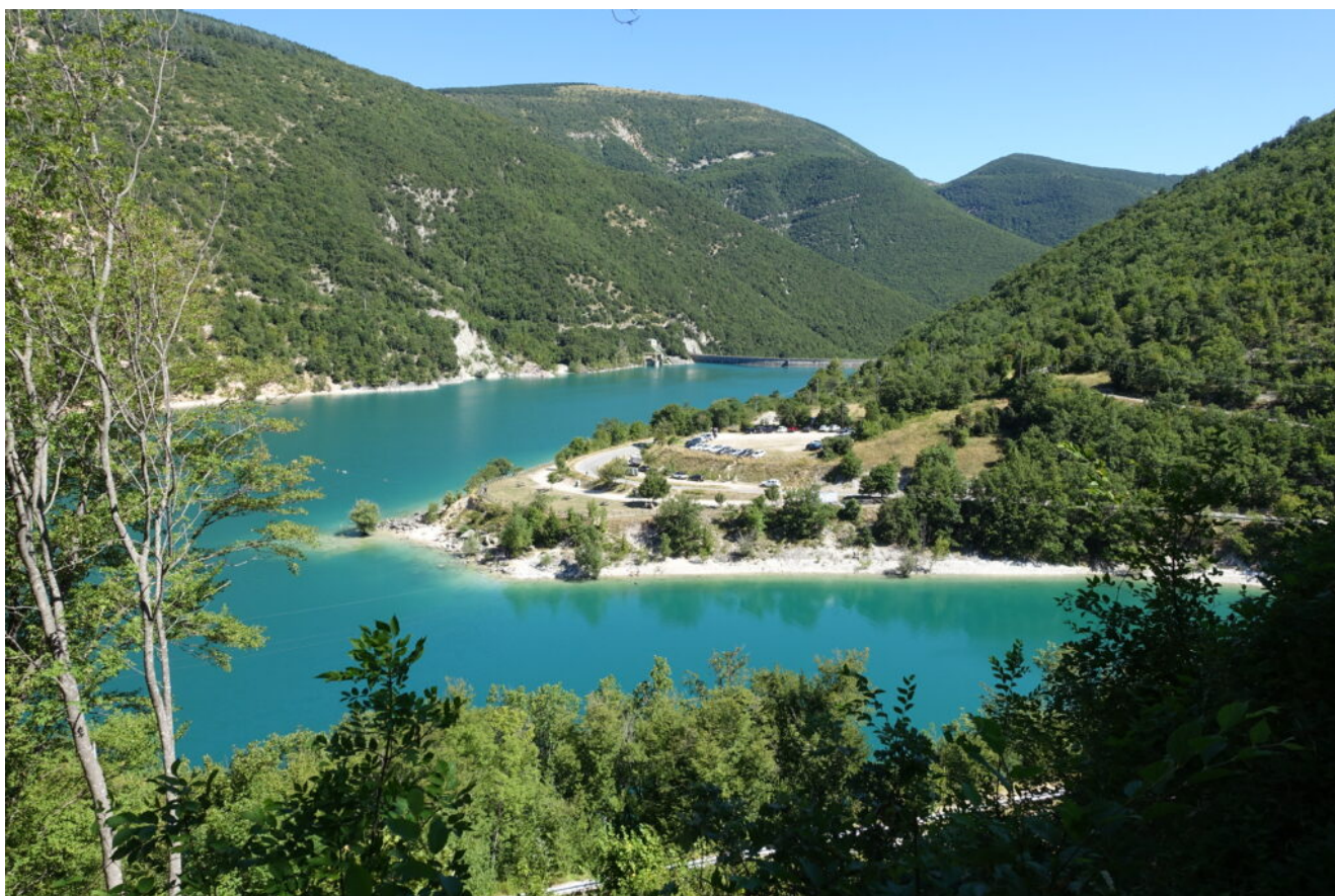
1- Il Lago del Fiastrone visto dalla zona franata.

La cavità, come le altre presenti nella zona, è riportata nel Catasto delle Grotte della Regione Marche.