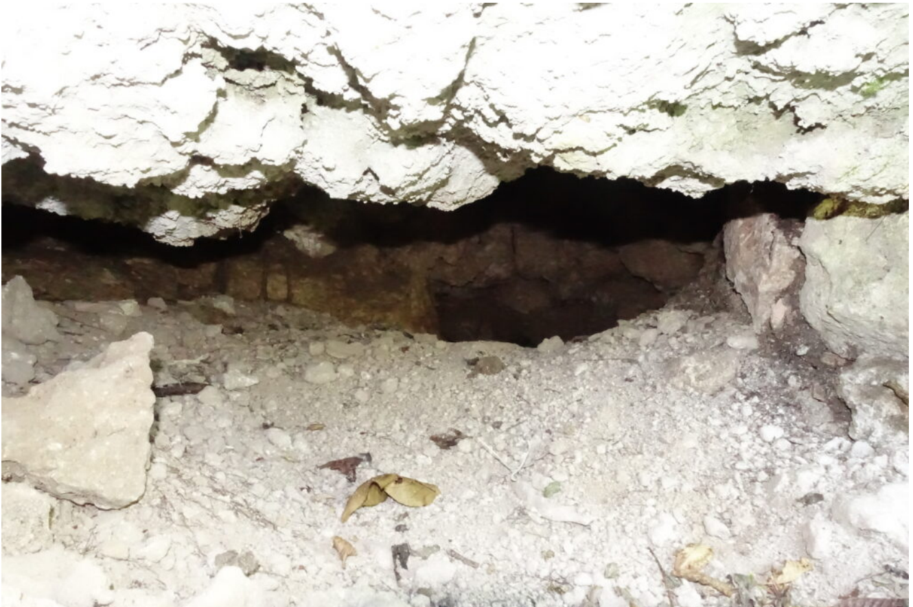
3 – 4 -Provo ad entrare ma dopo neppure due metri mi fermo.