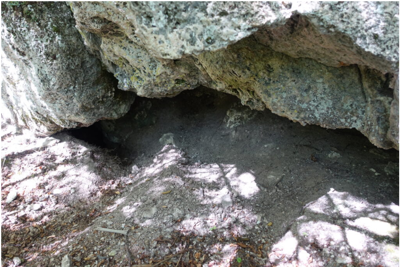
13- Nei pressi si apre una ulteriore piccola cavità usta come riparo dagli animali, come si nota dalle buche presenti sul terreno.