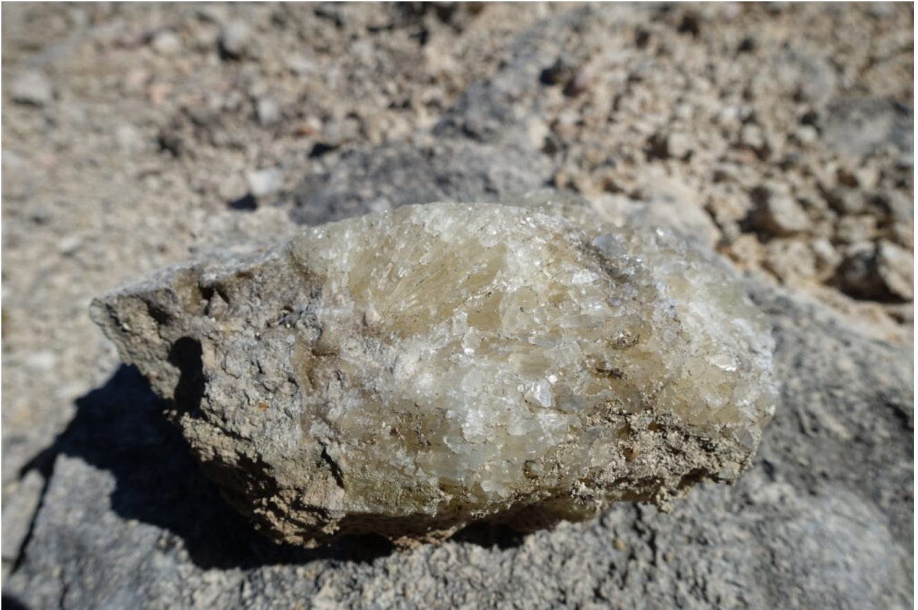
19- Colata calcitica staccatesi dalla rupe dopo il terremoto del 2016.