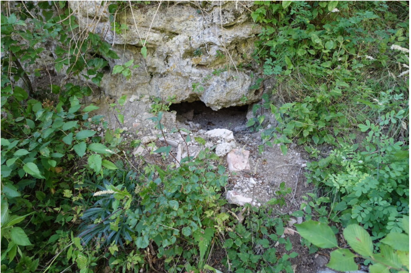
2- Il Buco dell'Istrice, una profonda e stretta fessura in cui non si riesce a scendere.