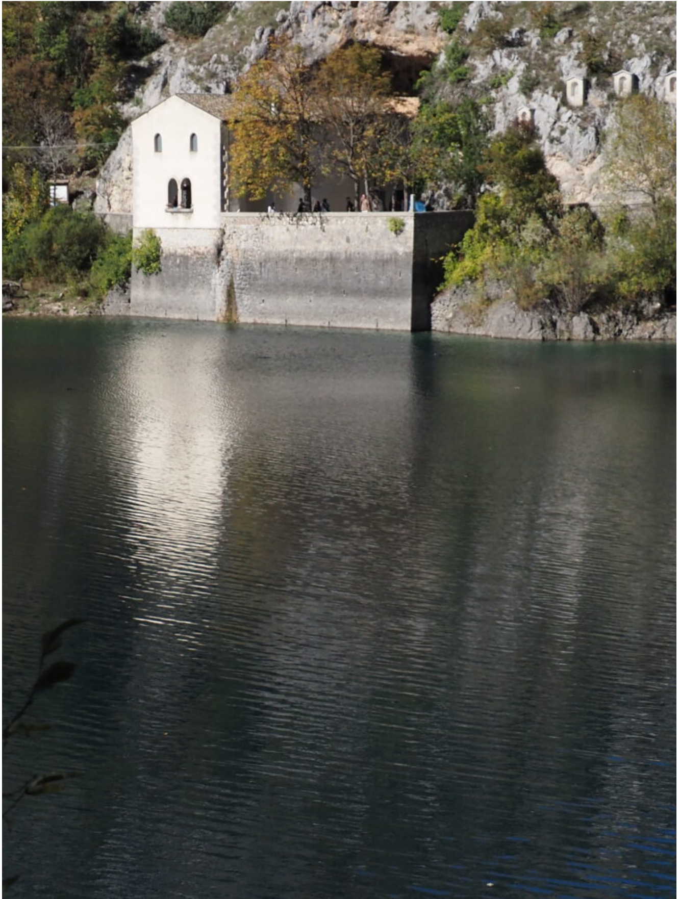
20- L'Eremito di San Domenico sulla sponde dell'omonimo Lago.