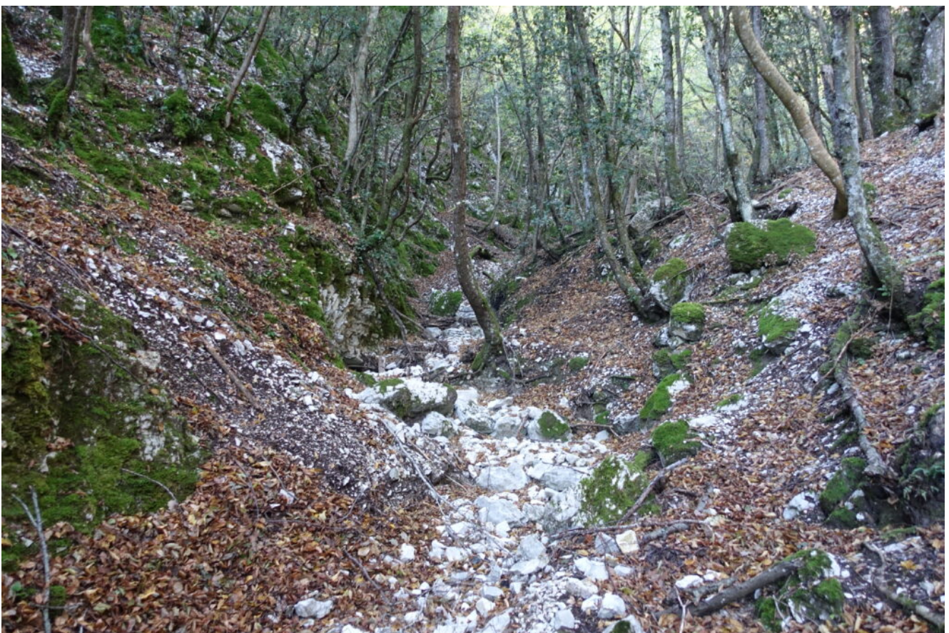
1- Il fosso della Val di Nicola.