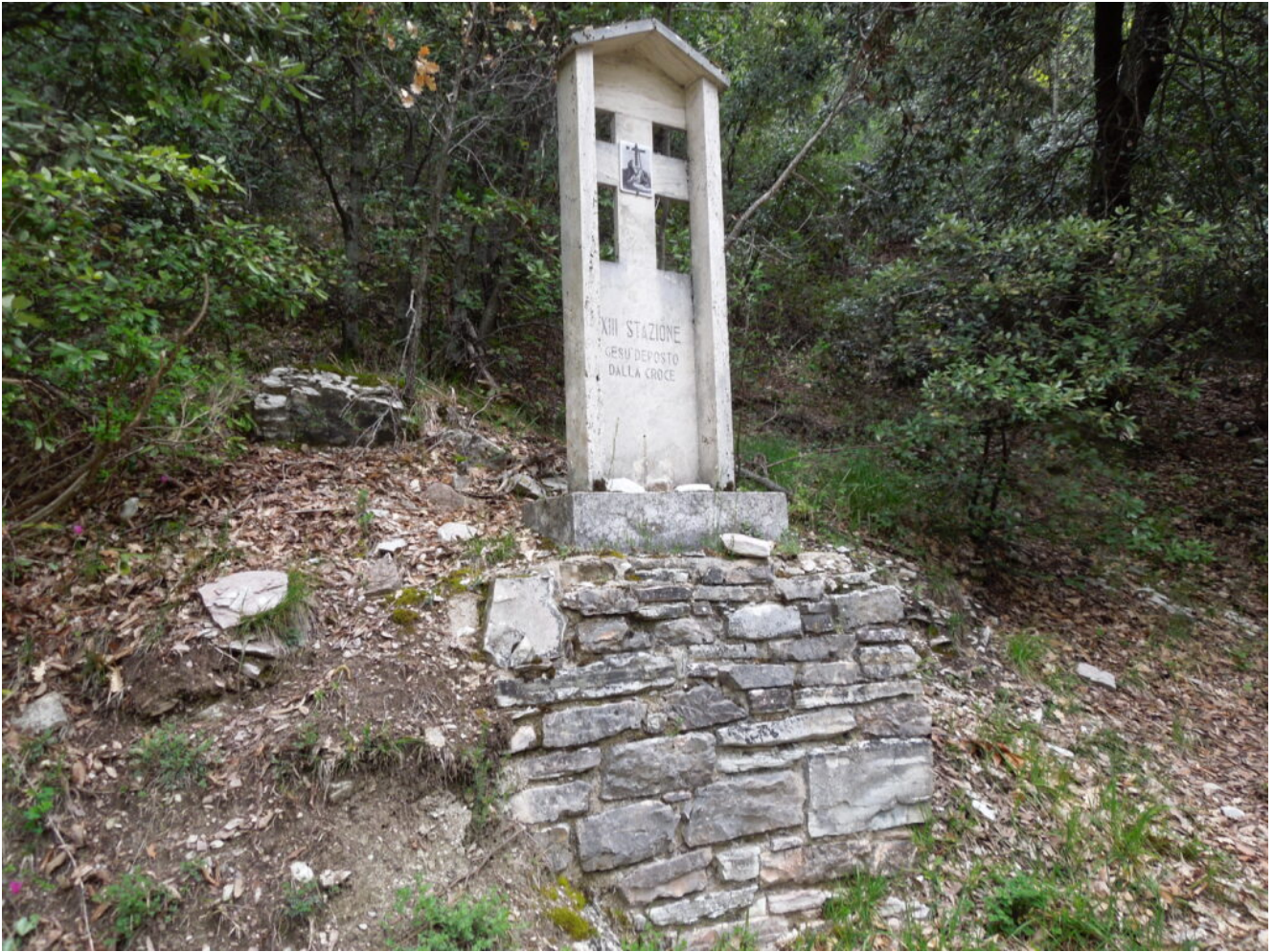
24- Lungo il sentiero sono presenti le stazioni della Via Crucis.