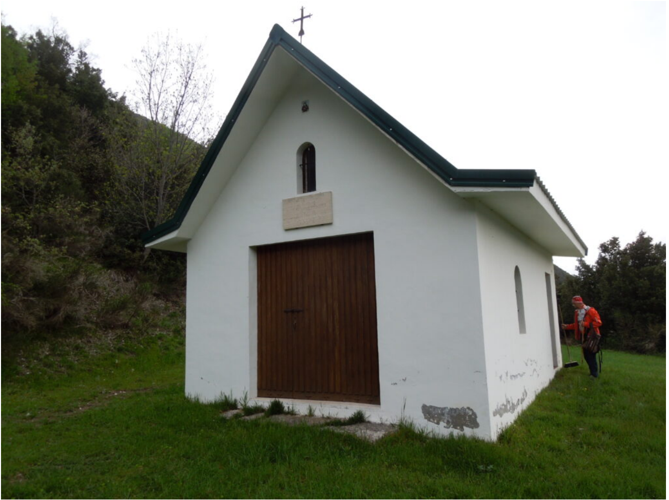
25 – 26 – La facciata della Chiesa del Beato Ugolino.