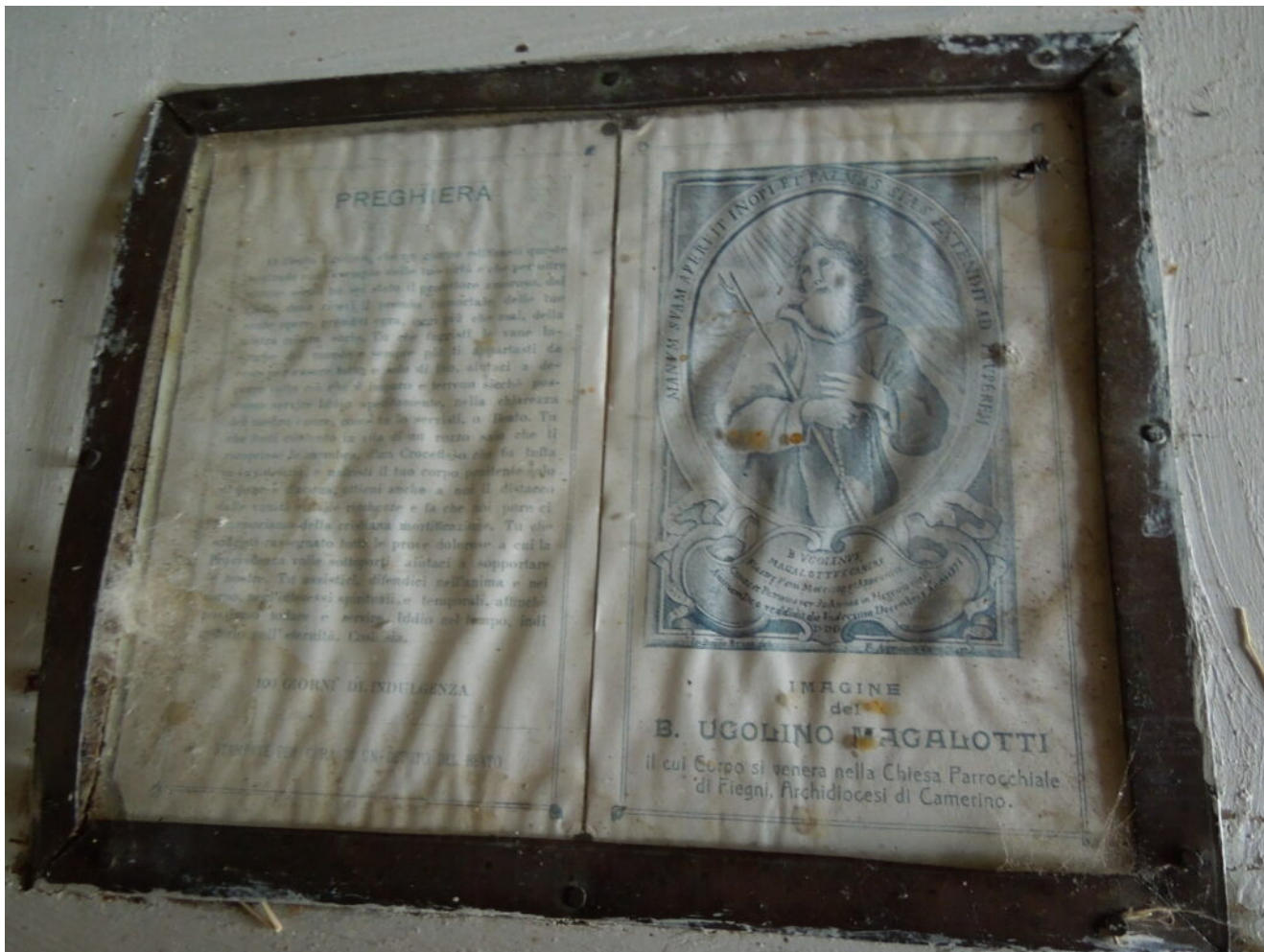
27 - 28 - L'interno della chiesa.