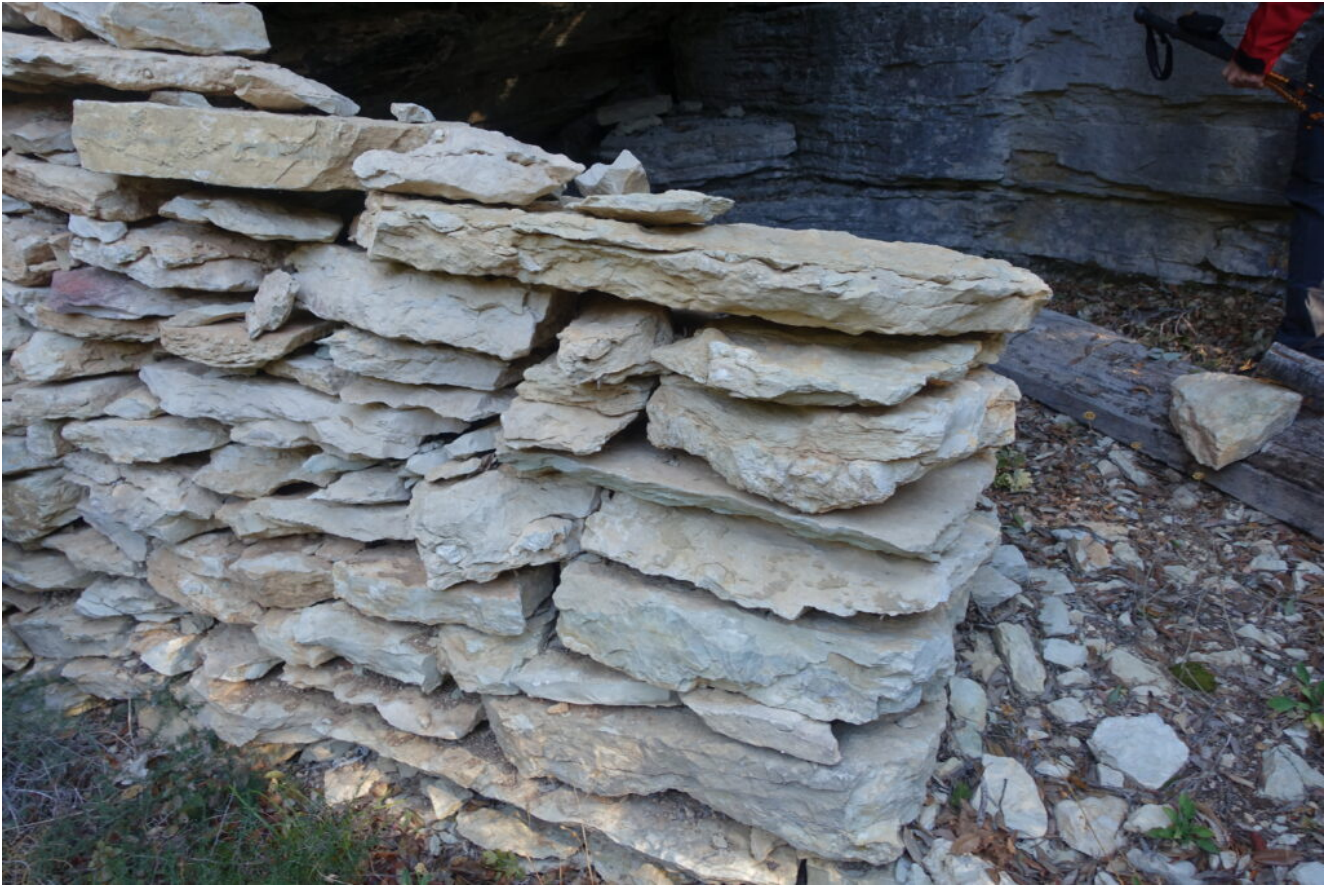
20 – Il muretto a secco anteriore.