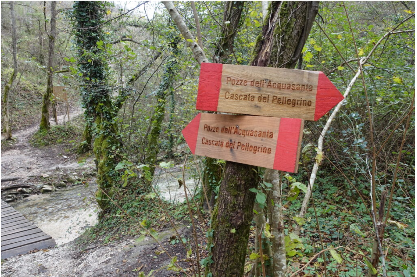
2- Raggiunto il torrente una ottima segnaletica indica il percorso da fare.