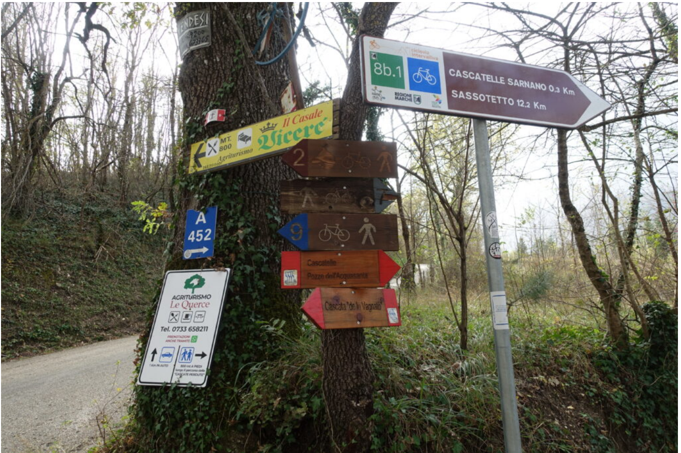
19- Il visibilissimo punto di partenza per raggiungere le Cascatelle di Sarnano.