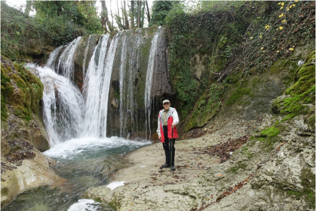
20 – 23 – Le Cascatelle di Sarnano.