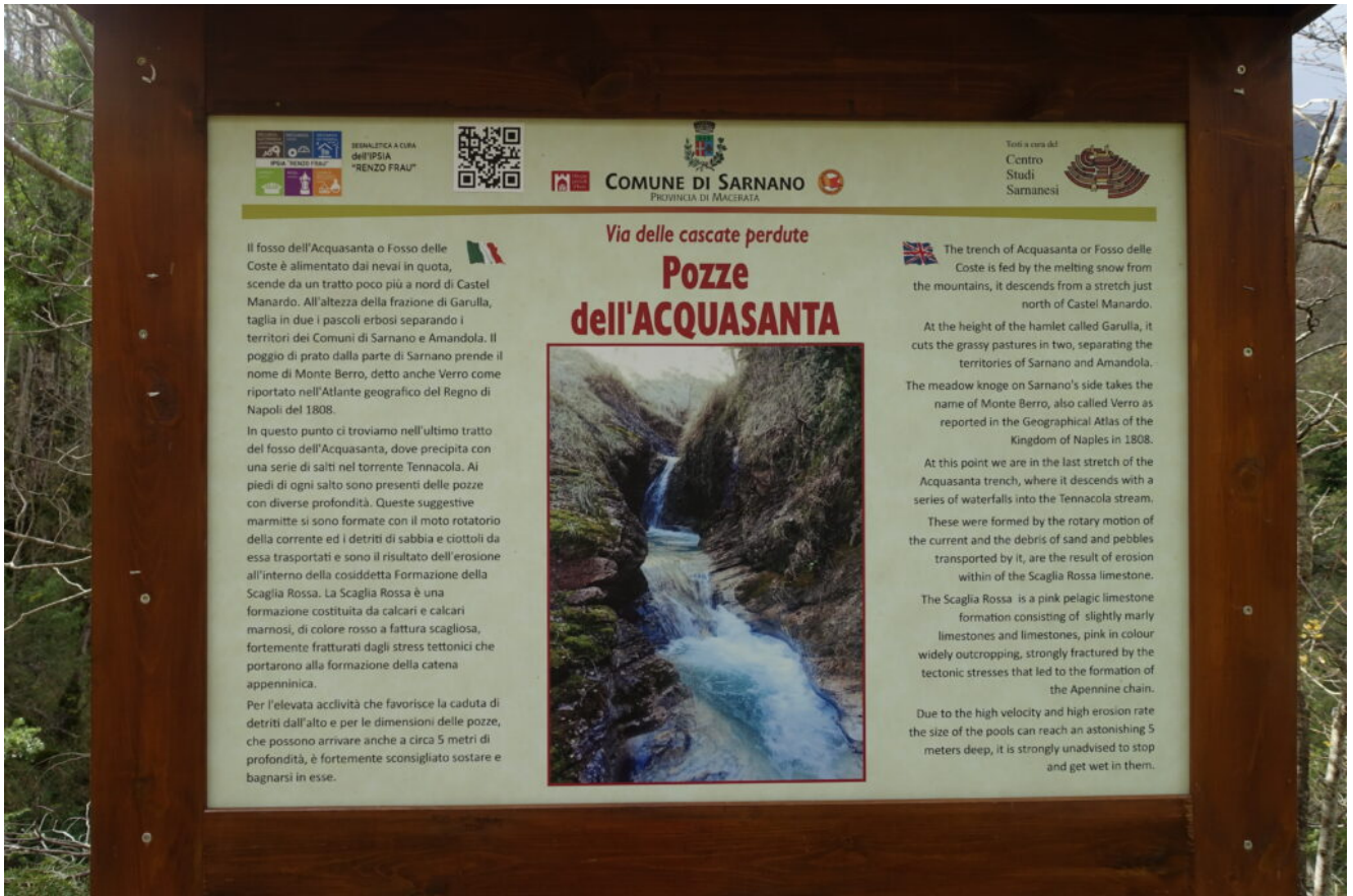
3- Il tabellone con la descrizione delle Pozze dell'Acquasanta.