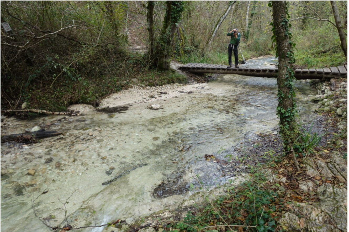
4- Il ponticello sul Tennacola che collega i due siti.