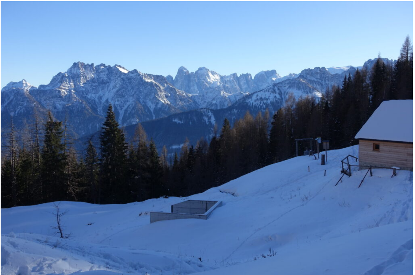
25- veduta verso il Monte Agner dalla Malga. IMMAGINI DALLE DOLOMITI, durante i nostri spostamenti in auto.