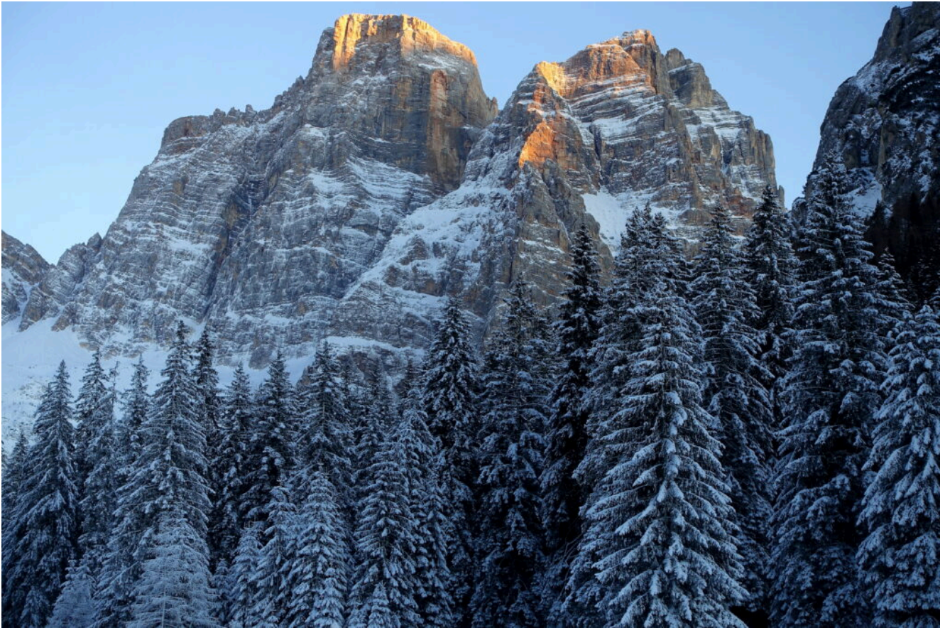
26 – 28 – I tre versanti del Monte Pelmo.