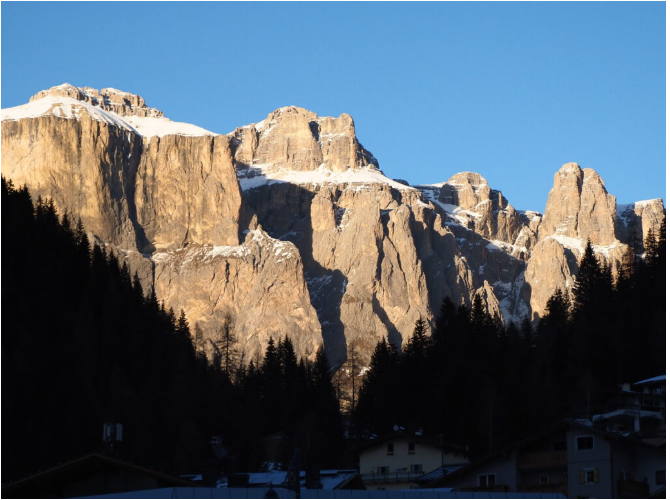
43- Il gruppo del Sella.