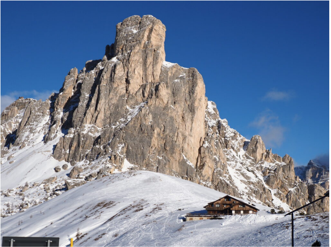
34 – 35 -l Ra Gusela dal Passo Giau.