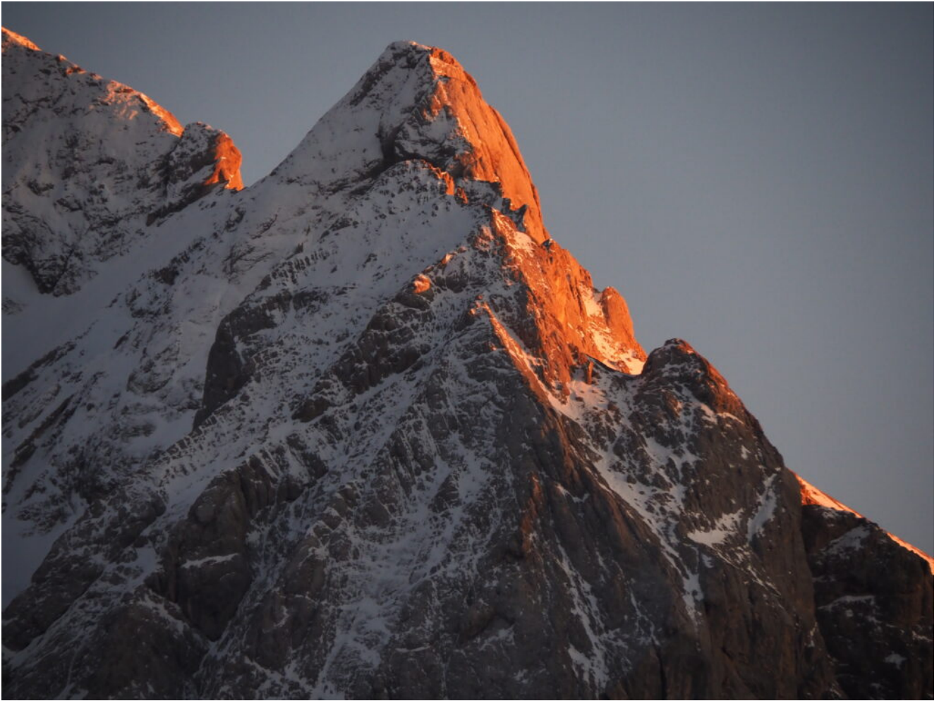
45- Dettaglio sulla Ponta de Cornates.