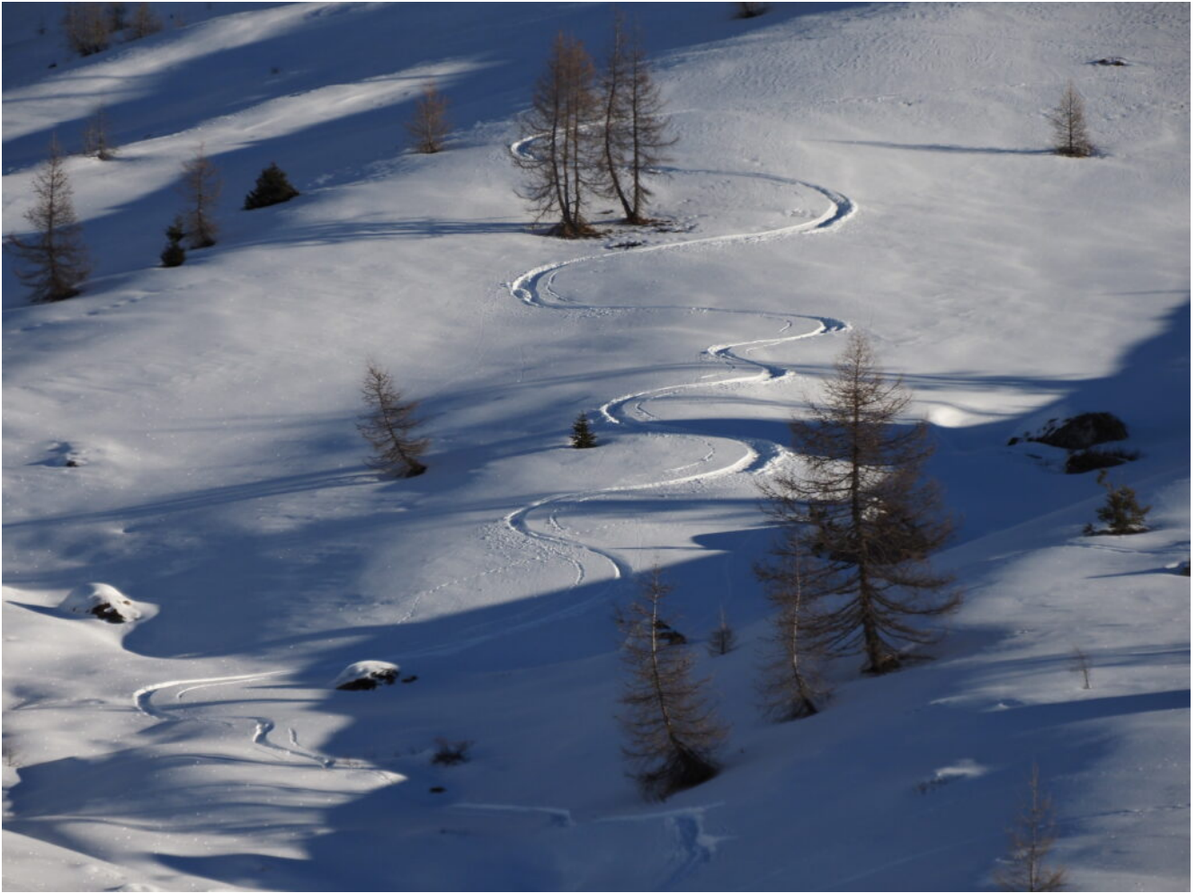
32 – 33- Tracce di fuoripista.