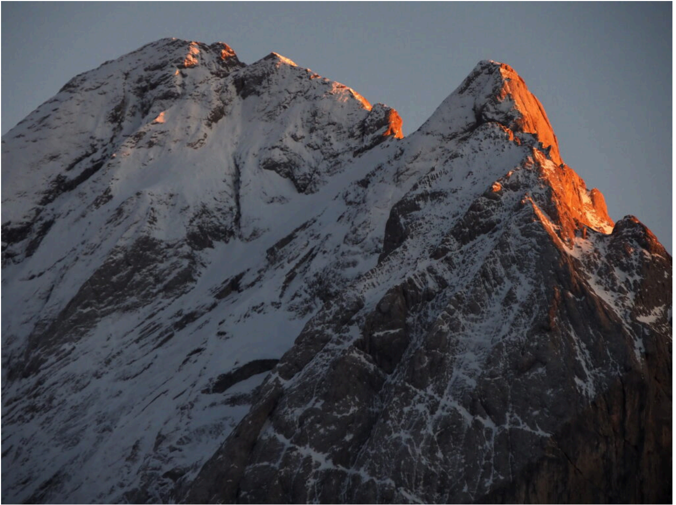
44 – Il Gran Vernel e la Ponta de Cornates al tramonto.