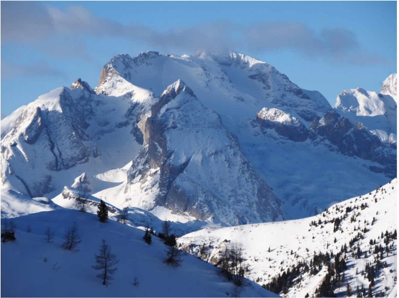
36- La Marmolada vista dal Passo Giau.