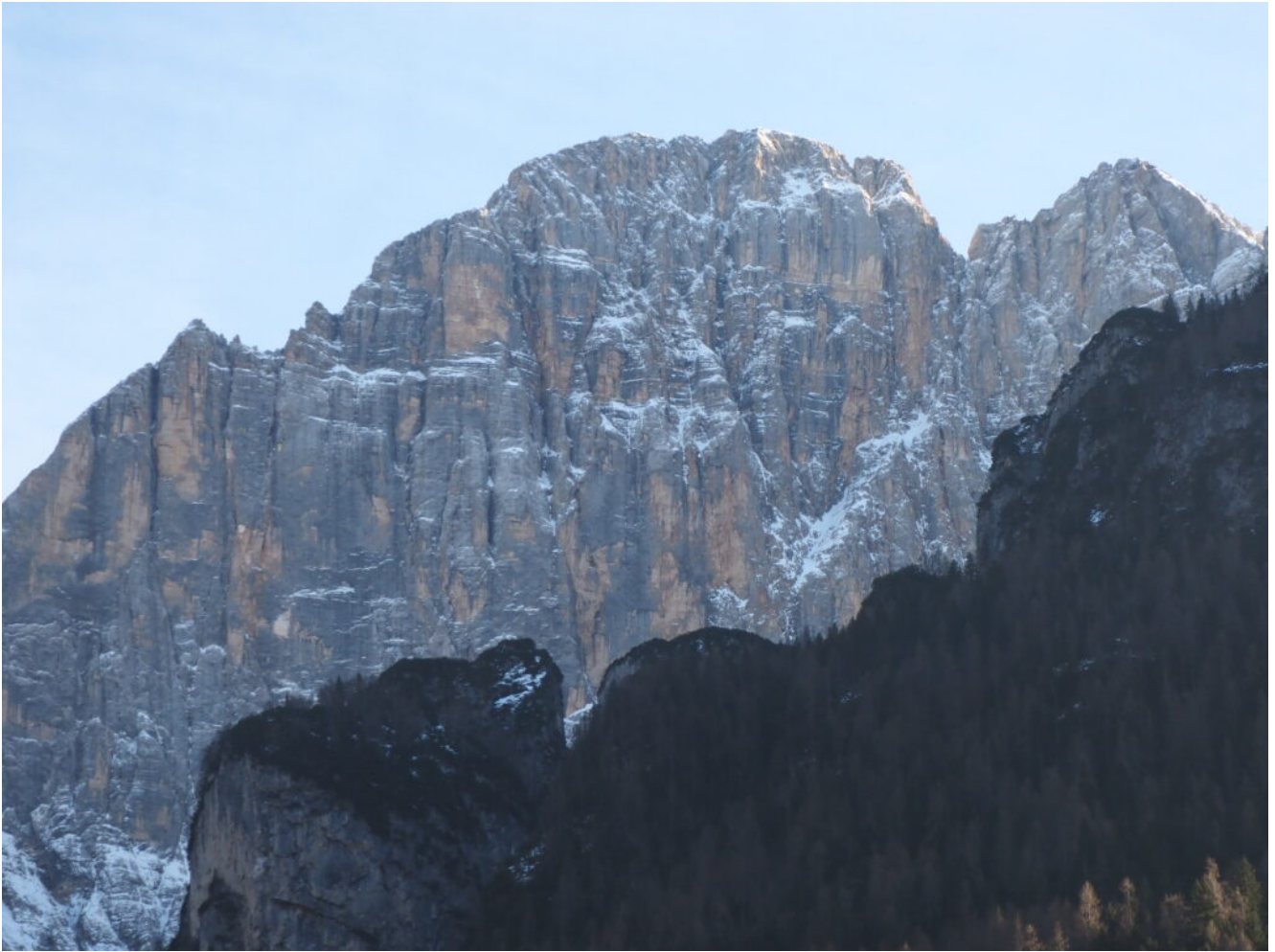
42- Il Monte Civetta, versante Nord.