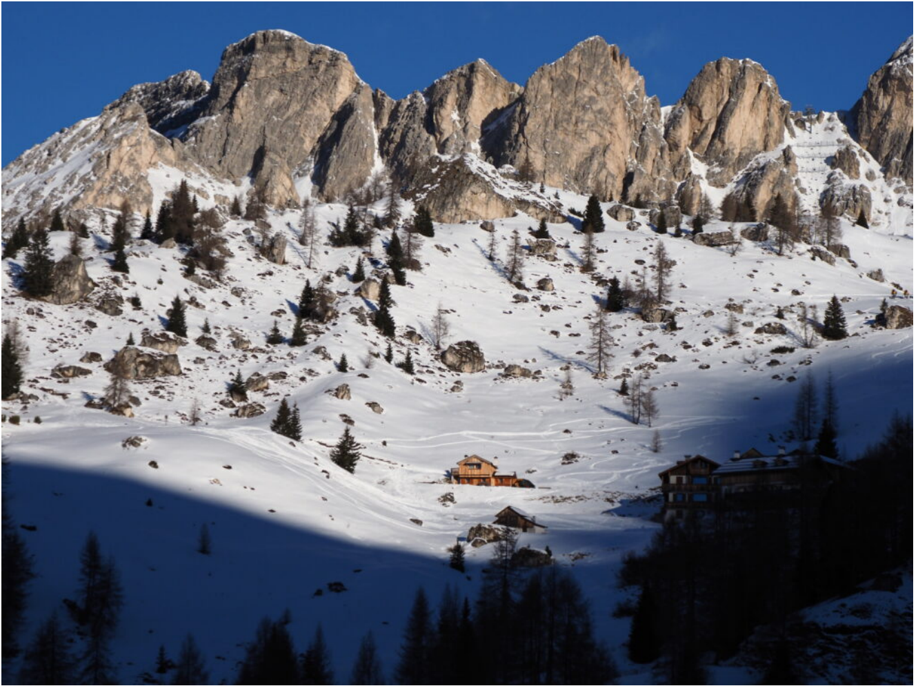
31- Incantevole Malga ai piedi del gruppo dell'Averau.