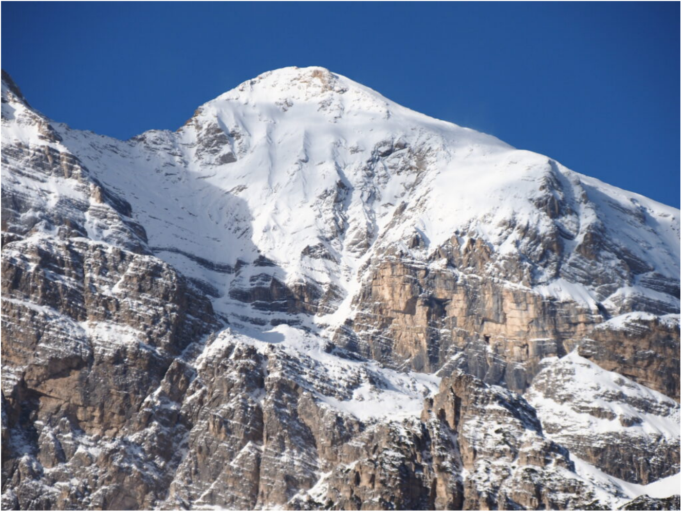
41- La Tofana di Dentro.