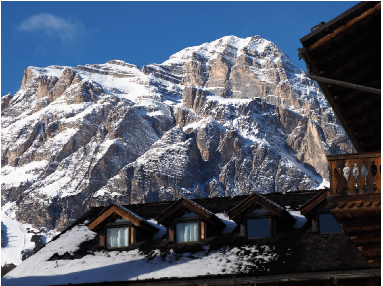
40 – La Tofana di Mezzo vista da Cortina.