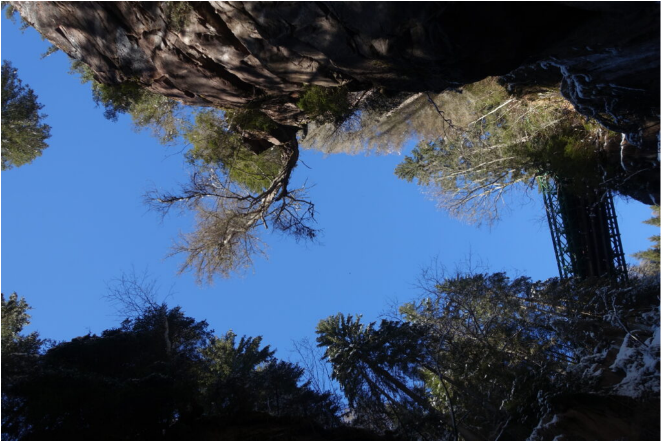
12- Veduta verticale verso il ponte della cascata