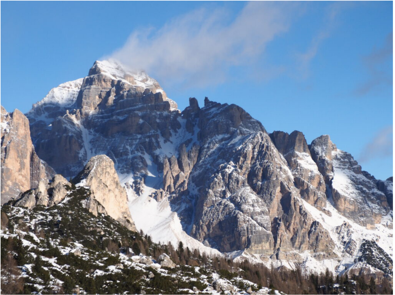
39 – La Tofana di Mezzo.