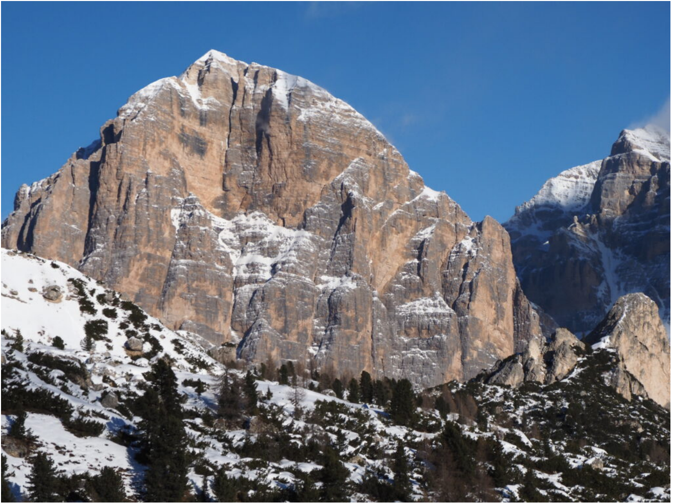
37 – 38- La Tofana di Rozes.