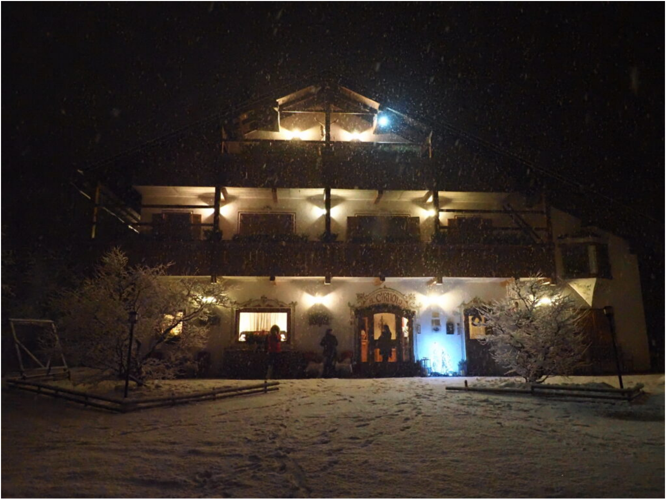
46- Lo splendido Hotel "Il Cirmolo" che ci ha ospitato questi giorni, foto del 31 dicembre 2023.