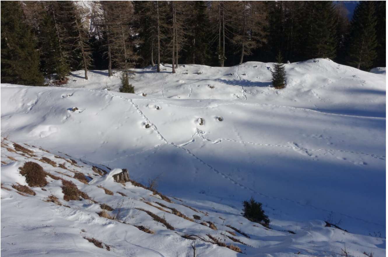
24- Intorno alla Malga solo tracce di animali, siamo i primi ad averla raggiunta nel 2024.