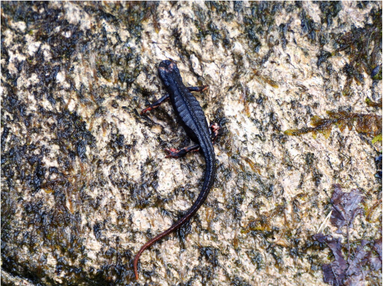
1 – 3 La Salamandrina di Savi

rilascio del minimo deflusso vitale, rilascio di ittiofauna aliena, attività escursionistiche estreme come il torrentismo, ecc.