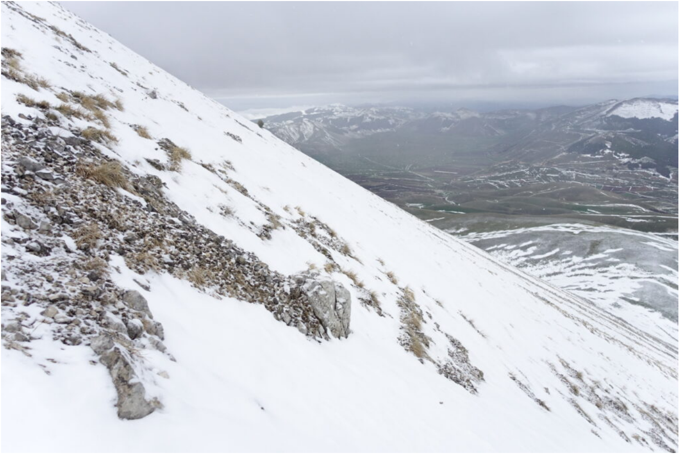
19- Il Piano Grande e Castelluccio