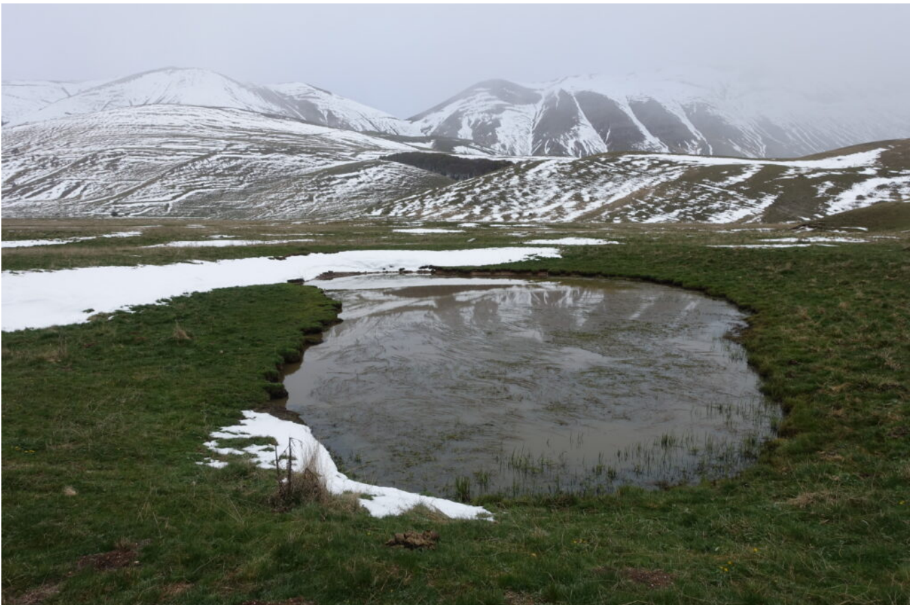
1- Il Laghetto del Pian Perduto.