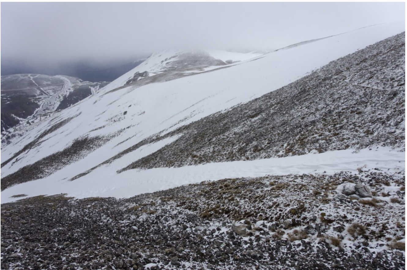
29 – 30 – La rapida e facile discesa nel canale di San Lorenzo