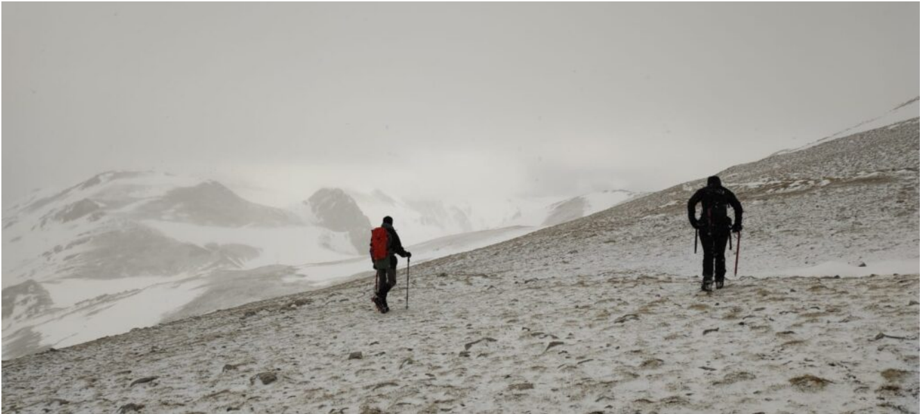
26- Proseguiamo verso la cima del Monte Argentella.