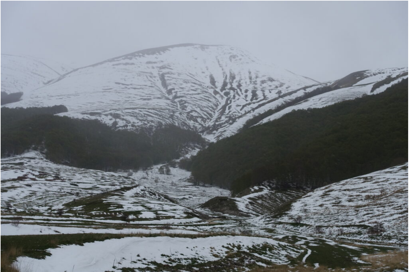
2- Superata la Portella del Vao ci si immette nella valle di San Lorenzo, in alto il canale Ovest del Monte Argentella.