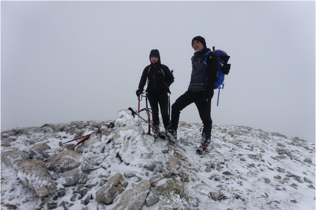
28- In cima.