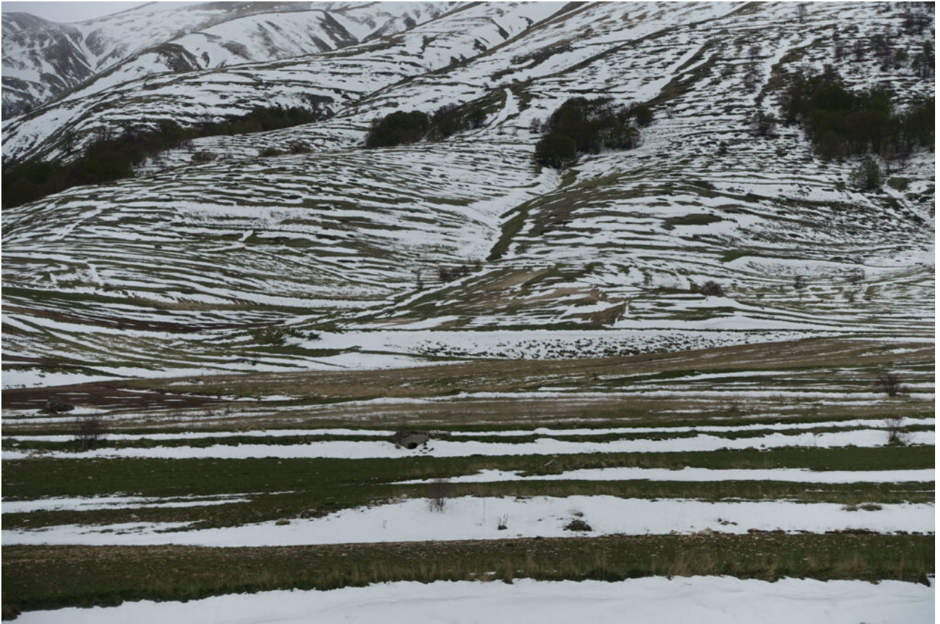
32 – 33 – I pendii ovest del Monte Palazzo Borghese