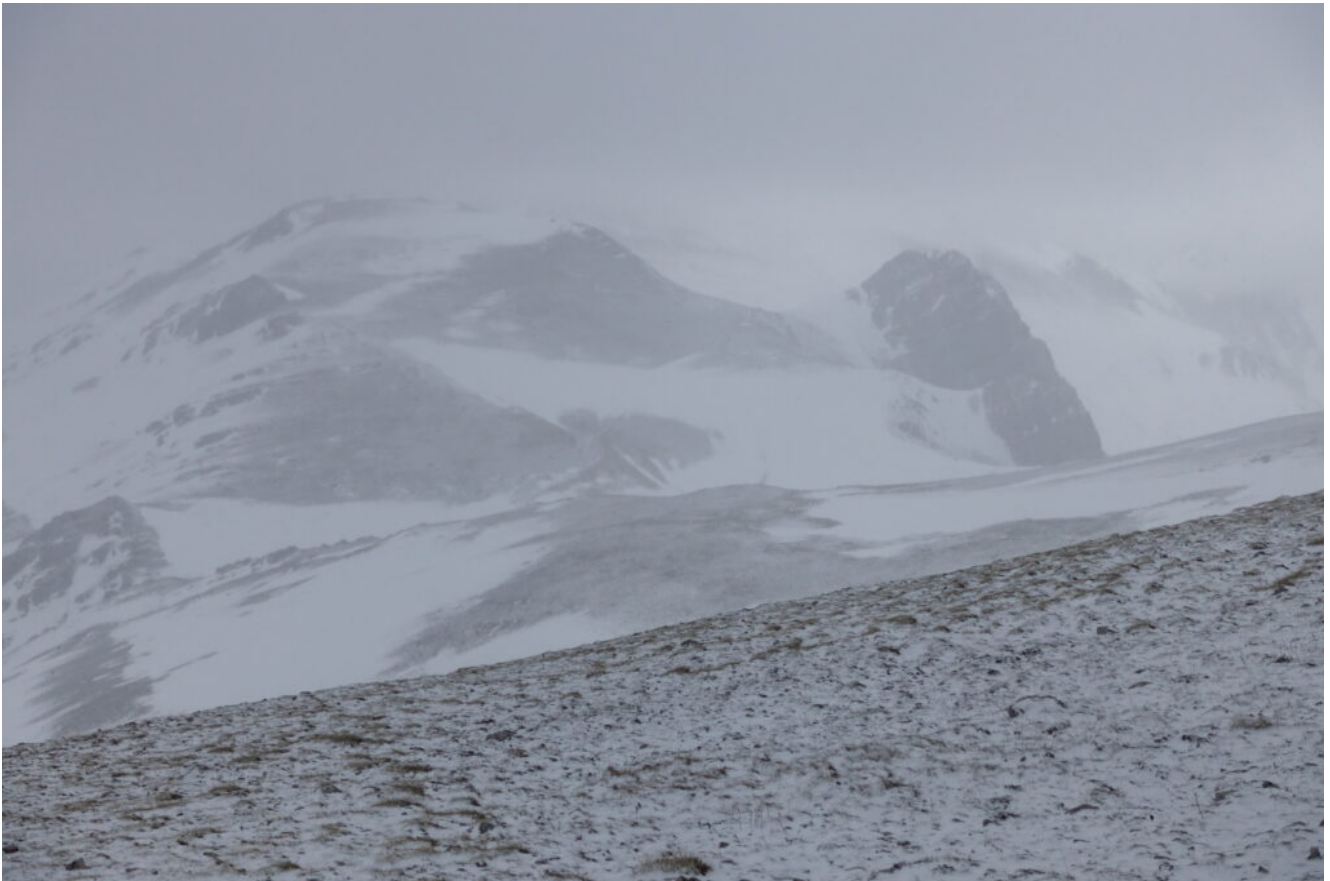
27- Il Monte Palazzo Borghese ed il Sasso di Palazzo Borghese si intravedono tra la nebbia.