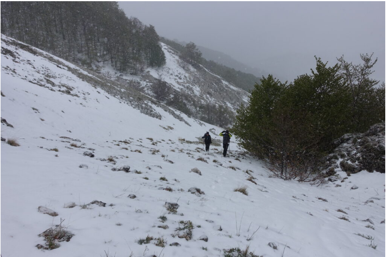
3 – L'inizio del canale a monte della Fonte di San Lorenzo ed inizia a nevicare.