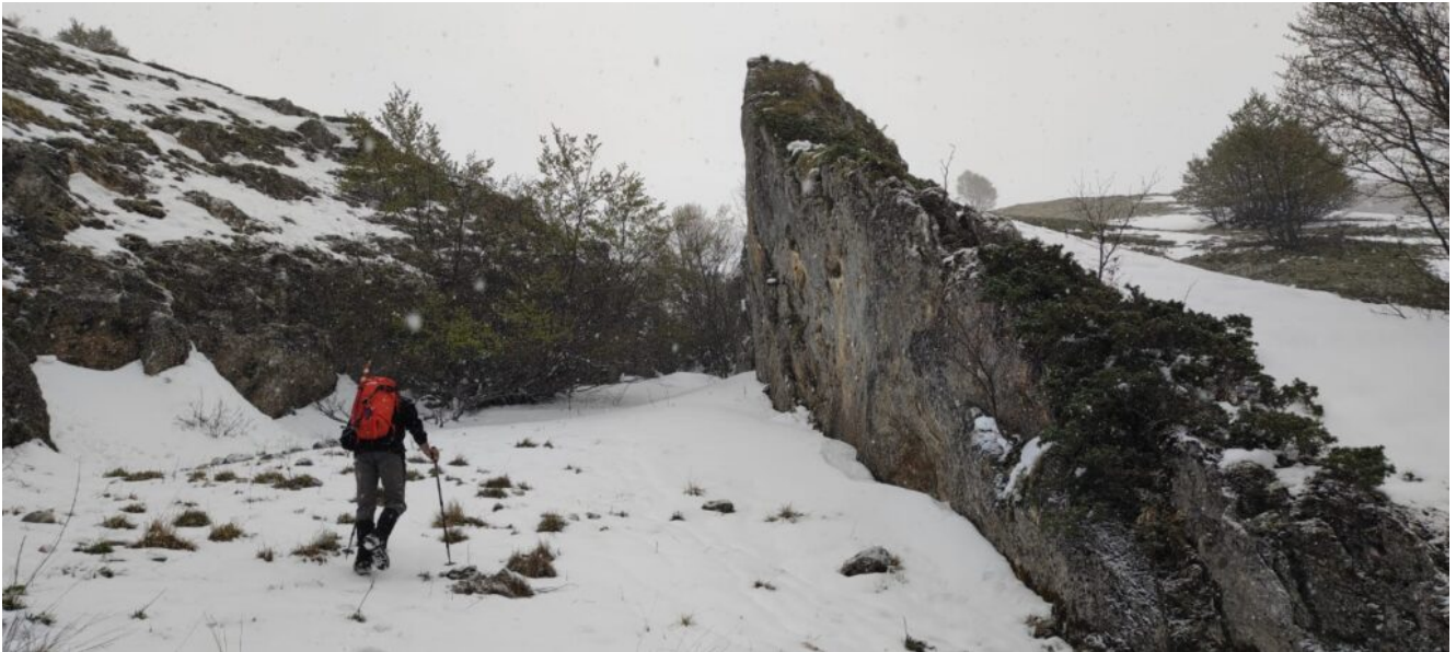
4 - 5 - La strettoia del canale con la caratteristica verticale parete laterale.