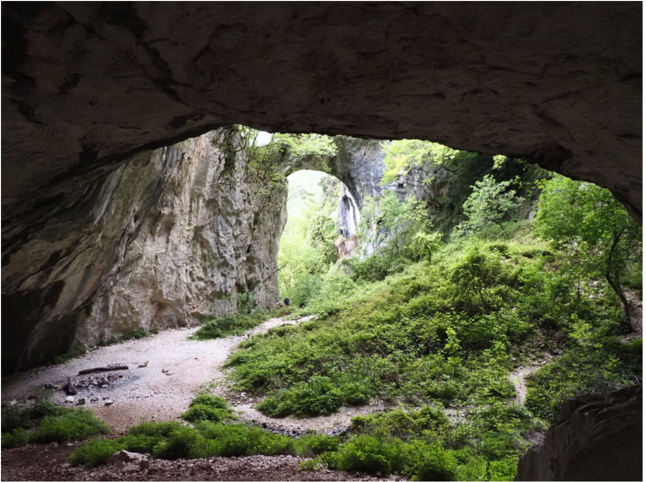
15 – 16 -L'arco di Fondarca visto dalla parte terminale della grotta