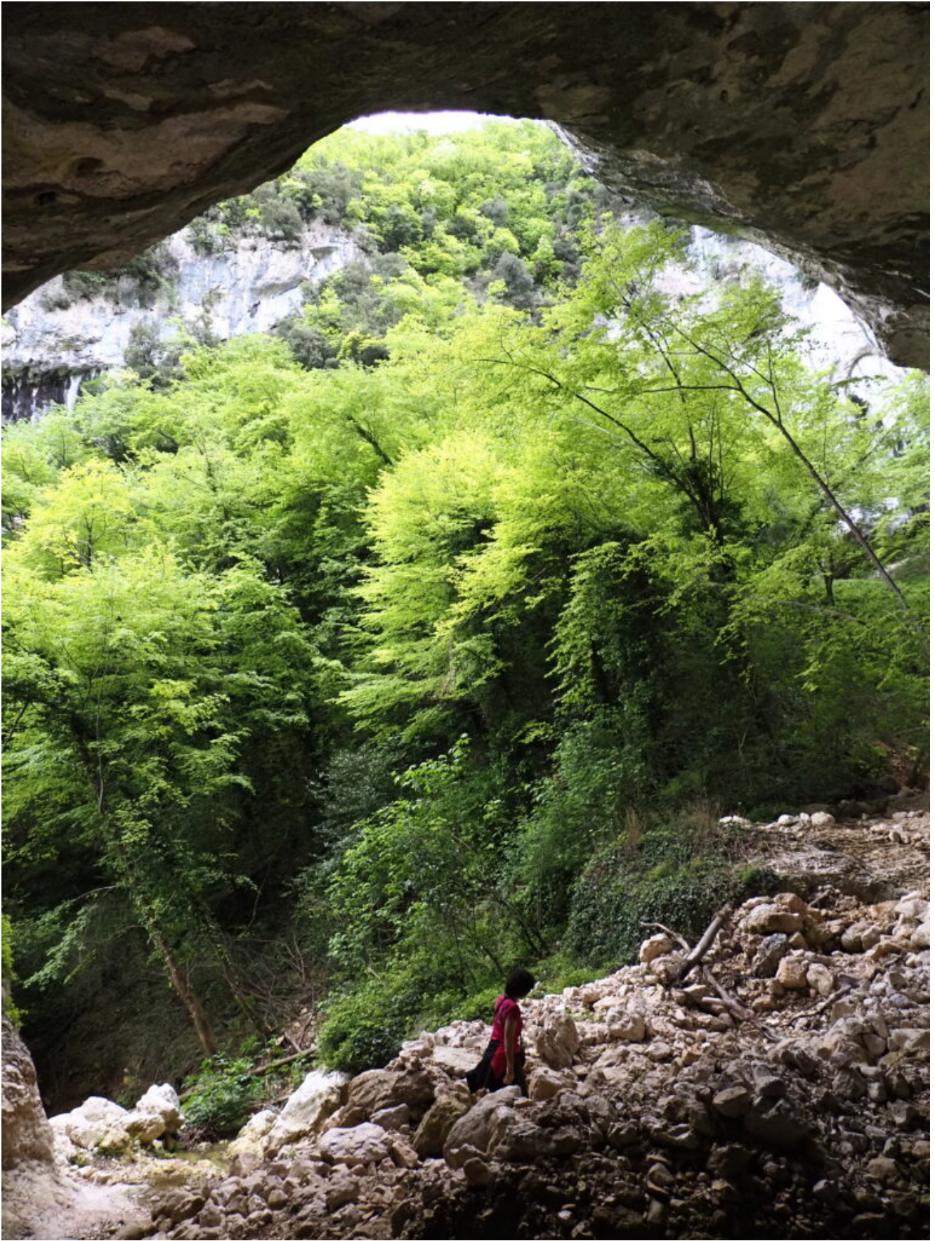
7 – 10 – Veduta dall'interno del Grottone