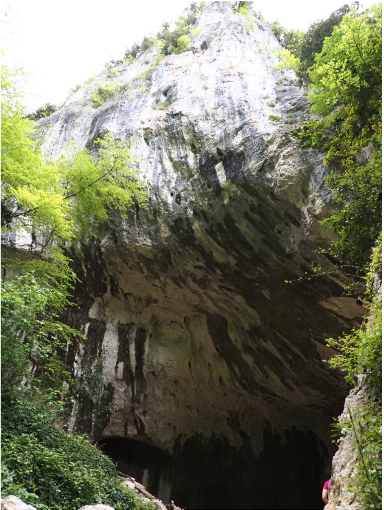
4 – 5 -Il Grottone