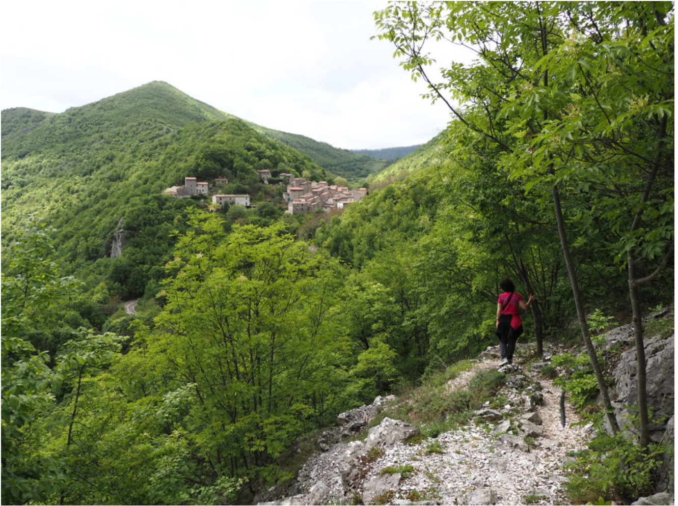
1- La frazione di Pieia da dove si parte per raggiungere Fondarca