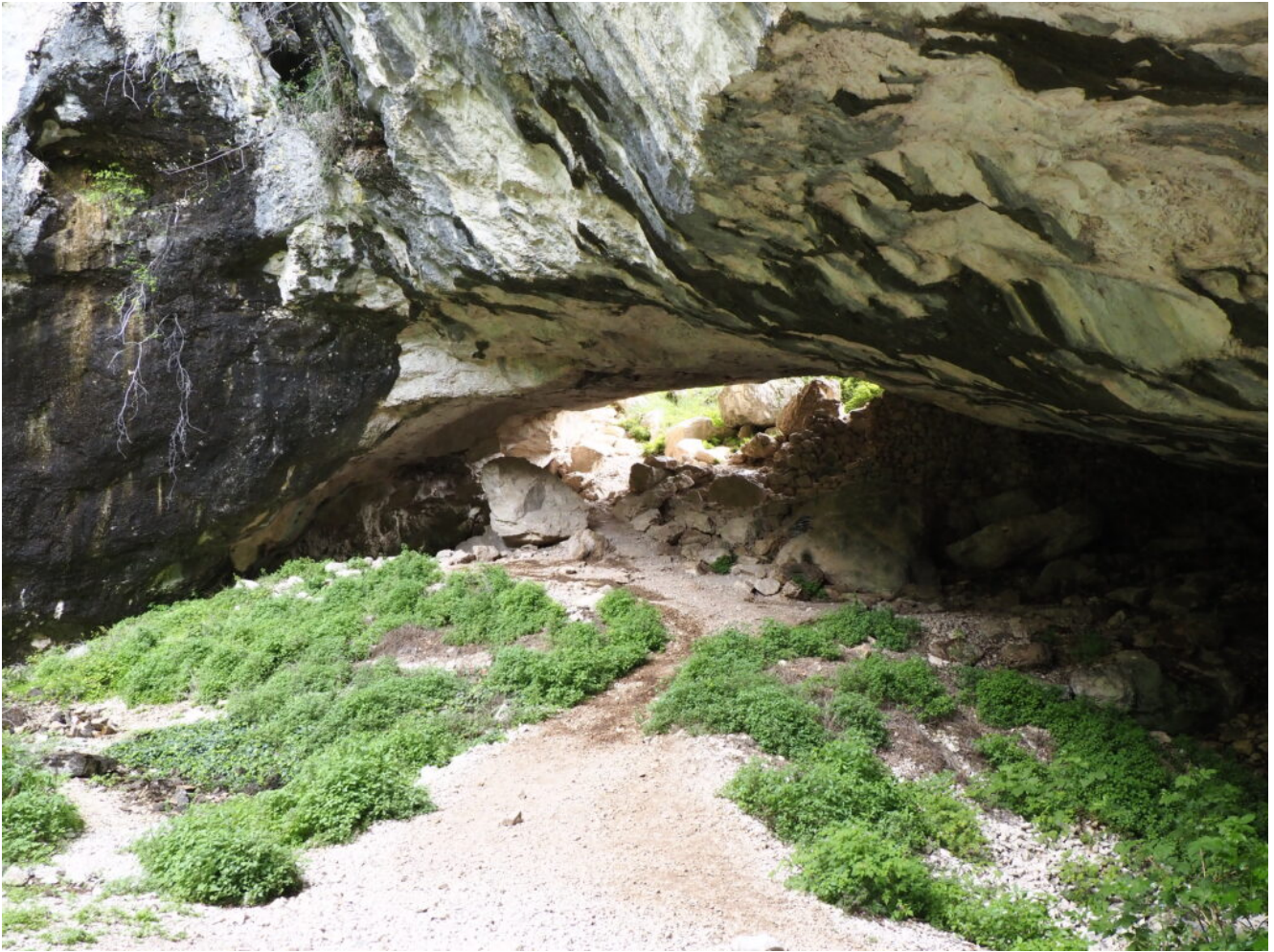
9 -14 – La grotta rimasta intatta nella parte finale della vallata.