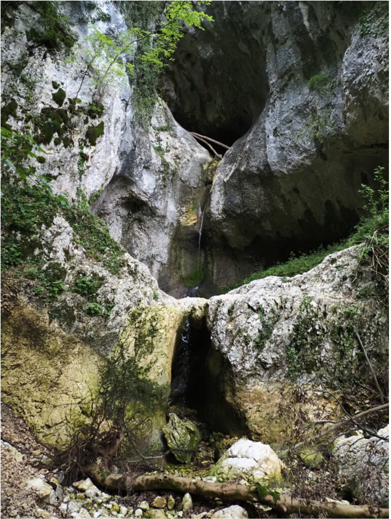
11 – 14 – Le cascate che chiudono la valle in una stretta forra.