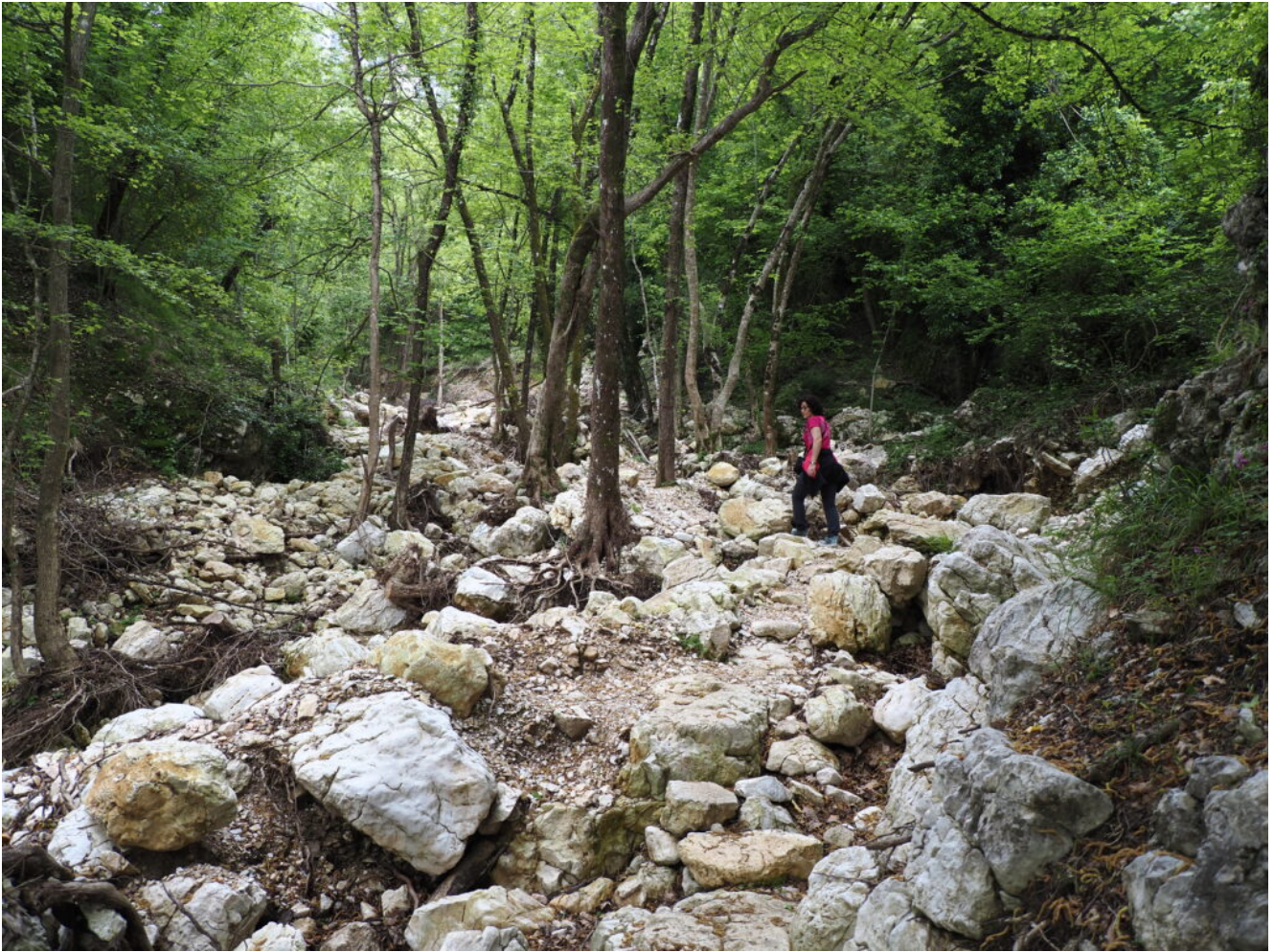
2- Le condizioni del fosso dopo l'alluvione del 2022.