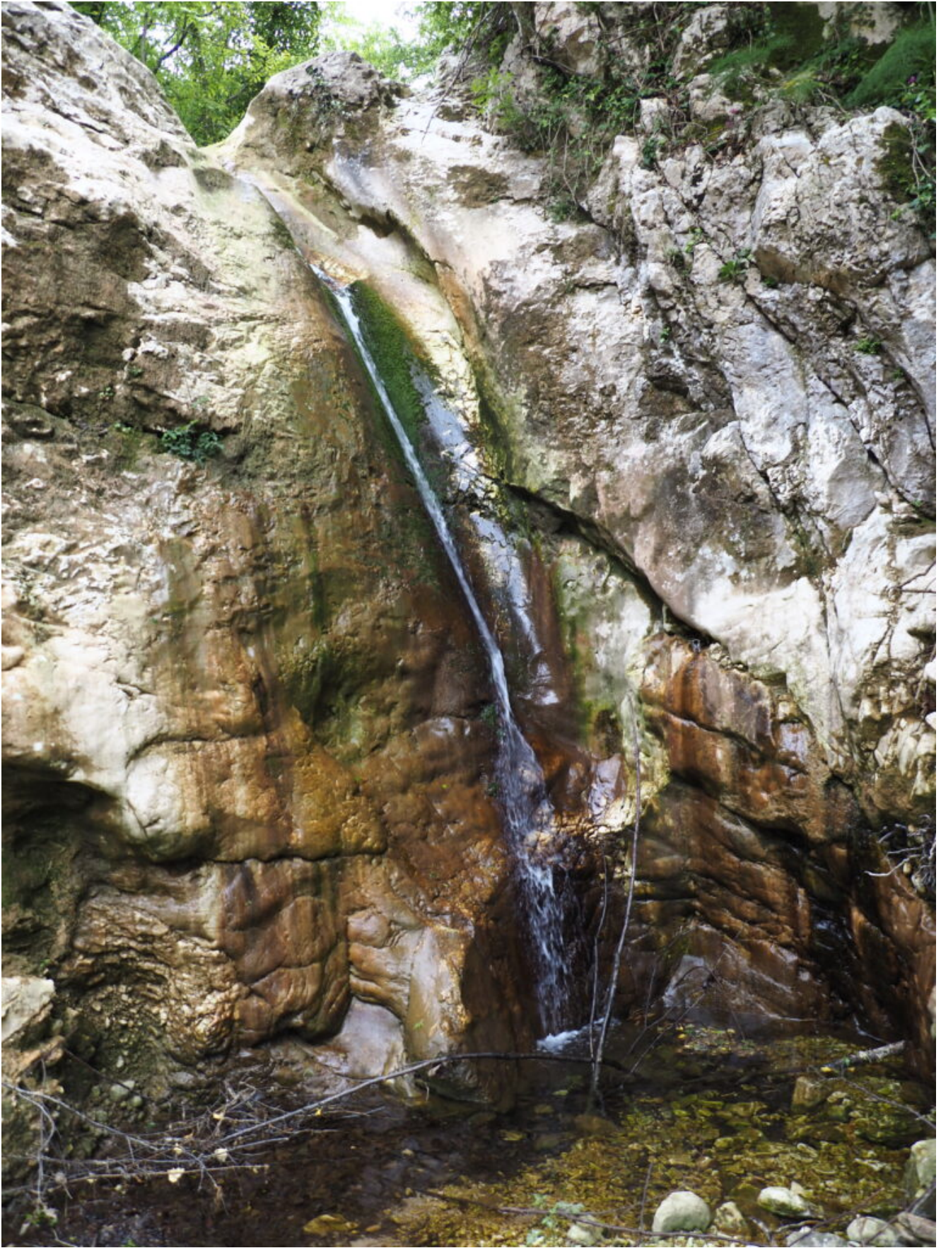
3- La prima cascatina della forra.