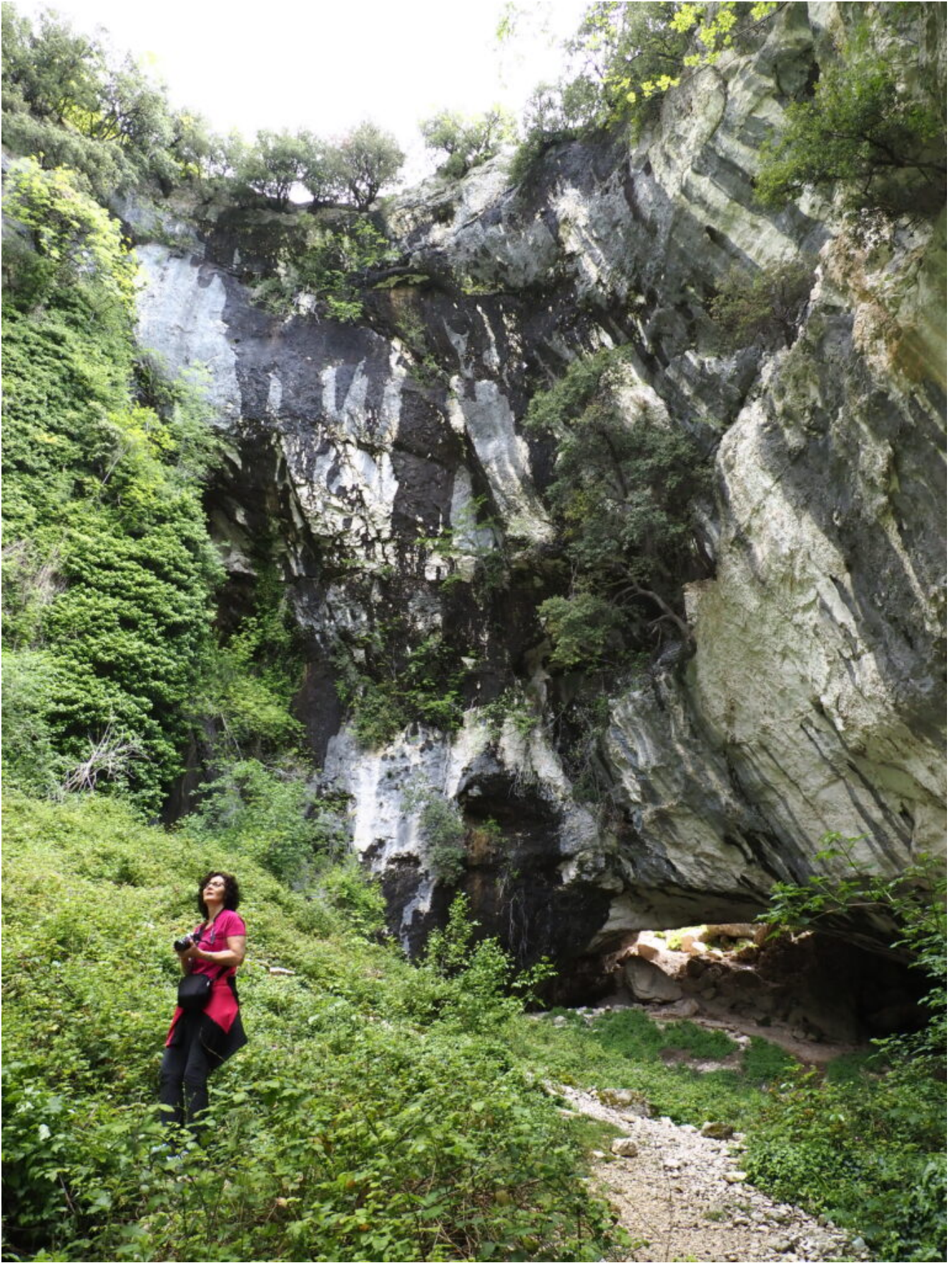
8- Le pareti laterali della grotta crollata.