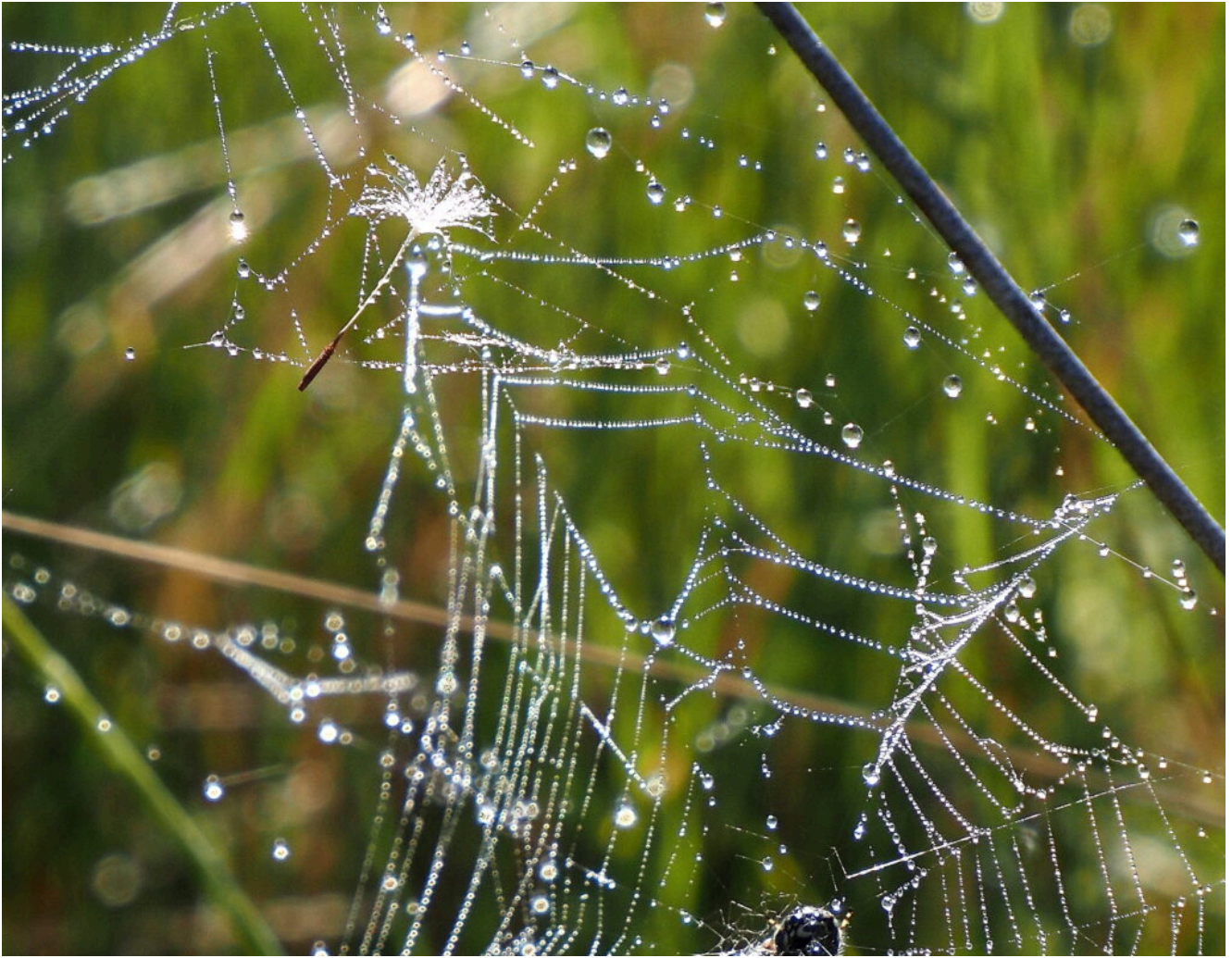
10- Un seme di Tarassaco intrappolato in una ragnatela.