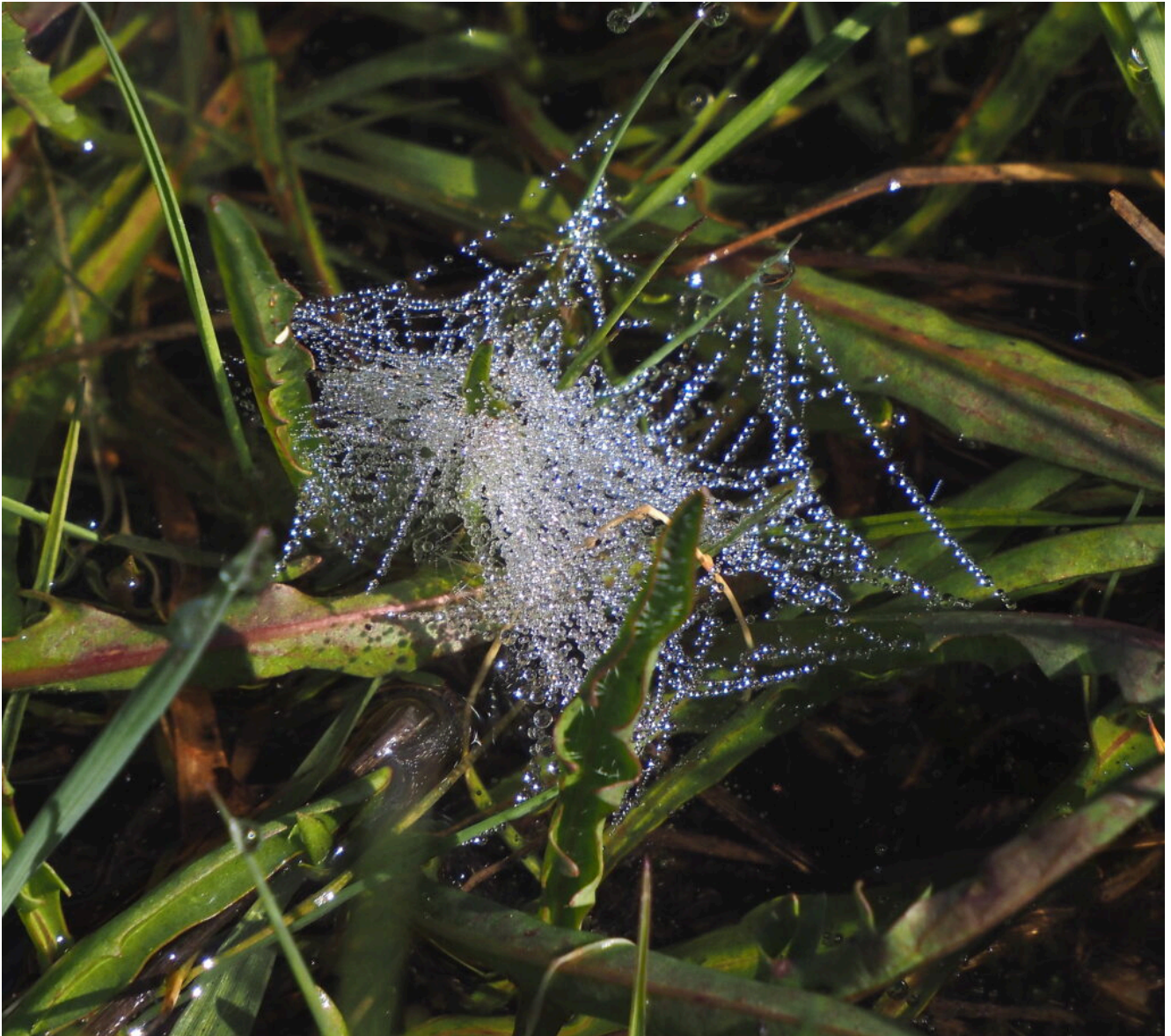
24 – Ragnatele di ragni acquatici nei laghetti del Piano Grande