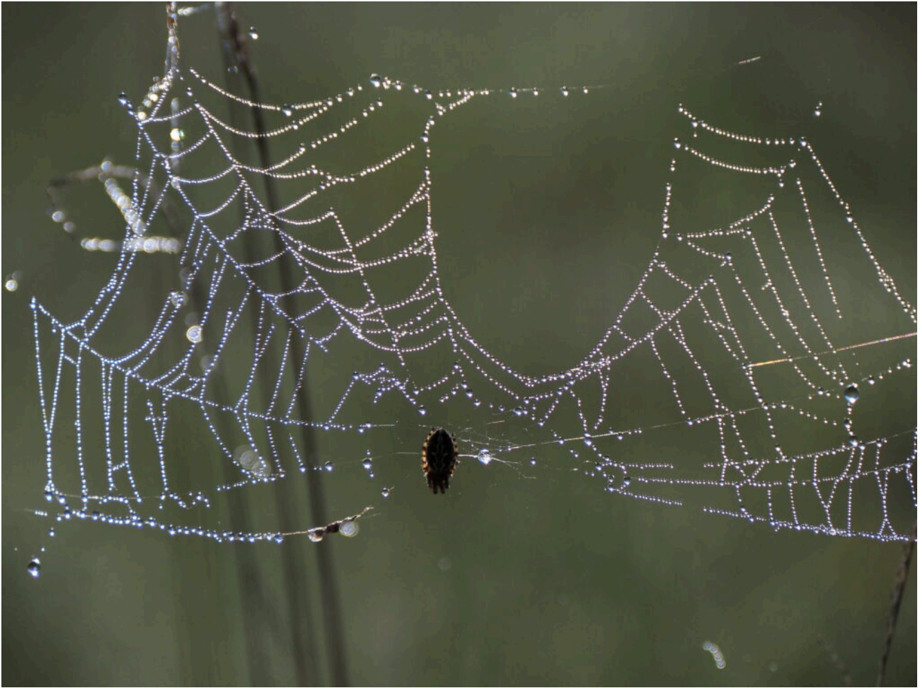
2 – 8 -Ragnatele trasformate in collane di perle dalla rugiada notturna.