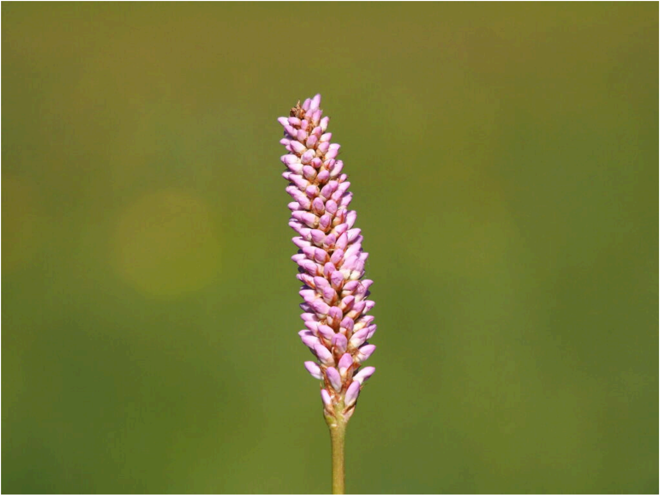
21 – 22- Gli artefici della fioritura primaverile : Bistorta officinalis