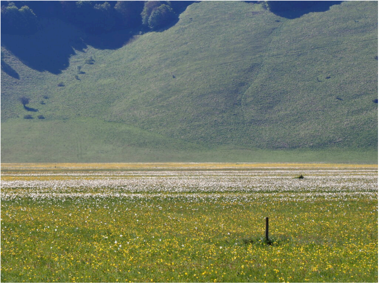
11 – 16 – La fioritura spontanea primaverile del Piano Grande