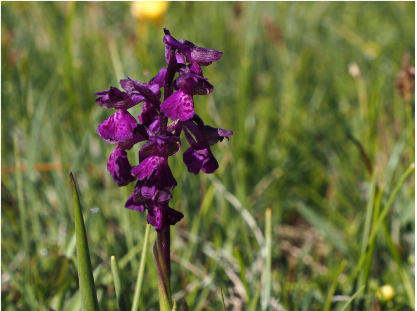
23- Orchis morio