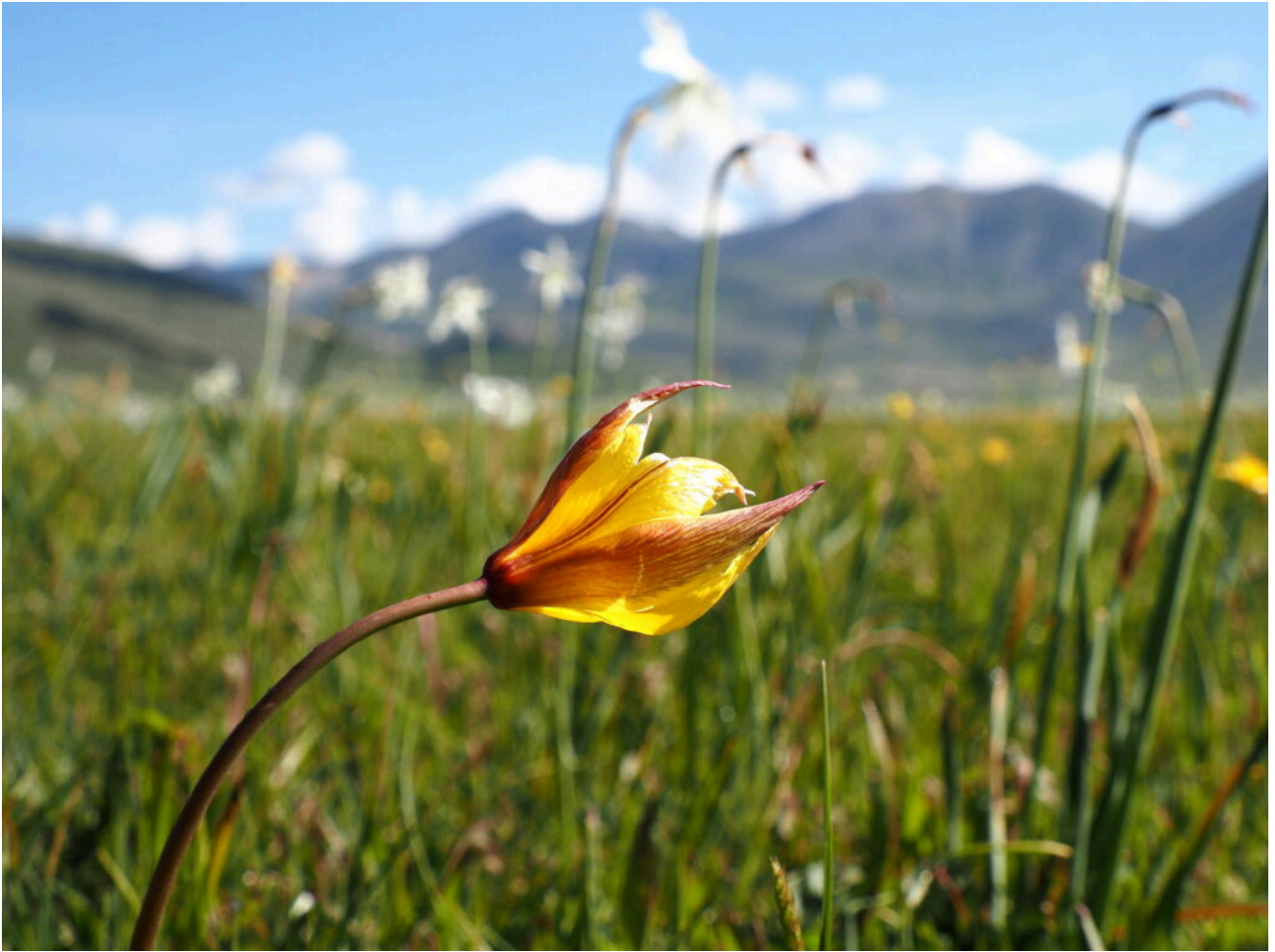
17 – Gli artefici della fioritura primaverile : Tulipa australis