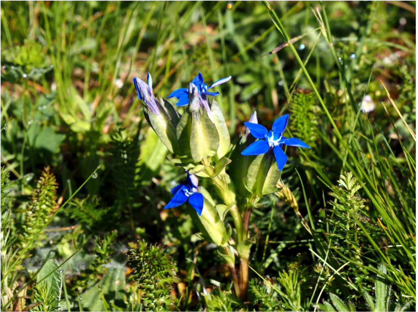
20 – Gentiana utriculosa