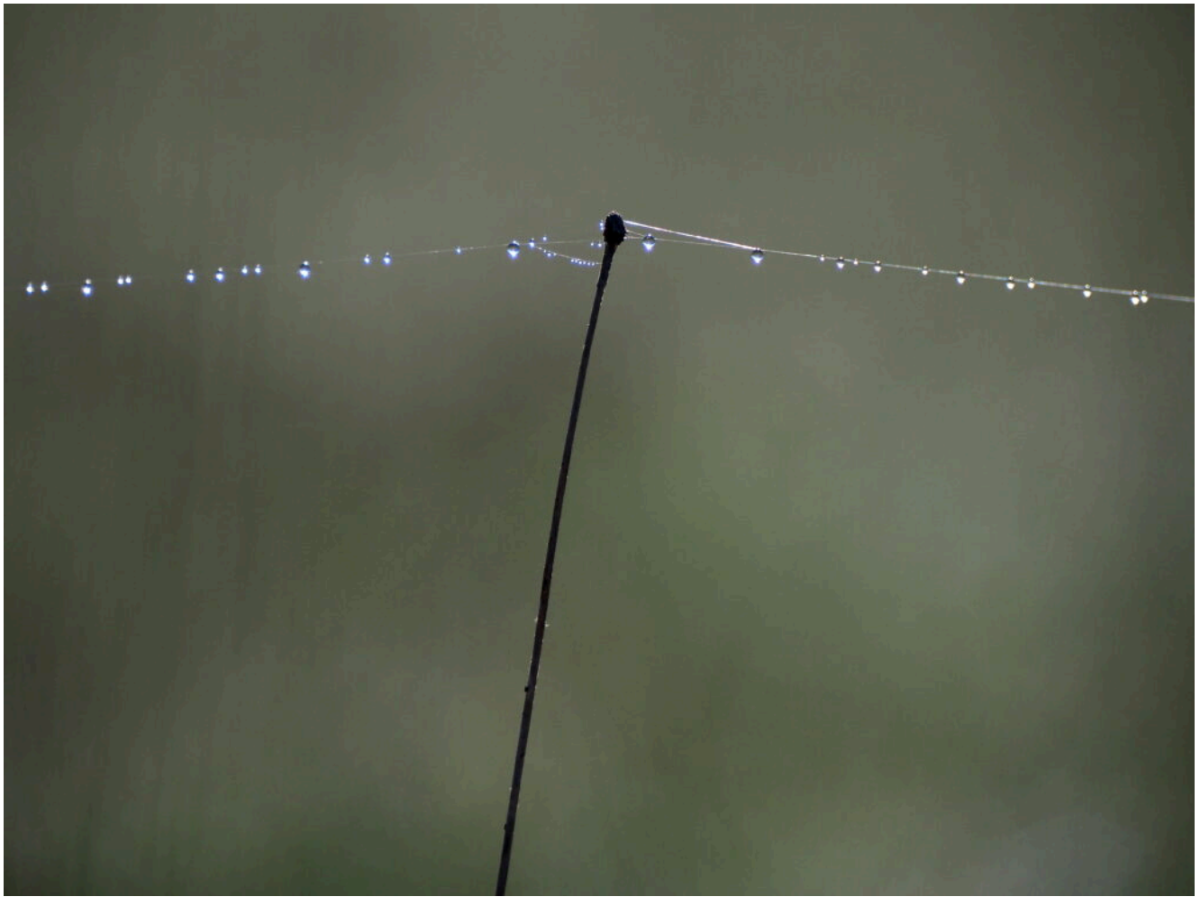
9- Uno stelo d'erba trasformato in un palo di collegamento