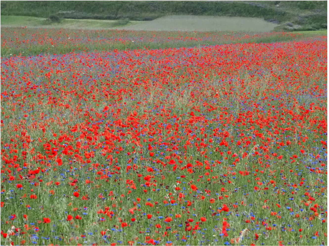
1 – 4 -campi fioriti prima del tramonto