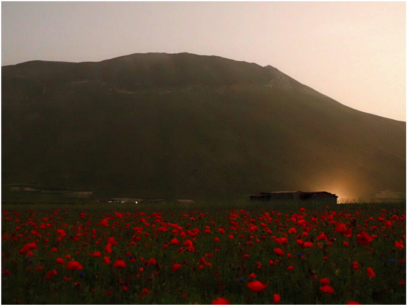
19 – 20- La Cima del Redentore in luce lunare