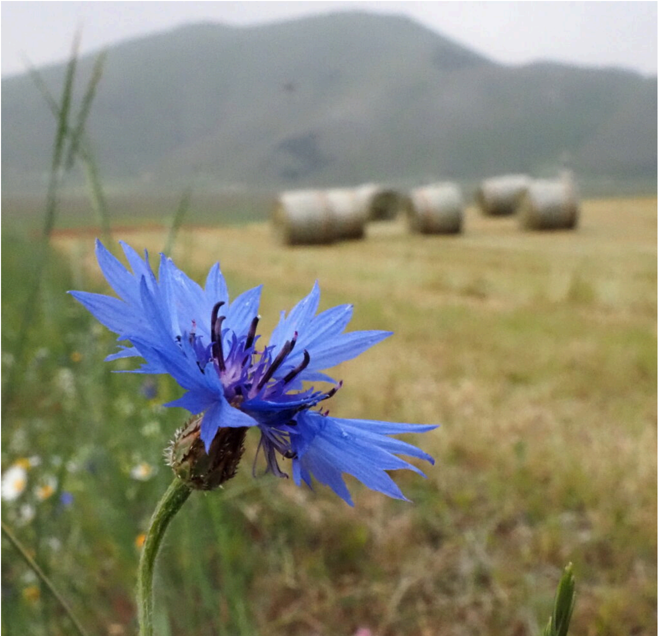
7 – 8- Fiordaliso ( Centaurea cyanus ).