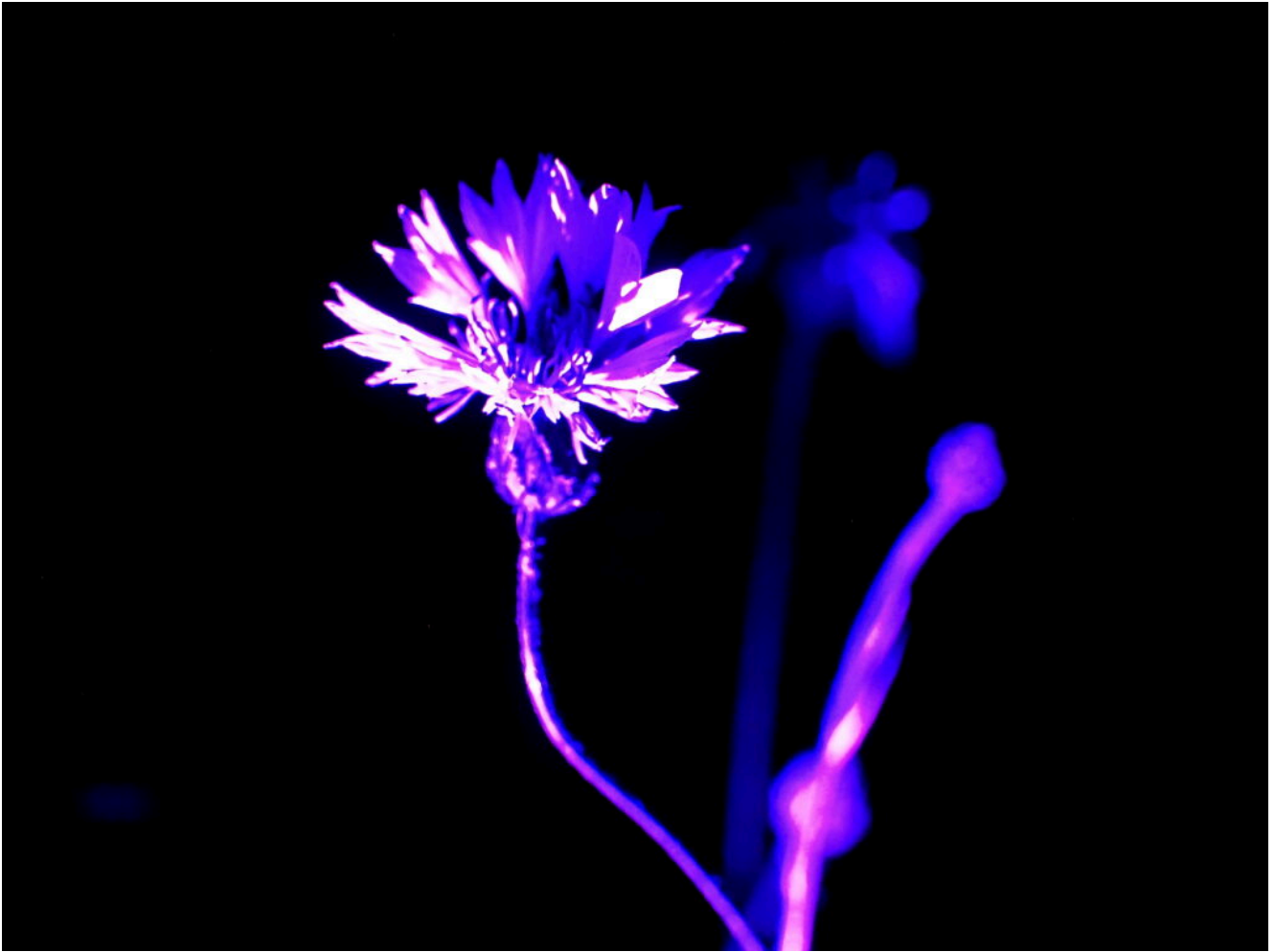
12 - 14 - Fiordaliso in luce Ultravioletta