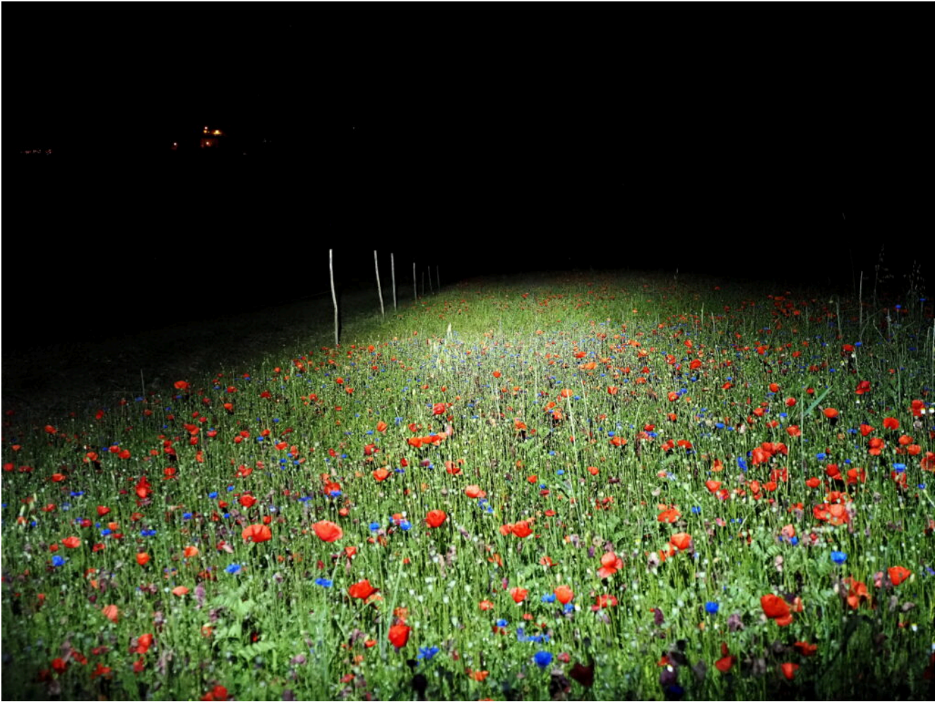
16- La fioritura in luce artificiale