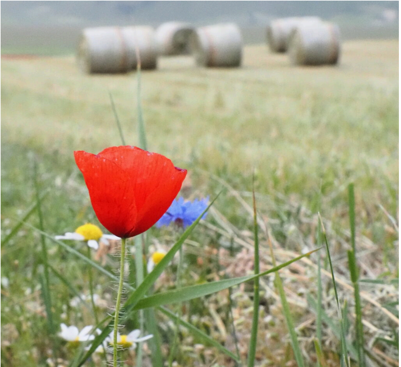
5 – 6- Papavero ( Papaver rhoeas )