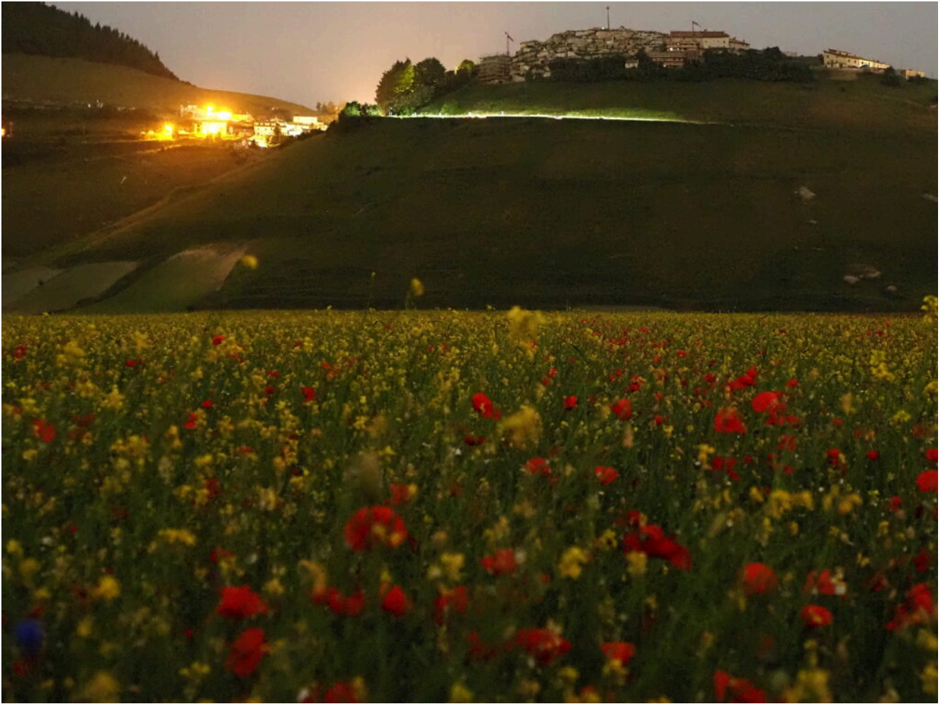
17 – 18- La fioritura in luce lunare, sullo sfondo il paese di Castelluccio.