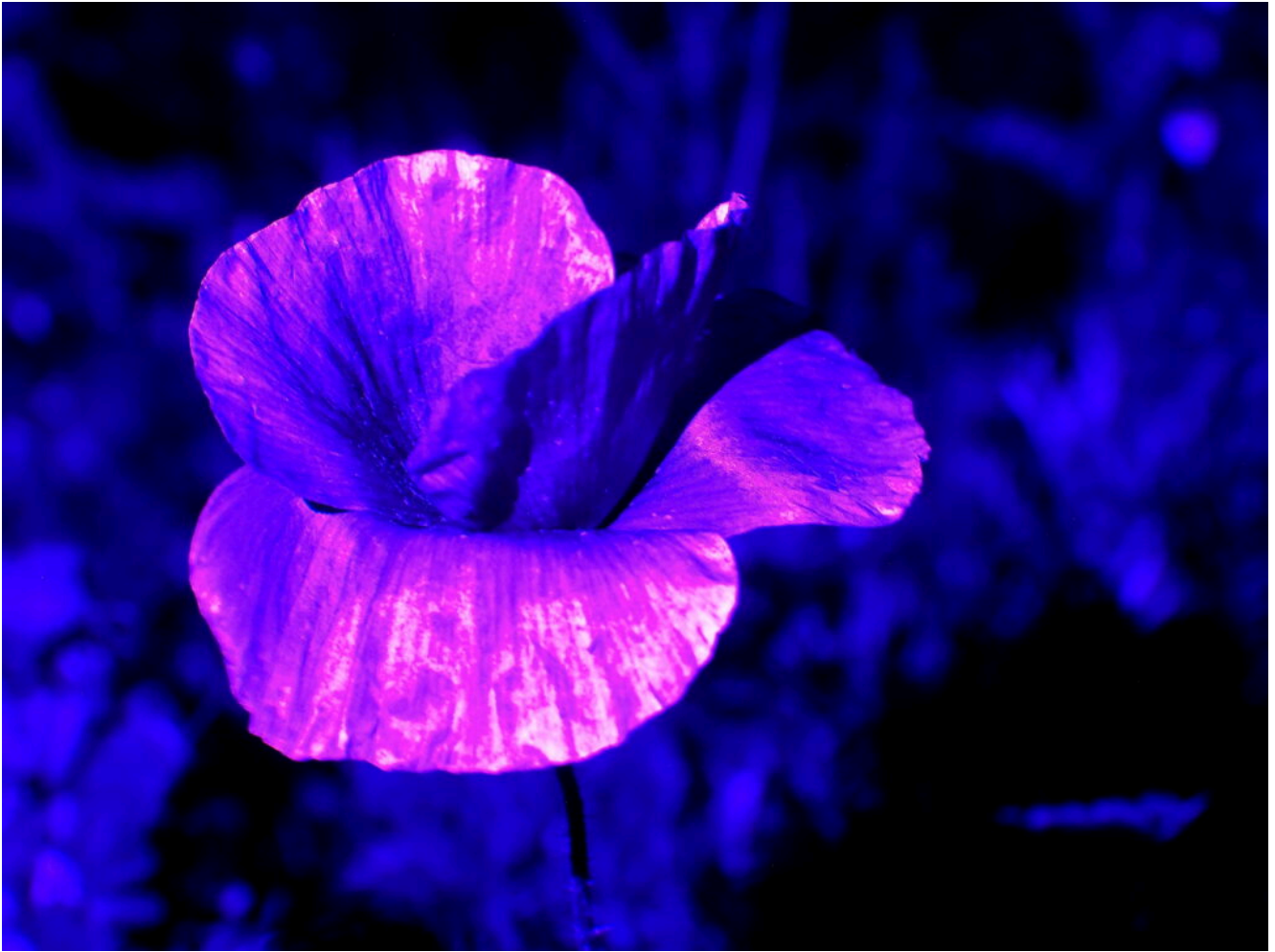
9 – 10- Papavero in luce Ultravioletta