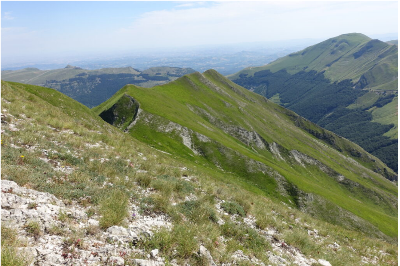
8- La Forcella Cucciolara da cui si scende alla nascosta Val di Tela.