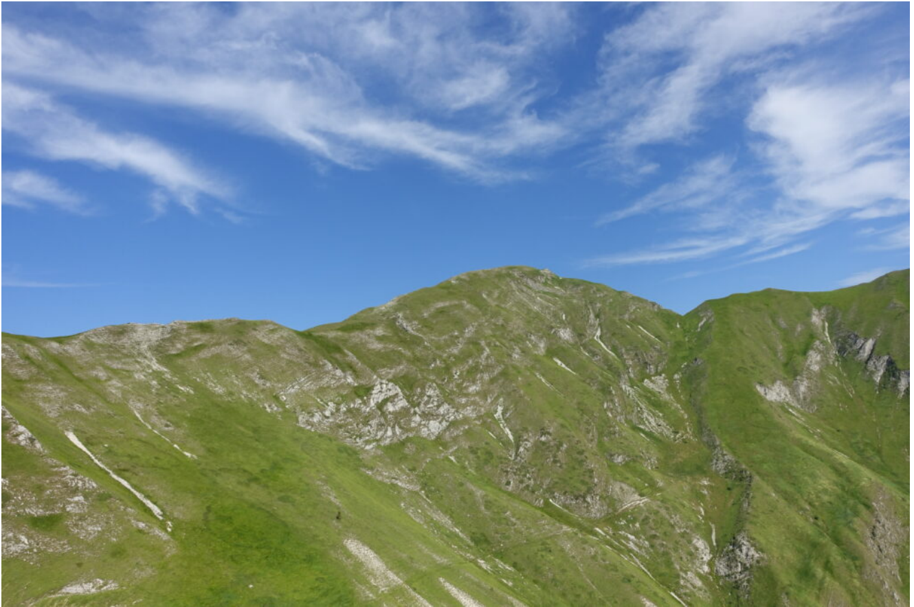
2- La cresta Sud del Monte Rotondo.