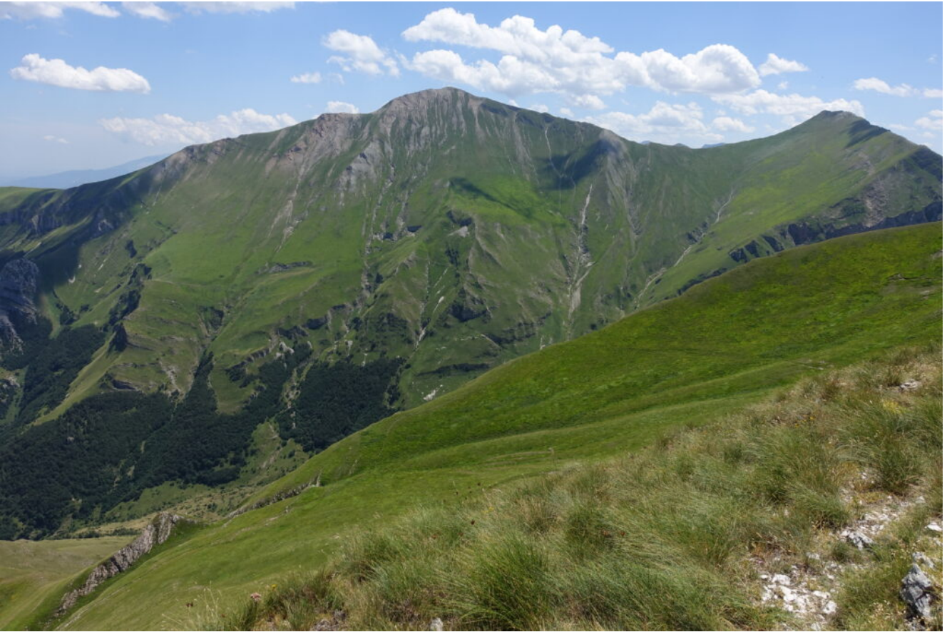
20- Il Pizzo Regina ed il Pizzo Berro visti dal Monte Acuto.