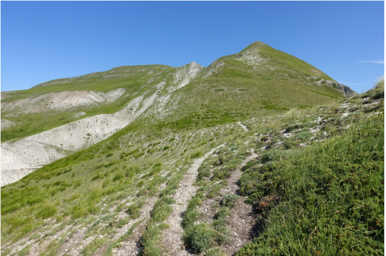
4- La cresta Sud del Monte Rotondo.