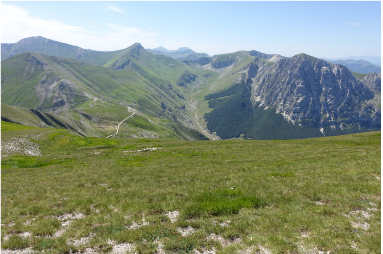
16- Veduta verso Sud.