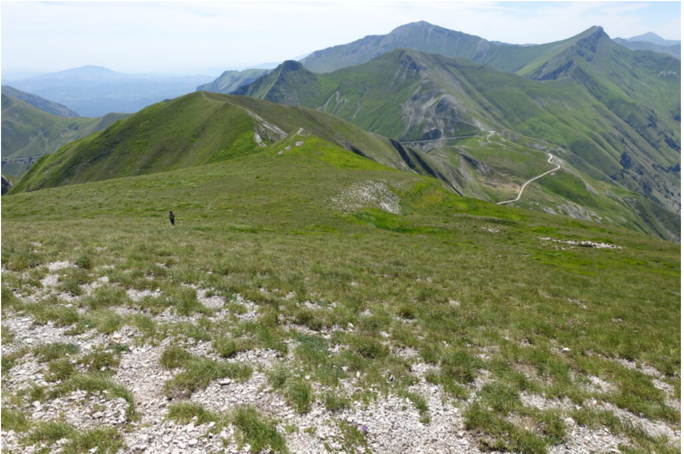
14- Veduta verso Est dalla cima del Monte Rotondo