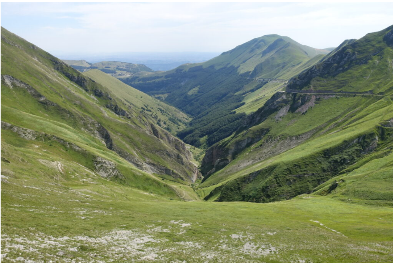
3- La Valle del Fargno con le sorgenti del Fiastrone, a destra il M. Castel Manardo.