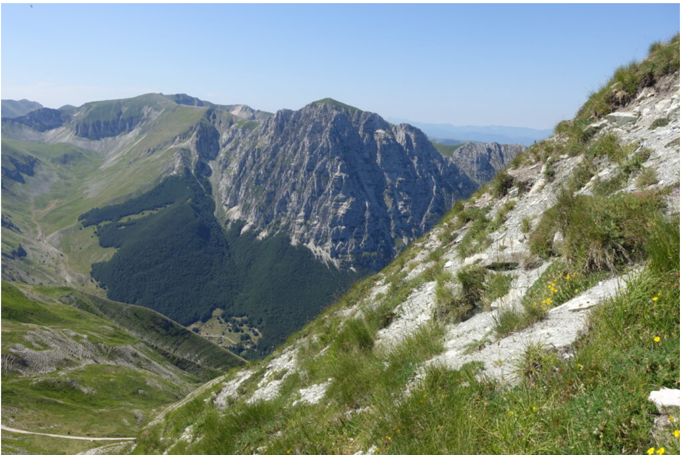
13- Il Monte Bove Nord e Sud e la Val di Panico sulla sinistra.