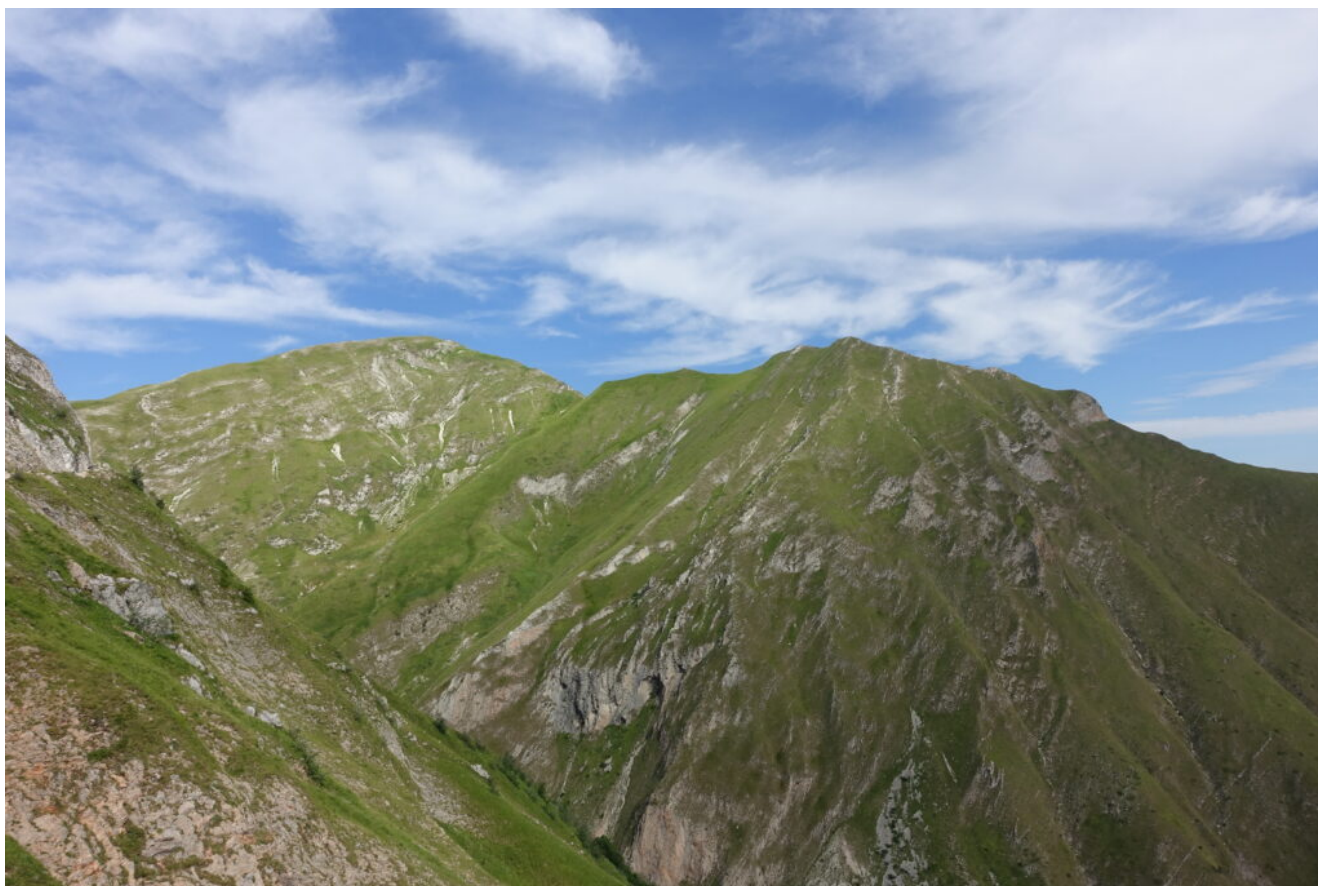
1- Il Monte Rotondo visto dalla strada del Fargno.