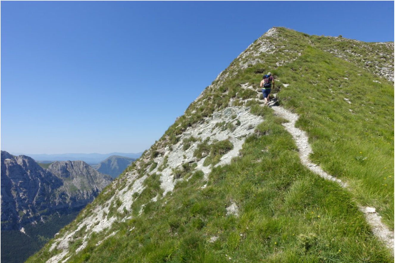
12- L'Antecima Sud del Monte Rotondo.