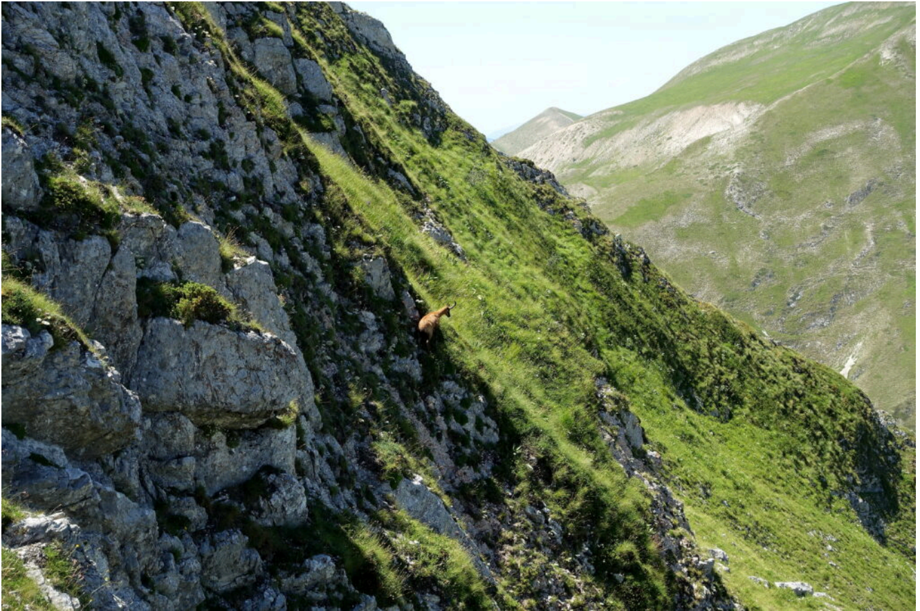
22- Camoscio sulla ripidissima parete Nord del Monte Acuto, a destra la cresta Sud del Monte Rotondo salita al mattino.