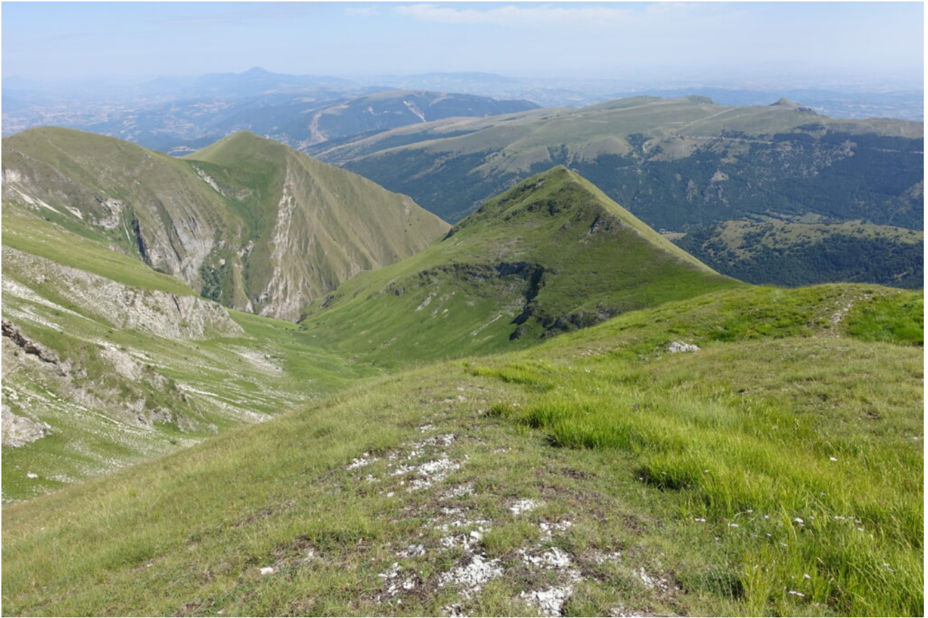
10- La Cima Bambucerta chiuse ad Est la Val di Tela.