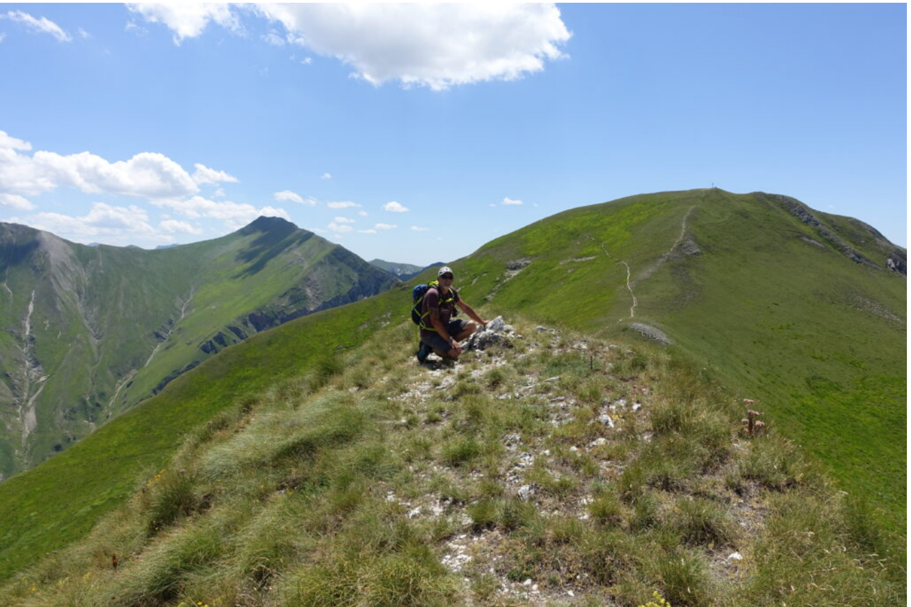
21- La stretta cima del Monte Acuto.