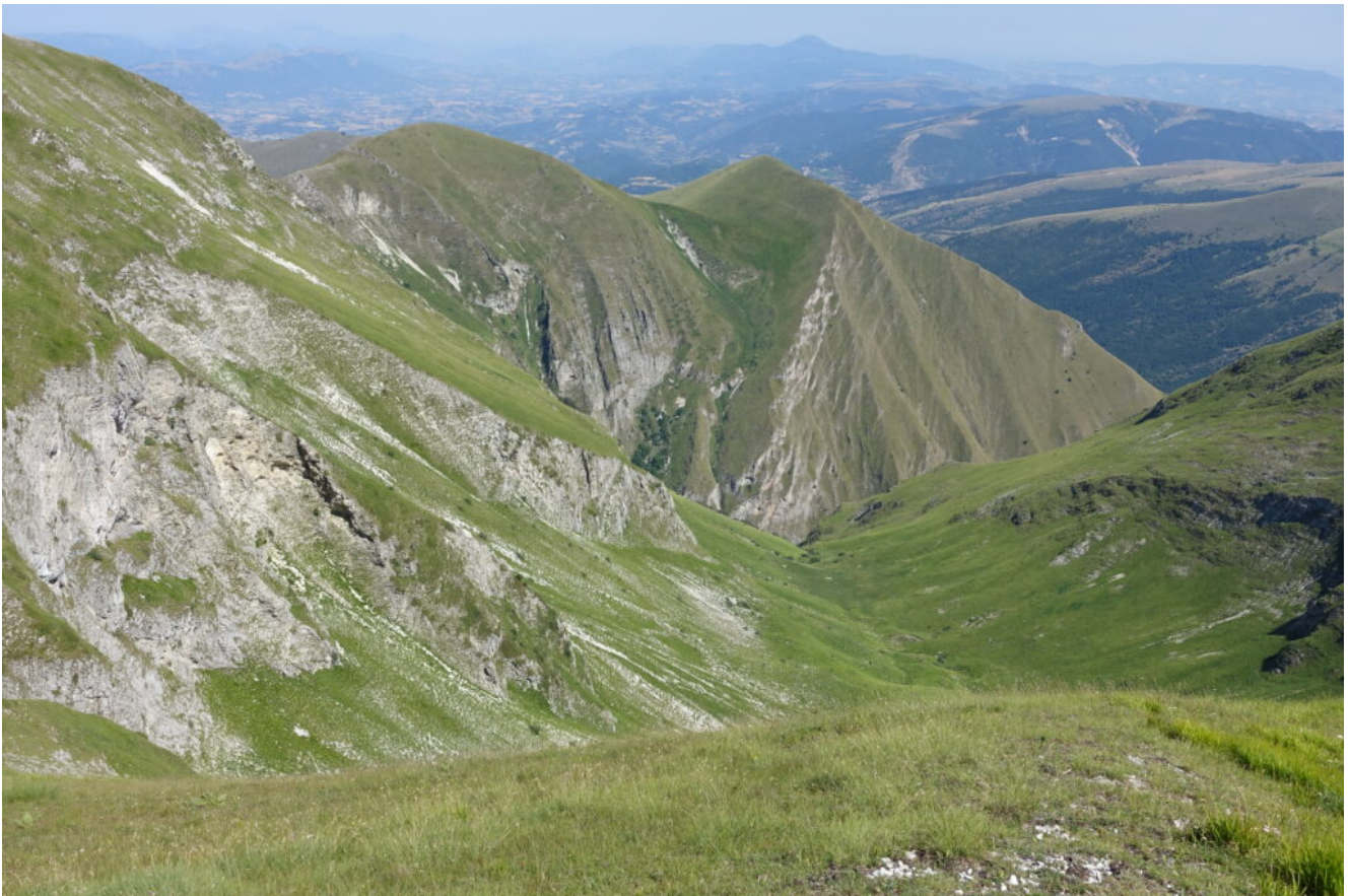
9- La Val di Tela con il Monte Cacamillo a destra e il Monte Pietralata a sinistra, tra i due si vede una piccola porzione