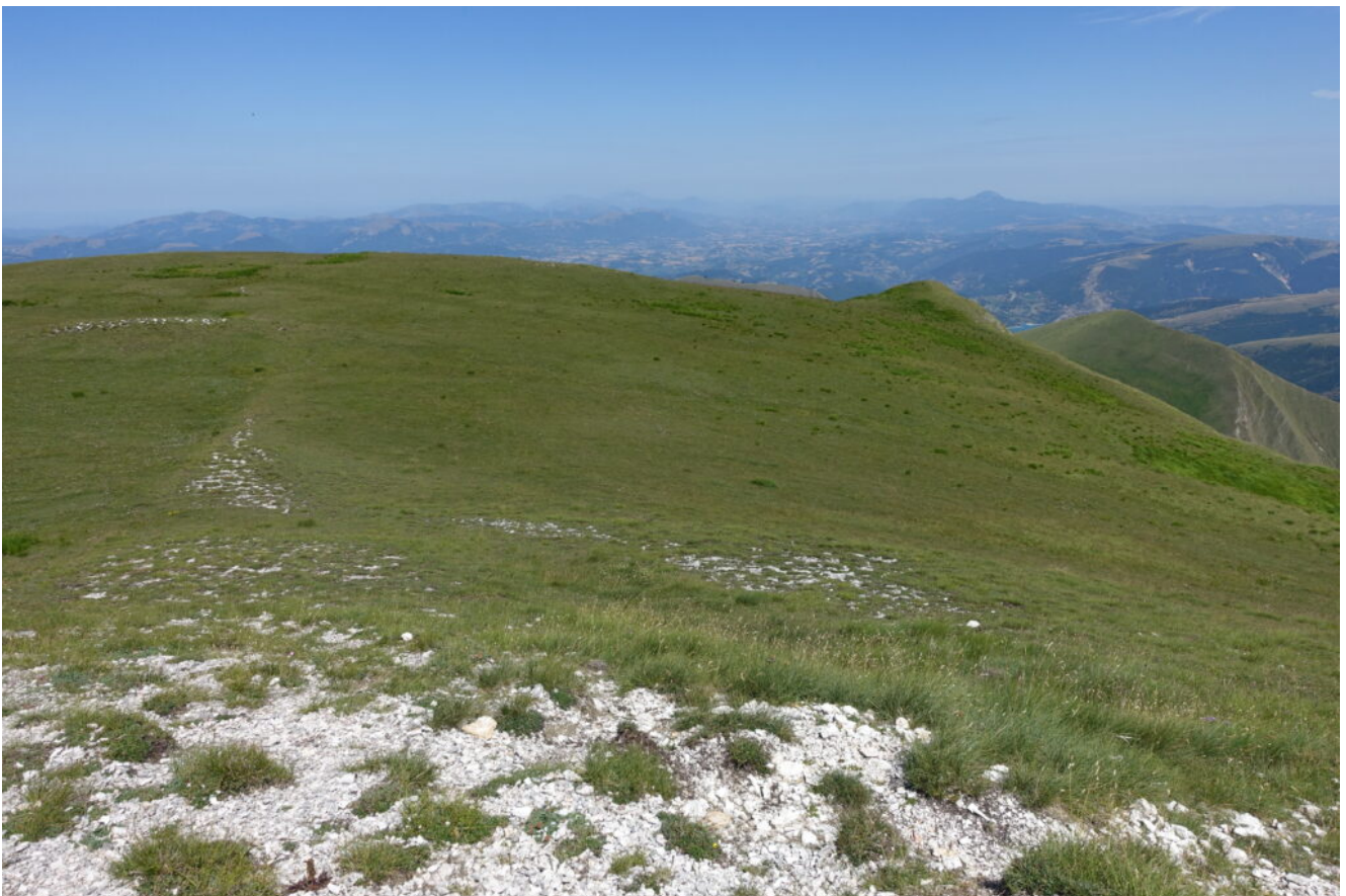
15- Veduta verso Nord