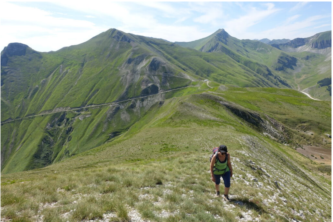
5 – 6 – Verso la cima del Monte Rotondo