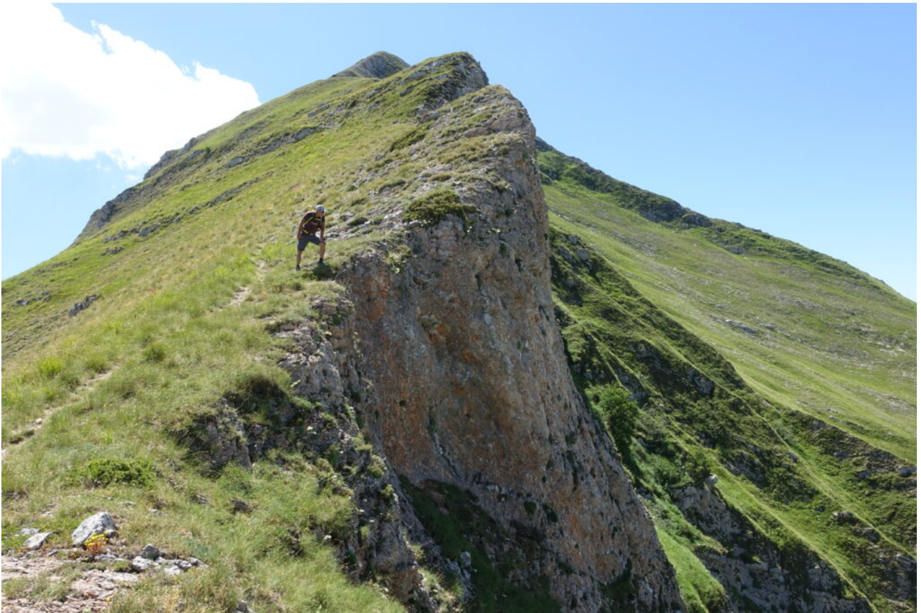
23 – 24 – La bellissima cresta Est del Monte Acuto che scende verso Forcella Bassete.