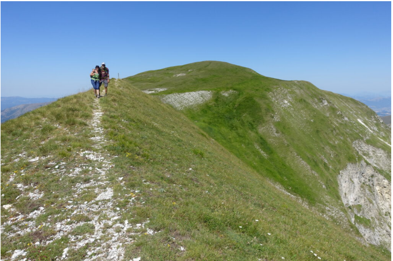
11- La cima del Monte Rotondo.