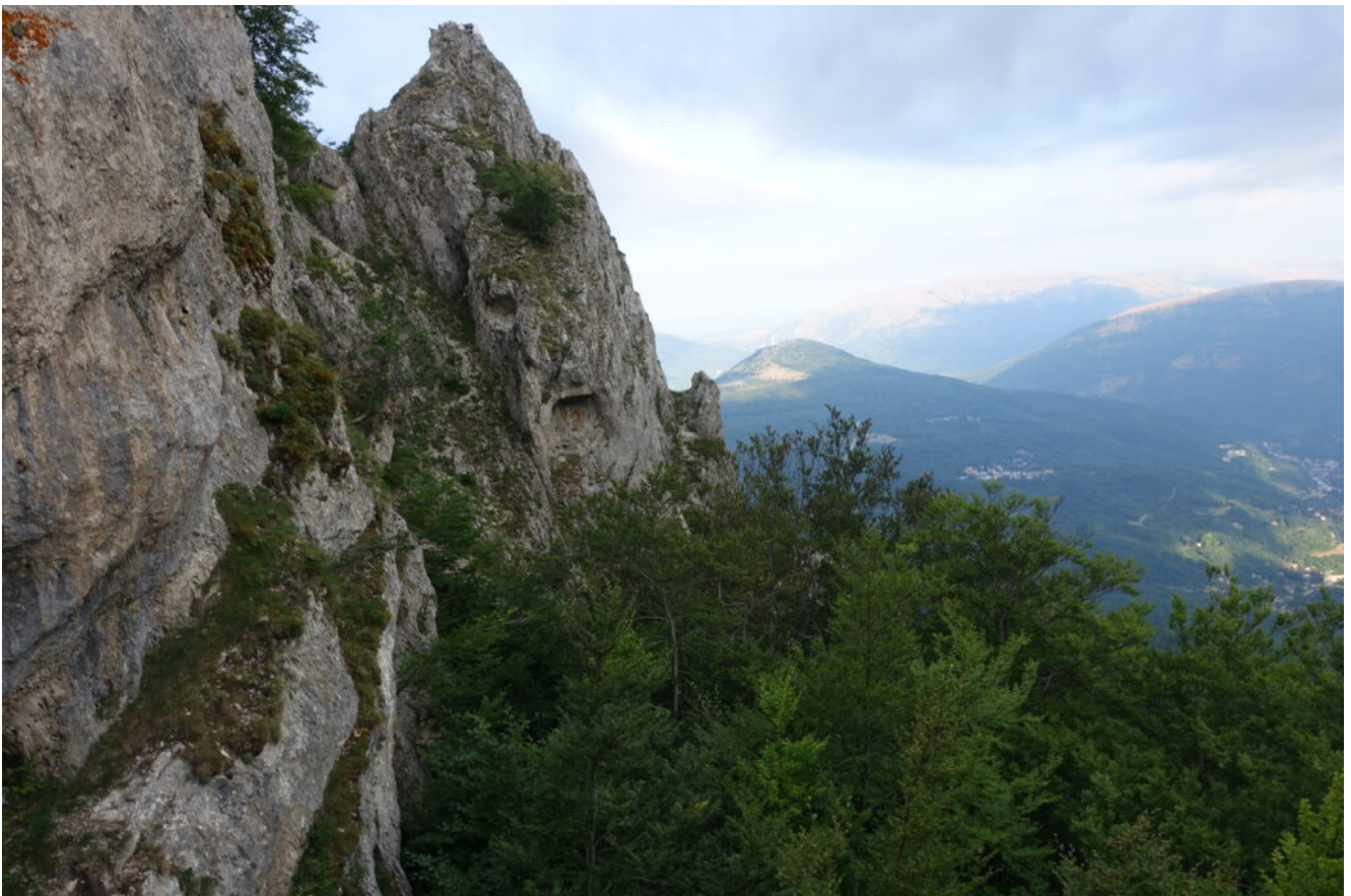
2- Gli alti torrioni del versante Nord dell'inizio della