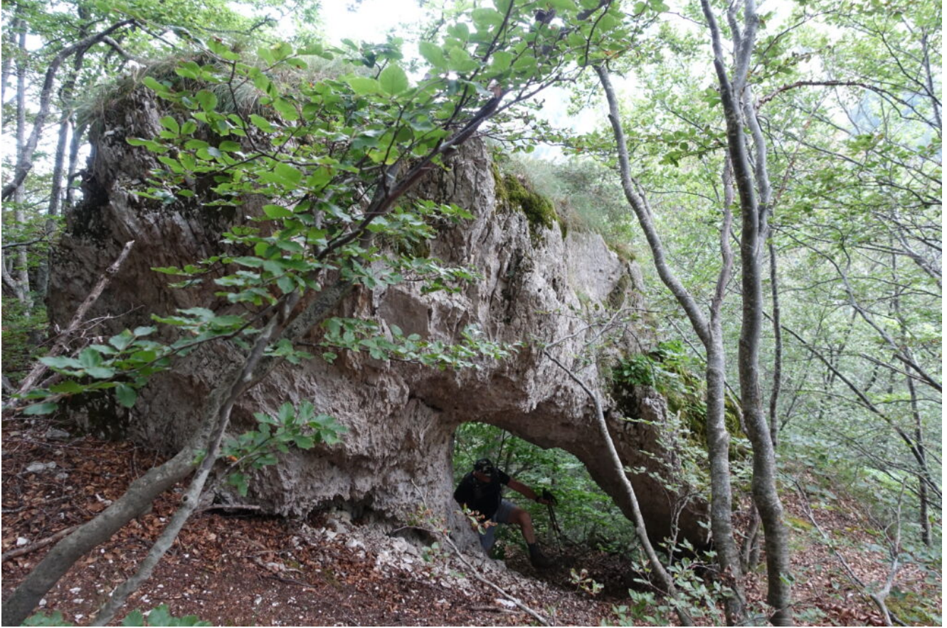
1- Il masso isolato nel bosco, poco oltre l'inizio della cresta del Bicco, caratterizzato da un arco, nelle sue vicinanze si trova la grotticella non censita.