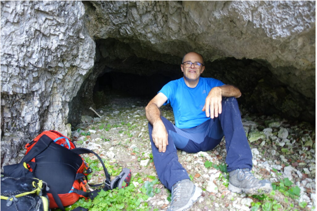
10- Il sottoscritto davanti alla grotticella I.