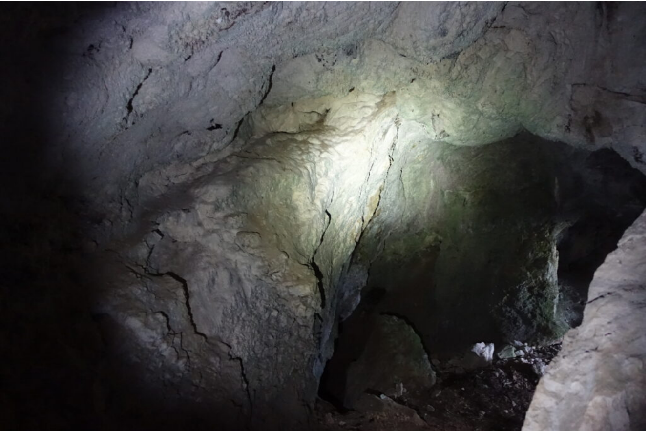
25 - 27 - L'uscita