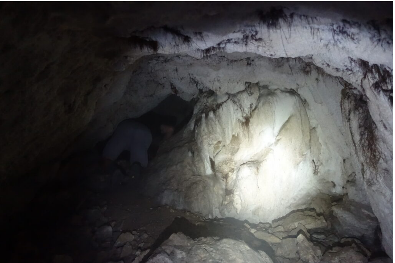
24- La grotta presenta anche delle concrezioni calcaree nei pressi della strettoia centrale