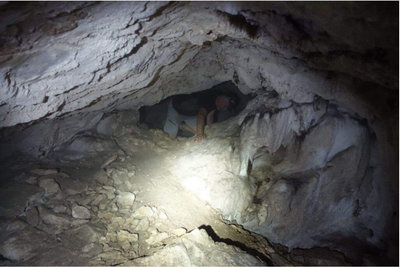
23- La strettoia centrale