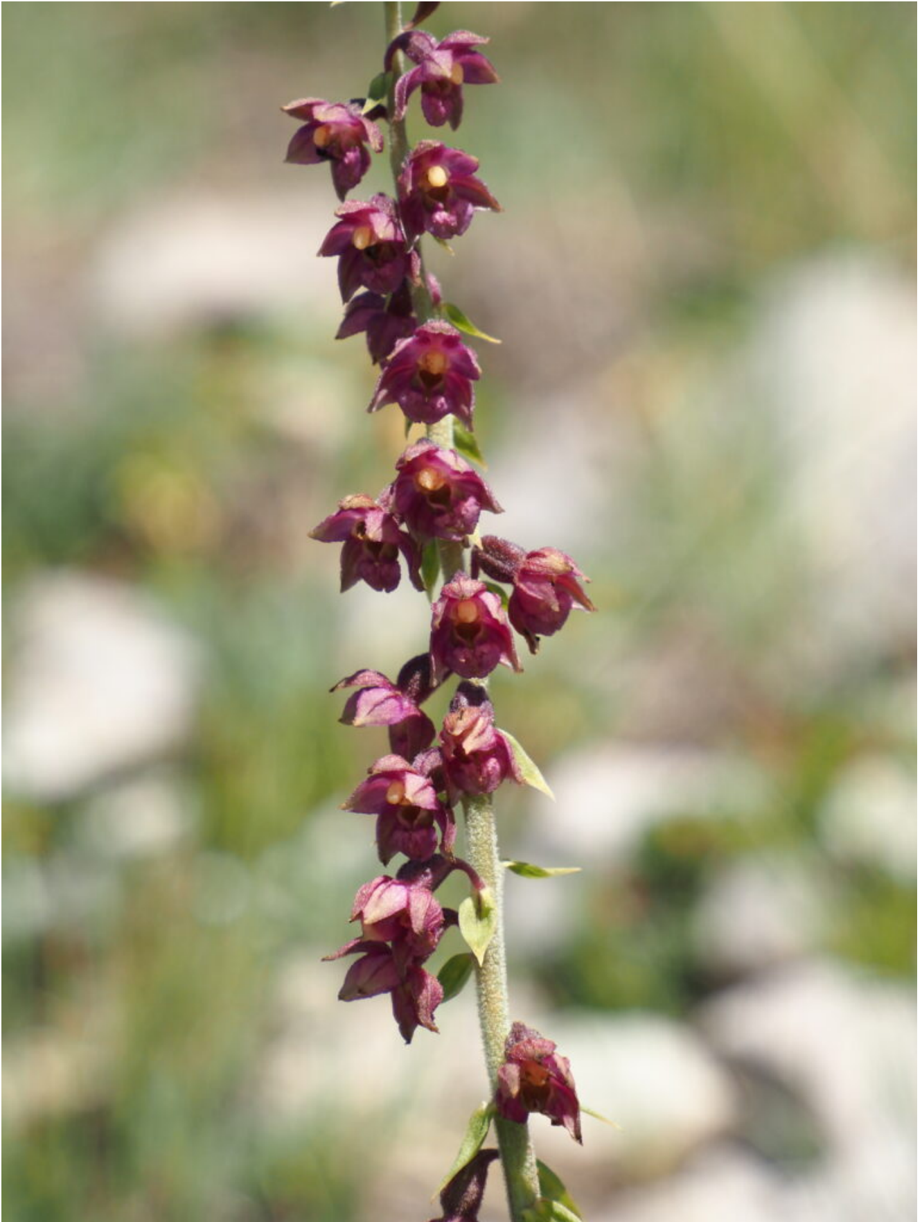
16- Una orchidea che cresce nei ghiaioni calcarei, l' Epipactis atrorubens .