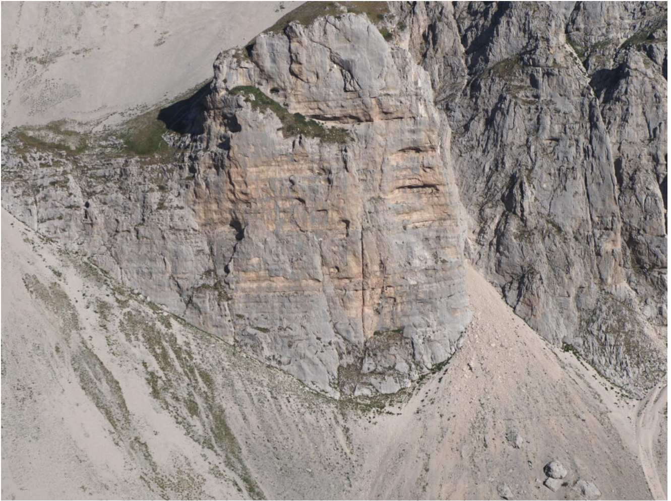
3- Il torrione denominato "il Castello"