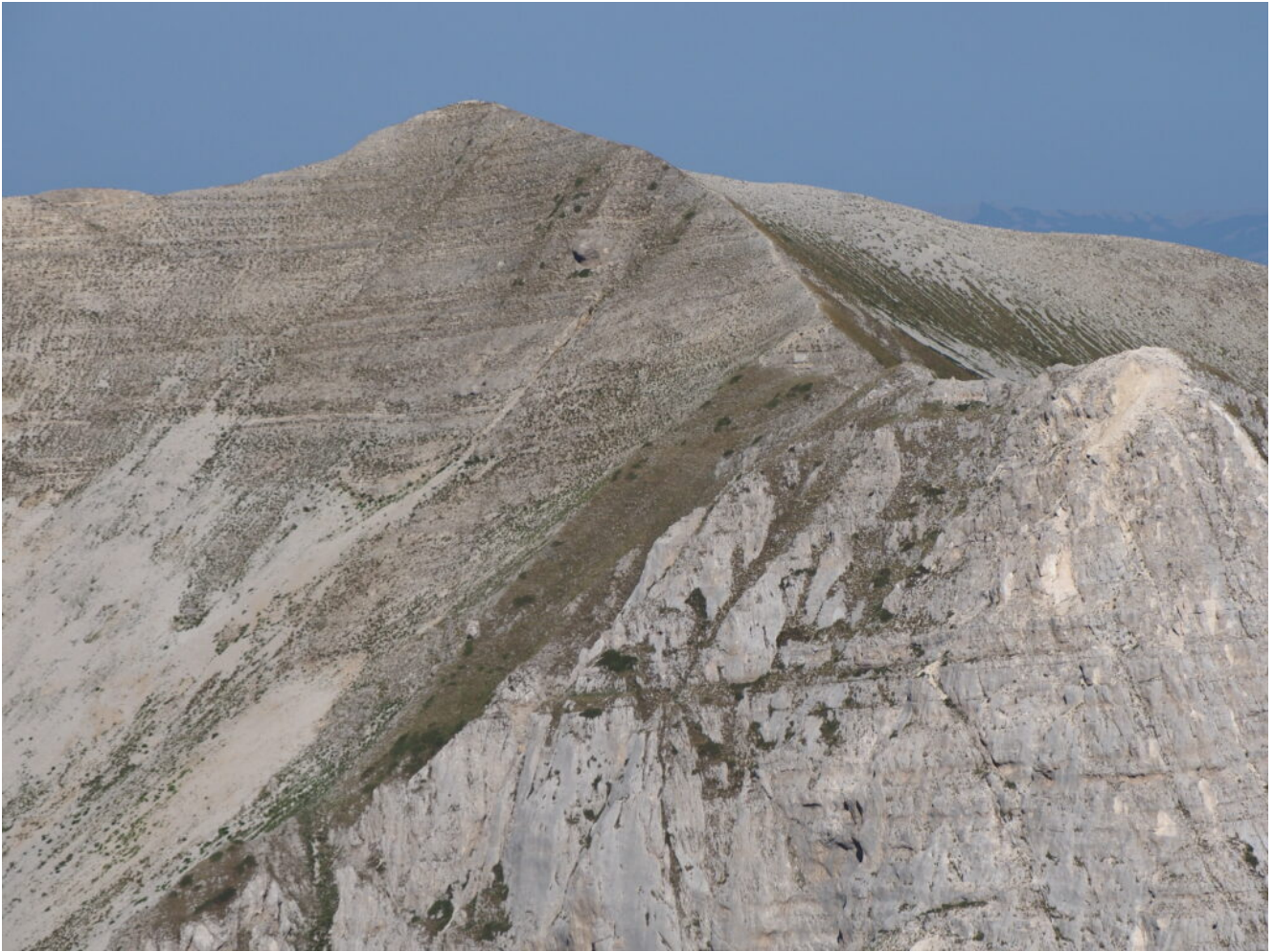
5- La cresta tra la Cima del Redentore e il Pizzo del Diavolo.