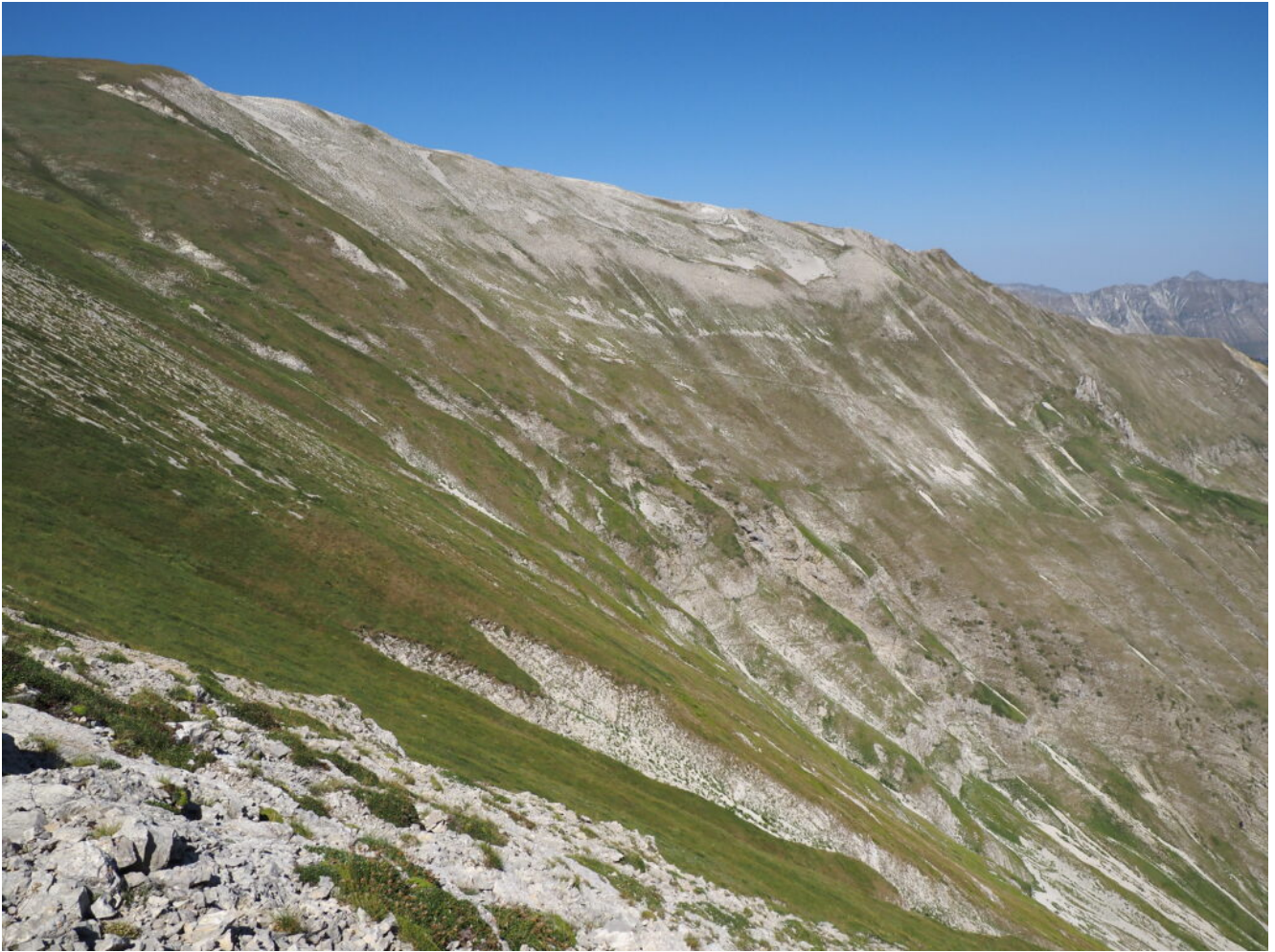
25- la cresta che dalla cima del M. Vettore scende verso l'appuntita Antecima Nord.