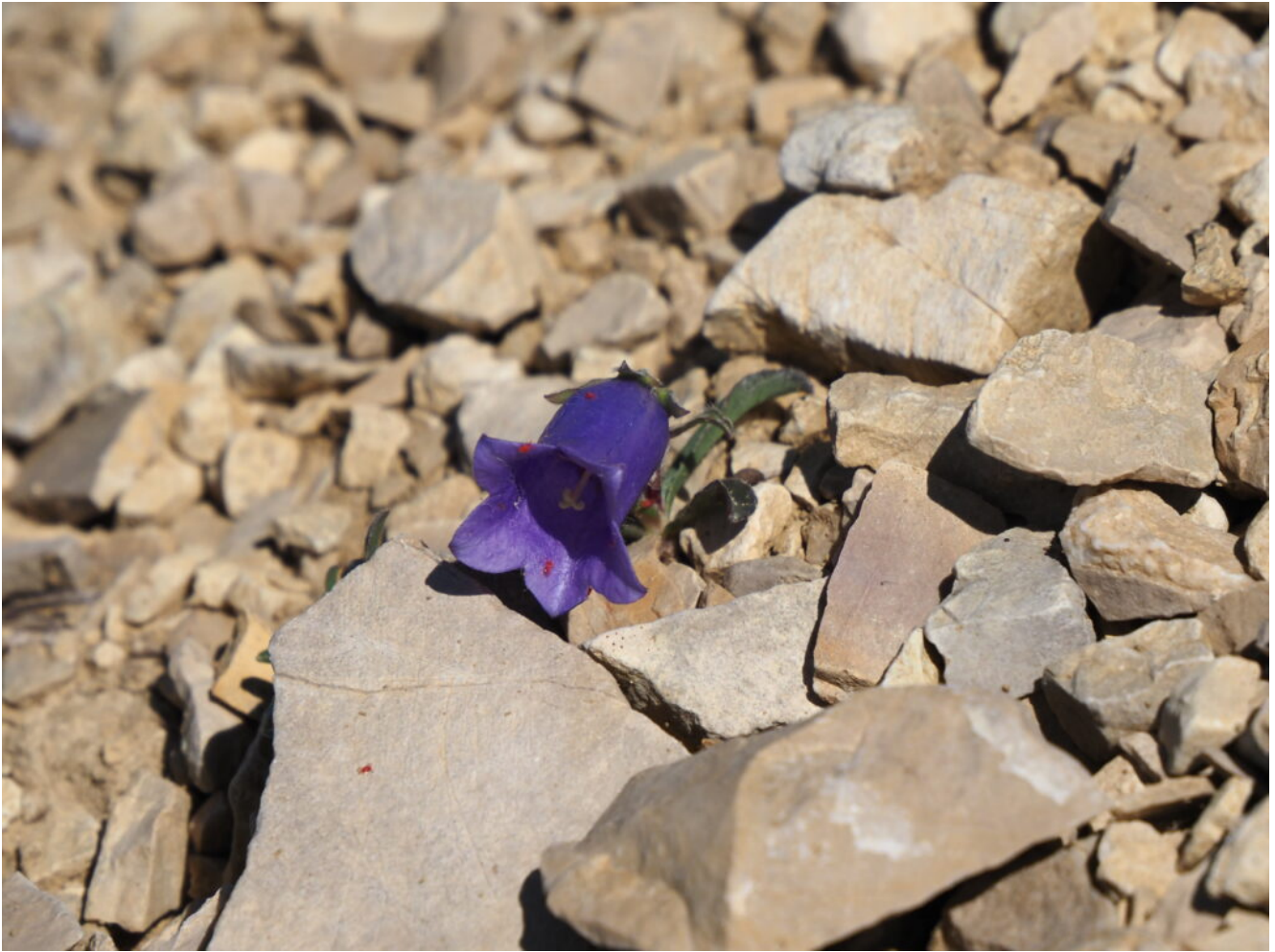
14 – 15 – Campanula alpestris , la pianta più rara dei Monti Sibillini presente in una unica stazione.