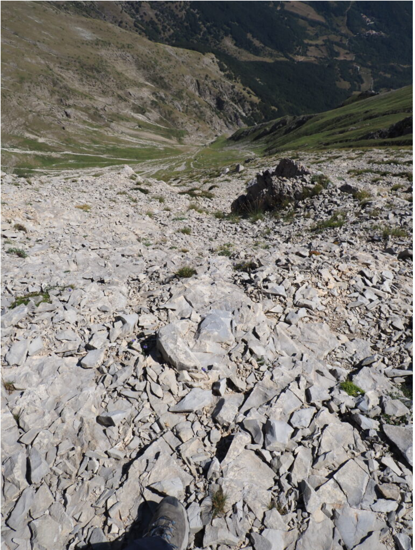
21- L'imbuto Nord del M. Vettore.