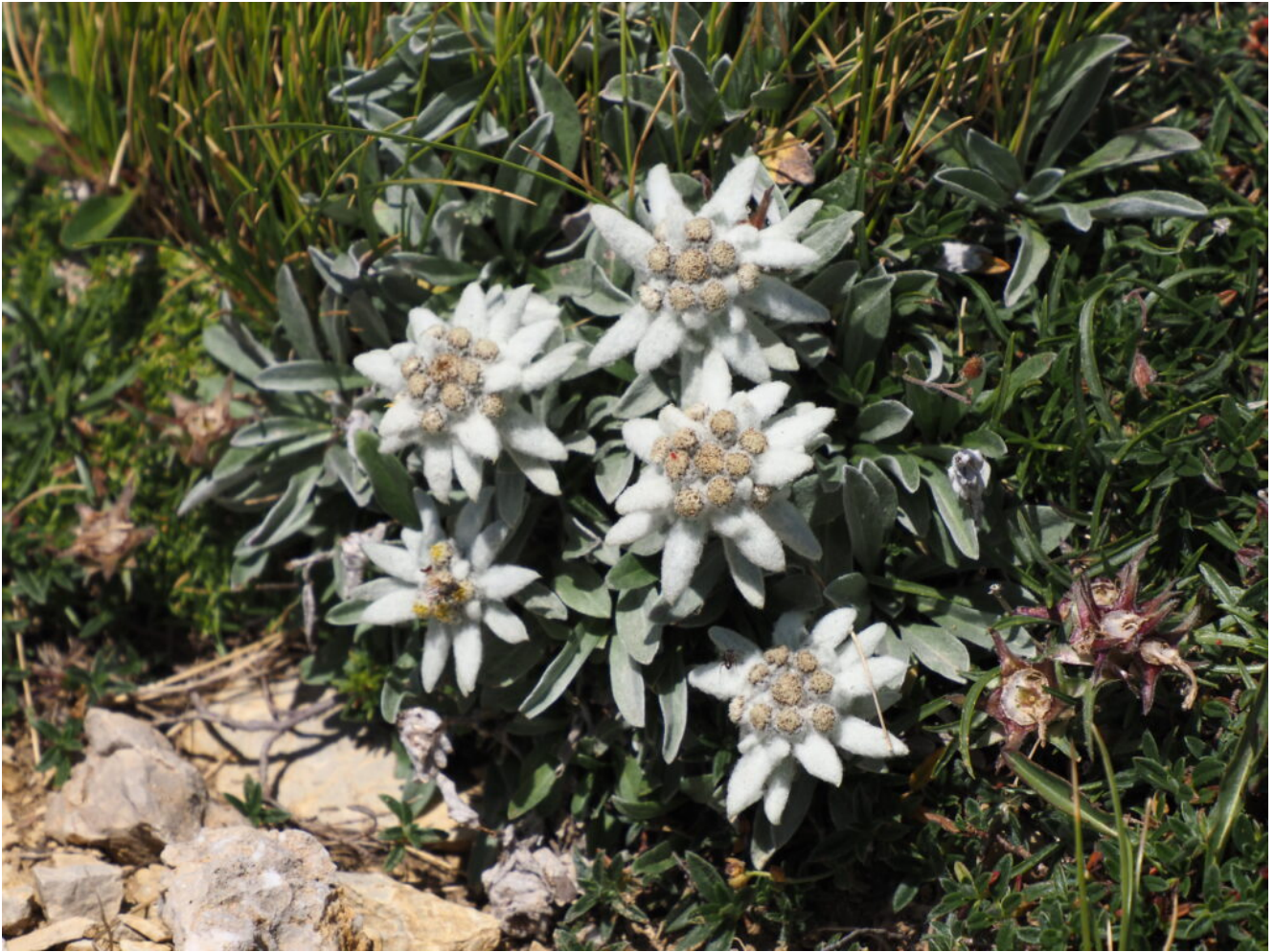
29- Bellissimo esemplare di Leontopodium alpinum subsp. nivale .