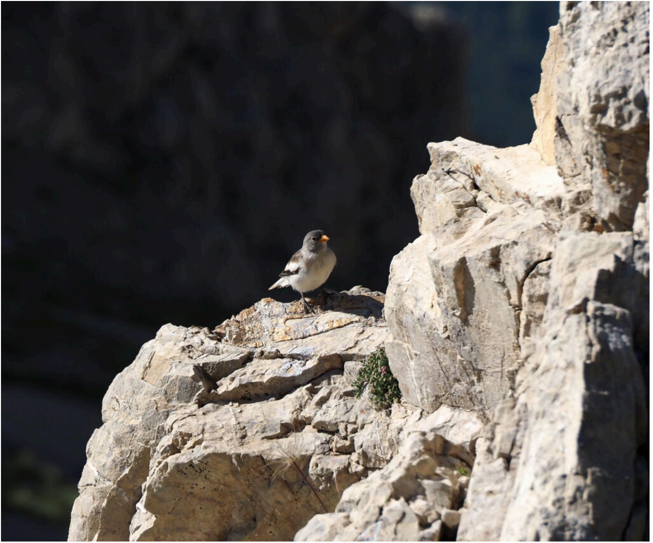
8 – 9 – Fringuello alpino ( Montifringilla nivalis ).