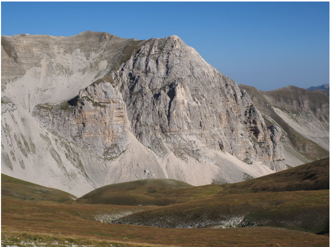
1- La Cima del Redentore e il Pizzo del Diavolo visti dalla Sella delle Ciaole.