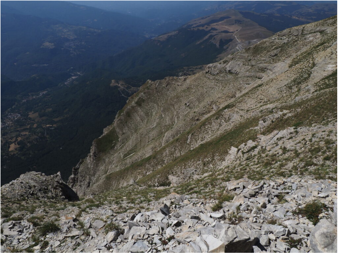
22- La cima della "Piramide"