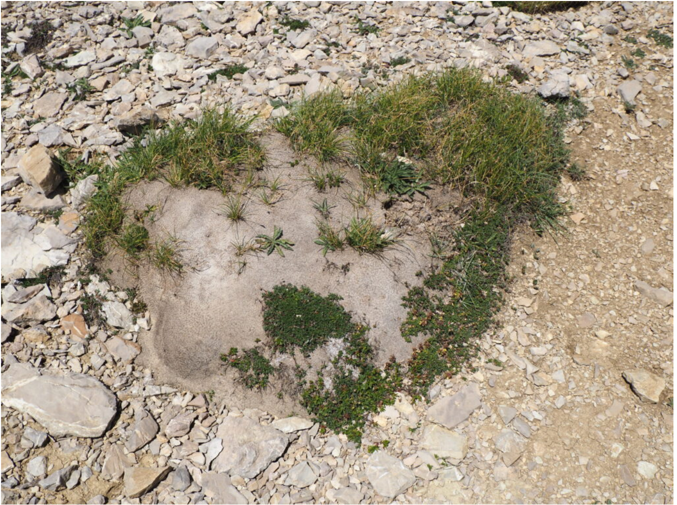
28- Vecchio cuscinetto di Silene acaulis ormai morto che fa da substrato ad altre piante.