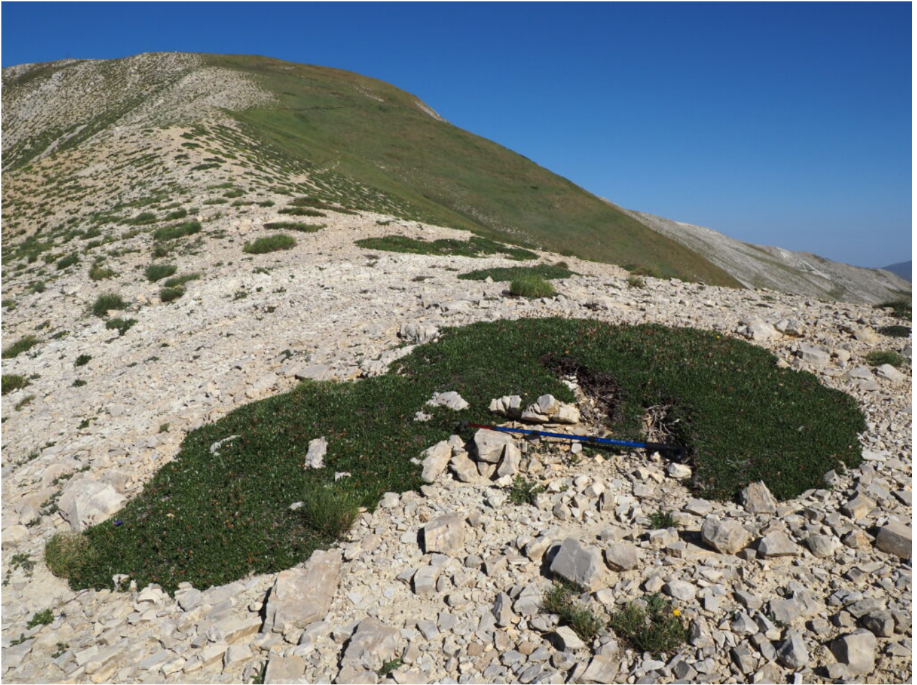
12- Grandi e secolari arbusti nani di Drias octopetala .