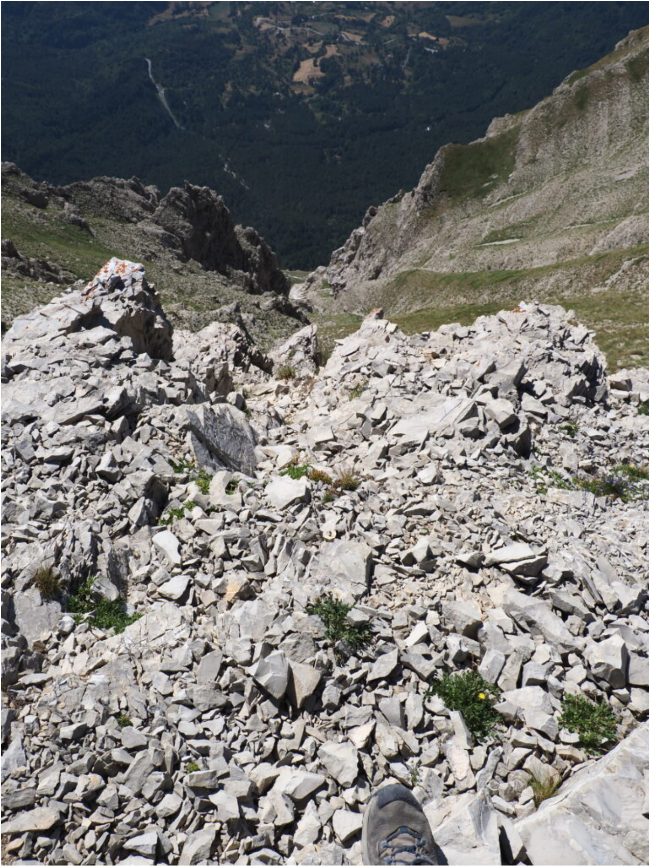
19- L'imbuto del "canalino" nel versante Sudest del M. Vettore.