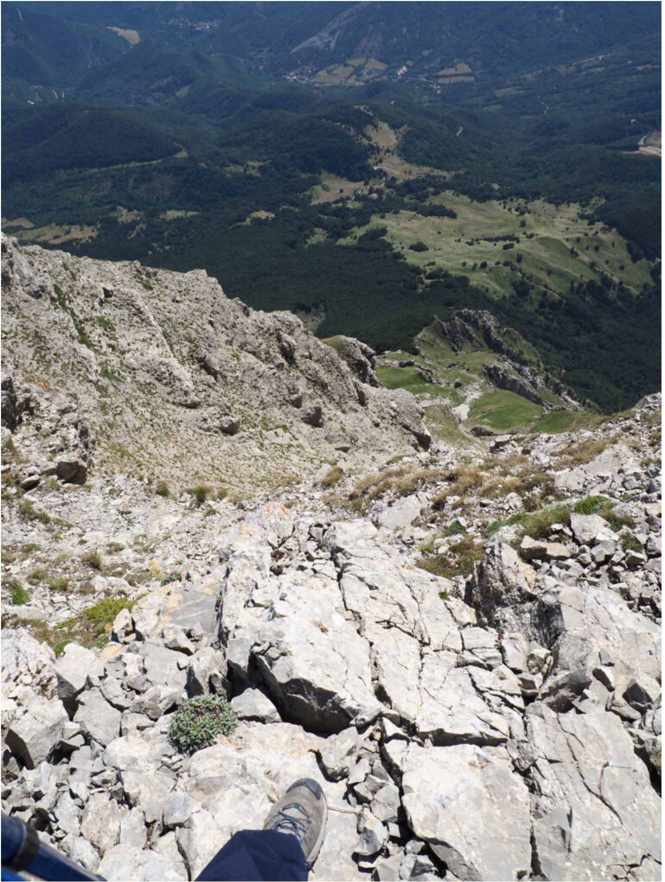
24- La cresta di Galluccio