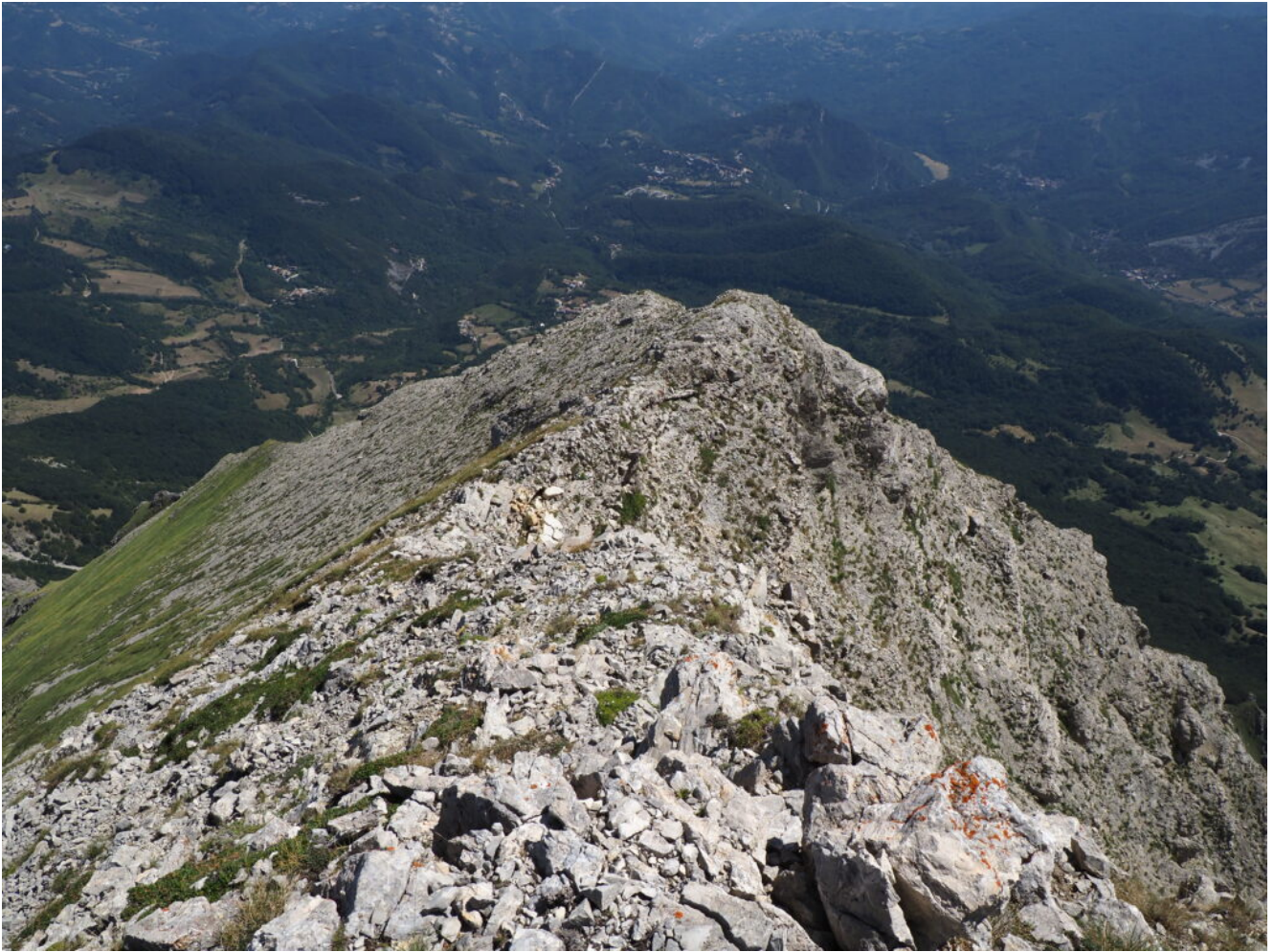
26- La Cima di Pretare