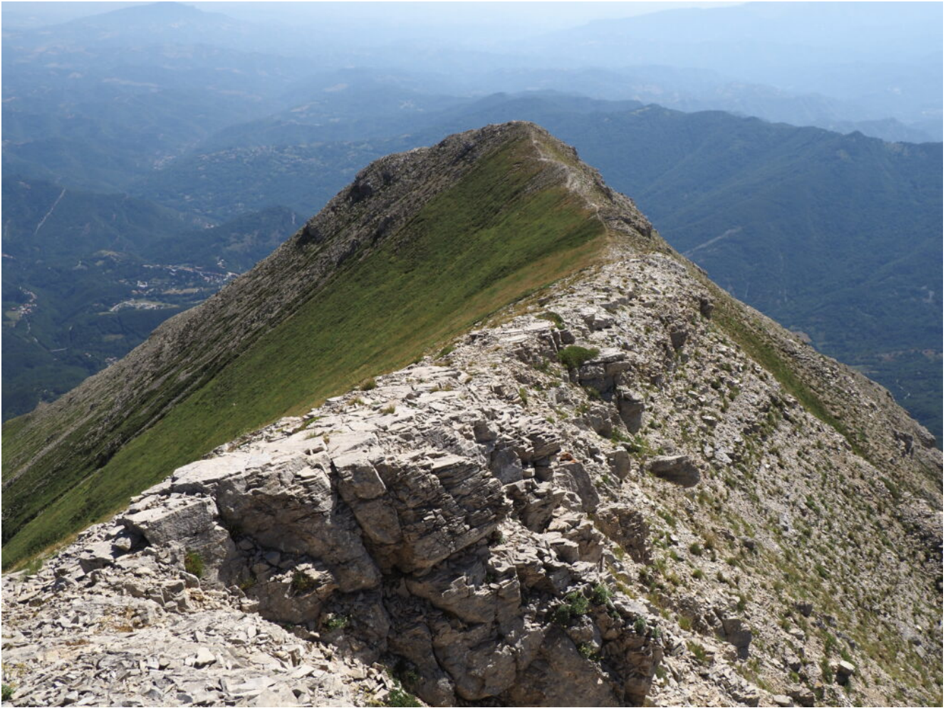
20- La Cima di Pretare.