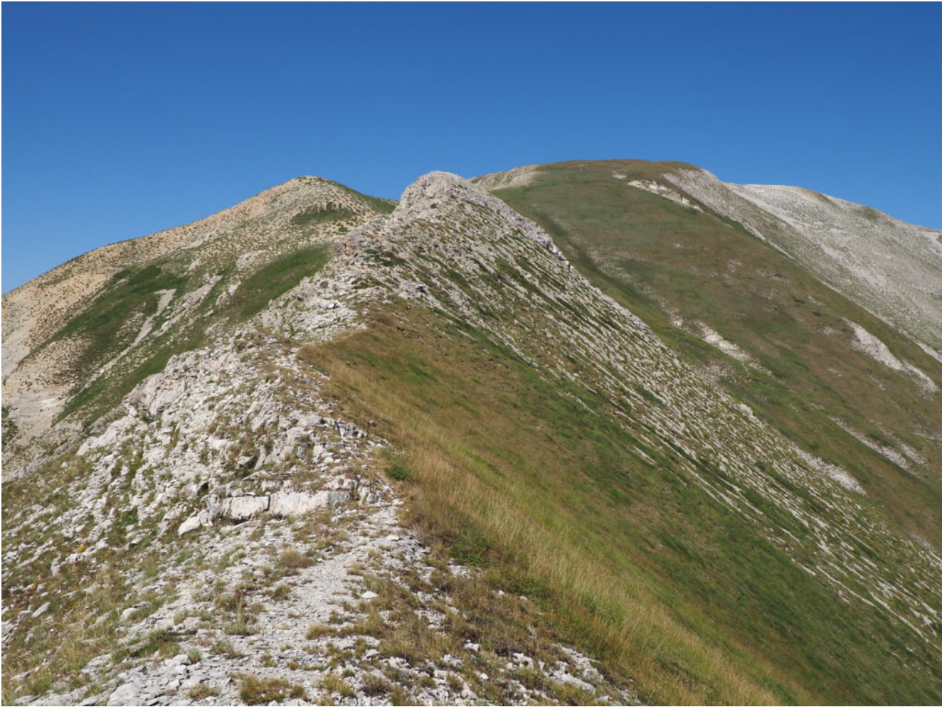
23- Veduta dalla Cima di Pretare verso la cima del M. Vettore.