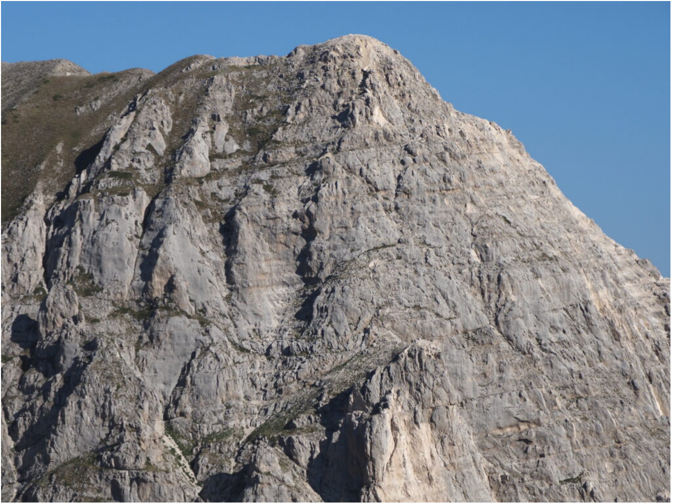
2- La cima del Pizzo del Diavolo