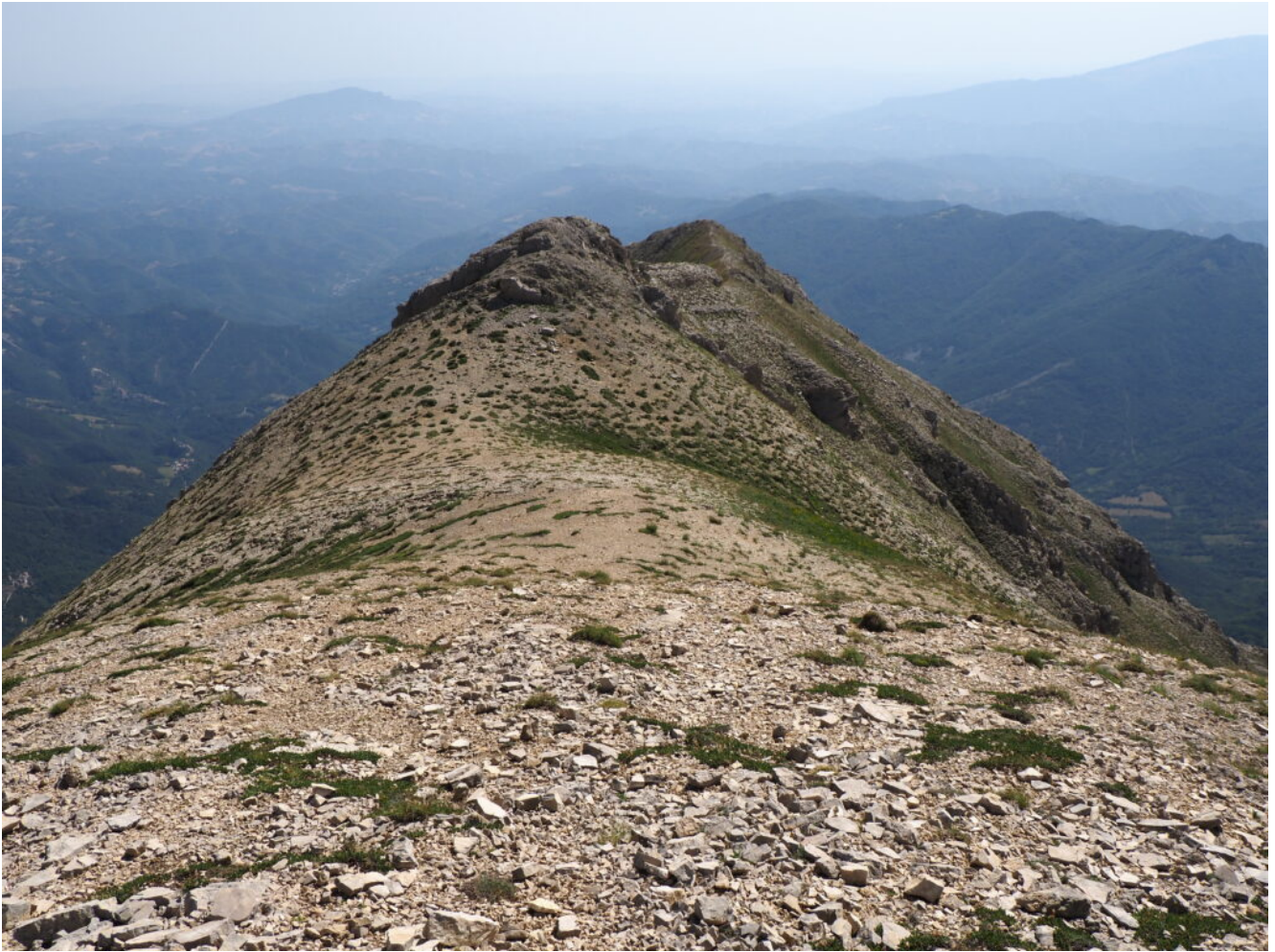
18- La cresta che dal M. Vettore scende verso la Cima di Pretare.