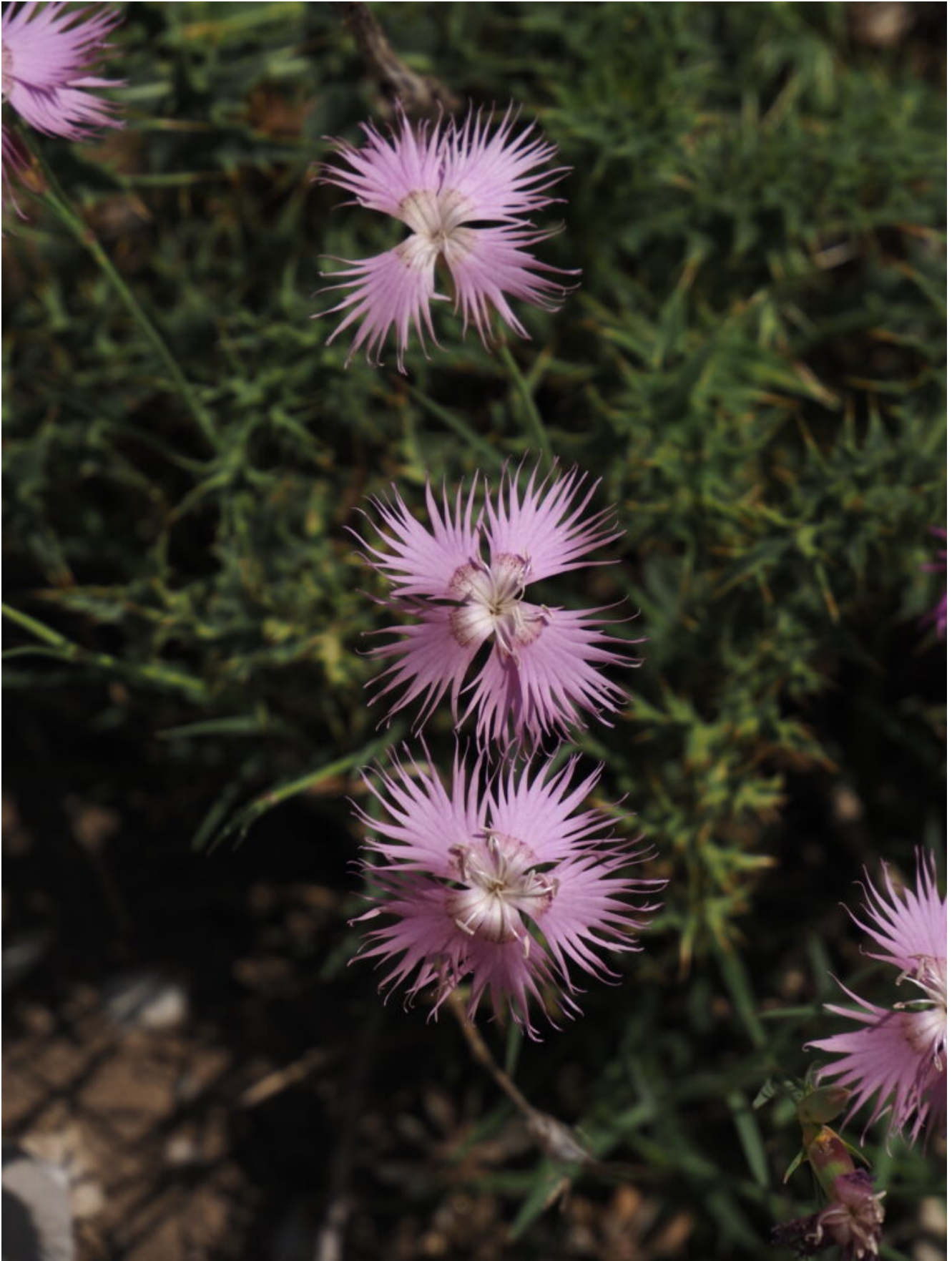
31- Il profumatissimo Dianthus monspessulanus .