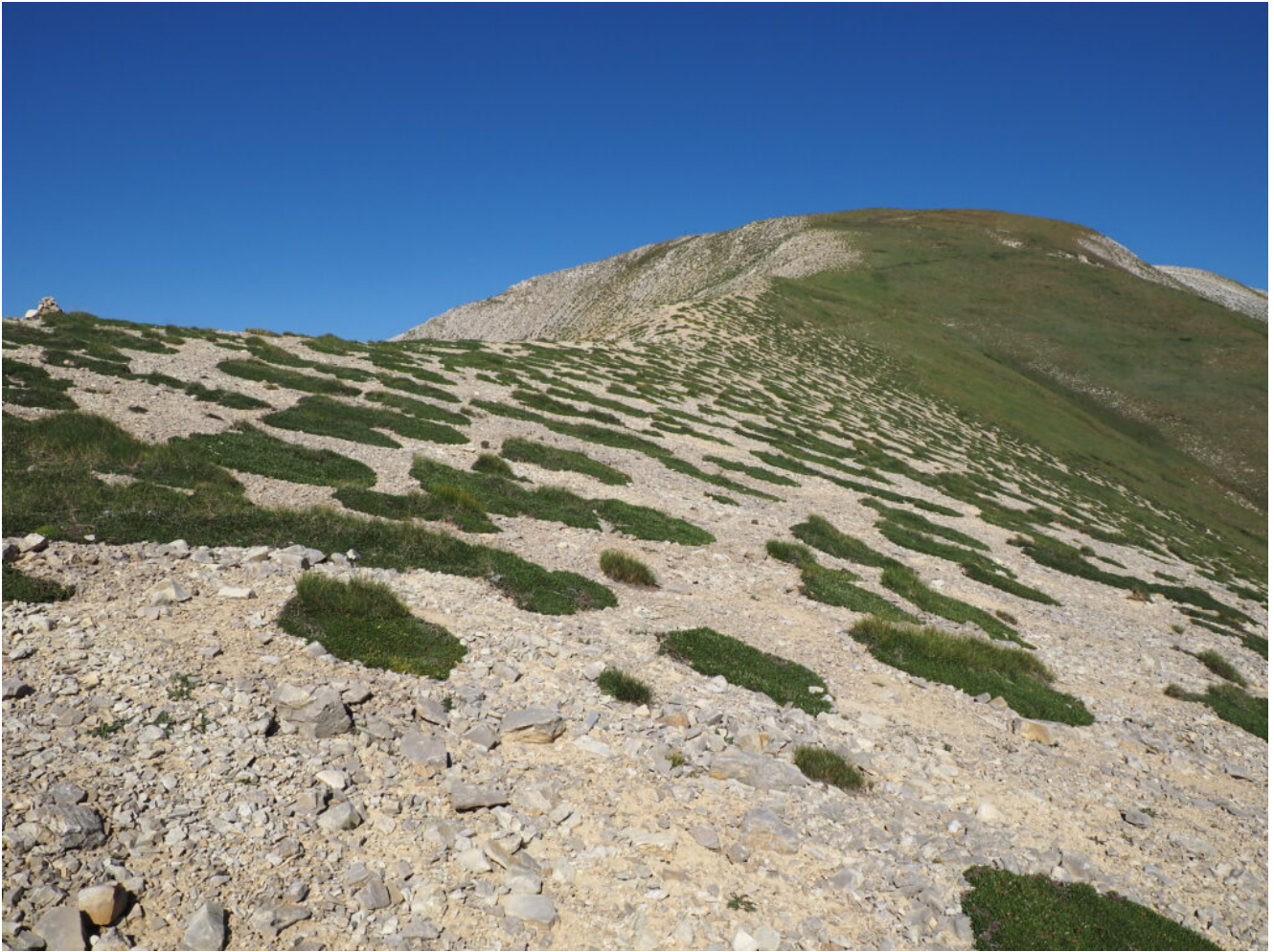
13- La cresta che dal M.Vettore scende alla Cima di Pretare è tappezzata da centinaia di arbusti nani di Drias octopetala .