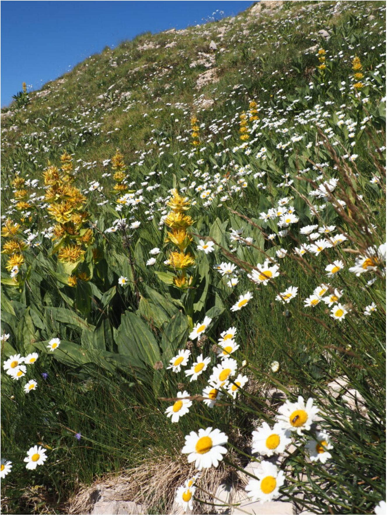
17- Margherite e Genziana lutea n una piccola conca umida sotto alla cima del M.Vettore.