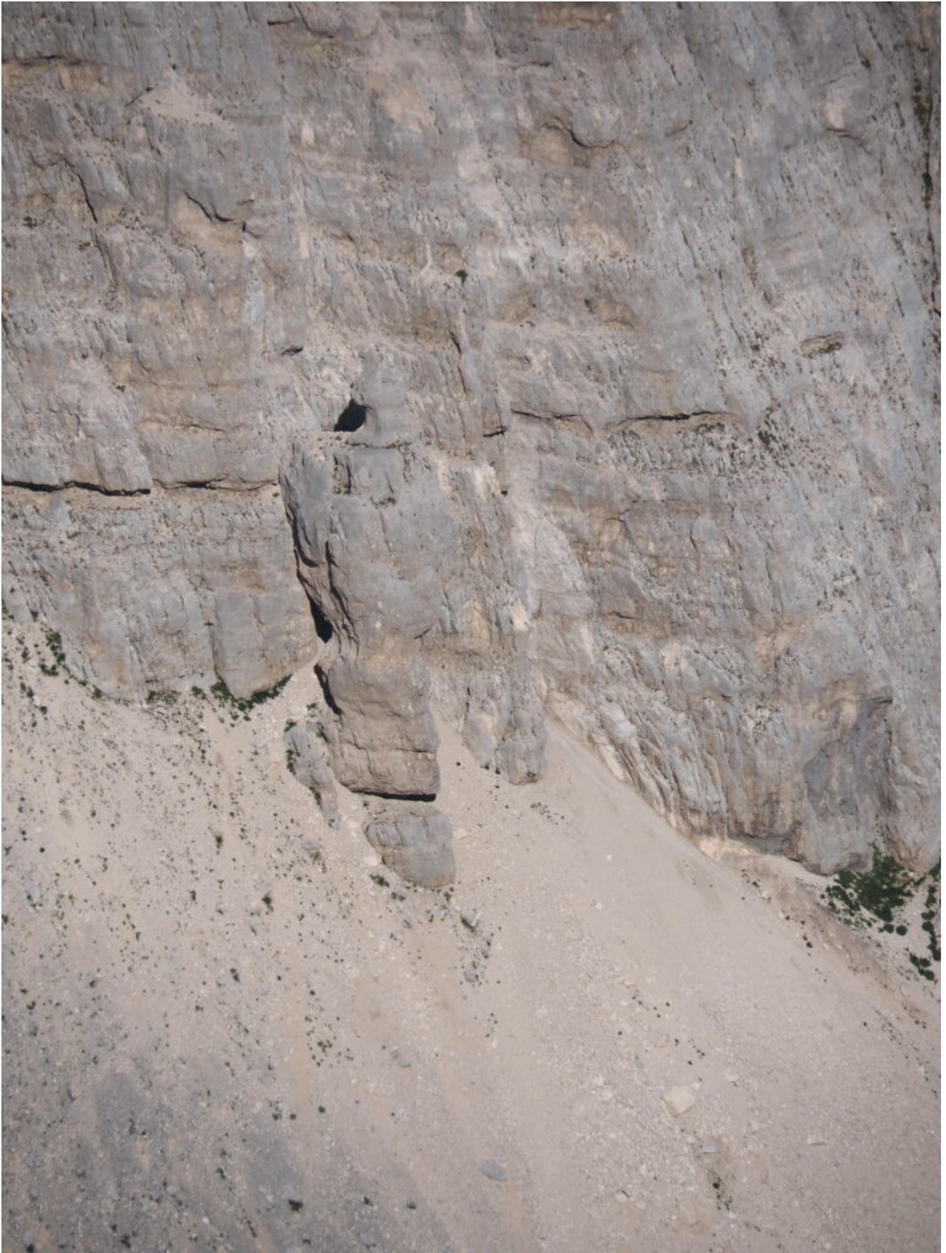
4- Il "Portico", dove è presente l'arco di roccia e l'immagine naturale della "Madonna e il Diavolo".