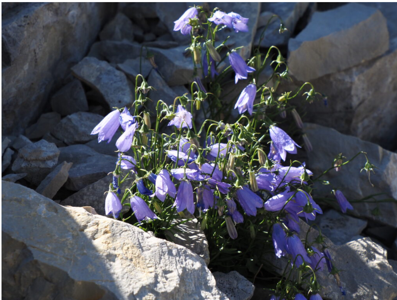
11 – Campanula scheuchzeri

10- Fringuelli alpini in volo con le loro caratteristiche ali bianche e nere.