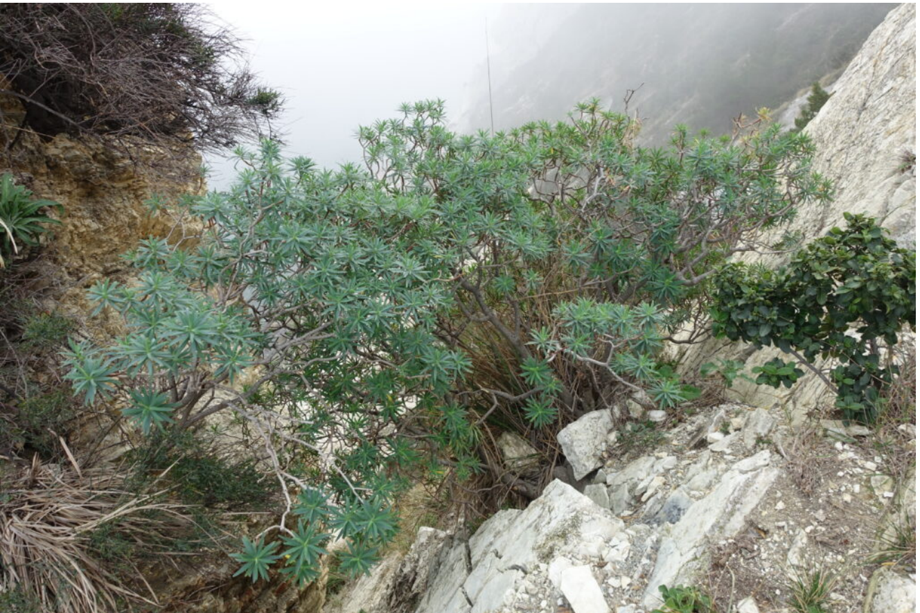
11- Arbusto di Euphorbia characias subsp. wulfenii .