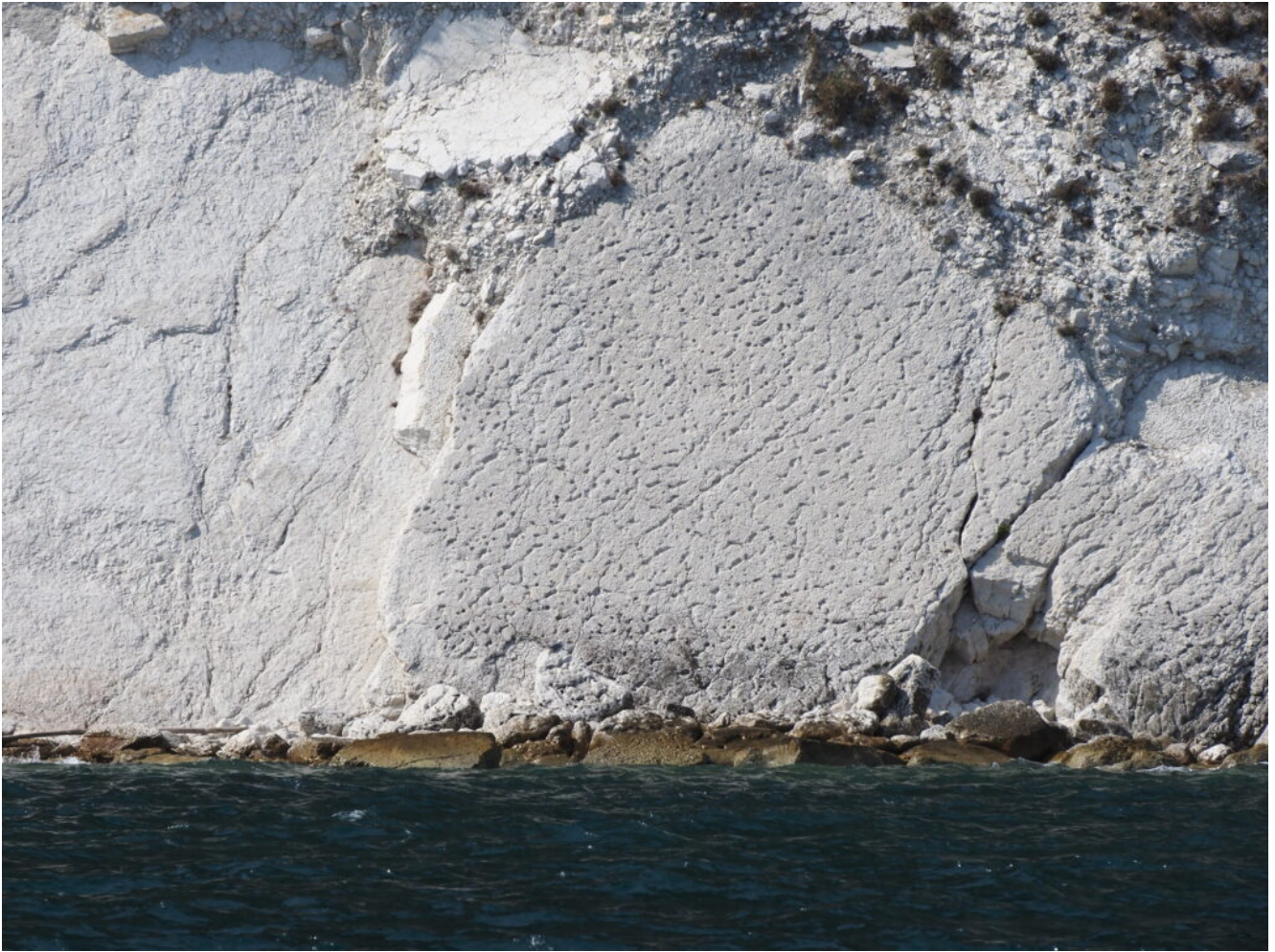
20- Placche di bellissimo Calcarea a picco sul mare.