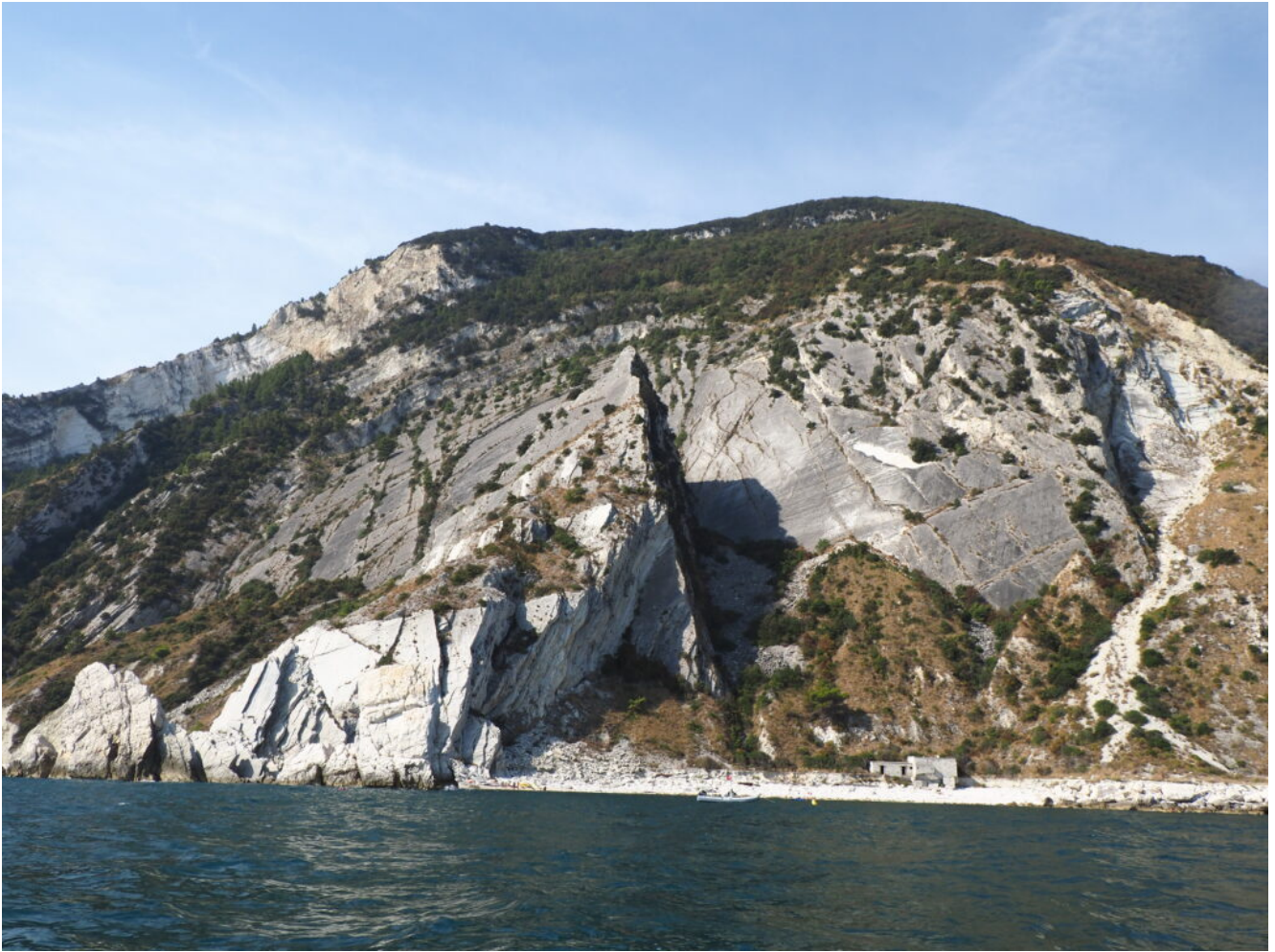
12 – 13 – La Baia delle Due Sorelle, attualmente raggiungibile solo da mare.