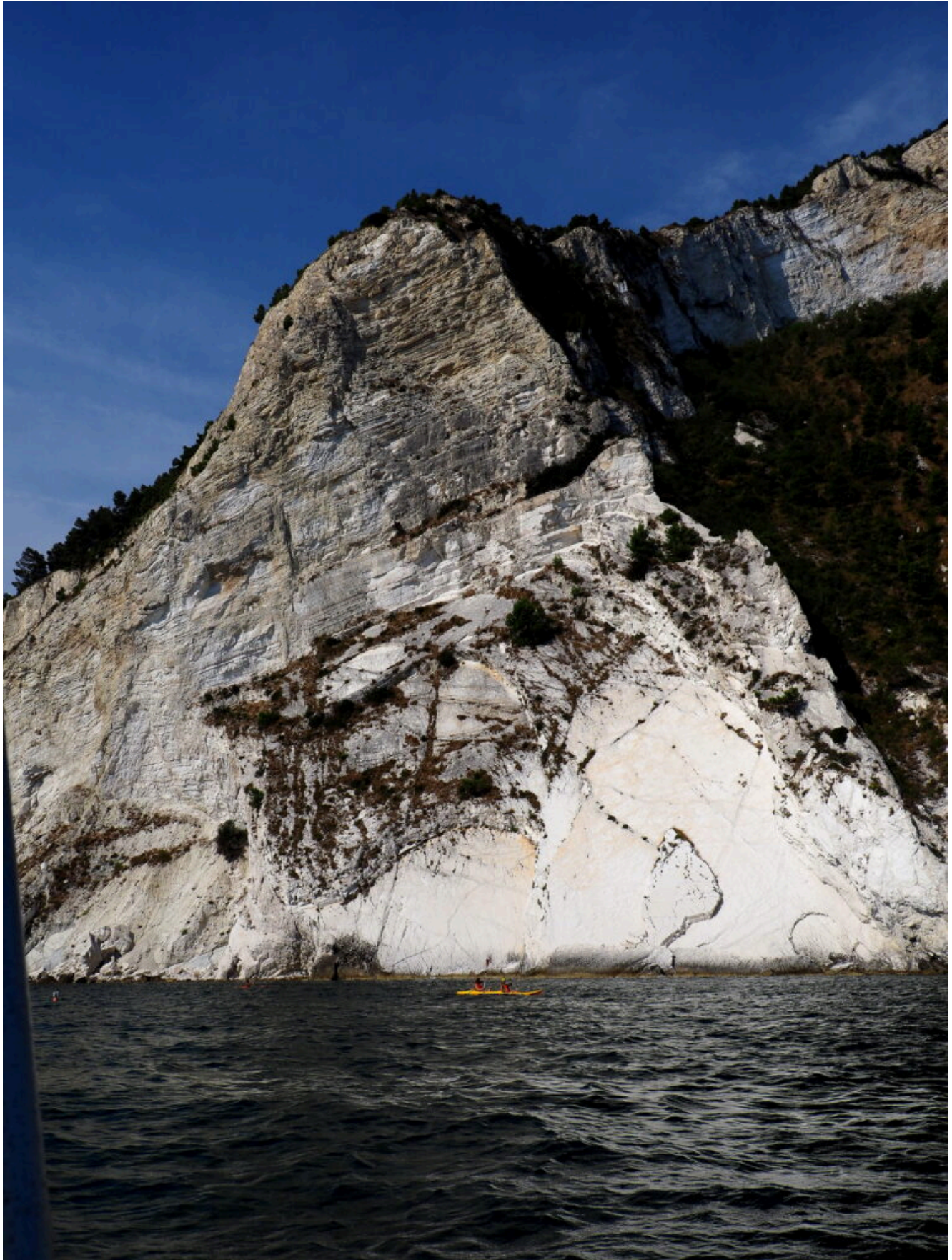
6- Le alte pareti del versante Est del Monte Conero.