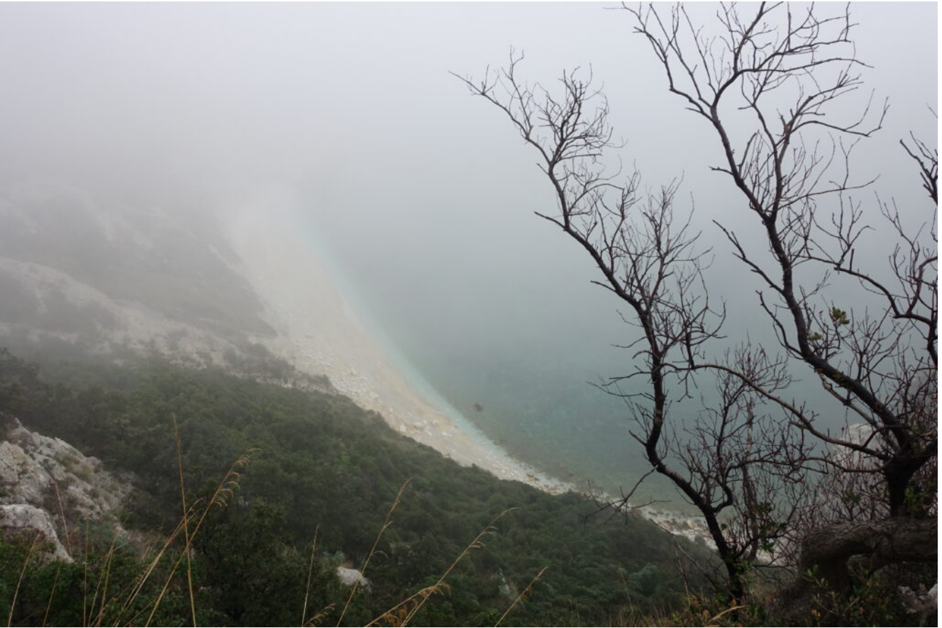
10- La Baia delle Due Sorelle vista dall'alto