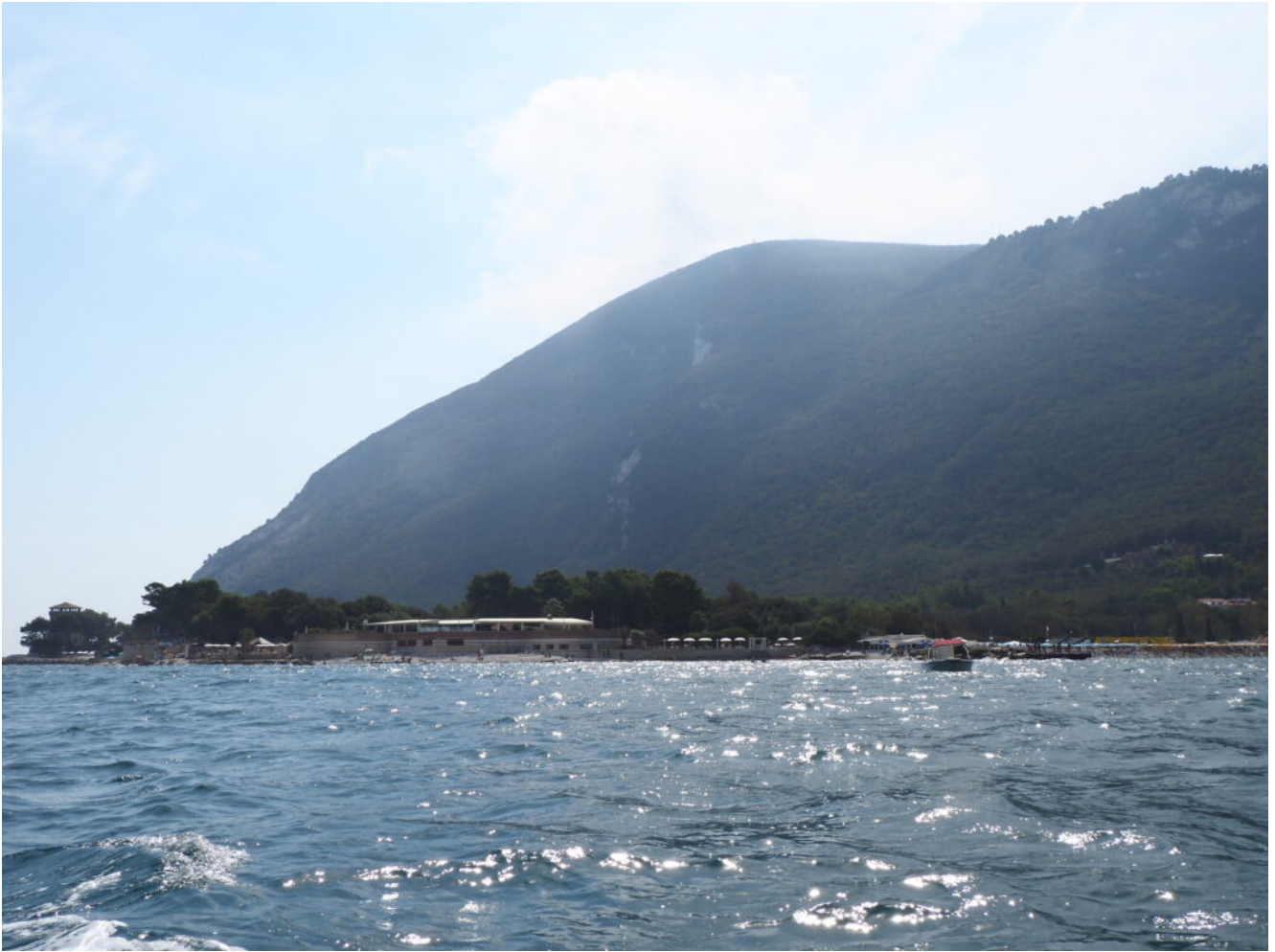
23- Il Fortino Napoleonico di Portonovo.