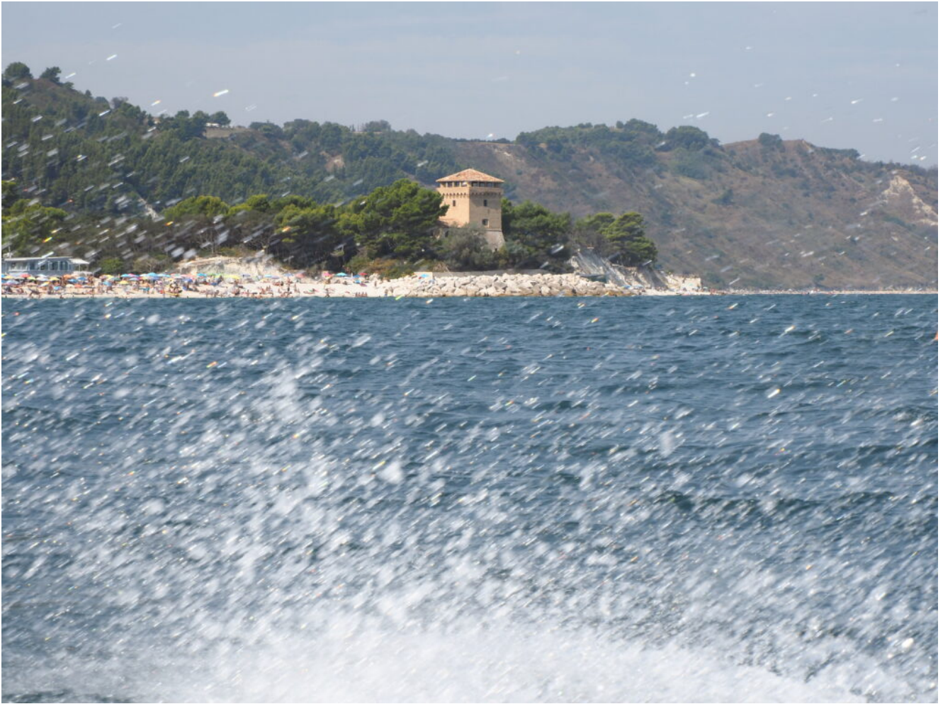
22- La Torre del Bosis.