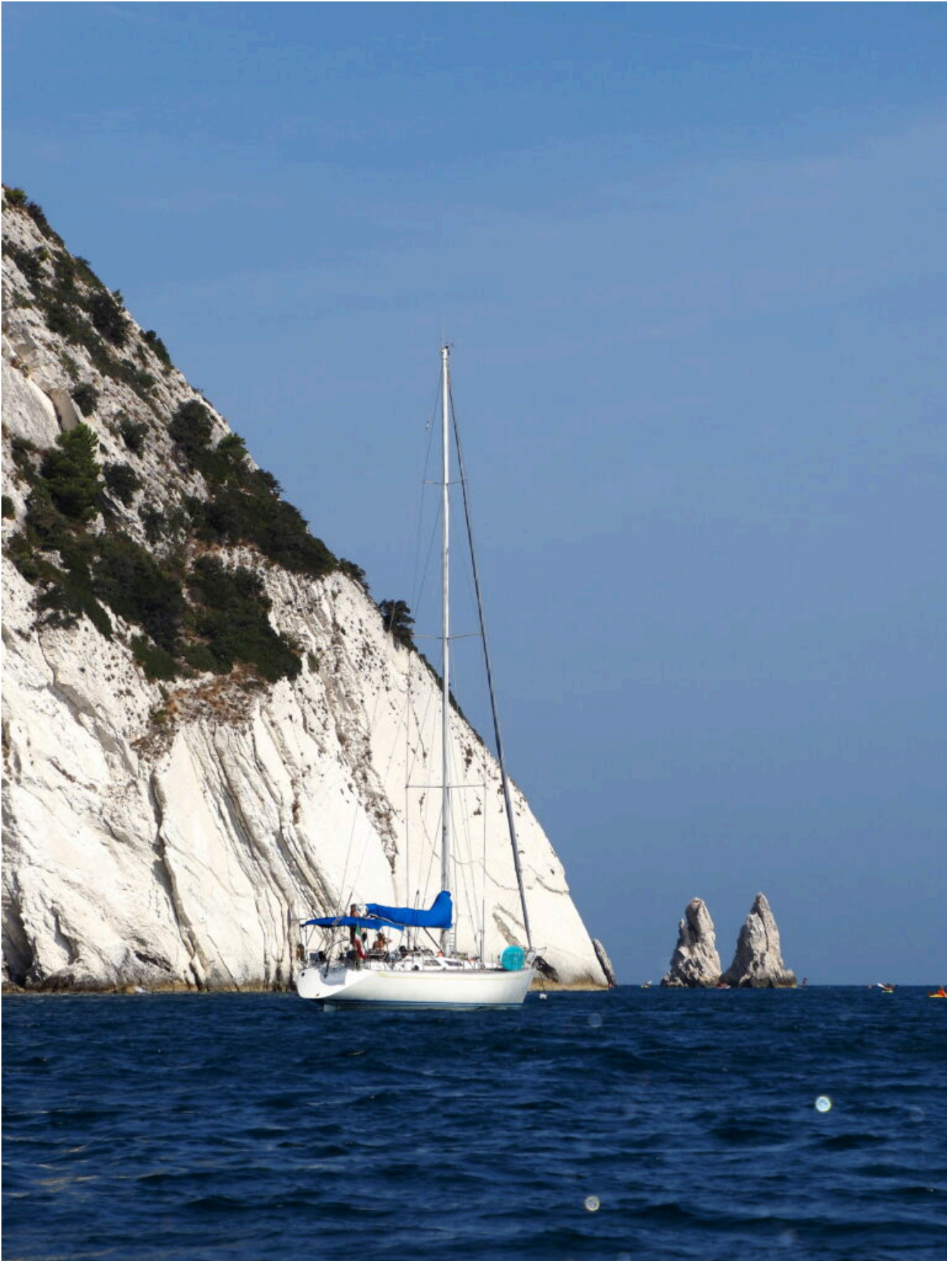
4 – 5 -Gli scogli delle Due Sorelle