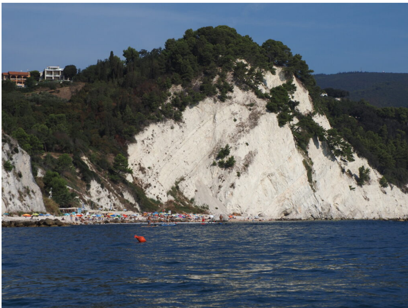
1- La costa del Conero subito dopo Sirolo.

alle escursioni poiché ha fatto registrare numerosi infortuni negli anni passati.