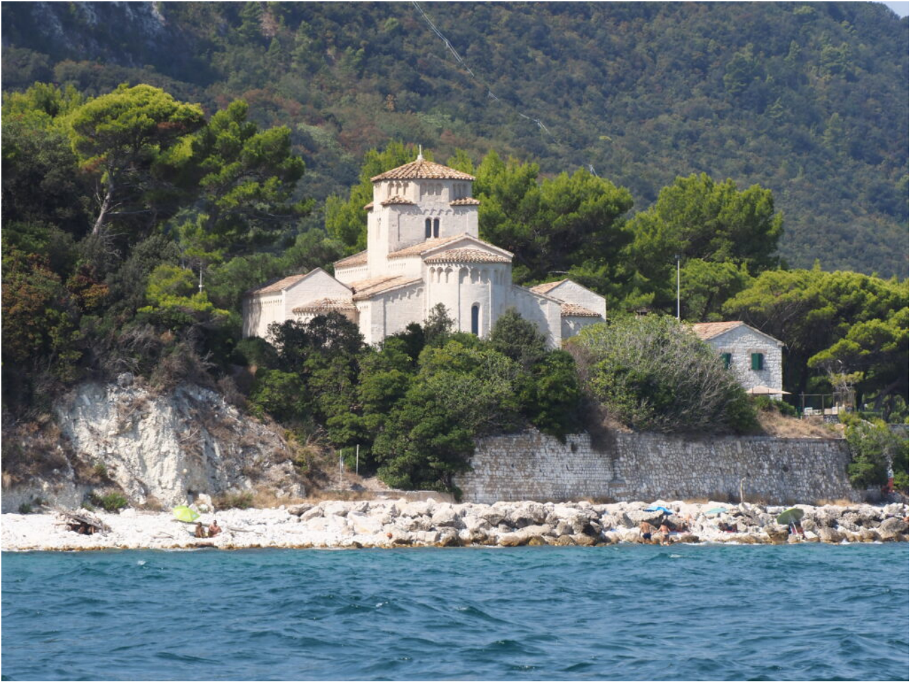
21- La chiesa di Santa Maria in Portonovo.