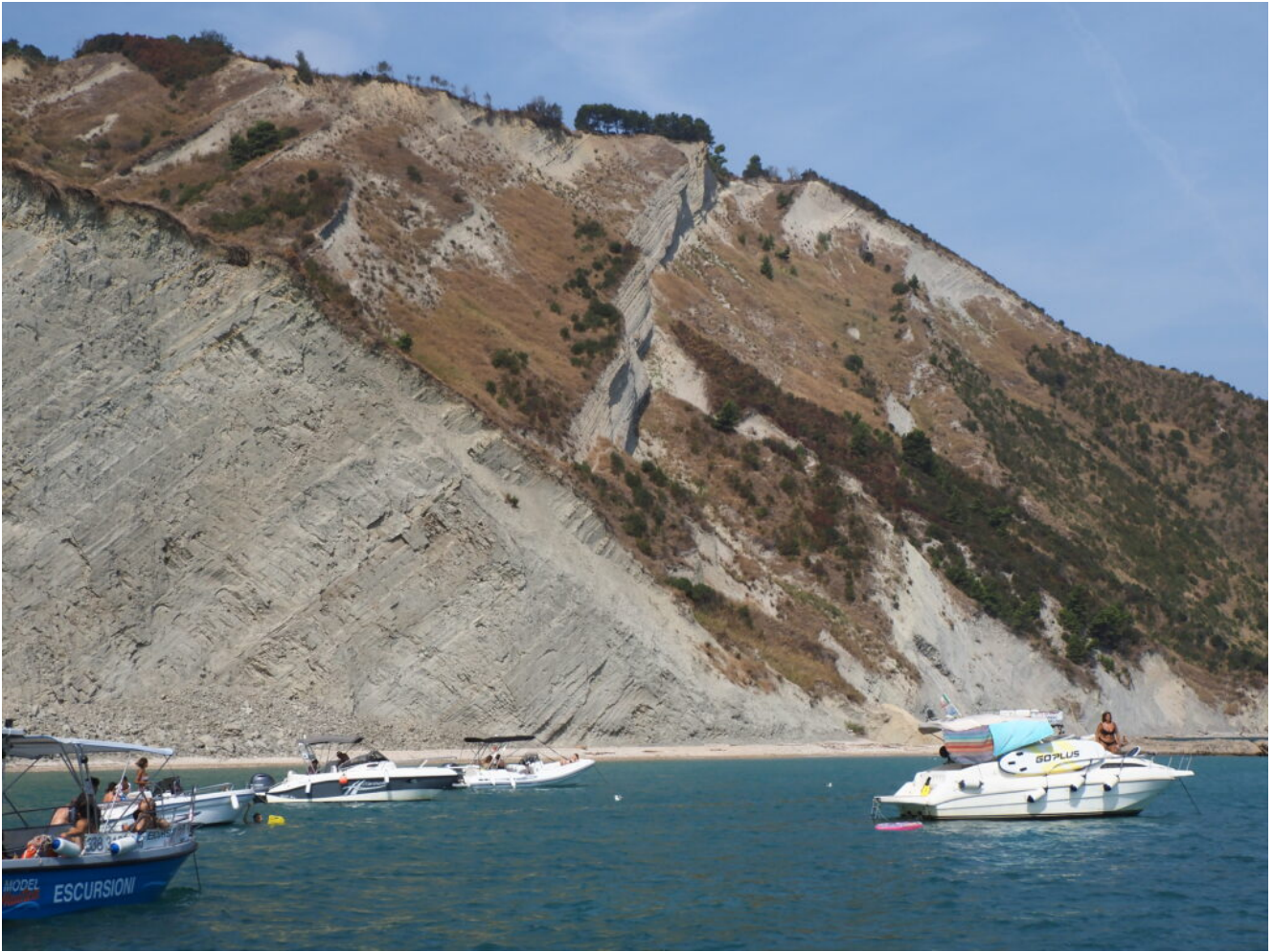
24 – 27- La Falesia della Trave, anch'essa piuttosto pericolosa per le frane come ben visibile nella foto n.27.