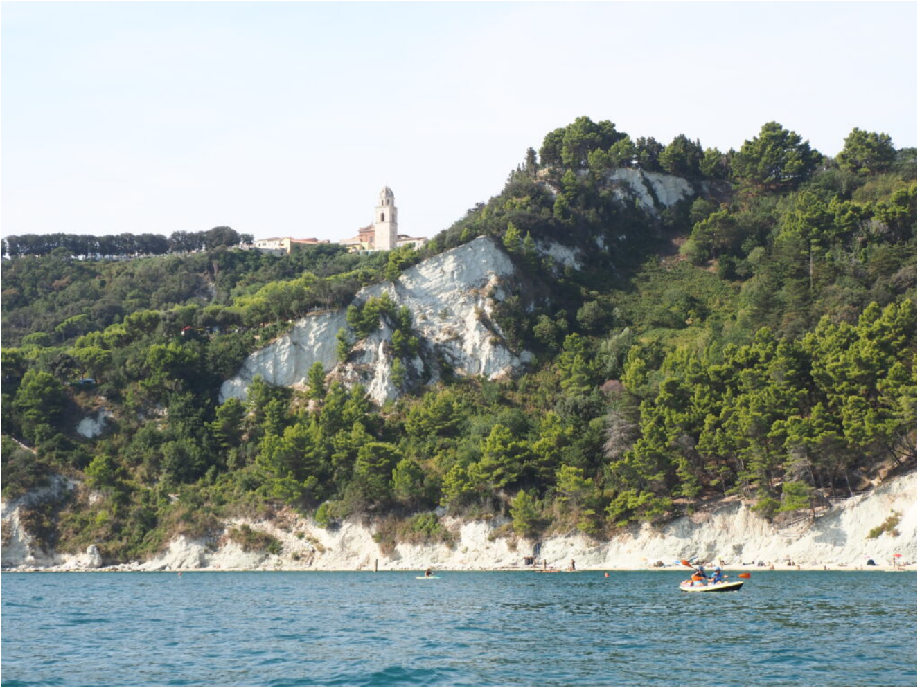
3- La chiesa di Sirolo.