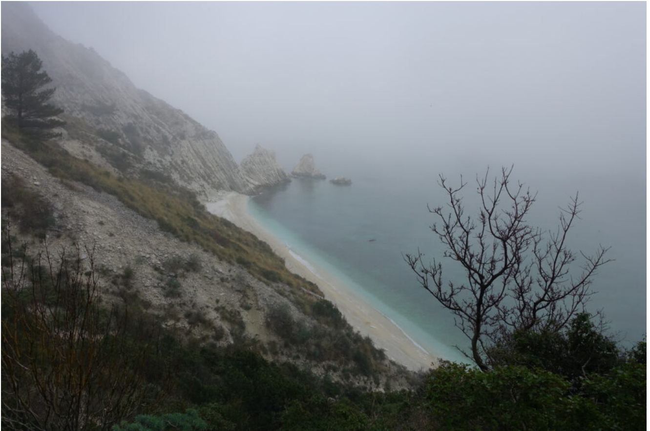
12- Le Due Sorelle