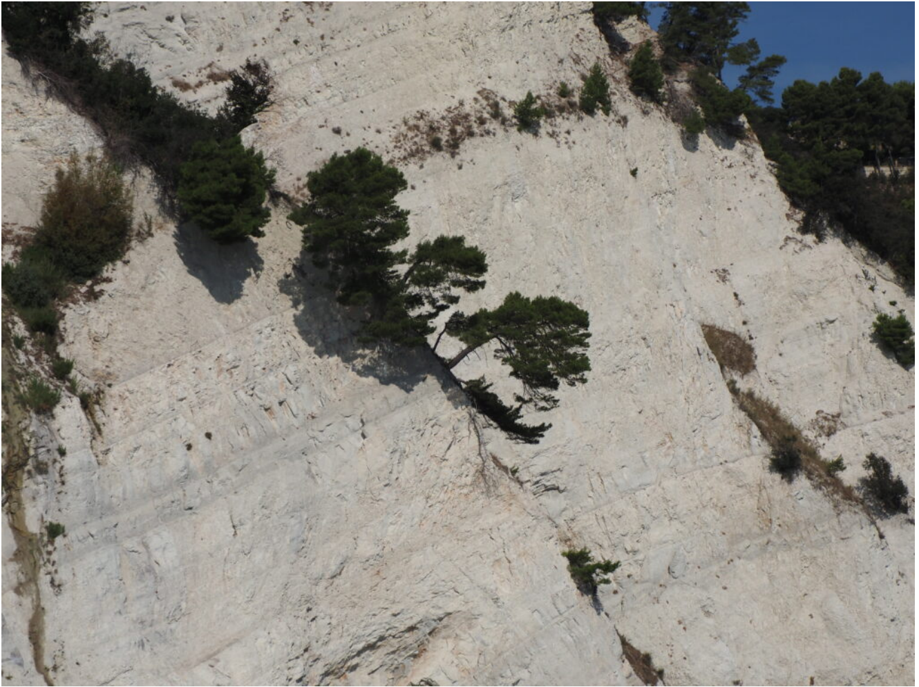
2- Pini di Aleppo monto coraggiosi.