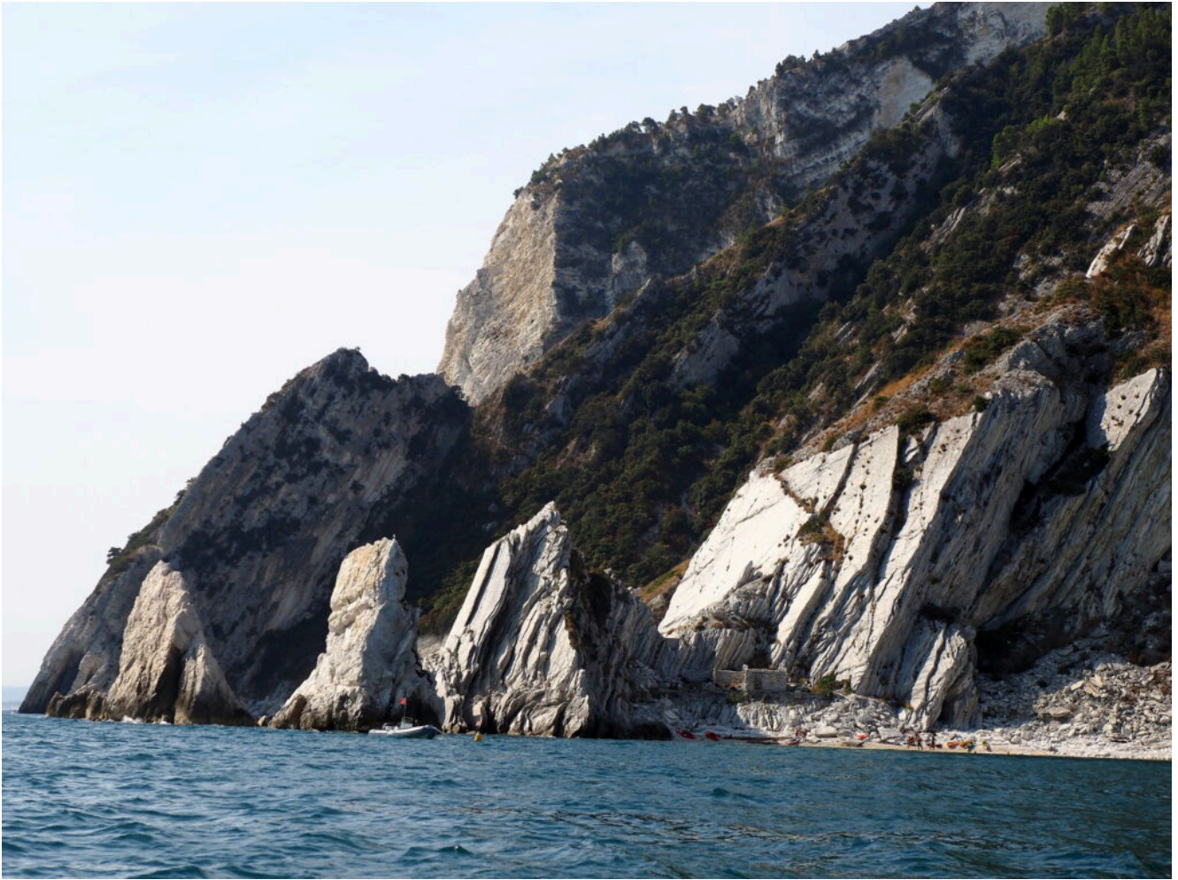
14 – 15 – Le Due Sorelle