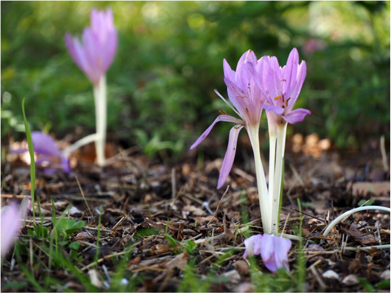
7 – 13 – Fioriture di Colchicum Lusitanum nei pendii intorno ai boschi del San Lorenzo.