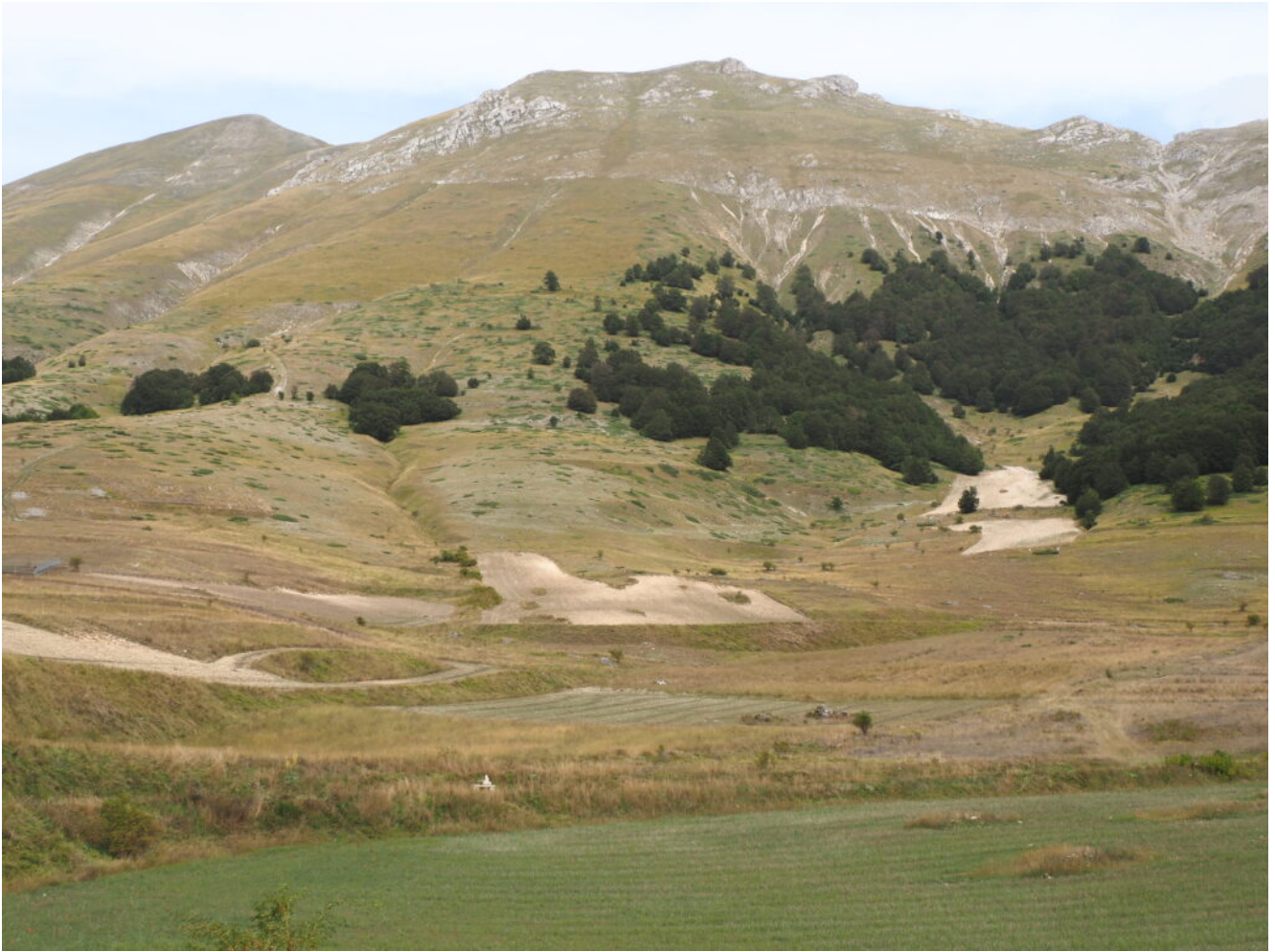
6- I boschi del San Lorenzo sotto alle pendici del Monte Palazzo Borghese e Monte Porche a sinistra, intorno ai quali si sviluppano abbondanti fioriture di Colchico.