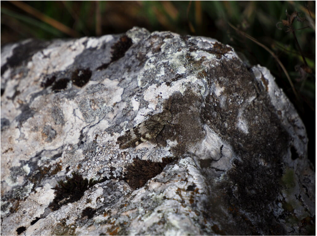
14- Cavalletta dalle ali rosse perfettamente mimetizzata ( Oedipoda germanica ).