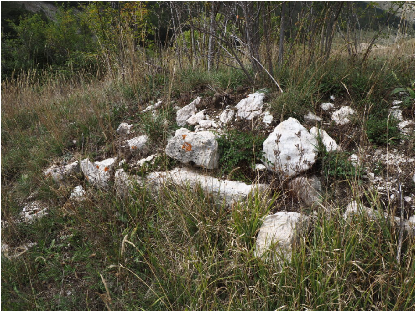
5- I resti delle mura della Romitoria di San Lorenzo