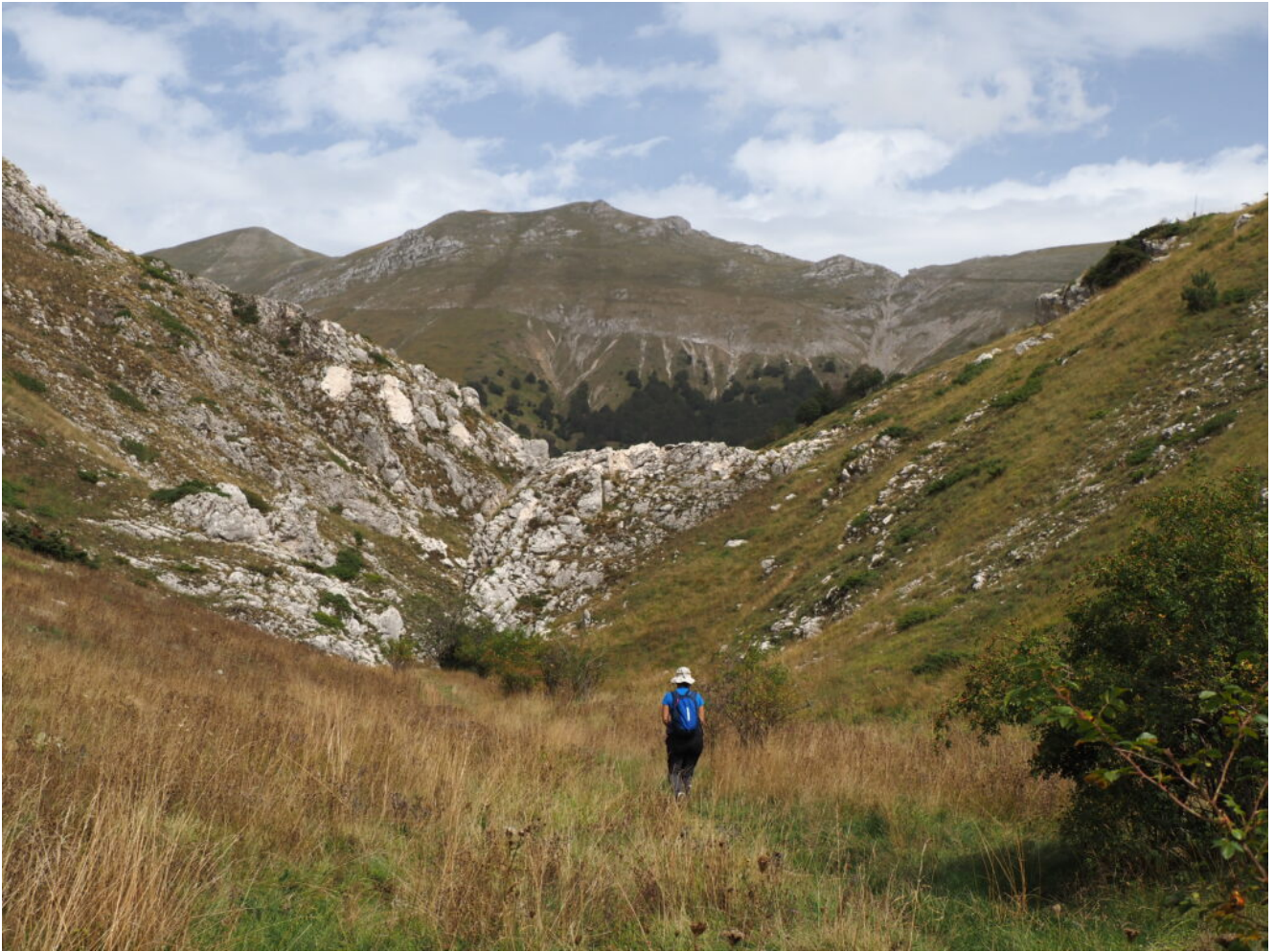
1 – 2 – La Portella del Vao che collega il Pian Perduto alla zona del San Lorenzo, sullo sfondo il Monte Palazzo Borghese e il Monte Porche a sinistra.