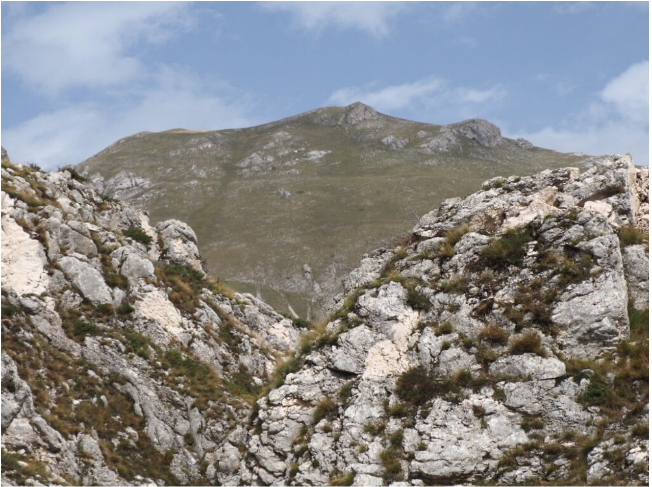
3- Il Monte Palazzo Borghese si staglia sopra la Portella del Vao.