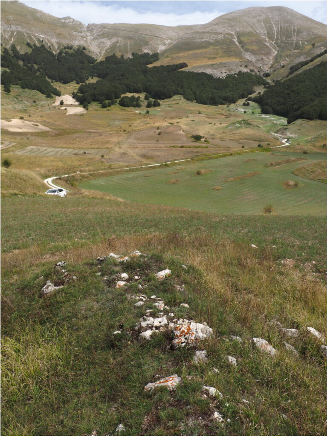
4- Dalla Portella del Vao si accede alla Romitoria di San Lorenzo i cui resti dominano su una collinetta la zona omonima, a destra il Monte Argentella.