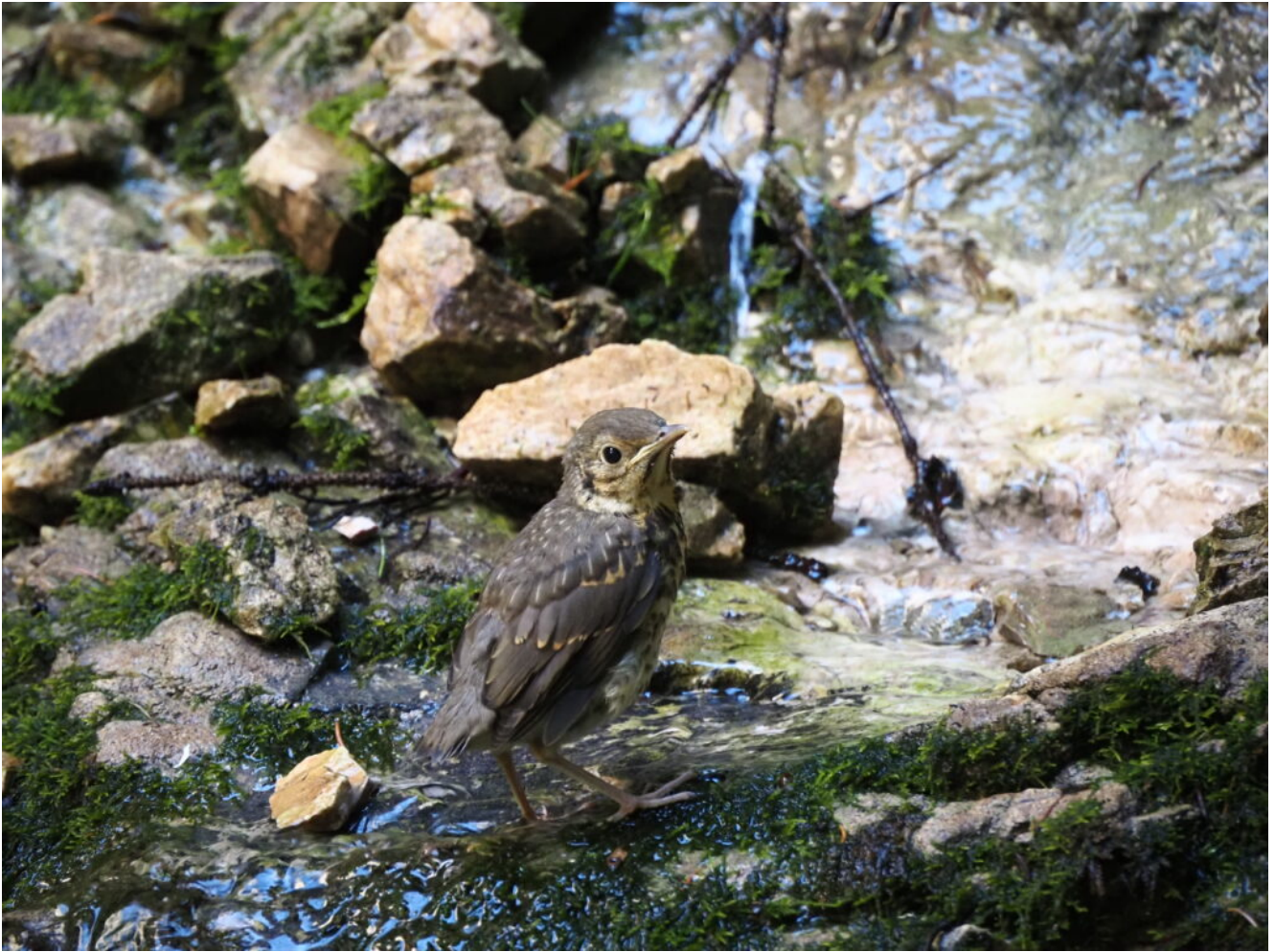
14- Pulcino di Merlo acquaiolo.