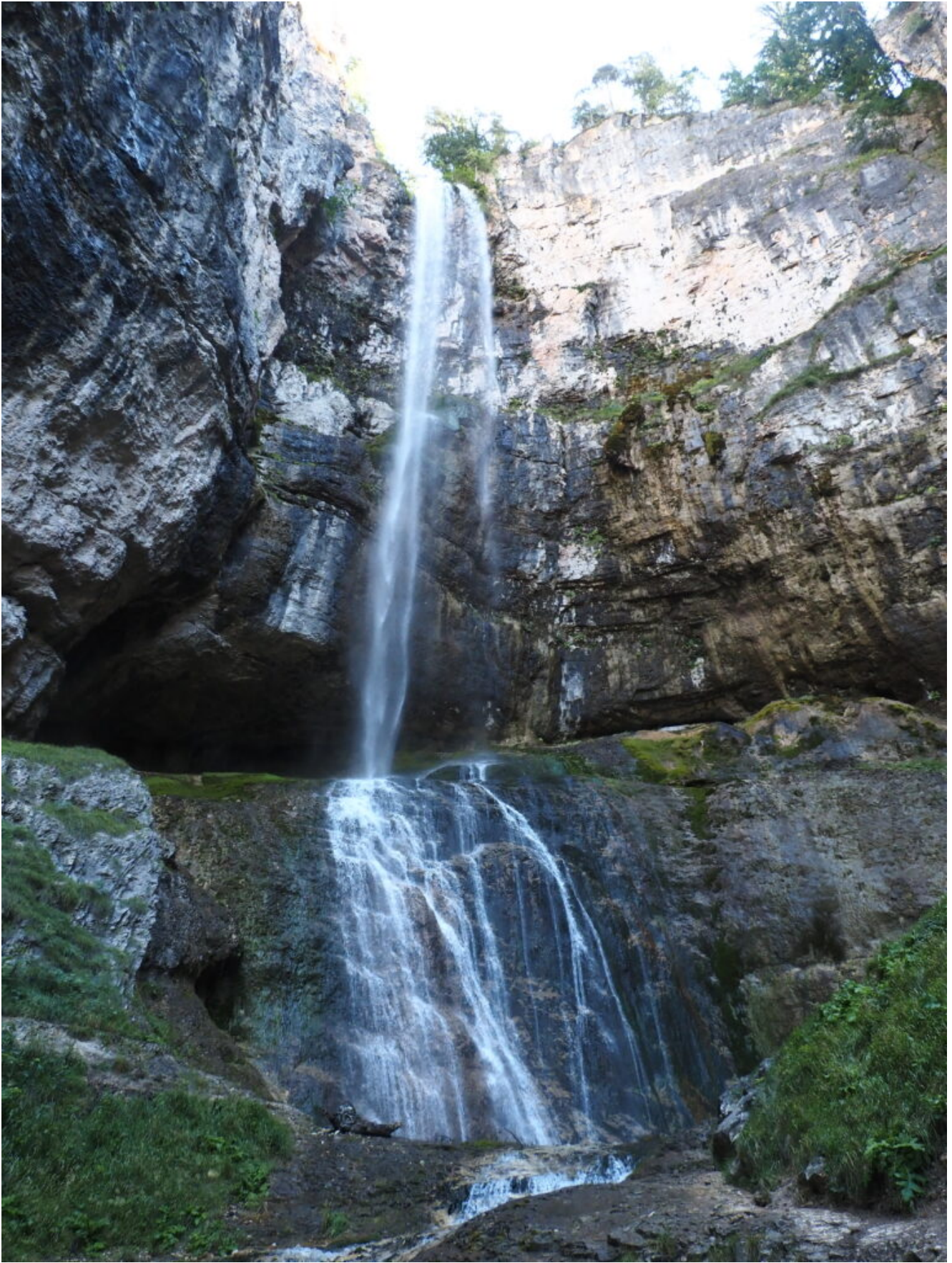
1 – 11- La cascata di Tret vista dalla base e dall'interno della grotta.