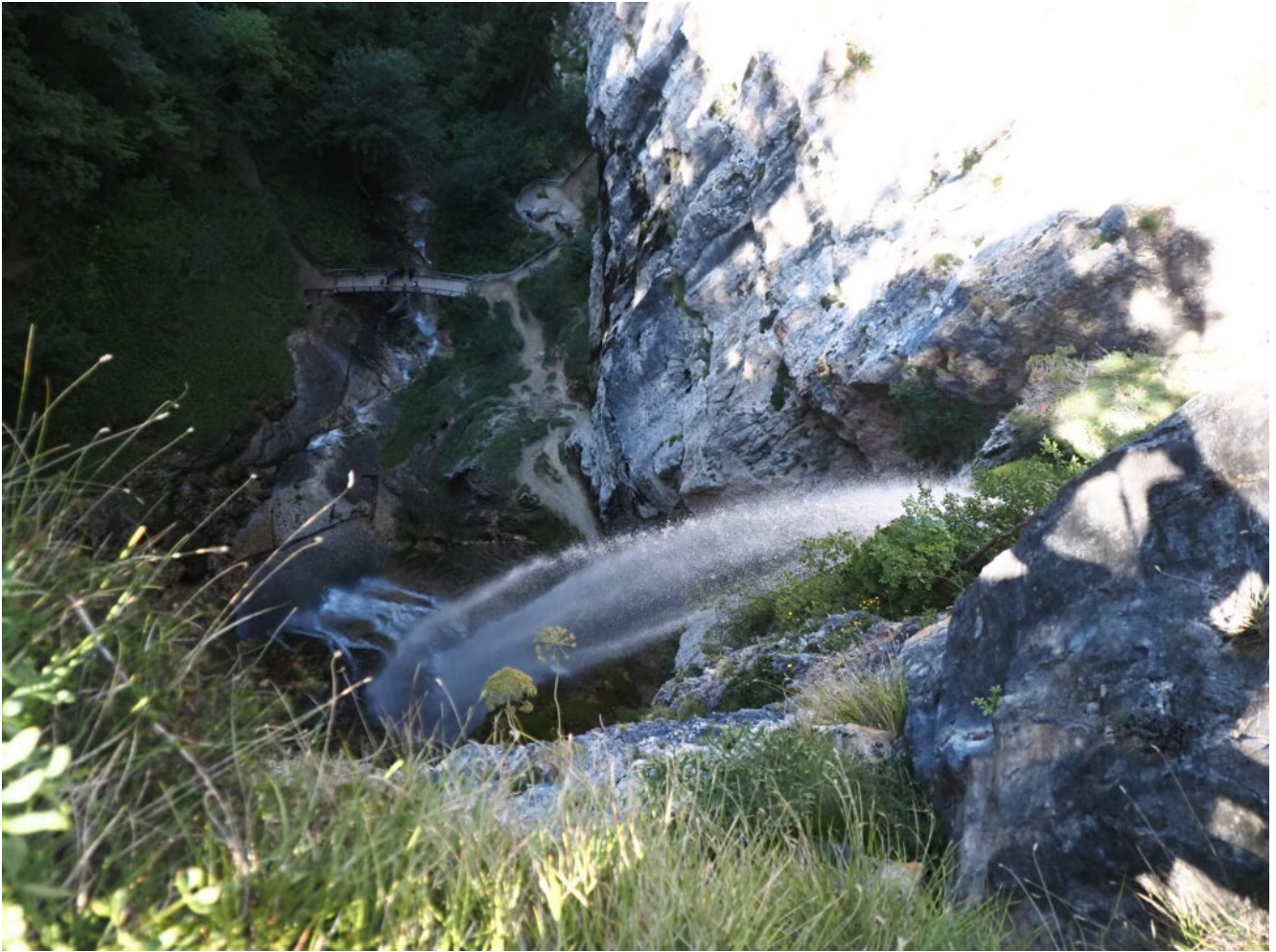
13- La cascata vista dal belvedere superiore.