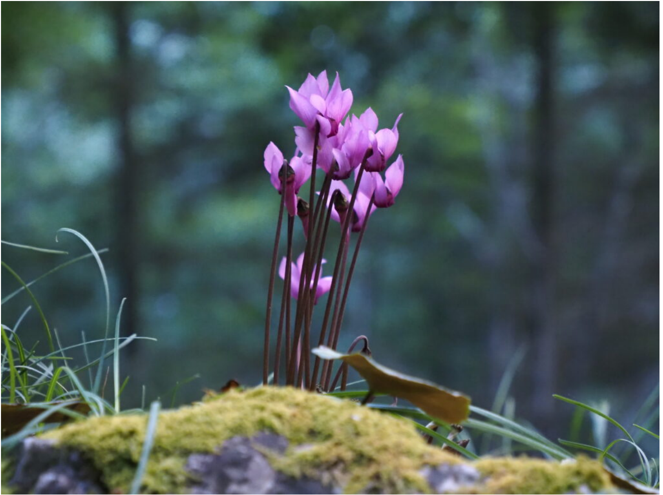
12- Ciclamino autunnale ( Cyclamen hederifolium ).