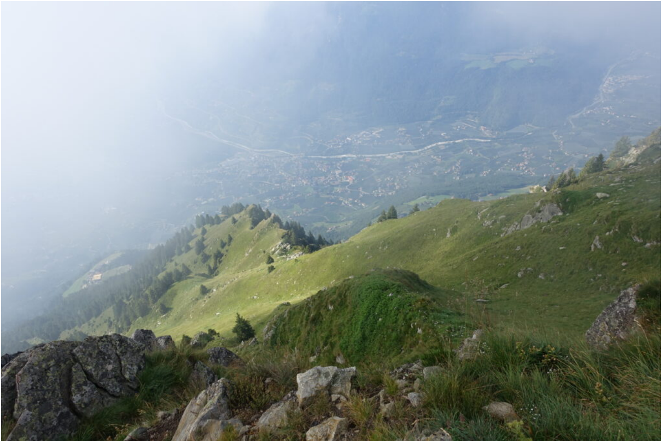
13- Merano visto dalla cresta sommitale di Cima Muta.