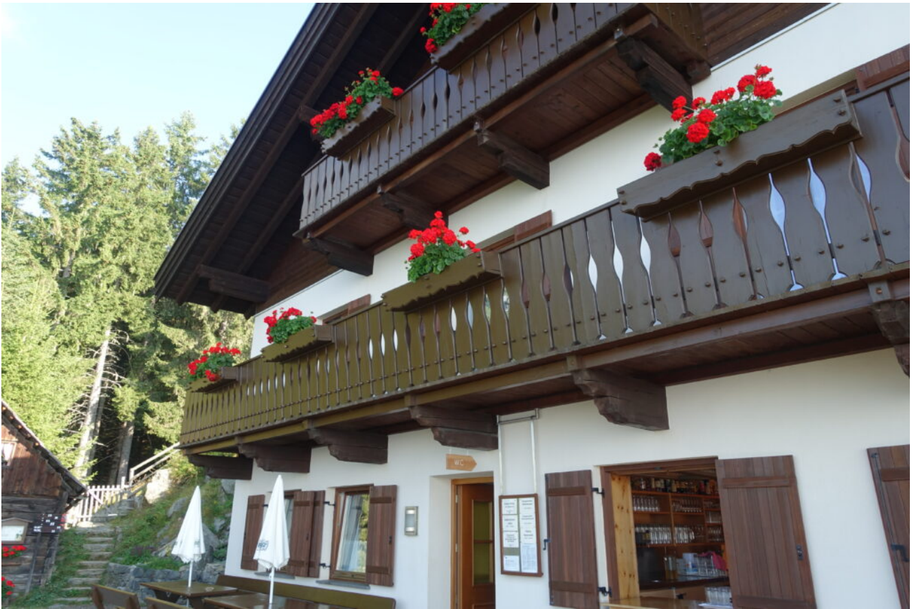
7- L'accogliente Maso Mutkopf.