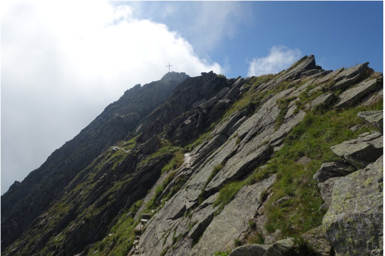
21- La Cima Muta vista dalla cresta del Gioigo di Quaira.