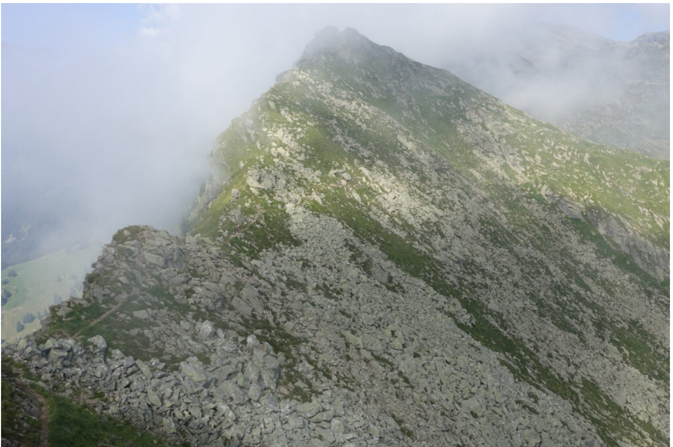
27- Dal Gioigo di Quaira scende il sentiero che conduce ai Laghi di Sopranes.