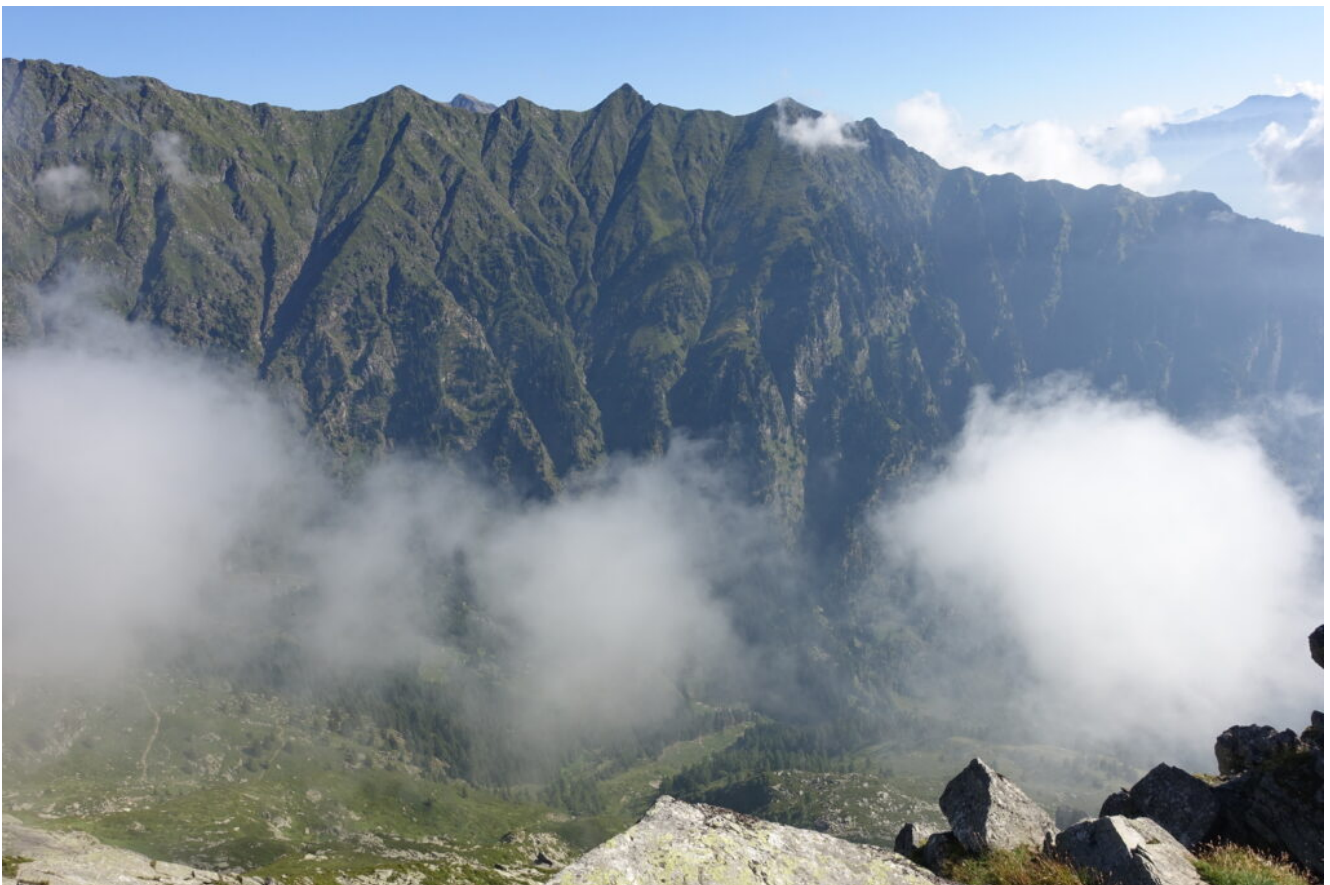
18- Veduta verso la lunghissima cresta dello Spitzhorn.