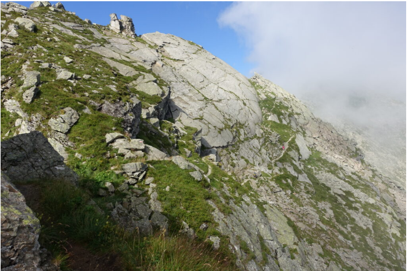
25- La grande placca del Giogo di Quaira.