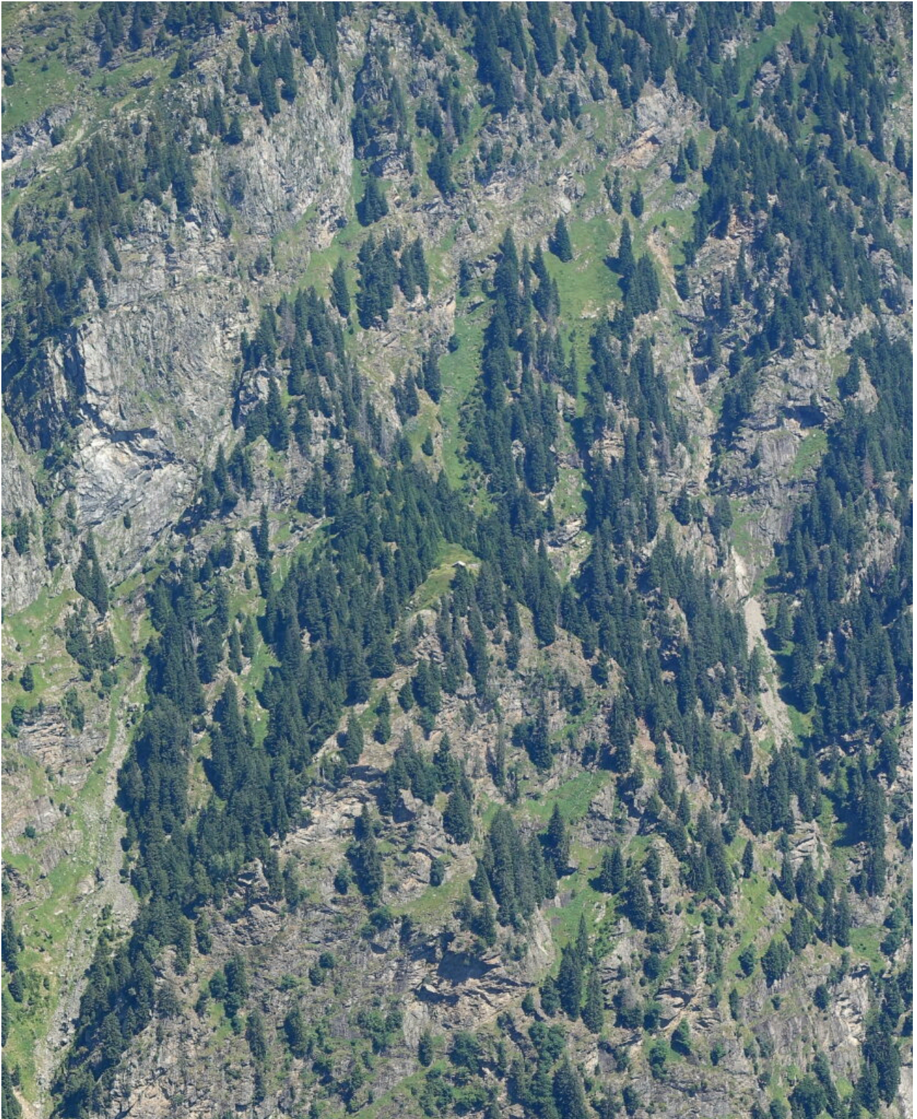
40- Le ripidissime pendici del Monte Pfitshkopf situato nella vallata a Nord della Cima Muta, se guardate esattamente al centro dell'immagine si nota il piccolo Maso della foto n.41.