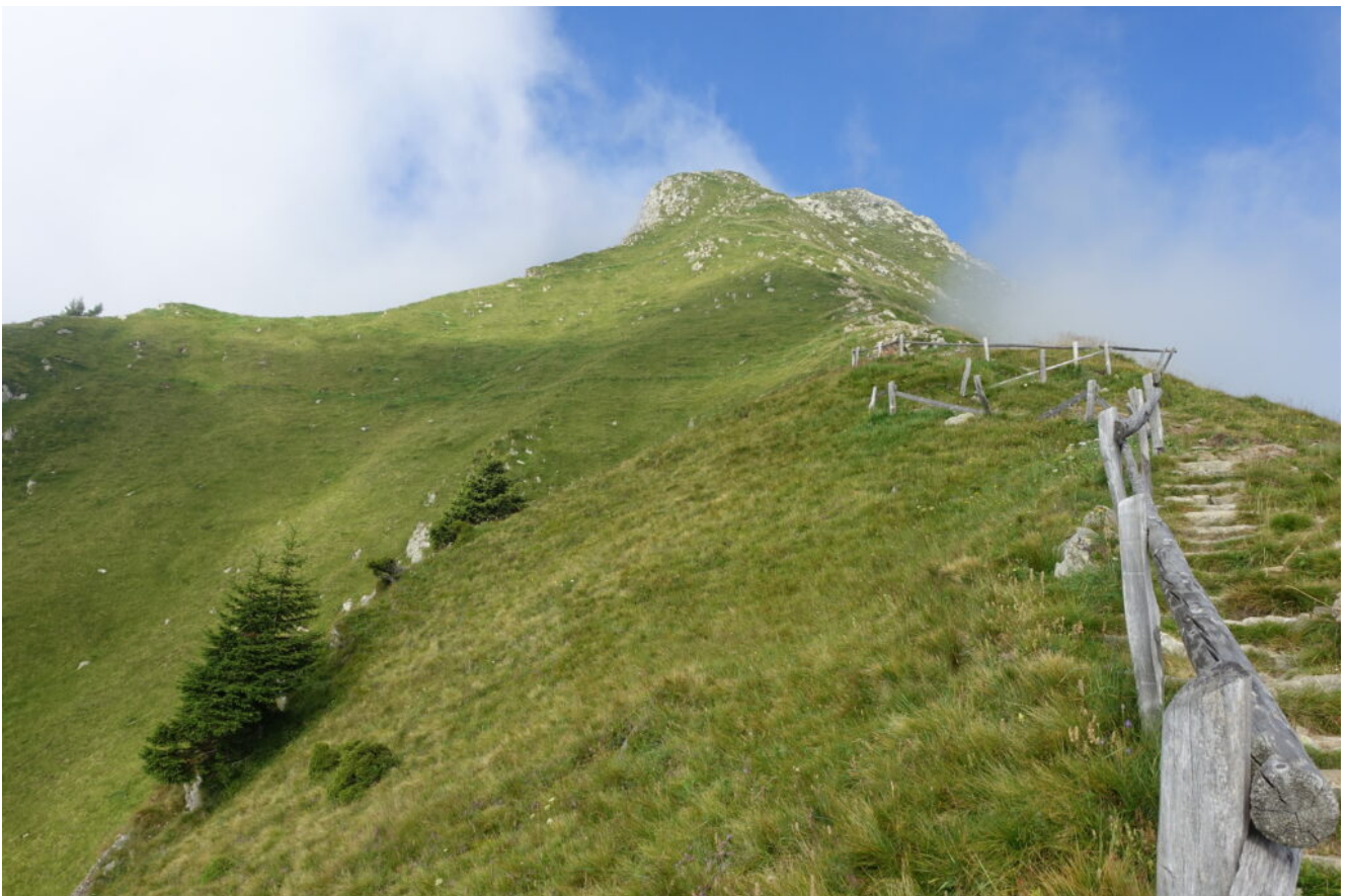
10 – 12- La lunga salita per Cima Muta.