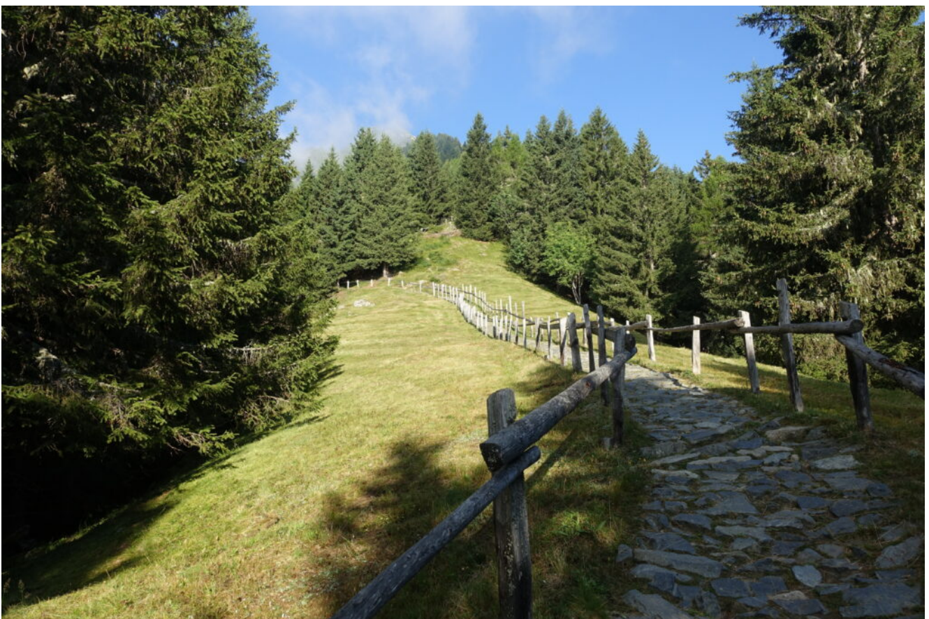
8- Il sentiero attrezzato che dal Maso Mutkopf sale verso Cima Muta.