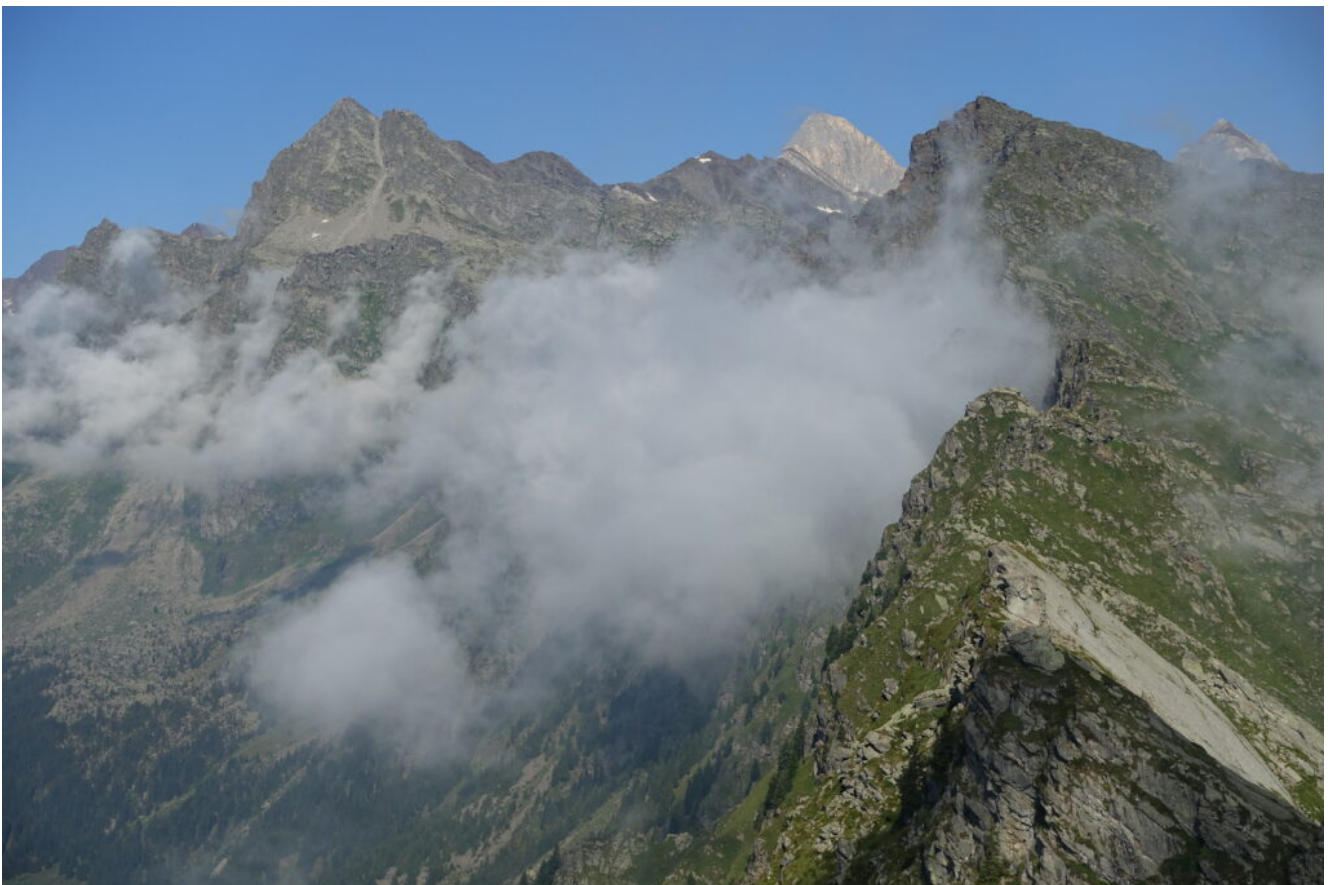
20- Monte Gigot a sinistra e la Cima Rosa di Sopranes che emerge a destra.