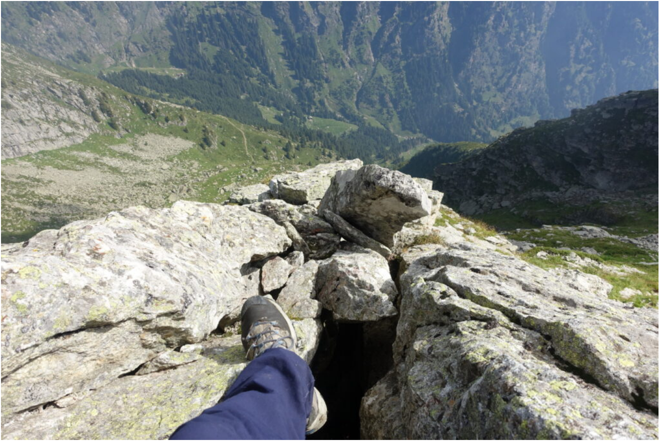
28- Veduta verticale sulla Valle di Sopranes sottostante