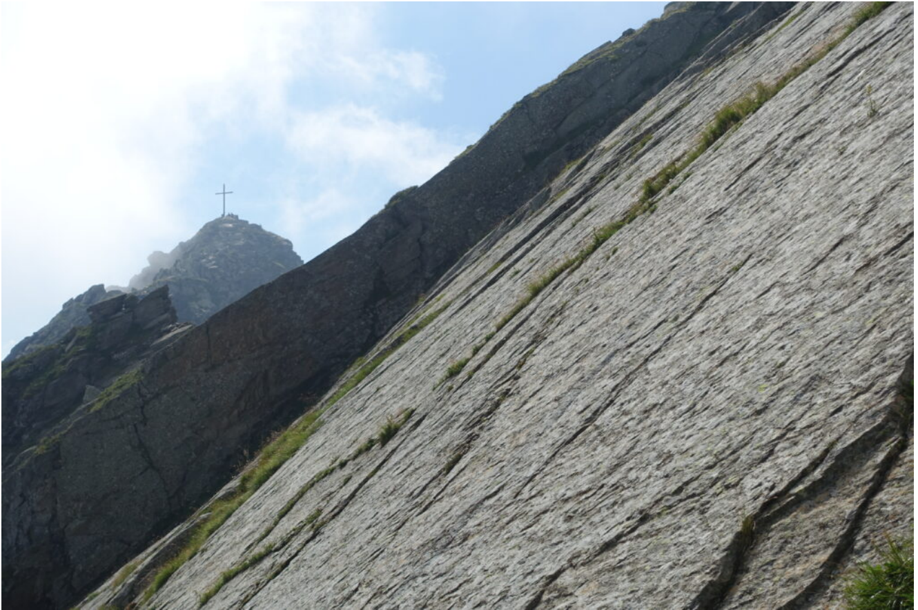
26- La Cima Muta dalla placca del Gioigo di Quaira.