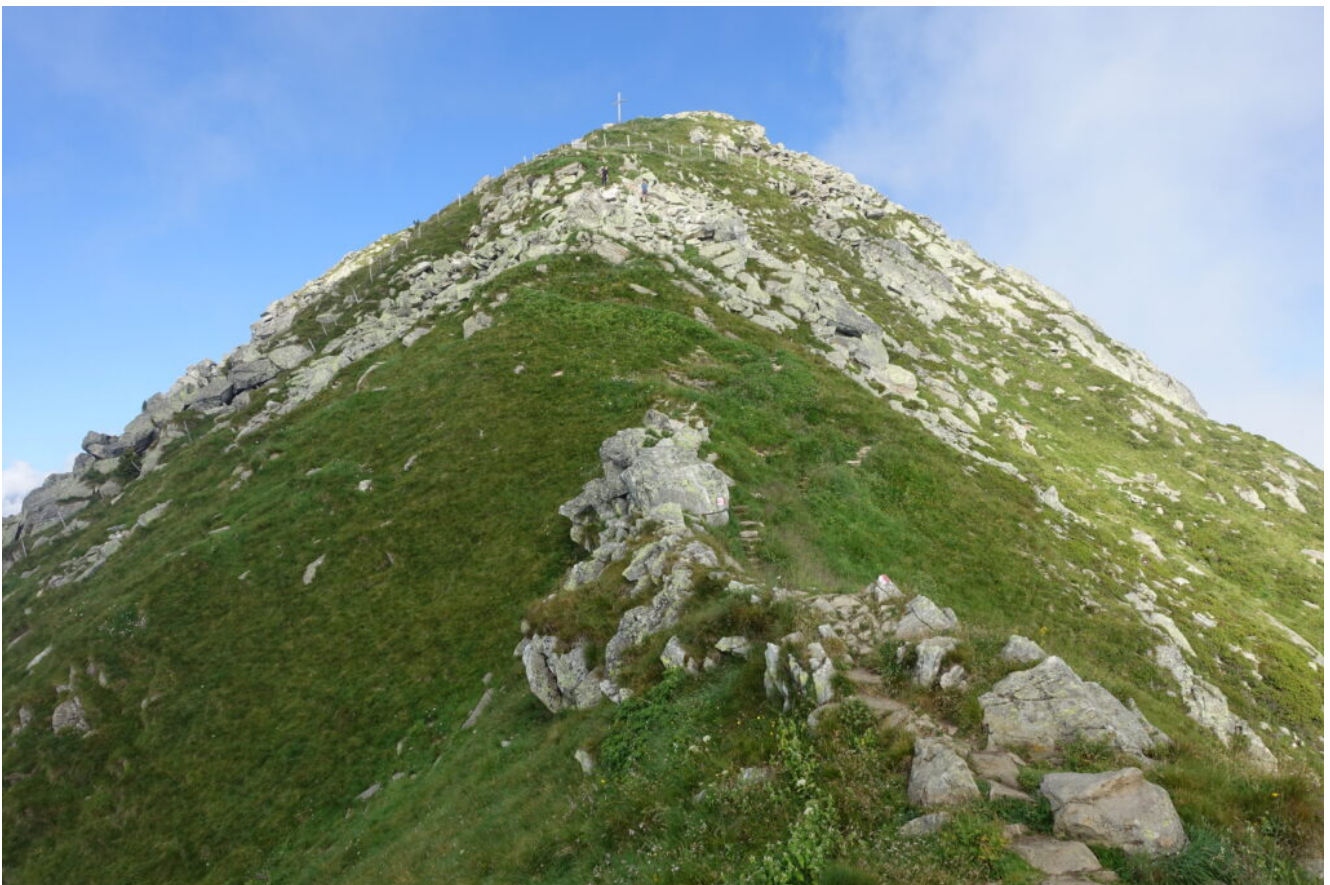
14- Cima Muta, 2291 metri.