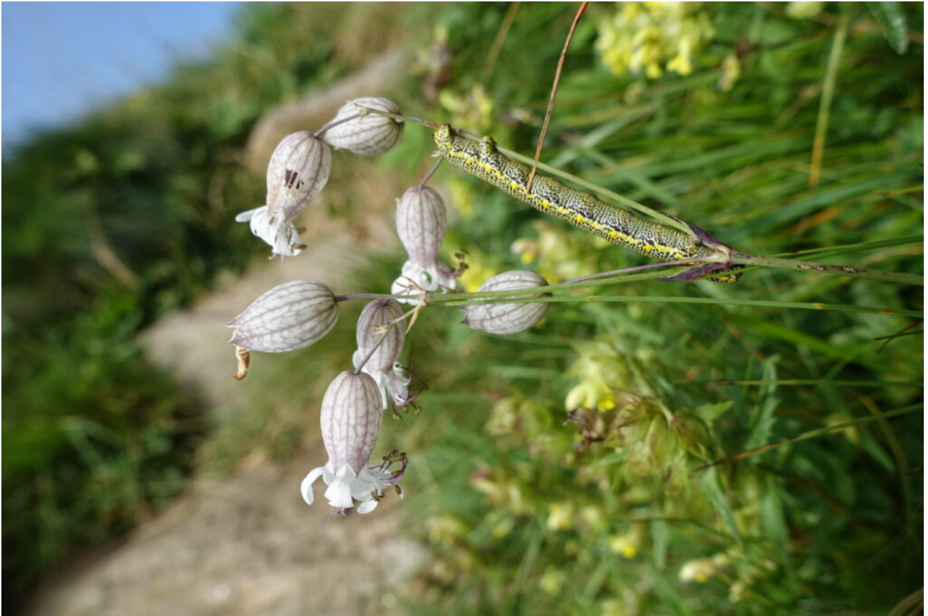
17- Bruco variopinto su Silene vulgaris .