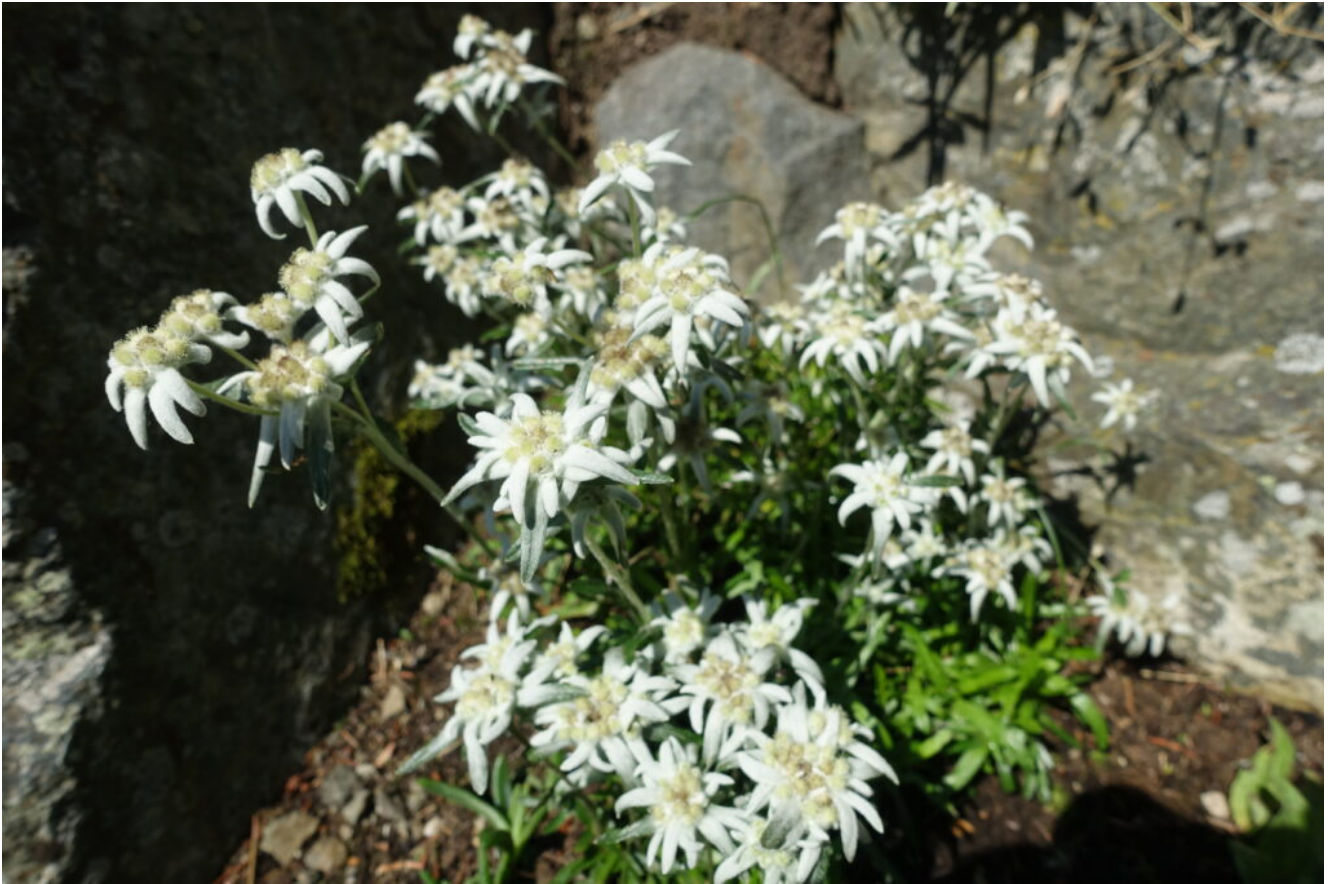
42- Una bellissima pianta in piena fioritura di Stella Alpina ( Leontopodium alpinum ).