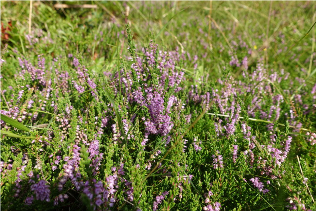
9- Erica carnea già in fiore.