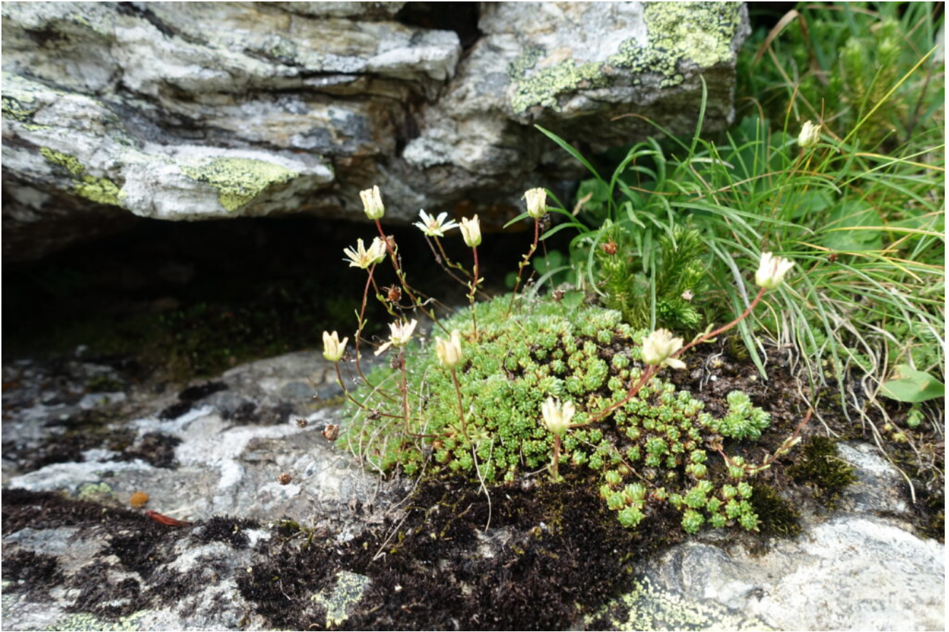
24- Saxifraga bryoides