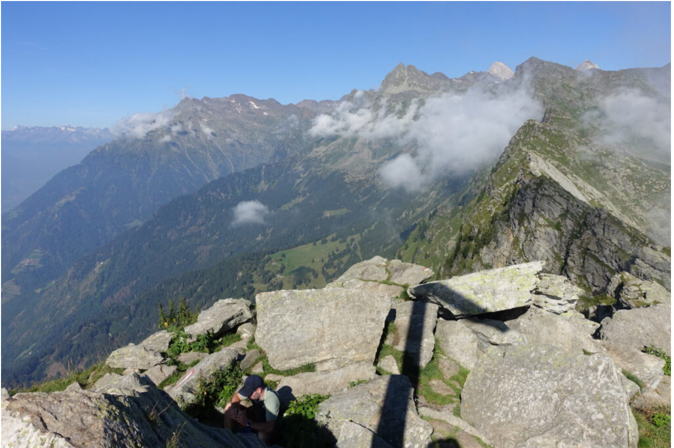
19- Veduta verso la Cima Rosa di Sopranes.