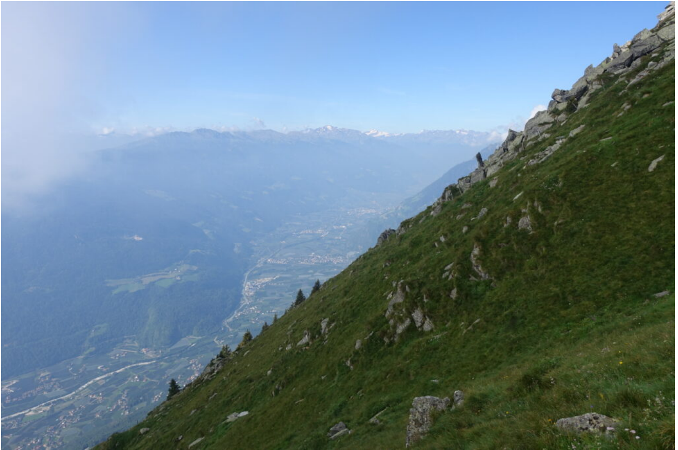
15- Veduta verso Ovest con le montagne del gruppo dell'Ortles.