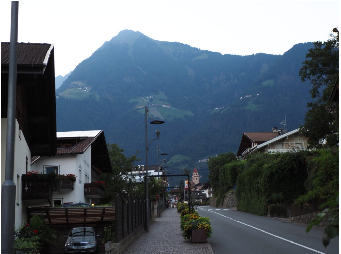
1 – La Cima Muta domina l'abitato di Tirolo.