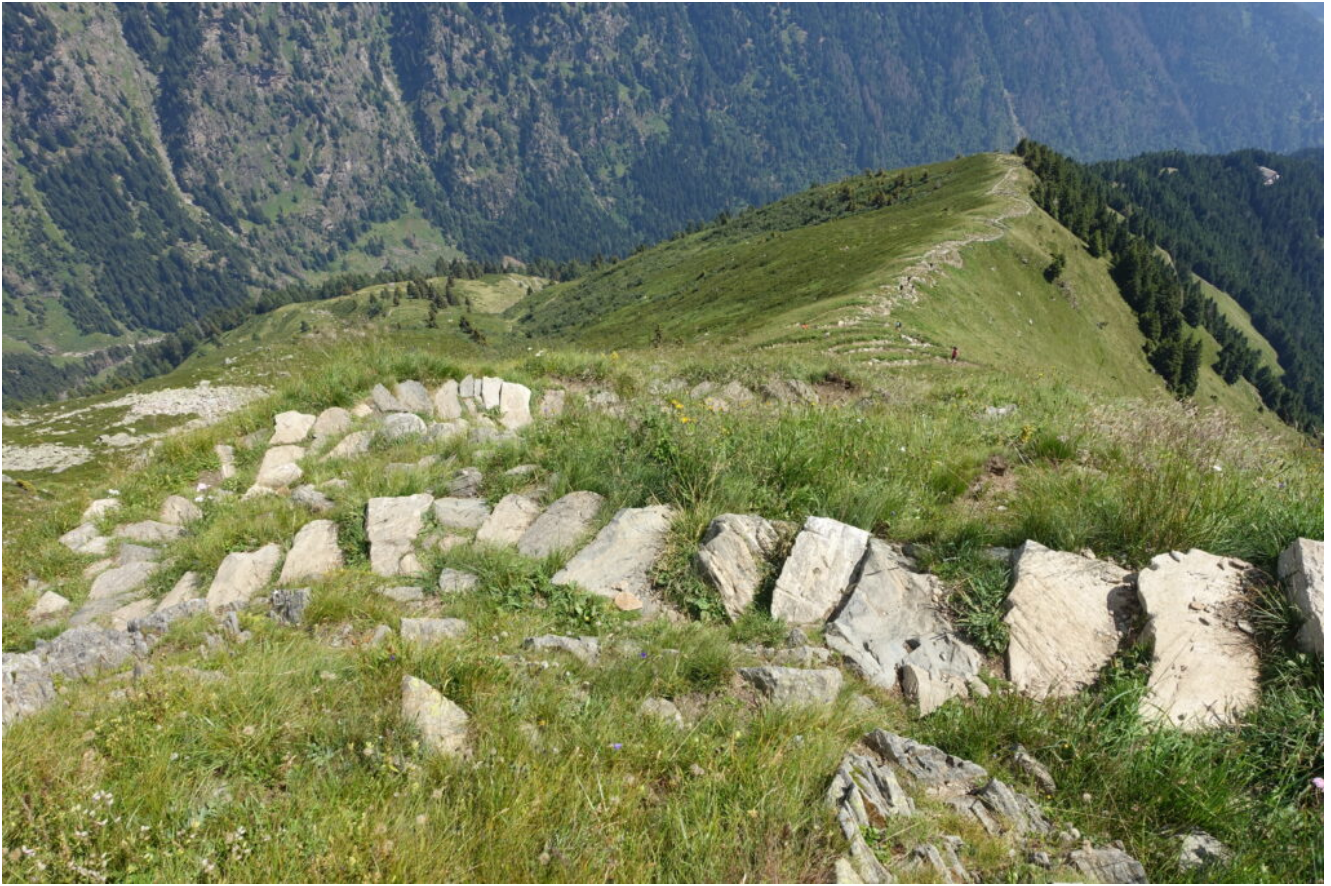
39- I numerosi tornanti scalettati saliti al mattino.