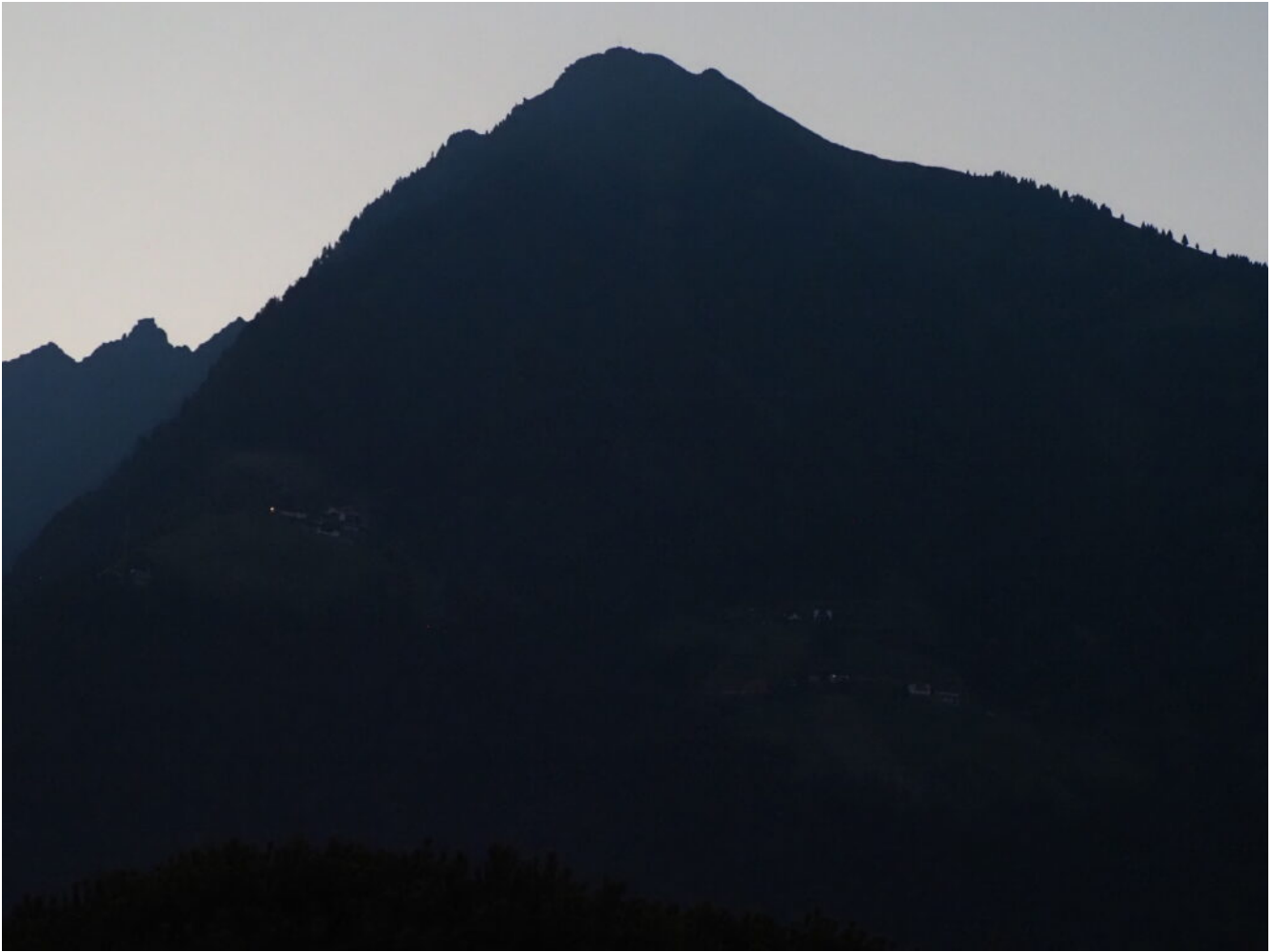
2- Al tramonto si notano le luci dei Masi della Muta.