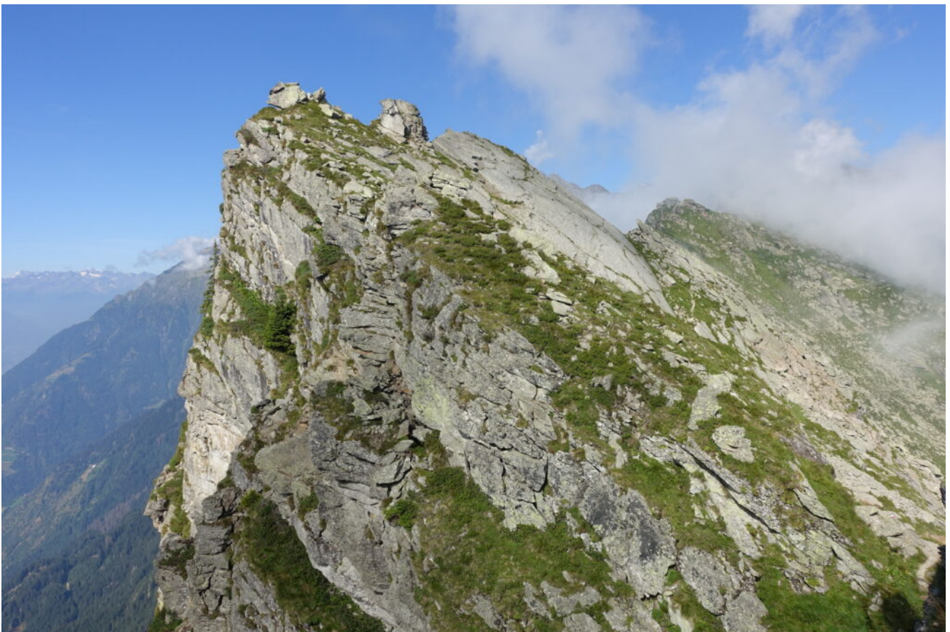
22- Il Gioigo di Quaira, 2230 metri.