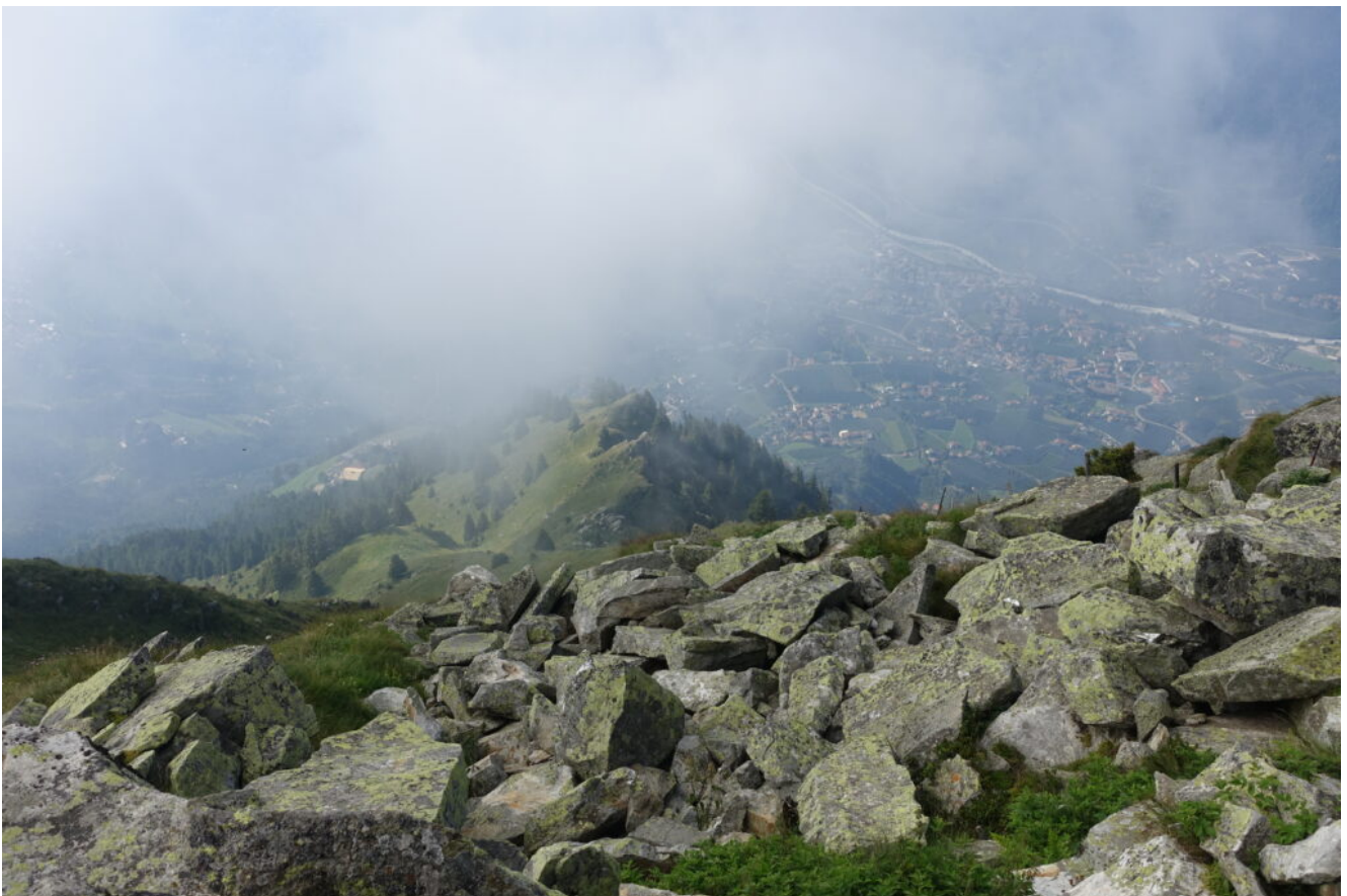
16- Merano si scopre tra la nebbia.