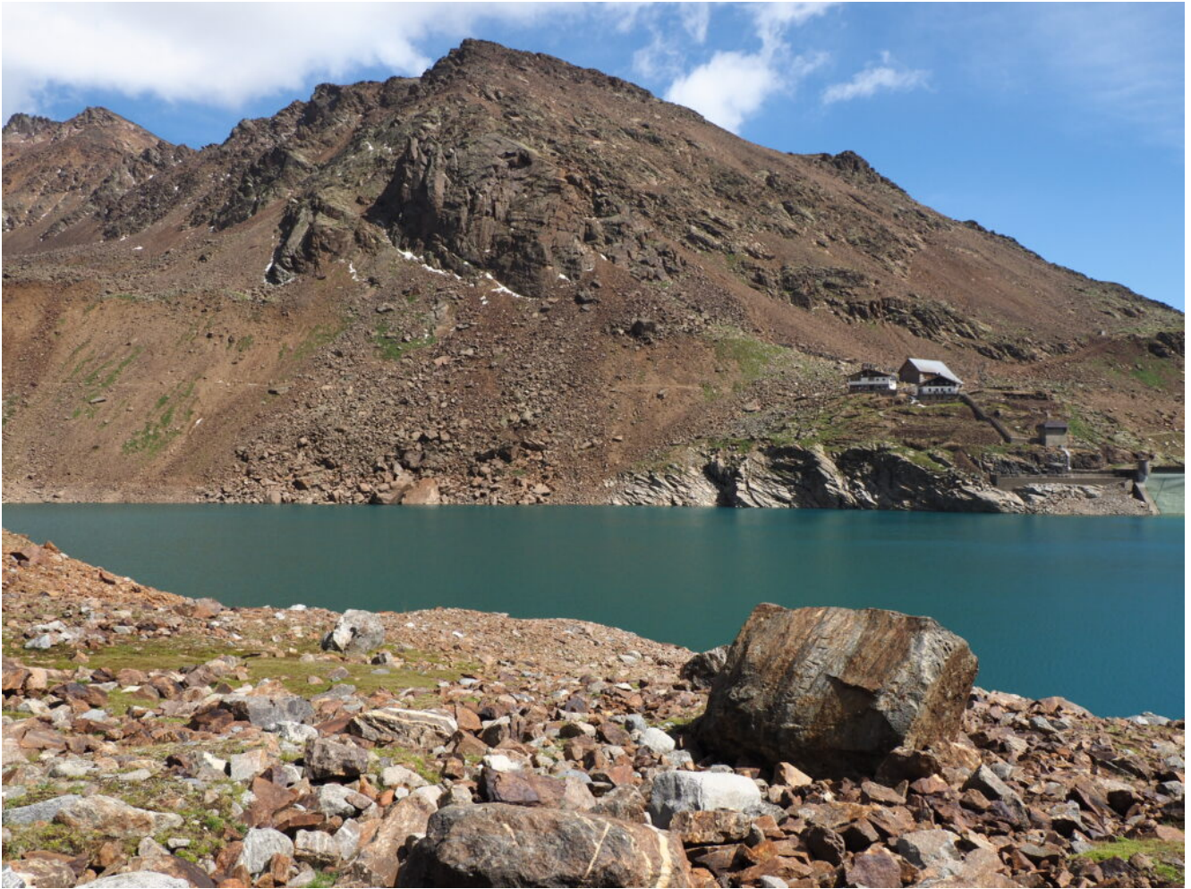
20- Il Rifugio Canziani visto dalla riva opposta.