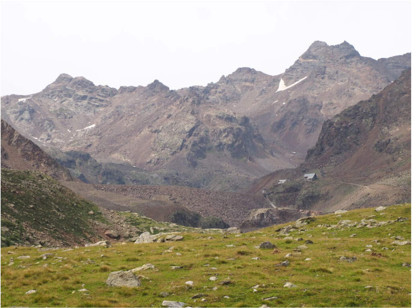
45- Il Rifugio Canziani e il Monte Gioveretto a destra e la Cima Fontana Bianca a sinistra, visti dal rilievo che sovrasta il Lago Lungo.