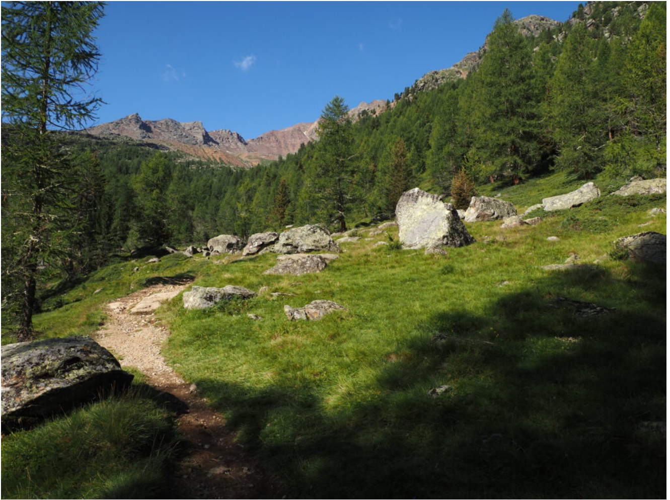
1- Il sentiero di salita dal lago Fontana Bianca al Rifugio Canziani e Lago Verde.