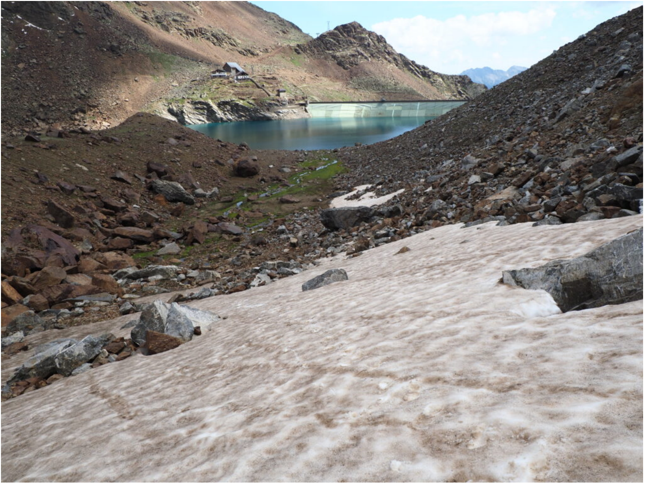
25- Il Lago Verde e il Rifugio Canziani visti dai nevai.