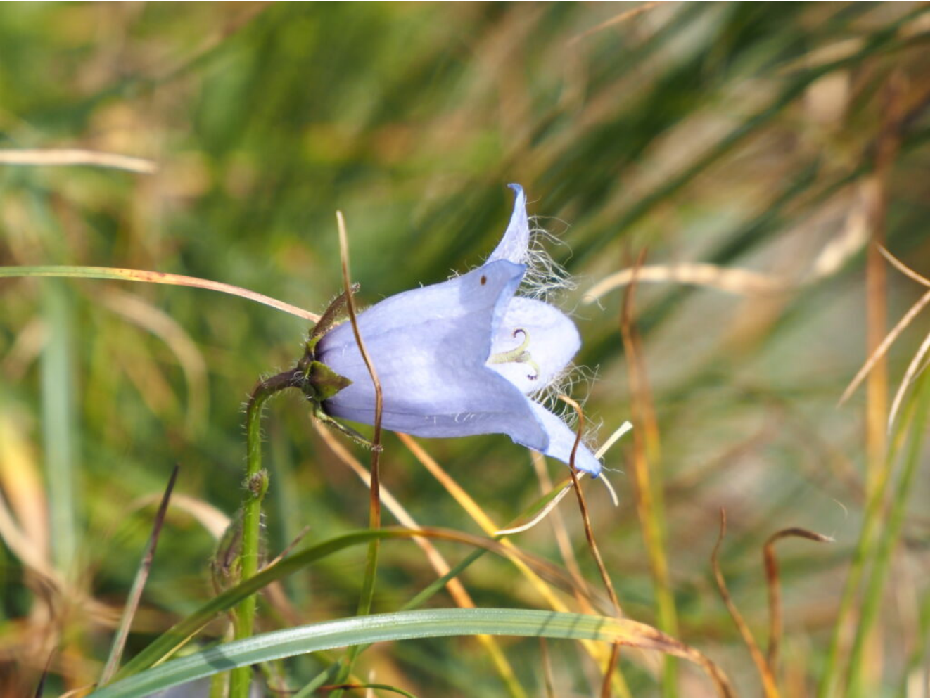
51- La Campanula barbata.