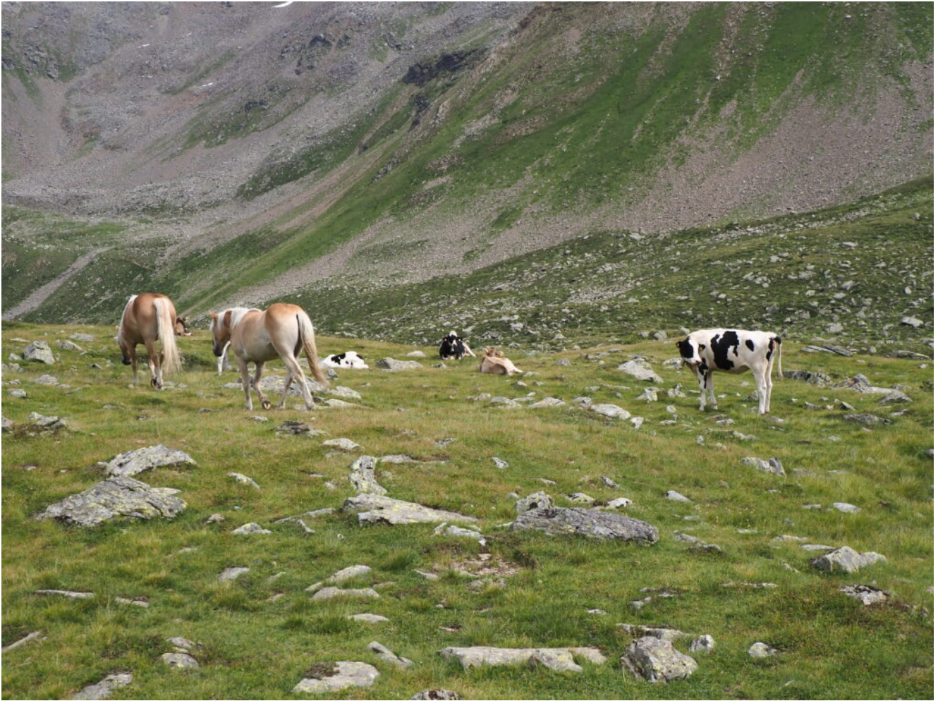
50- Mucche e cavalli al pascolo negli alpeggi intorno ai laghi.