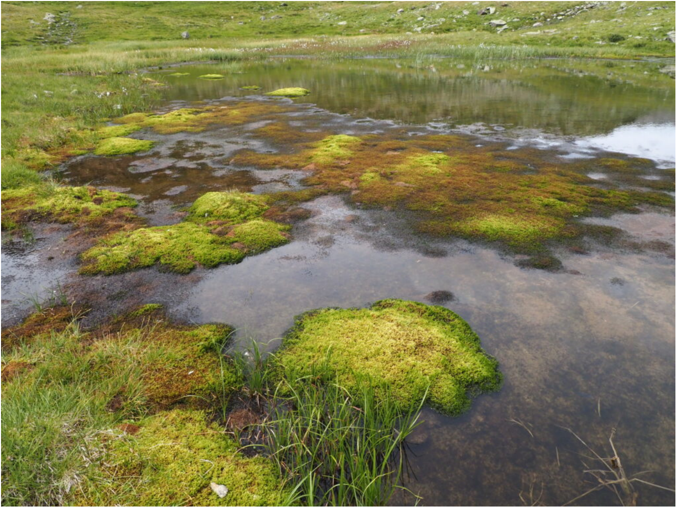
39- Sfagni nelle torbiere della zona.