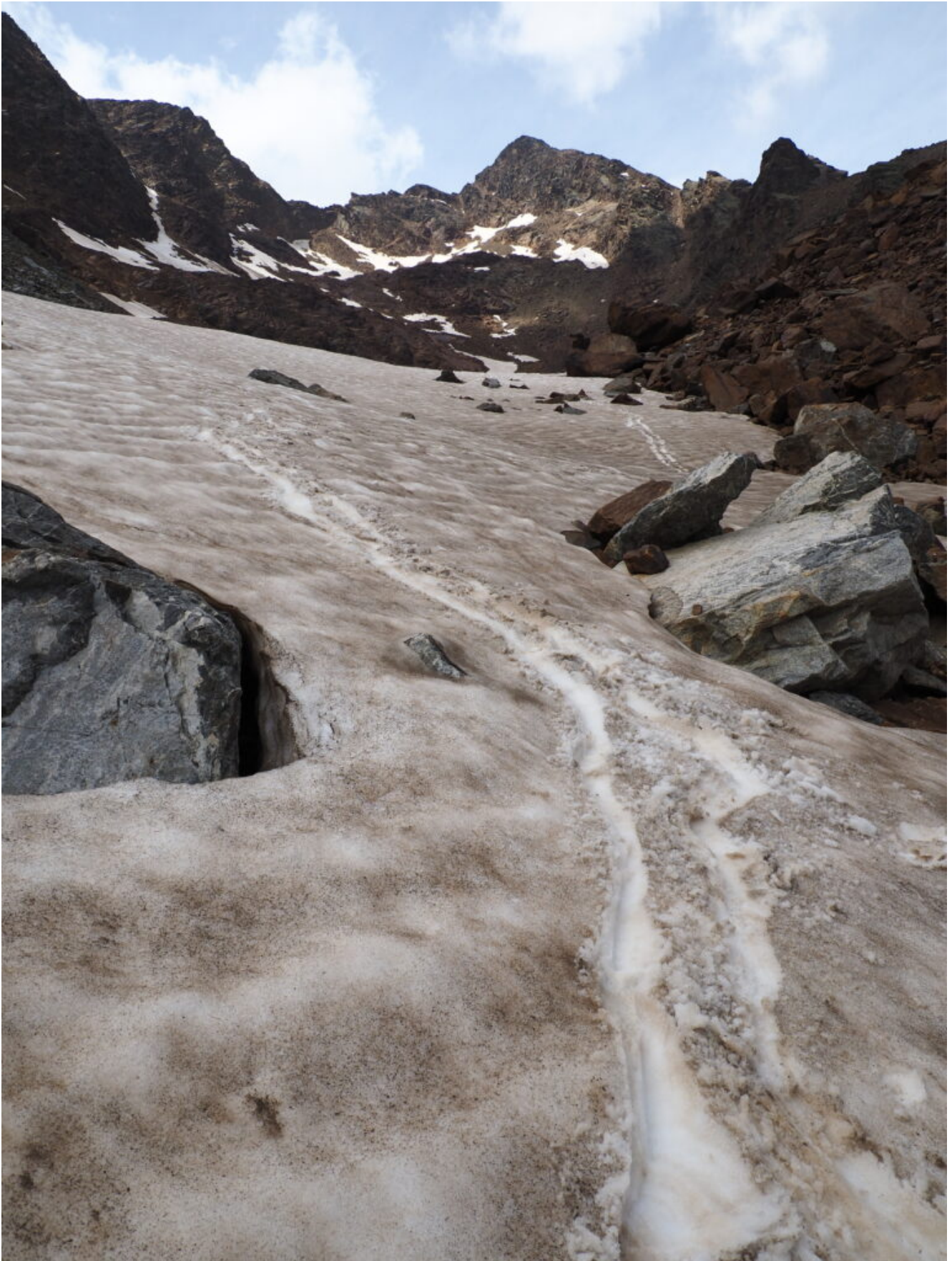
28- Cadute di pietre quasi continue dal versante Nord mi spingono a scendere.