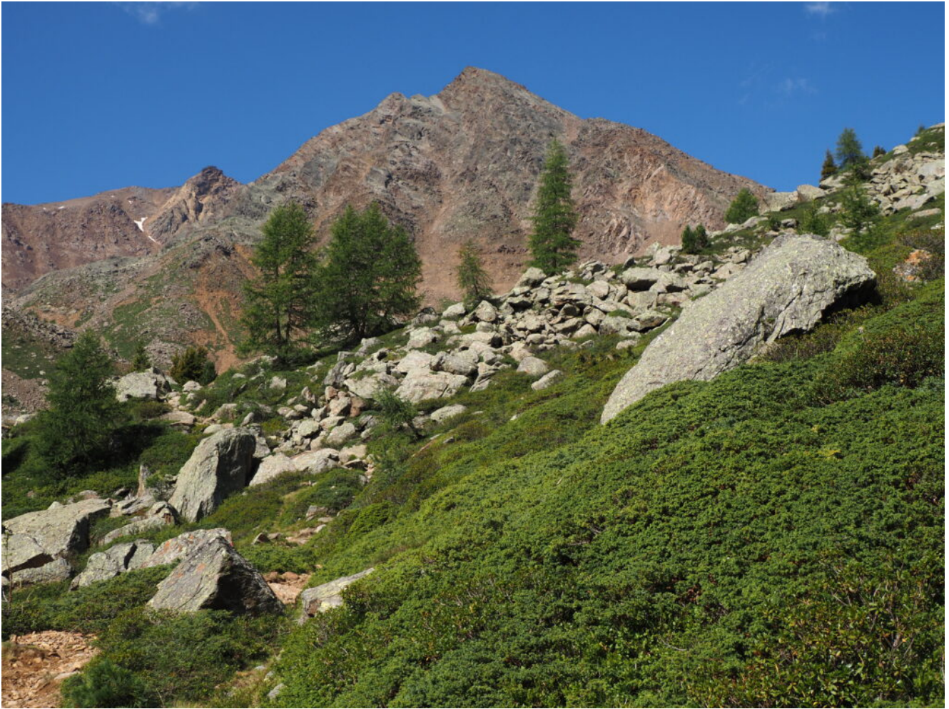
3- La Cima Sternai e i primi cespugli di Uva ursina segnano il limite del bosco.