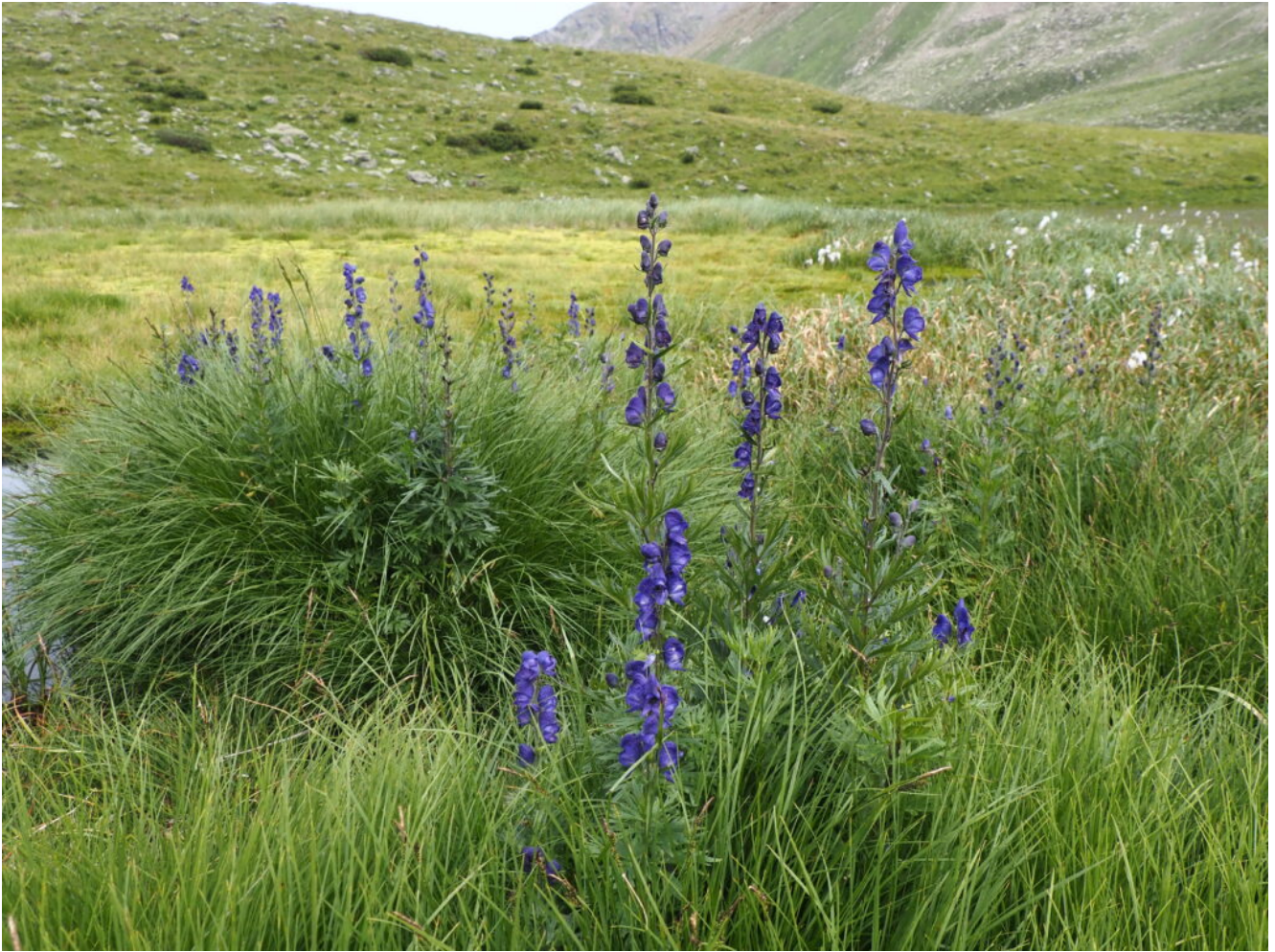
40 – 41 – Aconitum napellus , pianta velenosissima.