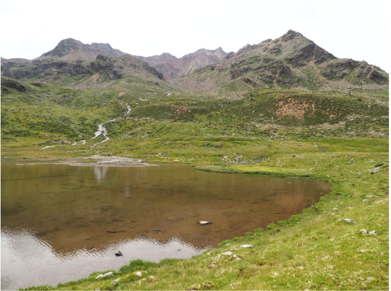
42 – 44 -Il Lago Lungo .