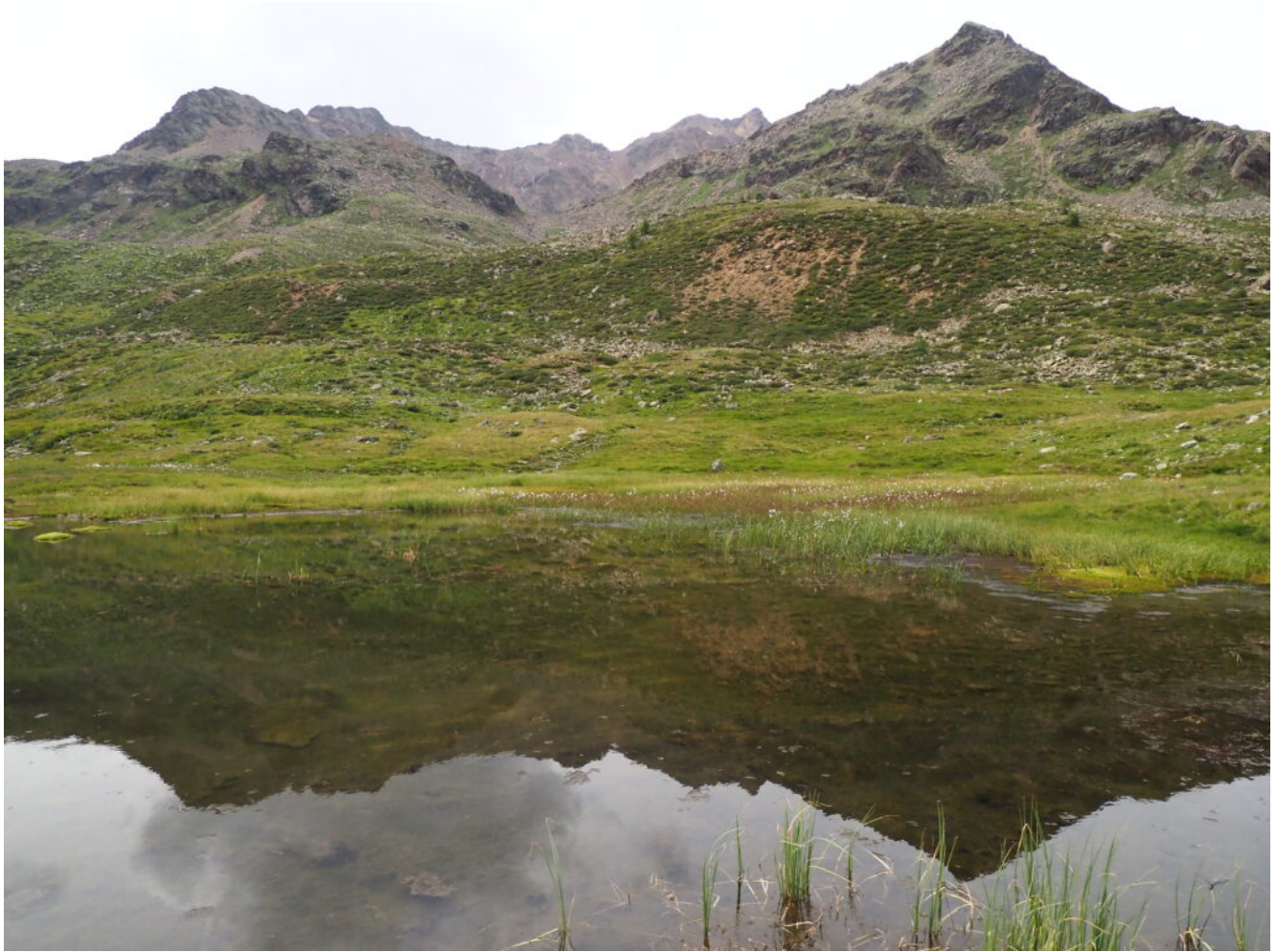
38- Le cime della zona si specchiano sul Lago Lungo.