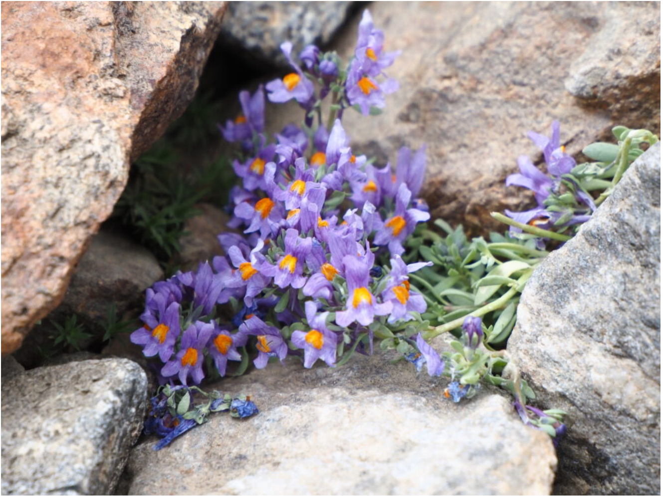
30- Linaria alpina nei ghiaioni di quota.