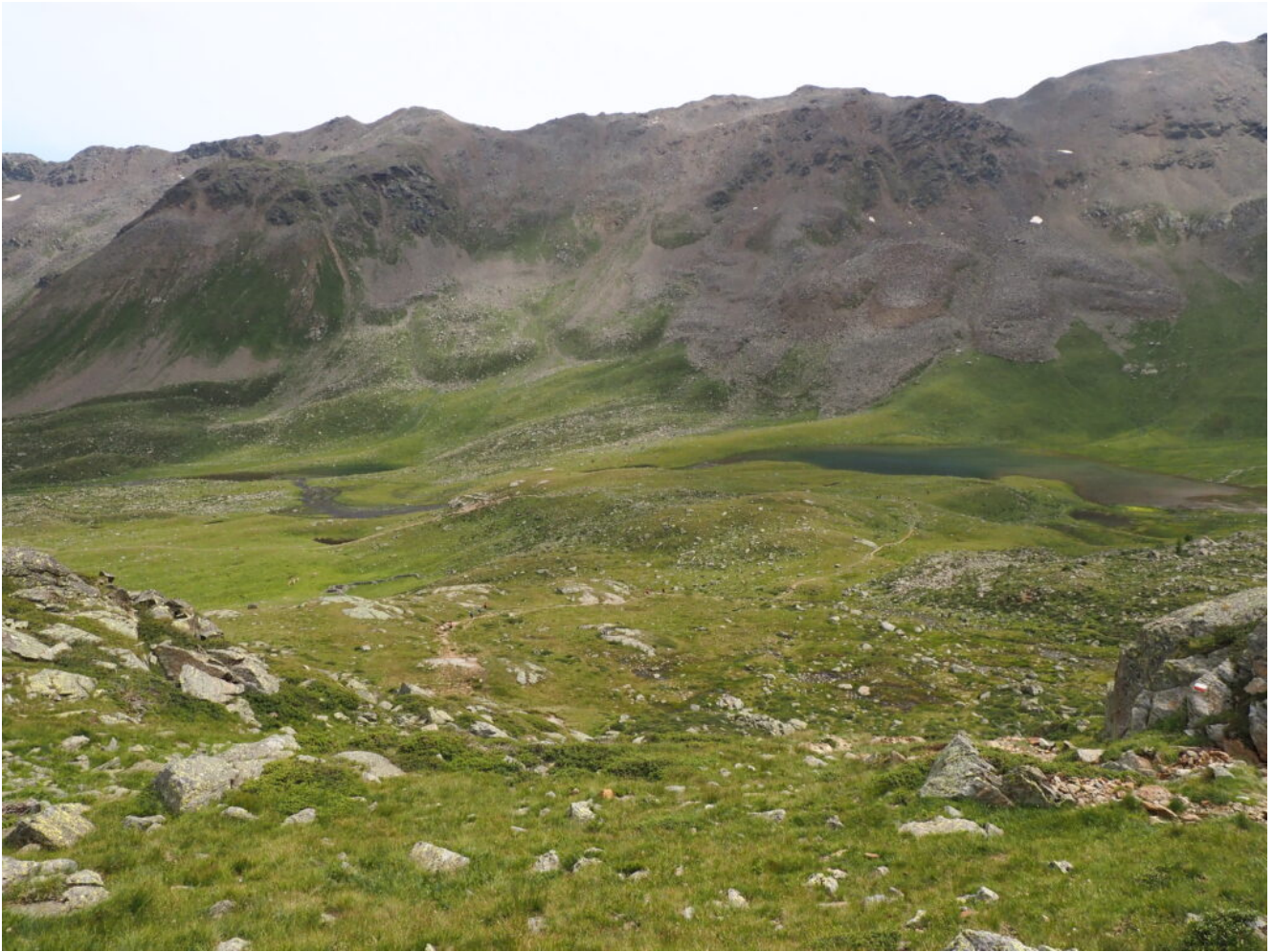
35- Il Lago Lungo e il Lago Lungo Inferiore.