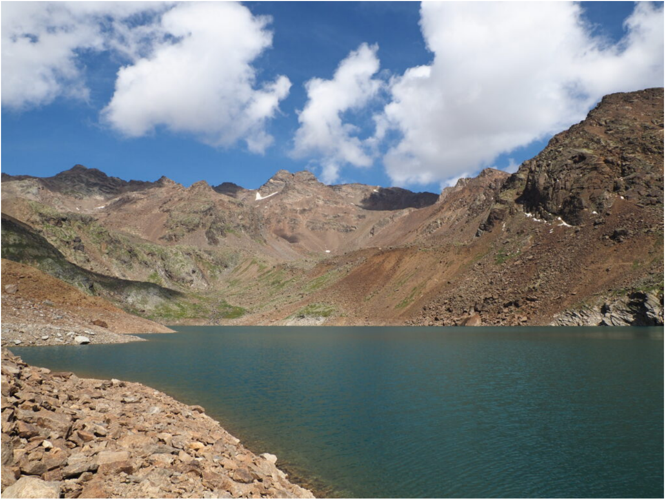
18- Attraverso la diga e inizio a salire sui nevai di Cima Sternai.