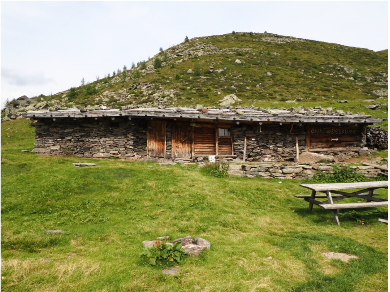
47 – 48- Case di alpeggio nel sentiero di discesa.