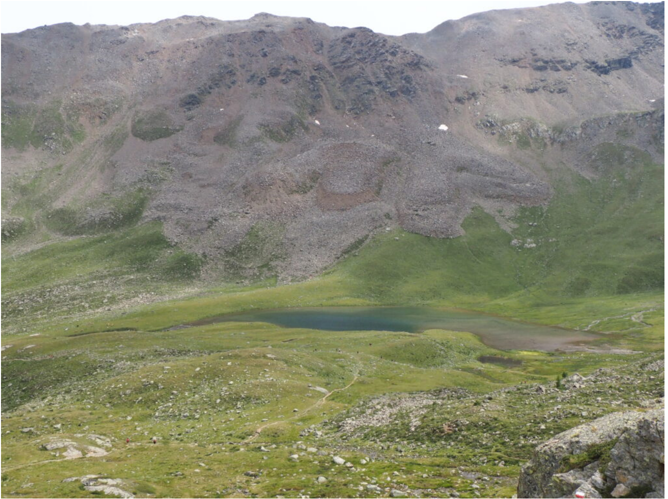
36- Il Lago Lungo.