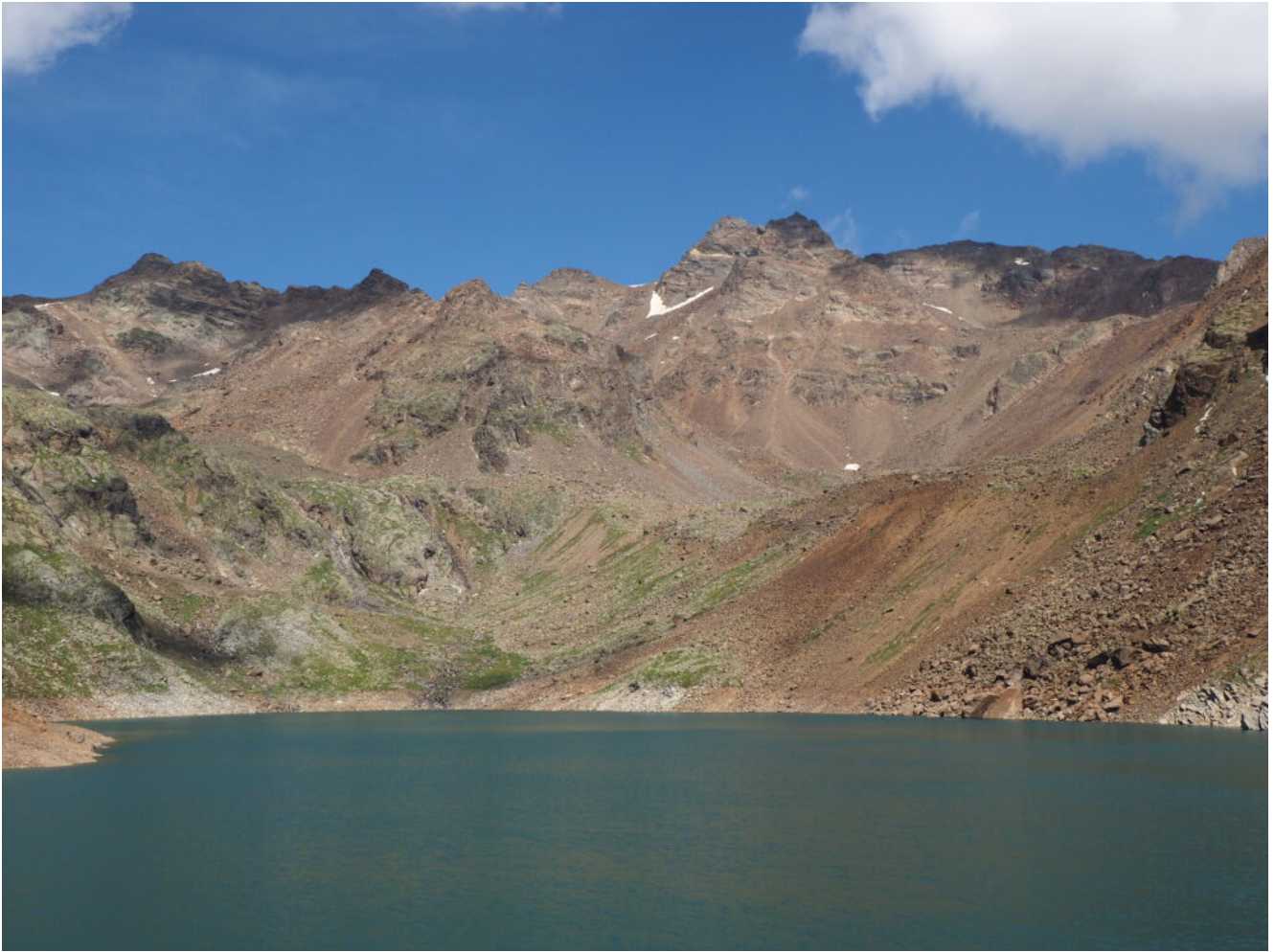
13 – 15 -Il Gioveretto (3439 m.)