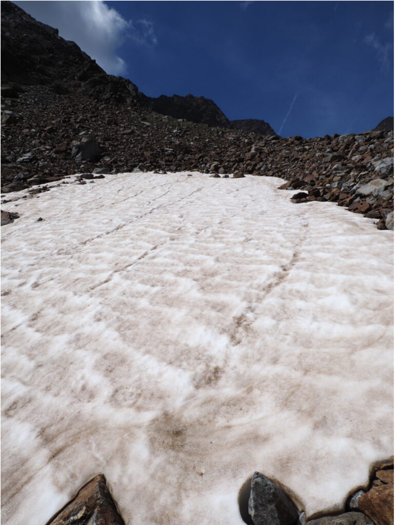
26 – 27 – Arrivo alla Forcella a 2900 metri.