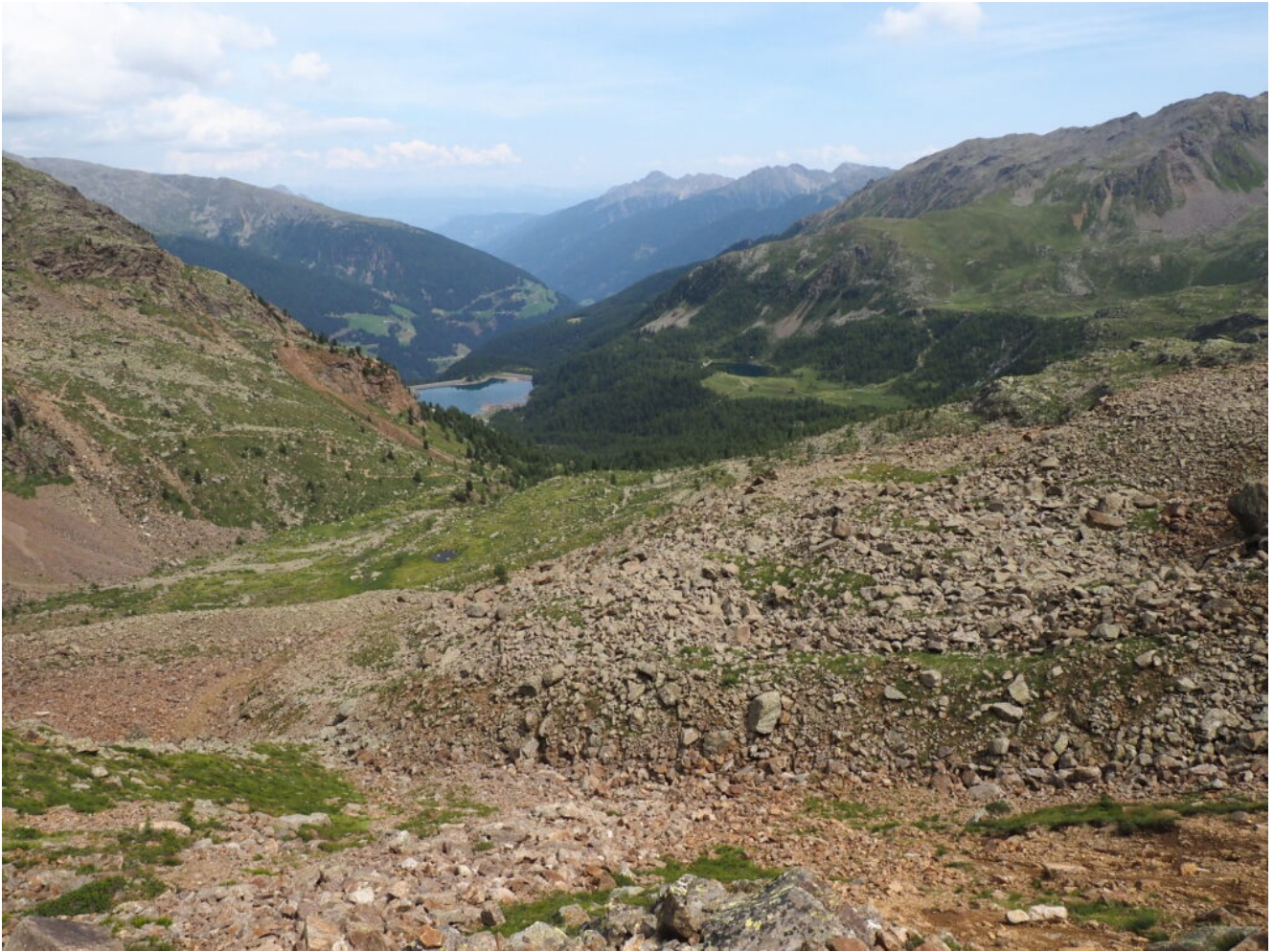
34- Il Lago Fontana Bianca nel fondo valle da cui sono partito.