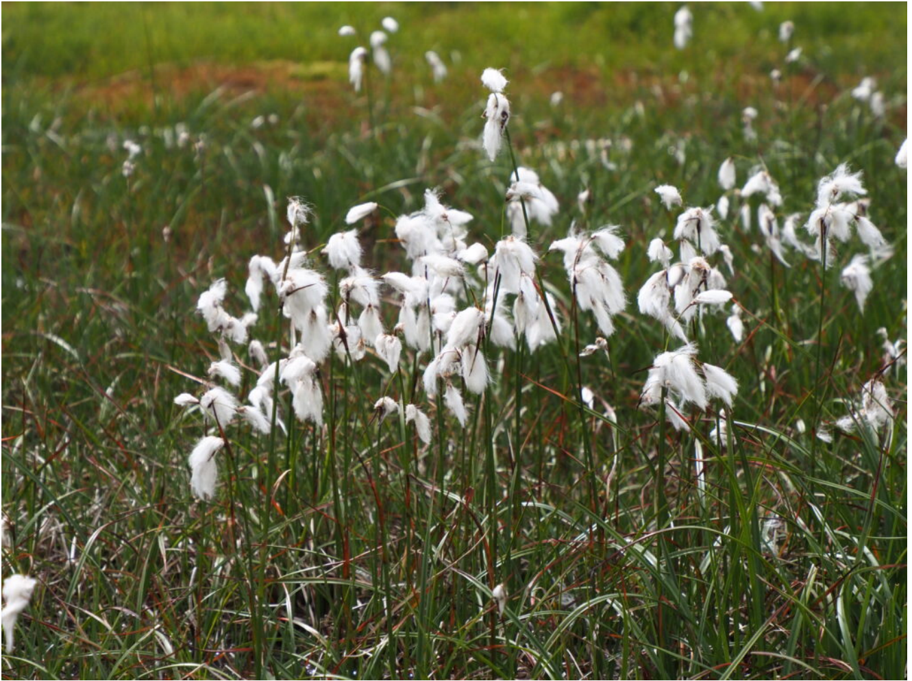
37- Eriophorum latifolium sulle sponde dei vari laghetti che circondano il Lago Lungo.