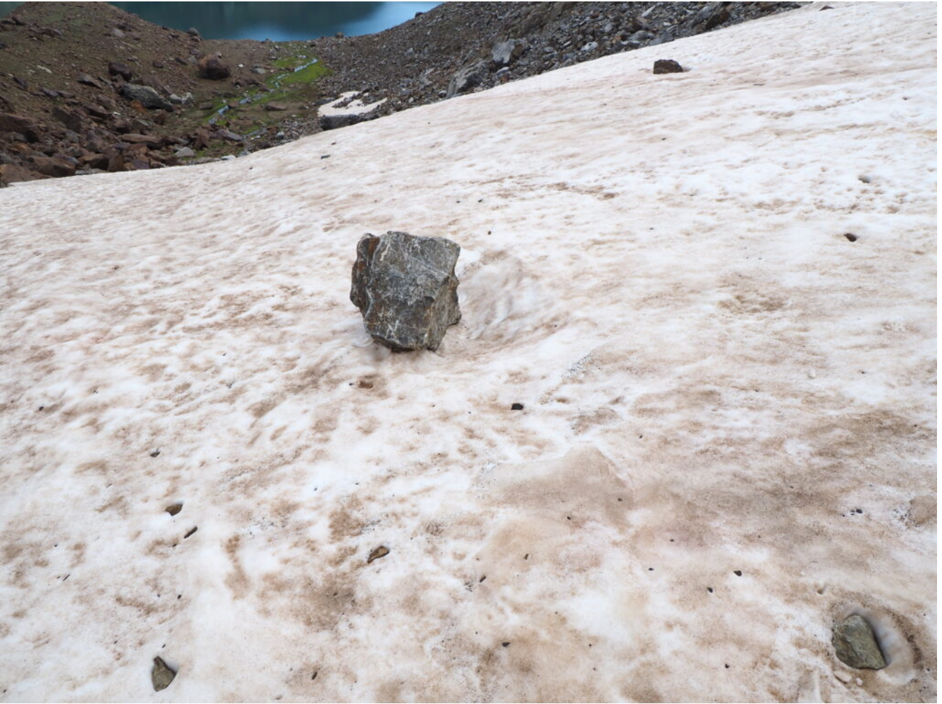
29- Una delle tante pietre sopra alla neve.