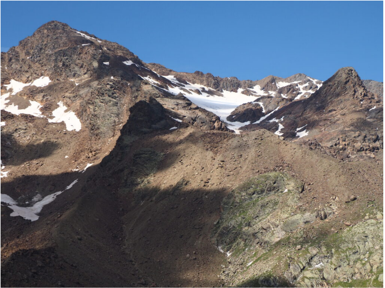
11- La Cima Sternai e la vedretta Fontana Bianca che ancora mantiene neve.