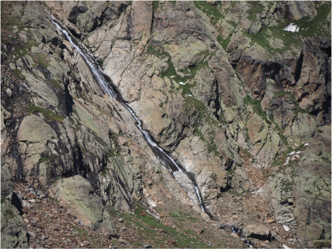
17- Una cascata sulla testata della valle del lago Verde.