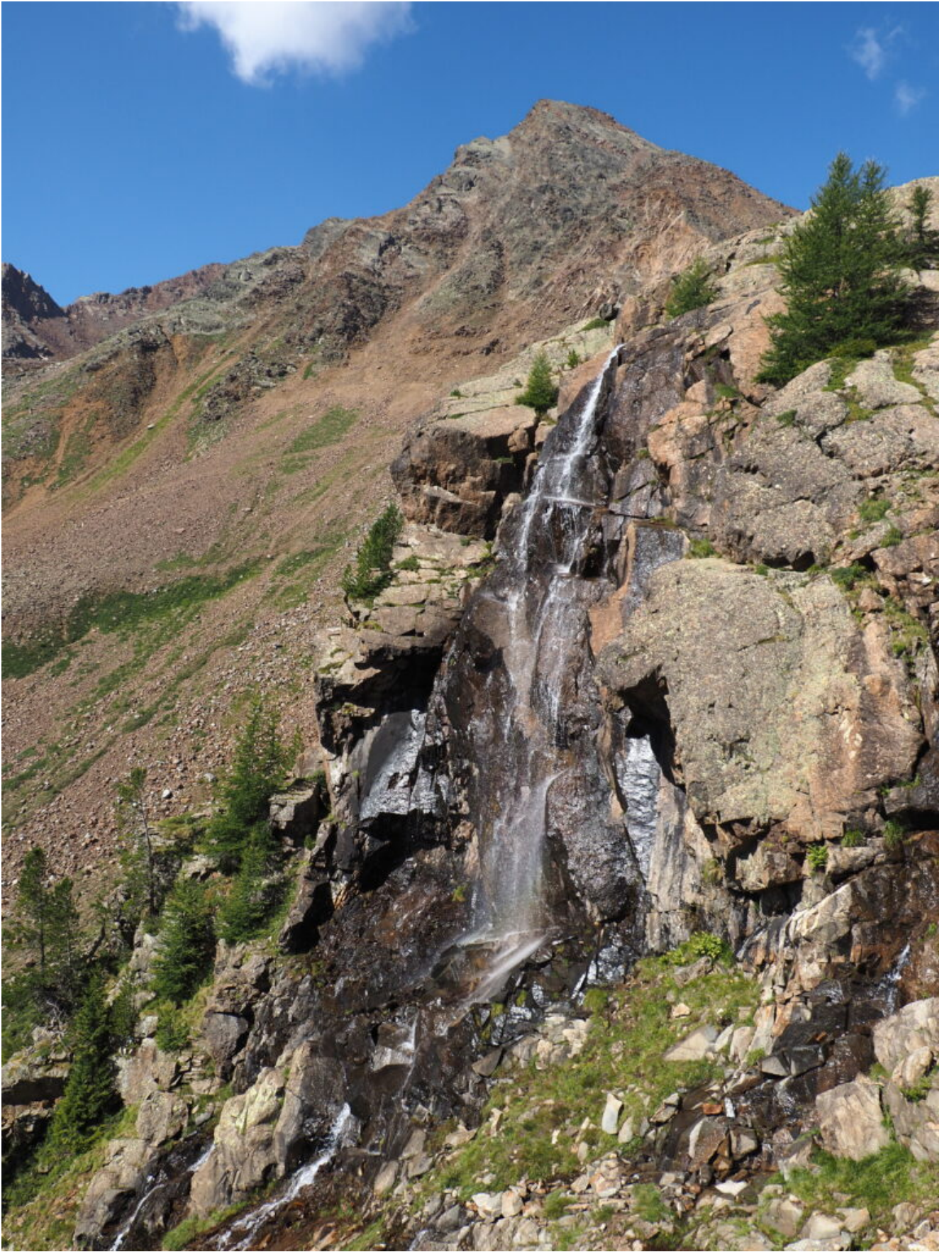
4-La Cima Sternai e una cascata a valle del Lago Verde.