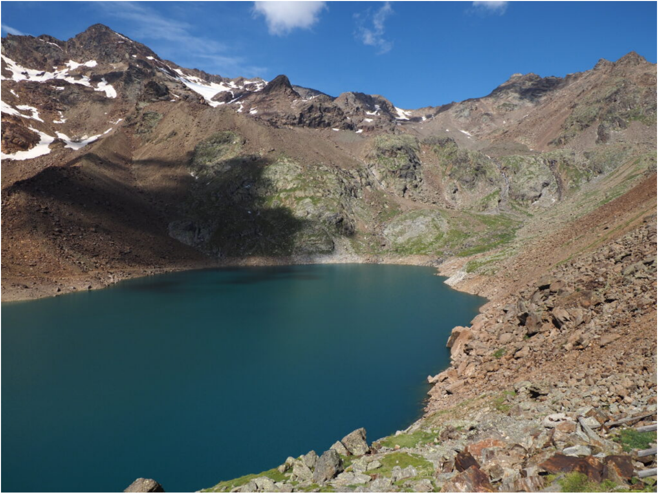
16- Il Lago Verde e la Cima Fontana Bianca sulla sinistra.