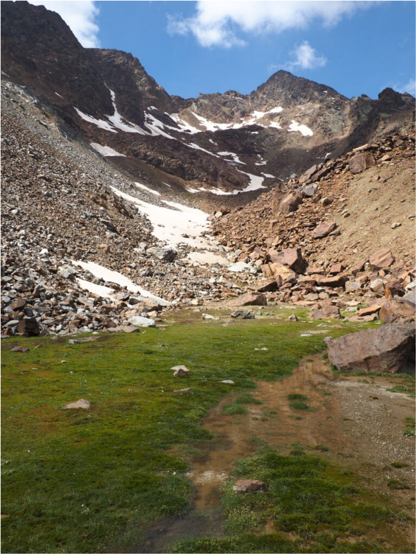
21 – 22 – Le vallette nivali ai piedi dei nevai ricoperte di muschi.