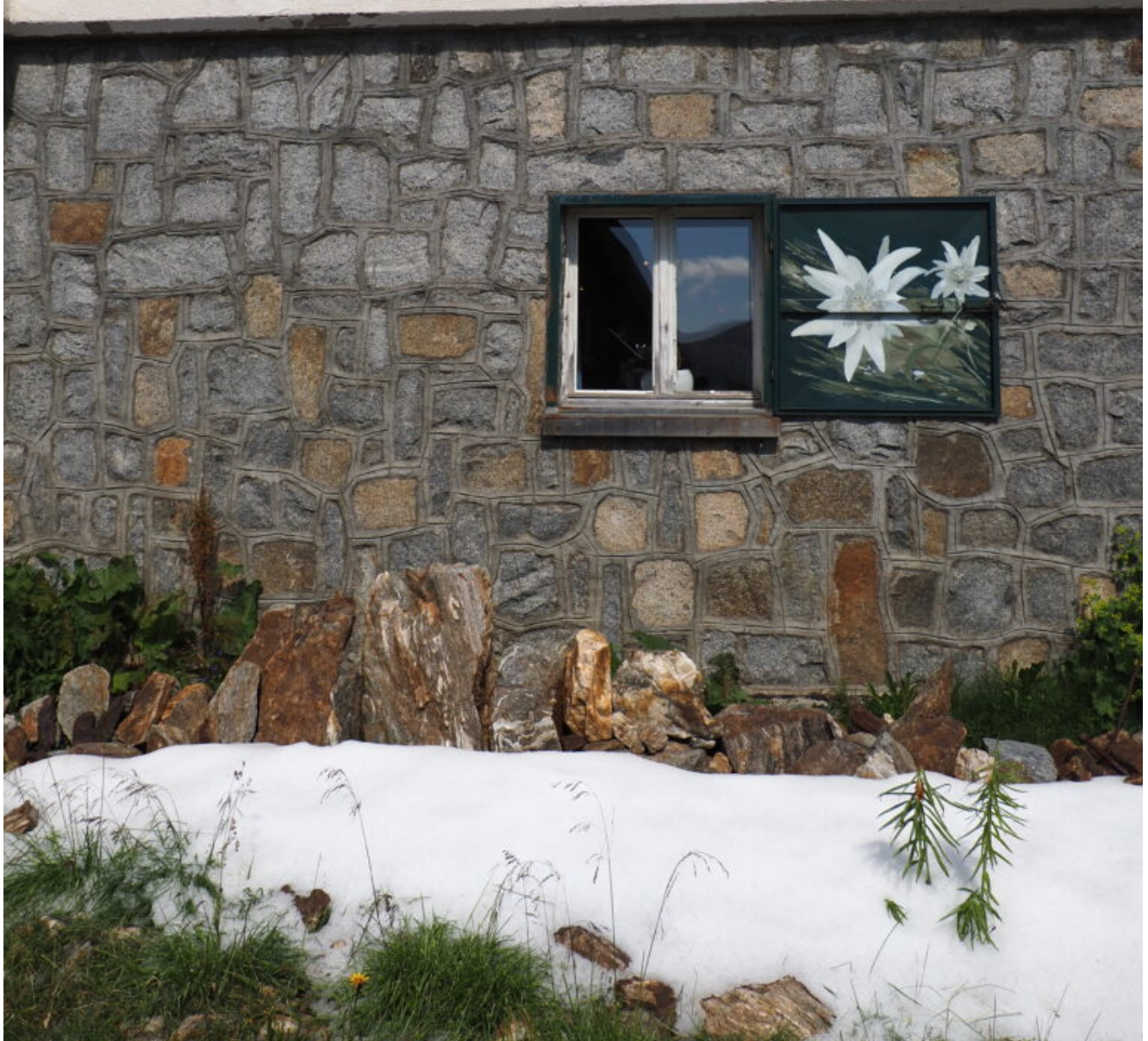
9- Residui di una grandinata del giorno prima.

CLUB ALPINO ITALIANO Sezione di Milano / Sektion Mailand