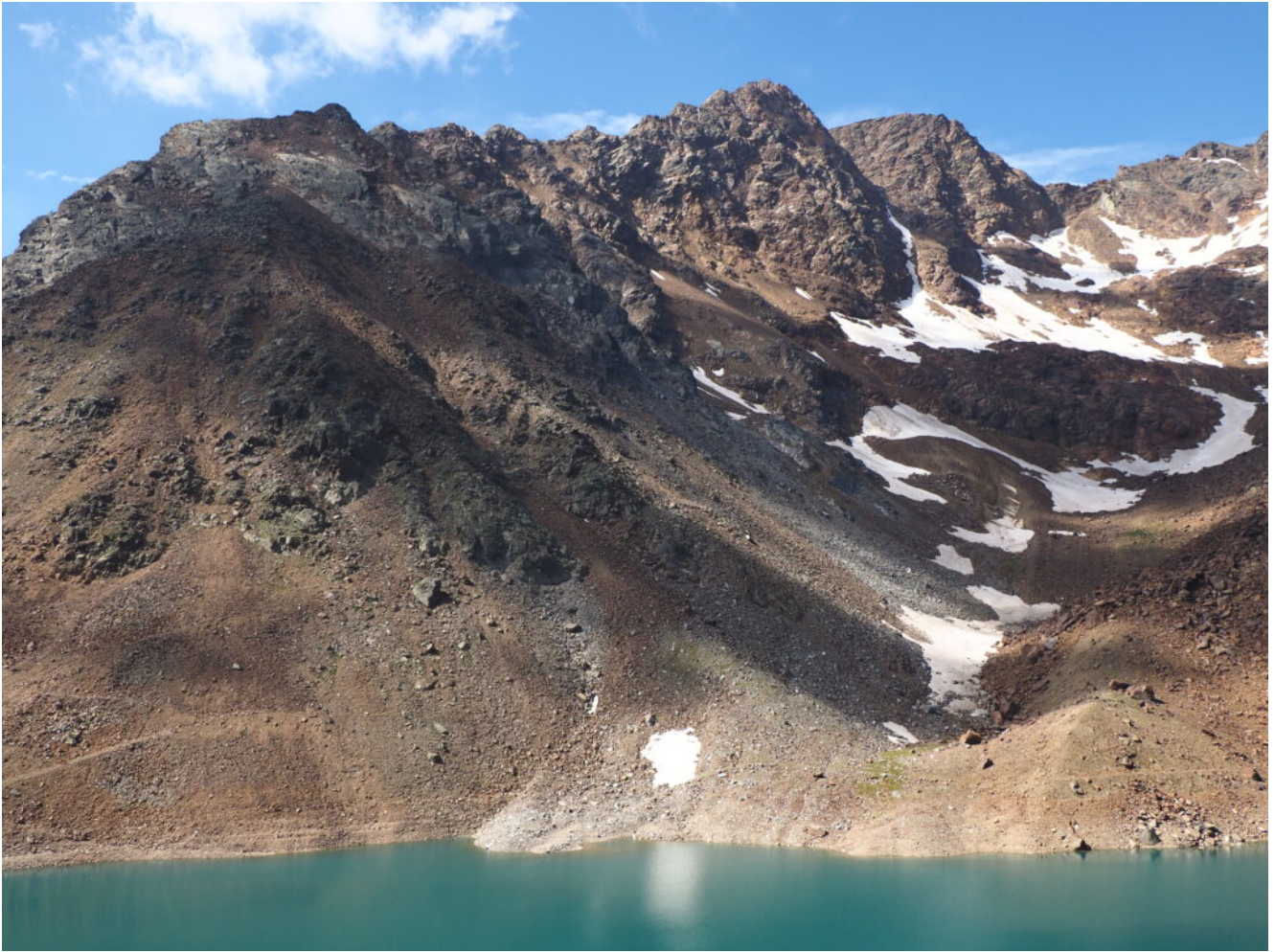
10- Il Lago Verde e i nevai della Cima Sternai.