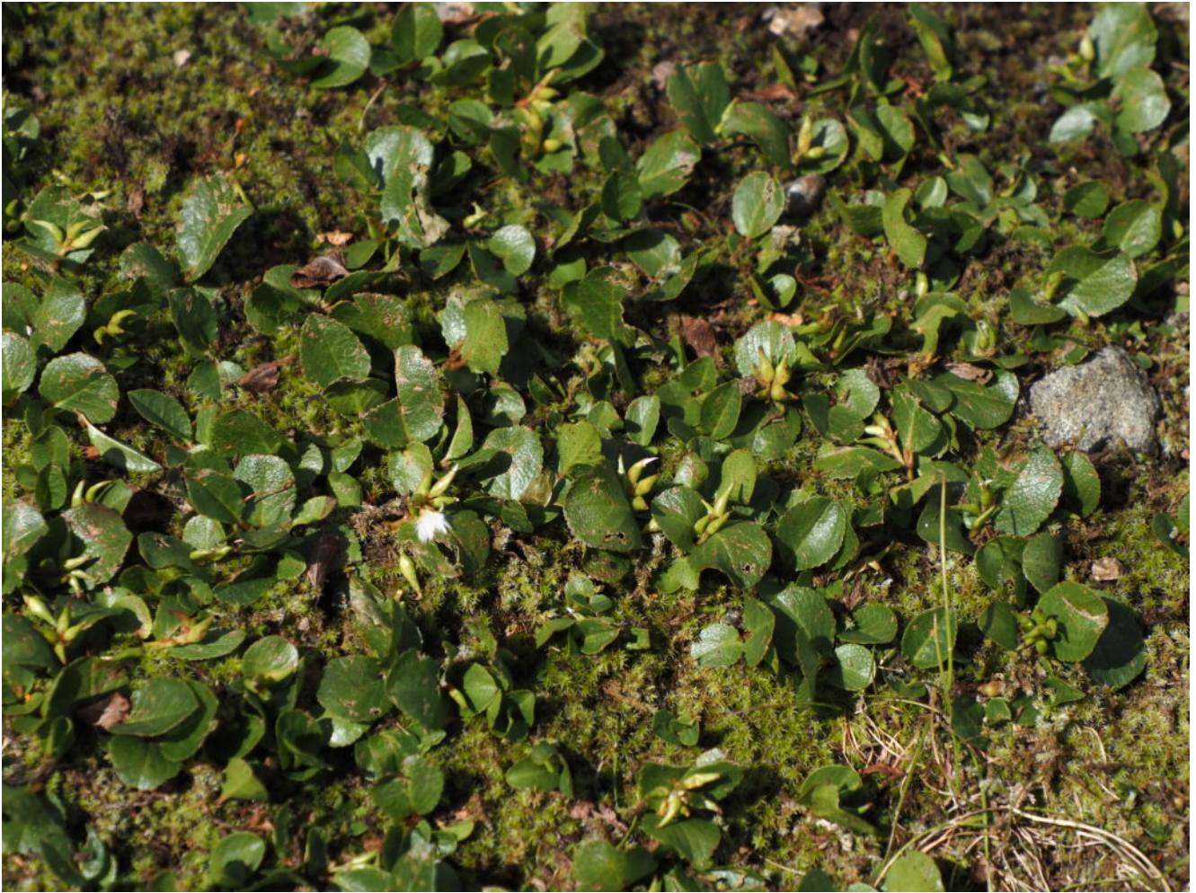
19- Salix herbacea nei pressi dei nevai.