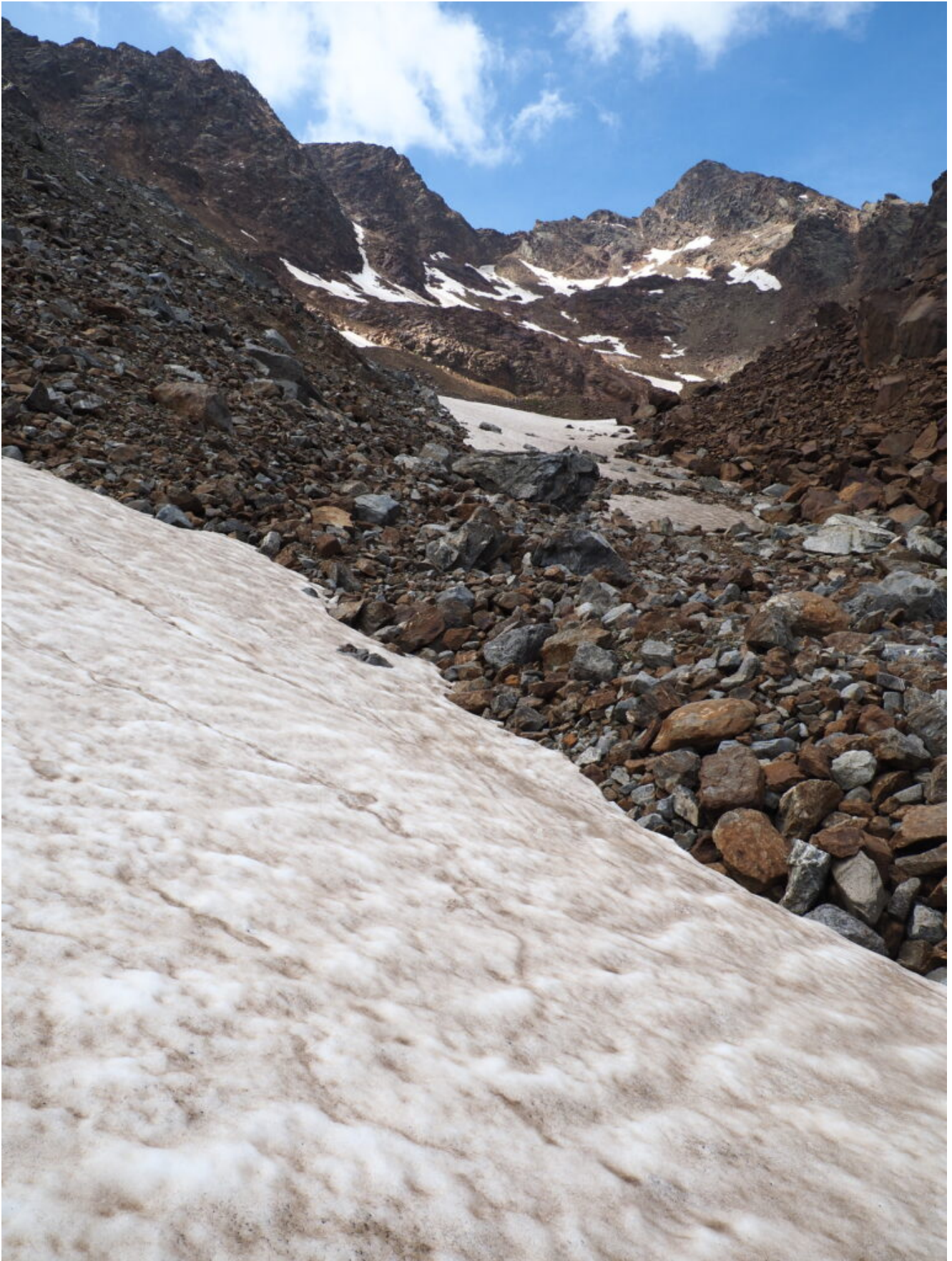
23 – 24 – Inizio a salire sui nevai.