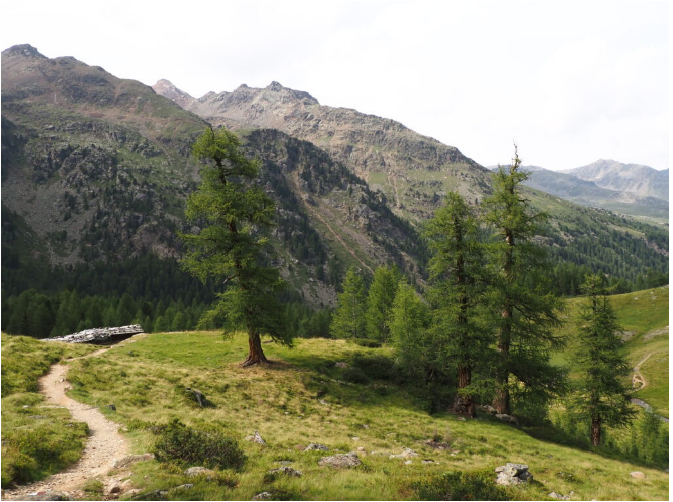
49- Larici secolari sopra al Lago Fontana Bianca.