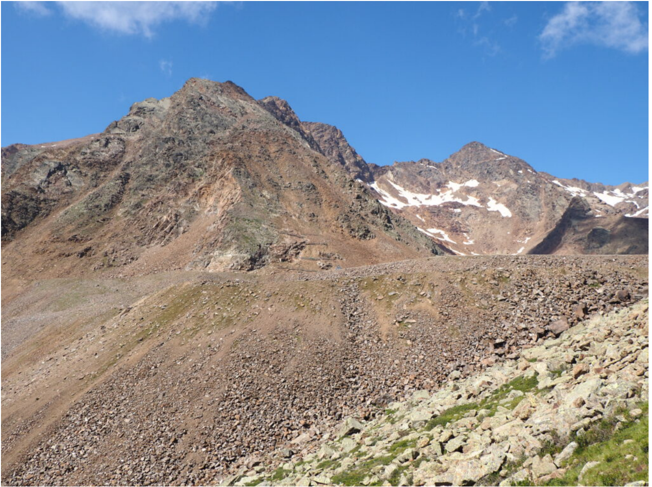
5 – 6 – I nevai residui del versante Nord di Cima Sternai e, in primo piano, il terrapieno del Lago Verde.