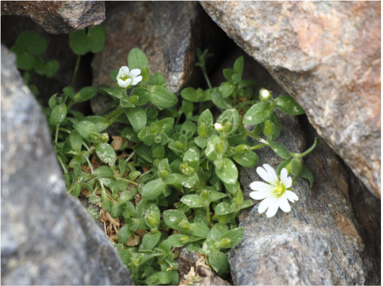
31- Cerastium uniflorum