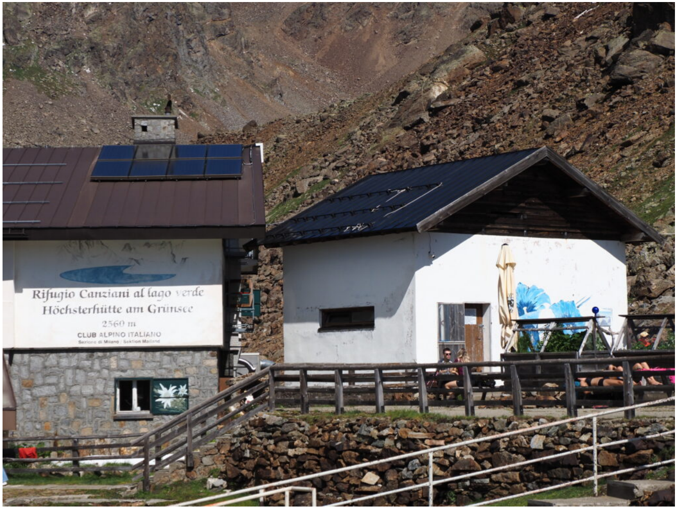
8- Il Rifugio Canziani, provvisto di impianto di risalita privato dal Lago Fontana Bianca.