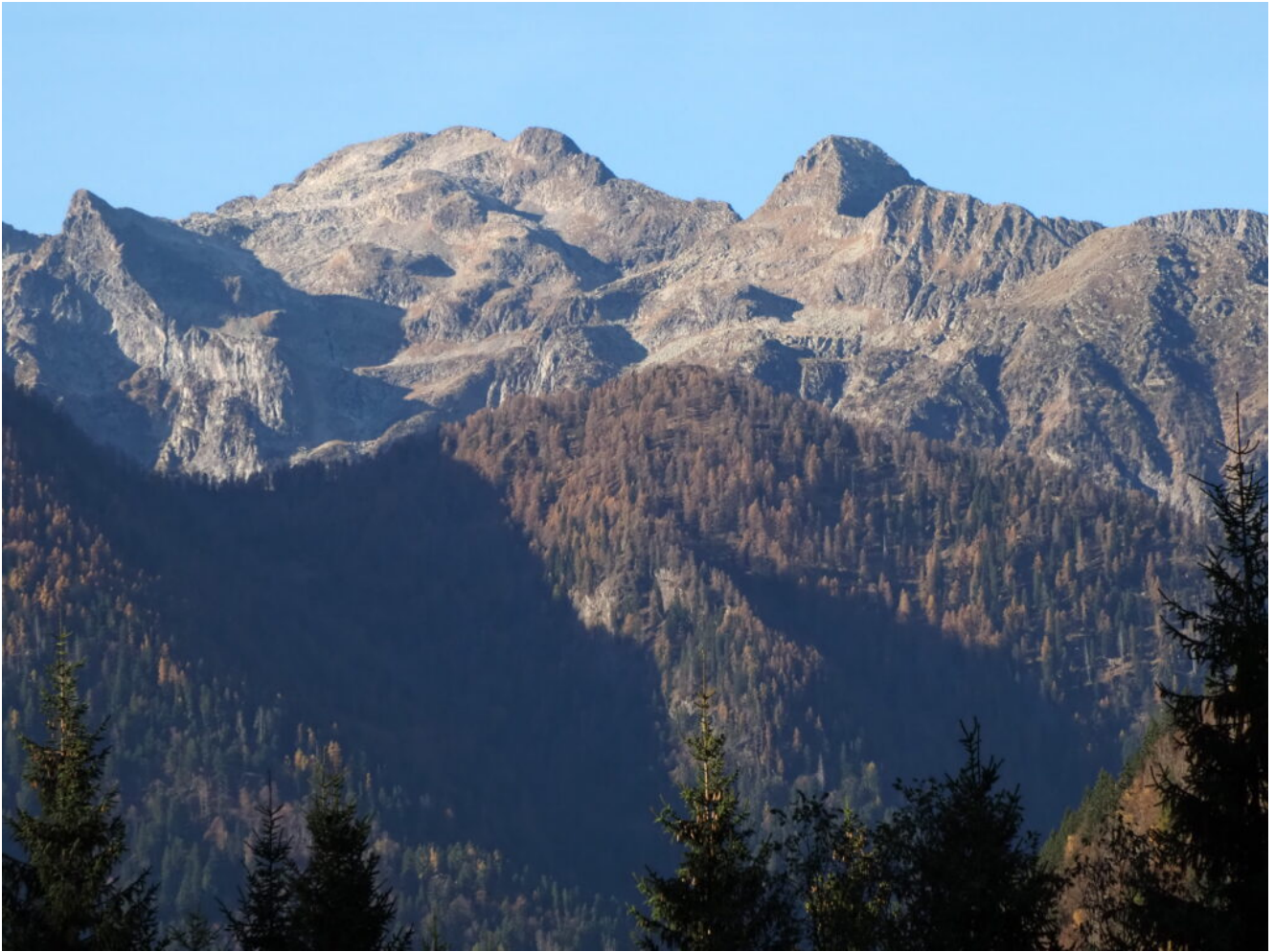
2- La Cima d'Asta di fronte all'abitato di Caoria.