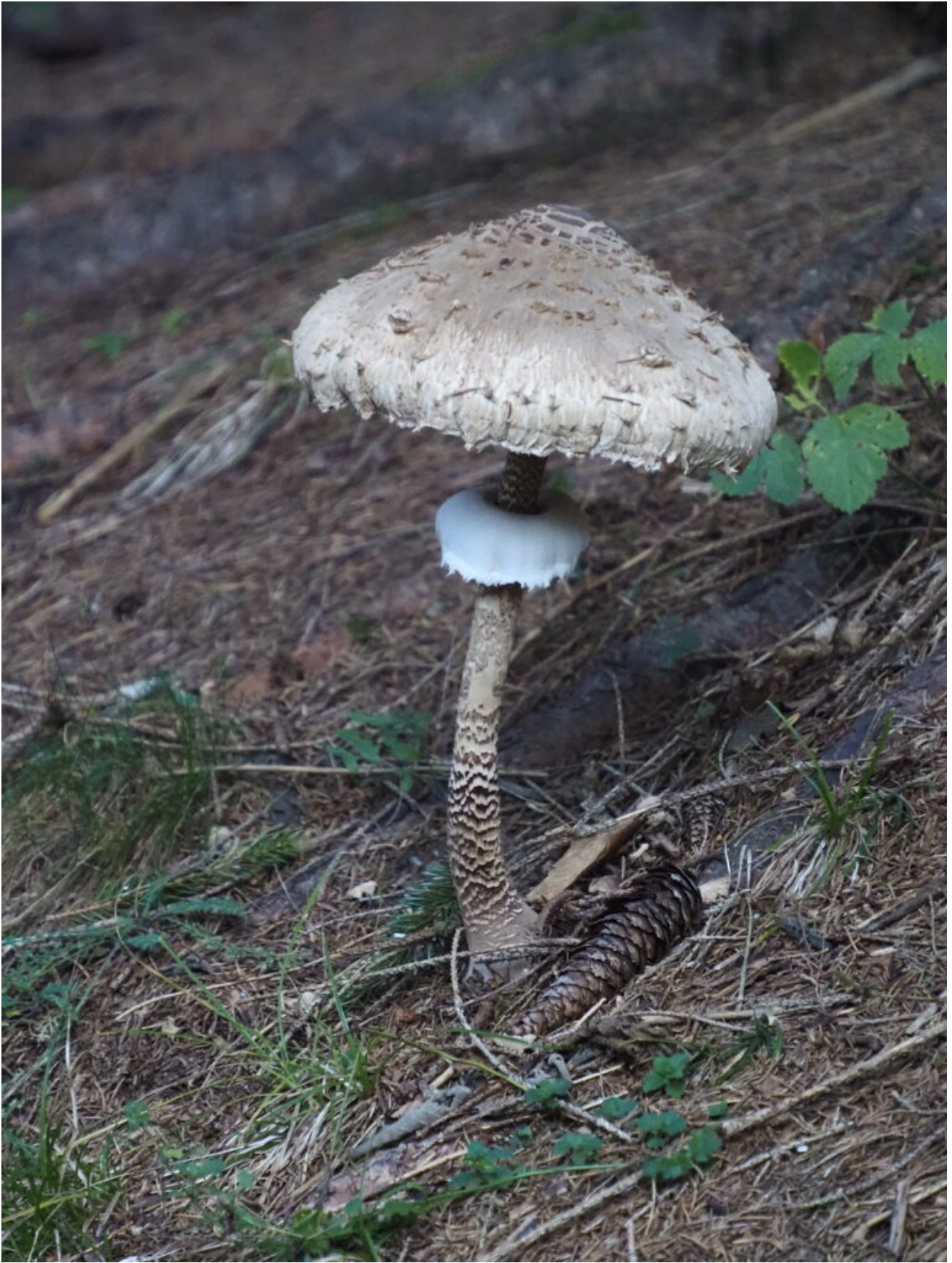
4- Lepiota procera nelle radure dei Masi.