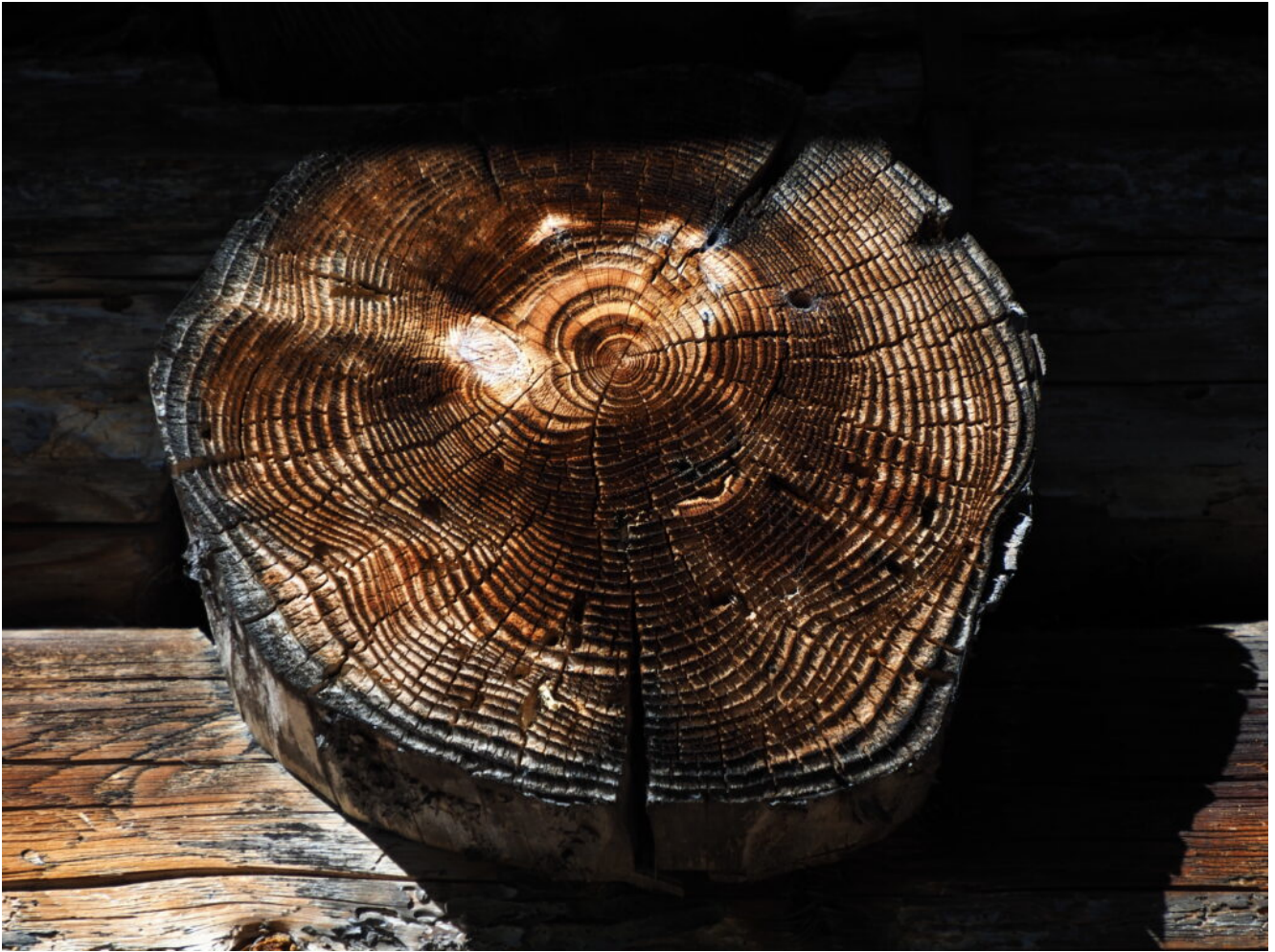
26 – 30- Suggestive immagini del fantastico scenario dei Masi Tognola.