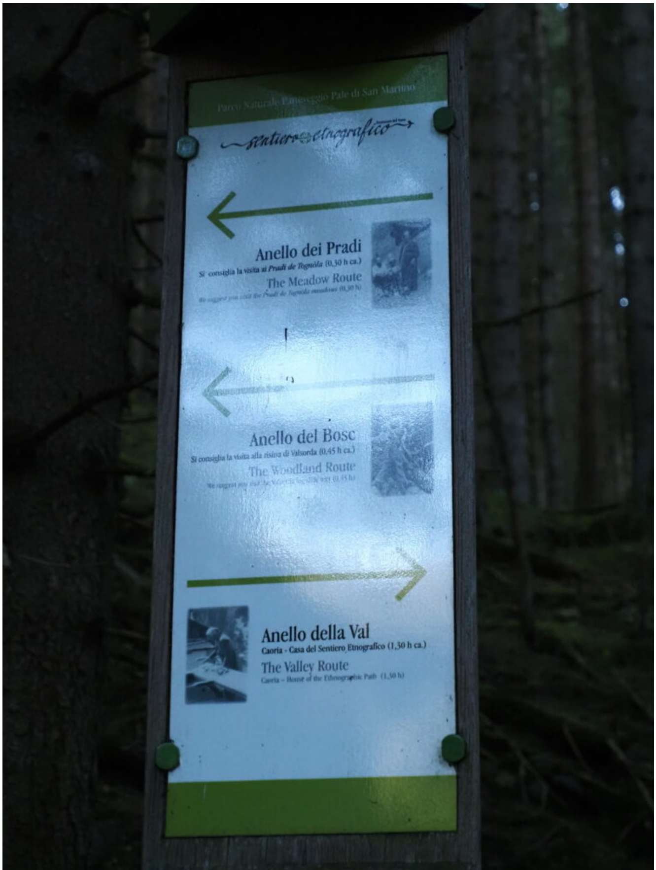
1- Il cartello indicante i vari sentieri percorribili nella Valle Tognola.