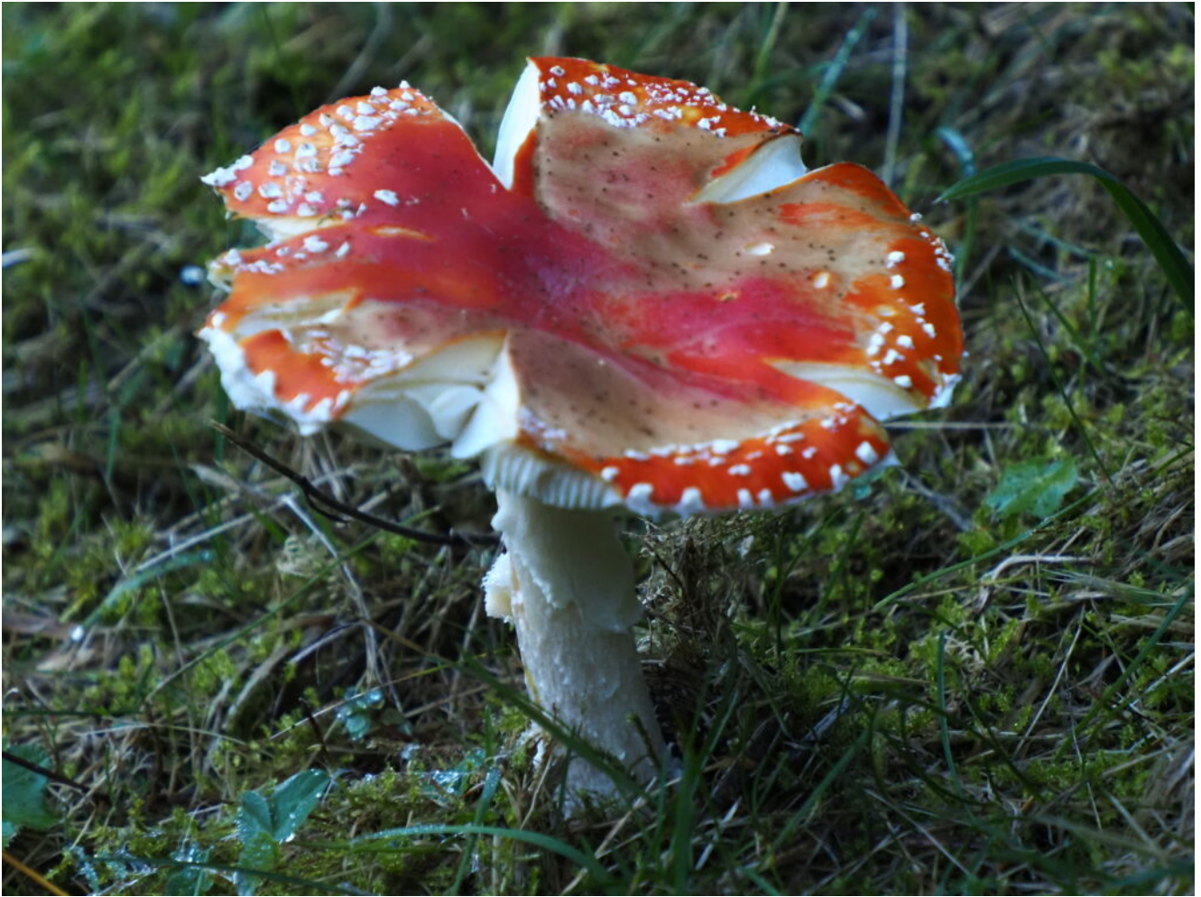
5- Amanita muscaria nel bosco.