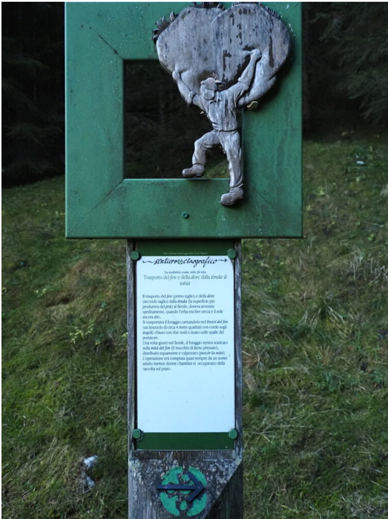
7- Uno dei cartelli narranti le tradizioni della valle Tognola.