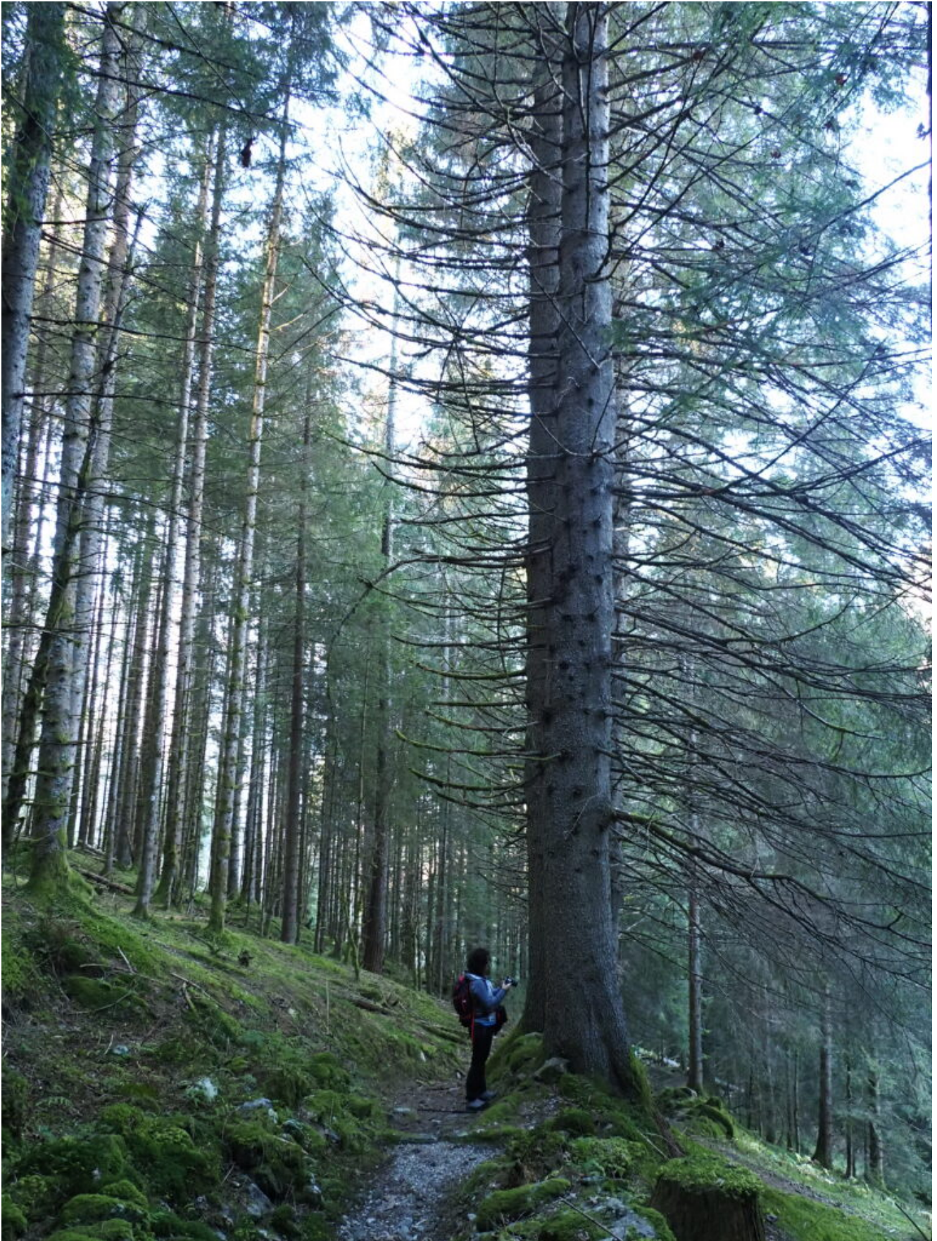
8 – 9 – Nei boschi sono presenti abeti giganteschi, per fortuna preservati dall'attacco del bostrico.