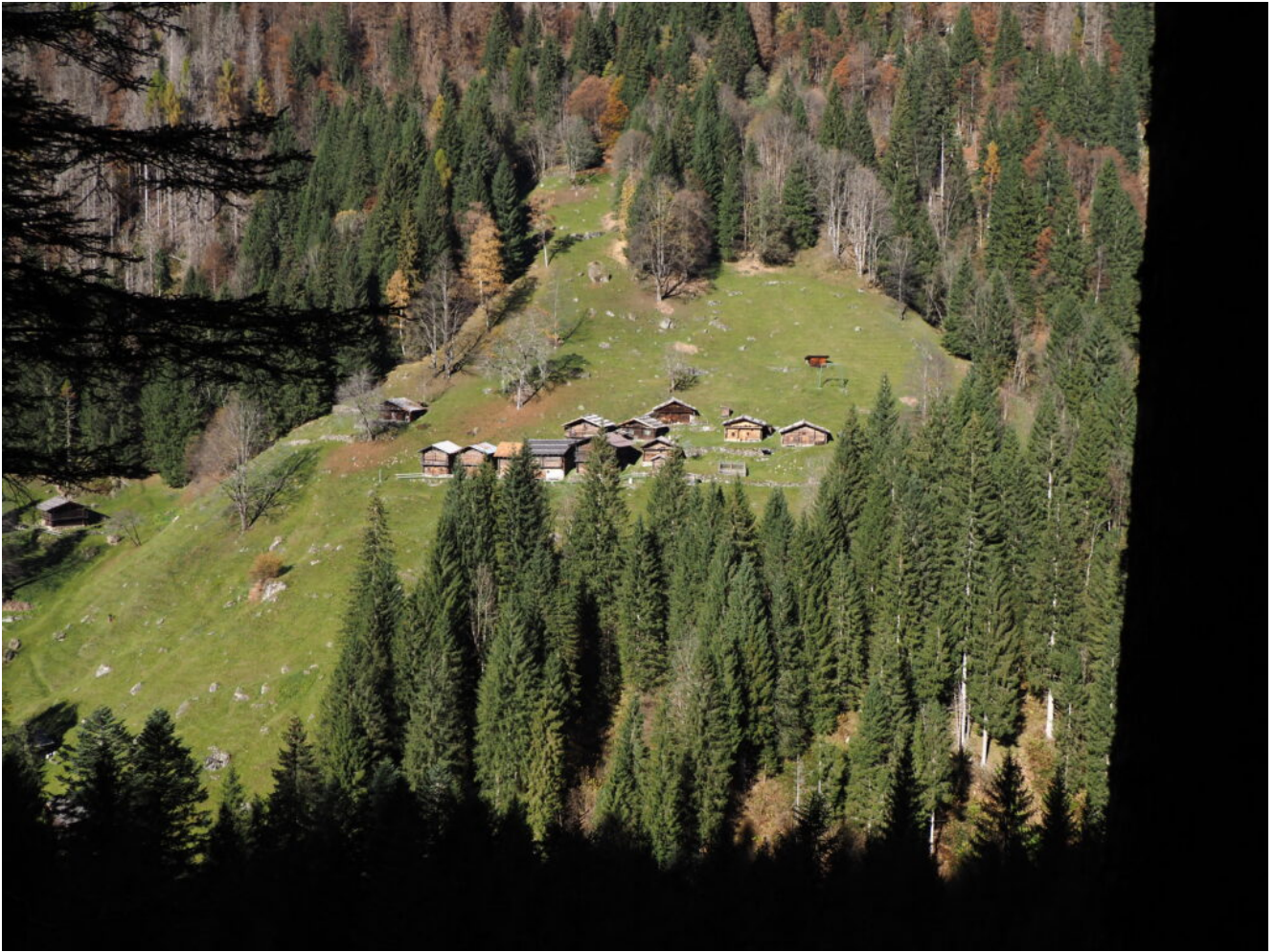
10 – 12- La ripidissima Malga Tognola con i relativi Masi, visti dal versante opposto della valle.