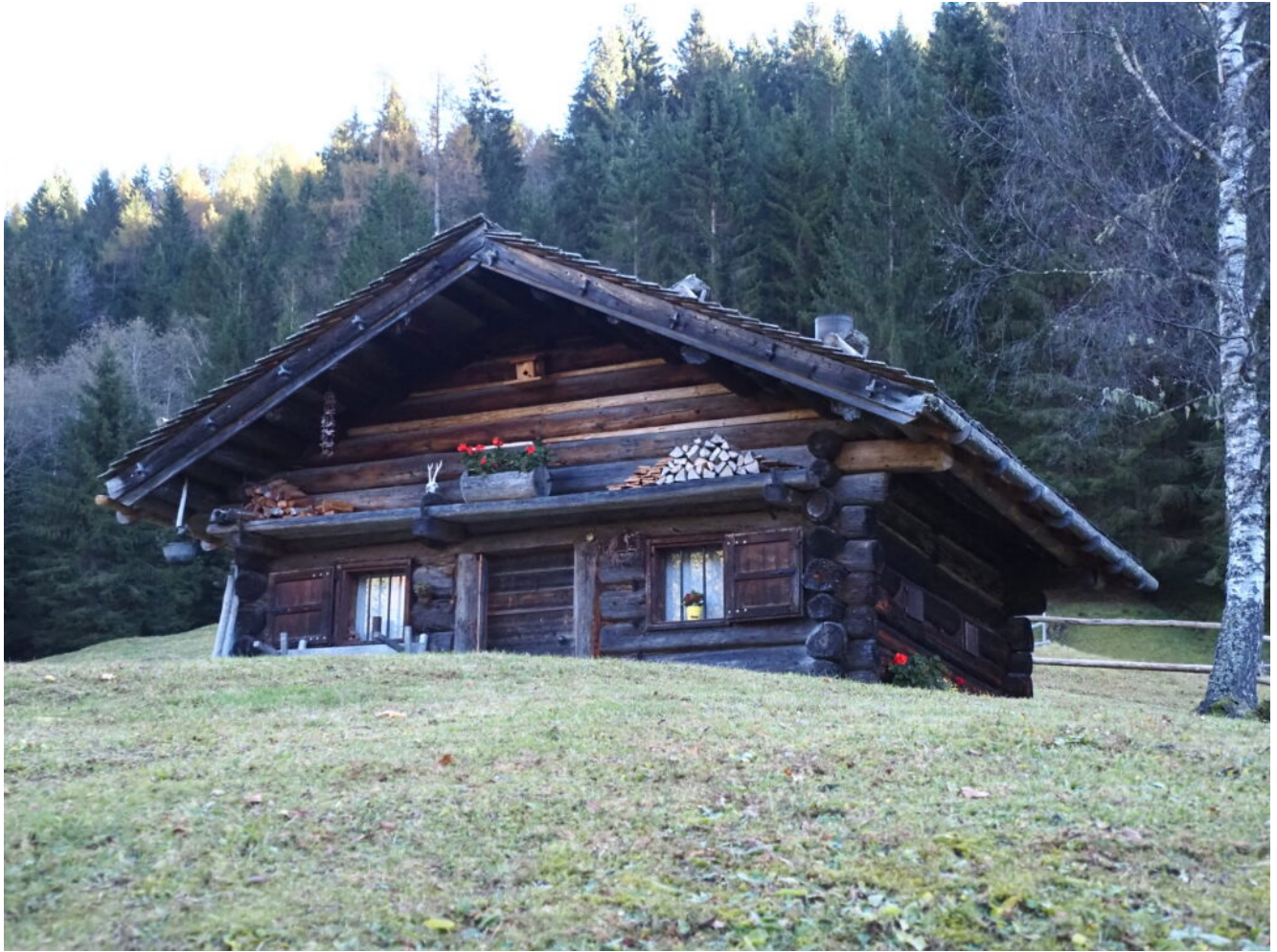
3- Uno dei primi masi.