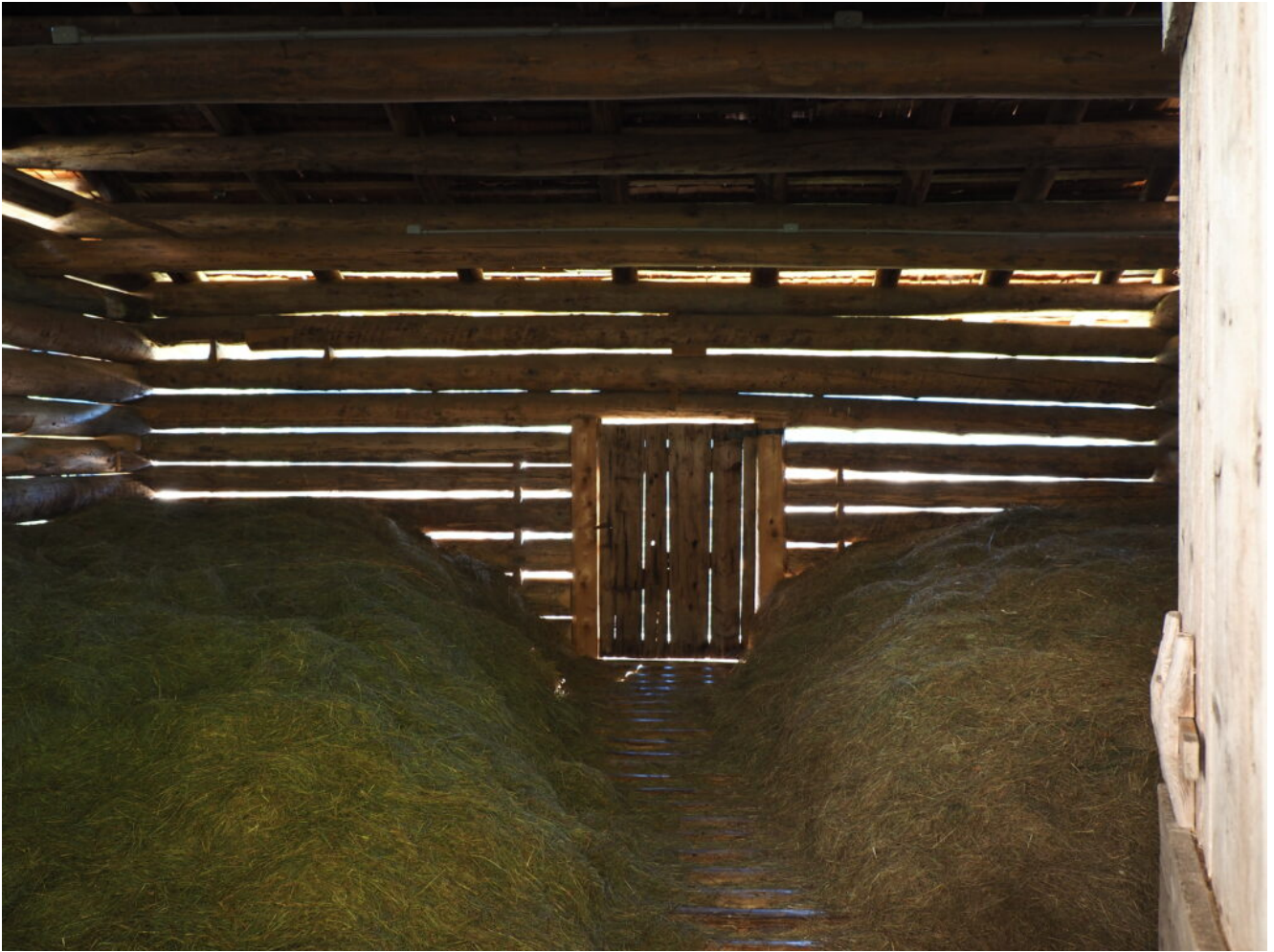
19- Il fienile