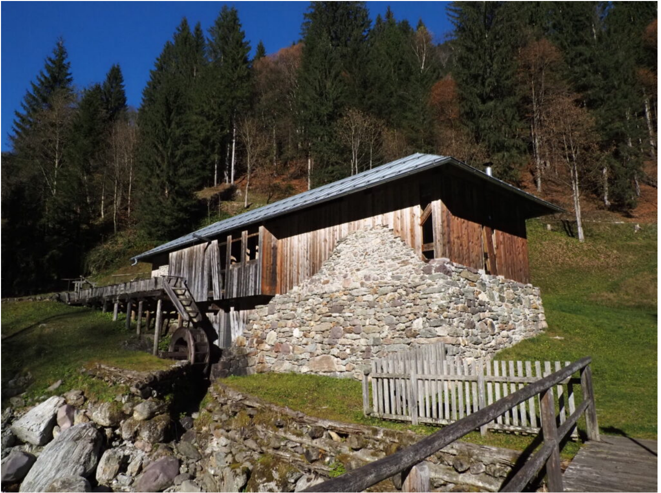
32- La vecchia segheria di Ponte Stel ancora in funzione per dimostrazioni turistiche.