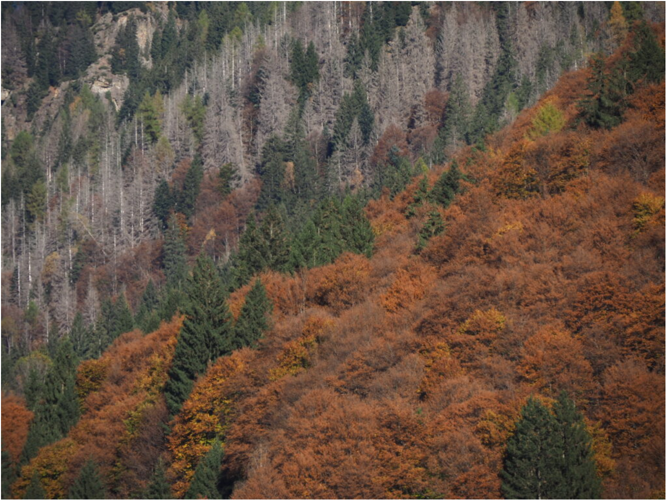
33- Bosco sopra l'abitato di Caoria attaccato dal Bostrico.