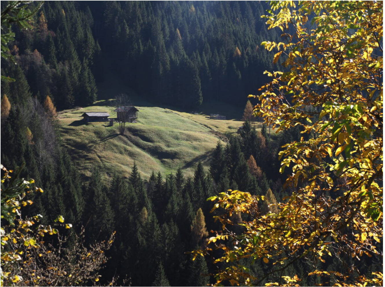
31- Veduta dal versante opposto della Malga della foto n.3