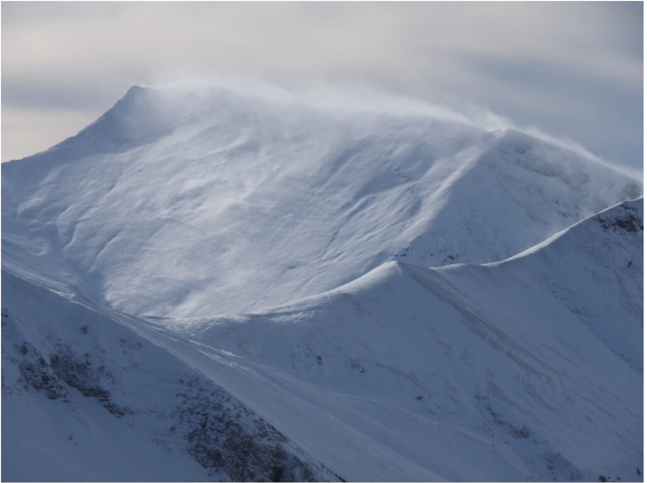
28- Il versante Est del Pizzo Berro con grandi turbinii di neve, i cosiddetti "Diavoli di neve" o Snownado.