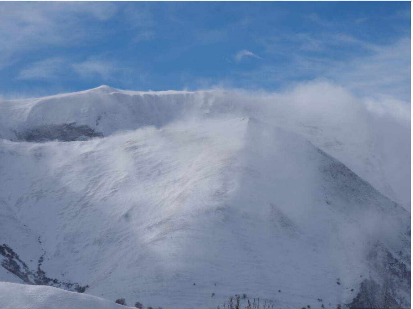
45- Ore 11.