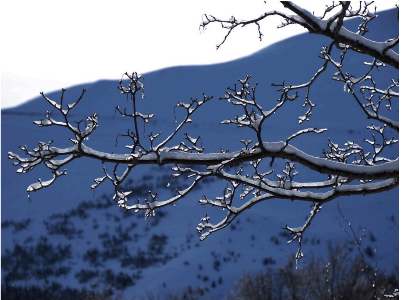
6 – 8 – Leggera Galaverna ai Piani Gra.