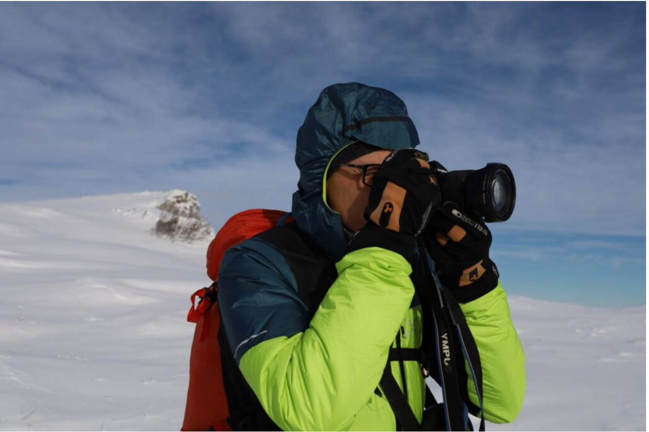
15- Ci soffermiamo a fare delle foto.