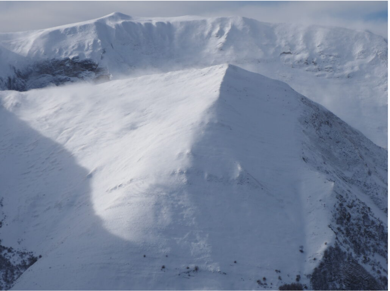
44- Ore 10.