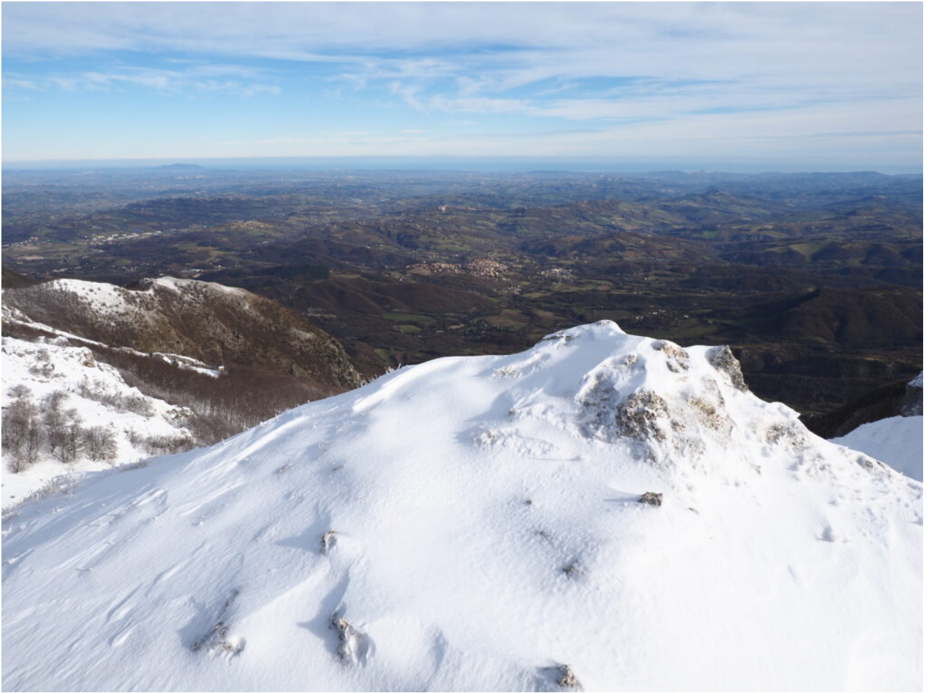
18- Veduta dal Monte Valvasseto verso il Mare Adriatico.