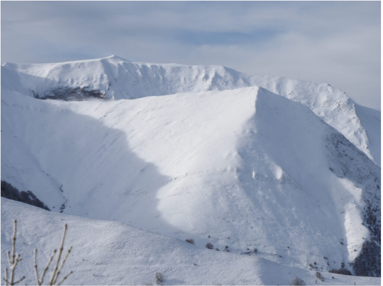
43- Punta Bambucerta a destra e Monte Rotondo sullo sfondo verso le 9.