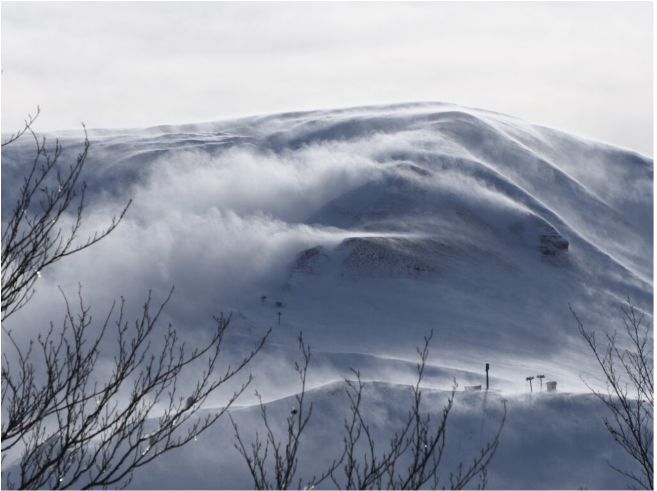
40- Situazione vista dai pressi della Pintura di Bolognola, tutto il monte è rivestito di neve sollevata dal vento.