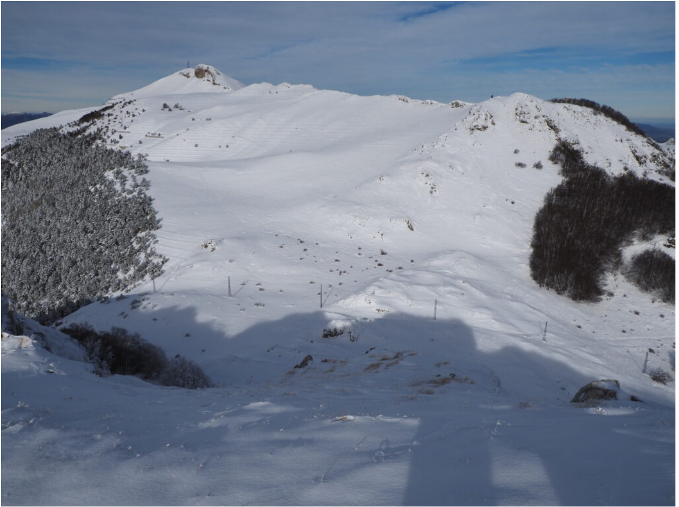
19- La lunga cresta del Monte Sassotetto.