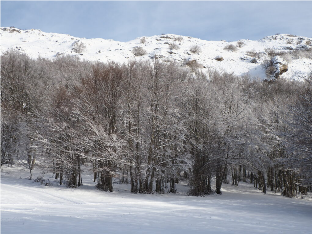
3- La faggeta dei Piani Gra.