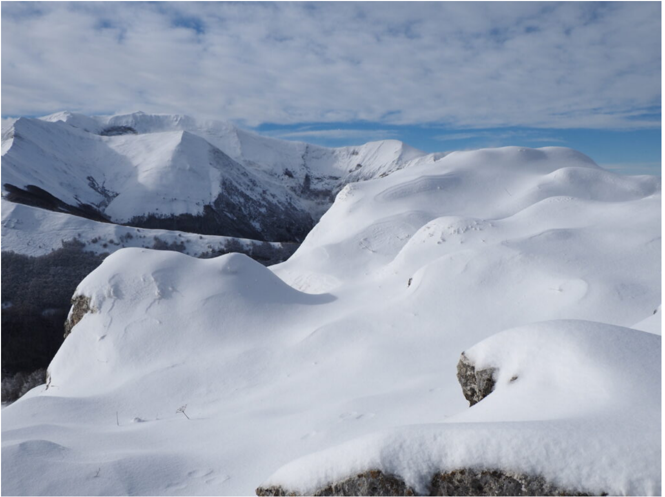
20- Veduta verso Ovest con il Monte Rotondo, sulla cima circa 20 centimetri di neve.