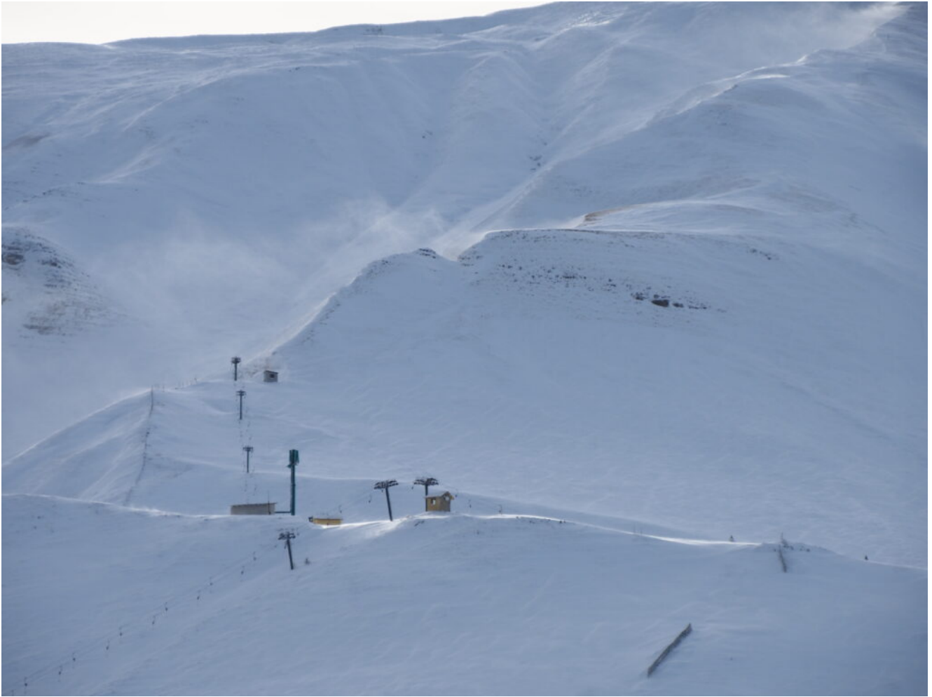
33- La cresta Est del Monte Castel Manardo sopra all' intaglio della Porta di Berro (Campi da sci di Bolognola), verso le 9, lieve brezza in cresta.