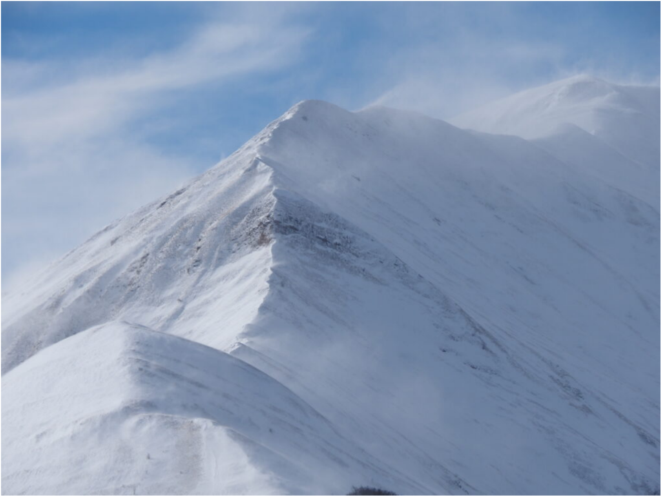
42- La stessa cresta verso le 11.