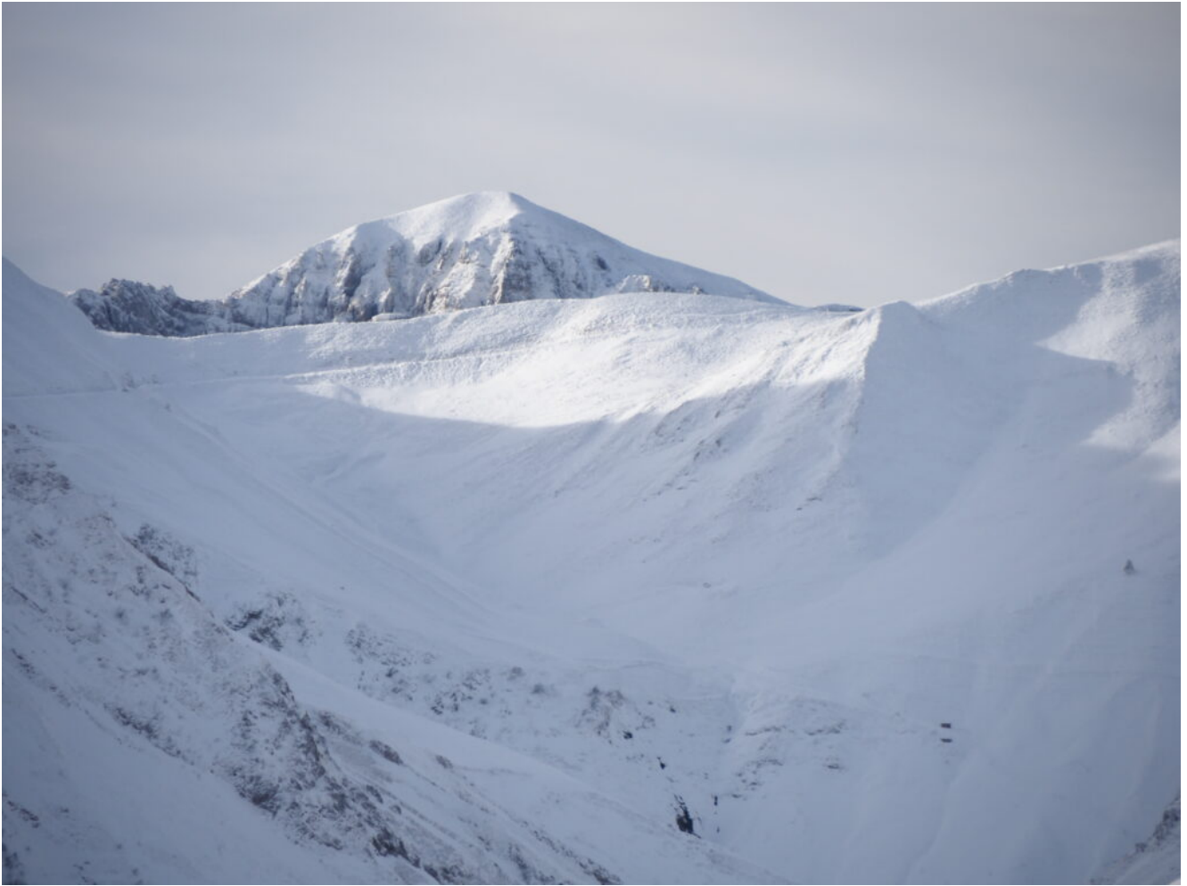
31- La Forcella del Fargno con il Rifugio omonimo e il Monte Bove Nord.