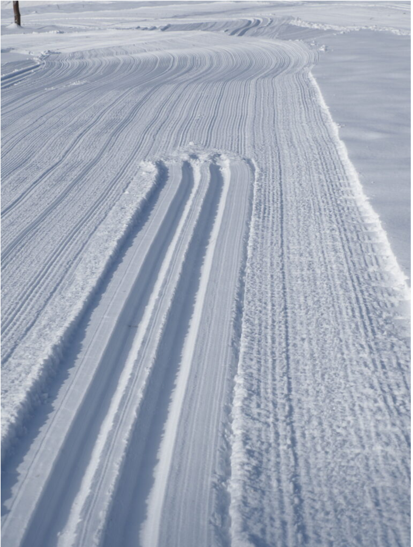
4 – 5- La pista da fondo era già battuta.