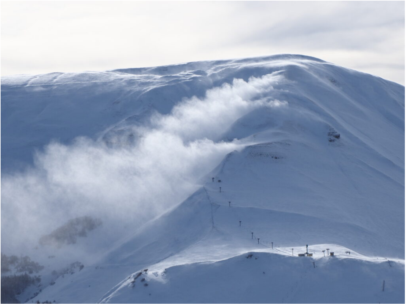
37- Ore 11.