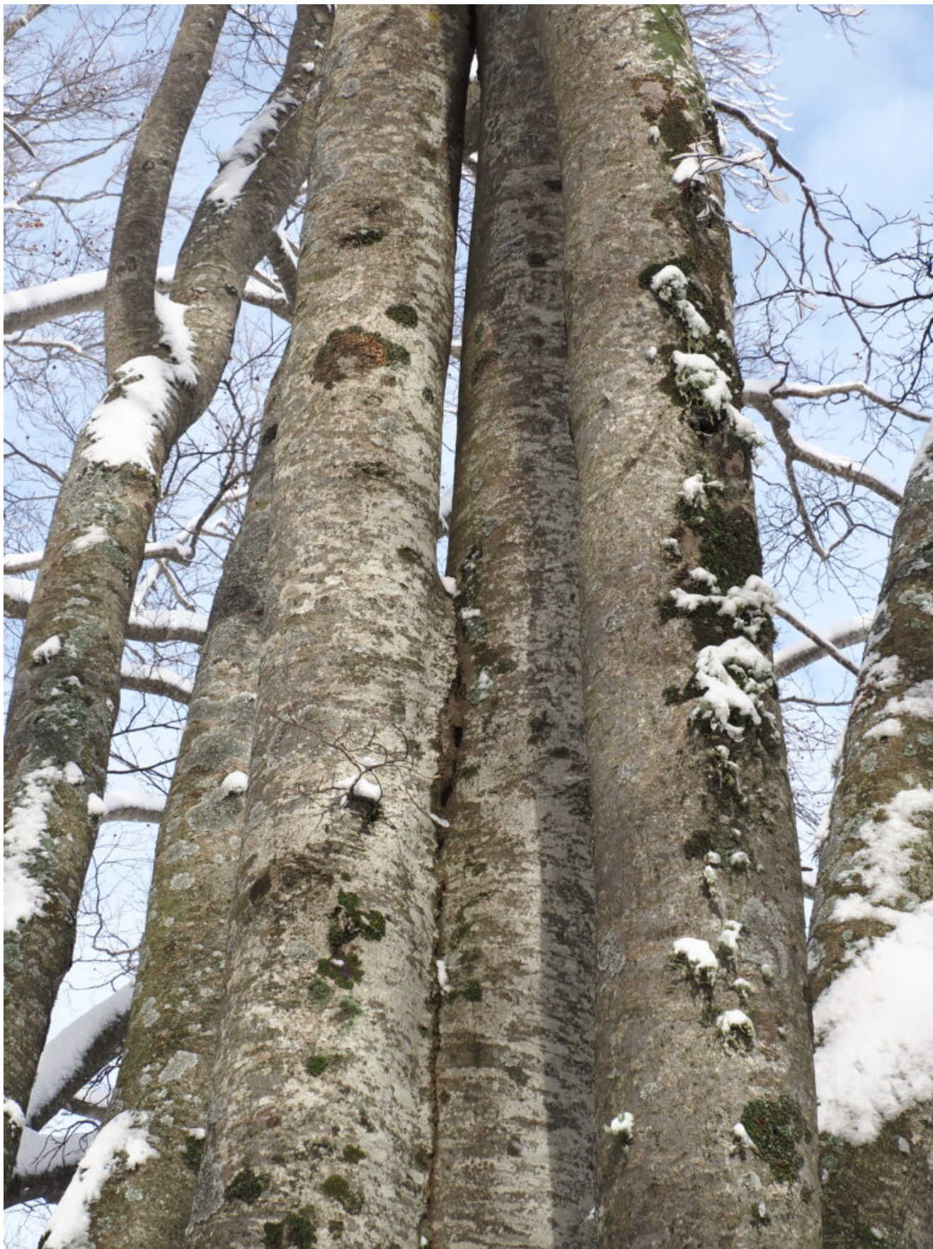
26- Faggi "siamesi" nella faggeta dei Piani di Pao.