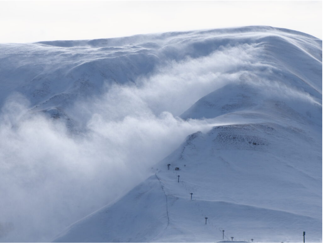
39- Ore 12.