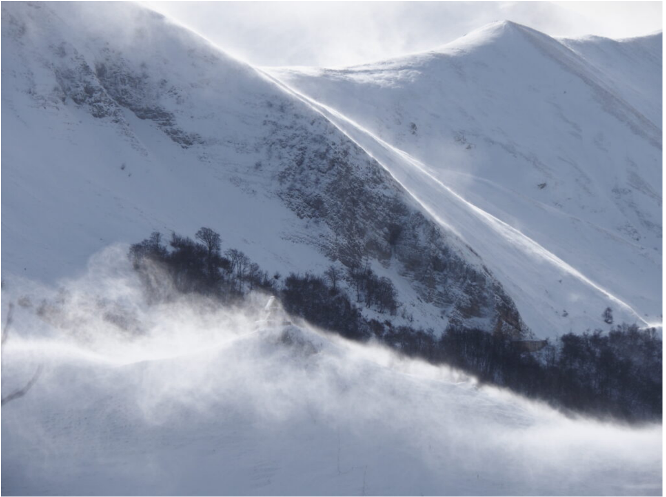
48- La Madonnina della Pintura di Bolognola alle ore 12.