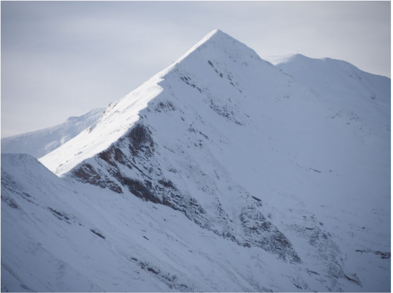
29- Monte Acuto e Pizzo Tre Vescovi al mattino presto.