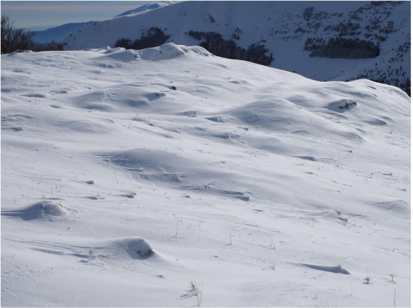
13 – 14 – Verso la sommità del Monte Valvasseto