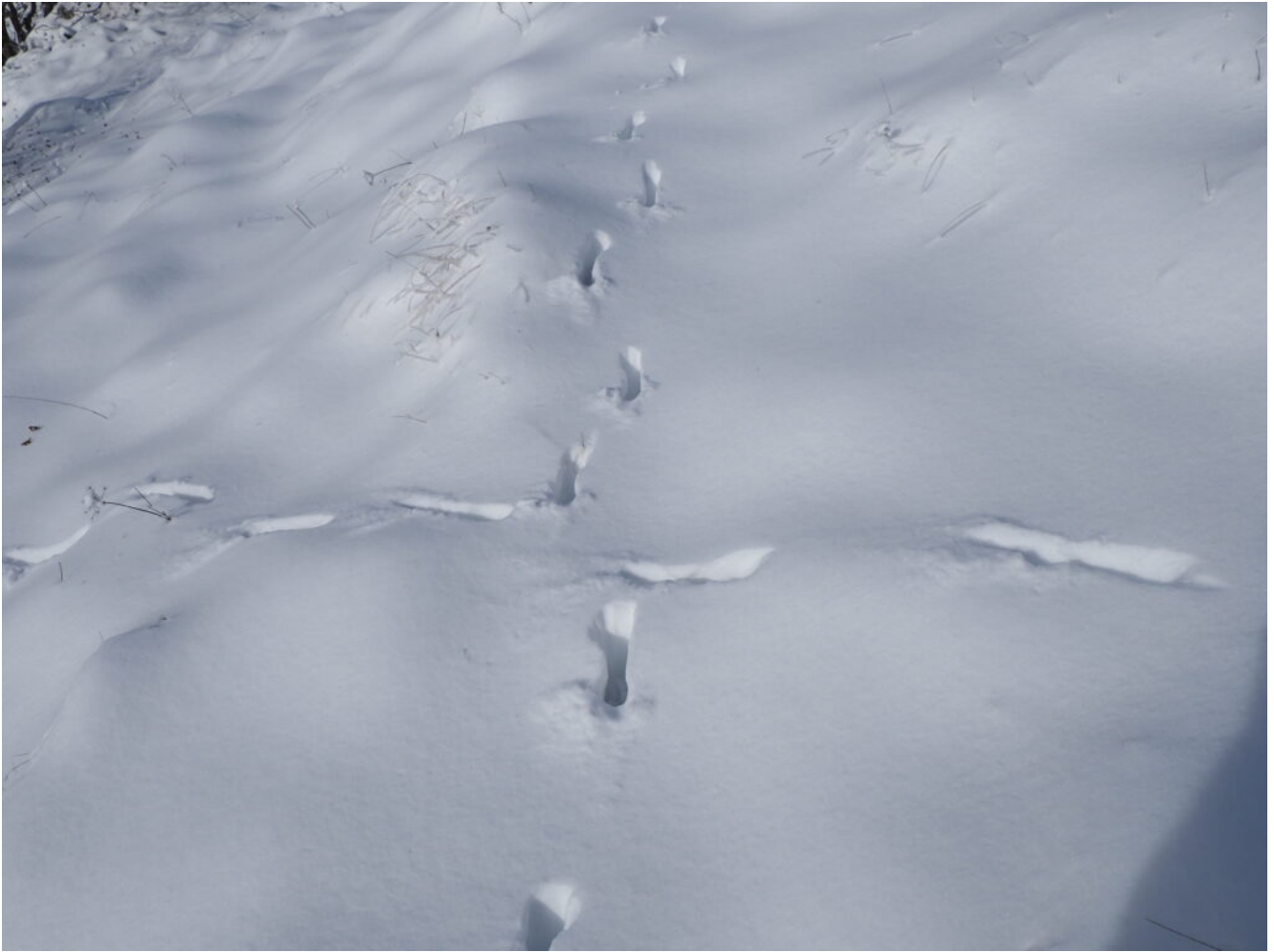
12- Incroci di volpe e capriolo.