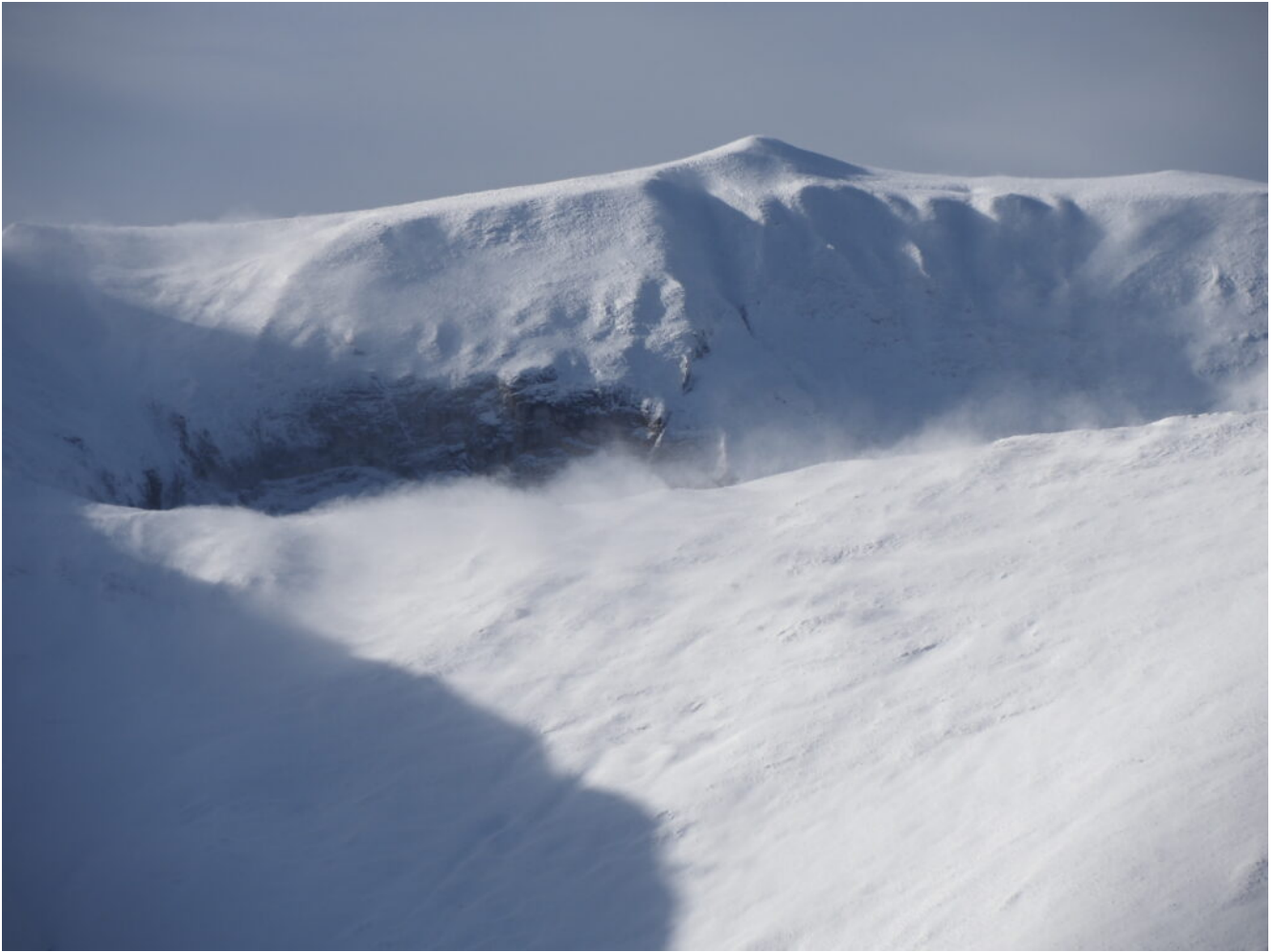
46- Zoom sulla stessa cresta, ore 10.