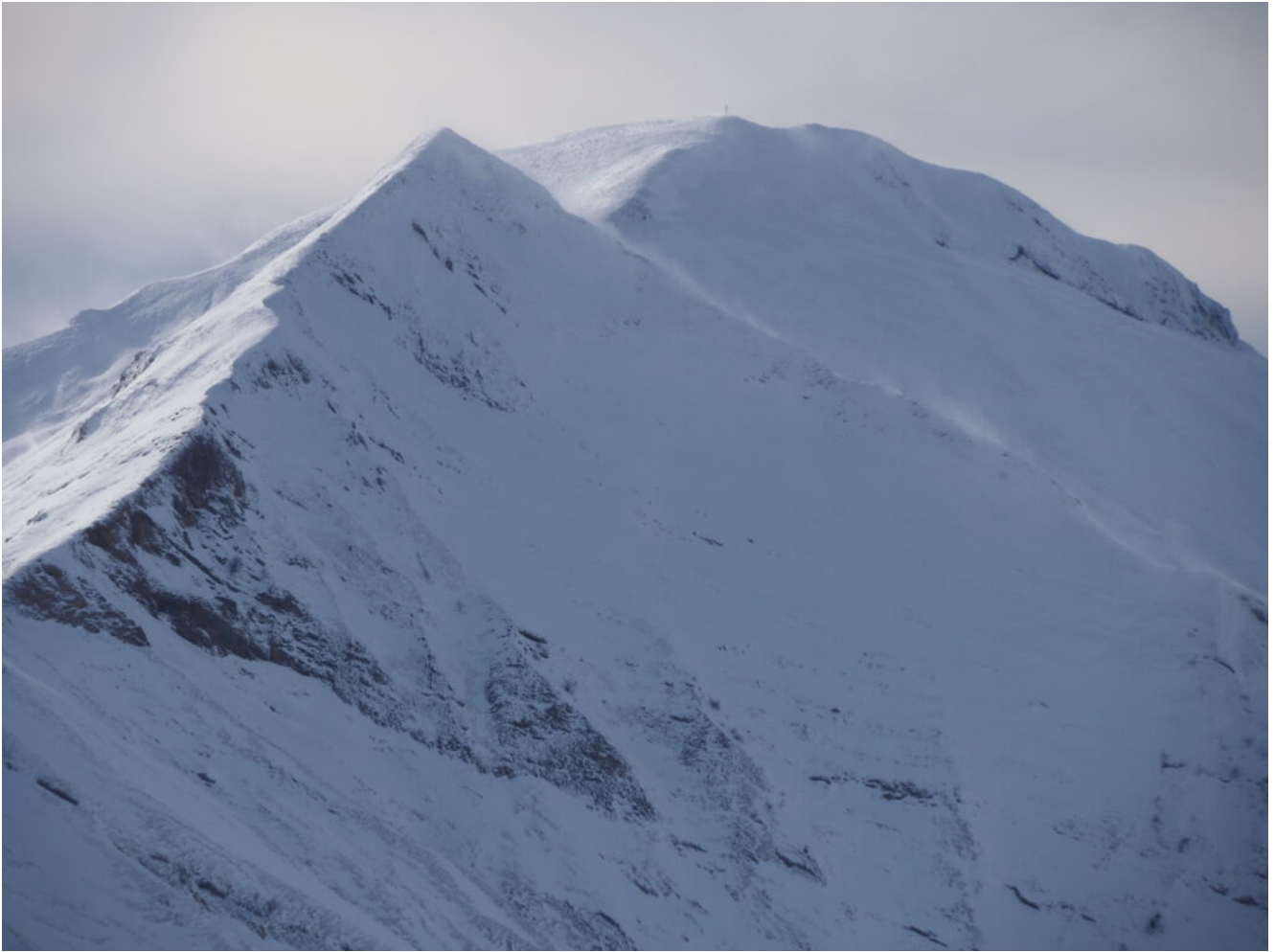
30- Monte Acuto e Pizzo Tre Vescovi dopo neppure due ore.