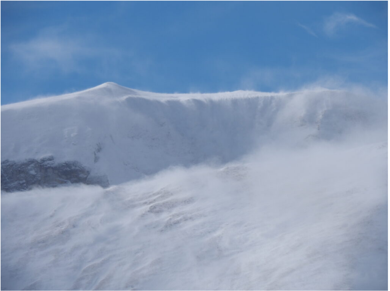
47- Stessa inquadratura della foto 48 alle ore 11.