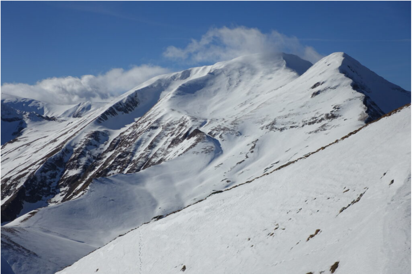
27 – Il Monte Acuto ed il Pizzo Tre Vescovi visti dalla cresta di discesa.