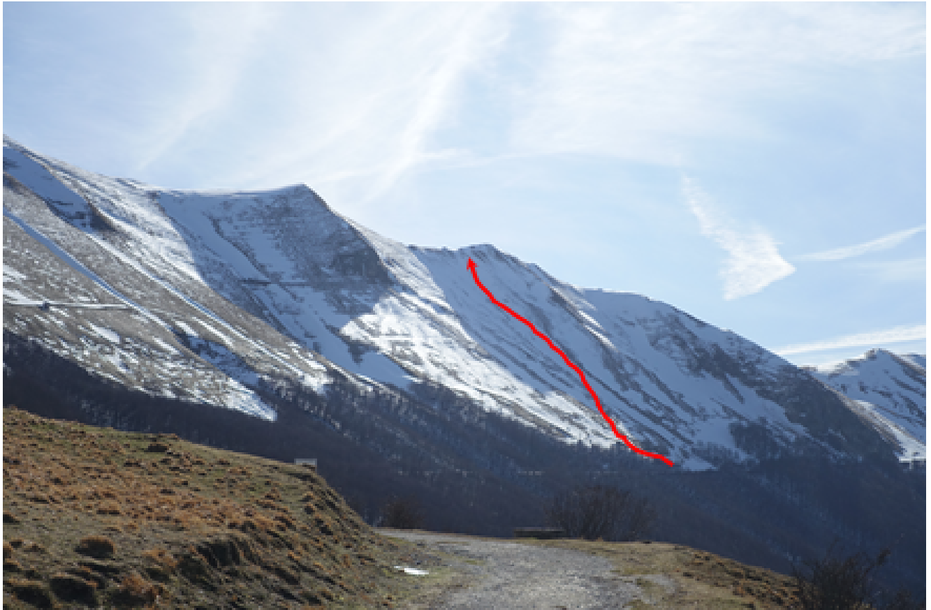
31- Il canale destro dello Scoglio del Montone visto dalla Pintura di Bolognola.