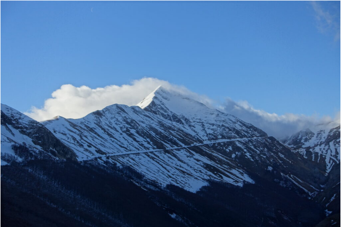
1- Il Monte Acuto visto dalla Pintura di Bolognola.