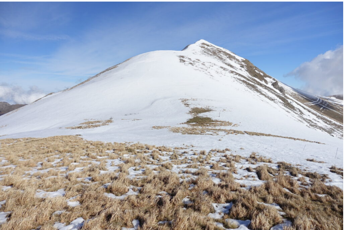
30- Lo Scoglio del Montone visto da Forcella Bassete.