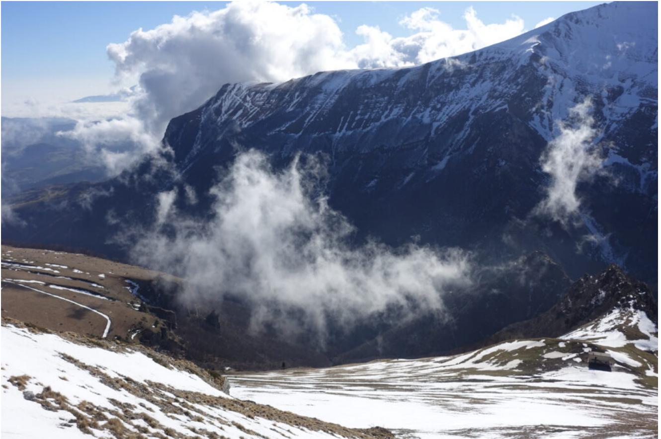
18- Il Pizzo e la Valle dell'Ambro.