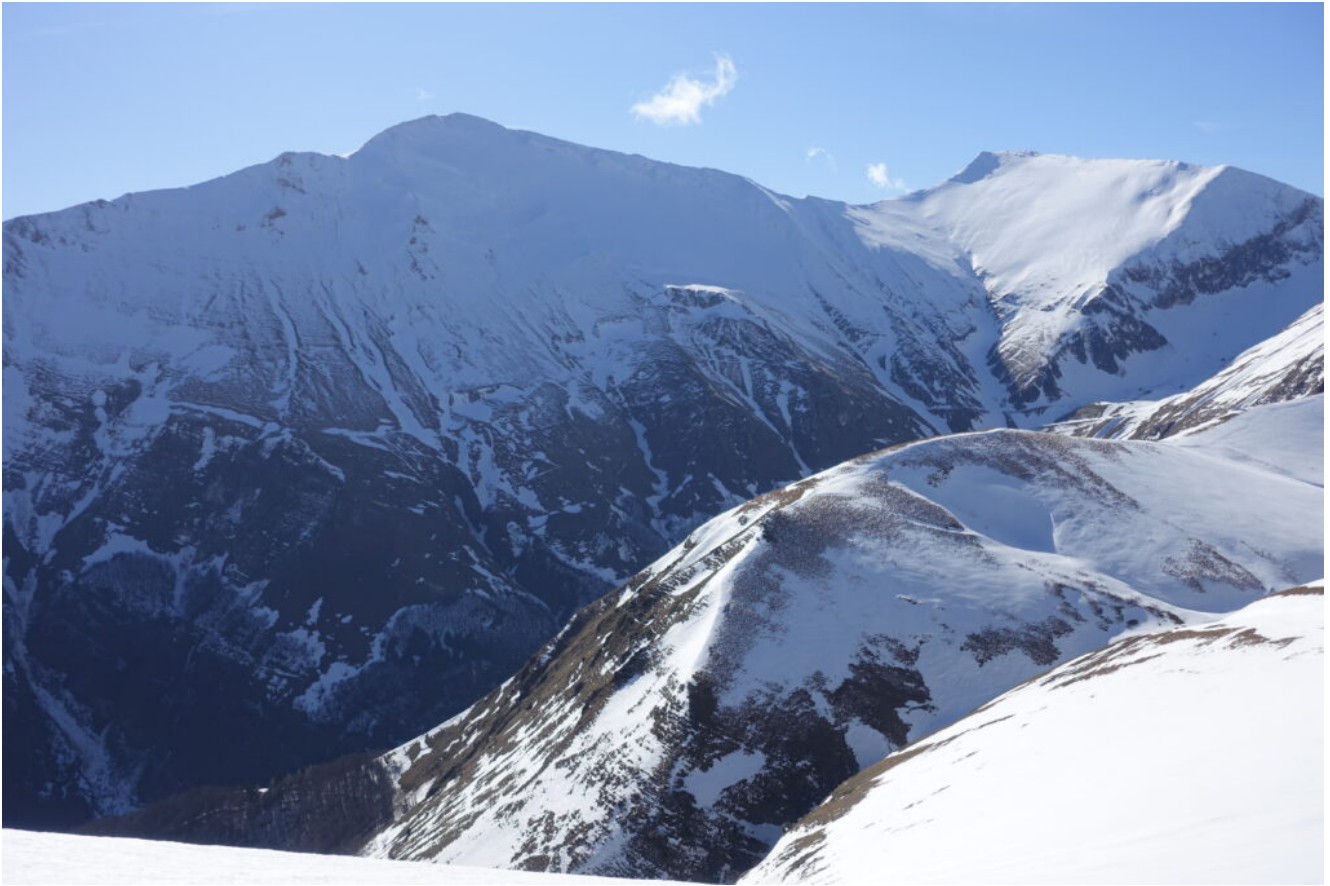
25- Il Pizzo Regina a sinistra e il Pizzo Berro a destra.