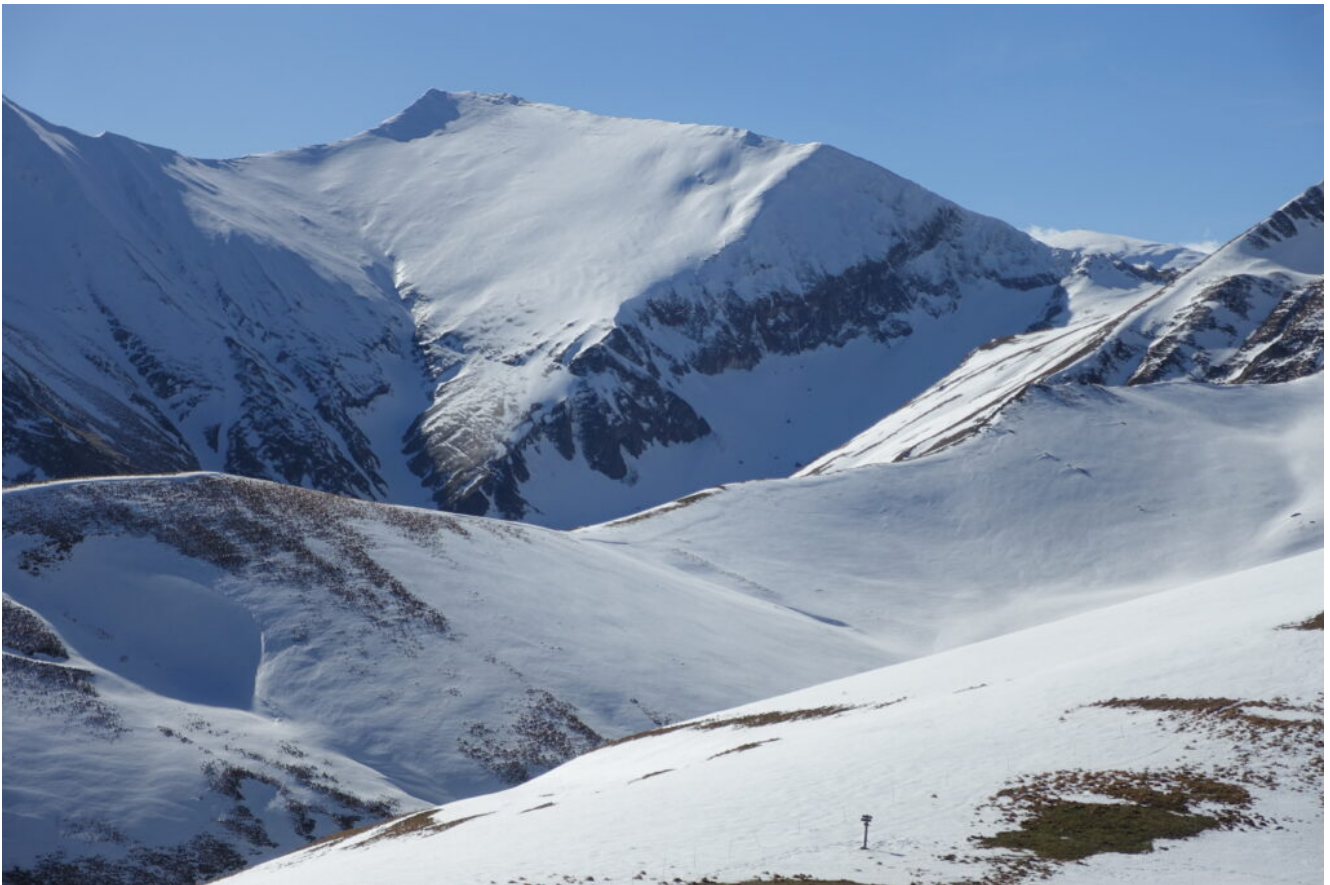
26- Il Pizzo Berro.