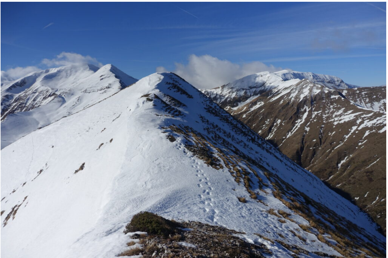
19 – 20- La cresta con il M. Rotondo a destra ed il M. Acuto e Pizzo Tre Vescovi a sinistra