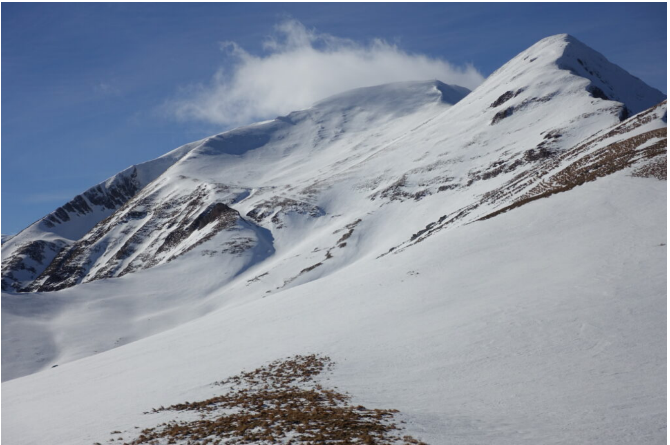
28- Il Monte Acuto ed il Pizzo Tre Vescovi visti dalla Forcella Bassete.