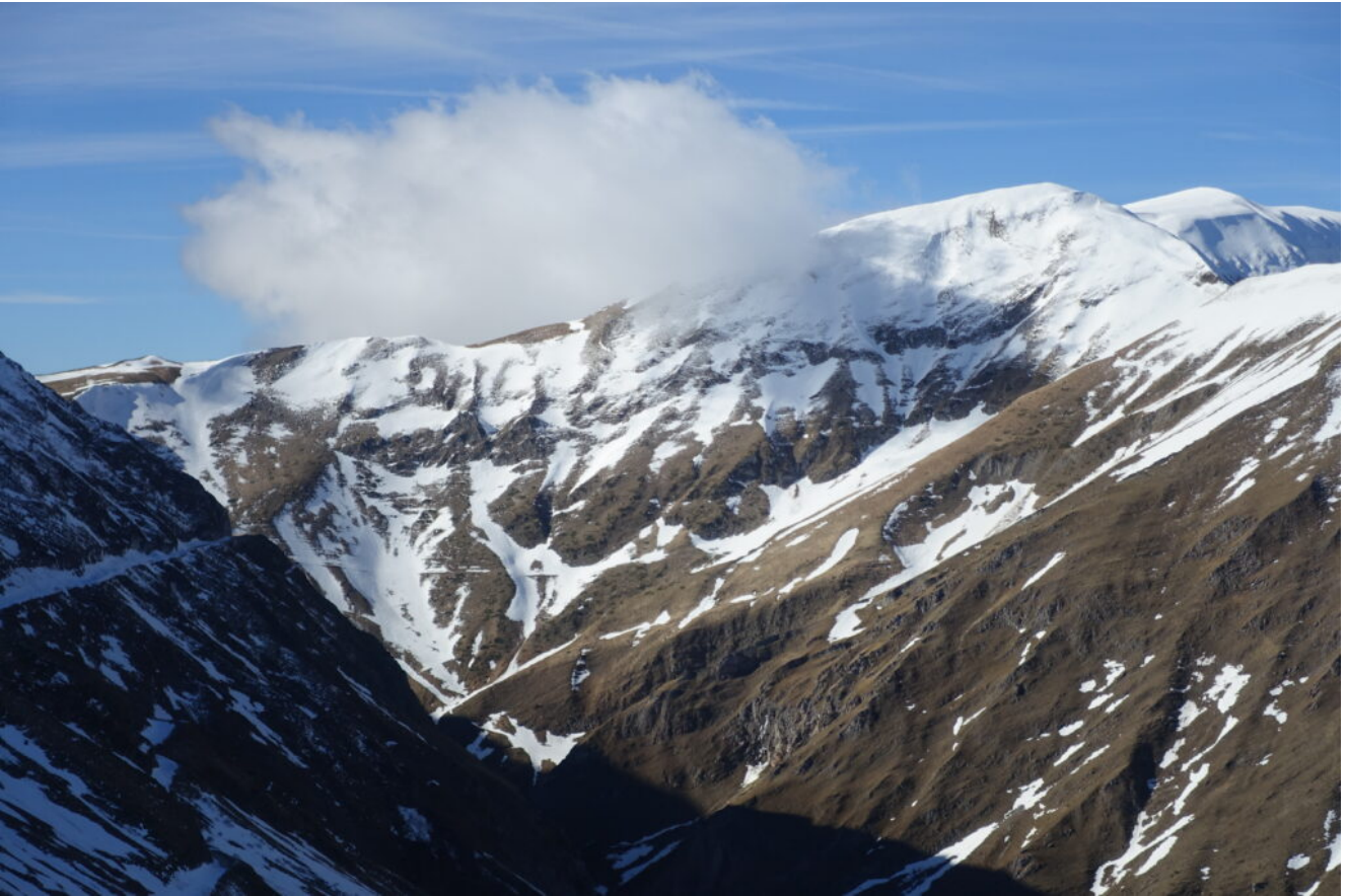
29- Il Monte Rotondo visto da Forcella Bassete.