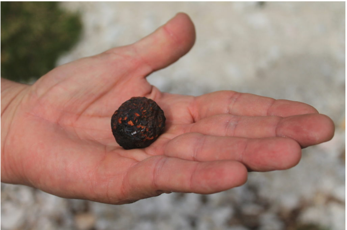
4- Un nodulo di pirite limonitizzata.