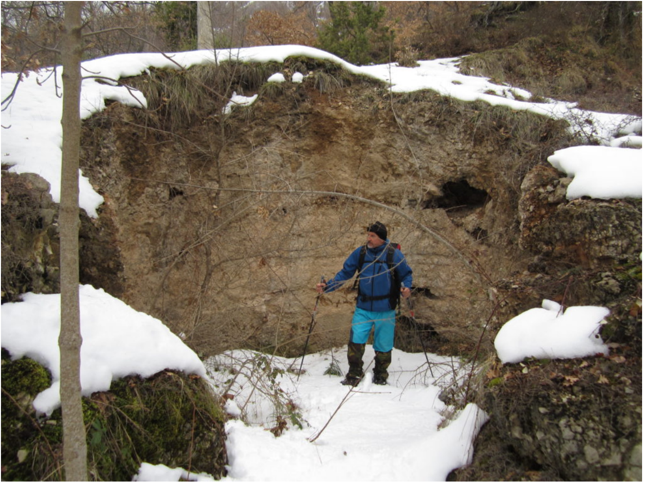
13- Il sito circolare intagliato nella roccia presente a pochi minuti a piedi da Casali.