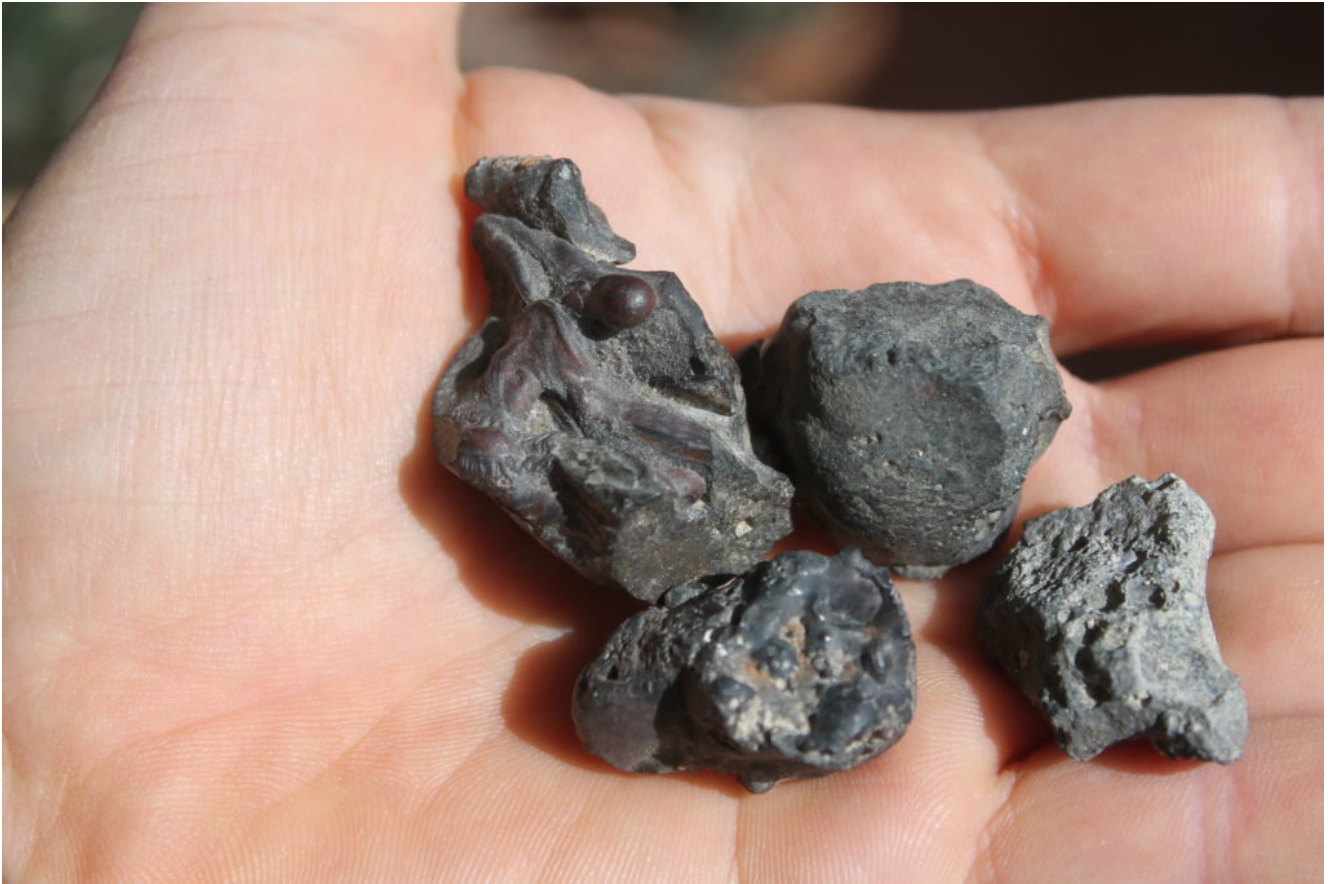
14- I frammenti di scorie ferrose, nel frammento maggiore si nota nettamente il suo aspetto di materiale fuso