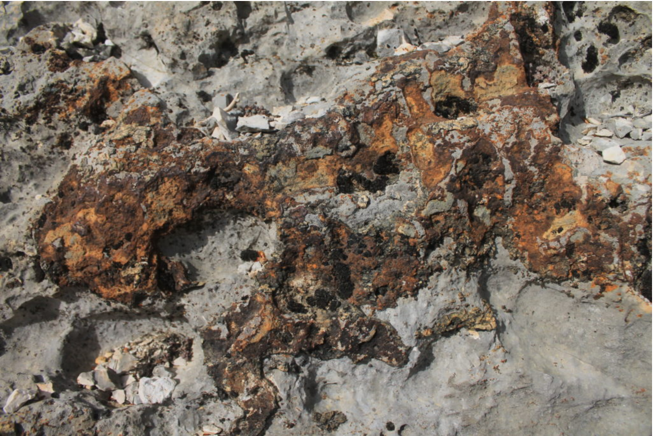
5- Incrostazioni ferrose nella parte alta delle placche.