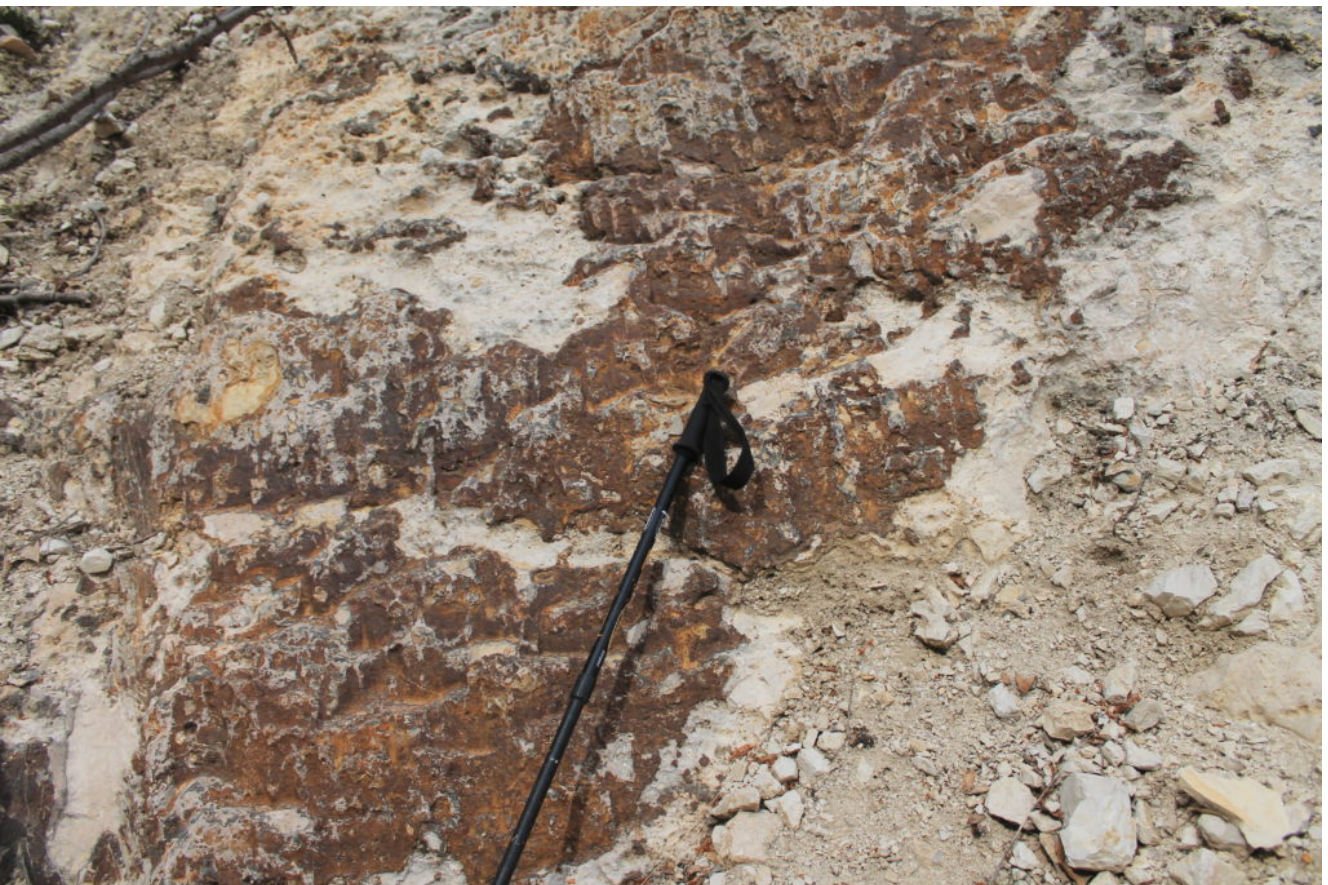
6- Incrostazioni ferrose parzialmente staccate nella parte bassa delle placche.