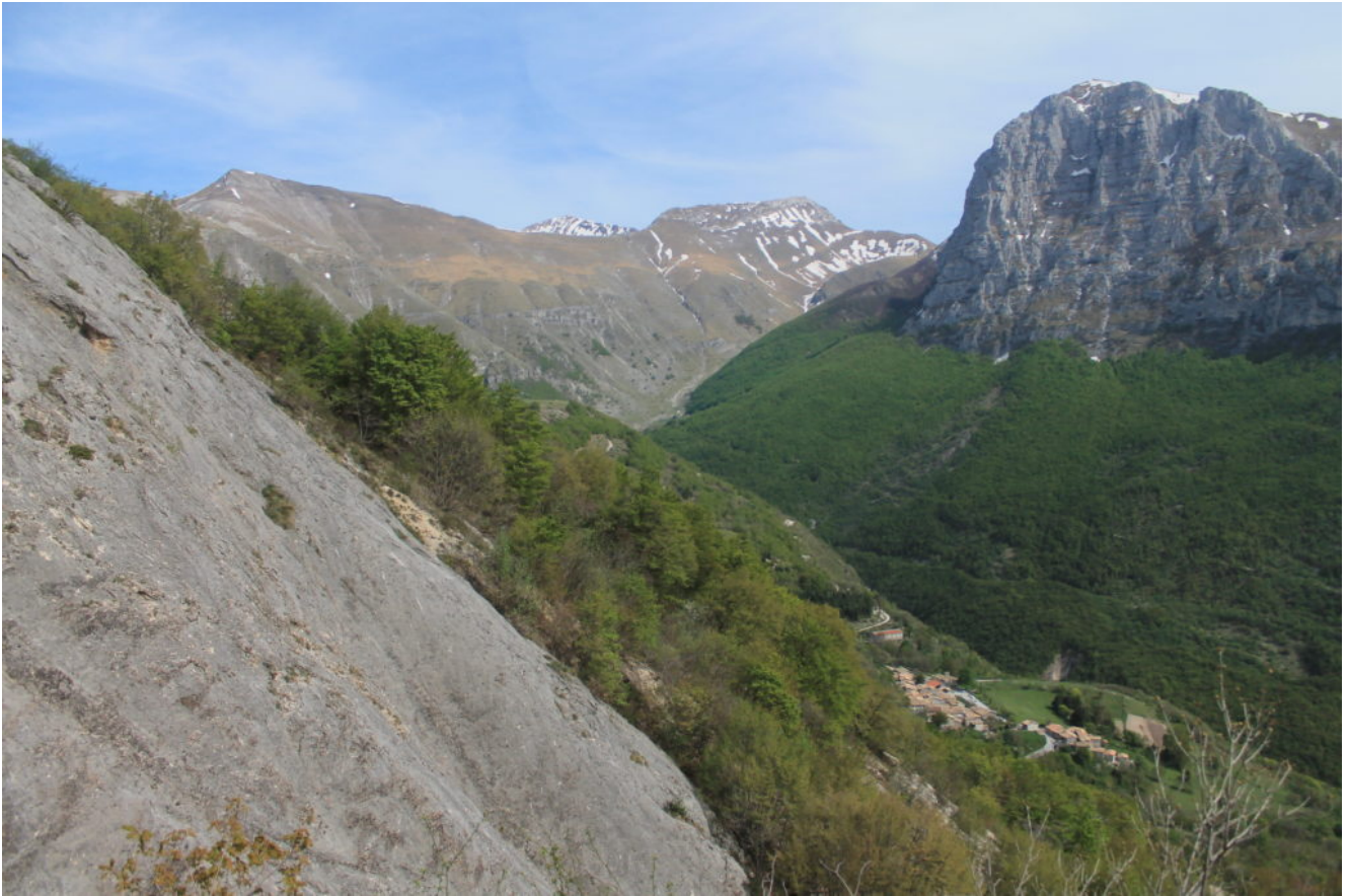
3- Il panorama dal Fosso di S. Simone spazia dal Pizzo Tre Vescovi a sinistra, il Pizzo Regina, il Pizzo Berro ed il Monte Bove Nord a destra.