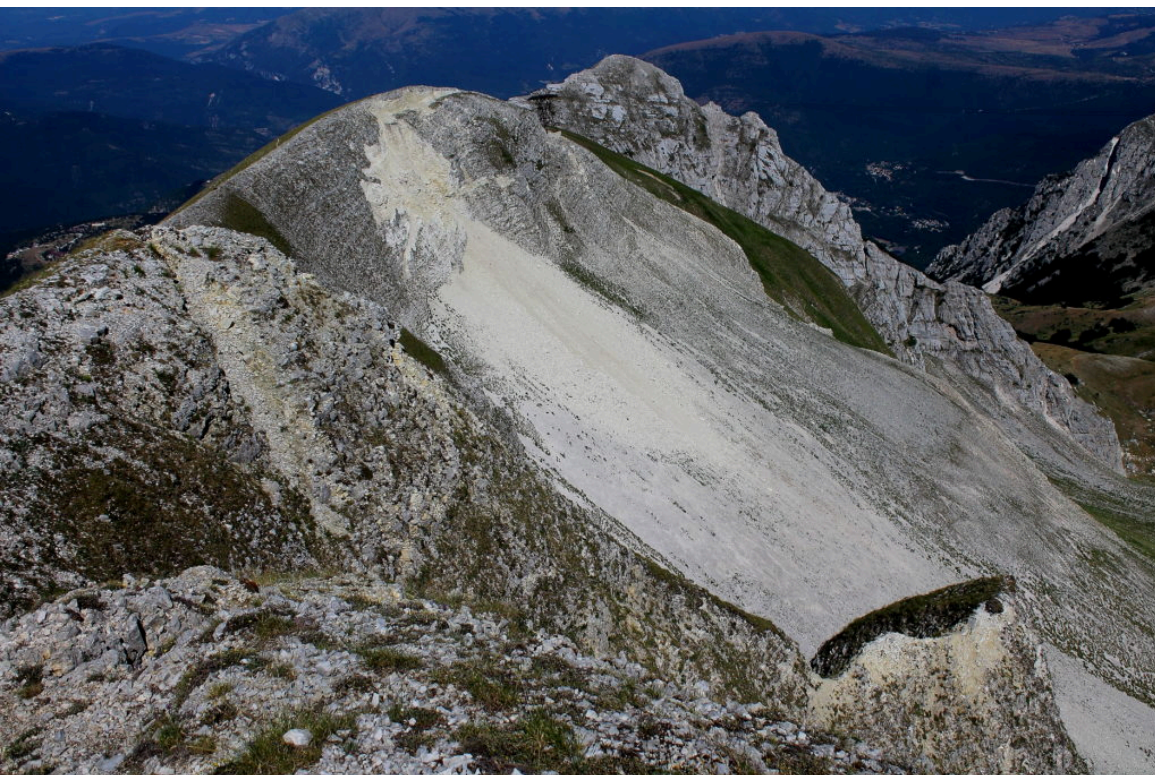
13- La frana osservata dalla cresta verso il Monte Bove Sud.