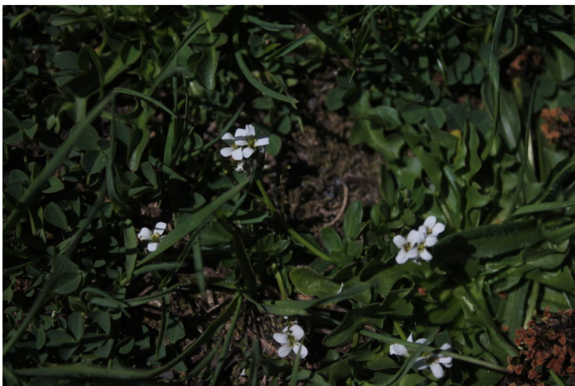
15- Arabis surculosa , piccolissima e rara pianta (probabile