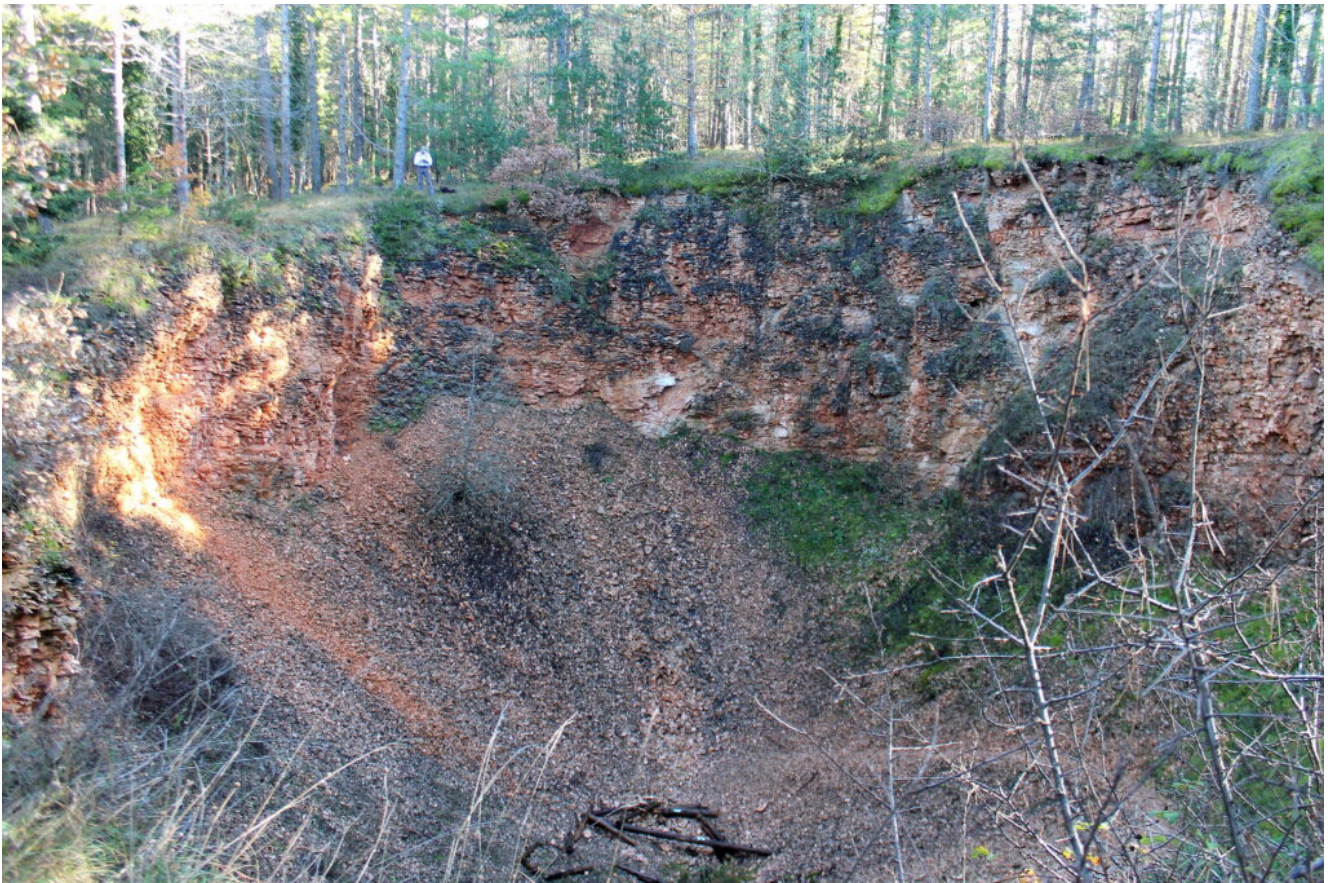
10- La Buca, si noti le dimensioni con la mia figura in maglia bianca, sul bordo a sinistra.