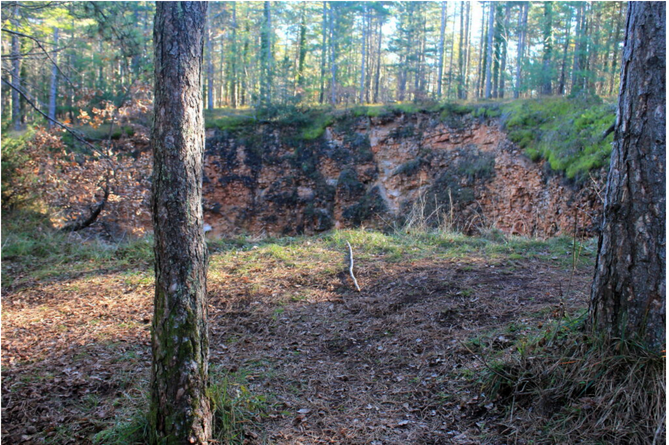
9- Dalla pineta all'improvviso si apre la voragine circolare della Buca del Terremoto.