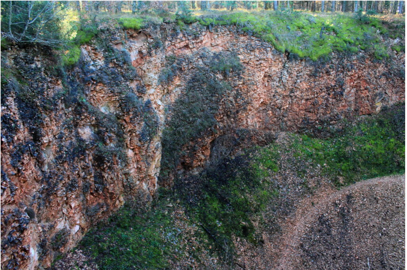
11- Le verticali pareti di scaglia rossa del lato Nord piene di muschi che compongono la Buca.