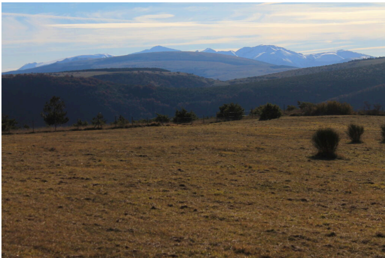
1- I Monti Sibillini visti dai prati intorno alla Madonna

RITORNO: Stesso itinerario. Dopo aver superato per 100 metri la chiesa della Madonna della Neve è possibile prendere la sterrata a destra in netta salita e raggiungere la base delle grandi pale eoliche ed arrivare fino alla sommità del Monte d'Aria caratterizzata da numerosi ripetitori.