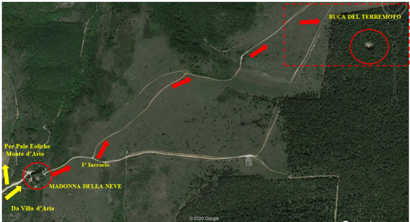
20- Dettaglio del secondo tratto del percorso, da compiere a piedi.