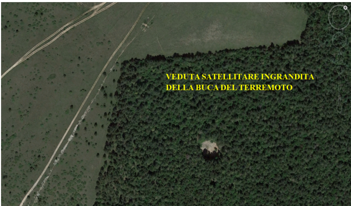
21- Dettaglio satellitare della parte tratteggiata in rosso della foto n.19 della Buca del Terremoto.