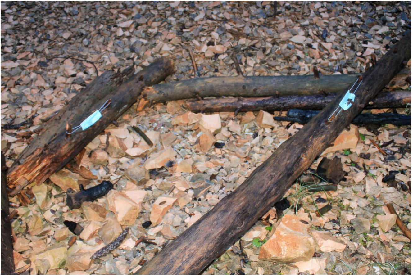
15- Alcuni tronchi caduti nel fondo della Buca dove qualche cretino ha lasciato due mascherine, la stupidità umana non ha limiti.