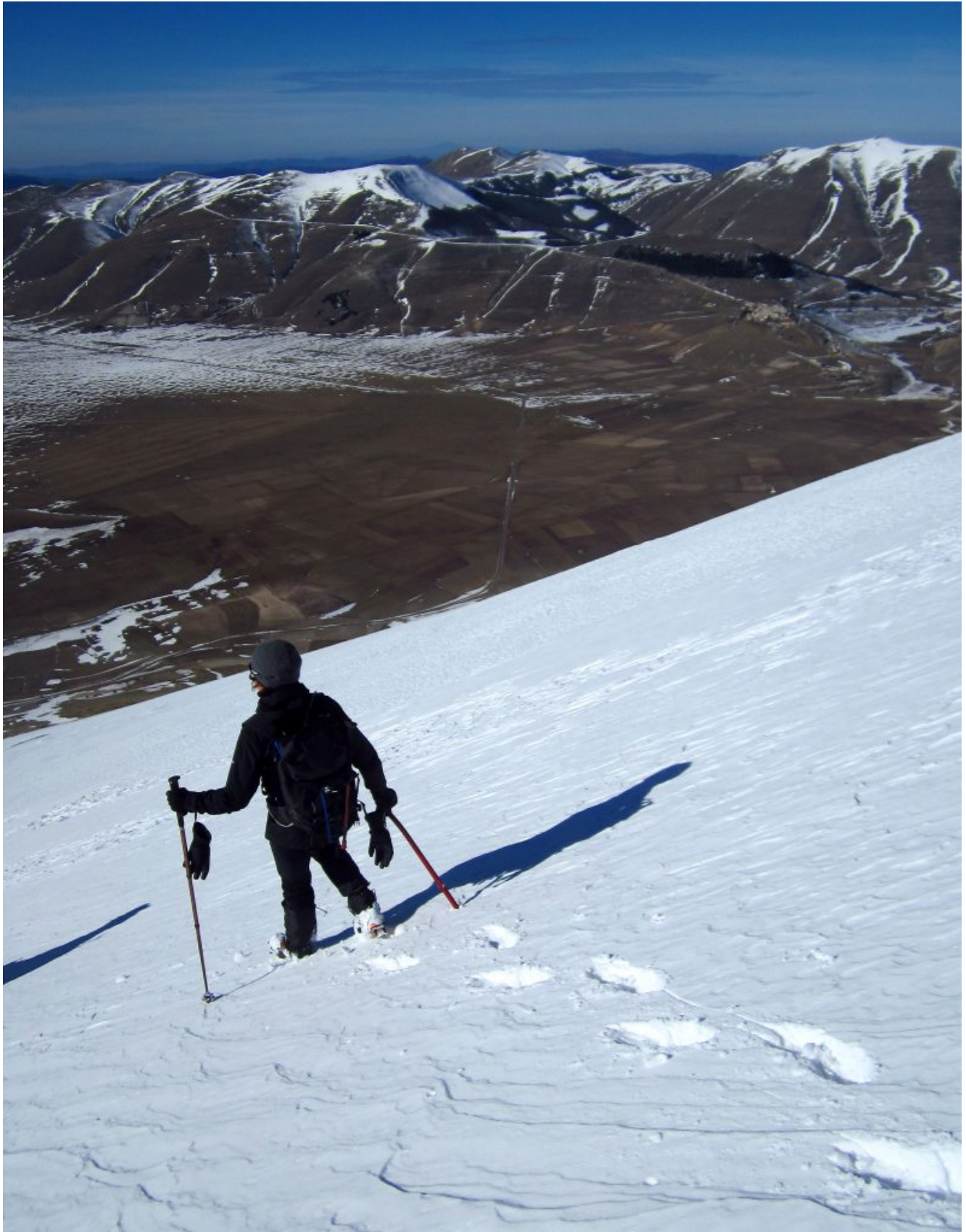
18- Rapida discesa su neve fresca, a destra il paese di Castelluccio senza neve.