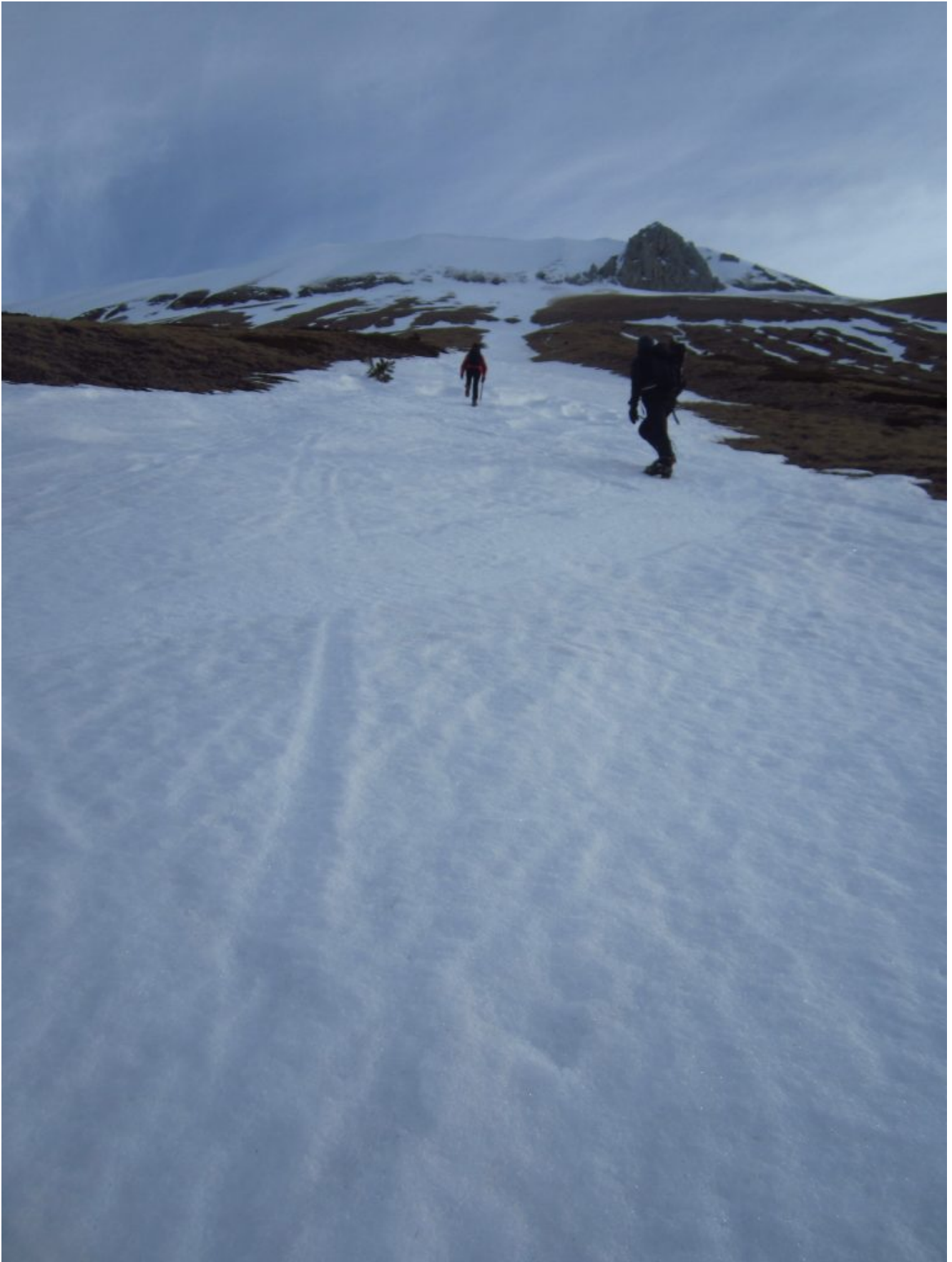
1- 2- Il canale di salita, l'unico con neve continua fin dalla strada, in alto a destra lo Scoglio dell'Aquila.