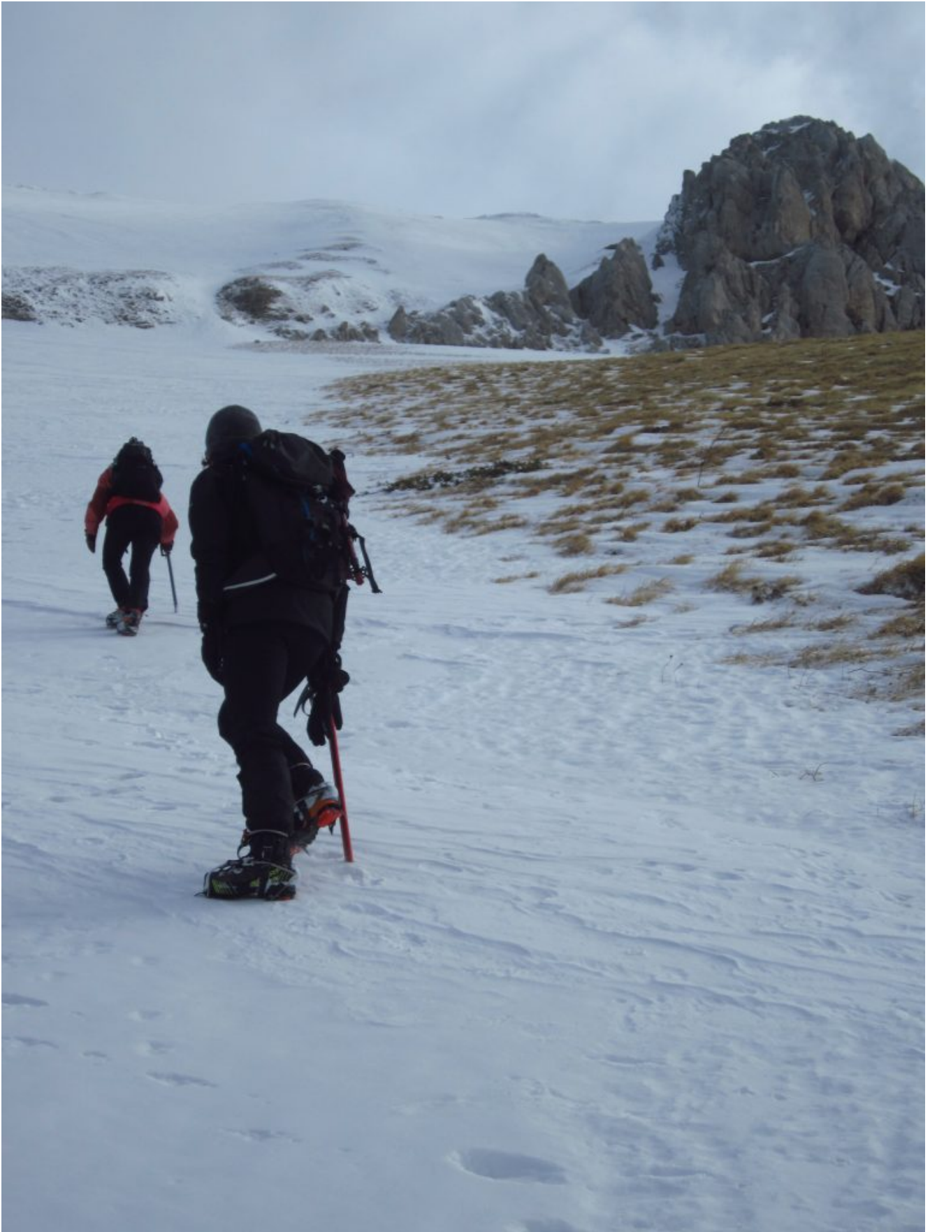
5 – 6- Fasi di salita