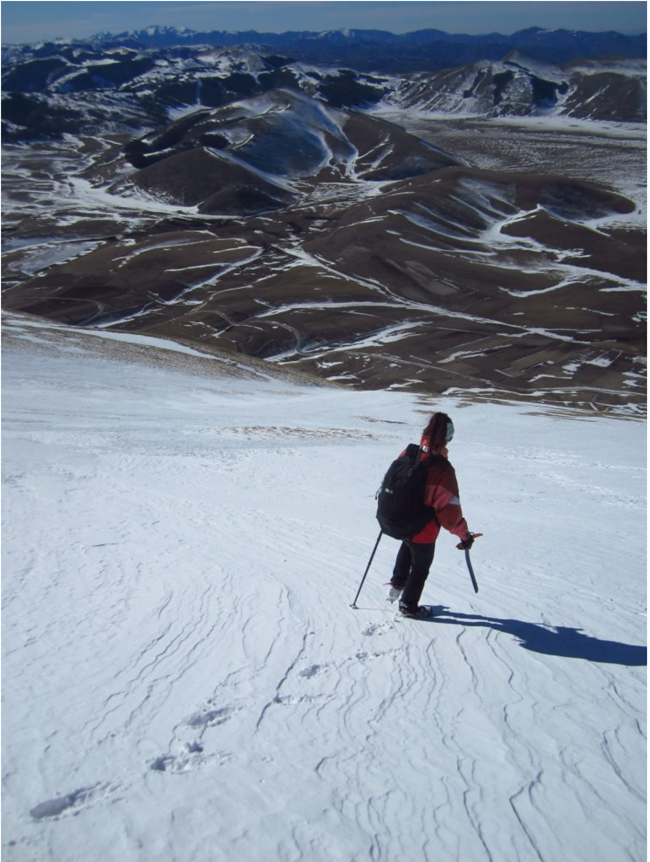
19 – 20- Discesa in scivolata su neve ammorbidita.