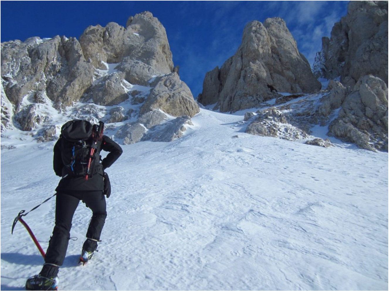
13- Alla base del Canale di San Benedetto.