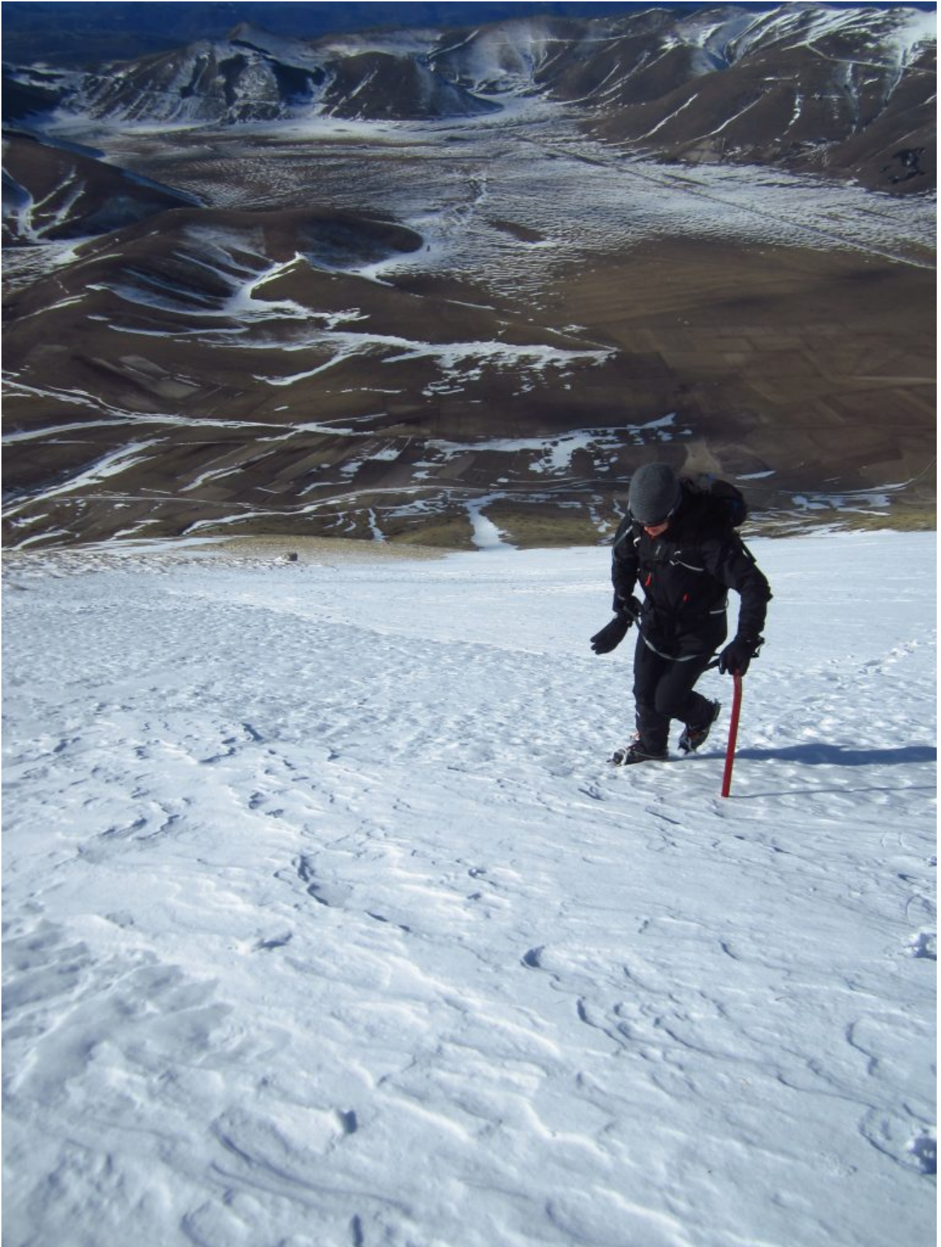
11- 12- Ci avviciniamo alla base dell'Scoglio dell'Aquila, sullo sfondo il Piano Grande praticamente senza neve.