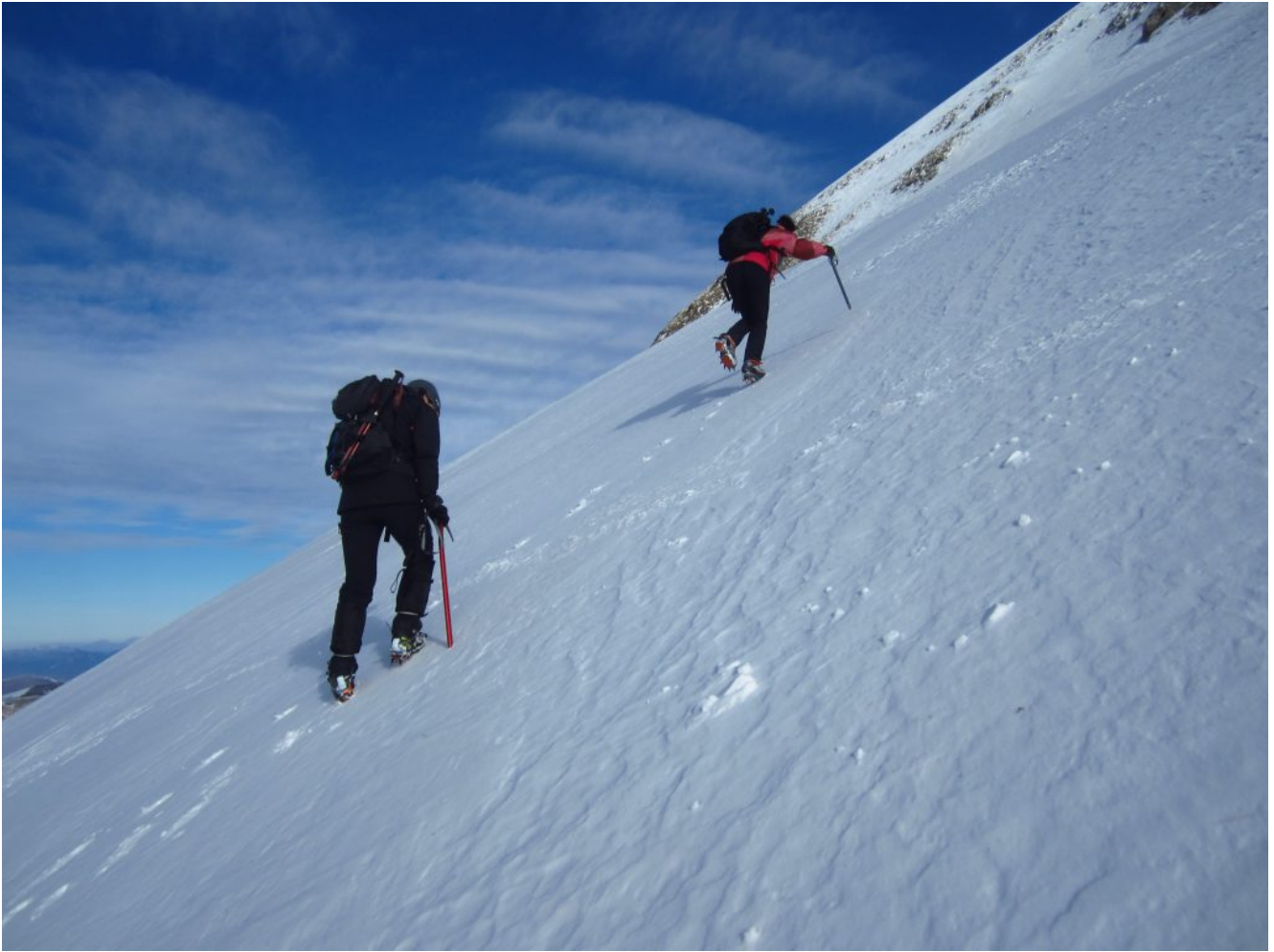
8- 9- 10- Il tratto più ripido alla base del Cordone del Vettore