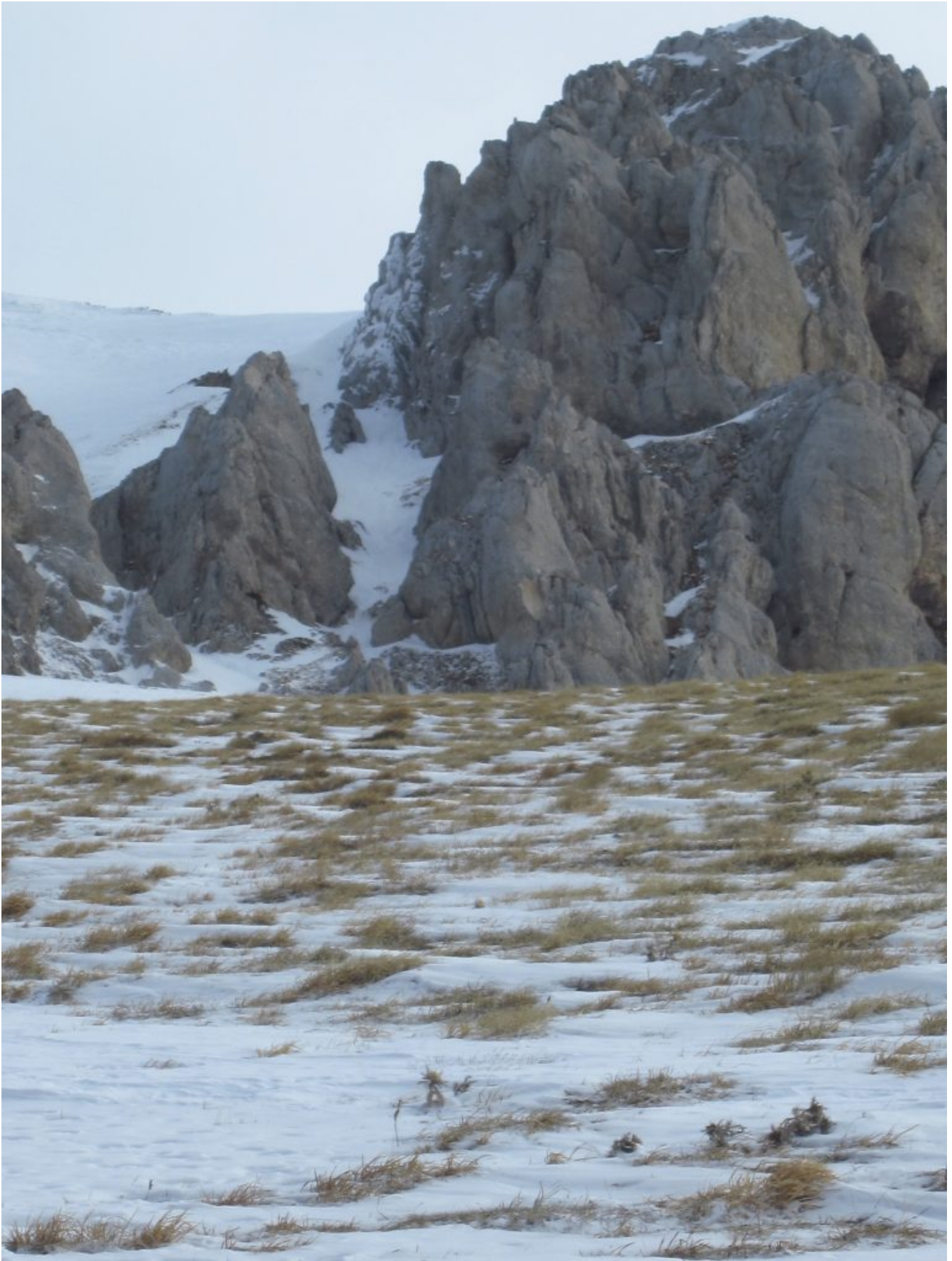
7- Lo Scoglio dell'Aquila con il canale di San Benedetto, diventata ormai una salita classica invernale "grazie" ai social.