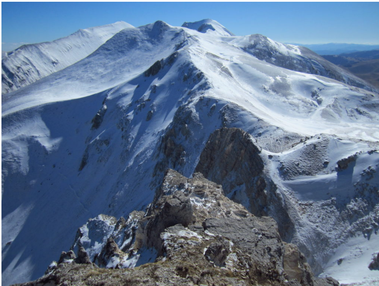
21- Il gruppo Sud del Monti Sibillini visto dalla cima di sacco di Palazzo Borghese.