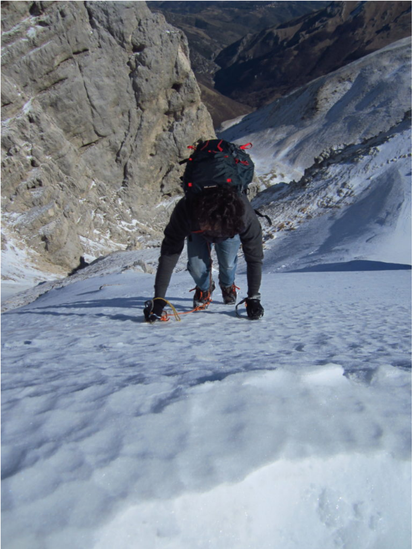
19- L'uscita con alle spalle la parete Sud del Sasso di Palazzo Borghese.