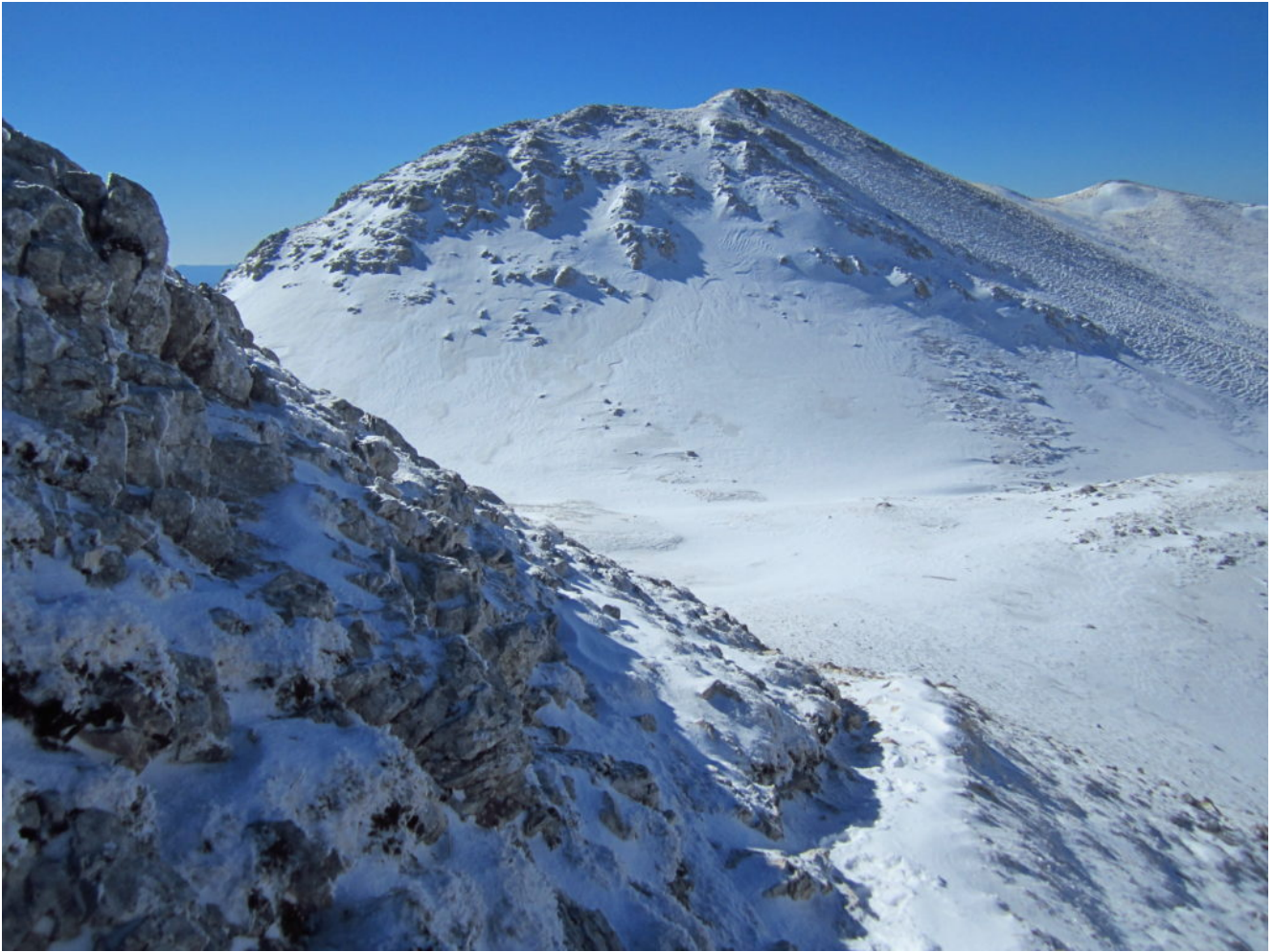
23- la cima del M. Palazzo Borghese.