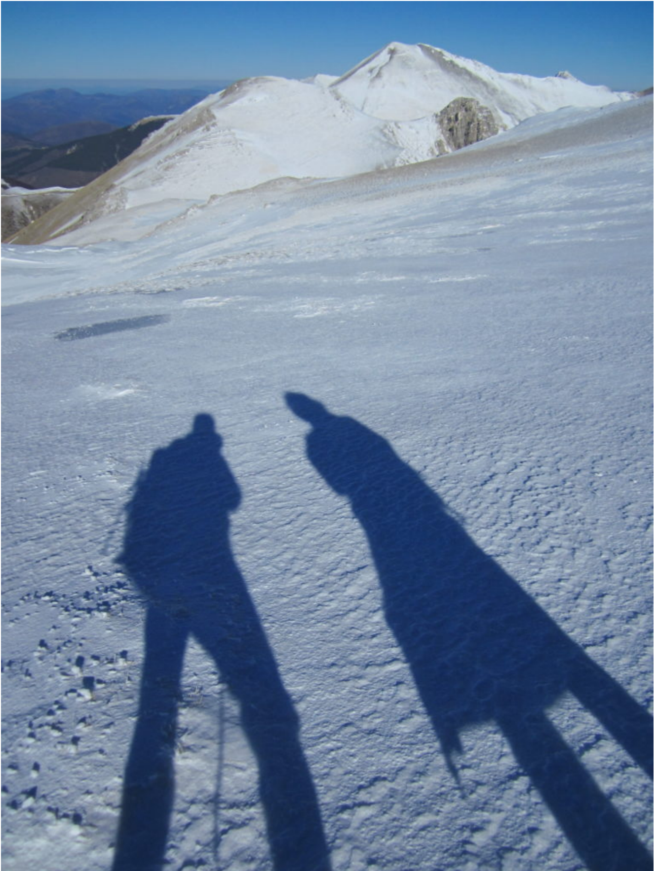
6- Le nostre ombre verso il M. Palazzo Borghese e M.Porche.