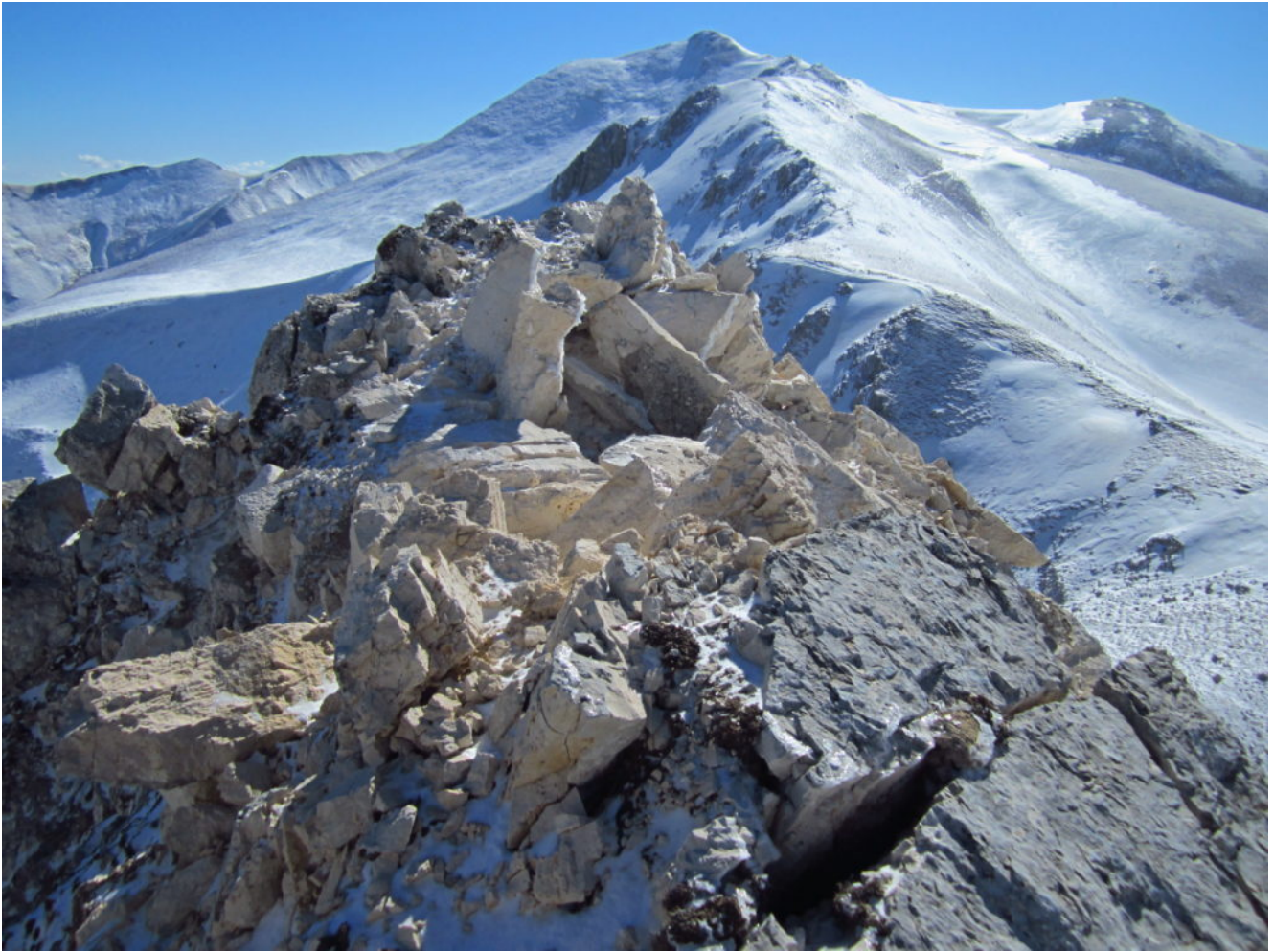
16- La cima dello scoglio gemello del sasso di Palazzo Borghese completamente squarciato dal terremoto del 206 con ancora un alto pericolo di crolli di massi, sullo sfondo il M. Argentella.