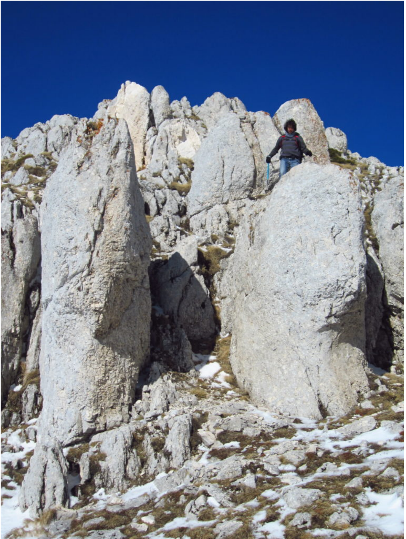
28- Scogli alla forcella della "Strada imperiale"