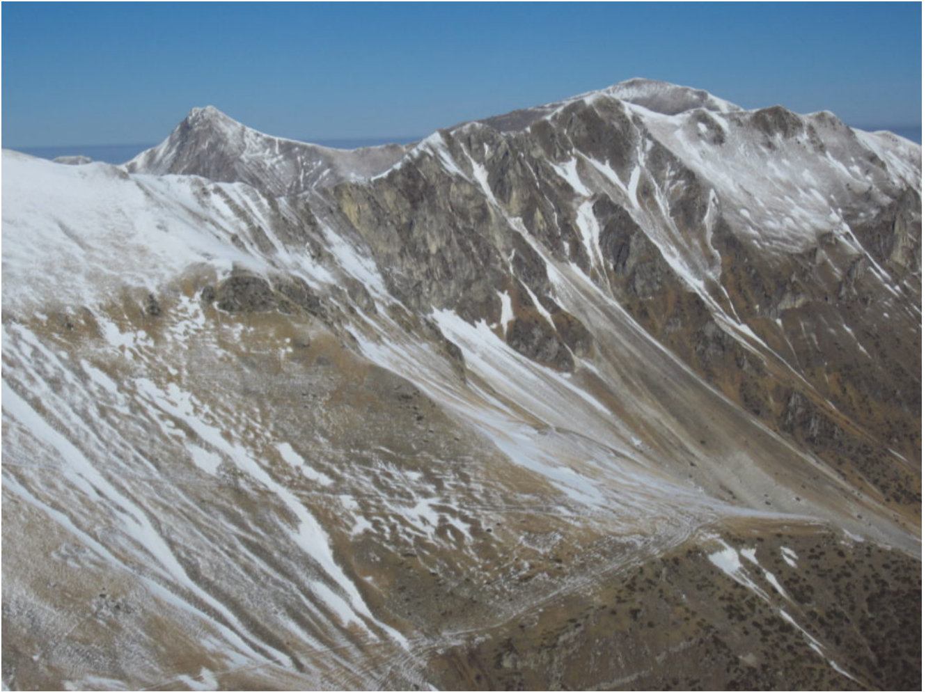
13- La Cima Vallelunga e sullo sfondo Il Pizzo Berro e il Pizzo Regina.