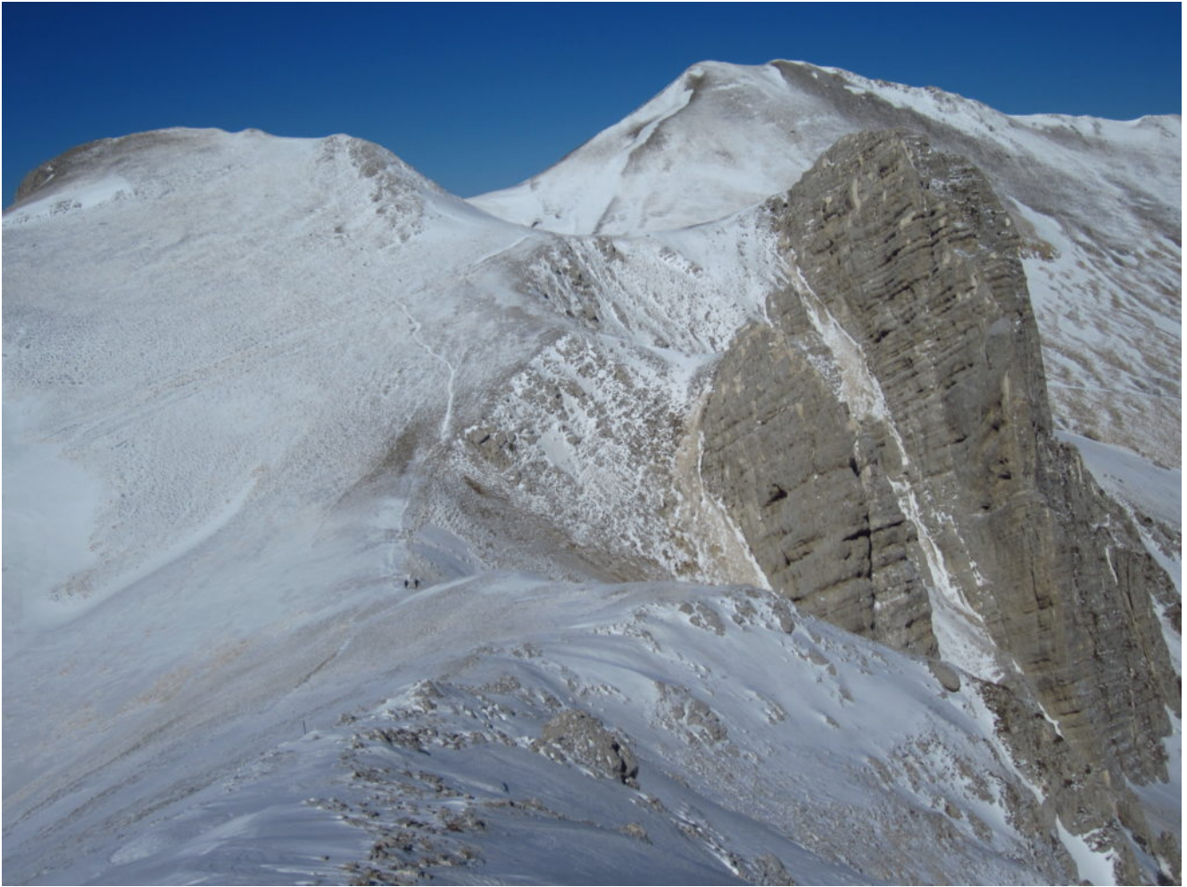
15- La cresta di discesa dal M. Argentella verso il M. Palazzo Borghese e i due scogli gemelli.