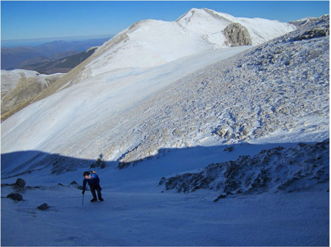
3- Uscita del canale nei pressi dell'antecima Ovest del M. Argentella, sullo sfondo Il M. Palazzo Borghese, il Sasso e il M. Porche