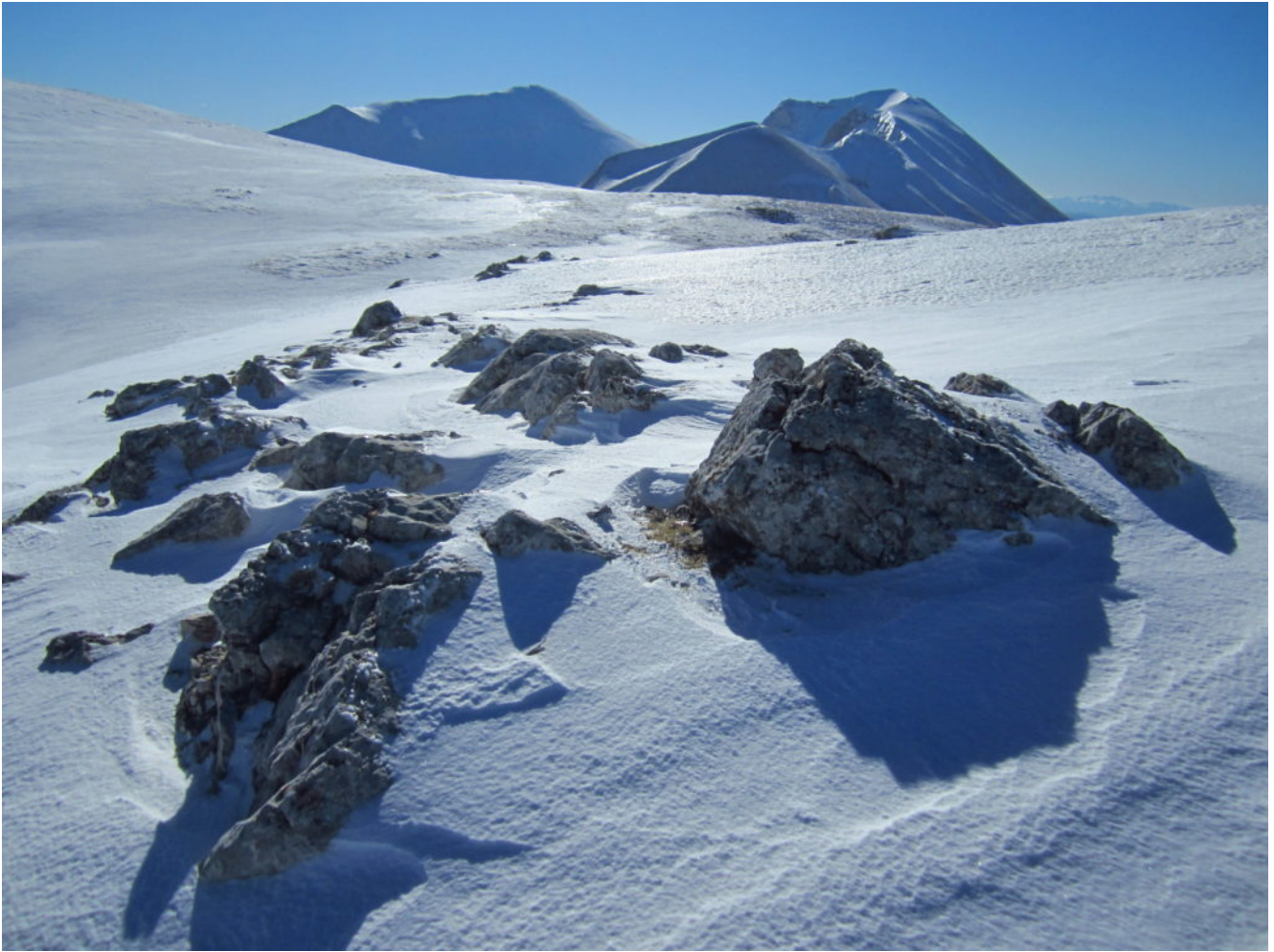
5- Salendo verso la cima del M. Argentella si scopre il gruppo del M. Vettore a sinistra e la Cima del Redentore a destra