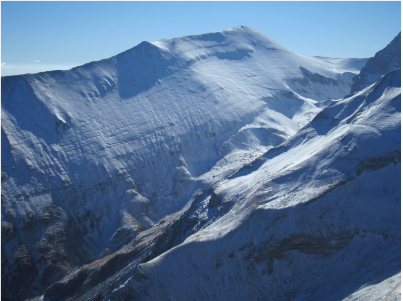
10- veduta verso Sud, il M. vettore e la conca del Lago di Pilato.