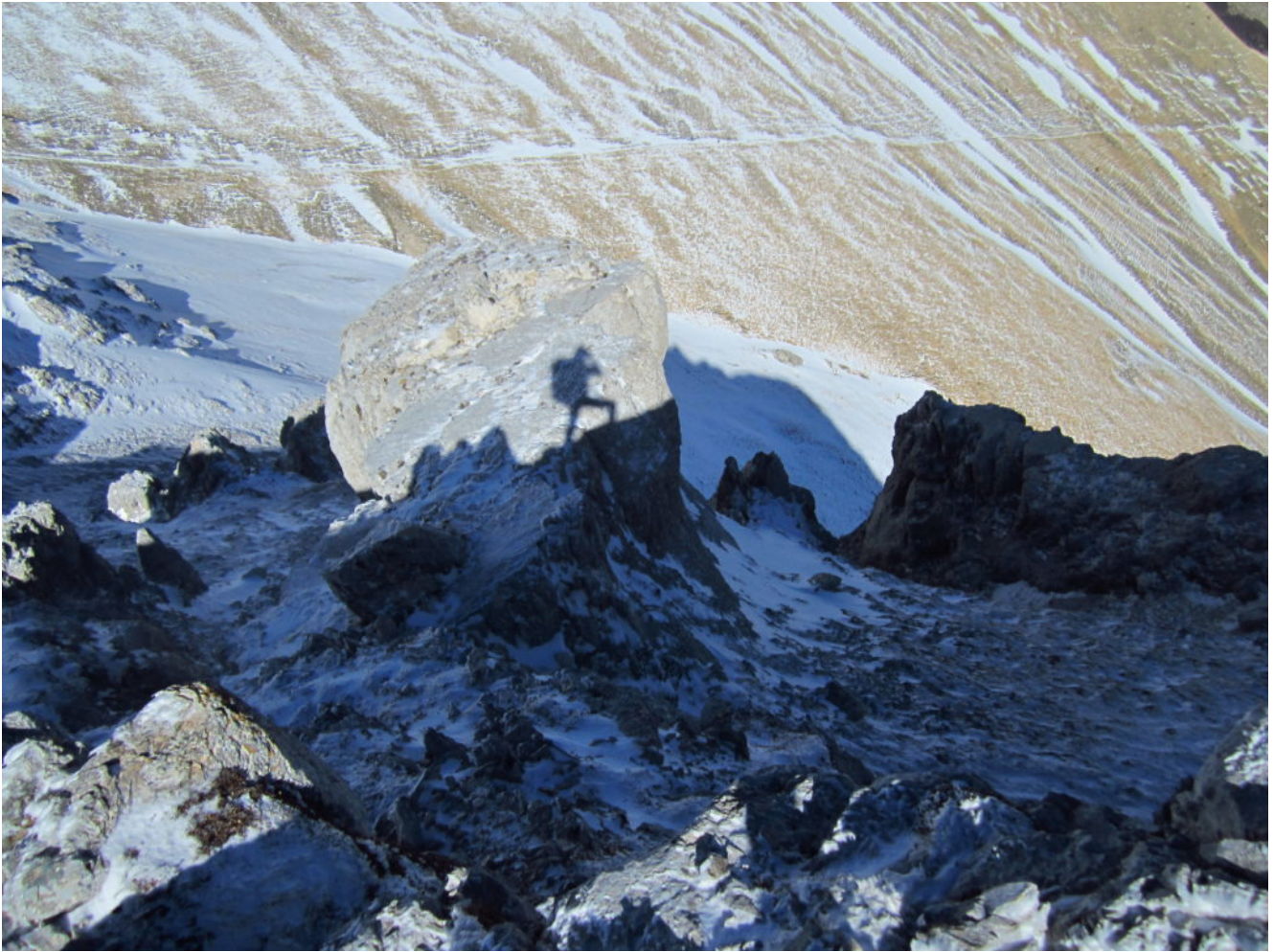
24- La mia ombra si riflette su un masso della parete Nord di Sasso di Palazzo Borghese, sullo sfondo il sentiero che proviene dalla Fonte dell'Acero.