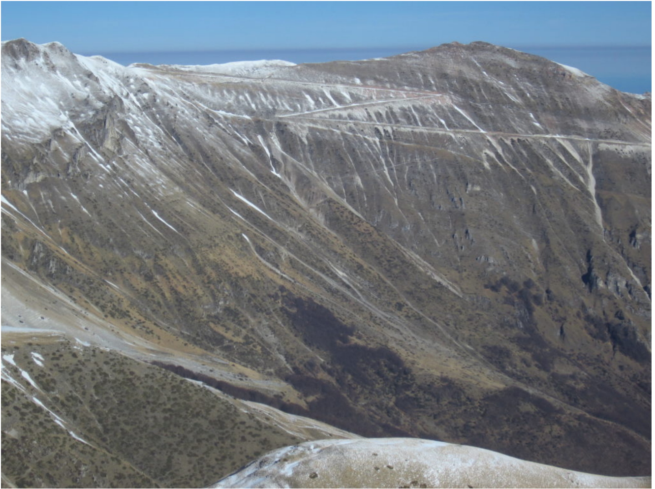
14- Il M. Sibilla praticamente senza neve.