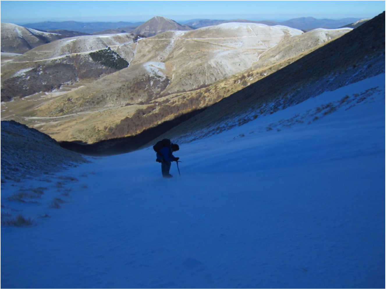
2- A metà canale, sullo sfondo il Monte Prata e il Monte Cardosa.