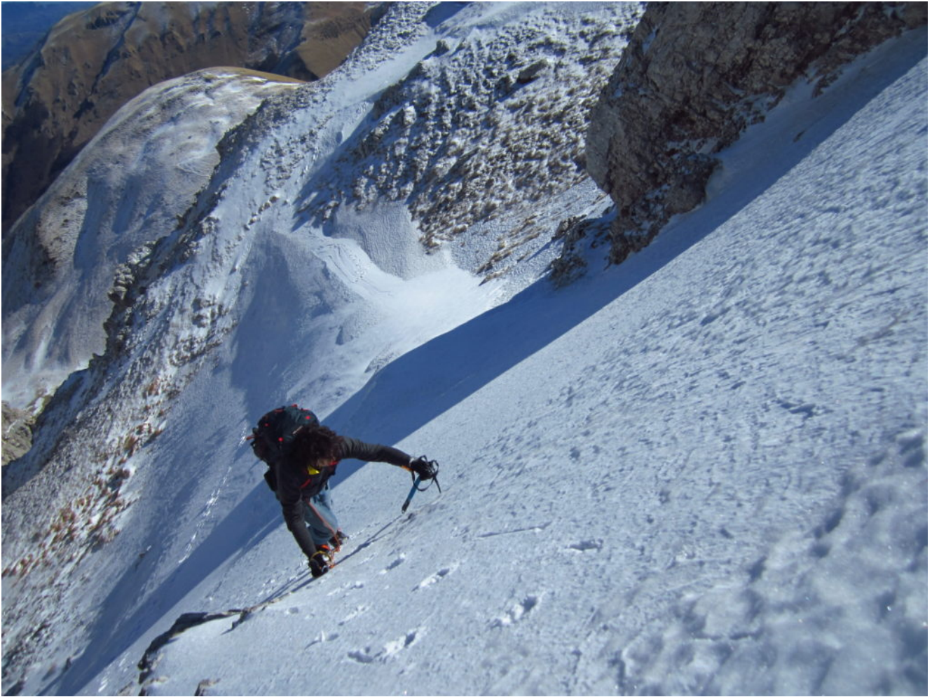
18- Il tratto più ripido del canalino.