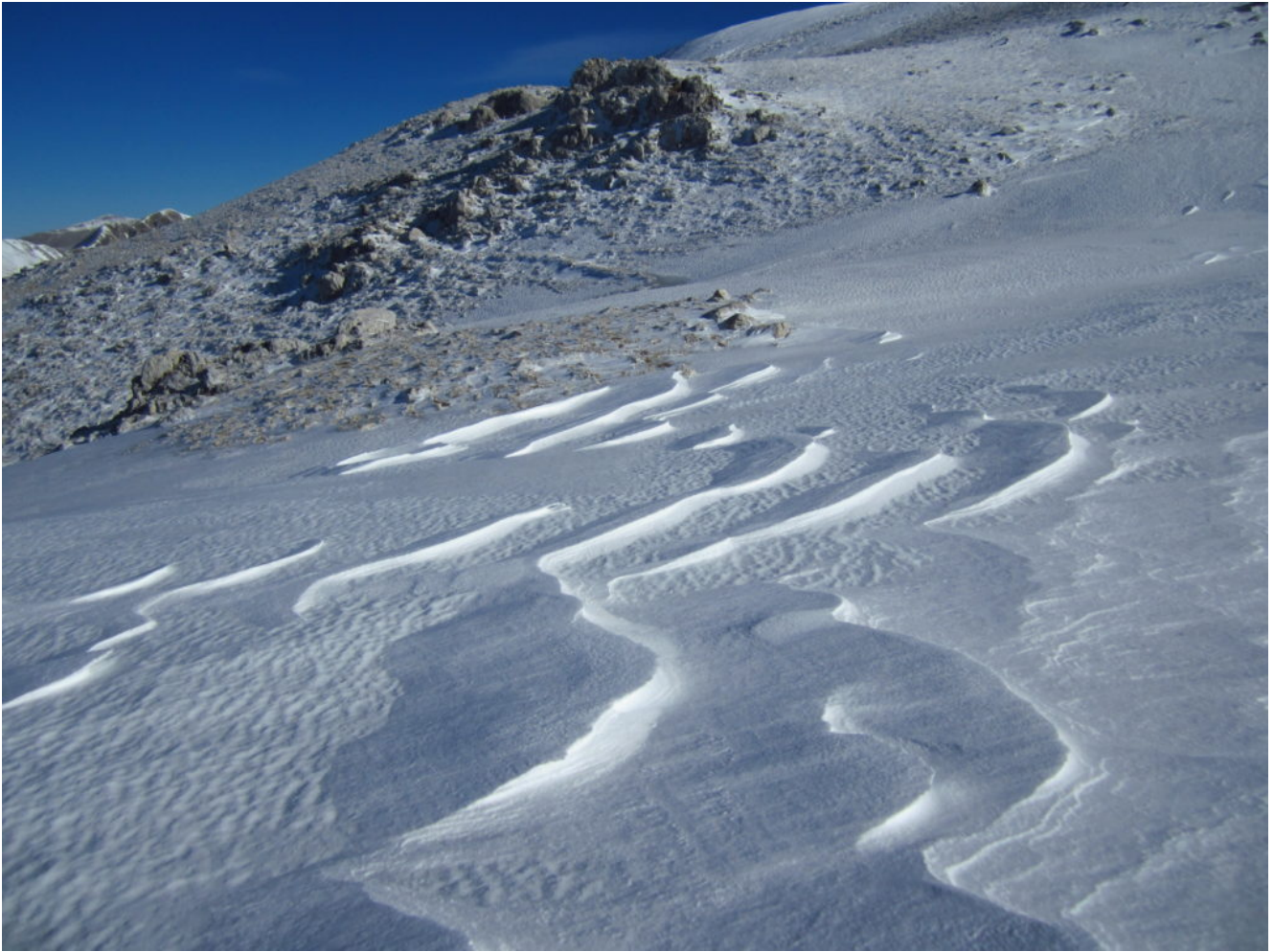
4- Innevamento scarso sul plateau sommitale del M. Argentella.