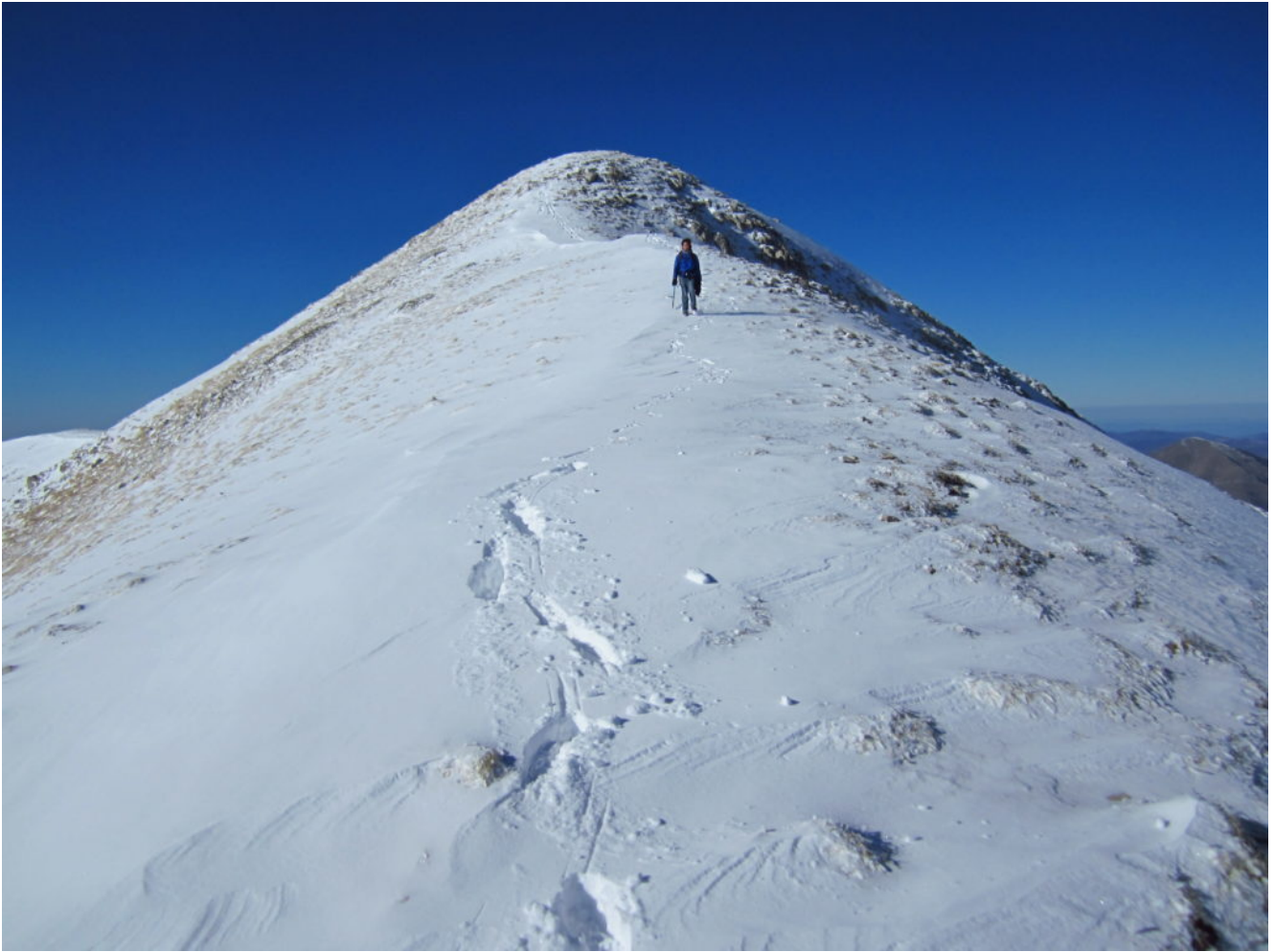
7- Scendendo dalla cima del M. Argentella verso l'antecima Nord