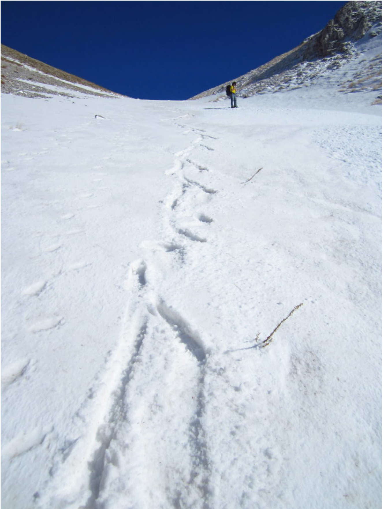
30- La rapida discesa in scivolata su neve ammorbidita nel canale Ovest risalito al mattino con neve ghiacciata.