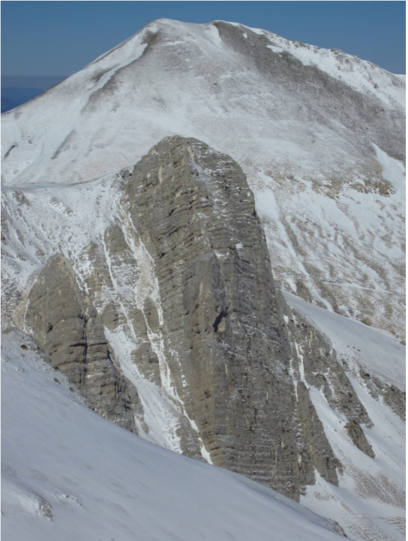
12- Veduta verso Nord, sullo sfondo il M. Porche e l'imponente Sasso di Palazzo Borghese con lo scoglio gemello più piccolo ed il canalino che costeggia la parete salito per la prima volta da noi e descritto nel sito.