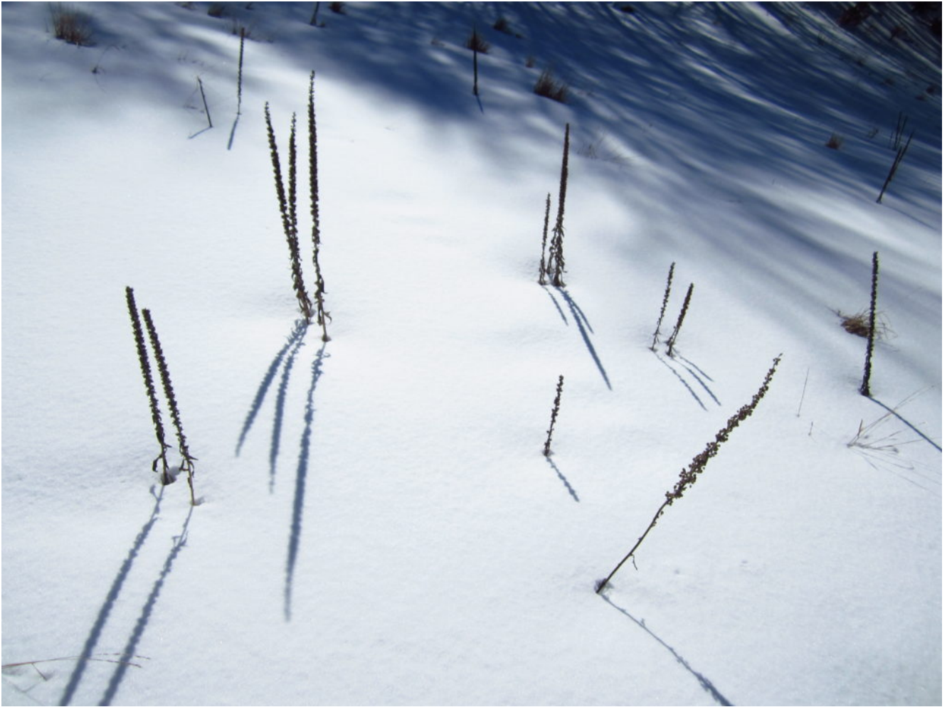
31- 32 Steli di Verbascum e Digitalis nella Valle di San Lorenzo