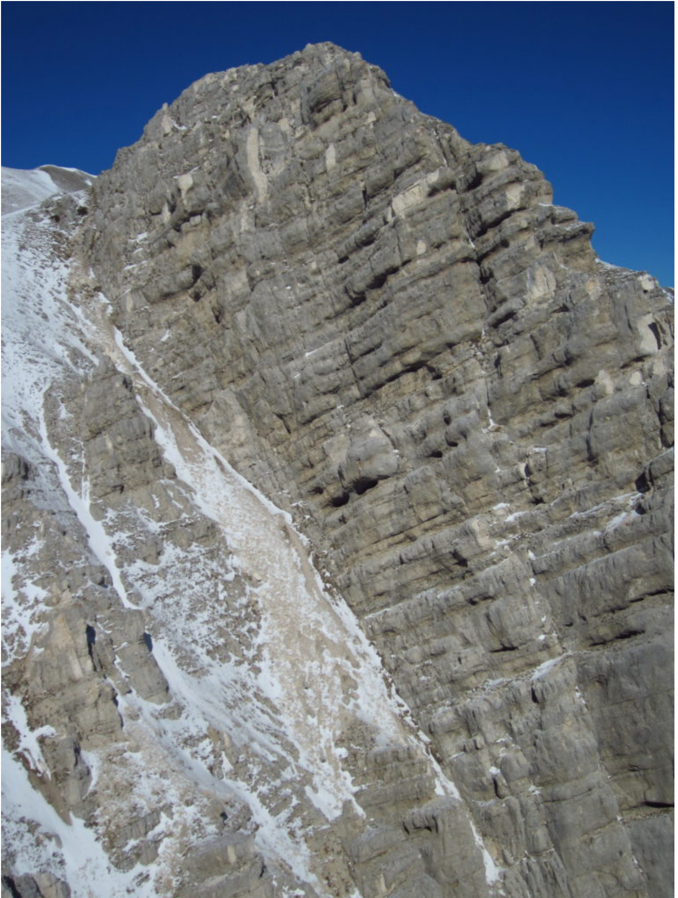
17- Il Sasso di Palazzo Borghese con il canalino alla base della parete Sud della nostra via invernale, .