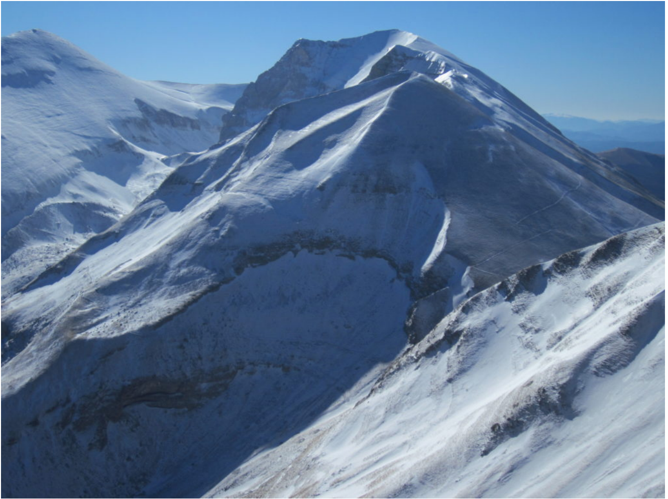
11- Forca Viola e la cresta da Quarto S. Lorenzo alla Cima del Redentore.