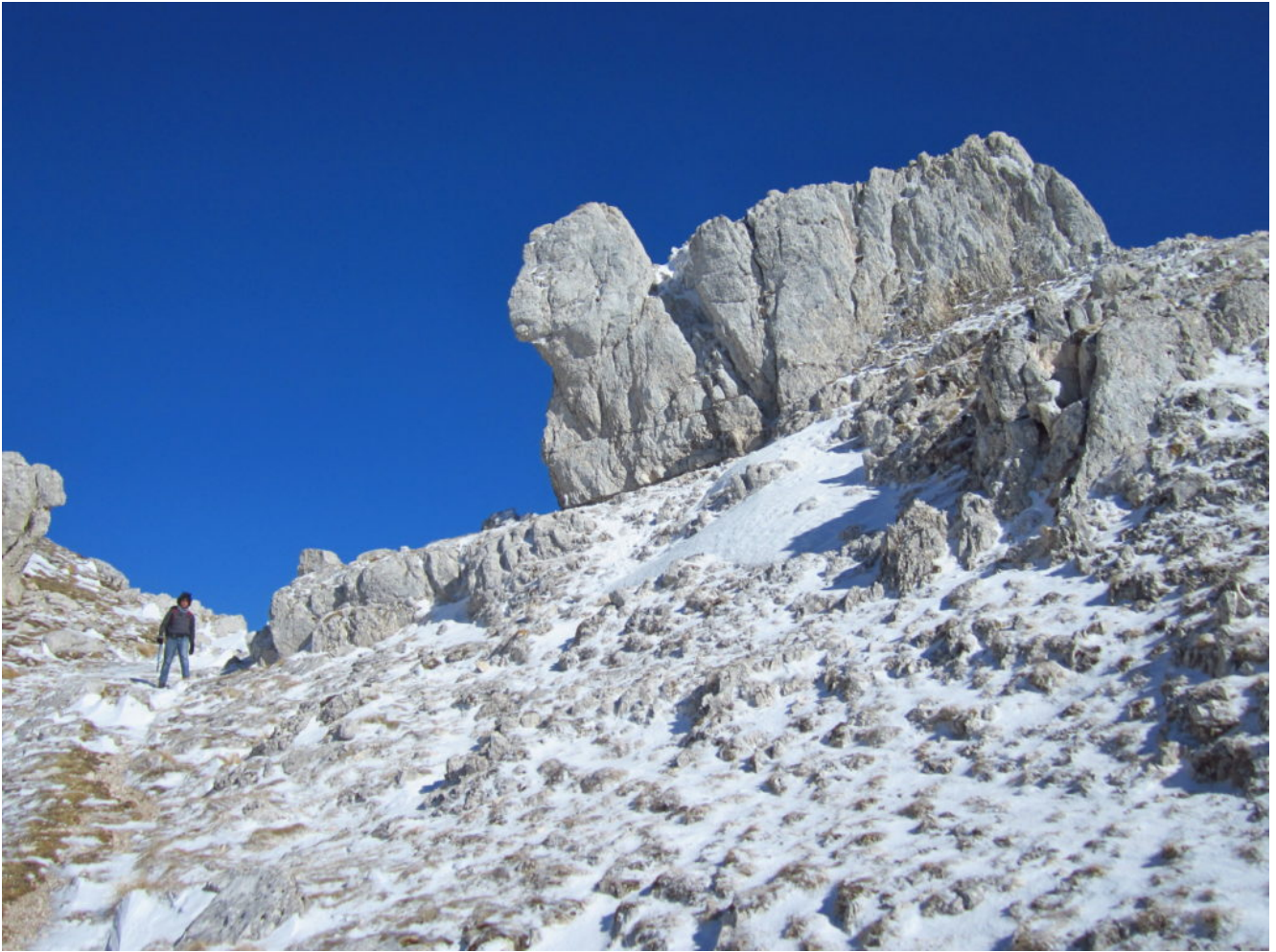
29- Lo scoglio denominato "il cammello"