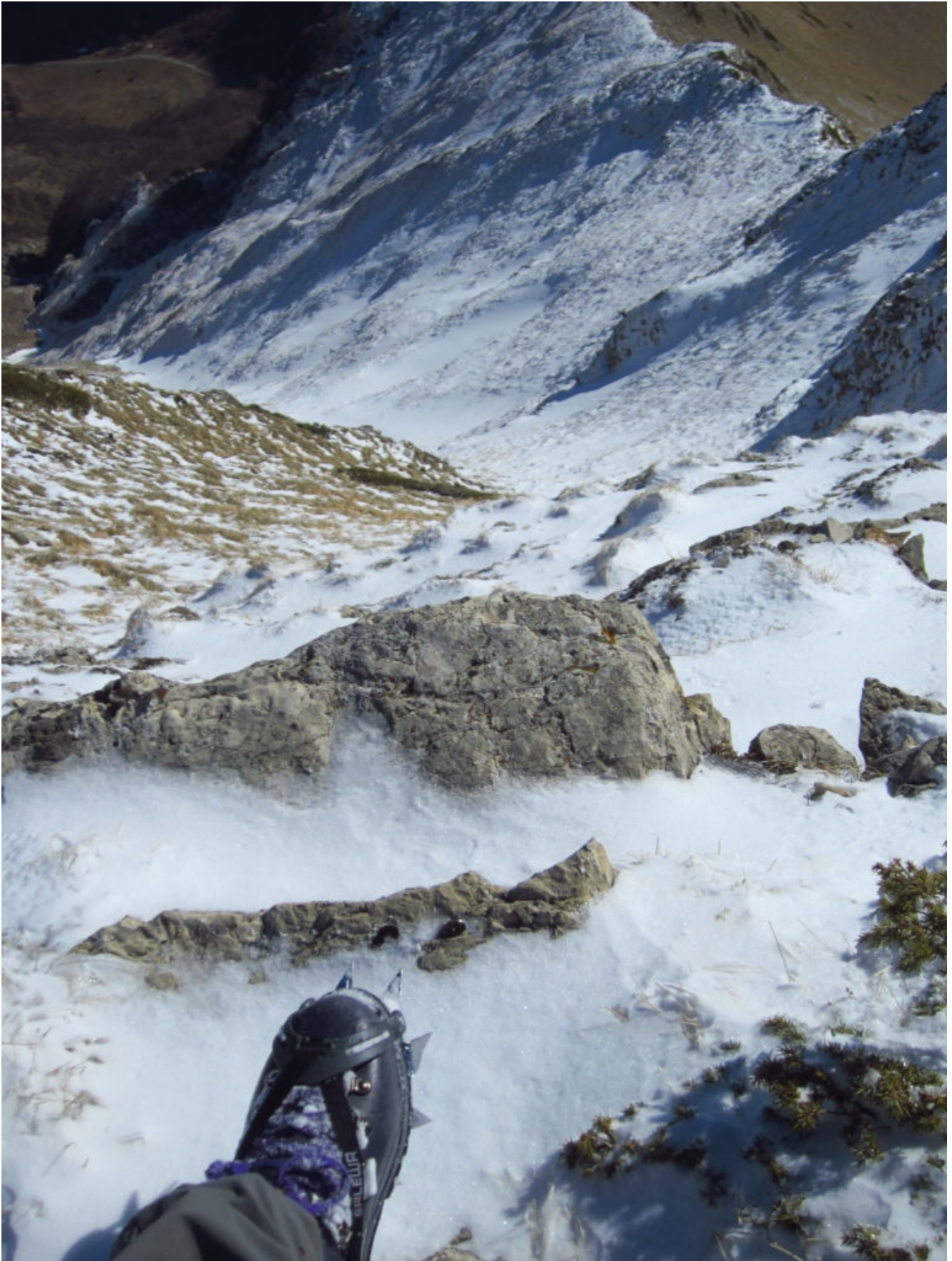
9- Dimostrazione della verticalità della parete Nord denominata anche "L'abbandonata".