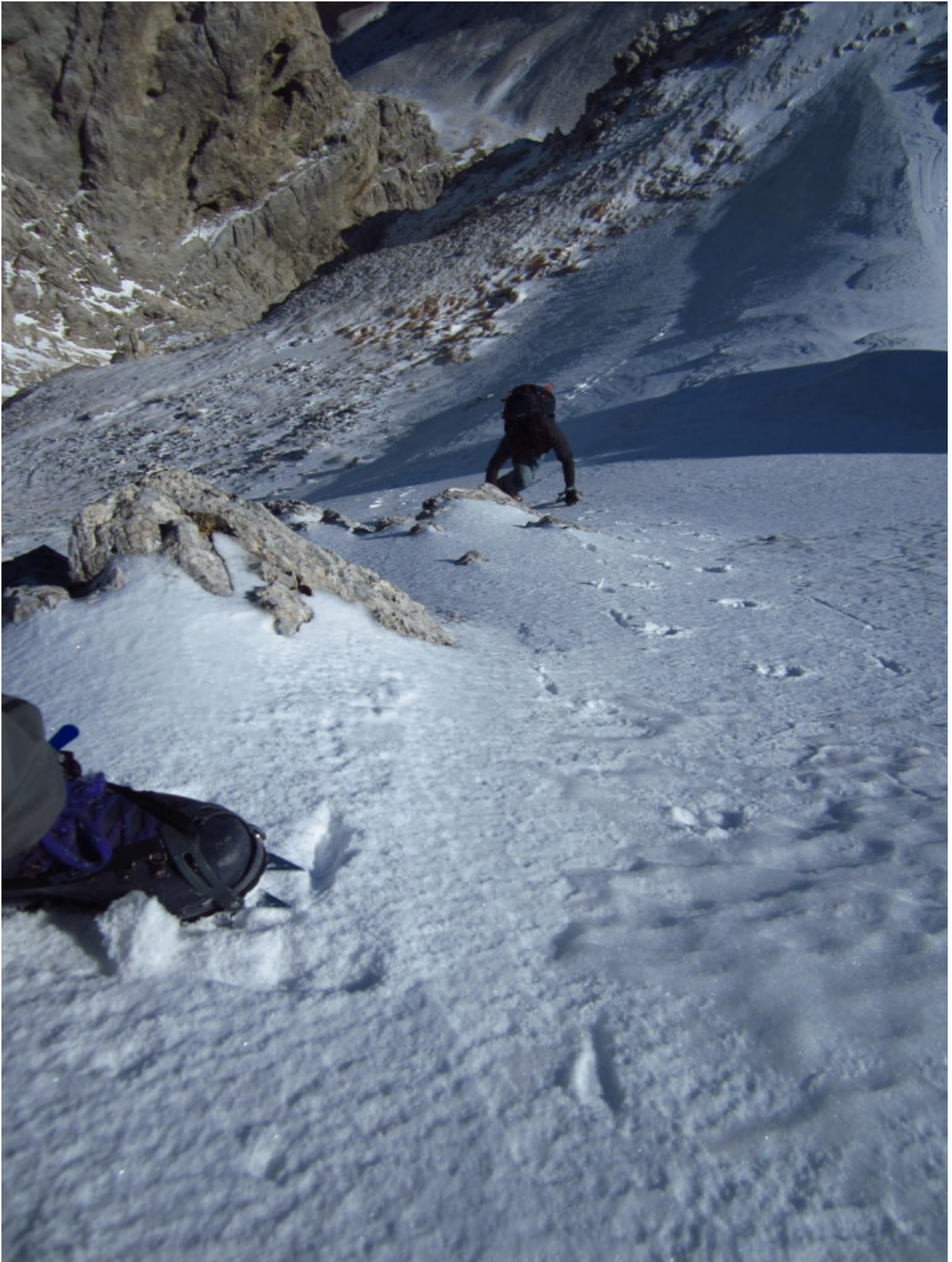
17- Il ripido canalino ghiacciato tra i due scogli che abbiamo risalito dopo essere scesi un centinaio di metri nel canale Est di Sasso di Palazzo Borghese.