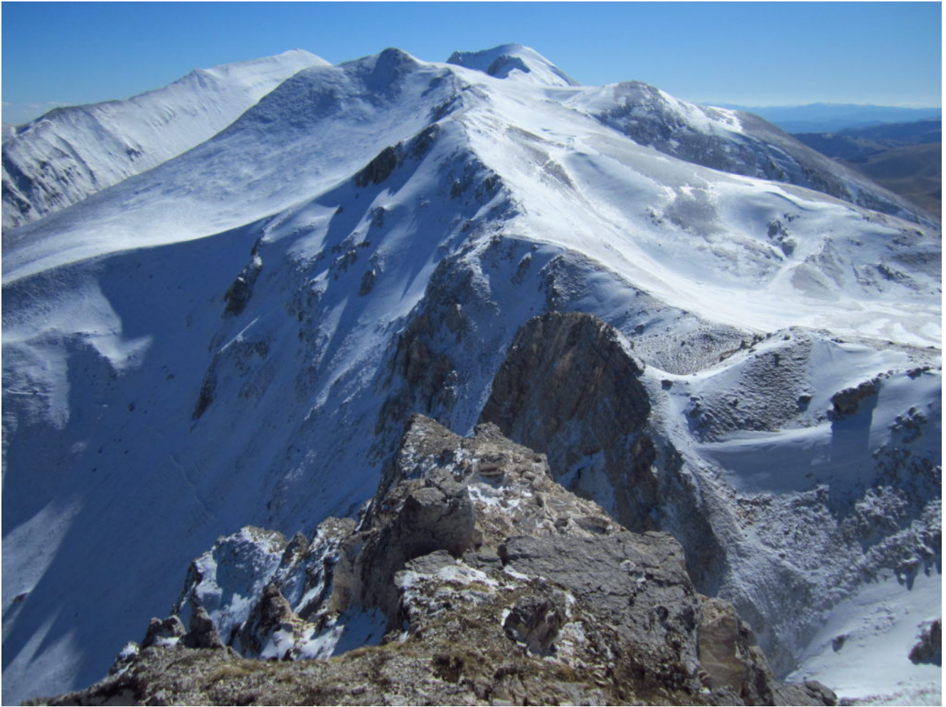
21- Il gruppo Sud del Monti Sibillini visto dalla cima di sacco di Palazzo Borghese.