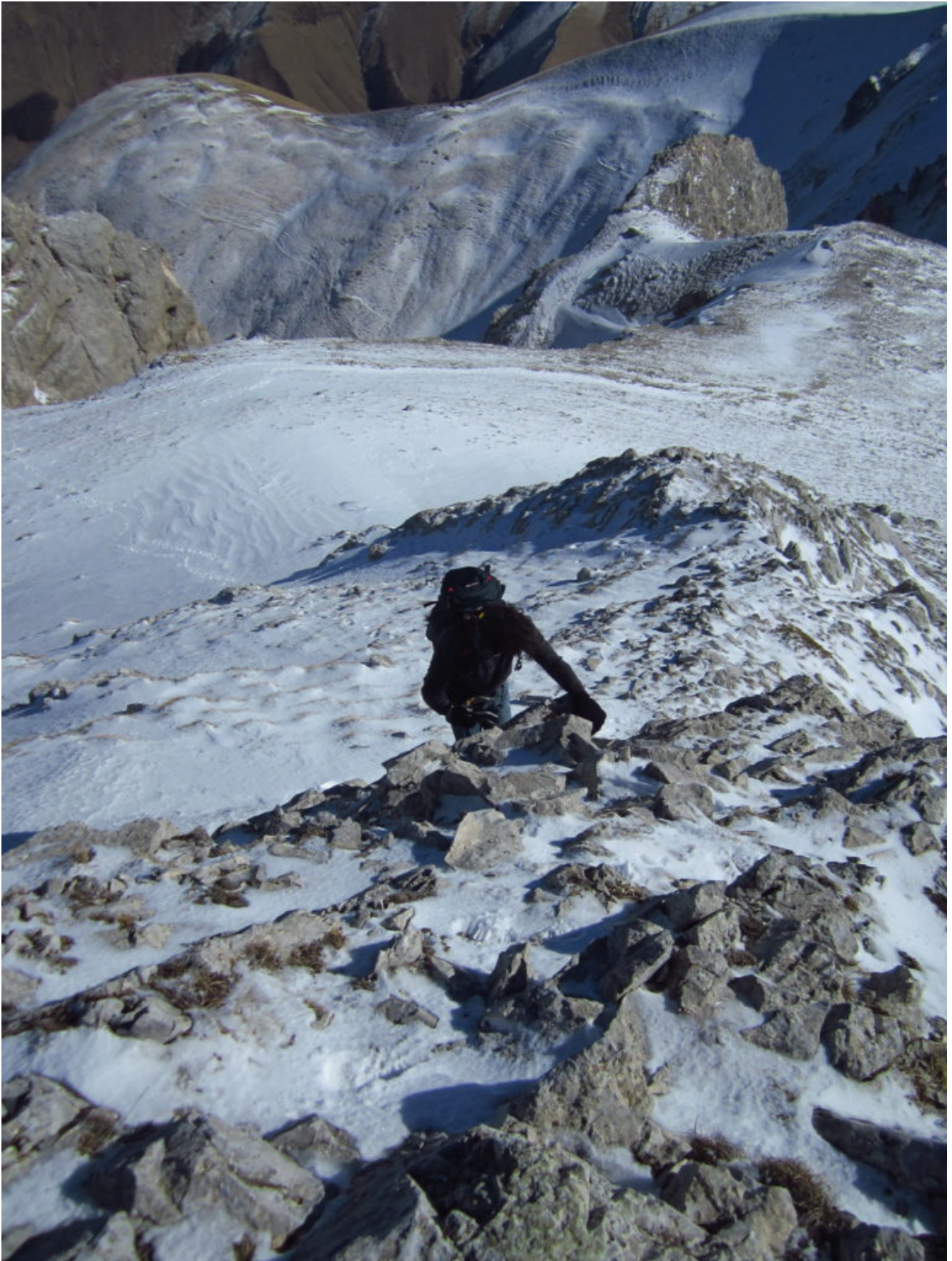
25- Facili roccette prima della cima di M. Palazzo Borghese, in fondo la sella tra il Sasso (a sinistra) e lo scoglio gemello (a destra)