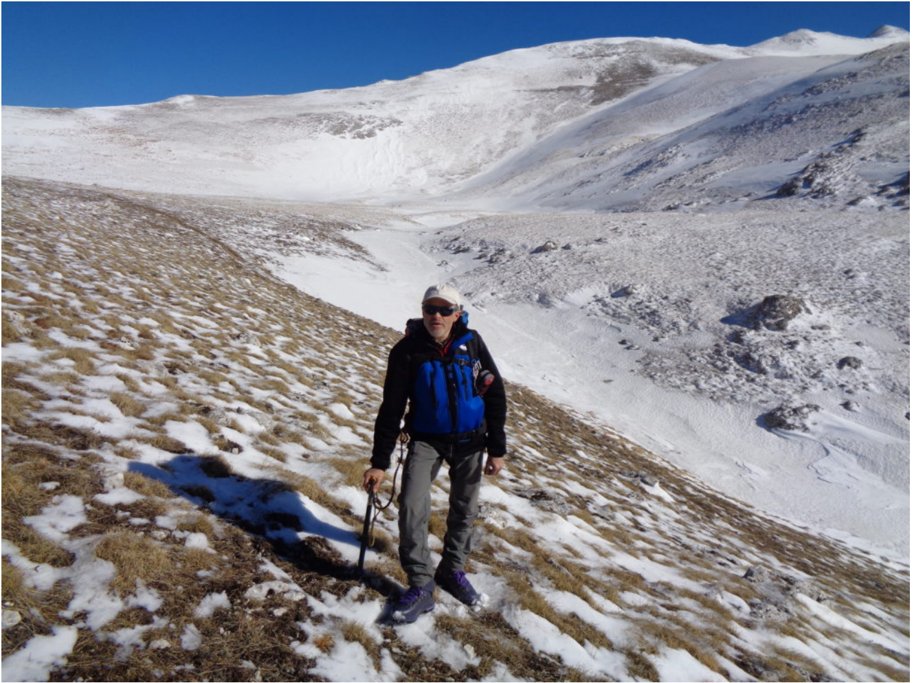
27- La valletta tra il M. Argentella e il M. Palazzo Borghese.