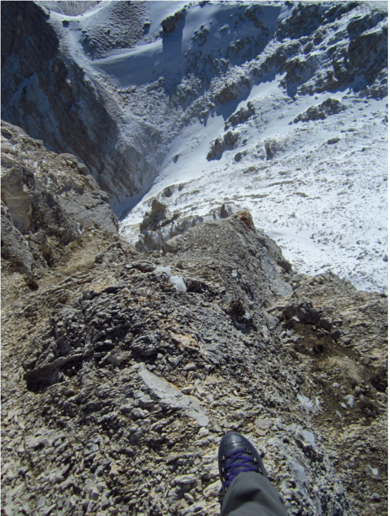
20- Il tratto risalito delle foto 17-19 visto in verticale dalla cima di Sasso di Palazzo Borghese.