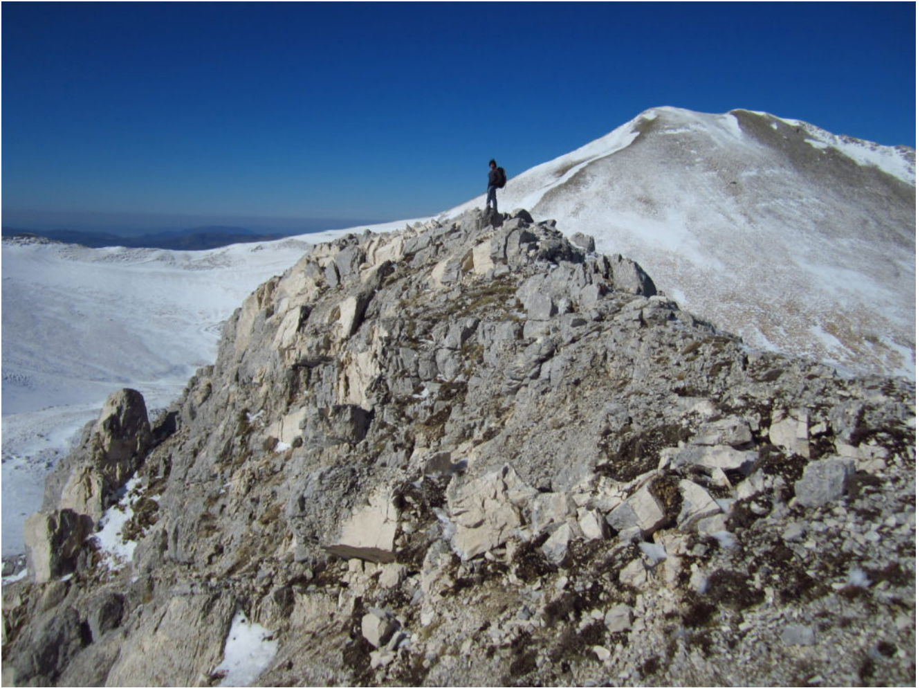
22- La martoriata cima del Sasso di palazzo Borghese con massi ancora instabilissimi, sullo sfondo il M. Porche.