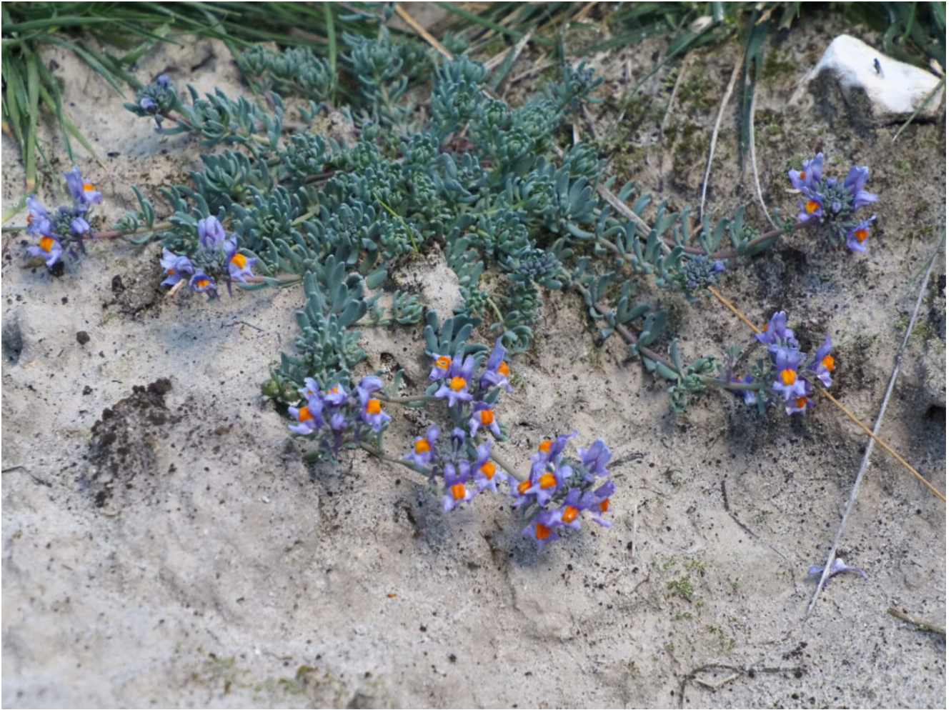
31- La Linaria alpina