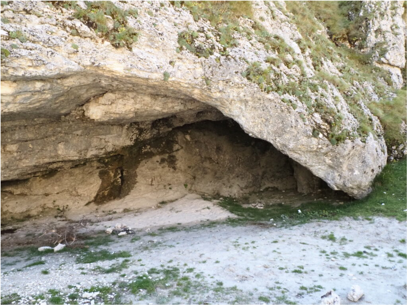
15 – 20- La Grotta della Valianara.