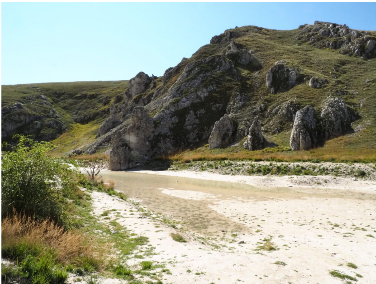
1- La parte iniziale del Canyon, riempito con l'acqua delle

Di seguito le immagini del particolarissimo sito.