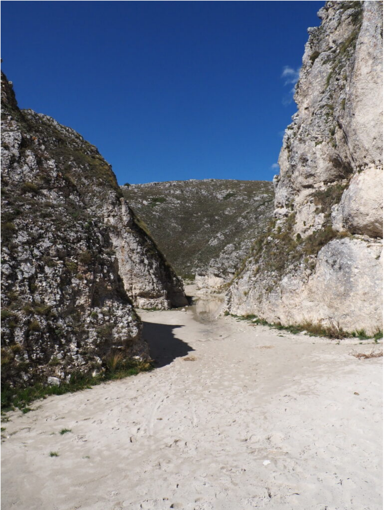
36- Il laghetto visto dalla duna di sabbia