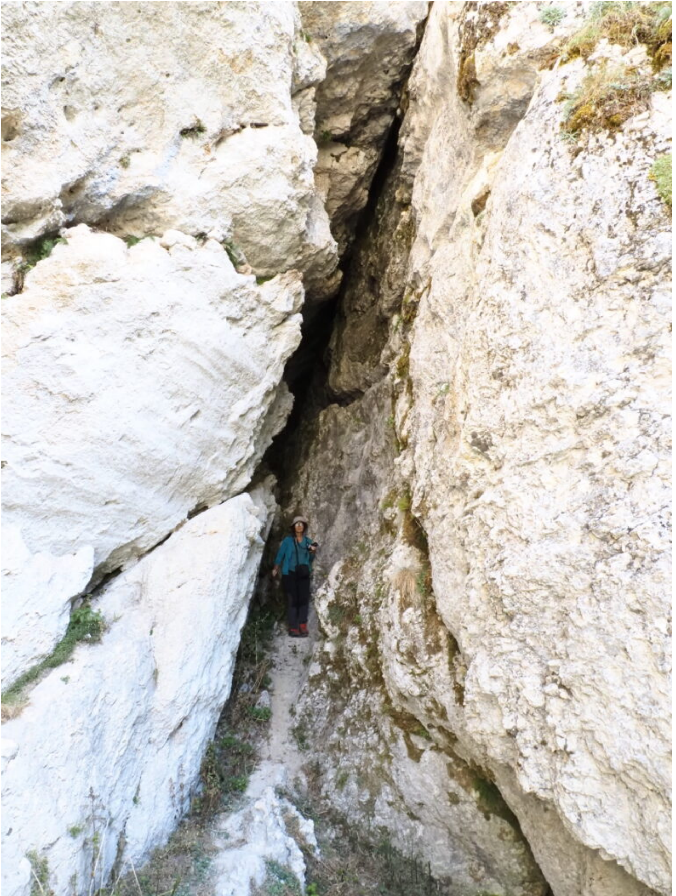
21- Una profonda faglia posta a valle della Grotta.