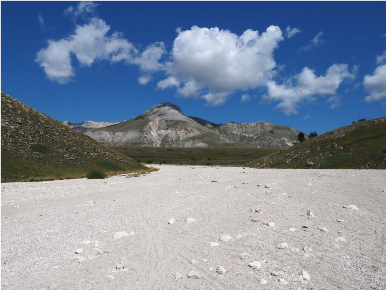
40 – 41 – La fiumana proveniente dal versante Sud del Monte Camicia.