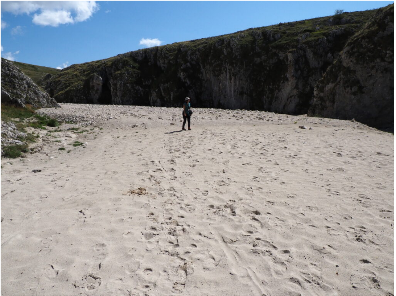
35- La particolarissima duna di sabbia che delimita a valle il laghetto temporaneo.