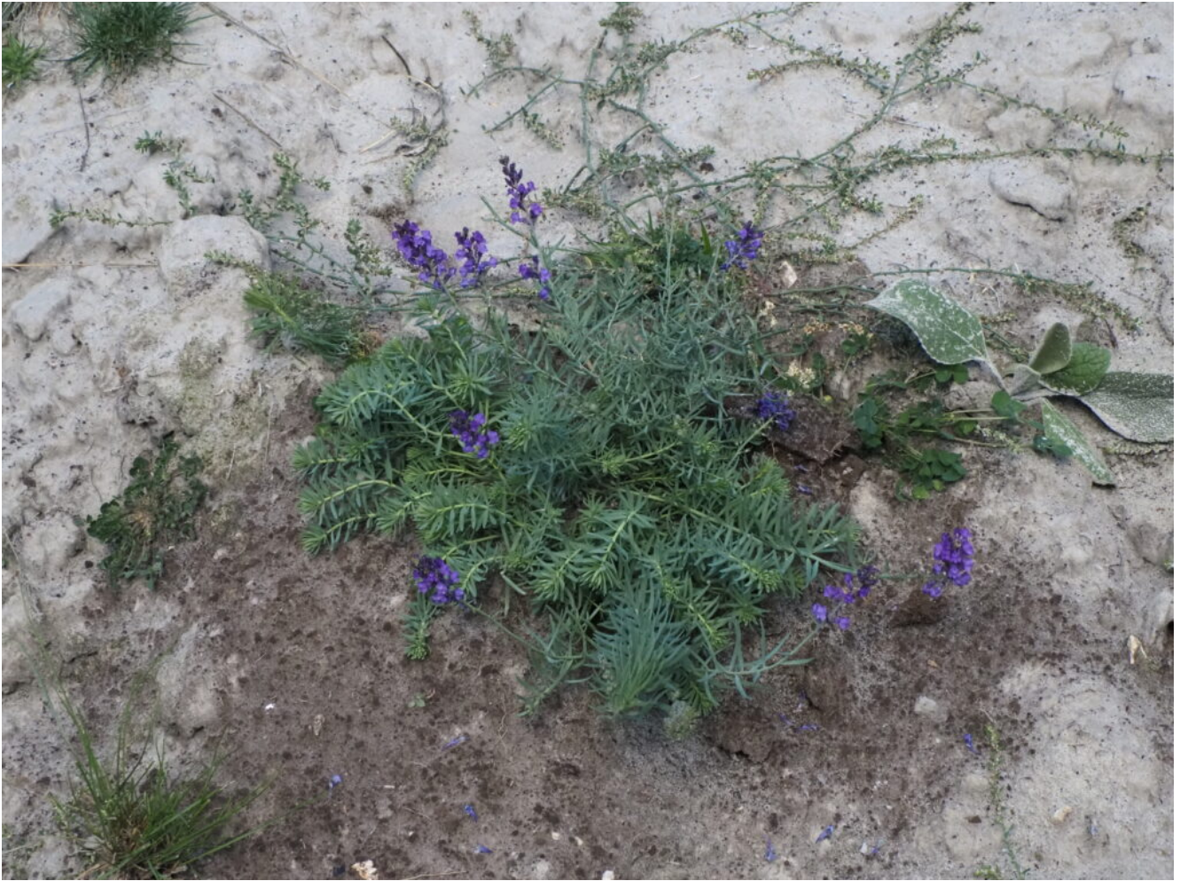
30 – La Linaria purpurea