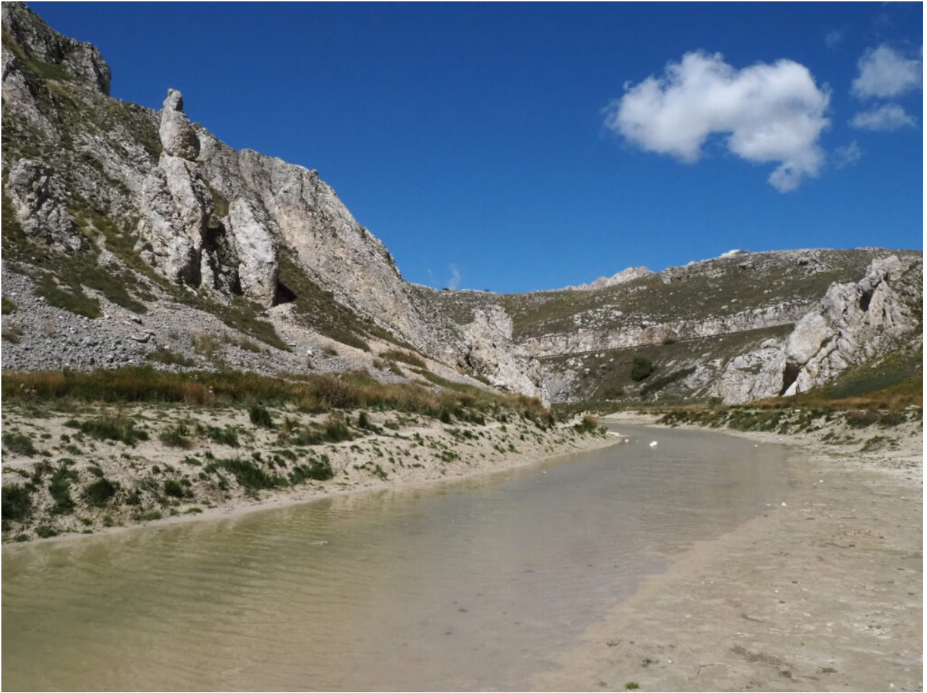
5- La prima parte del Canyon riempita d'acqua e la strada di Campo Imperatore sullo sfondo da cui si accede.