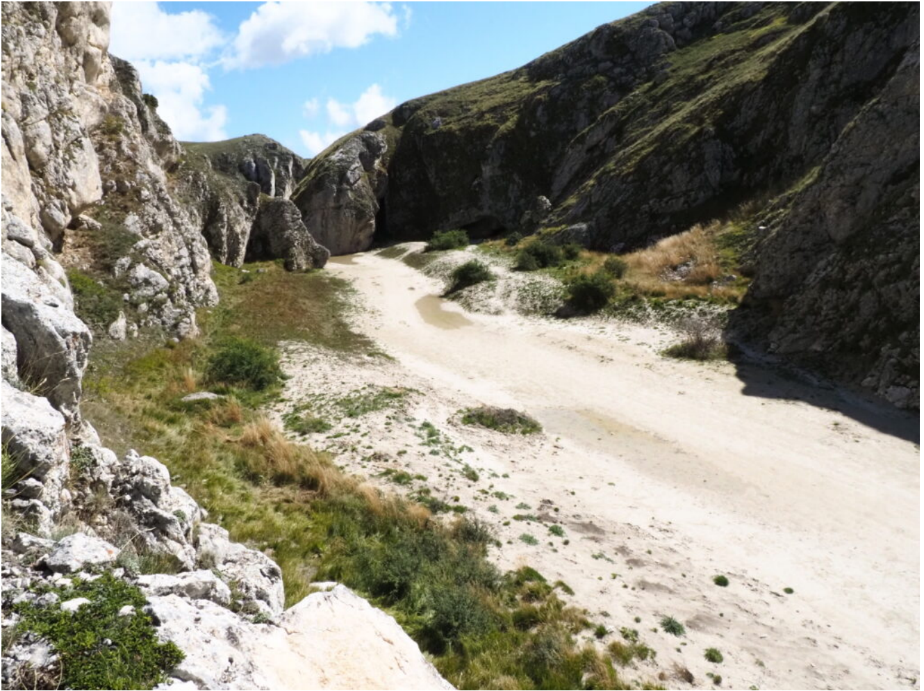
9- La parte successiva del Canyon oltre la prima strettoia.