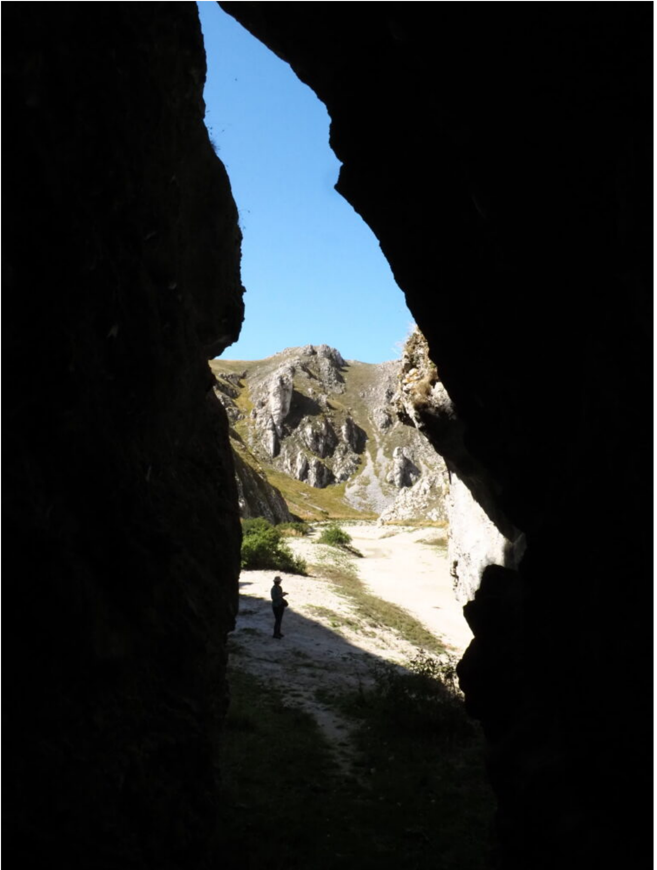
22 – 23- Veduta del Canyon dall'interno della Faglia.