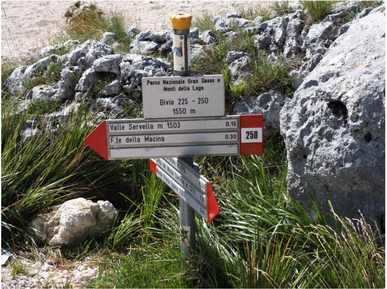
39- Il cartello posto all'uscita del Canyon.