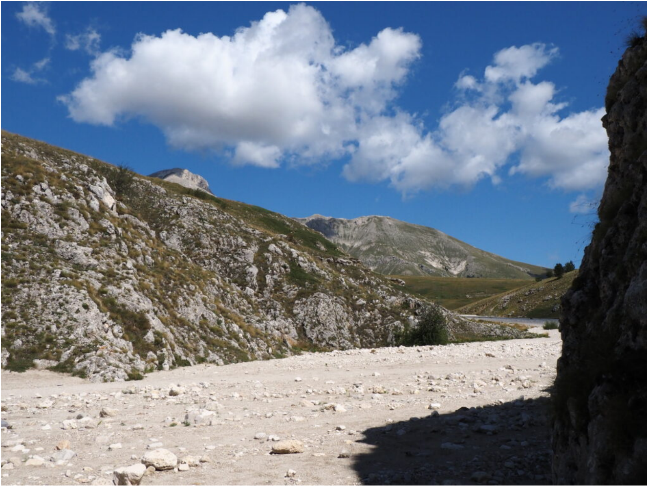
37- Procedendo lungo la duna di sabbia si scopre il Monte Camicia.