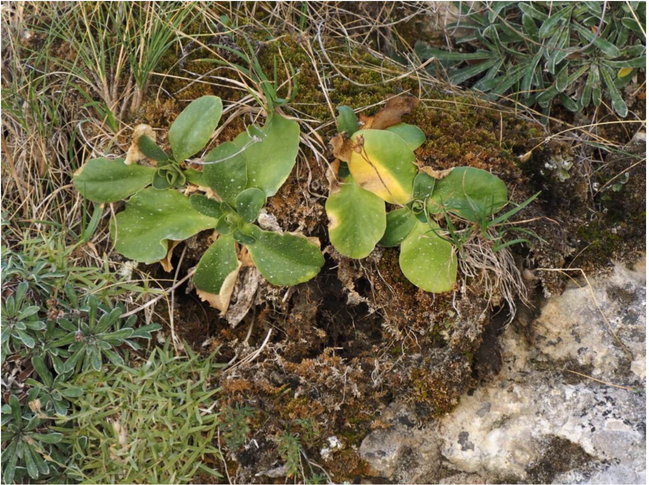
33- Nelle pareti del versante Nord del Canyon vegeta anche la rara Primula auricula , qui eccezionalmente abbondante.