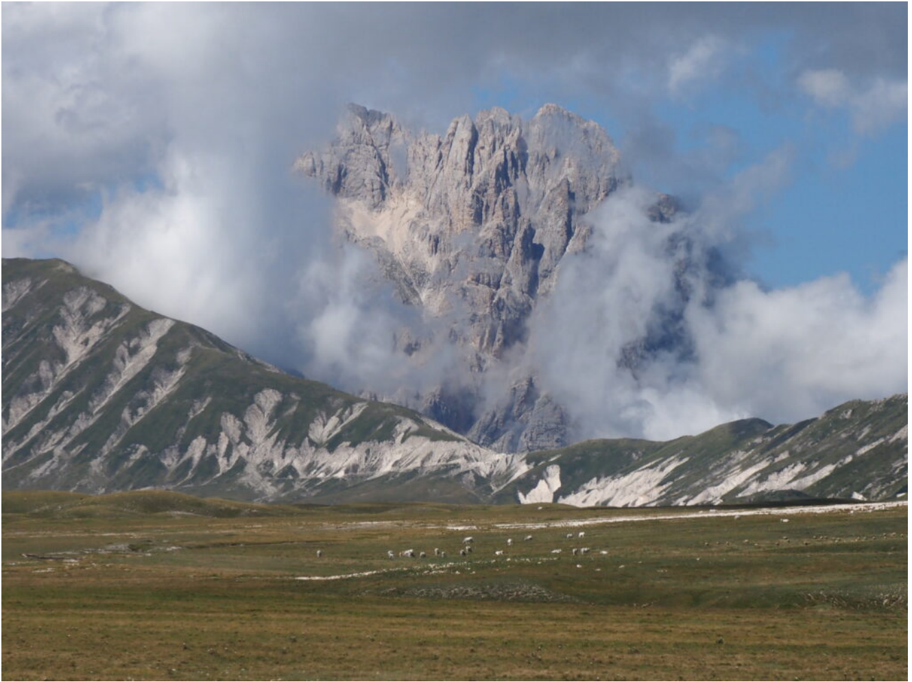
43- Raggiunto Campo Imperatore la vista si apre sul Corno Grande immerso nella nebbia.