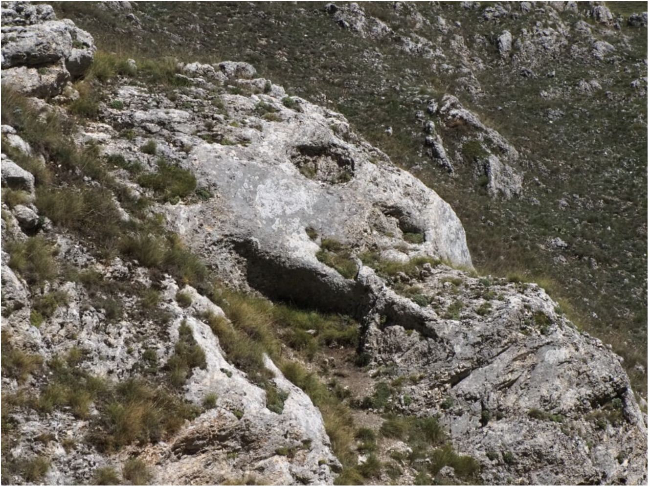
13 - 14 - Dettaglio della roccia a forma di testa di Aquila.