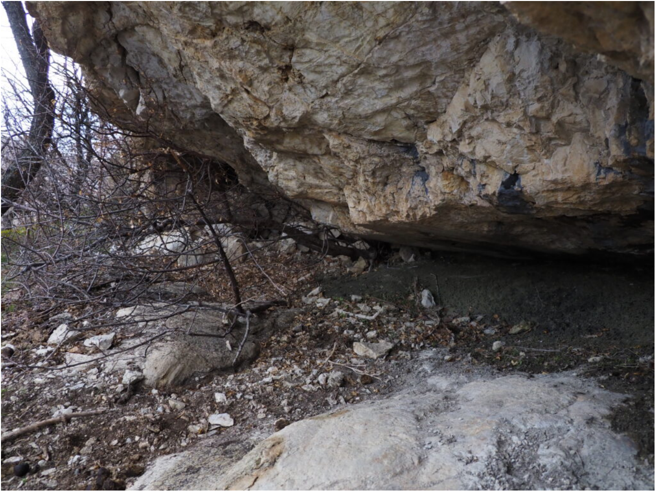
31- 32- La cengia prosegue per tutta la base della parete