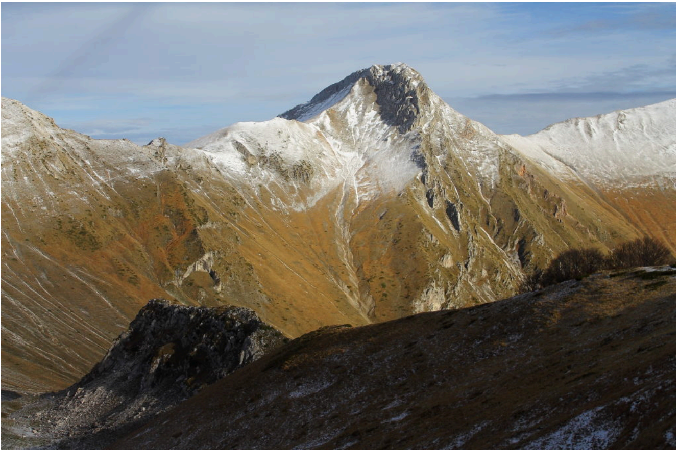
3- La cresta che separa Le fosse dalla Valle Orteccia ed il Pizzo Berro sullo sfondo..