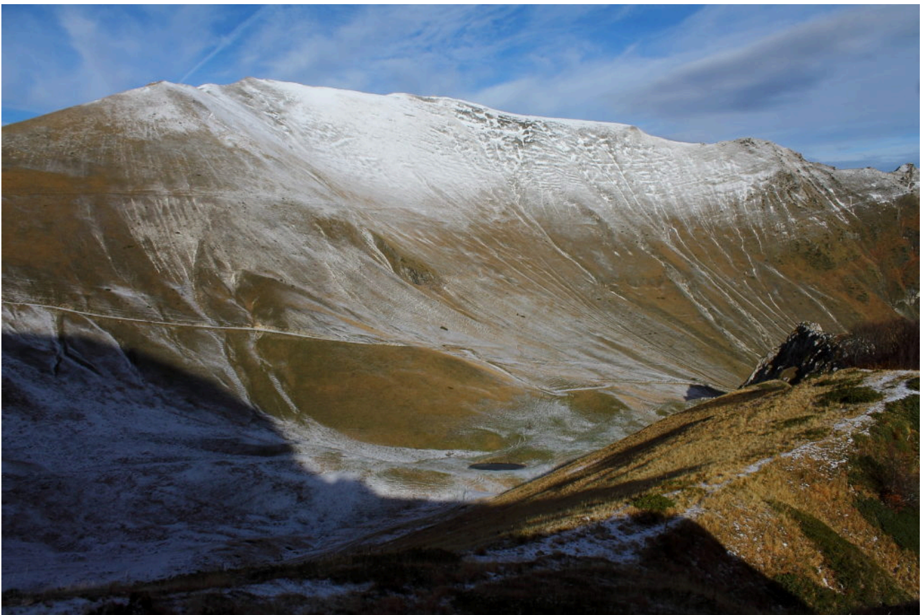
5- Il versante Sud-est del Monte Bove Sud