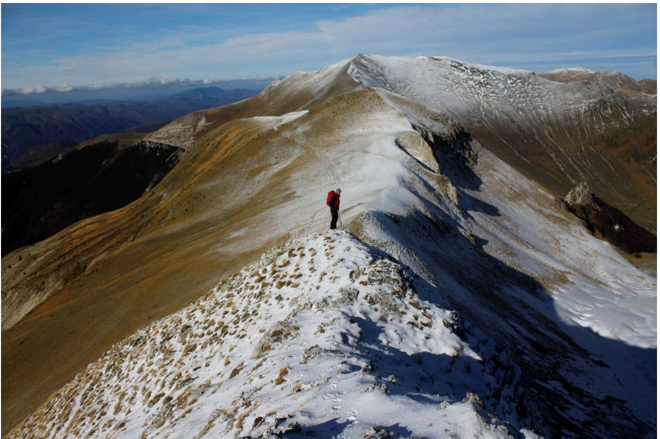
27- La cresta che scende da Cima di Vallinfante verso la Cima di Passo Cattivo.