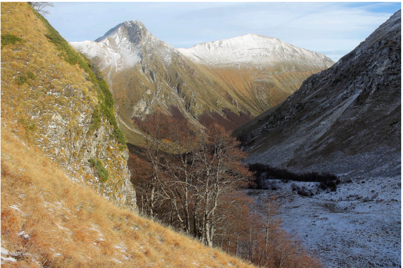
9- La Valle Orteccia con il Pizzo Berro e Pizzo Regina sullo sfondo.