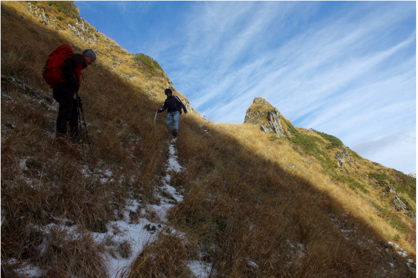
8- La discesa dalla cresta de Le Fosse a Valle Orteccia.