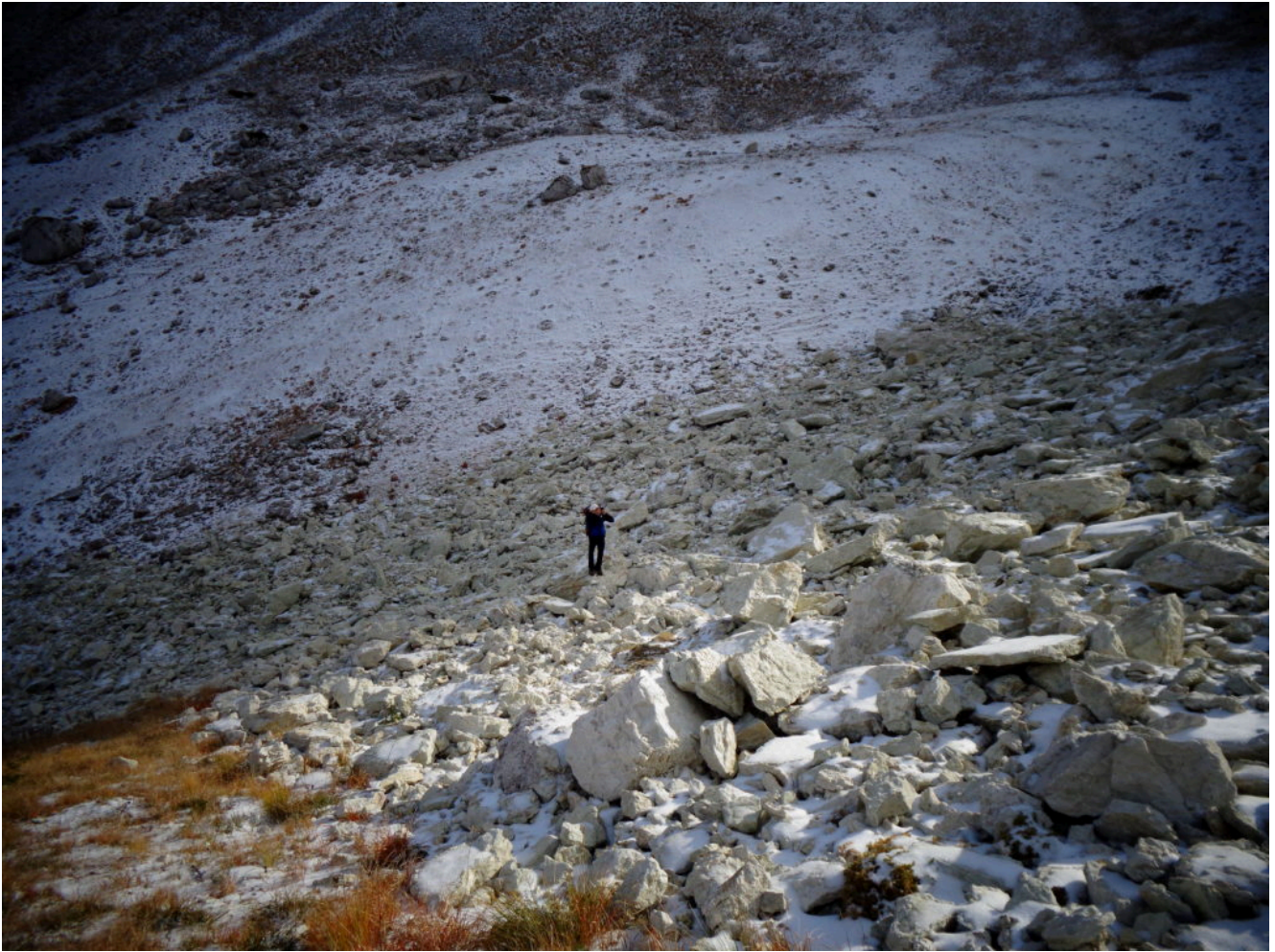
16 Il sottoscritto alla base dell'accumulo di frana.