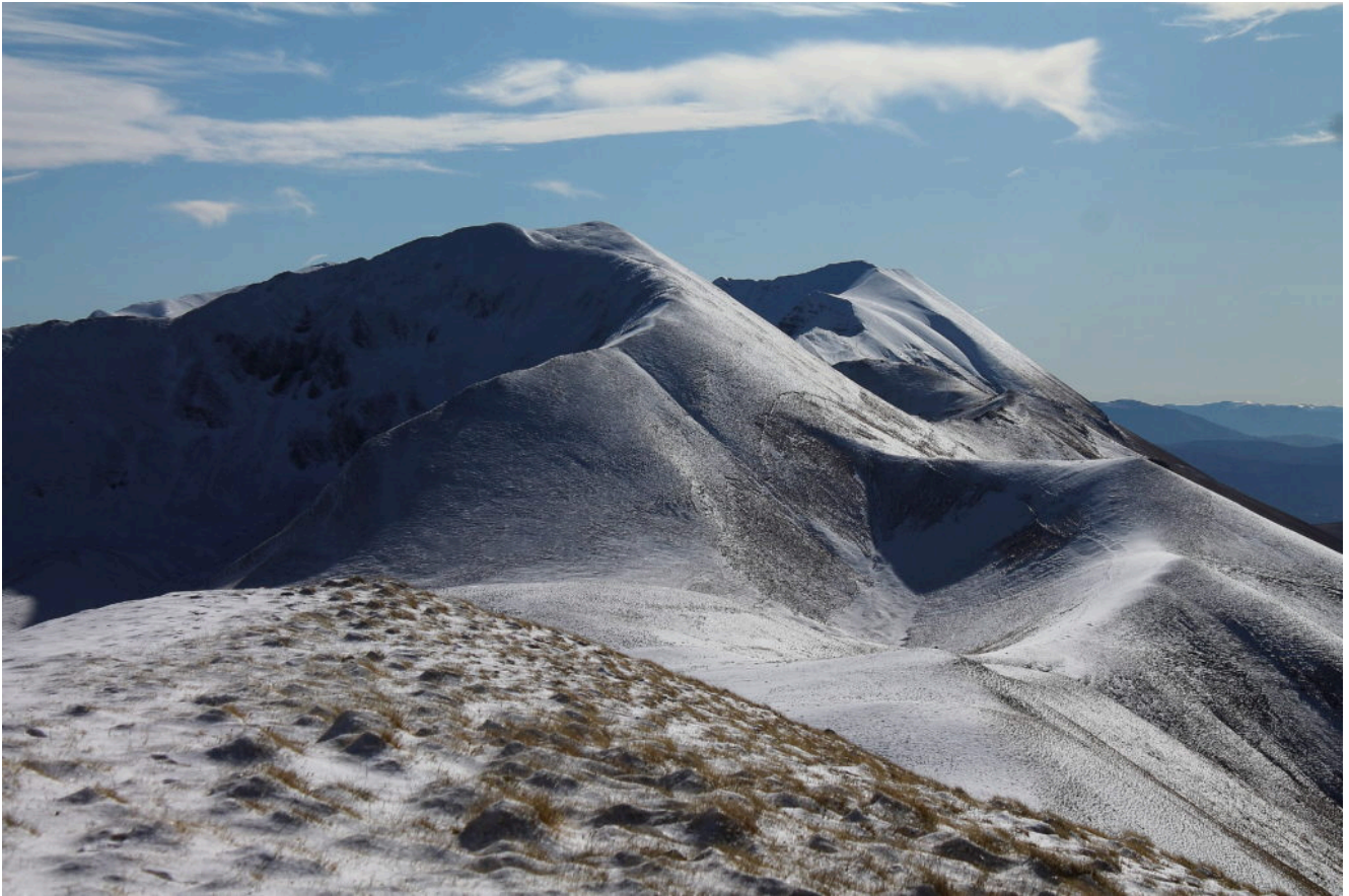
26- Il Monte Porche e la Cima del Redentore a destra.