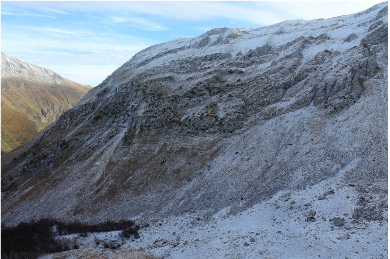
4- Il versante ovest di Cima Cannafusto nella Valle Orteccia.