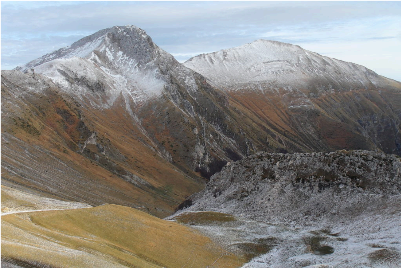
2- Il Pizzo Berro e il Pizzo Regina visti dalla zona "Le Fosse", a valle di Passo Cattivo.