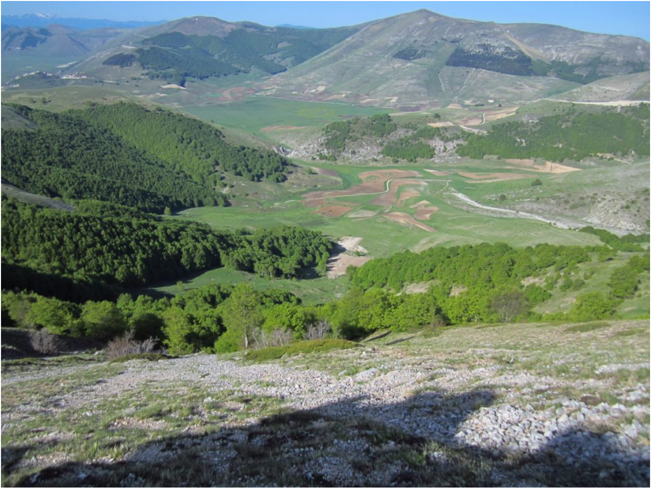
11- In alto al centro della foto il Pian Perduto e nel margine a sinistra il paese di Castelluccio