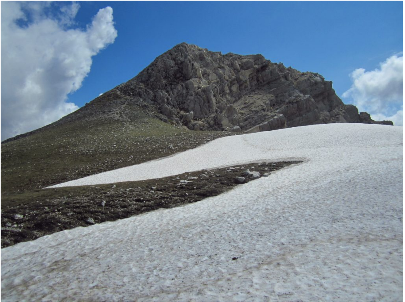
22- La cima del sasso di Palazzo Borghese.