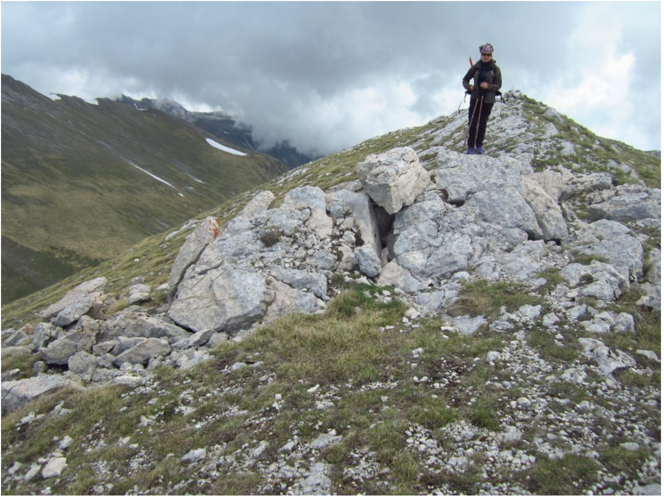
30- Sulla cima del M. Palazzo Borghese ancora effetti del terremoto, grossi blocchi di roccia sollevati e spezzati.