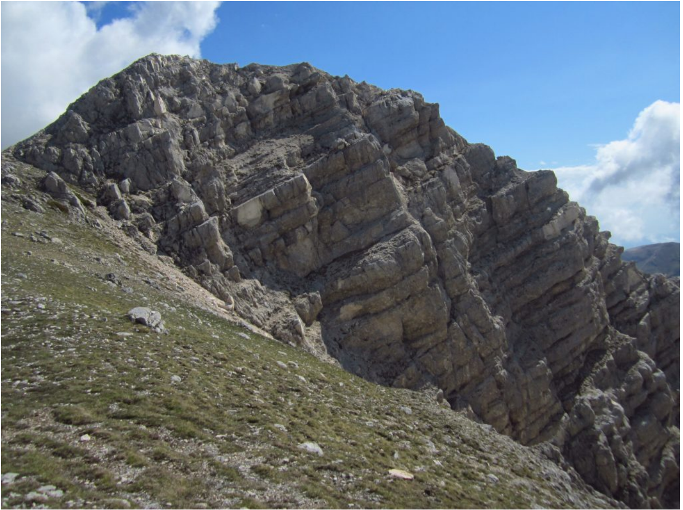
24- La parete Sud del Sasso di Palazzo Borghese.