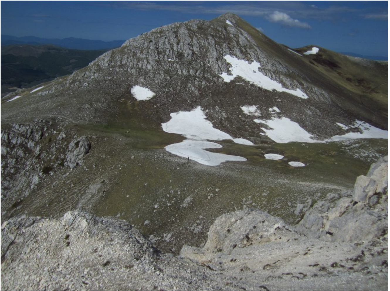
27- La cima del Monte Palazzo Borghese vista dal Sasso.