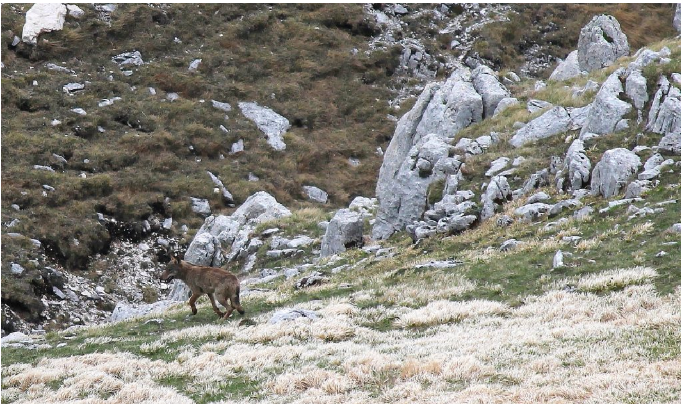
31- Scendendo per la "strada imperiale" poco prima del