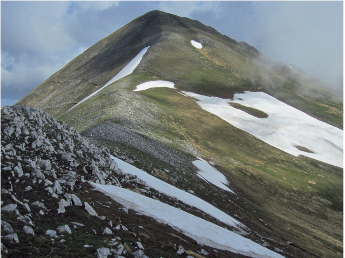
20- Il versante Sud del Monte Porche con la faglia ben visibile che prosegue sul pendio sotto la cima.