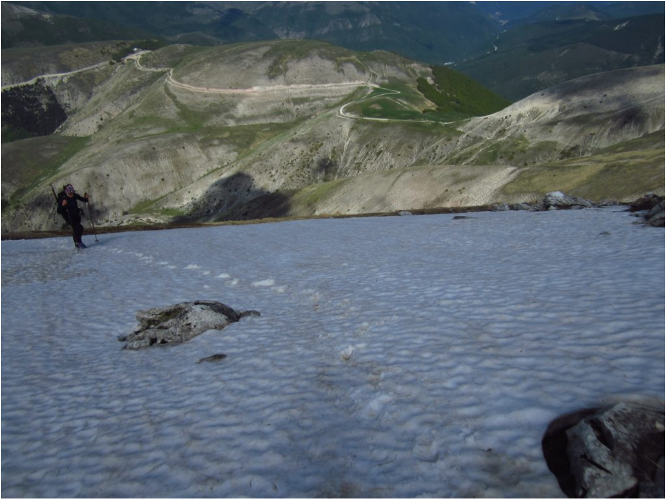
19- Un breve tratto innevato prima della cresta, sullo sfondo il Monte Prata a sinistra e strada che conduce alla Fonte della Giumenta a destra.