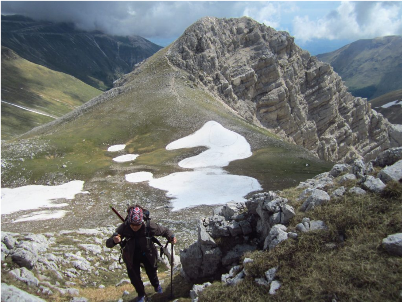
29- salendo al M. Palazzo Borghese con alle spalle il sasso salito poco prima.