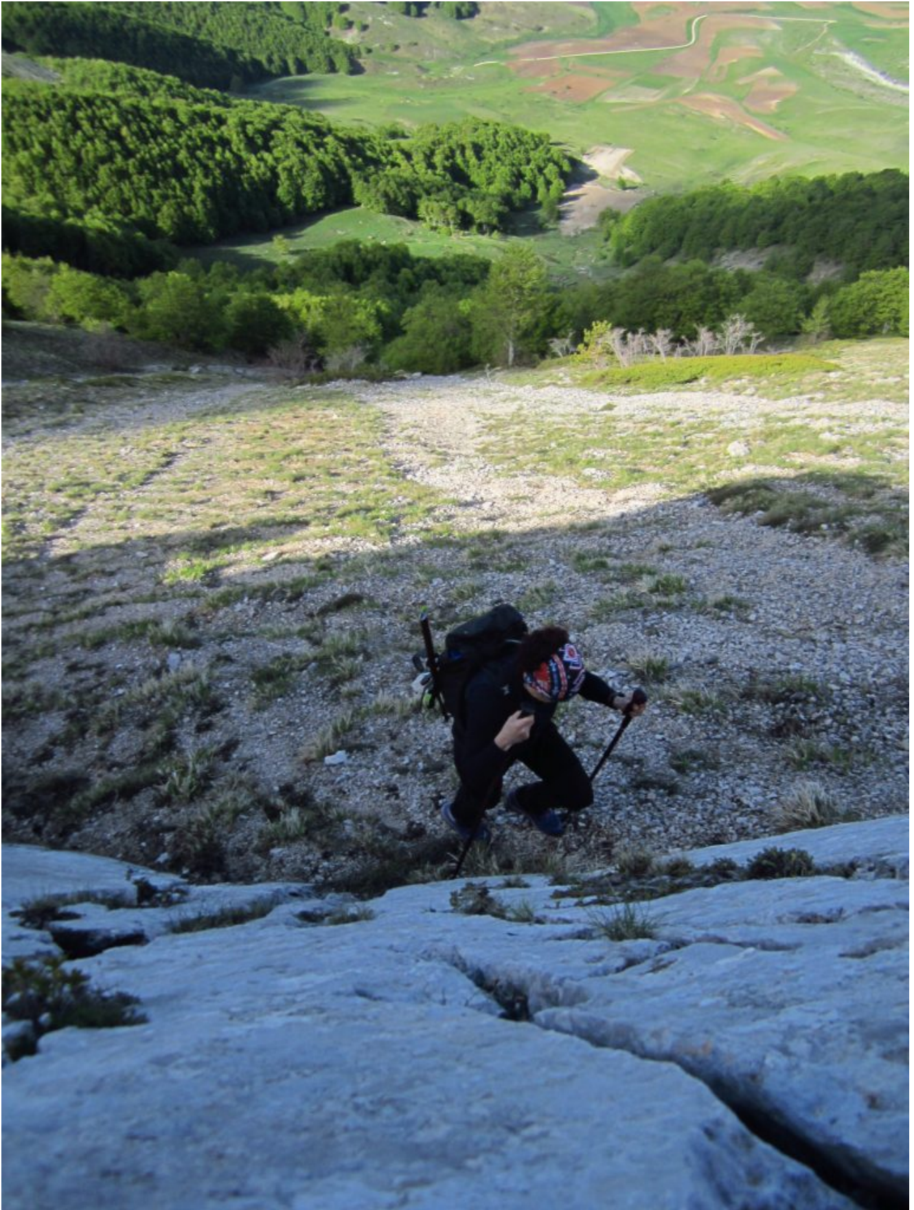
10 – 11- La faglia incombe sulla conca del San Lorenzo.