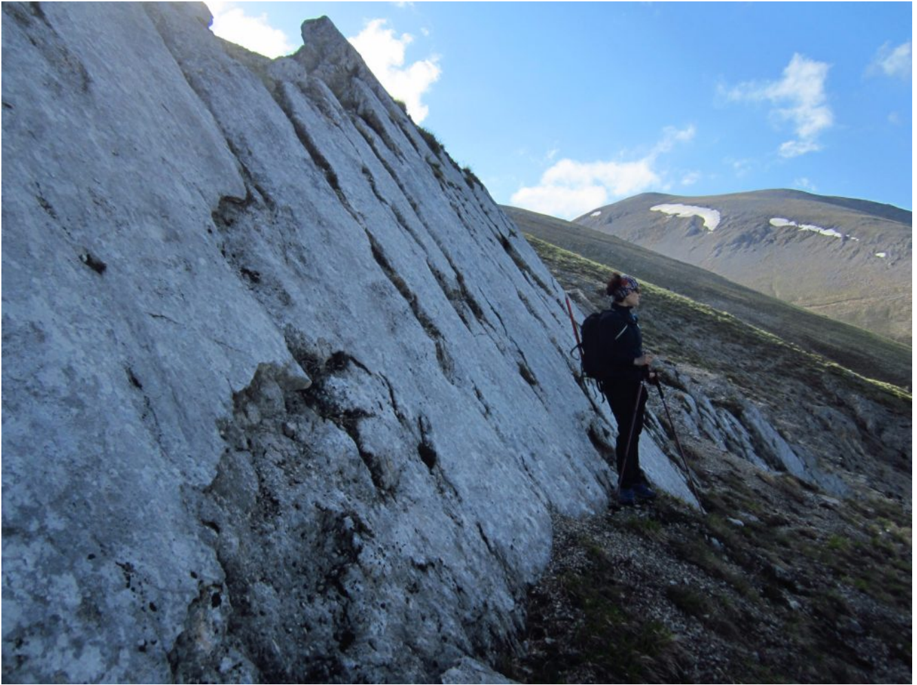
8- Sullo sfondo il canale Ovest e l'anticima del M. Argentella.