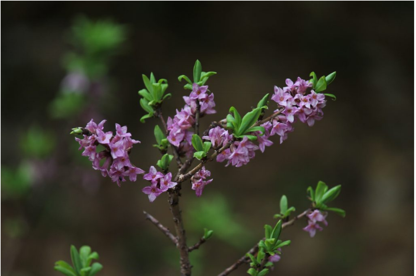
34- Daphne mezereum profumatissima nel bosco di San Lorenzo.