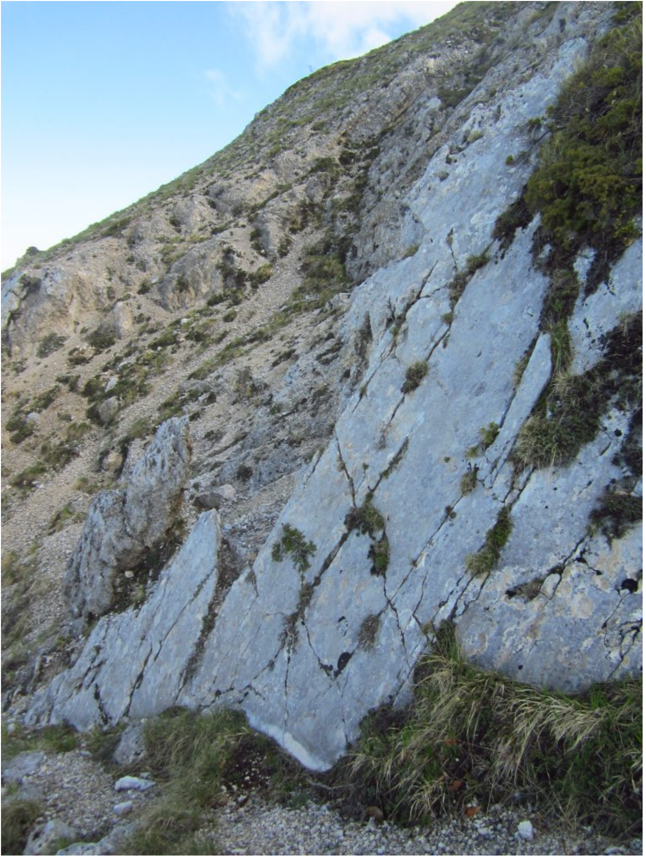
3 -4- Le liscissime placche della faglia con il lieve abbassamento del terreno visibile come linea bianca in corrispondenza del terreno