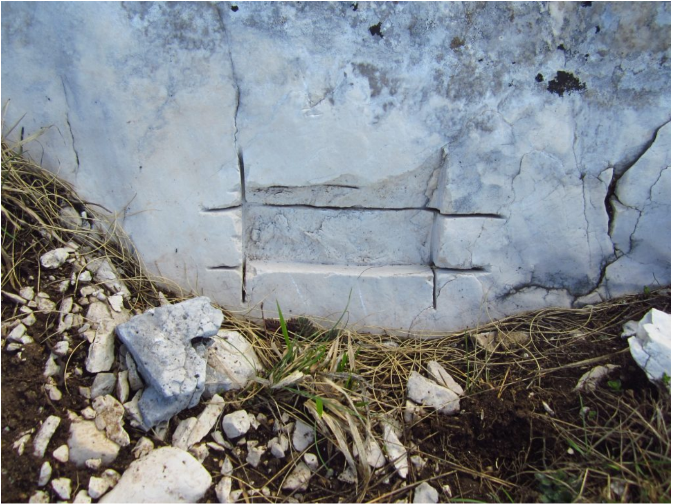
14- Su un tratto di roccia scoperta dall'abbassamento del terreno qualche geologo ha staccato un provino per studio.