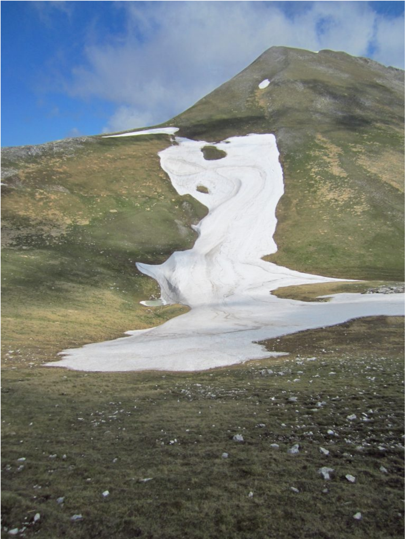
21- Un consistente accumulo di neve forma anche un piccolo laghetto sotto alla cima del Monte Porche.