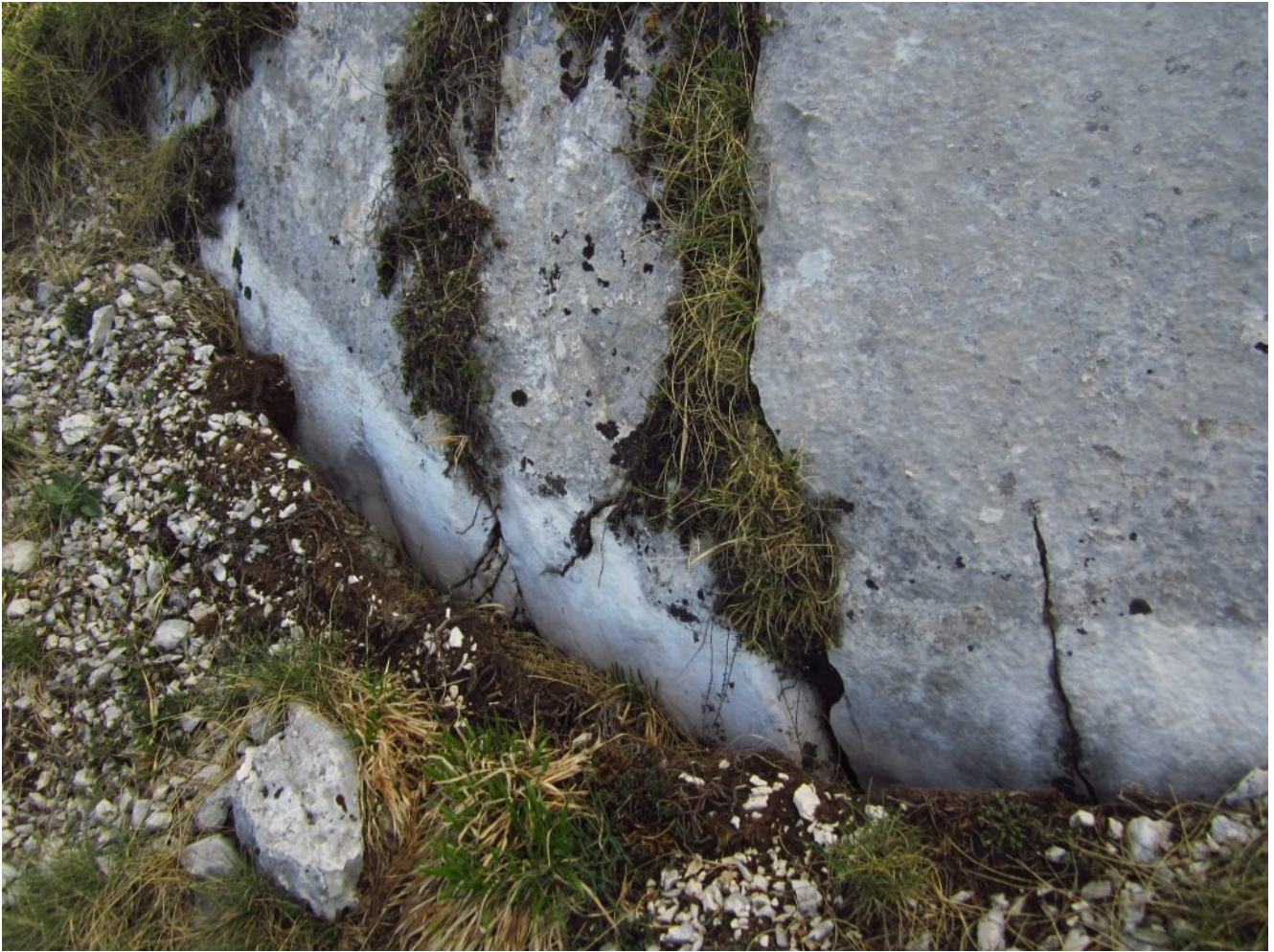
12- Dettaglio dell'abbassamento del terreno che si è verificato in questo tratto di faglia.