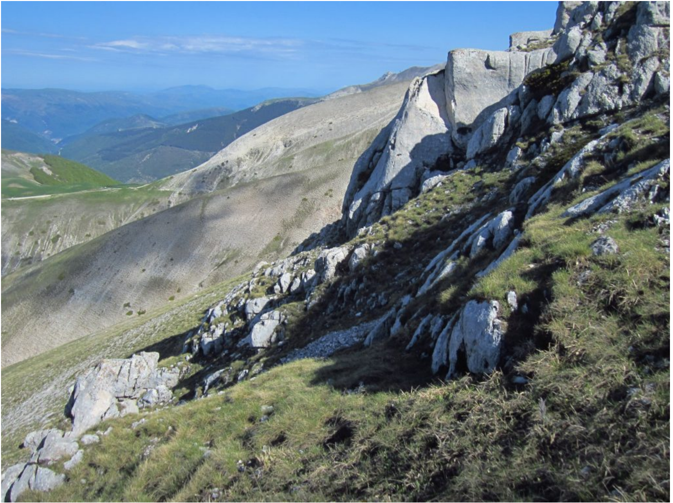
16- Giunti sulla verticale della cima del M. Palazzo Borghese sono presenti dei torrioni di roccia.