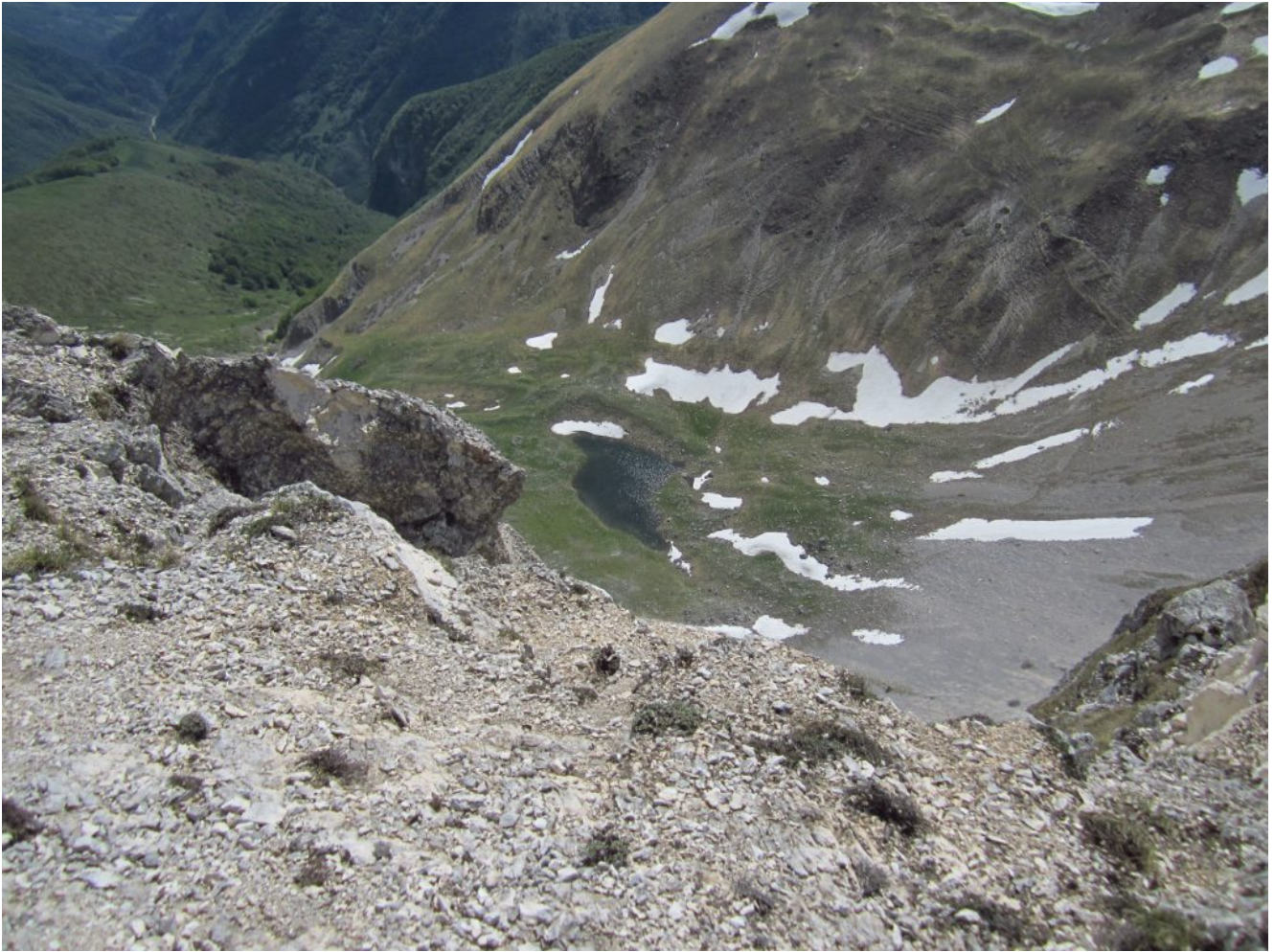
25 – 26- Veduta verticale dalla cima di Sasso di Palazzo Borghese sul “laghetto” sottostante