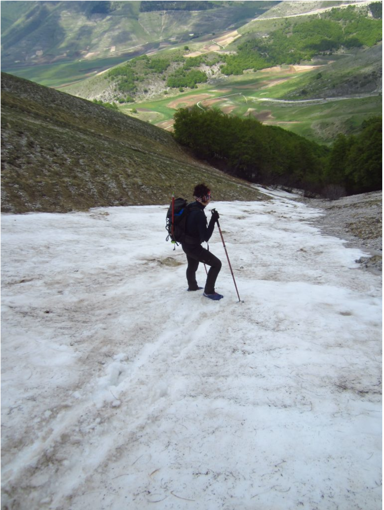
33- Discesa rapida scivolando sulla neve nella parte terminale del canale Ovest del. M.Argentella ci riporta brevemente alla conca del San Lorenzo.