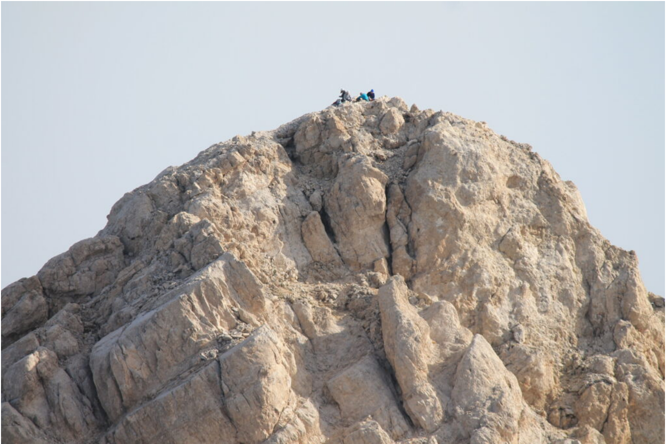
49 – Escursionisti sulla Cima Orientale.