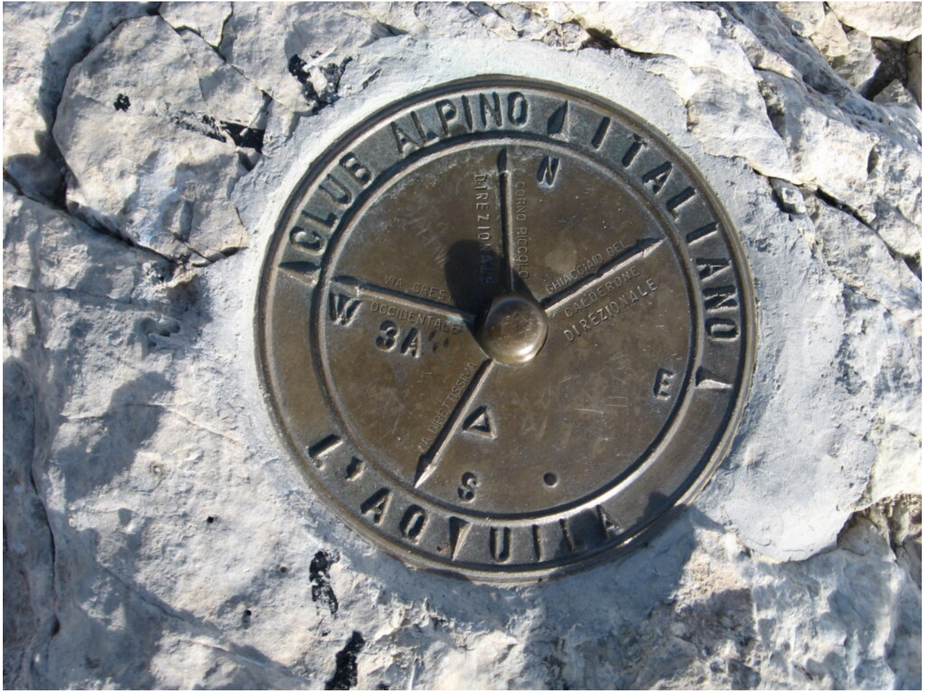
28- La targa altimetrica della cima del Corno Grande.