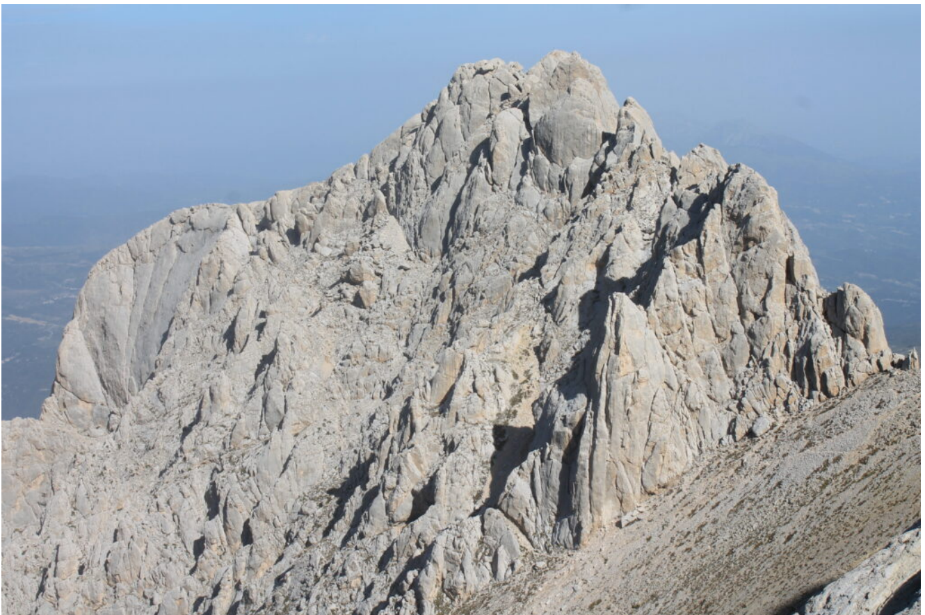
50- Il Corno Piccolo visto dalla Sella dei Grilli.