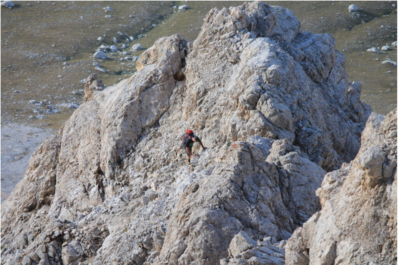
47- Altri escursionisti salgono dopo di noi.