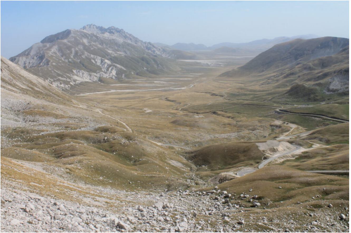
57 -Campo Imperatore