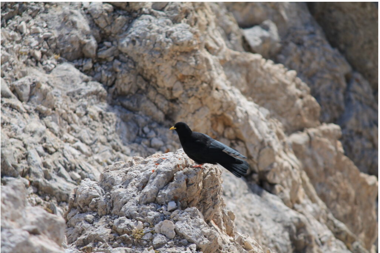
48- Un Gracchio ci sorveglia da vicino.