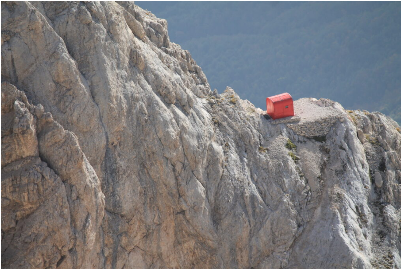
44- Il Bivacco Bafile