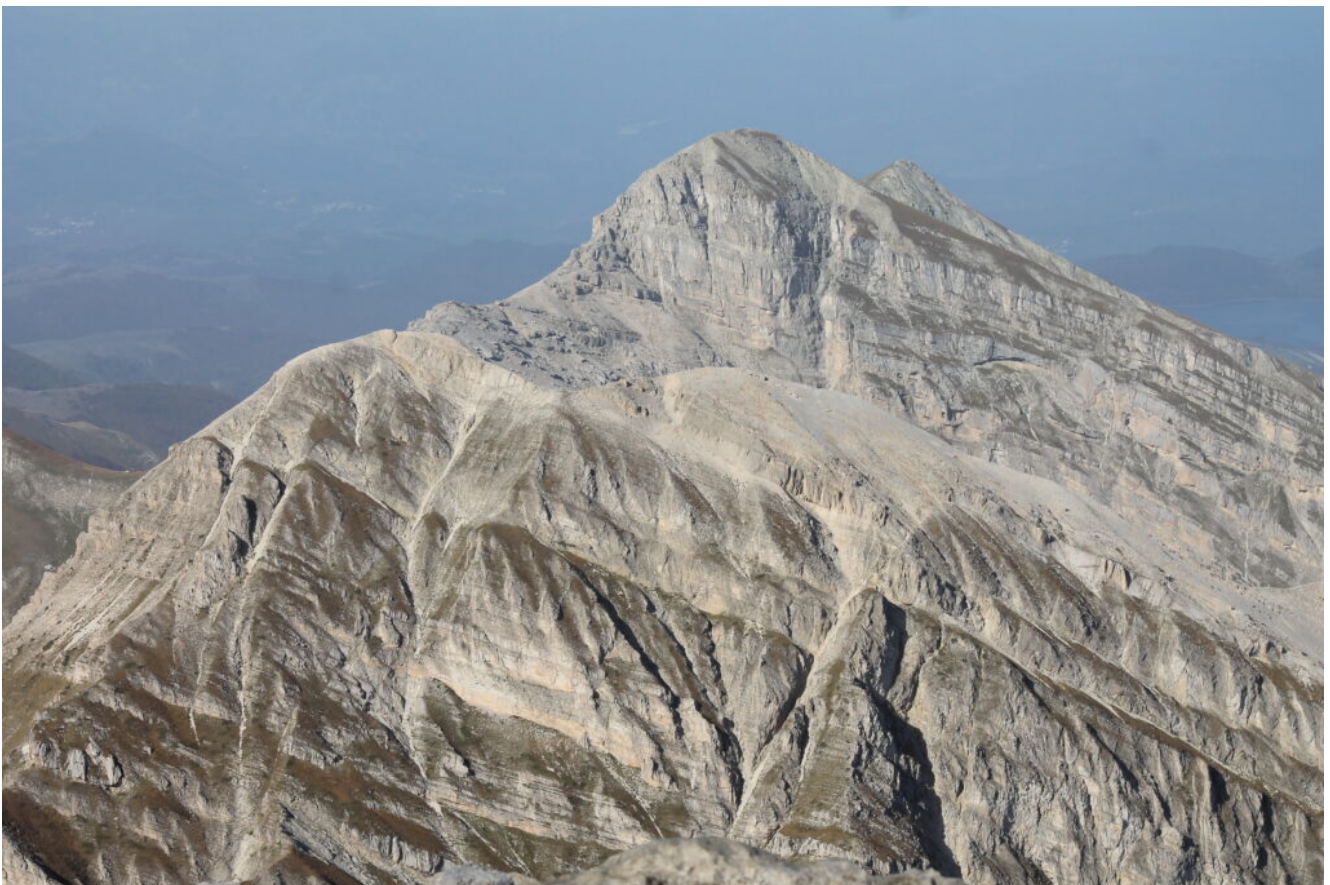
46- Il Pizzo d'Intermesoli