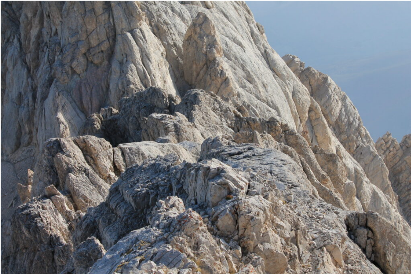
45- La cresta Est.