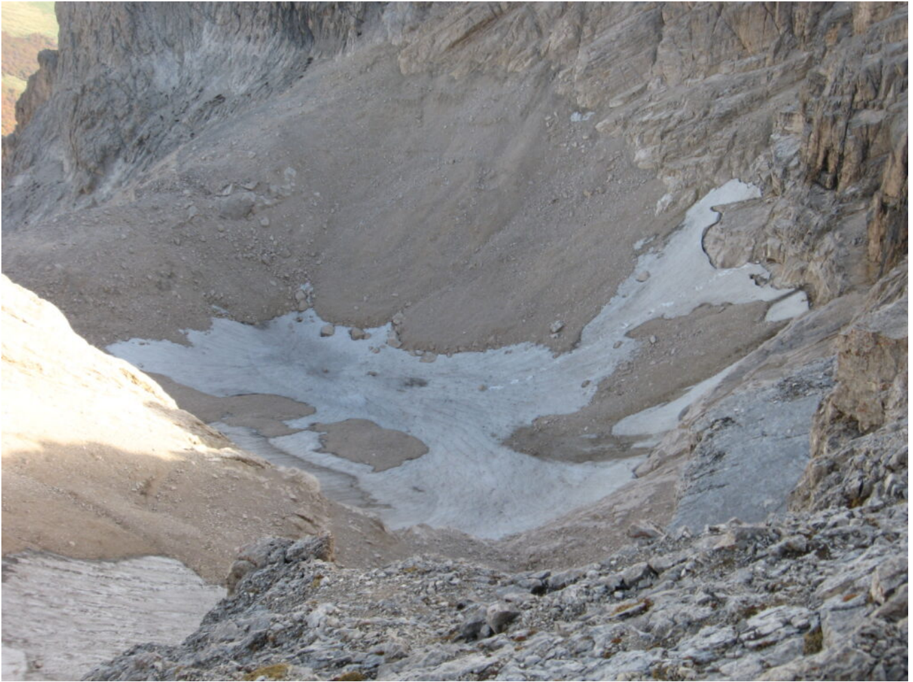
27 – Il Ghiacciaio del Calderone