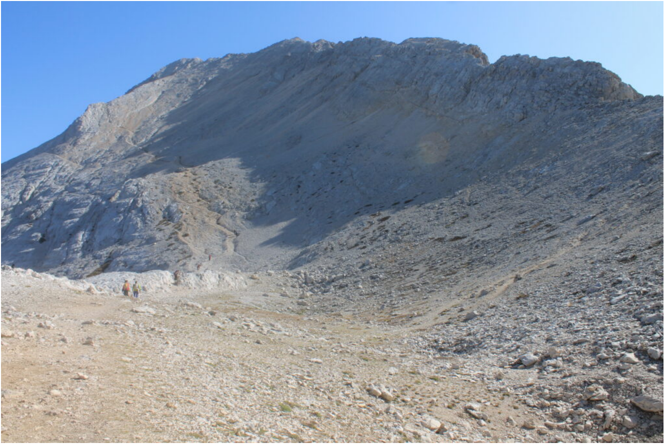
51- La cima del Corno Grande visto dalla Sella dei Grilli.