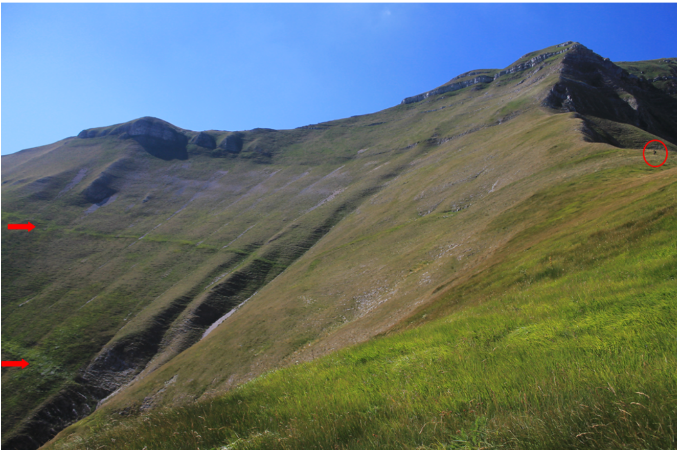
13- L'imbuto di "Mèta" nel lato sinistro della cresta di