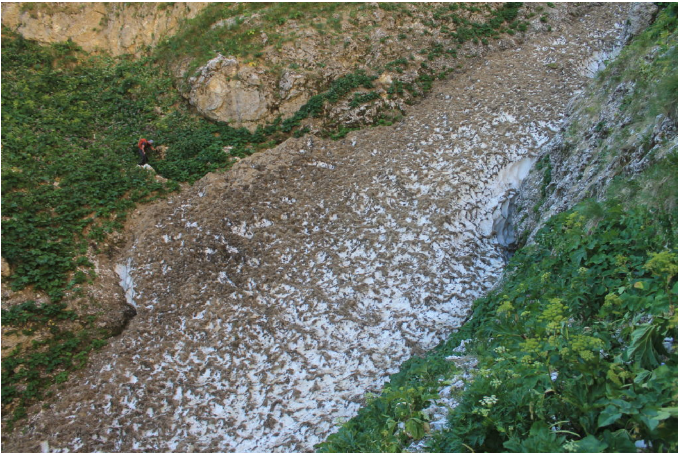
6- Attraversamento del Fosso di Mèta III con ancora un grande nevaio.