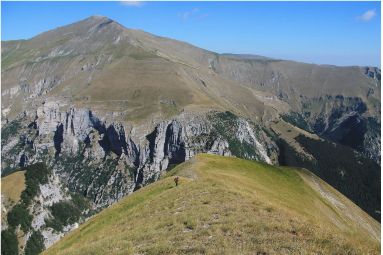
12- Il ripiano erboso oltre il primo ripido tratto di cresta (a destra), di fronte i "grottoni" con la cengia delle ammoniti e la cima del M. Priora.