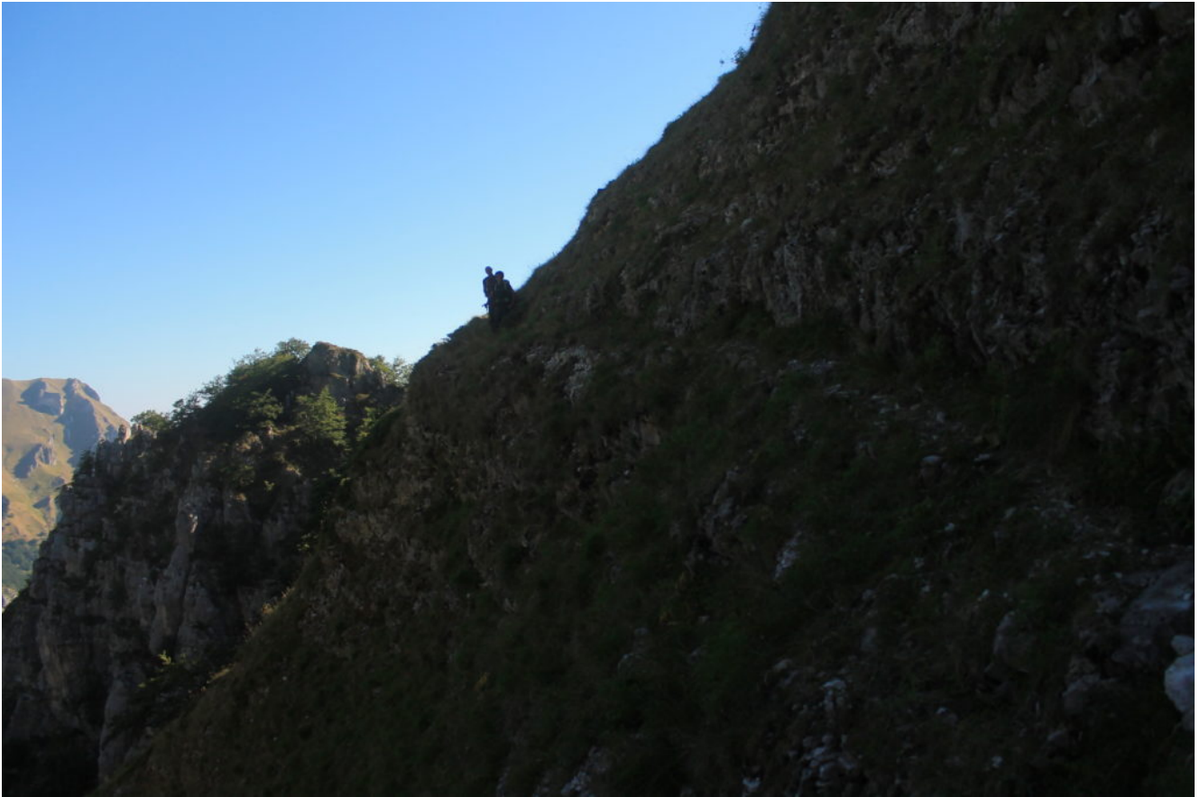
5- Attraversamento del Fosso di Mèta I, il tratto più ripido dell'avvicinamento, a sinistra il Pizzo (M.Priora)