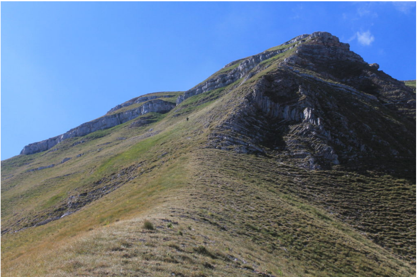
16- Arrivati dove il pendio si impenna si traversa verso la "corona" del M. Sibilla nell'unico tratto superabile senza