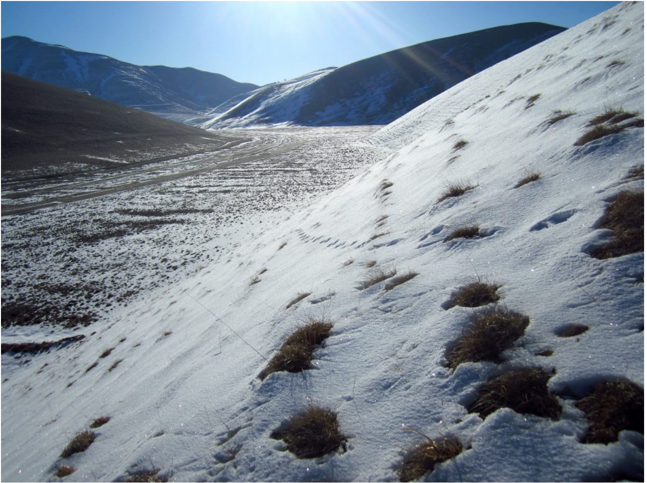
7- Veduta verso la Valle del Bonanno dal pendio di salita, a sinistra in lontananza i pendii del Monte Vettoretto.