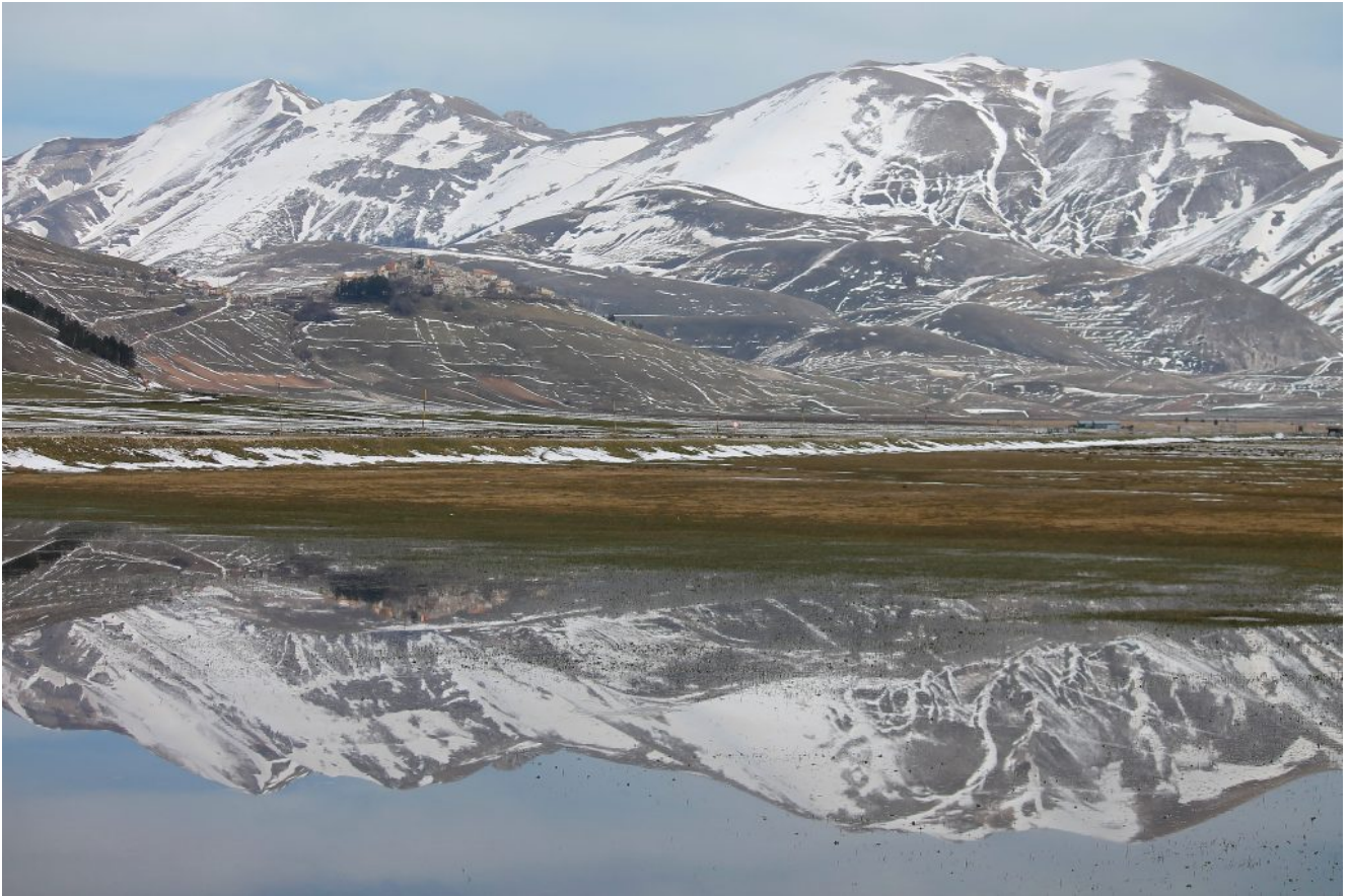
36- Il il Monte Porche e Monte Palazzo Borghese e Monte Argentella con i Colli Alti e Bassi di fronte e Castelluccio a sinistra.