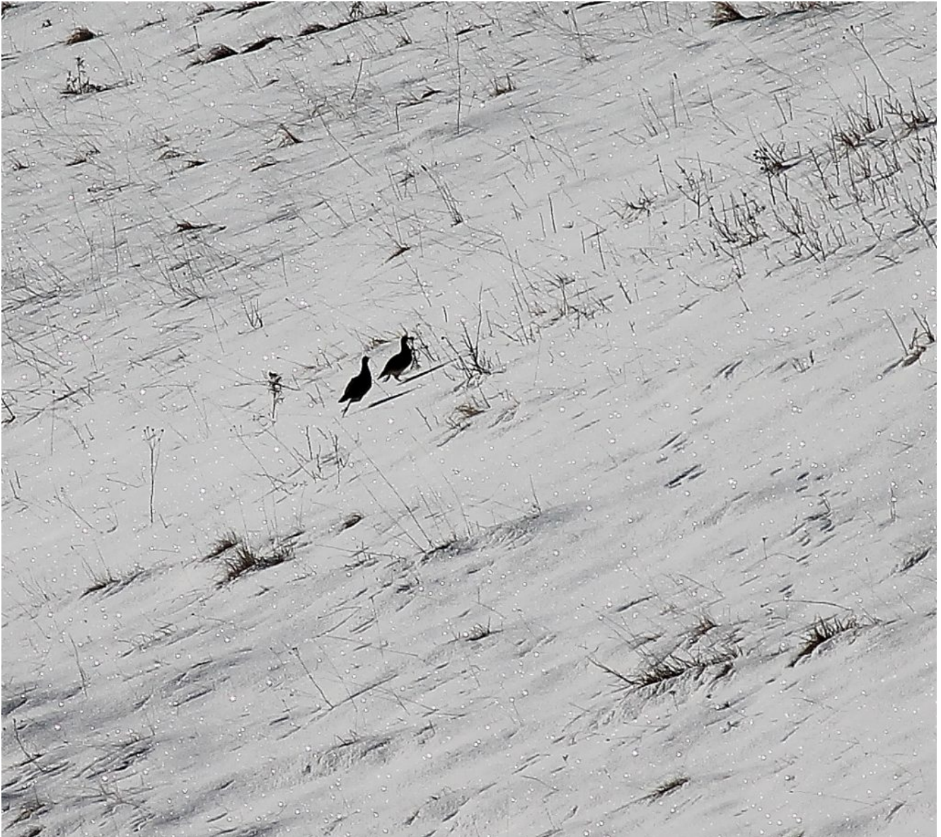
6- Una coppia di Coturnici sale il pendio.