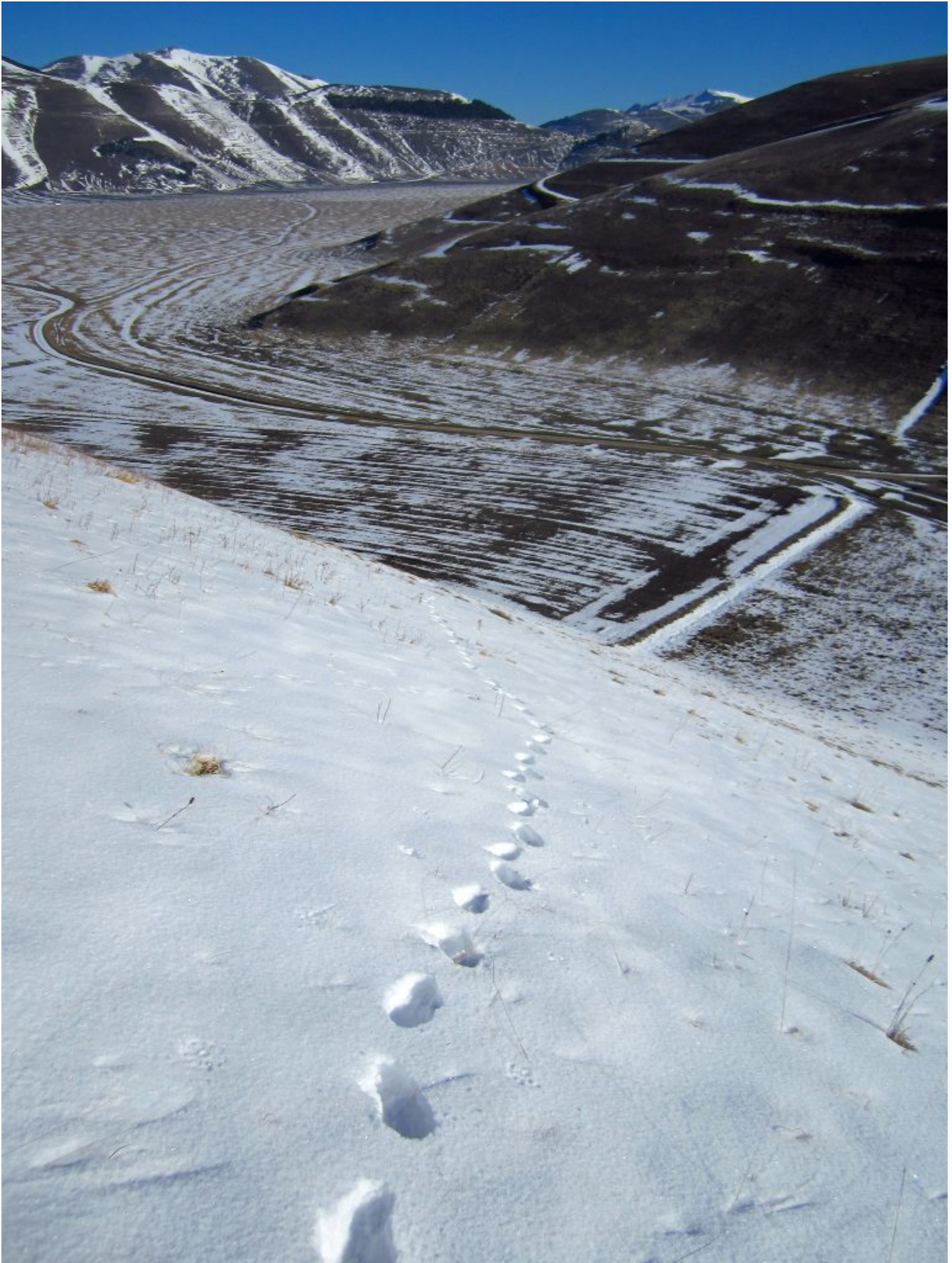
5- Salendo il pendio della cresta Nord del M. Guaidone si nota perfettamente il tratturo di collegamento al Ranch da cui si parte.