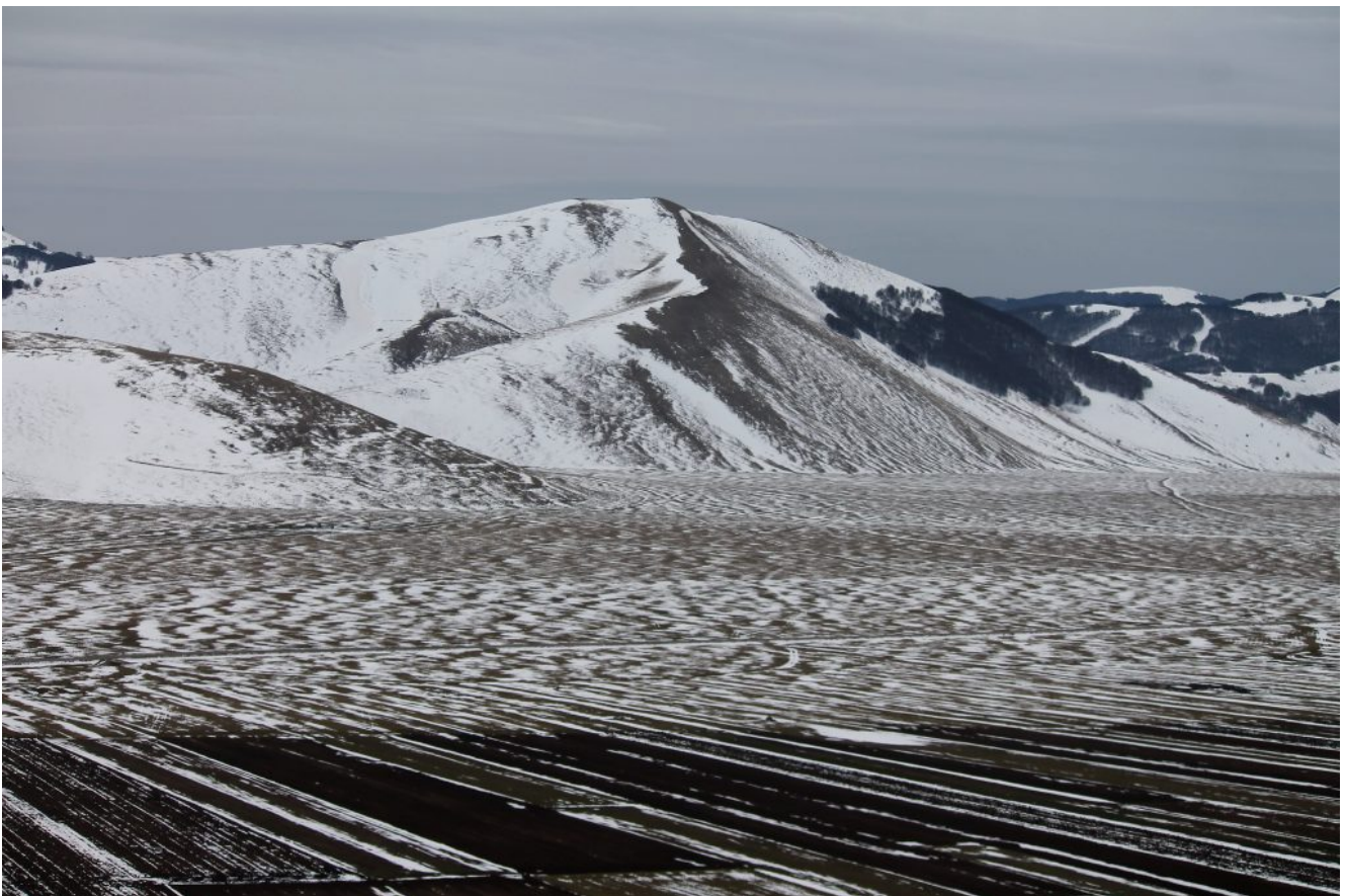
40- Alle 12 il cielo si era già coperto per il maltempo annunciato al pomeriggio, il Monte Guidone visto da Castelluccio.