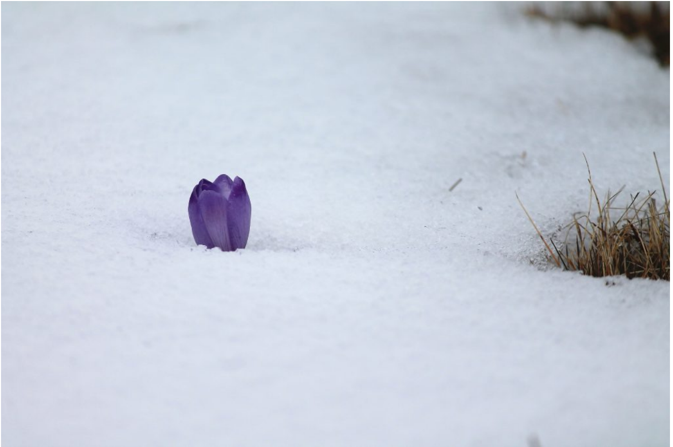
39- Un primo Croco emerge dalla neve.