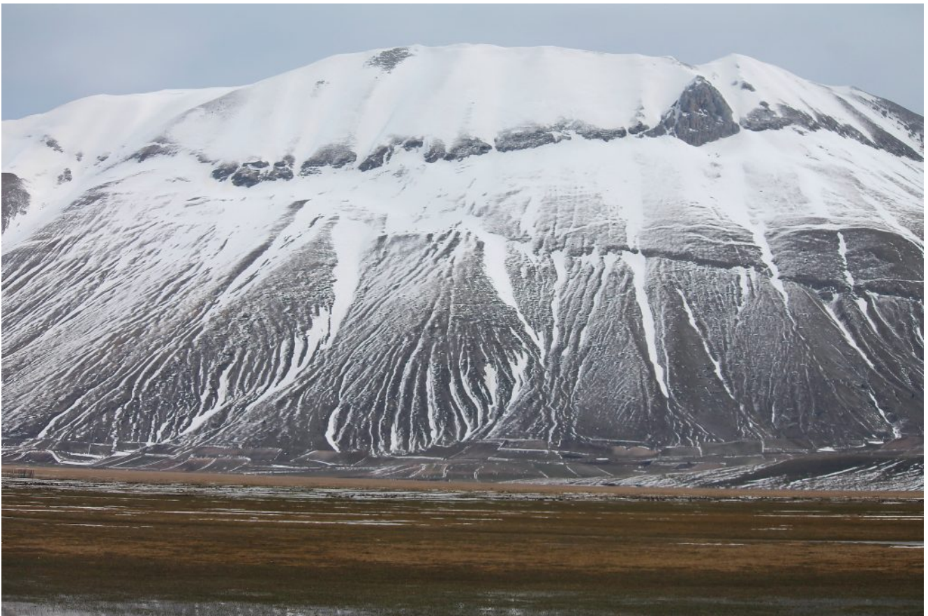
37- La Cima del Redentore con innevamento desolante nonostante