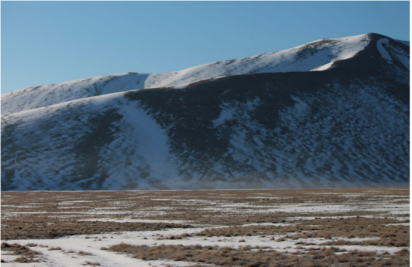
2- Dettaglio delle due creste parallele proposte per la salita al Monte Guaidone.