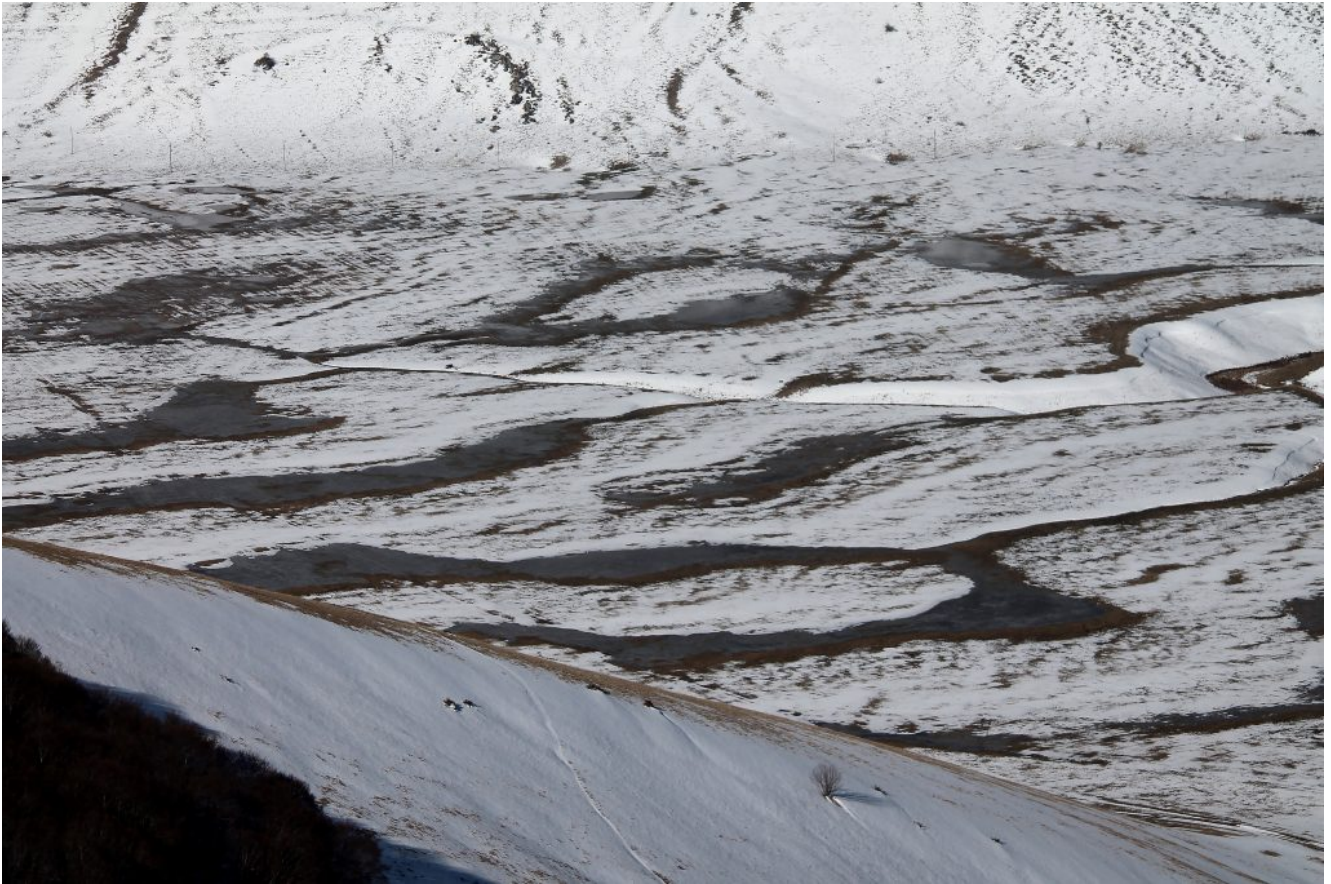
22- Dettaglio dei tanti laghetti temporanei che costellano il Fosso Mergani.