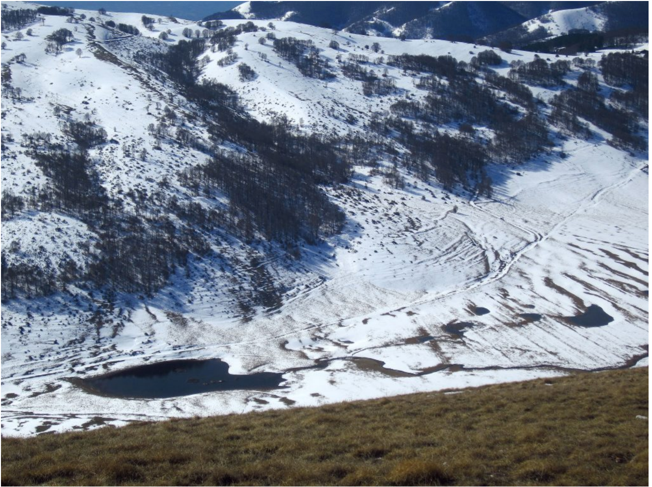
23- Panoramica verso Sud nel Piano Piccolo con il Laghetto.