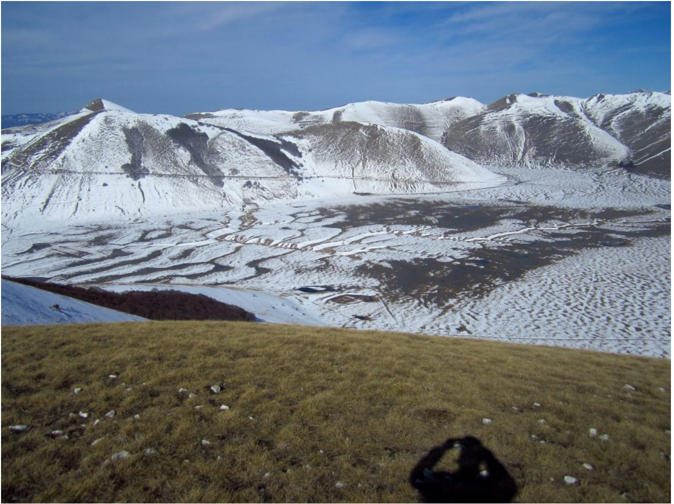
21- Panoramica verso Ovest con la parte terminale del Piano Grande nella zona del Fosso Mergani ricoperto di piccoli laghi temporanei