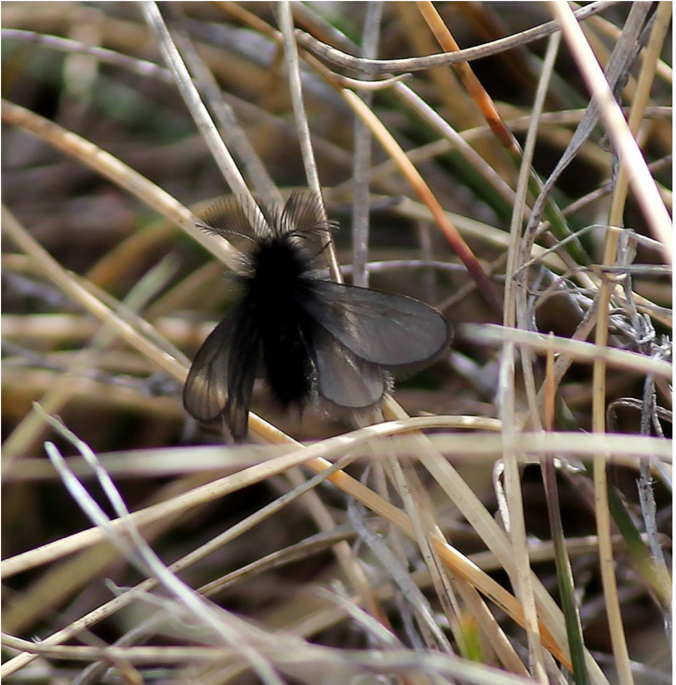
29- Ptilocephala plumifera , piccola farfalla diurna di circa 2 centimetri che si rinviene localizzata nei Monti Sibillini, a sfarfallamento precoce, fotografata sulla cima del Monte Guaidone.