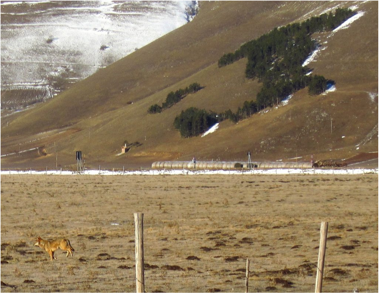
42- Lupo in transito nel Piano Grande, di fronte al rimboschimento "Italia". Panorama a 360 gradi da Monte Guaidone