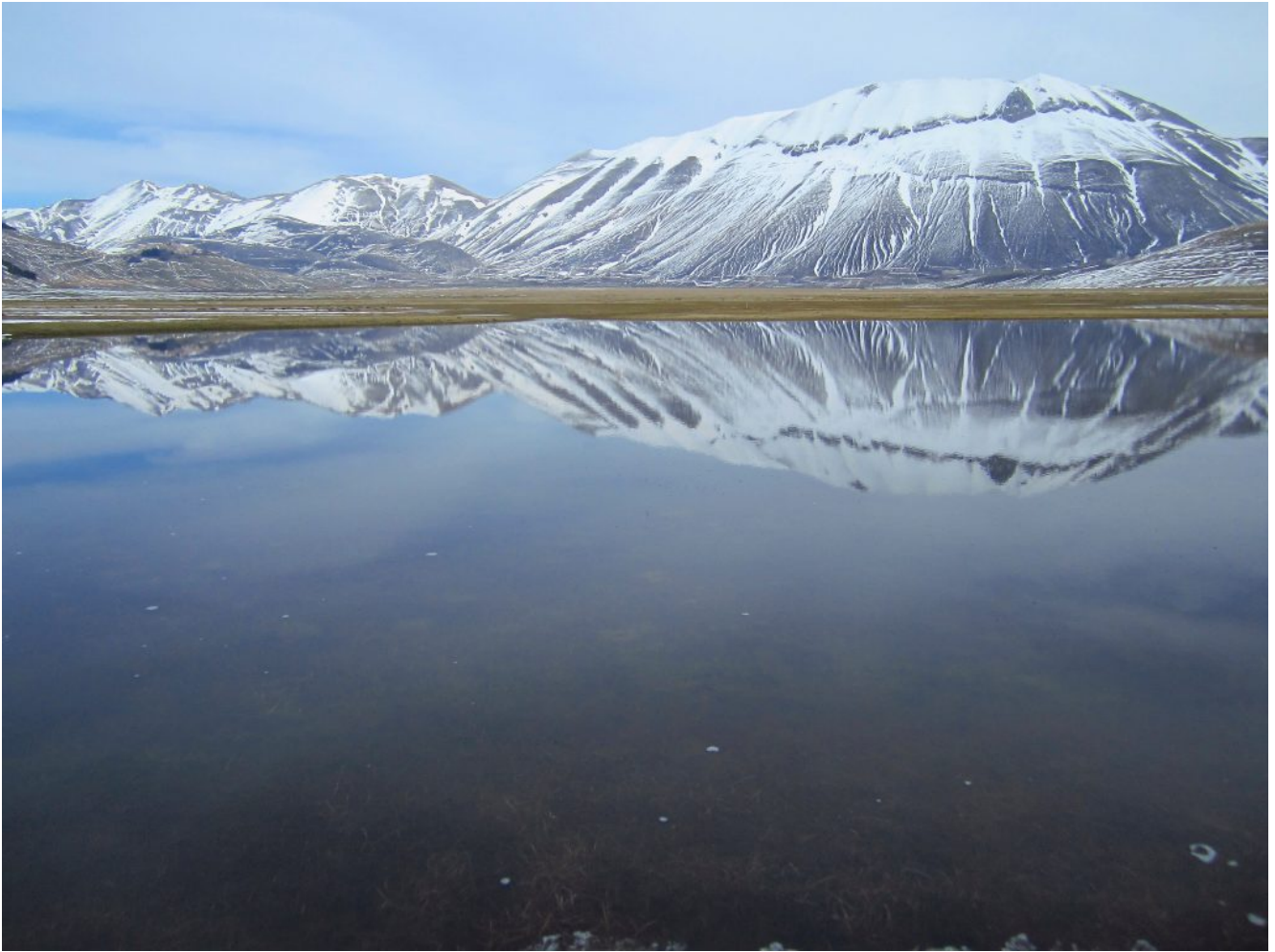
31- Da sinistra il Monte Porche e Monte Palazzo Borghese, Monte Argentella e Cima del Redentore.