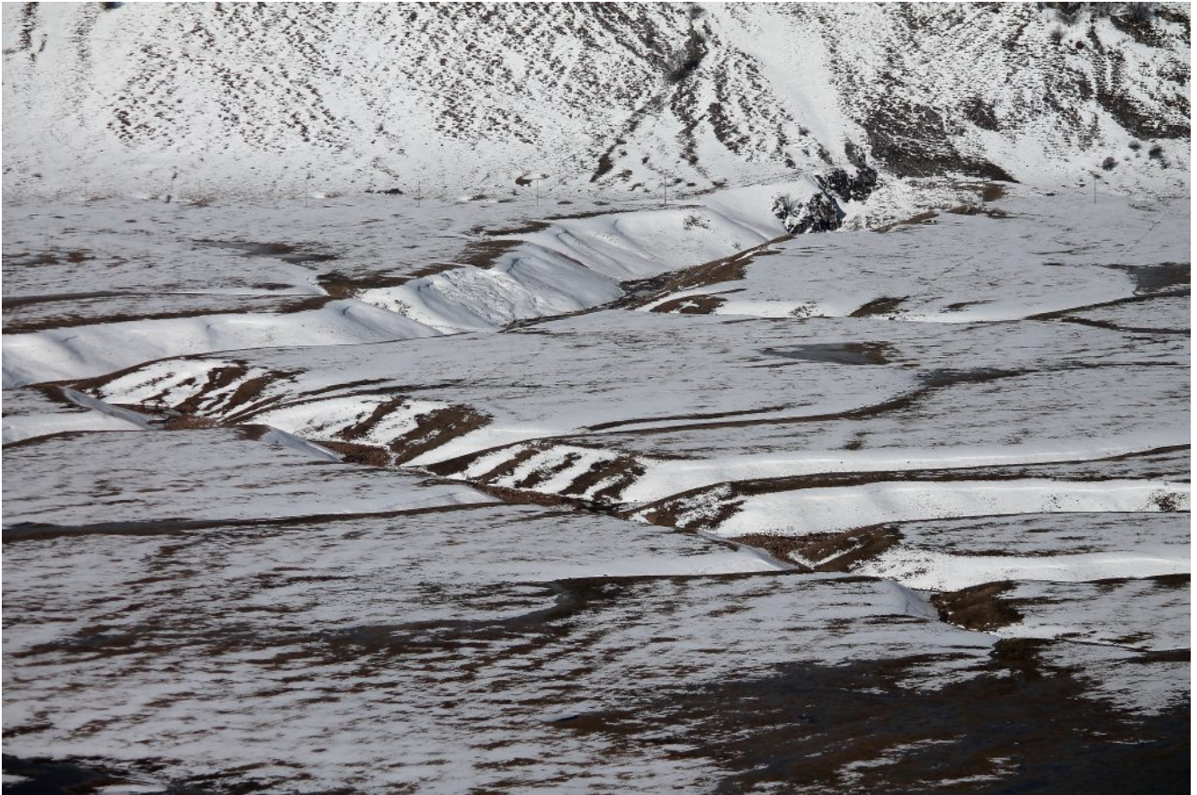
9- Dettaglio del Fosso Mergani con l'Inghiottitoio.