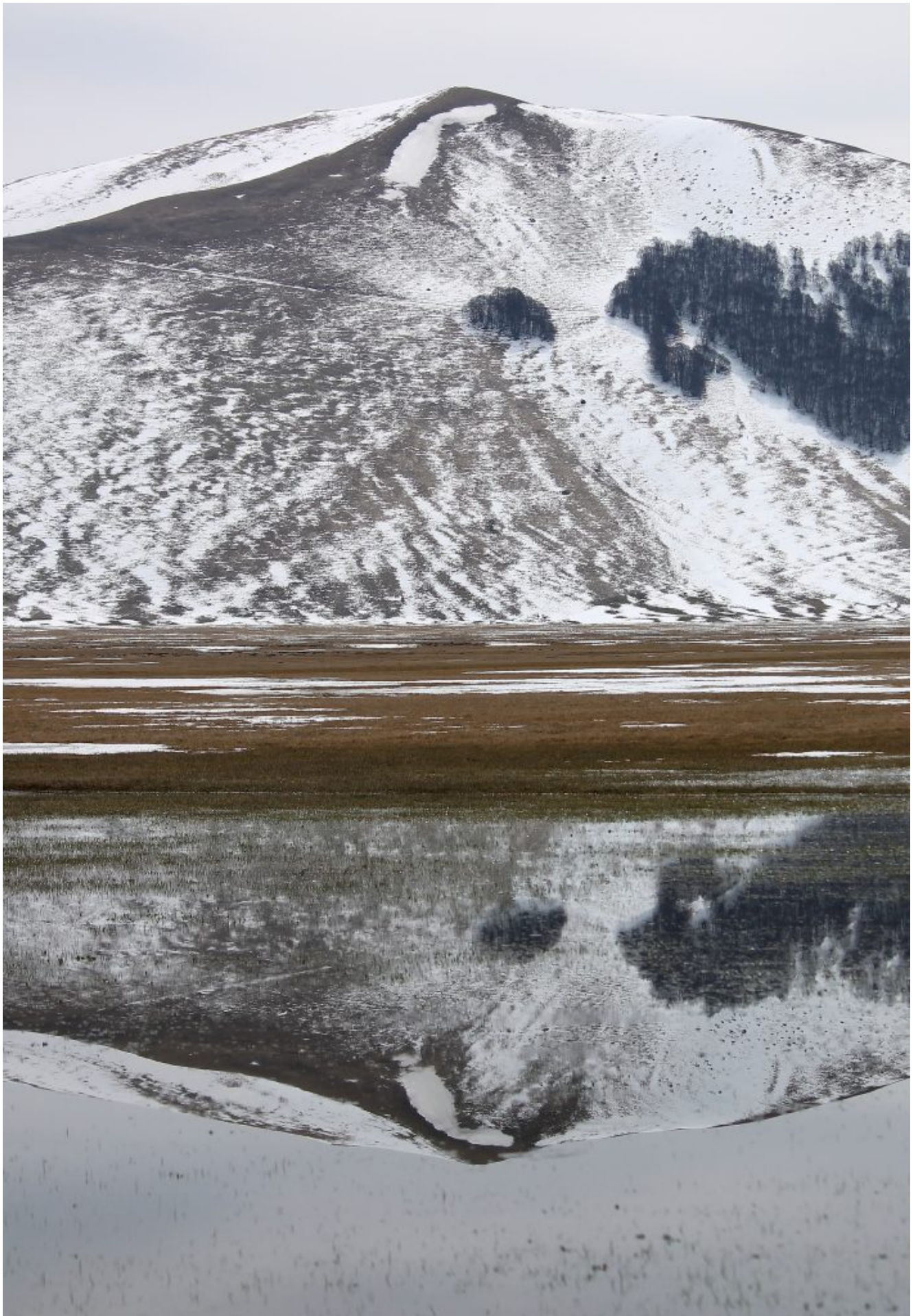
34- La cima del Monte Guaidone con la faggeta di Costa