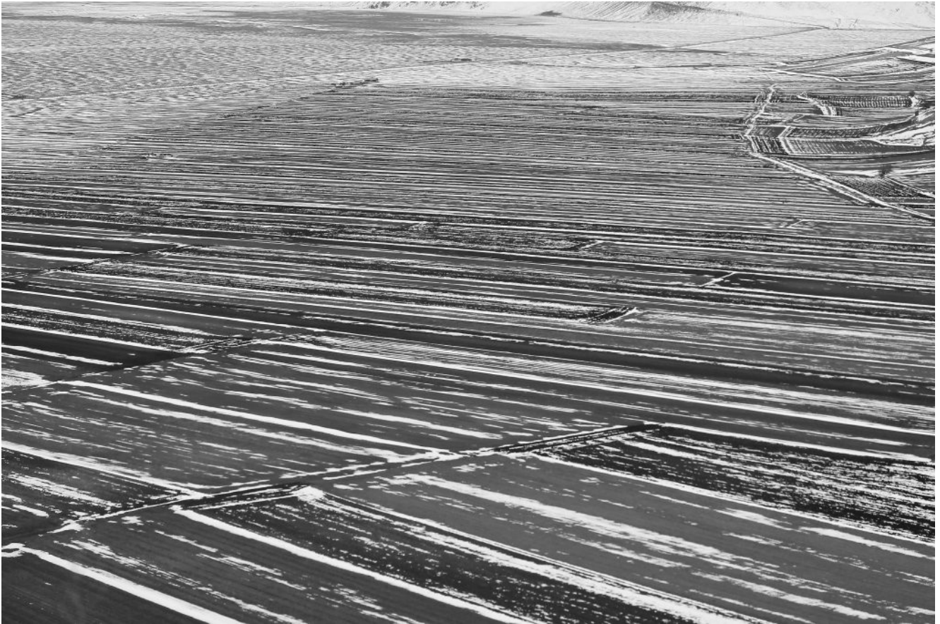
41- Bianco e nero sui campi coltivati sotto alla collina di Castelluccio