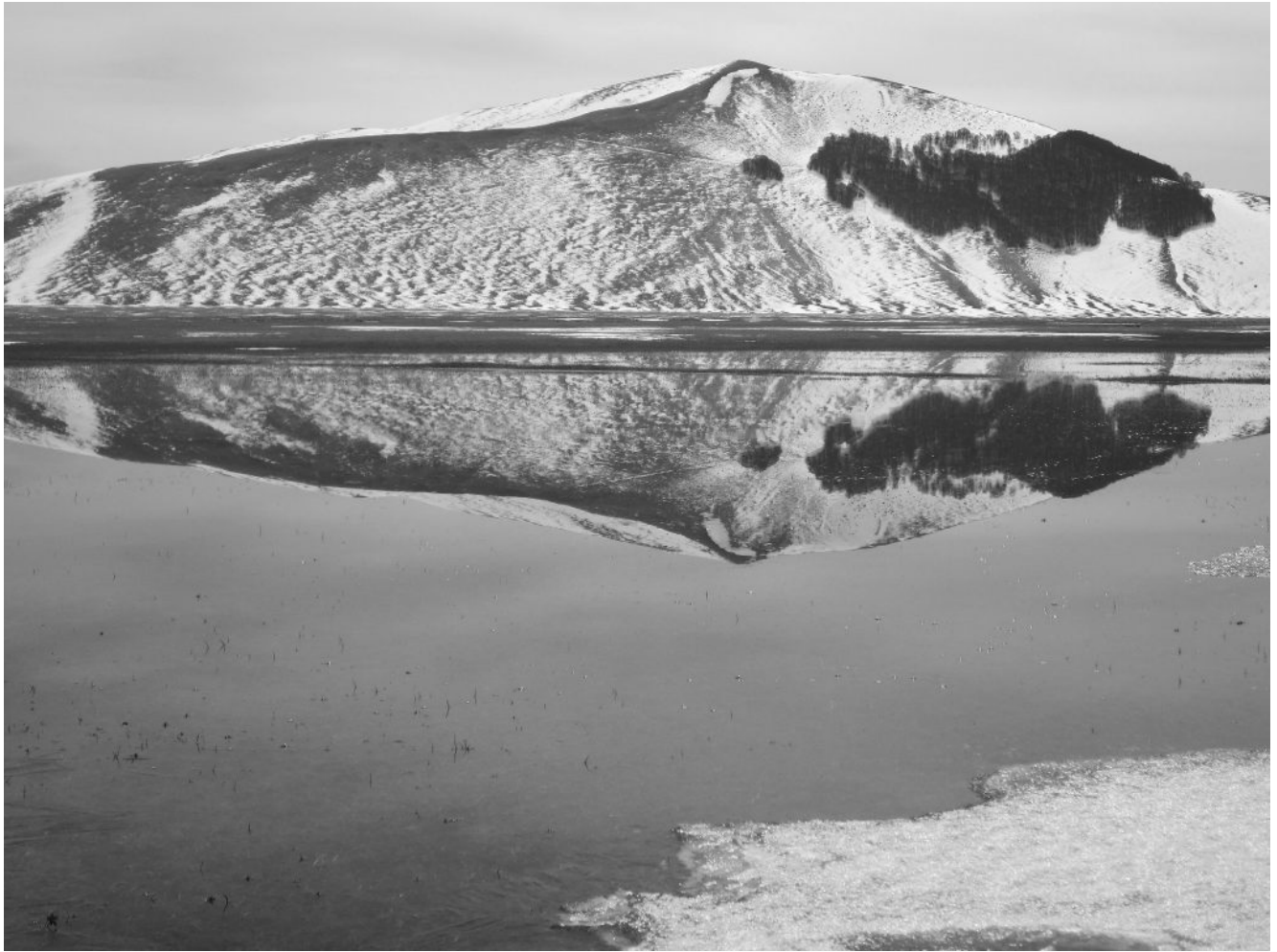
32- Bianco e nero sulla cresta di salita del Monte Guaidone.