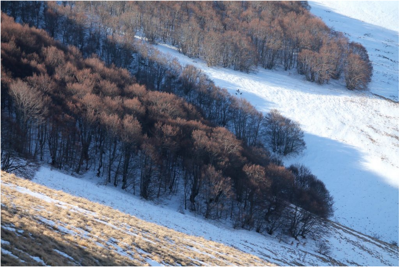
14- La faggeta di Costa Sasseti, nel versante Nord del Monte Guaidone.