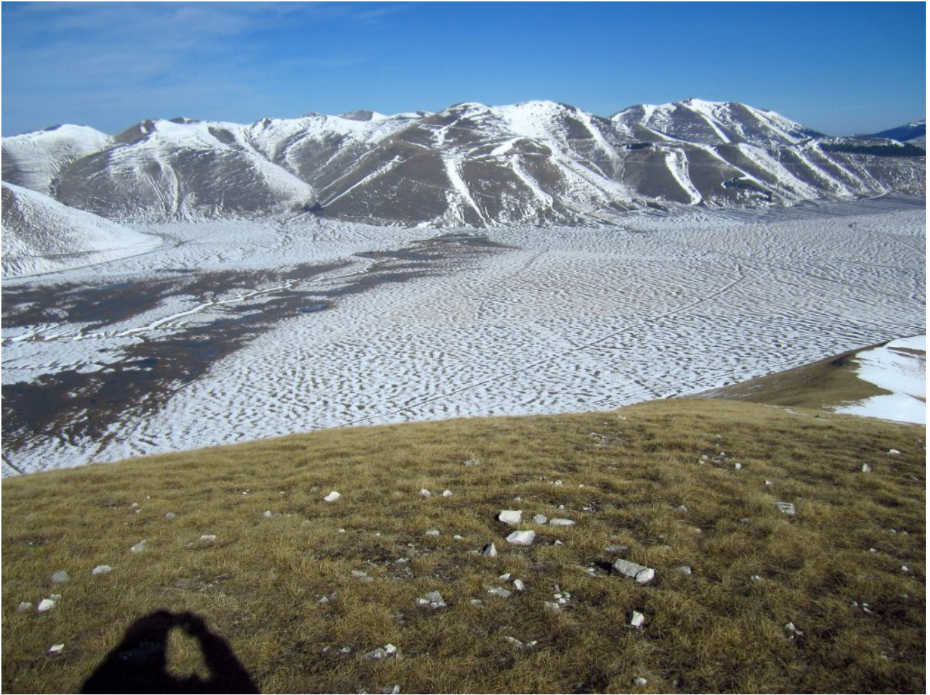
20- Panoramica verso Nord-ovest e del Piano Grande dalla cima del Monte Guaidone.