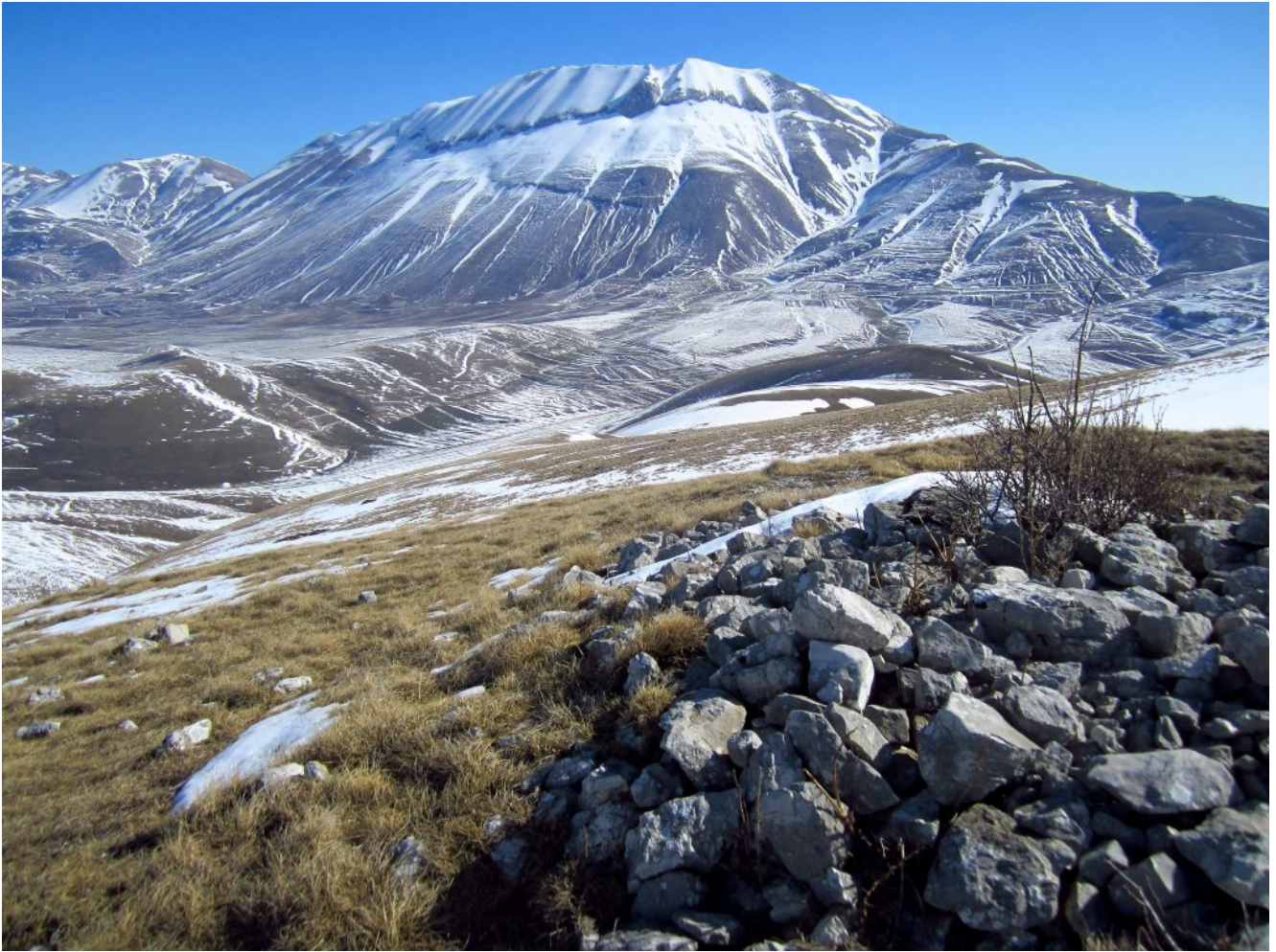
19- Panoramica verso Nord con la Cima del Redentore