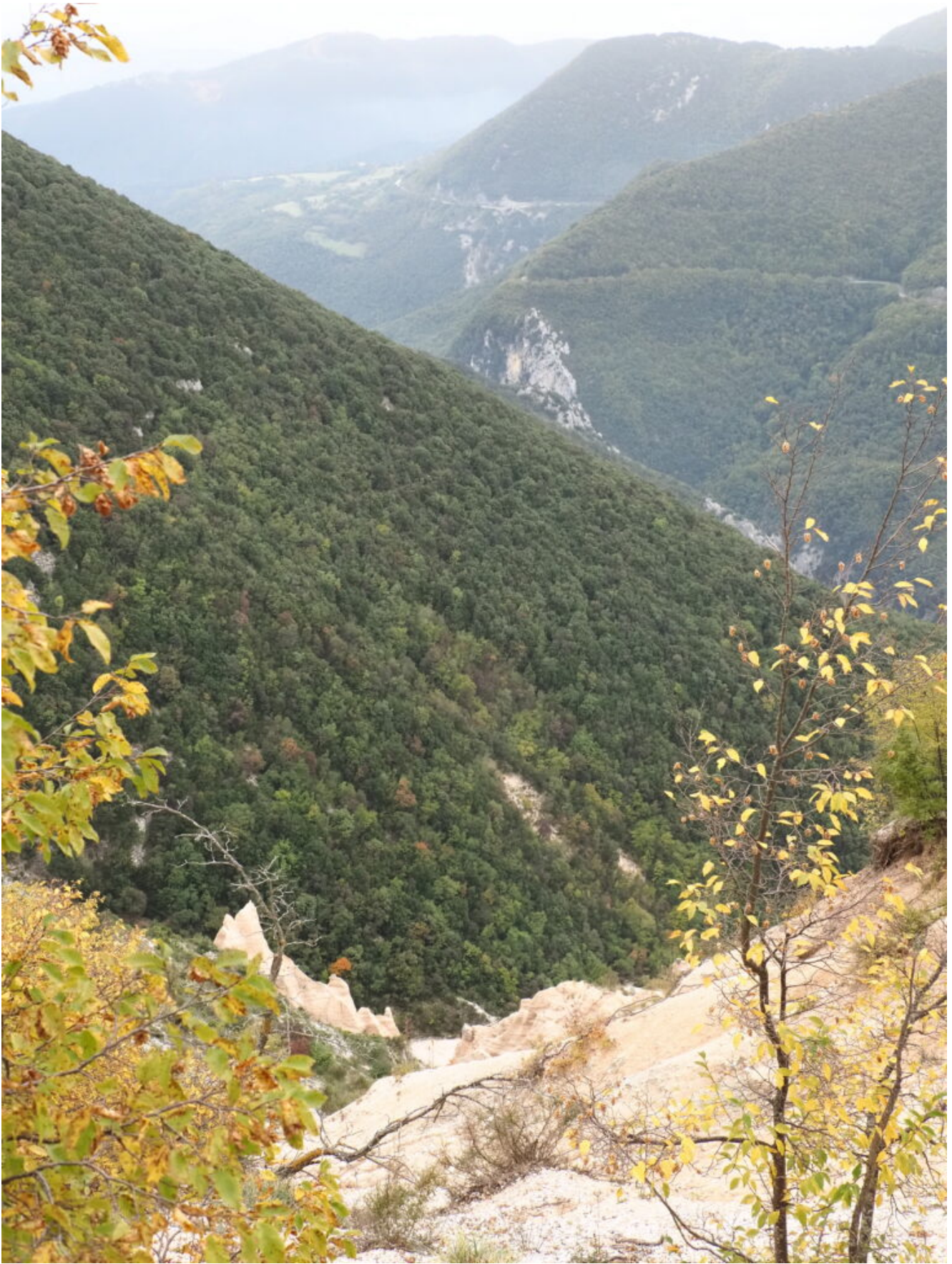
17- La Valle del Fiastrone, i campi di Monastero ed il taglio della strada che da Pian di Pieca conduce al Lago di Fiastra..