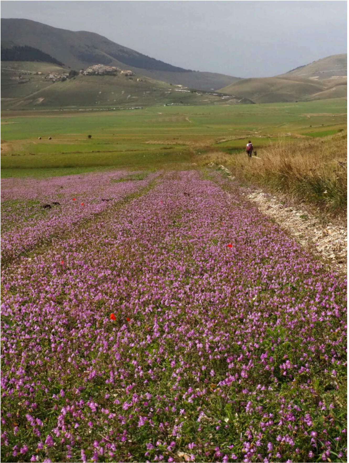
17 – 26 – Fioritura a Galeopside ( Galeopsis angustifolia subsp. angustifolia ) dei campi coltivati