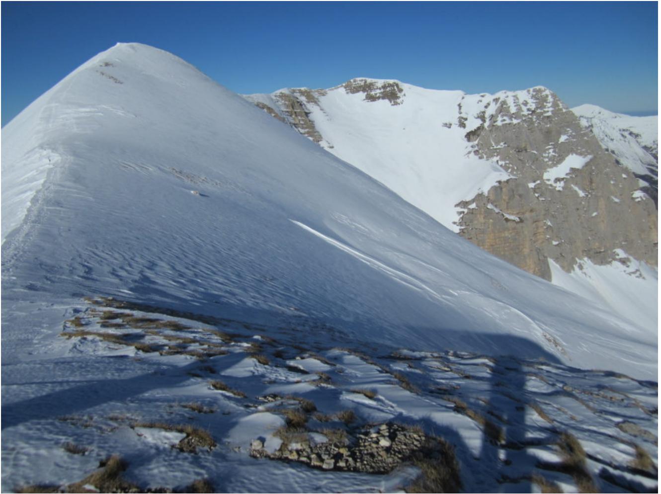
10- La Cima del Lago a sinistra e la Cima del Redentore con il Pizzo del Diavolo sulla destra.