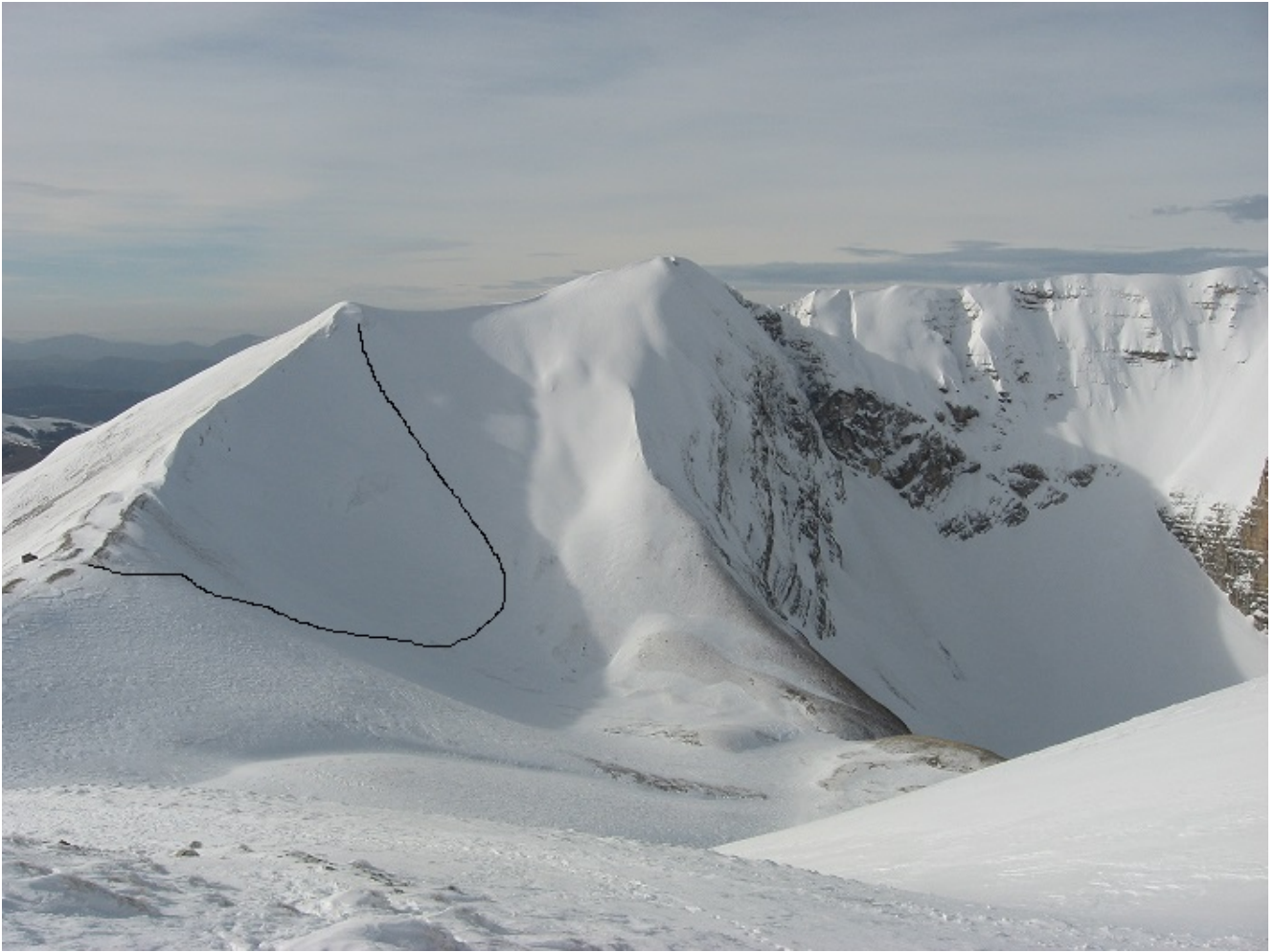
6- L'itinerario di salita tutto in ombra visto salendo alla cima del Monte Vettore