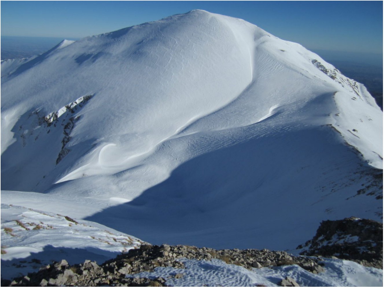
8- La cima del M. Vettore vista dalla Punta di Prato Pulito, a destra il Rifugio Zilioli.