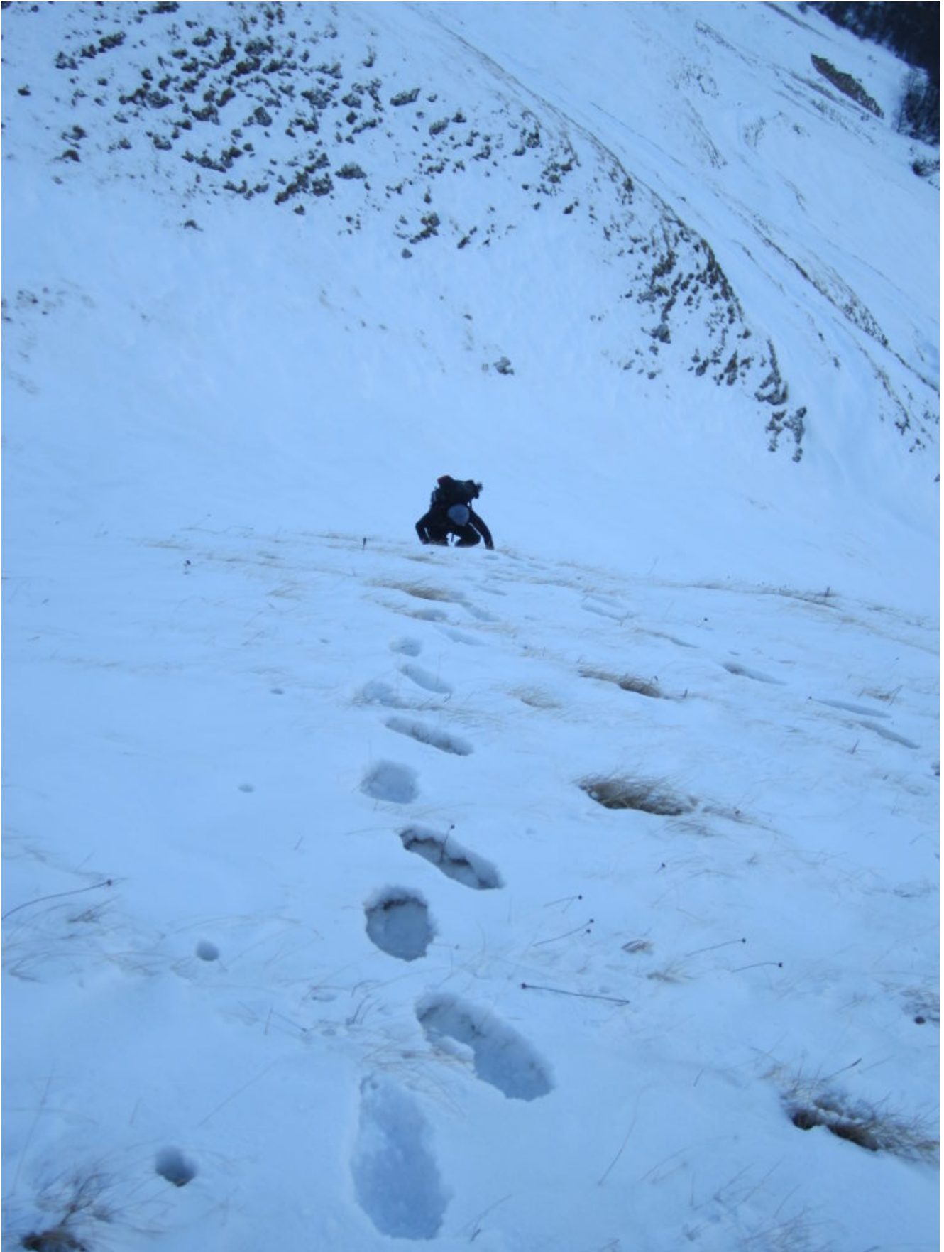
4- L'uscita del canale nord della cima de Il Pizzo nel tratto più ripido, salito con neve a tratti pessima ma di spessore limitato e quindi senza rischio slavine.