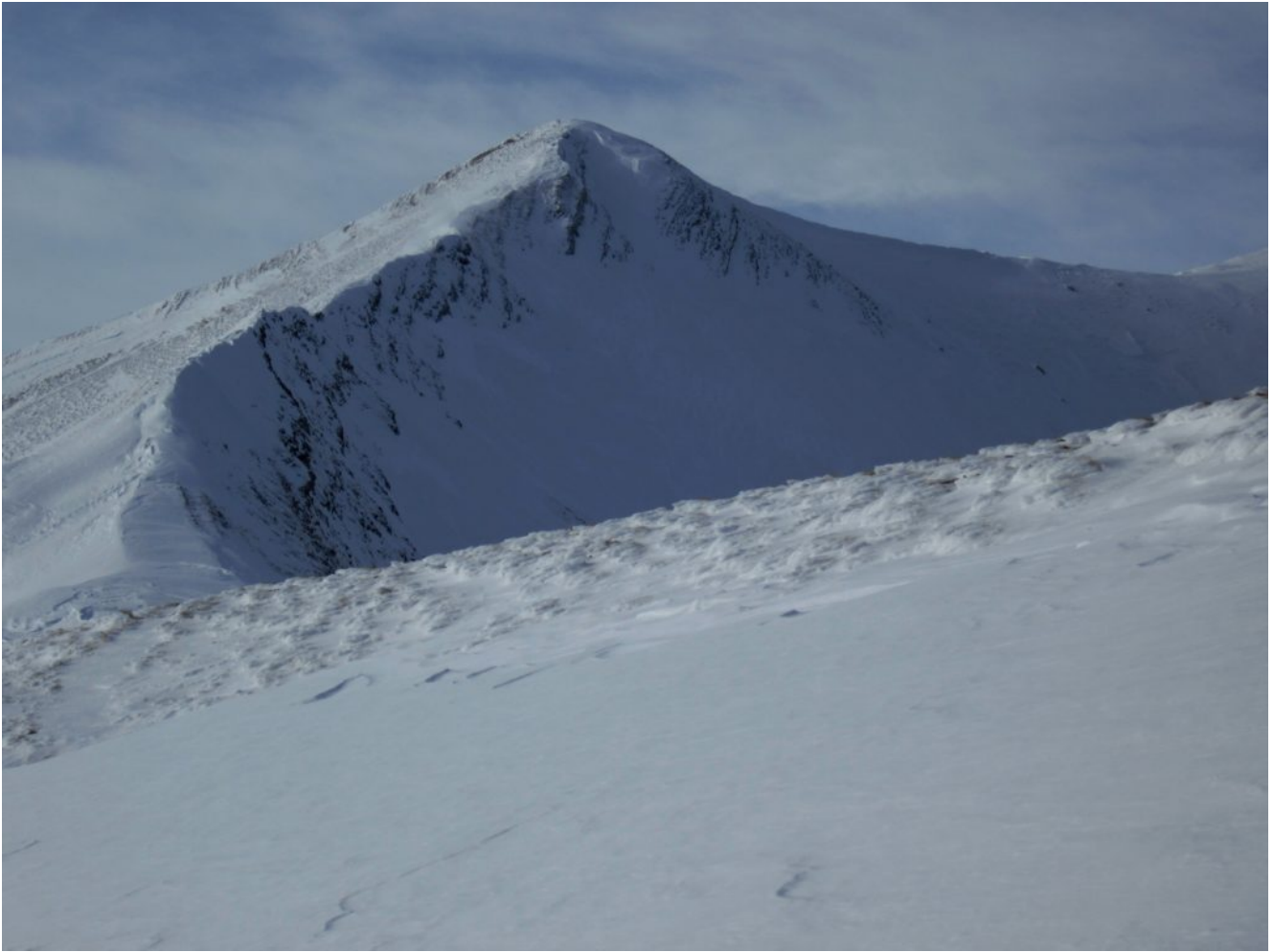
11- La Punta di Prato Pulito vista dalla Sella delle Ciaole con il canalino di uscita finale al centro in ombra.