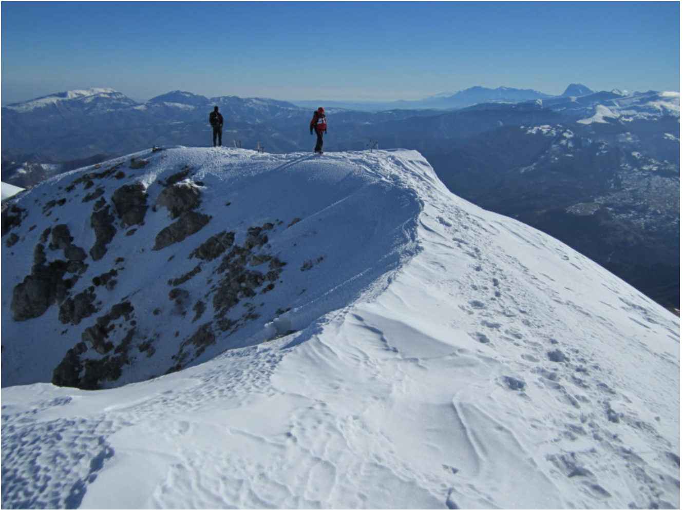
7- La cima della Punta di Prato Pulito con a sinistra in ombra il pendio di uscita dell'itinerario di salita