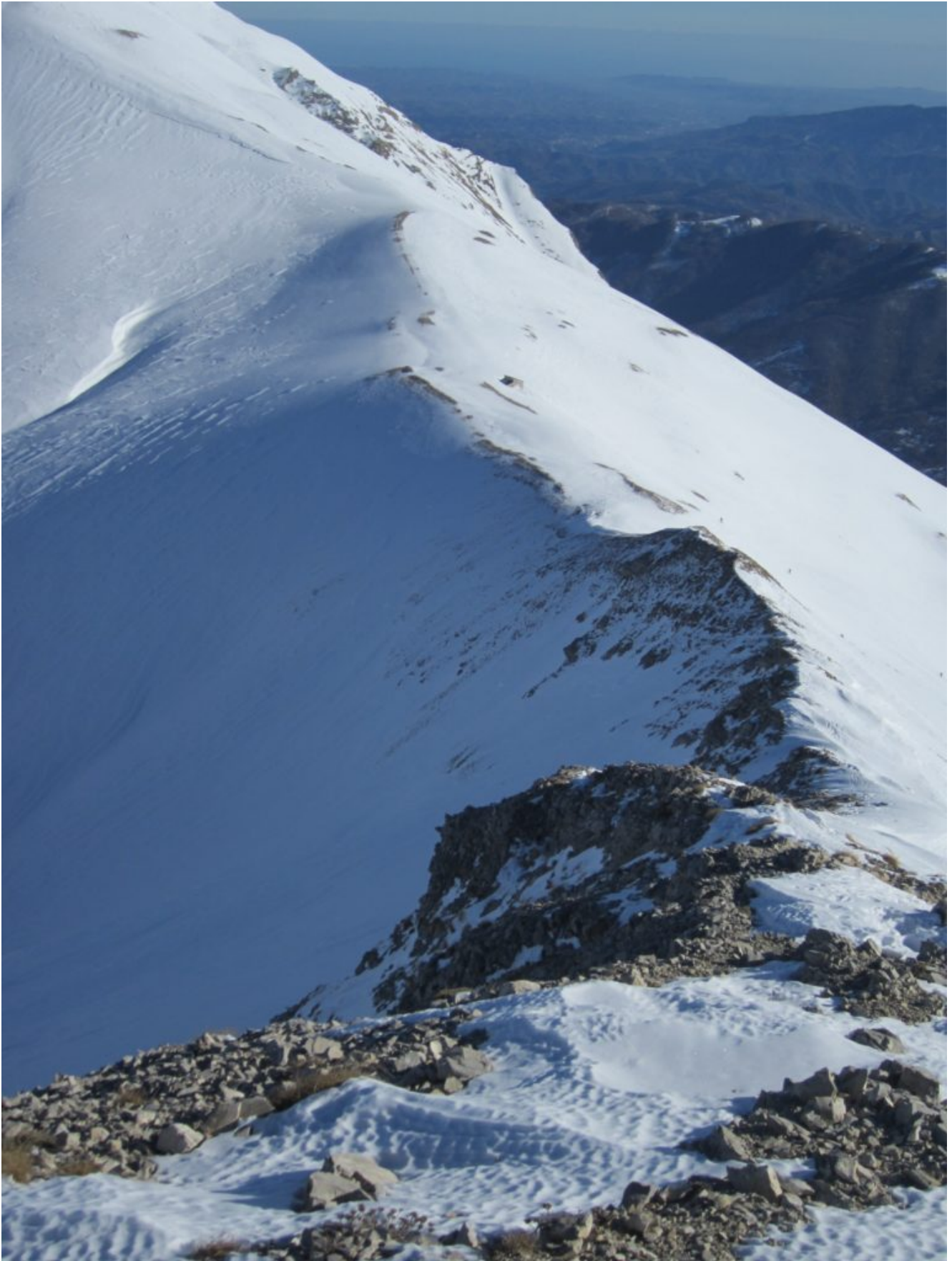
9 – La cresta nord-est della Punta di Prato Pulito (discesa) con la Sella delle Ciaole ed il Rifugio Zilioli.