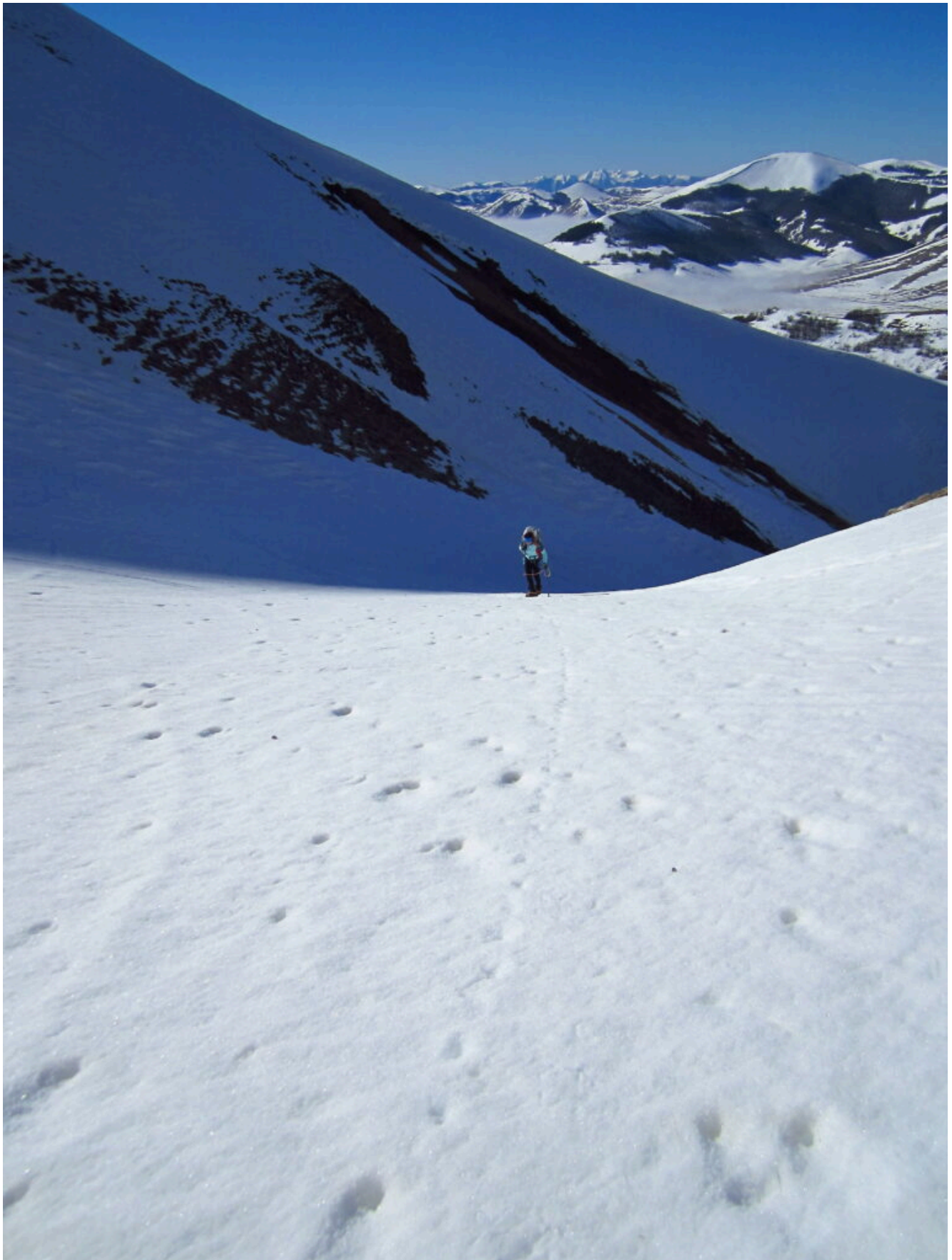
5- Il termine della prima parte del canale dopodichè inizia ad impennarsi.