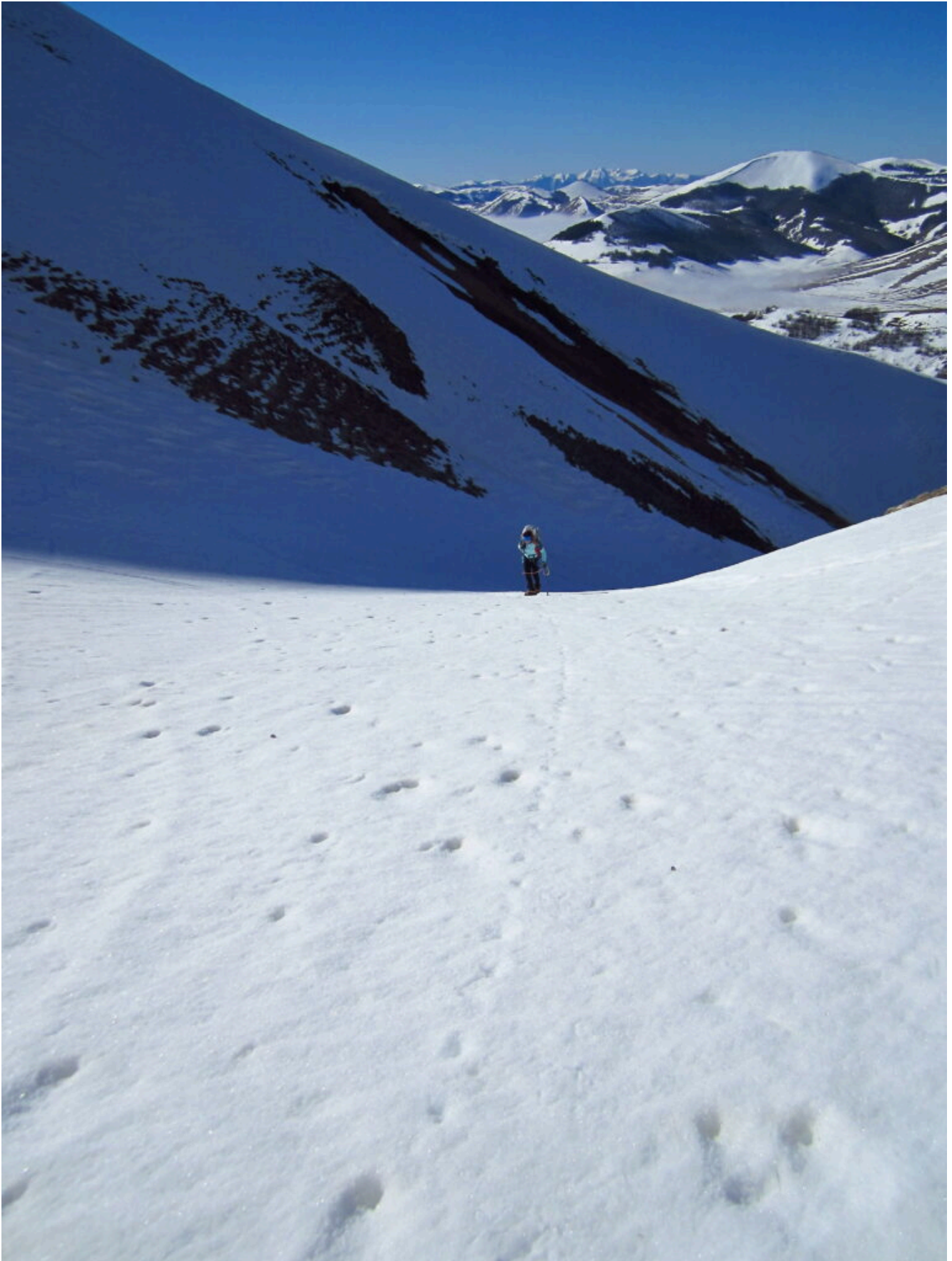
5- Il termine della prima parte del canale dopodichè inizia ad impennarsi.