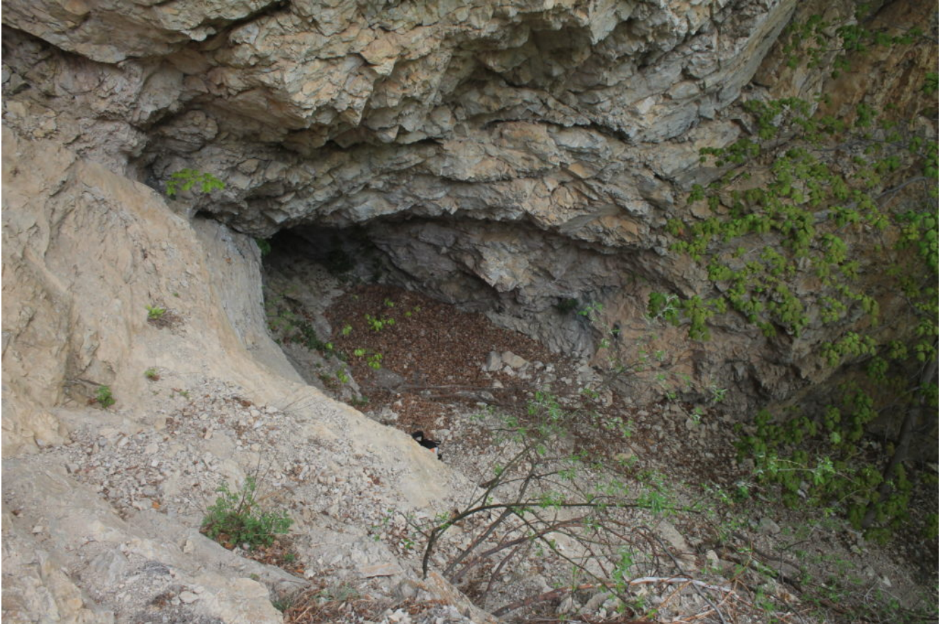
8- La cavità della foto n.6 vista dalla grotta superiore

raggiungibile salendo la facile paretina rocciosa posta di fronte.