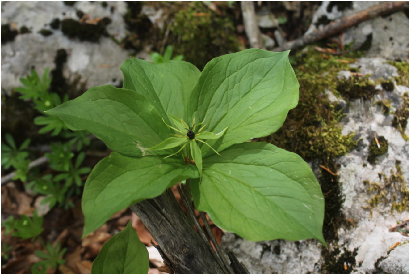
14- Paris quadrifolia o Uva di Volpe