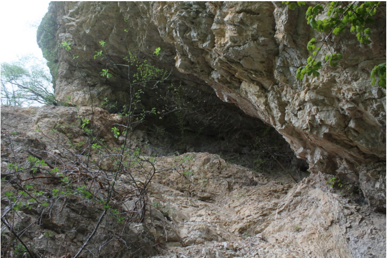
7- La cavità più grande posta più in alto di quella della foto n.6, visibile dal Piano della Gardosa (foto n.1) e