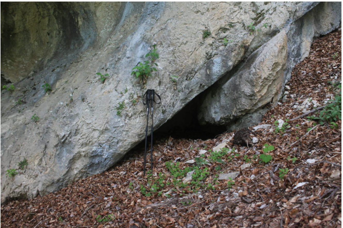
3- La seconda grotta più bassa ma profonda circa 4 metri, rifugio di animali.