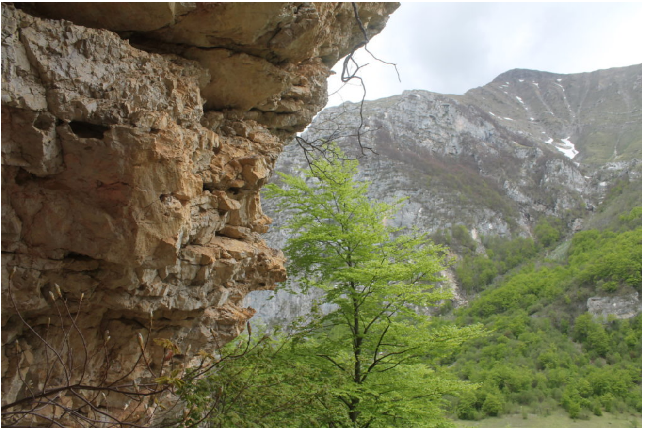
9- Il versante nord-est ed il Fosso del Monte Argentella visto