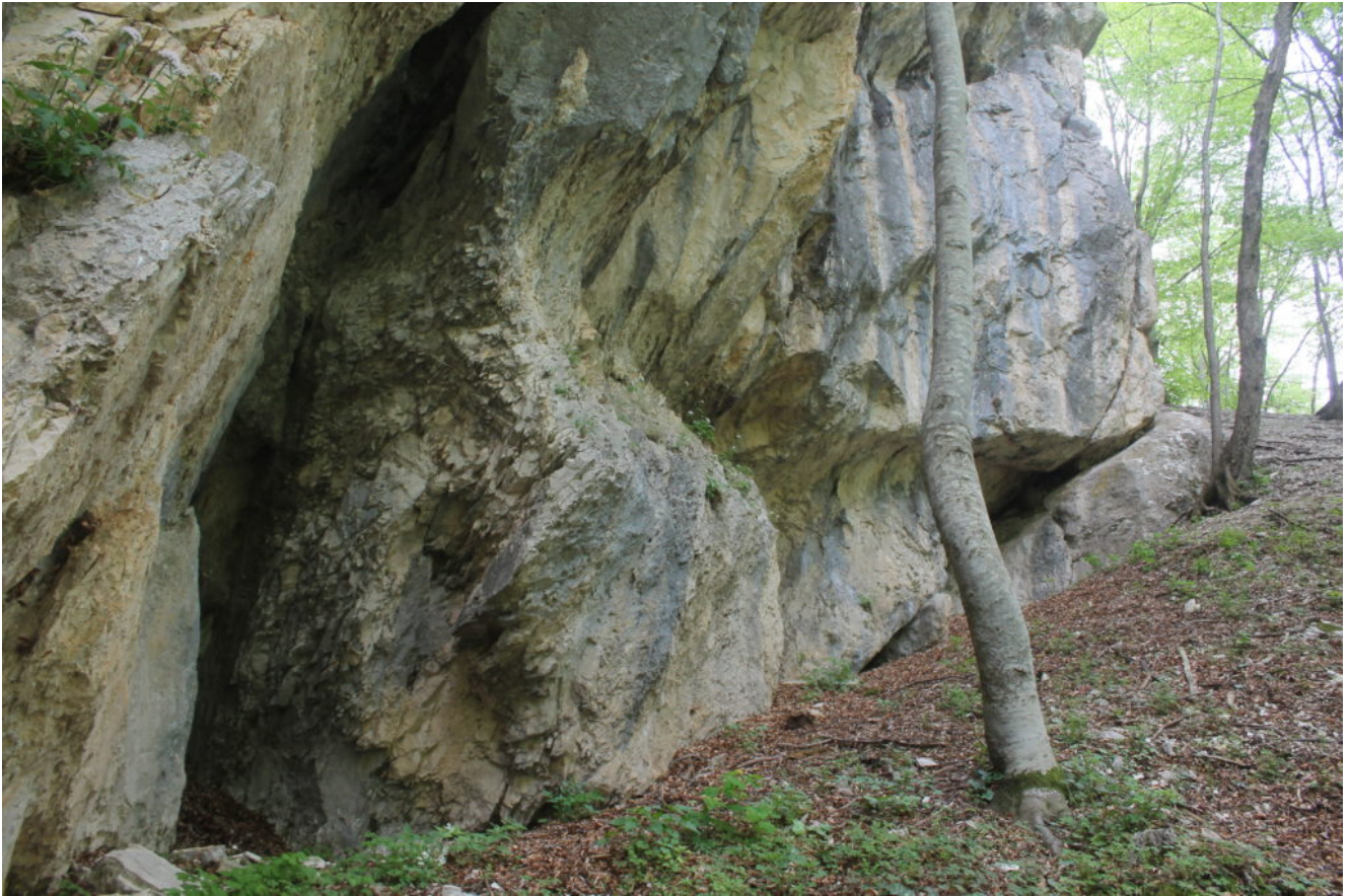
2- Le prime tre piccole cavità poste alla base delle pareti.