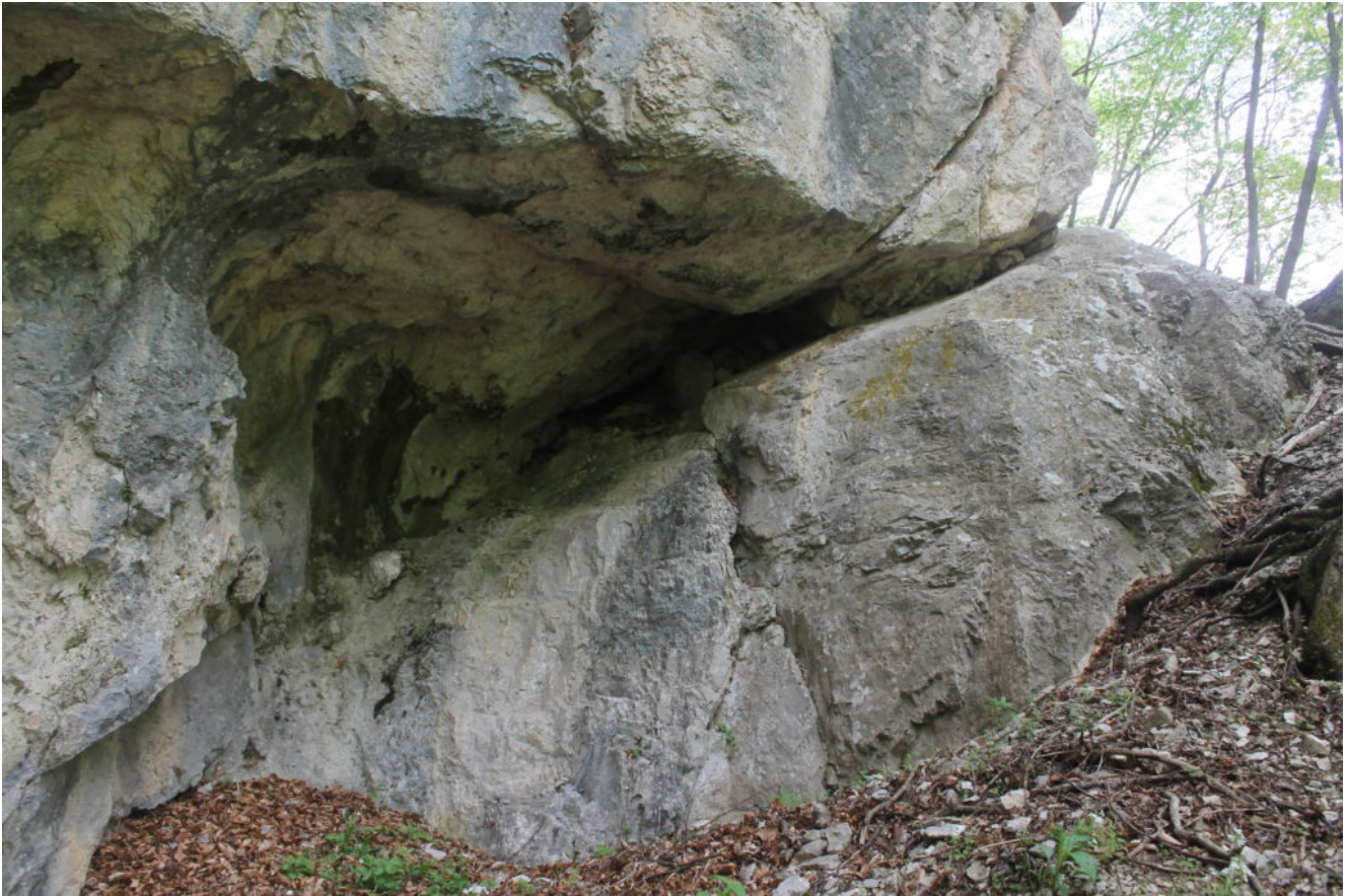
4- La terza grotta più alta.