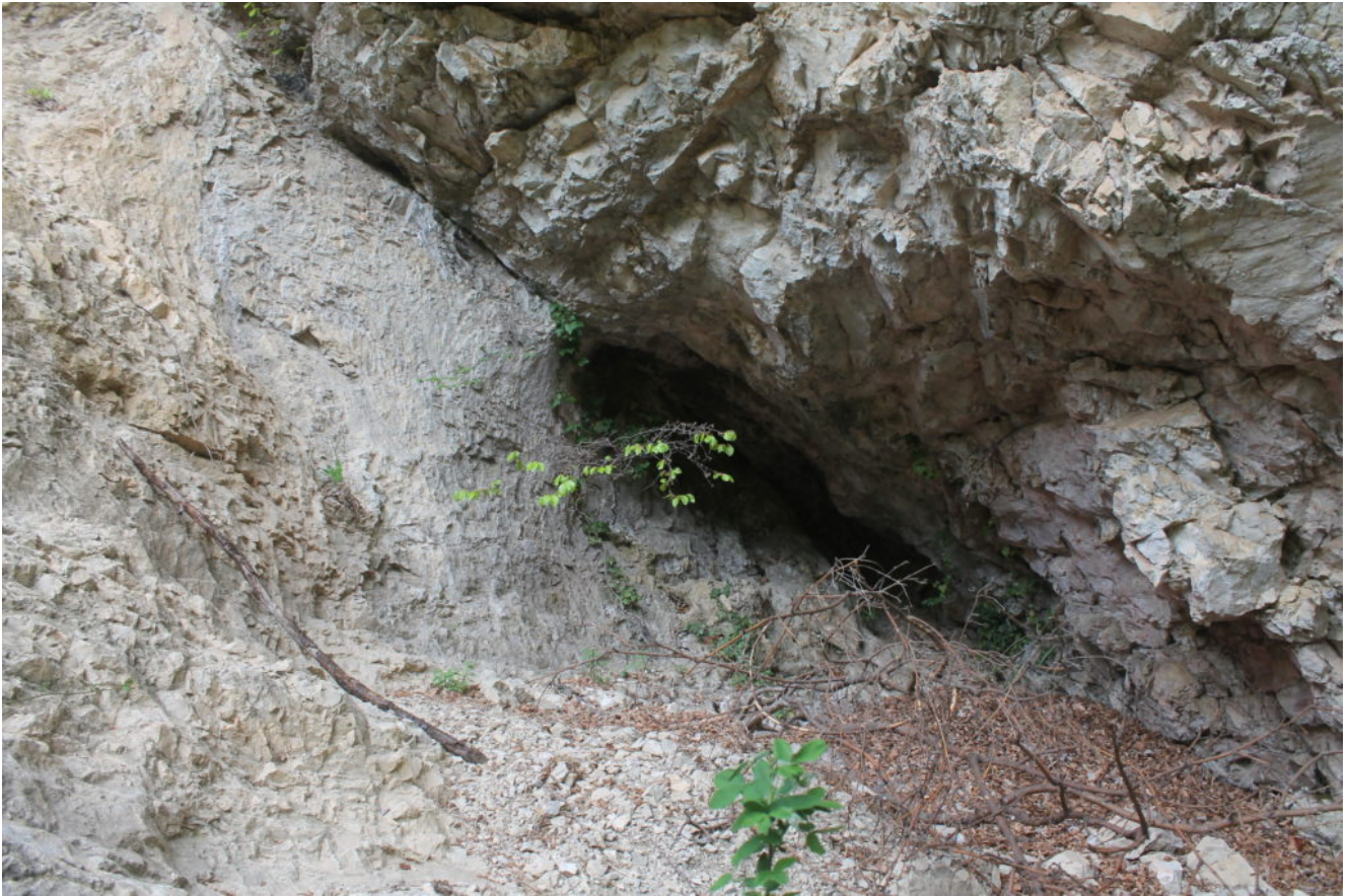
6- La quarta grotta più in alto di tutte e apertasi su roccia rossa.