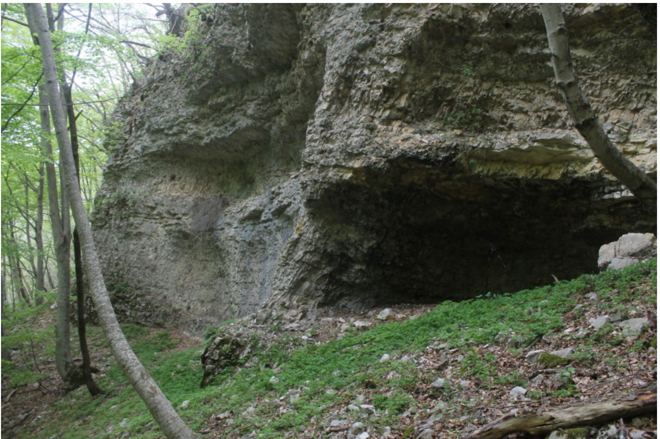
5- Altra cavità posta sulla stessa fascia rocciosa ma più in alto delle altre tre