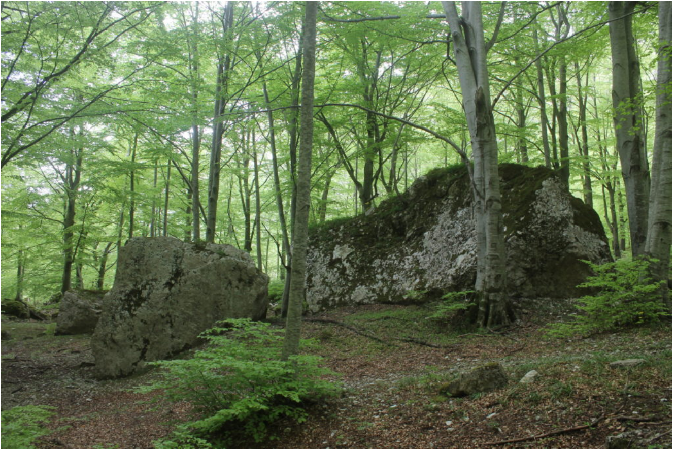
26- La bellissima faggeta posta alla base della Ripa Grande, un luogo di pace.