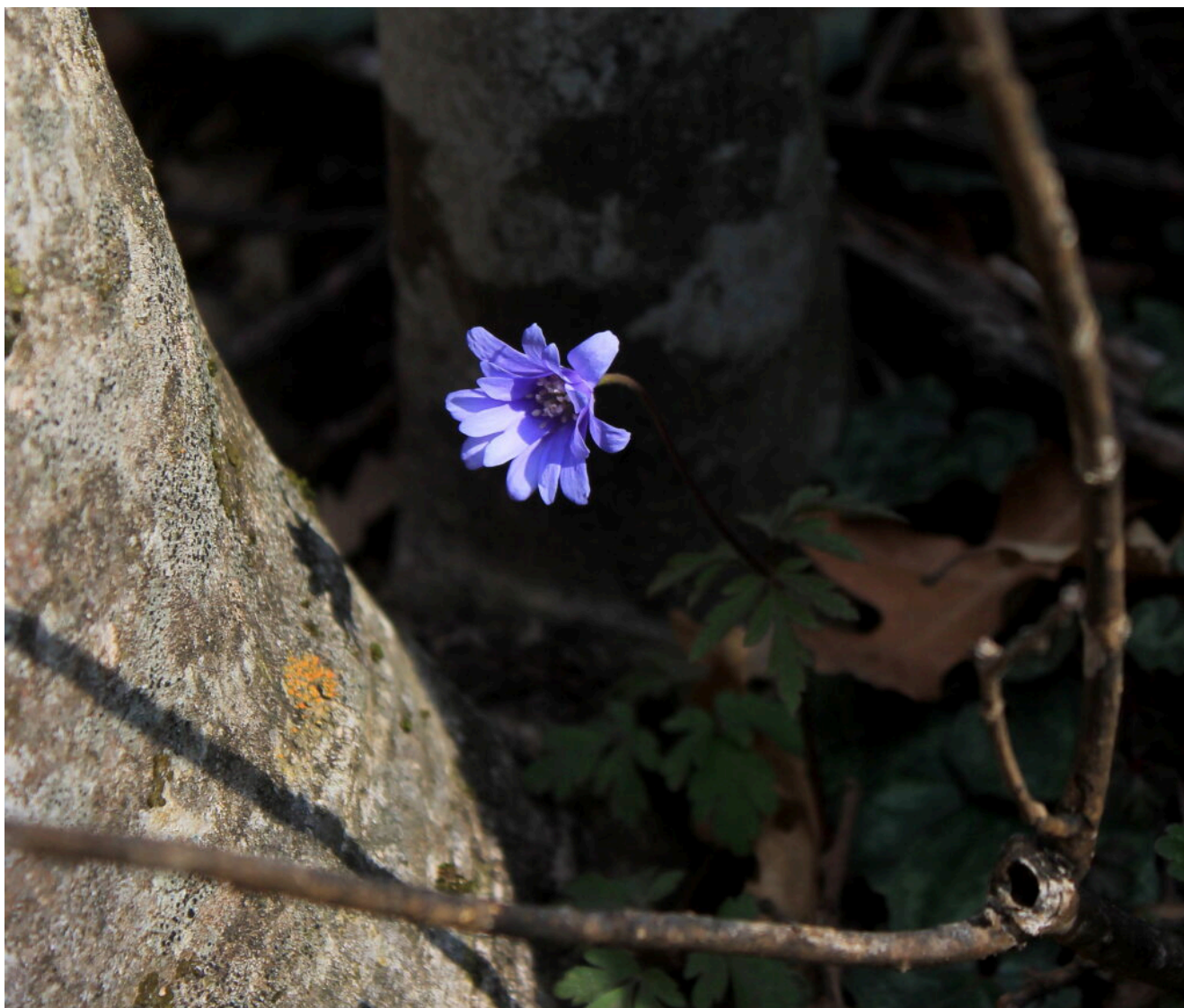
6- Anemone apennina nel bosco.