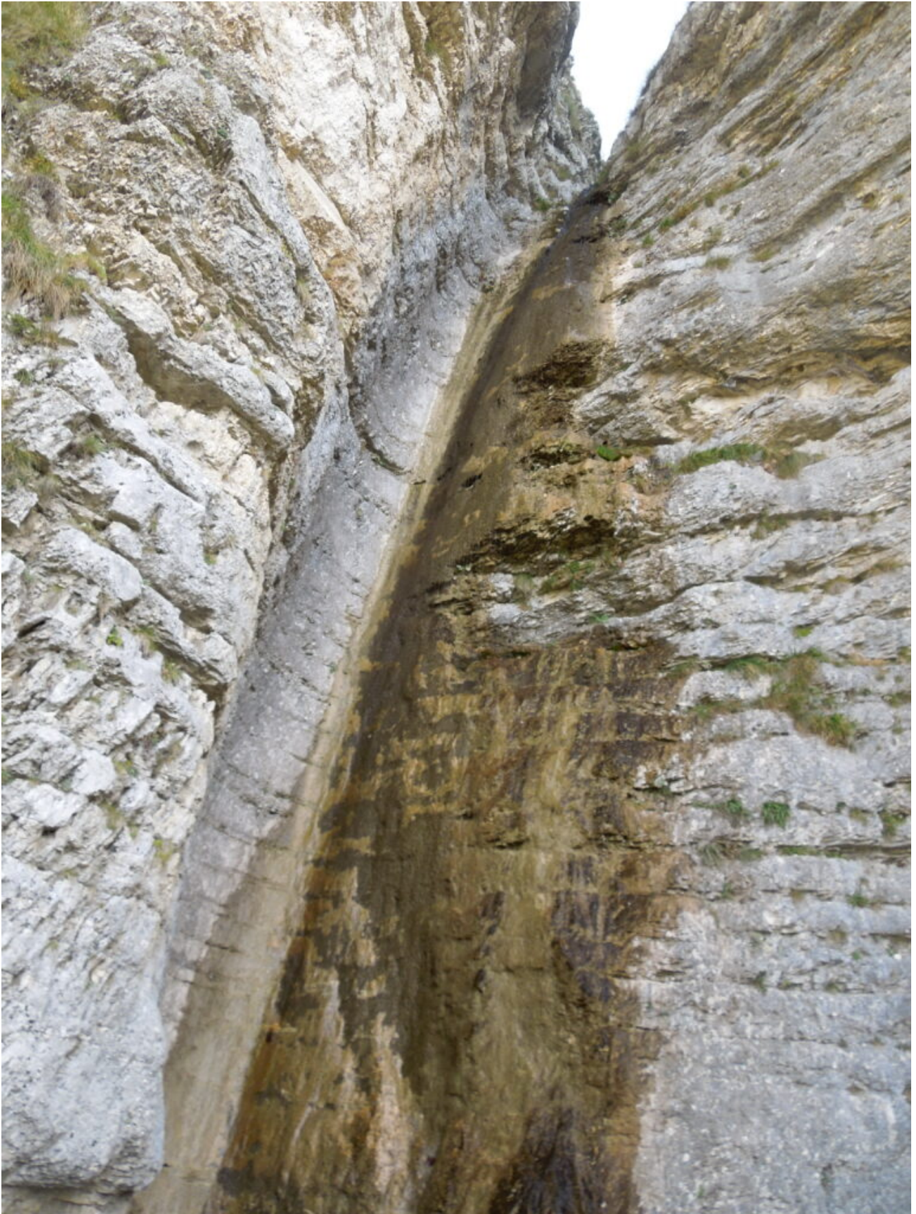
12- La cascata più alta