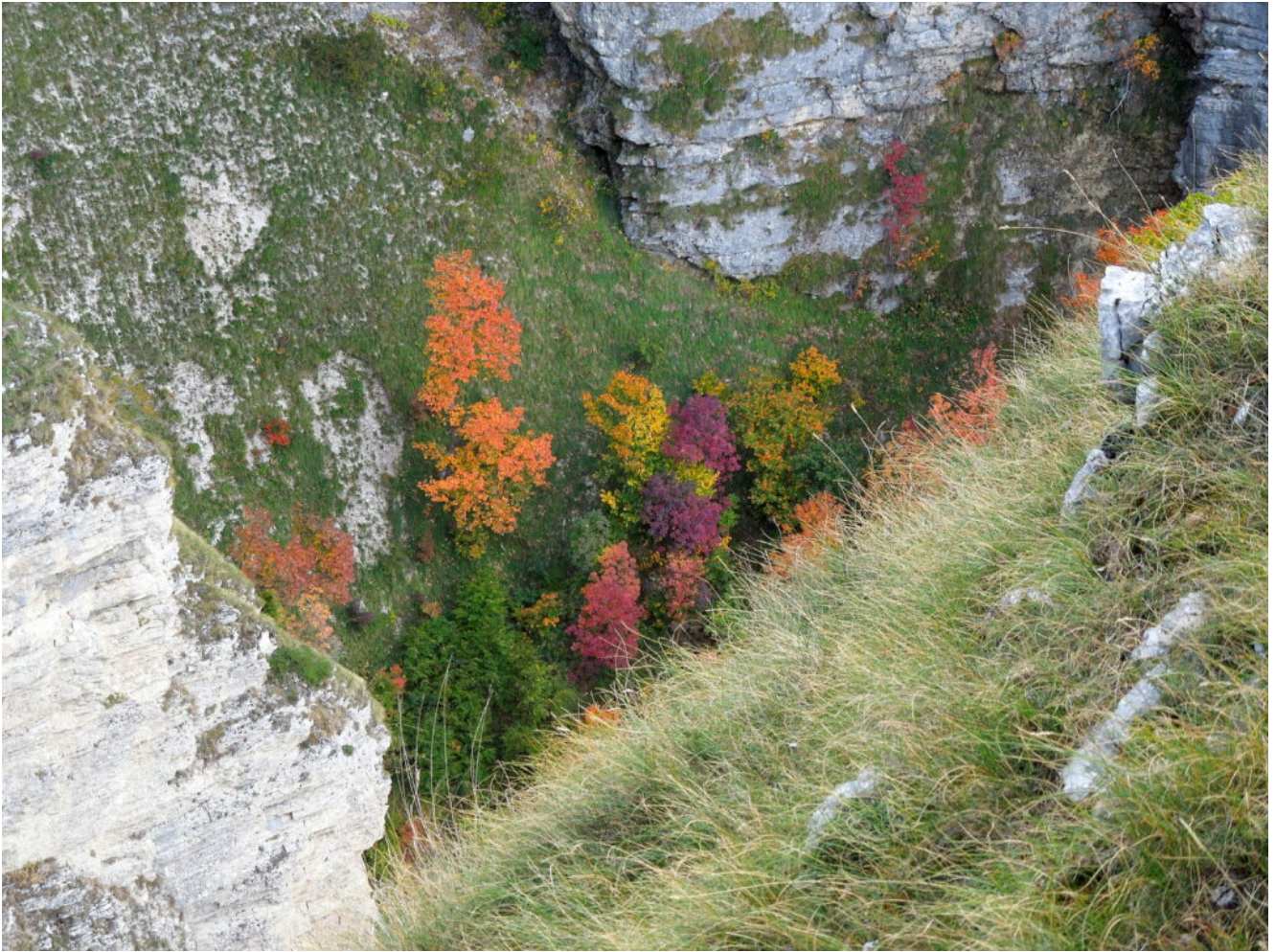
2- Foliage nel Fosso La Foce