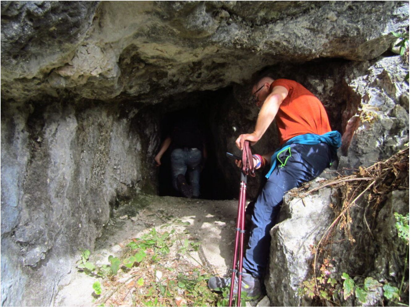
23- L'ingresso della Grotta Nascosta.