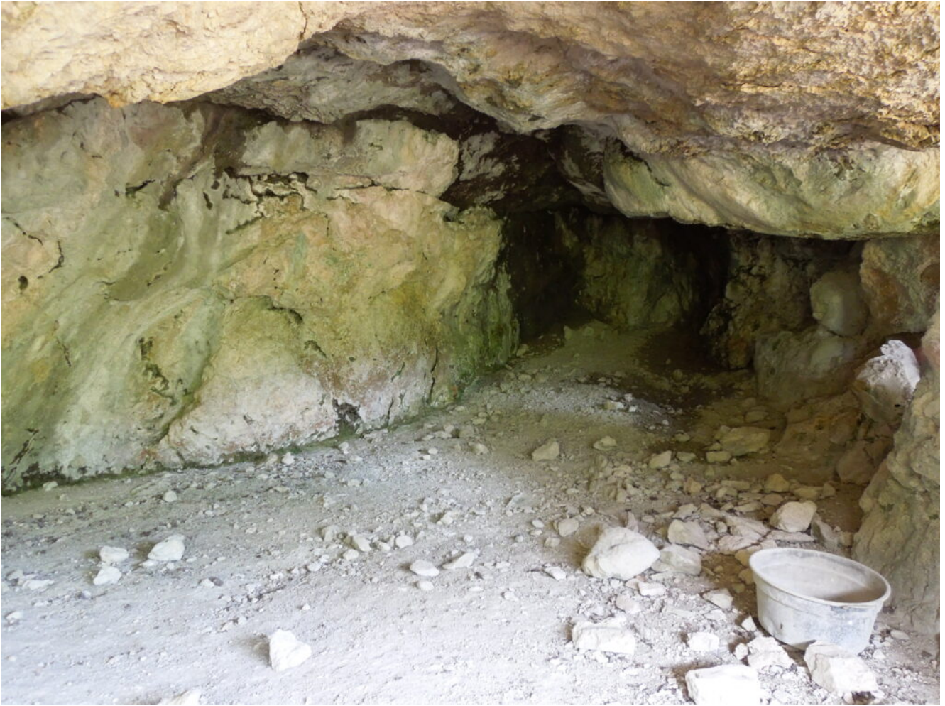
22- La Grotta Grande alle Cute conserva un vecchio secchio per la raccolta delle acque di stillicidio.