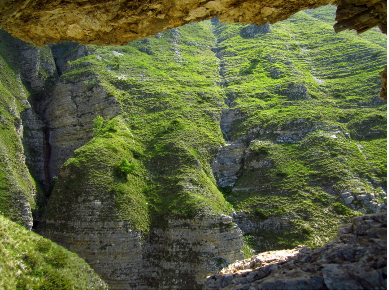
7 – 8 – Il ramo sinistro visto dalla finestra.