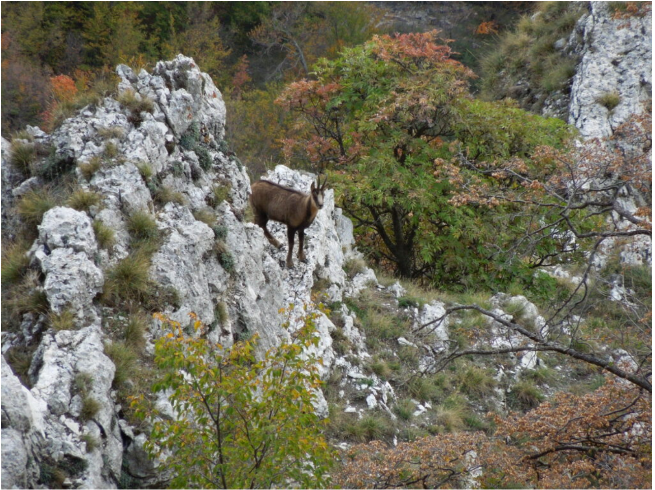
1- Un camoscio all'ingresso del Fosso La Foce, mai osservato prima a quote così basse.