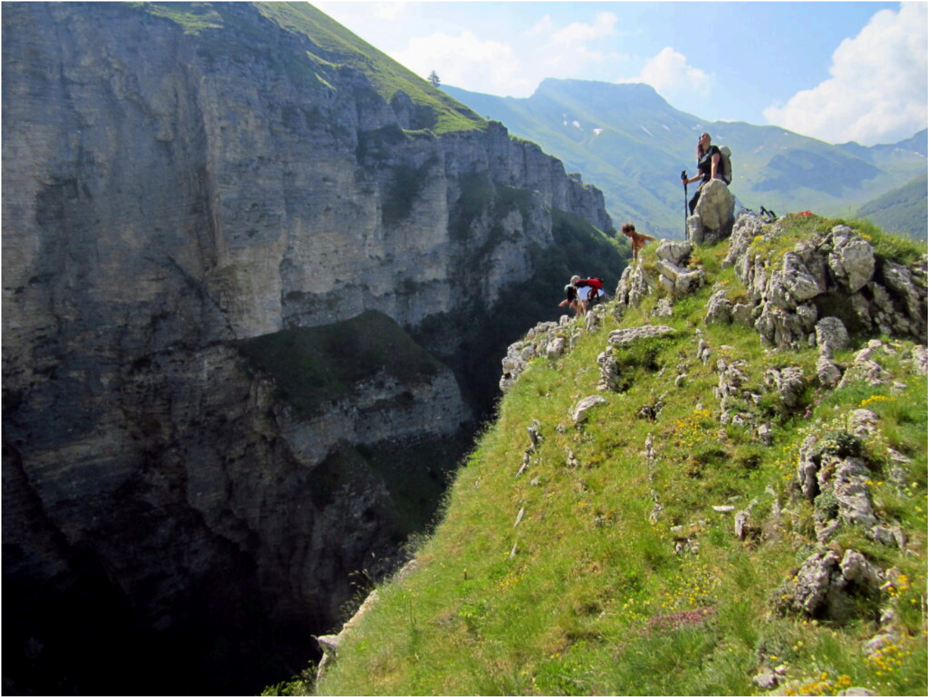
3- Il primo sperone del ramo destro orografico