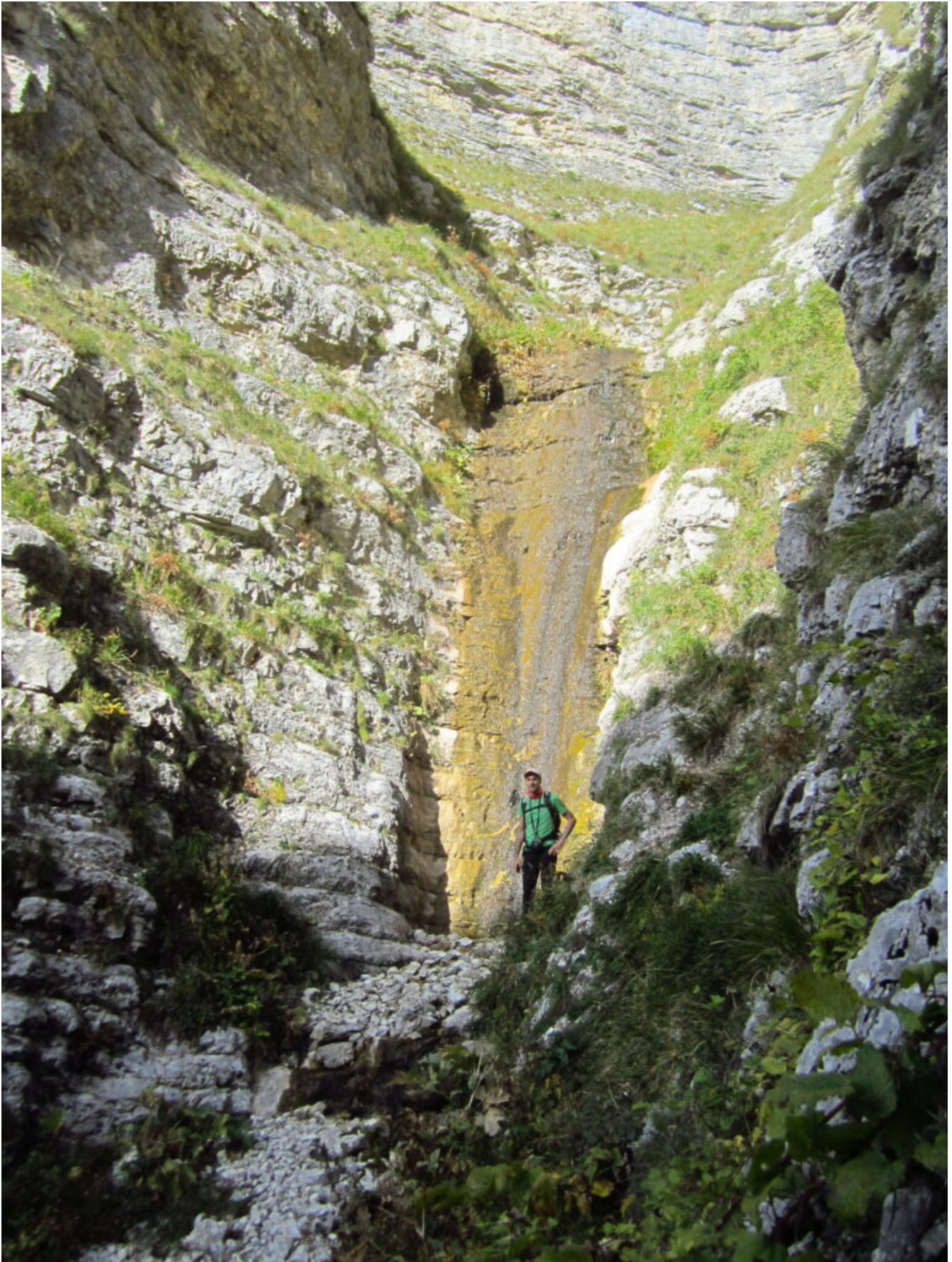
11- La cascata più piccola del lato sinistro orografico del Fosso La Foce.