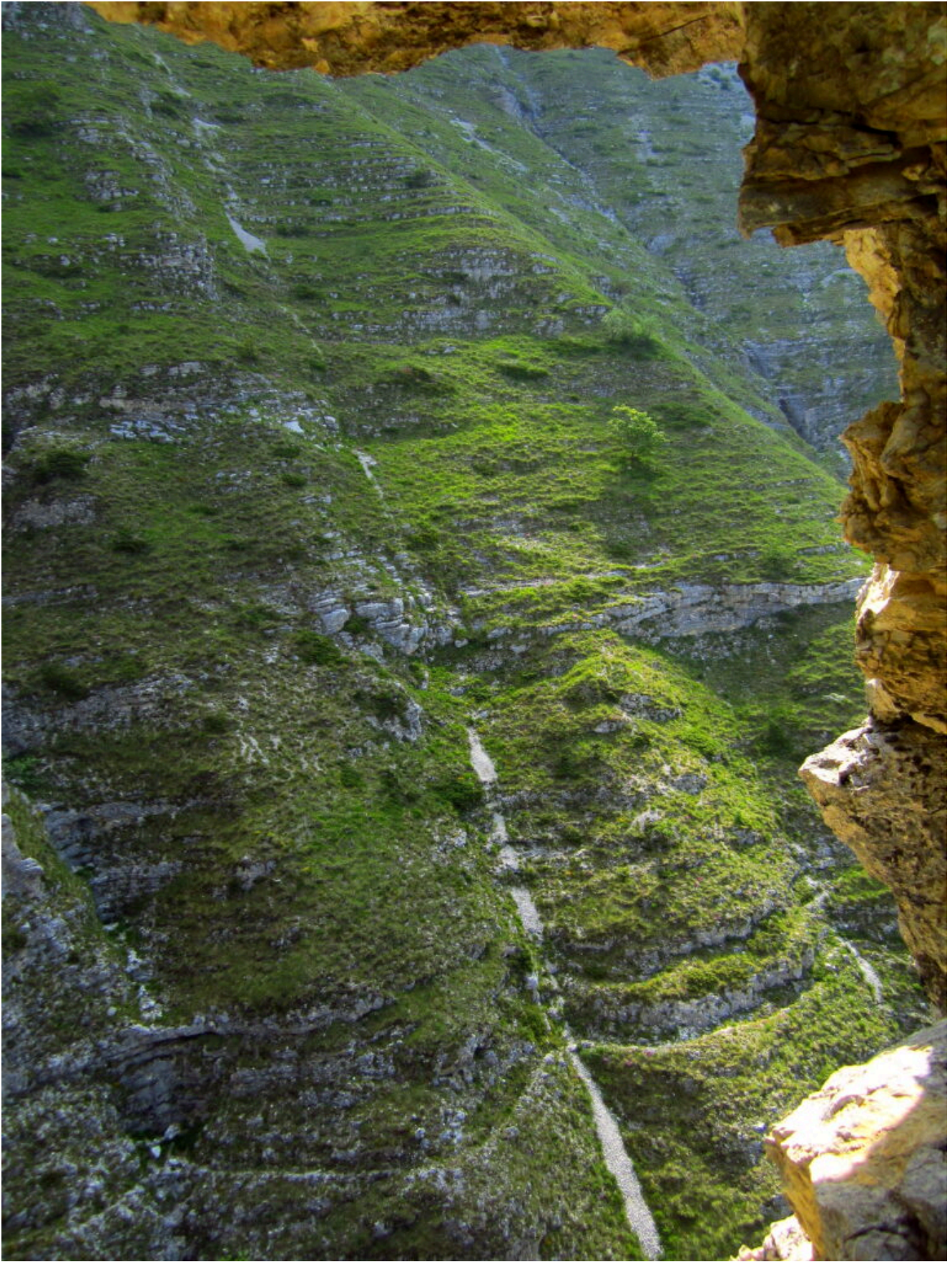
9- In basso si nota il tracciato del sentierino che attraversa il ramo sinistro del Fosso della Foce.