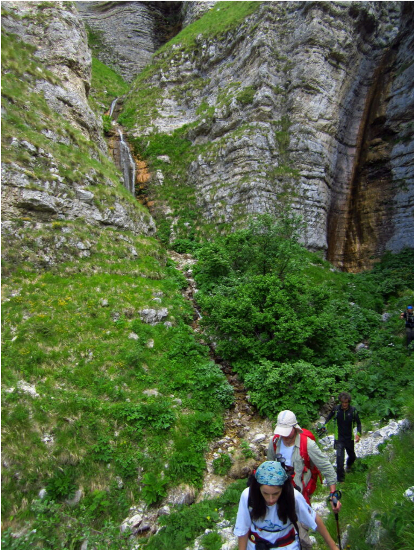
19 – 20- Tutte e due le cascate del ramo sinistro.