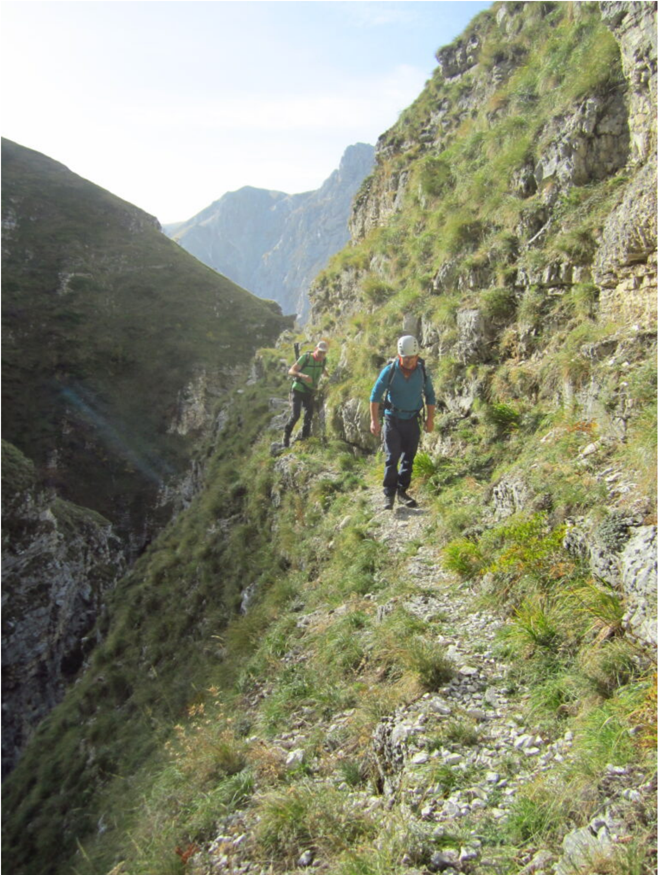
10- Il tratto più stretto della Cengia dei Fiumarelli