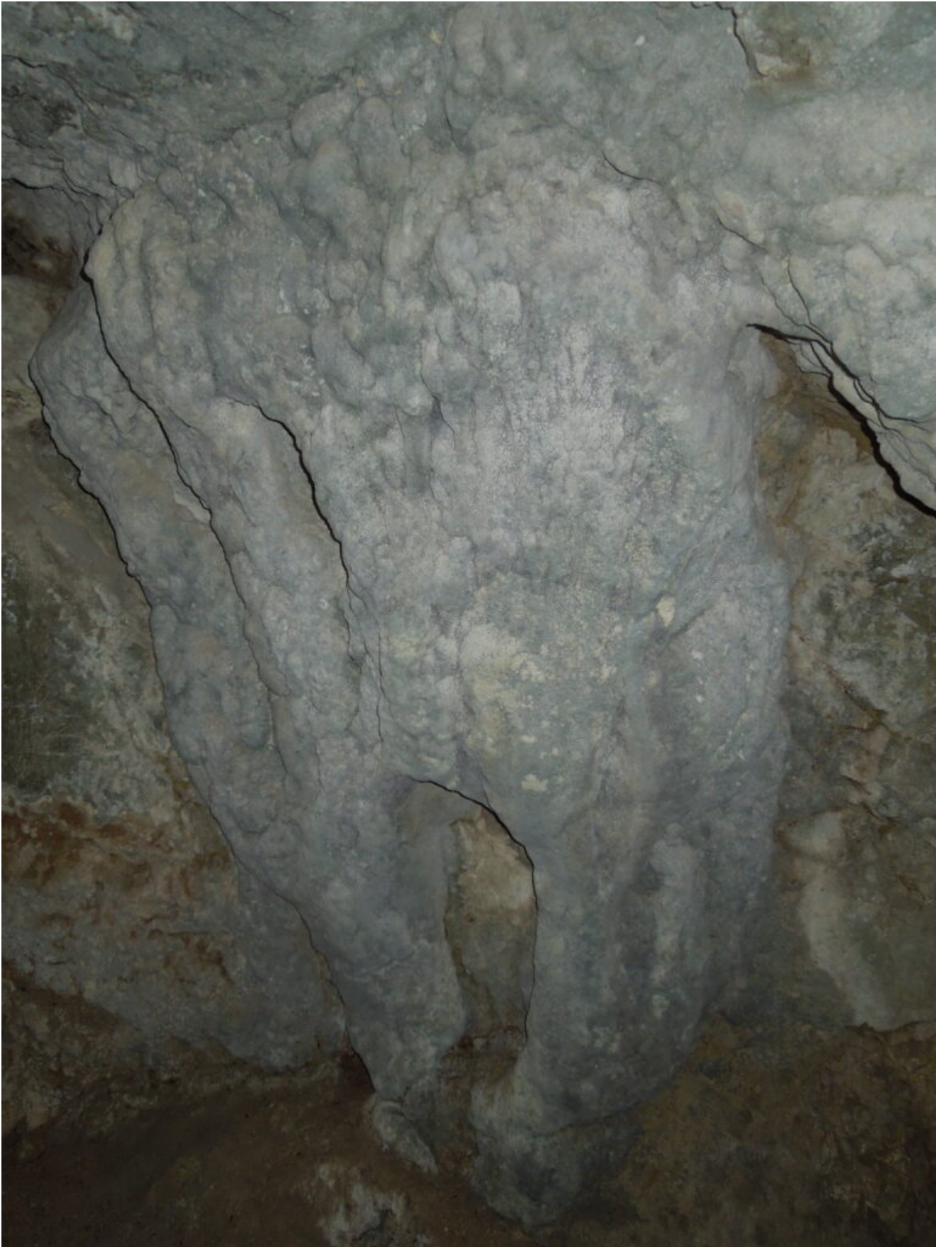
24- Concrezioni ormai asciugate dalla torrida estate all'interno della Grotta Nascosta