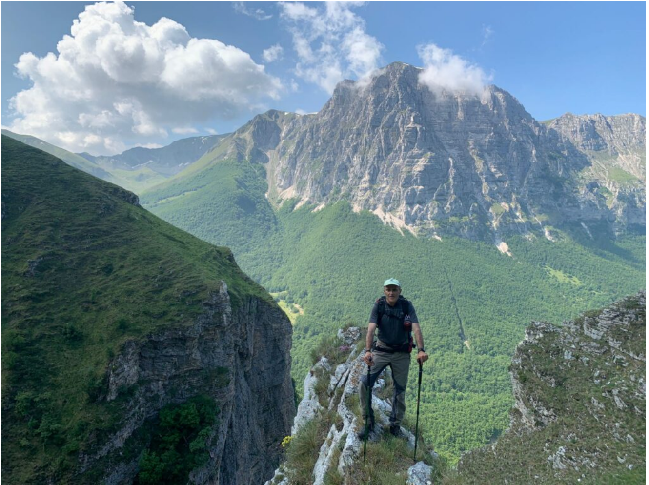
11- Lo sperone centrale che divide il ramo sinistro in due ulteriori rami formanti cascate distinte