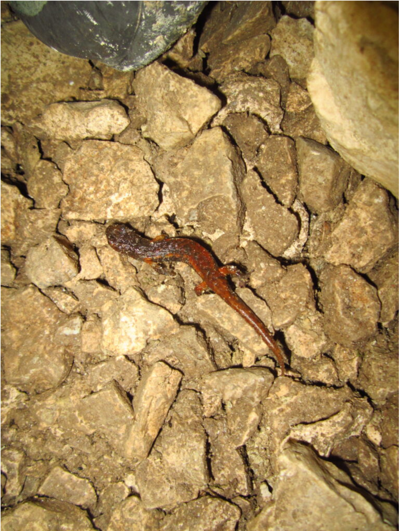
25 – 26 – Un Geotritone italiano ( Speleomanteus italicus ) se ne va in giro all'interno della Grotta Nascosta