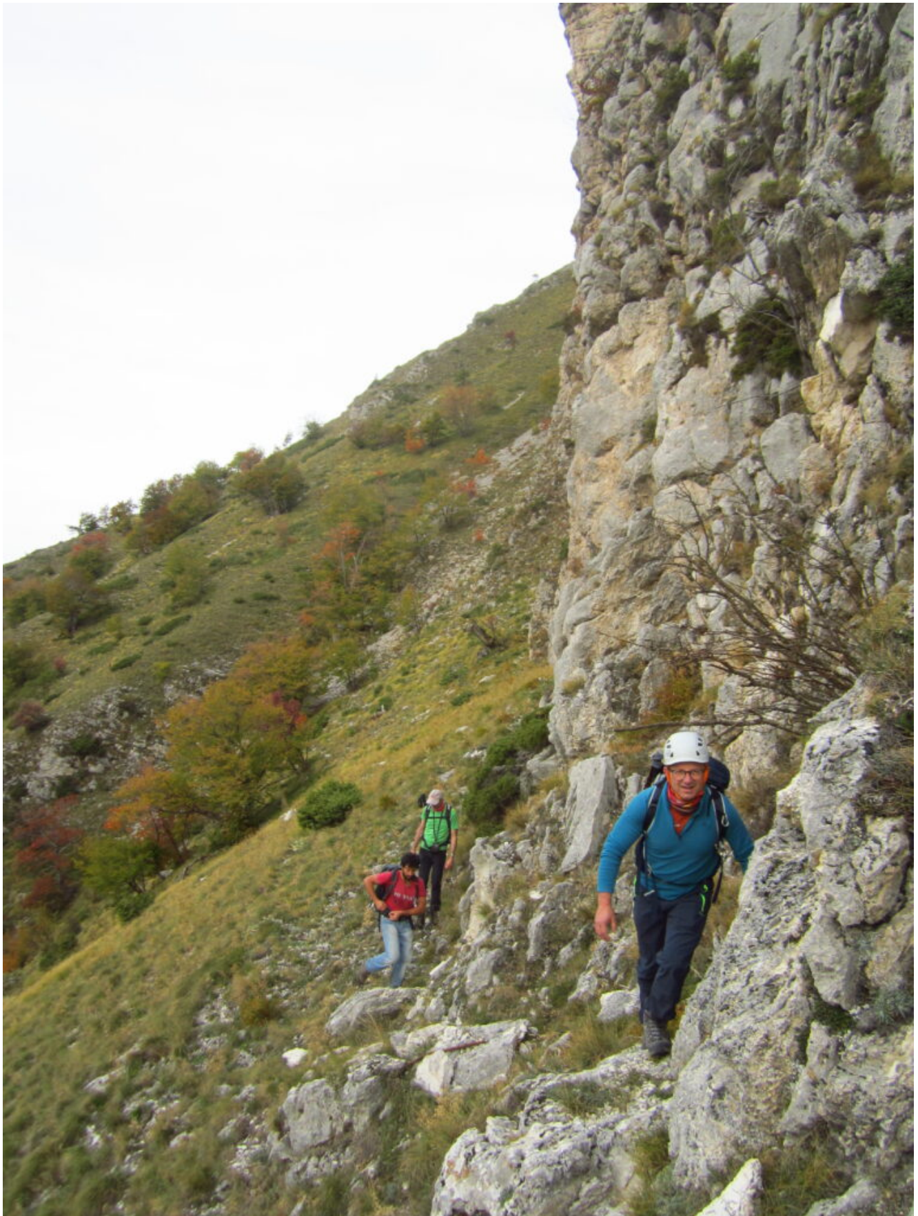
3 – 4- 5 – La prima parte della Cengia dei Fiumarelli che attraversa la destra orografica del Fosso La Foce.