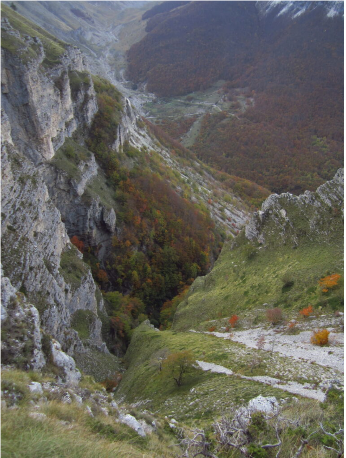
13- Veduta quasi verticale verso la Val di Panico