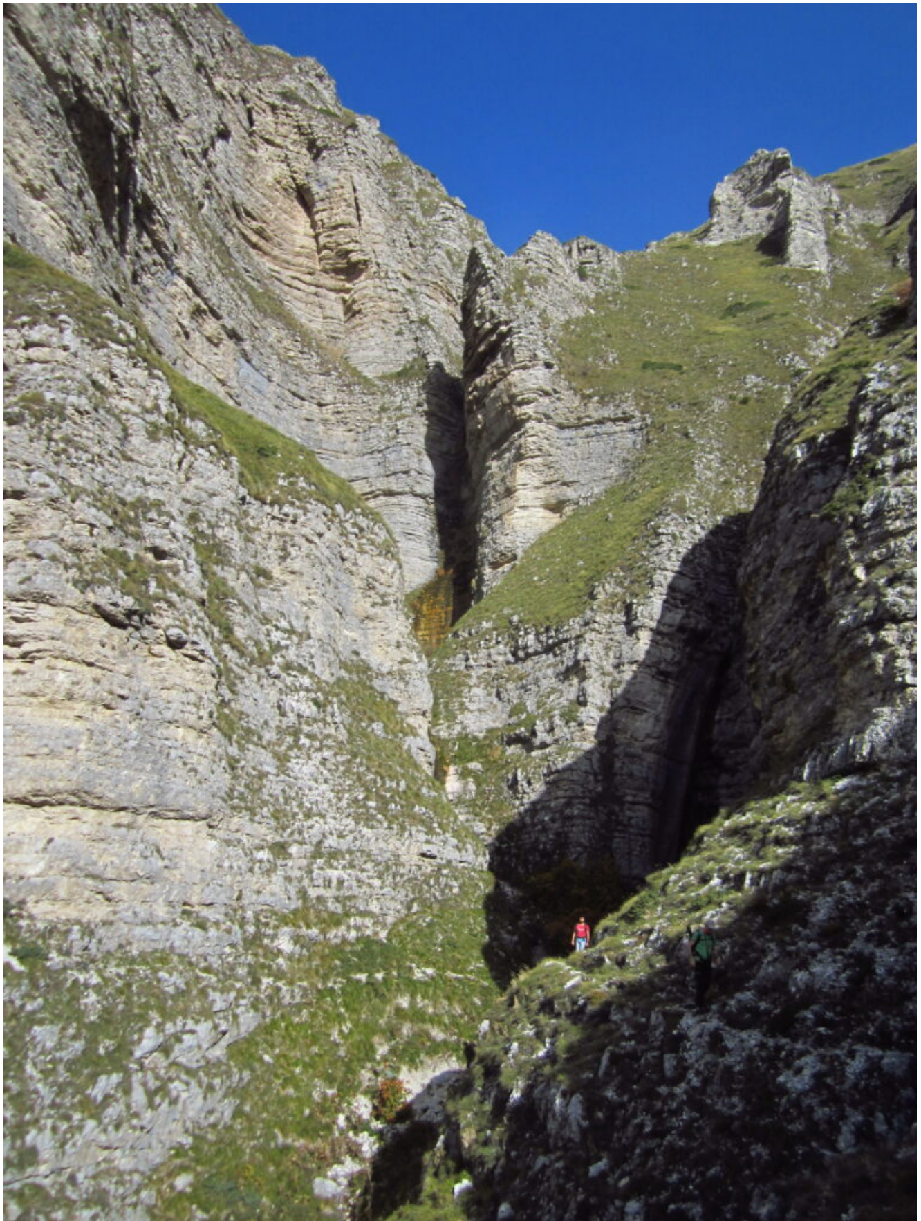
1 6-17 – Il ramo sinistro orografico del Fosso La Foce dove confluiscono le due cascate delle foto n. 11 e 12.