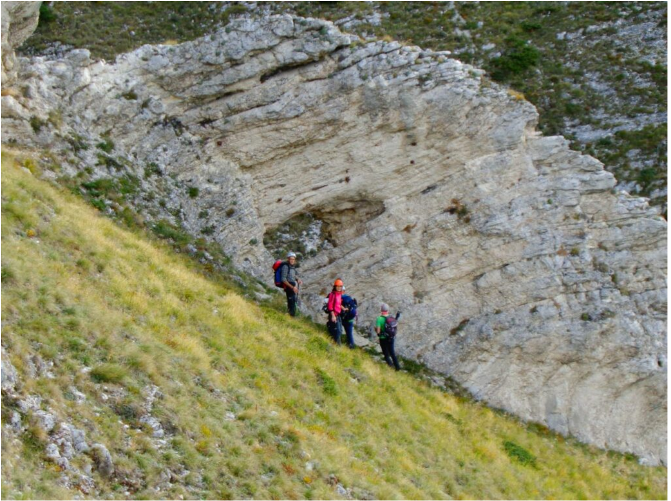
8 – 9 -La finestra della Cengia dei Fiumarelli