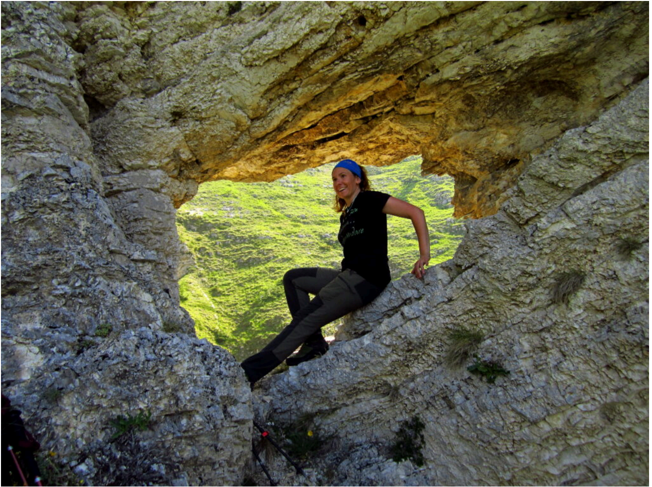
6- La finestra che si affaccia sul ramo sinistro molto più articolato e portante acqua.