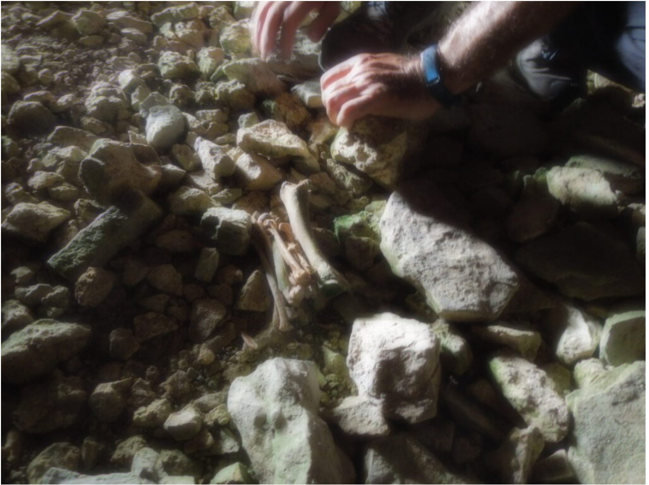
27- 28 – Ritrovamento di varie ossa all'interno della Grotta Nascosta.