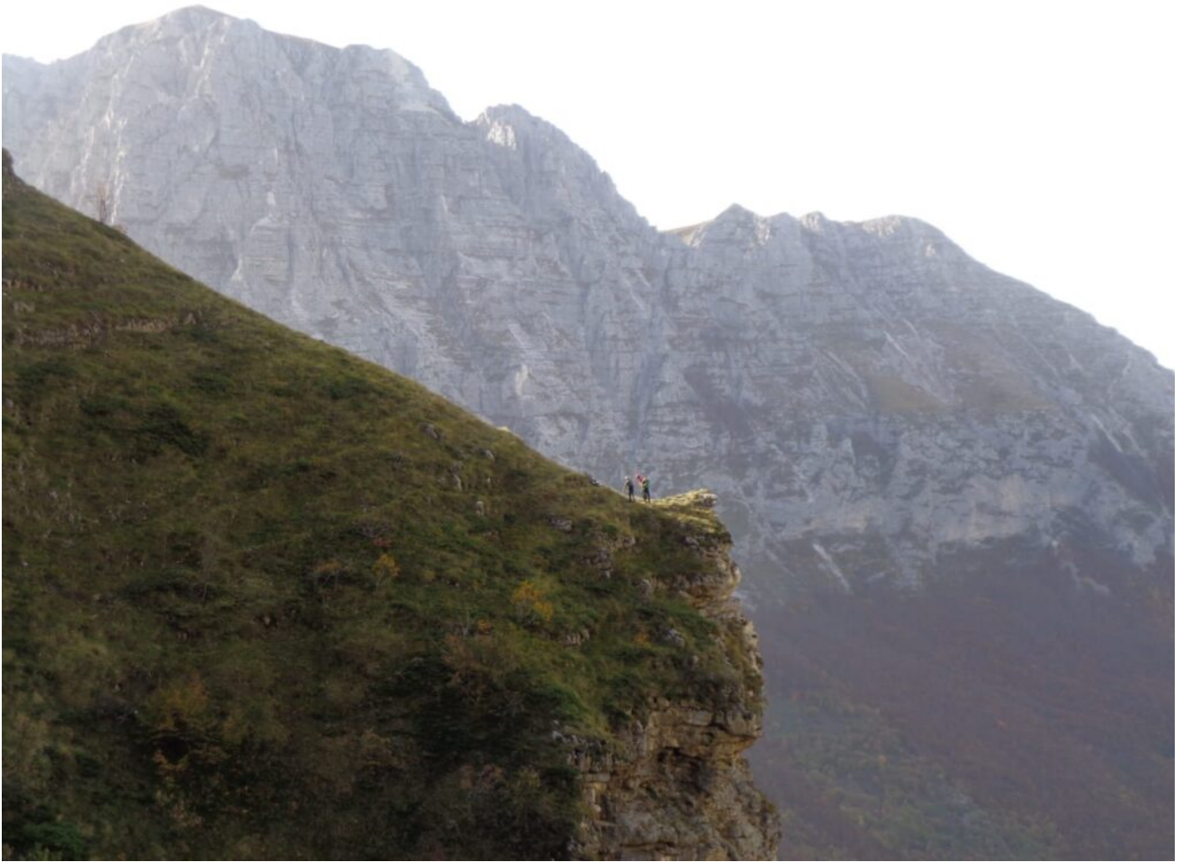
20- Lo spettacolare scoglio (foto n. 6 e 7) dell'uscita della Cengia dei Fiumarelli con il Monte Bove Nord alle spalle.