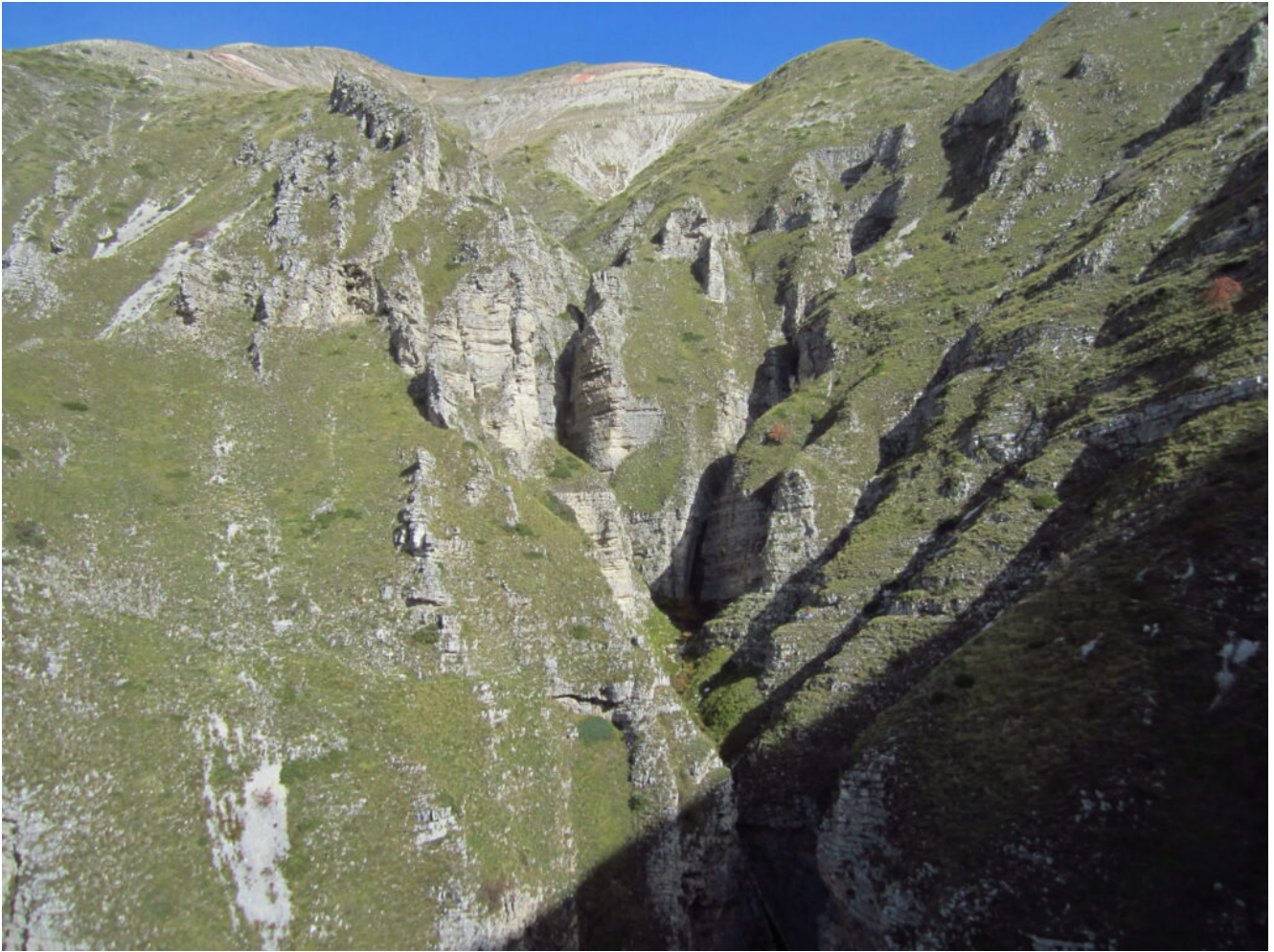
18- L'intero Fosso La Foce ed In alto il Monte Rotondo visto dallo scoglio della foto n.20