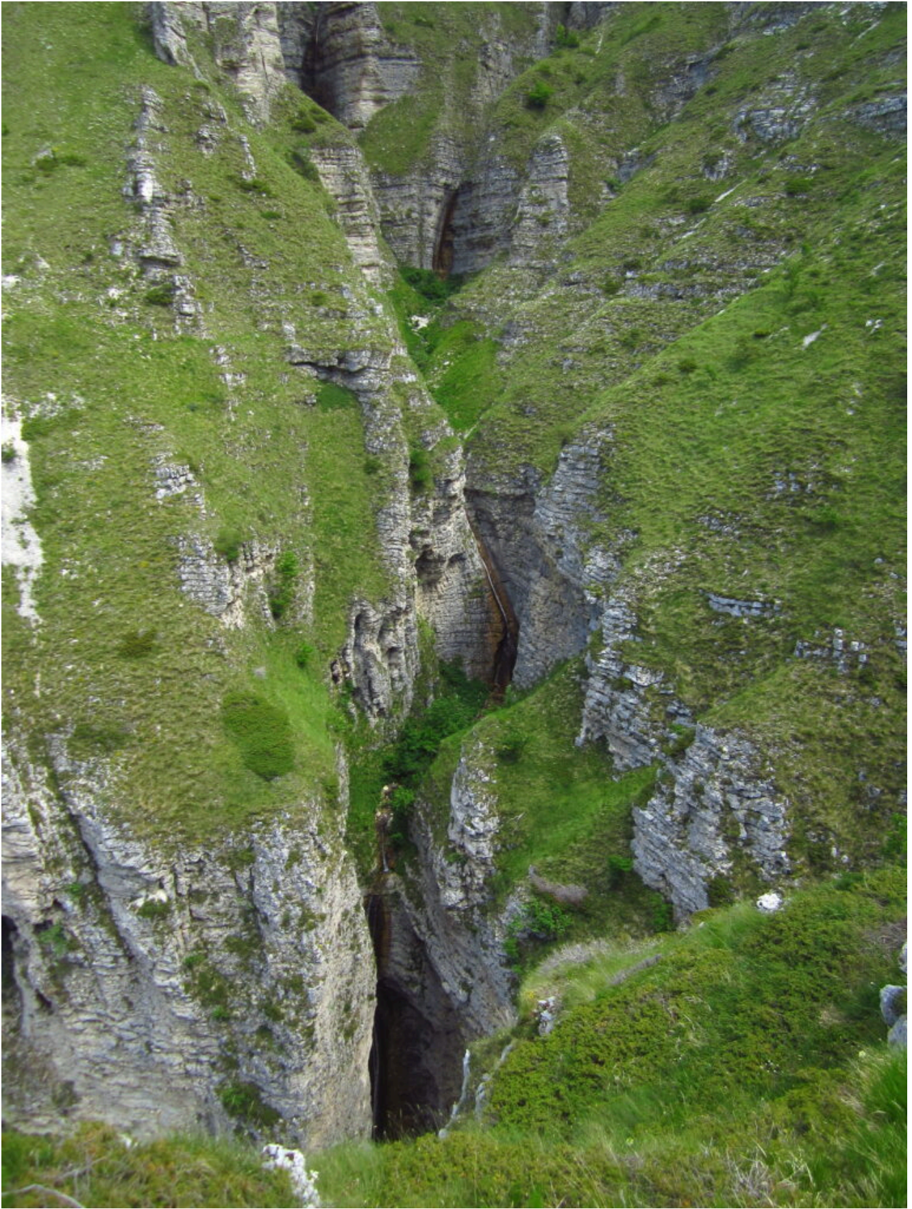
22- La parte inferiore del Fosso La Foce vista dallo sperone sinistro, in basso la grande cascata alta più di 70 metri.