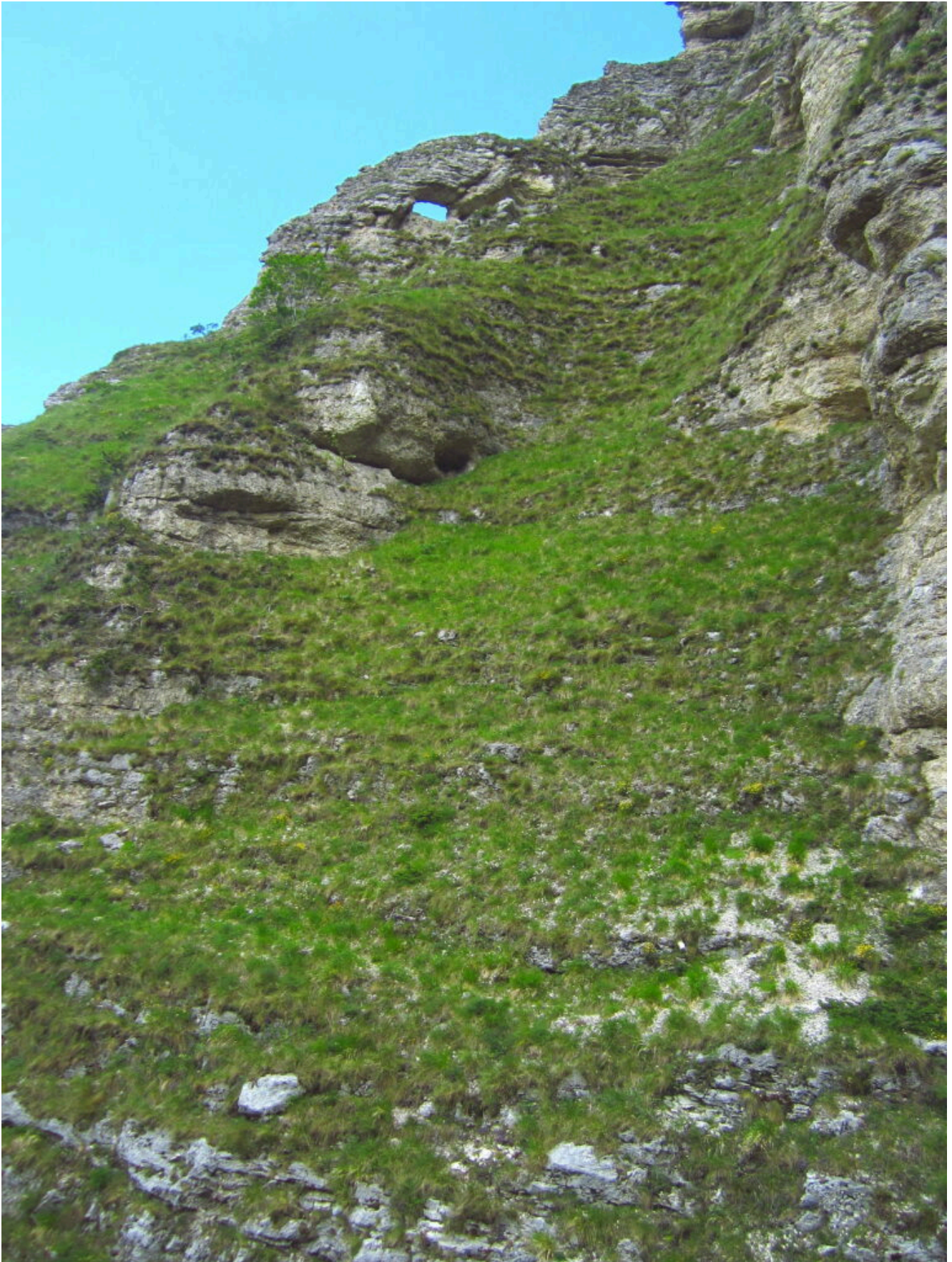
21- La finestra delle foto n.6-7-8-9.