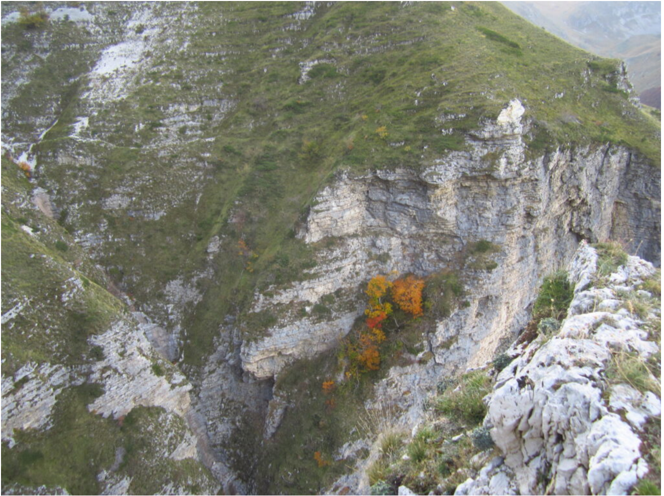
6- 7L'ultimo tratto della Cengia dei Fiumarelli visto dalla parte centrale, a destra lo scoglio della foto n. 20.