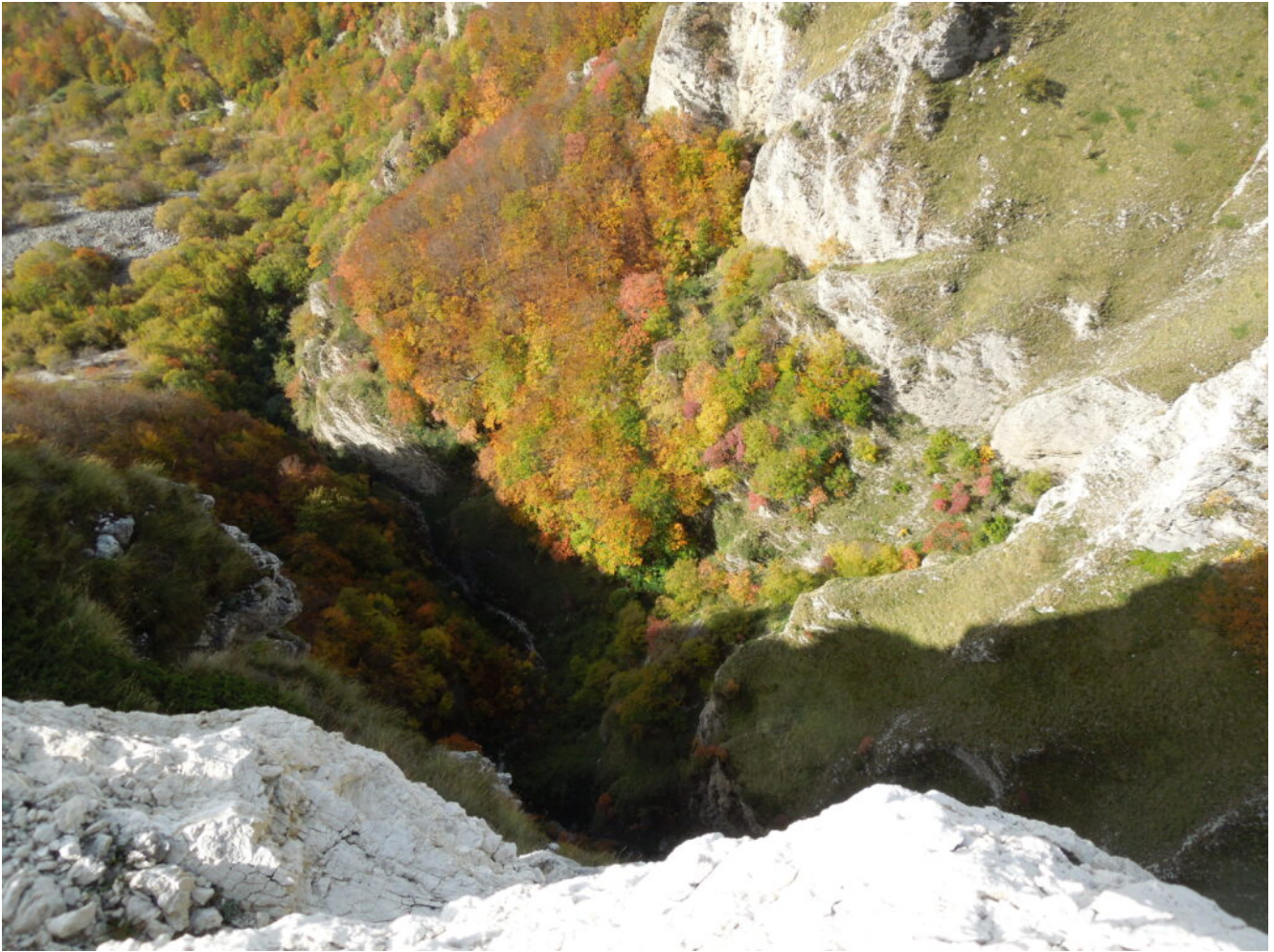
14 – 15 – La parte terminale del Fosso La Foce vista in verticale dalla Cengia dei Fiumarelli