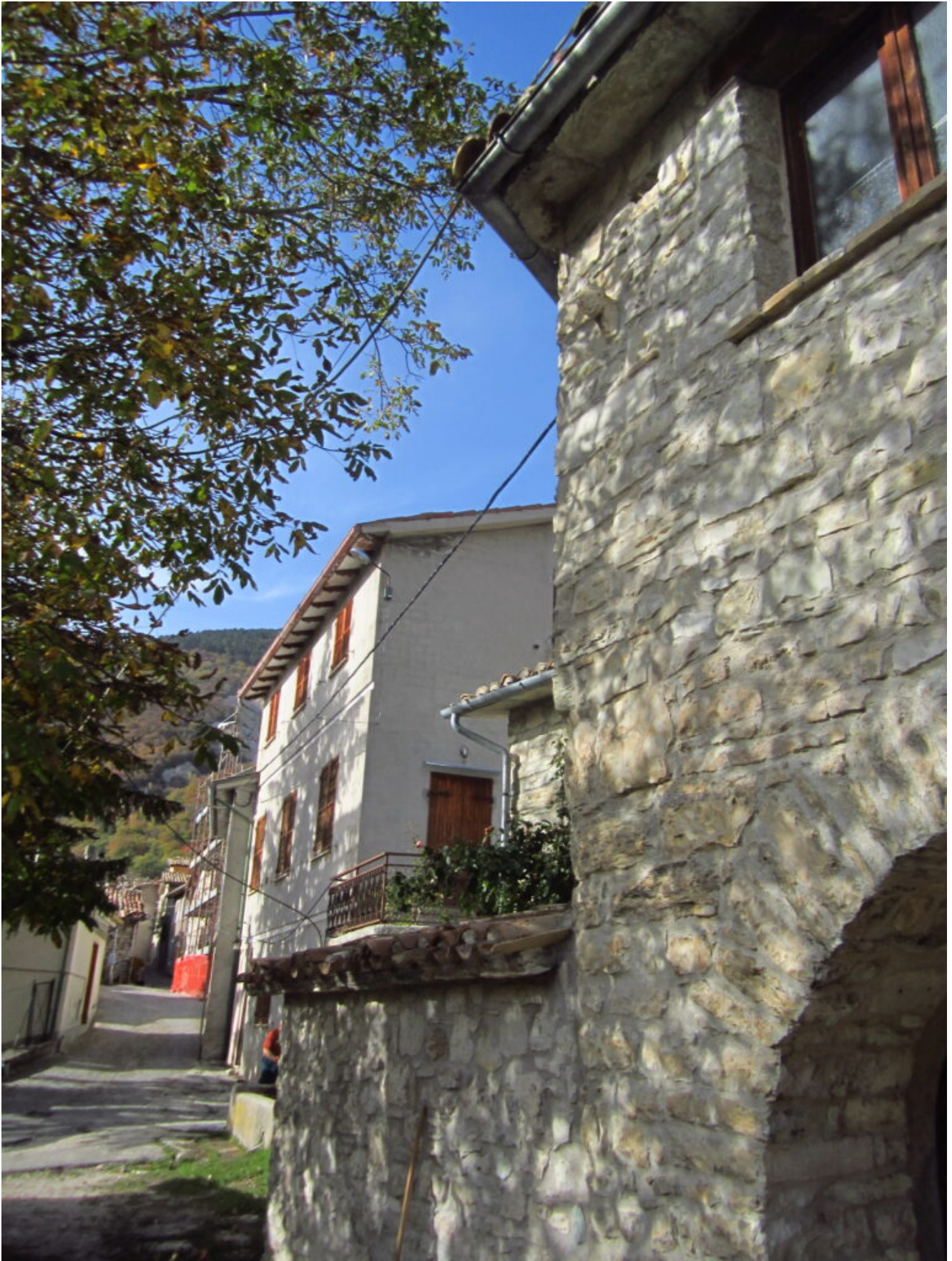
29- Casali di Ussita, ormai un paese fantasma.