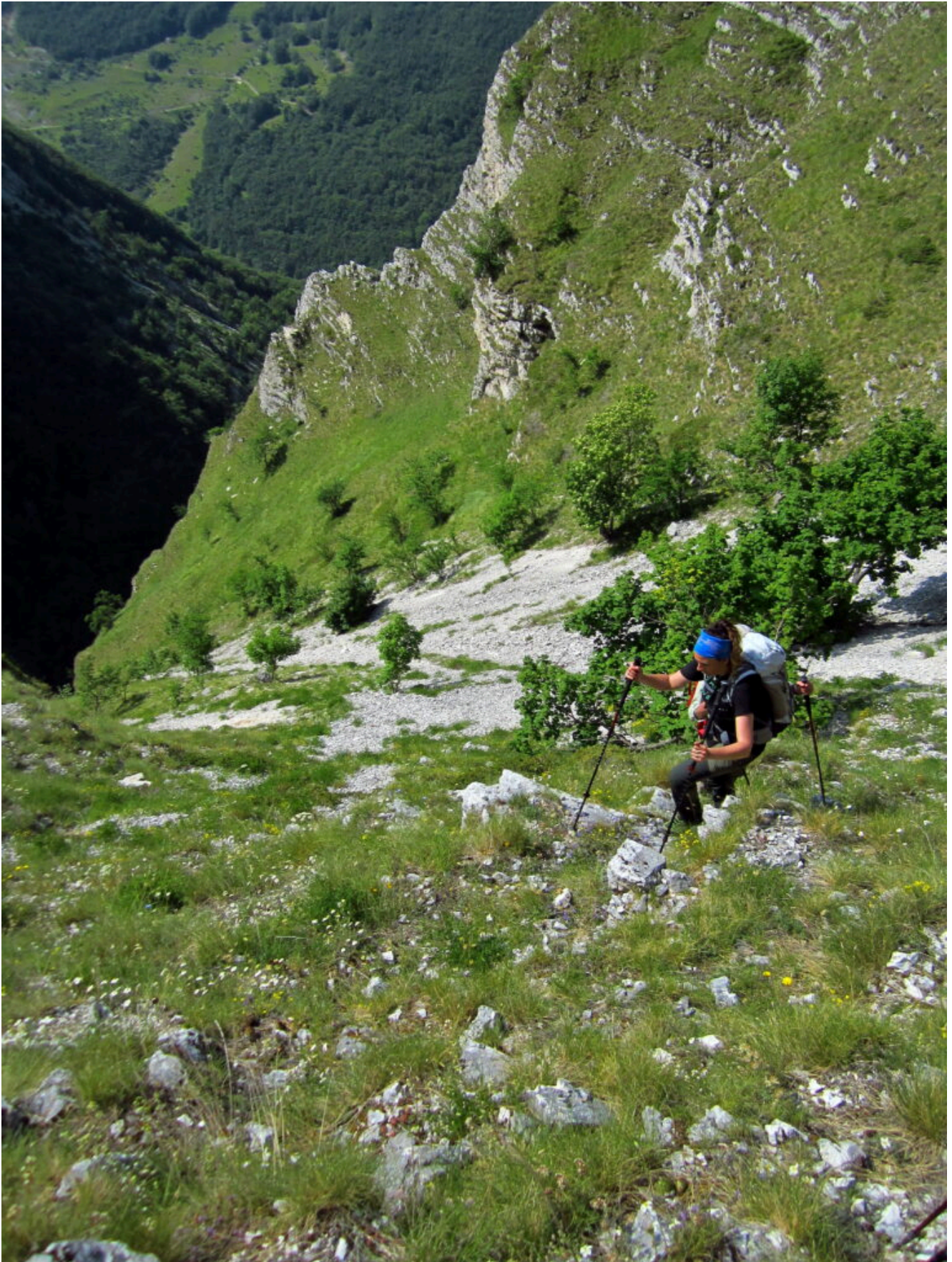
4- Il ripido imbuto del ramo destro secco, ha portato acqua fino a 10 anni fa poi si è asciugato.