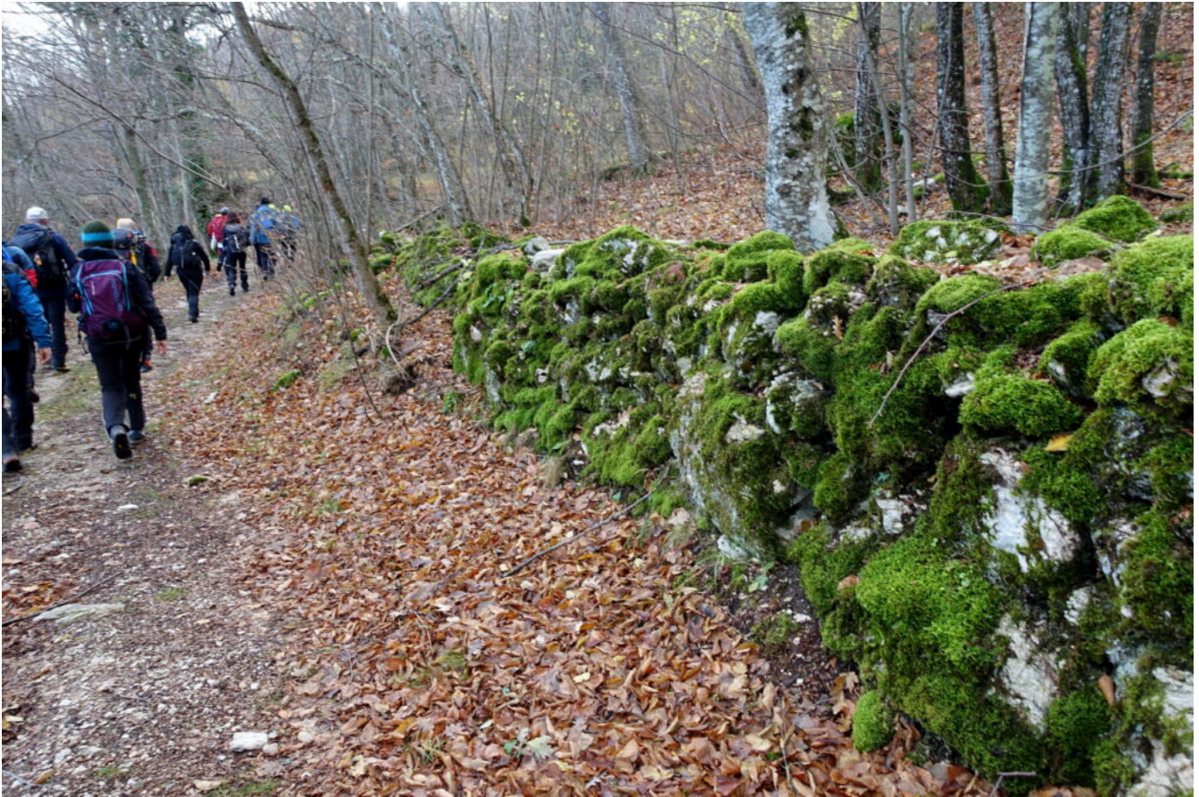
4- Vecchio muretto a secco nel sentiero N4