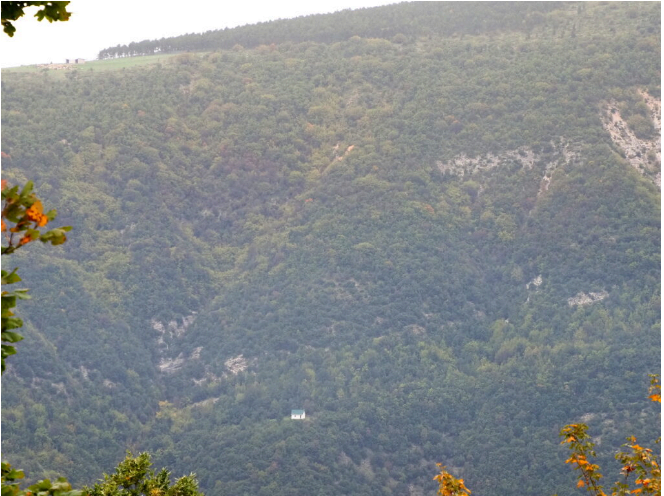
30- Zoom sul Romitorio