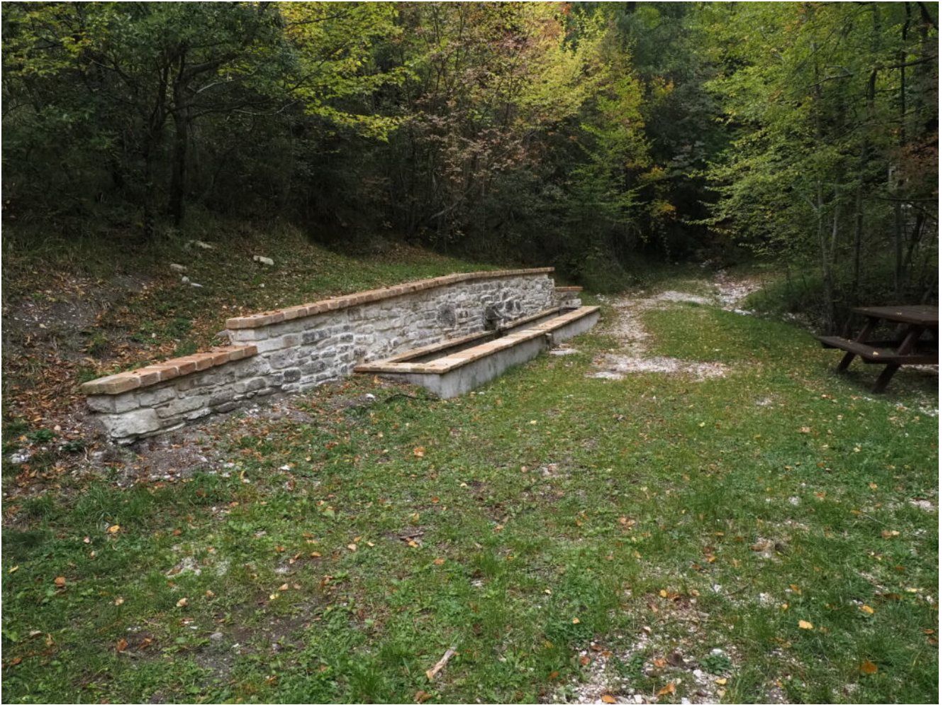
5- La Fonte del Beato Ugolino.