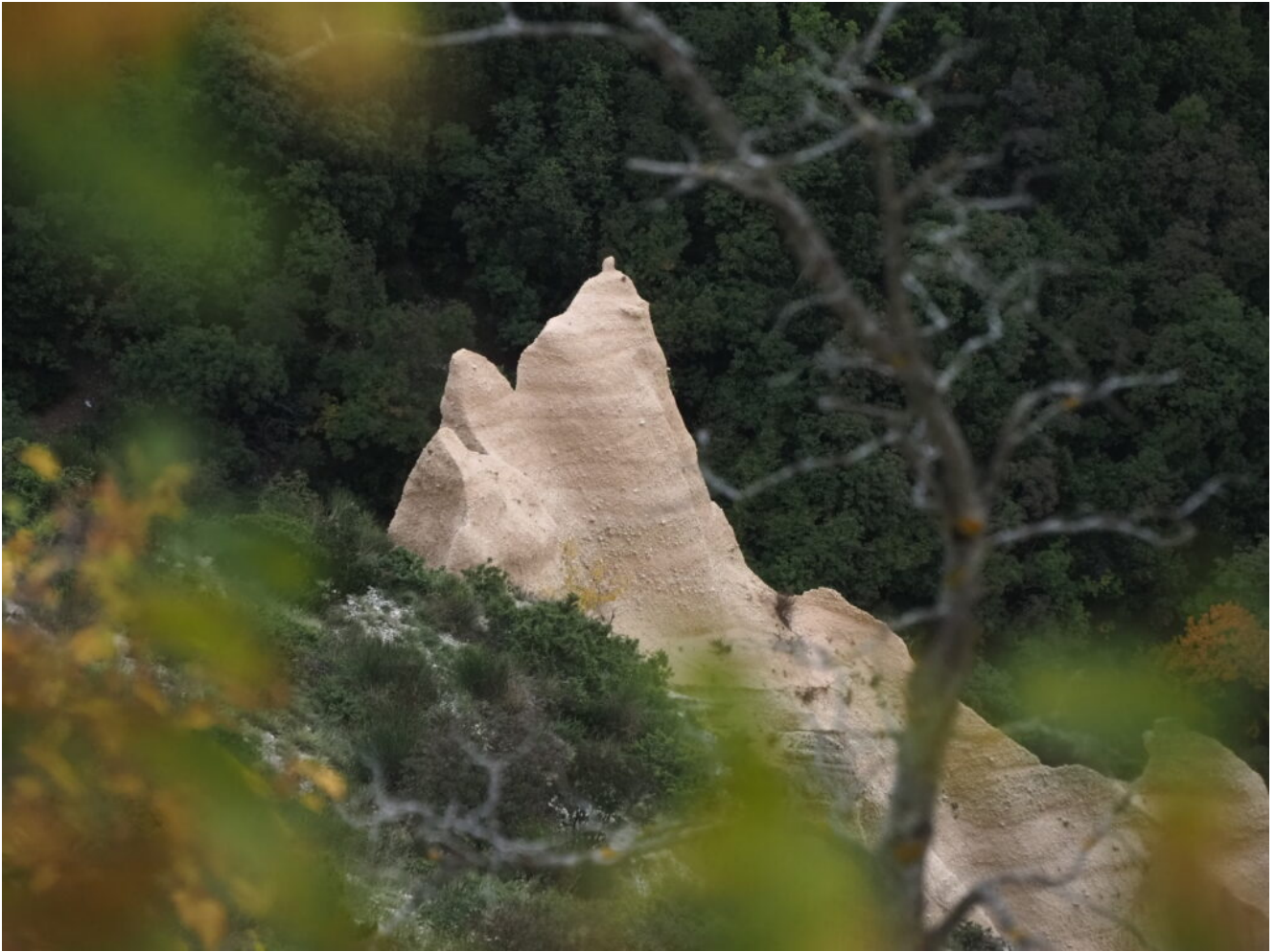
18 – 19- I Torrioni delle Lame Rosse da una veduta insolita, dall'alto anziché dal basso.