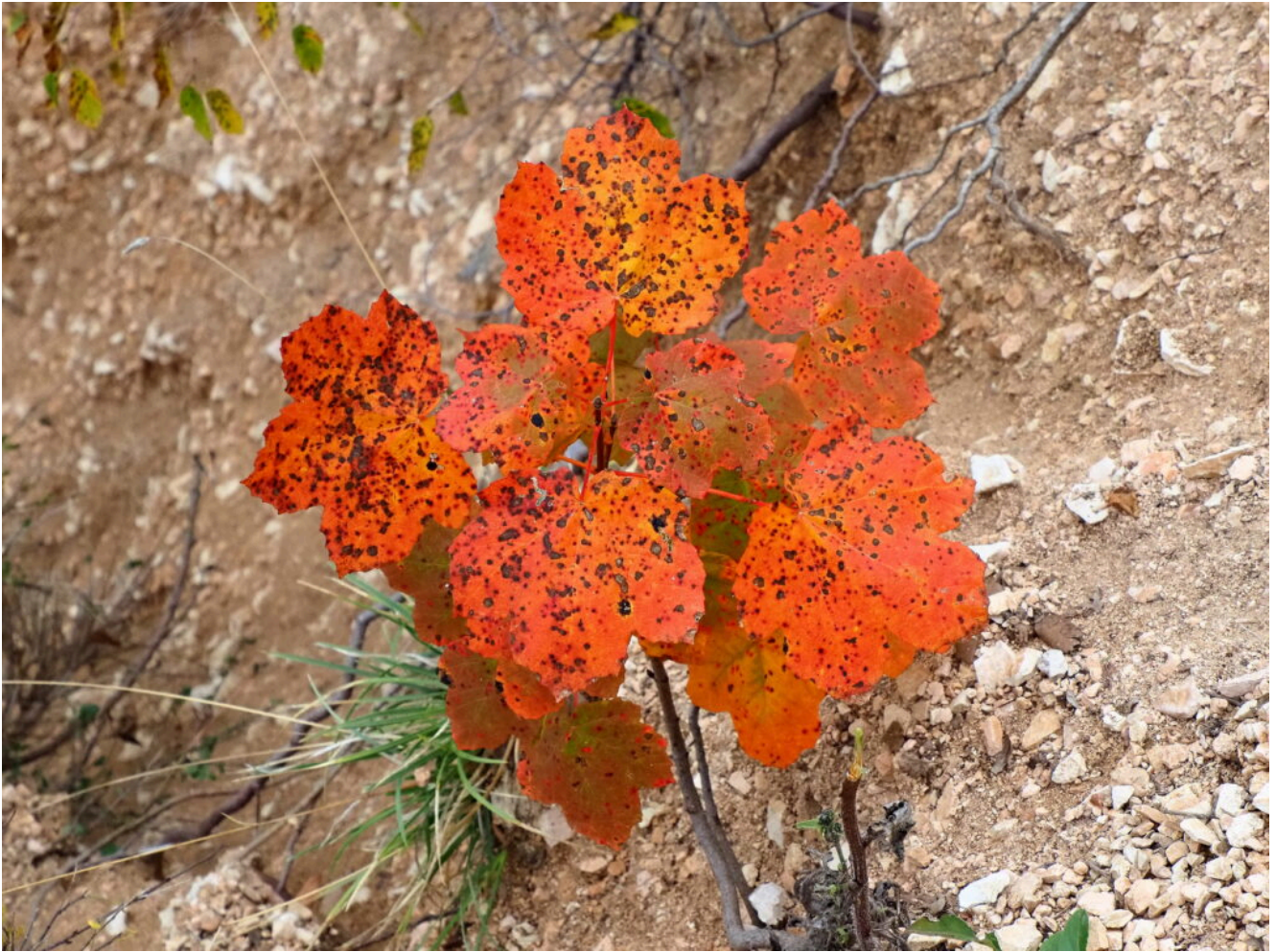
24- Piccolo ma coloratissimo Acero.