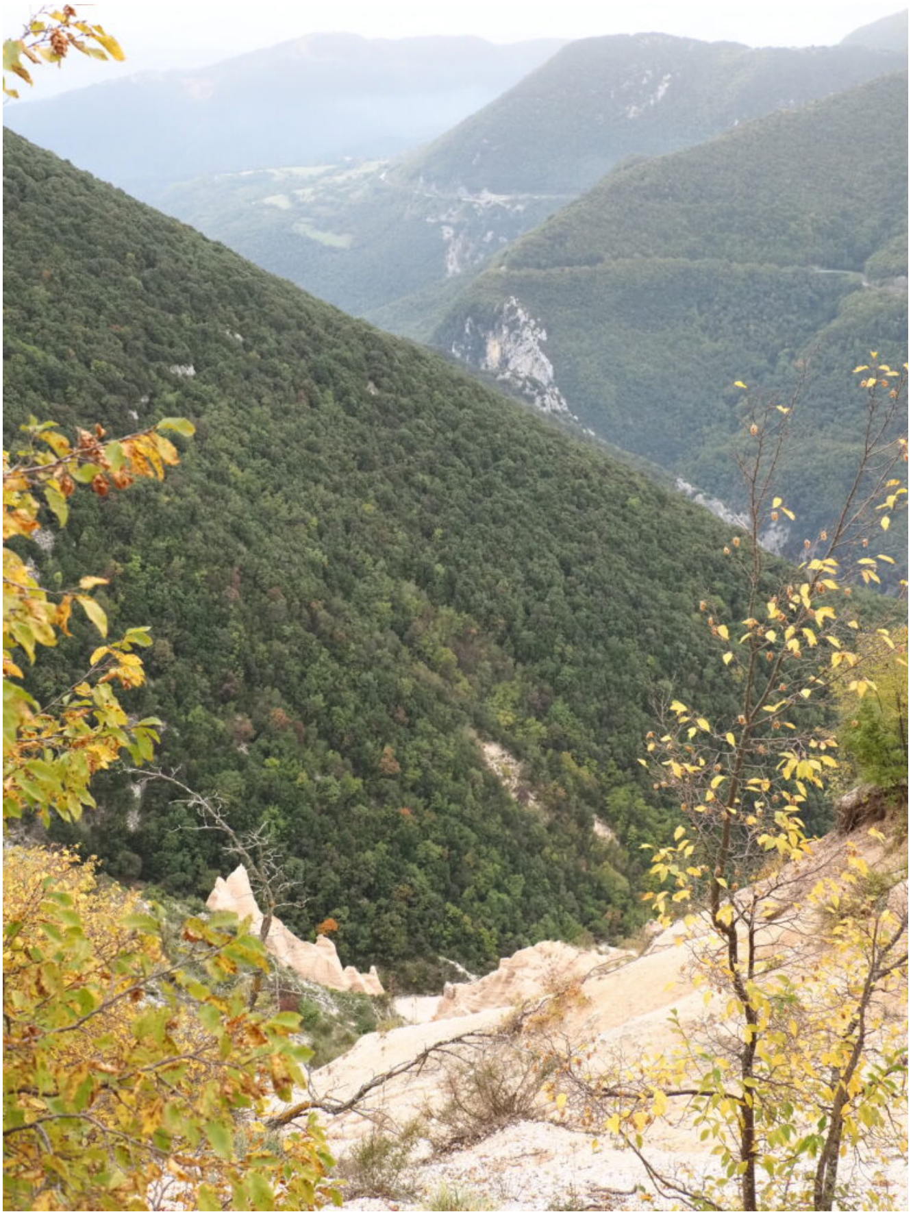
17- La Valle del Fiastrone, i campi di Monastero ed il taglio della strada che da Pian di Pieca conduce al Lago di Fiastra..