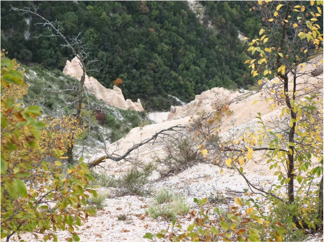
16- Ed in fondo i torrioni delle Lame Rosse.