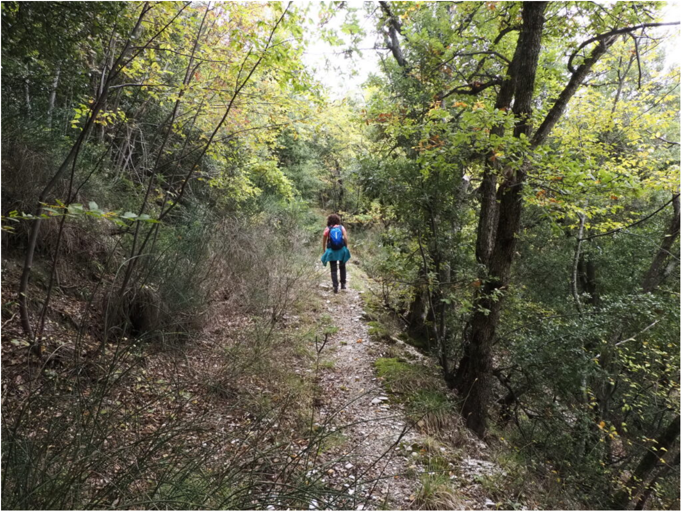
10- Dietro al Romitorio parte il sentiero per le Lame Rosse.