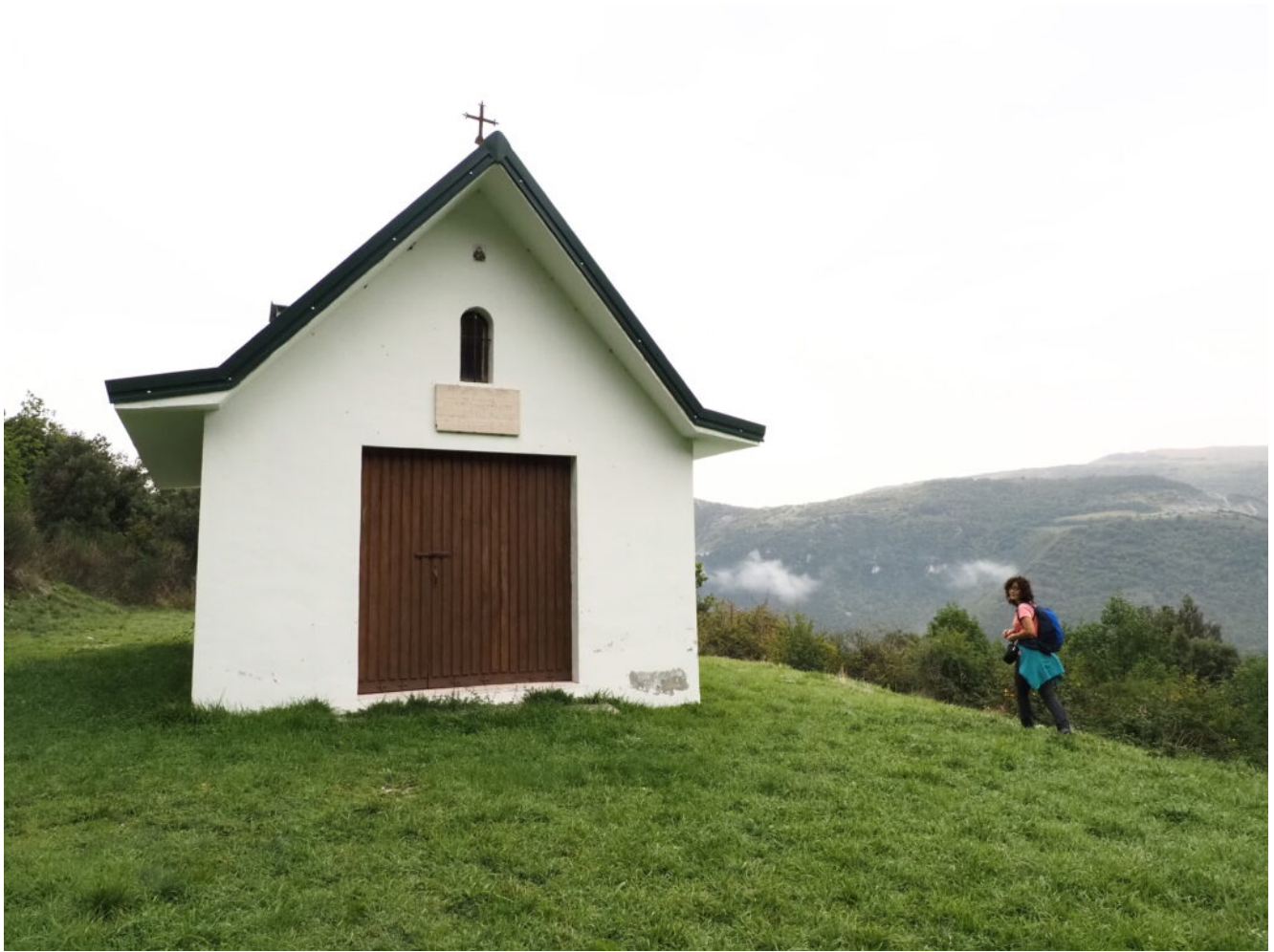
6 – 7 – Il Romitorio del Beato Ugolino costruito in una radura nel bosco con un bellissimo panorama....se fosse stato sereno.