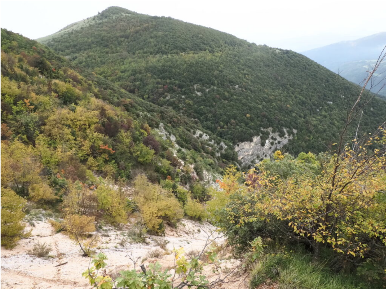
15- Di fronte il Monte Sottacqua.