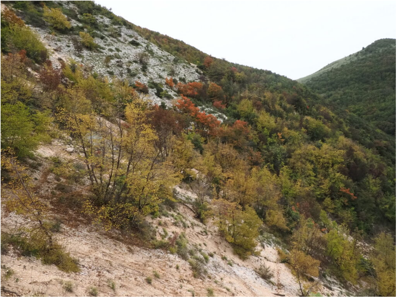
14- La parte superiore del canalone delle Lame Rosse.