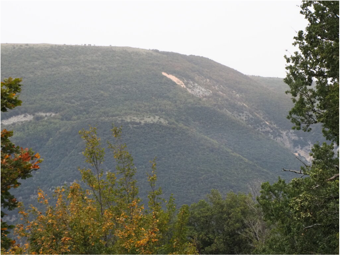
31- Zoom sul canalone delle Lame Rosse.