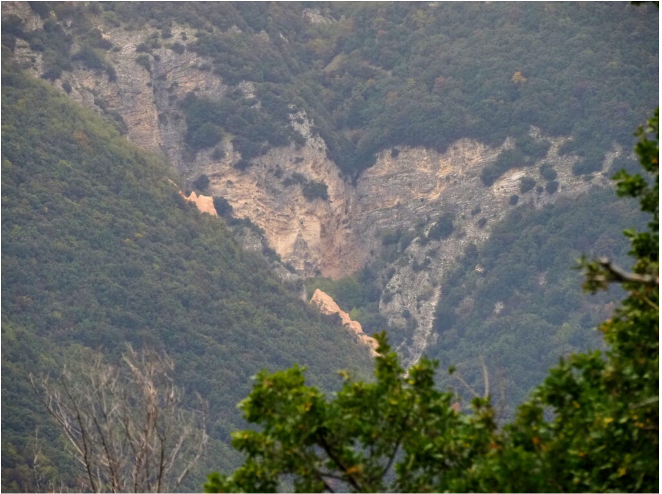
32- Zoom sui torrioni delle Lame Rosse.