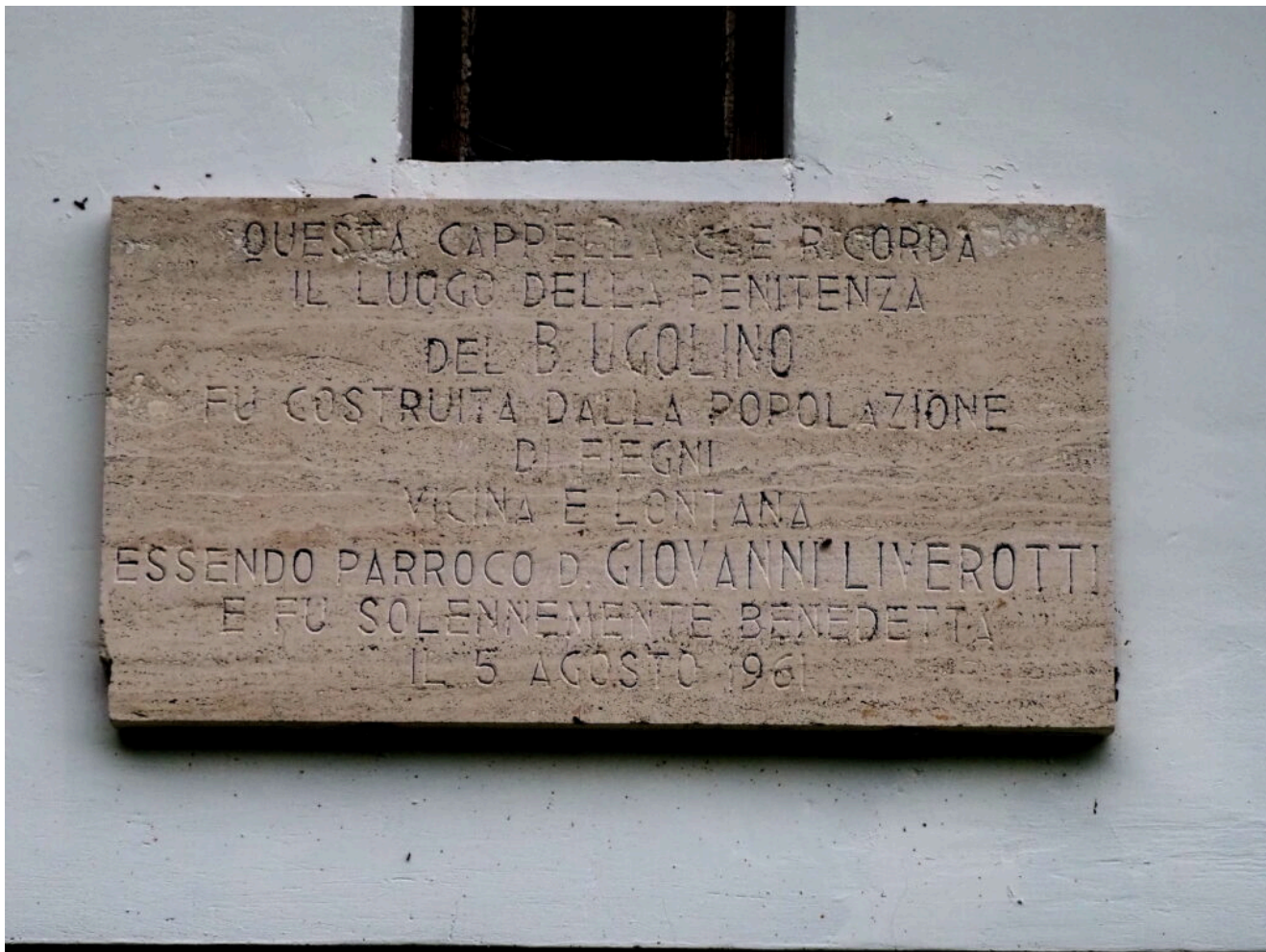
8- La targa che ricorda il giorno della costruzione dell'eremo.