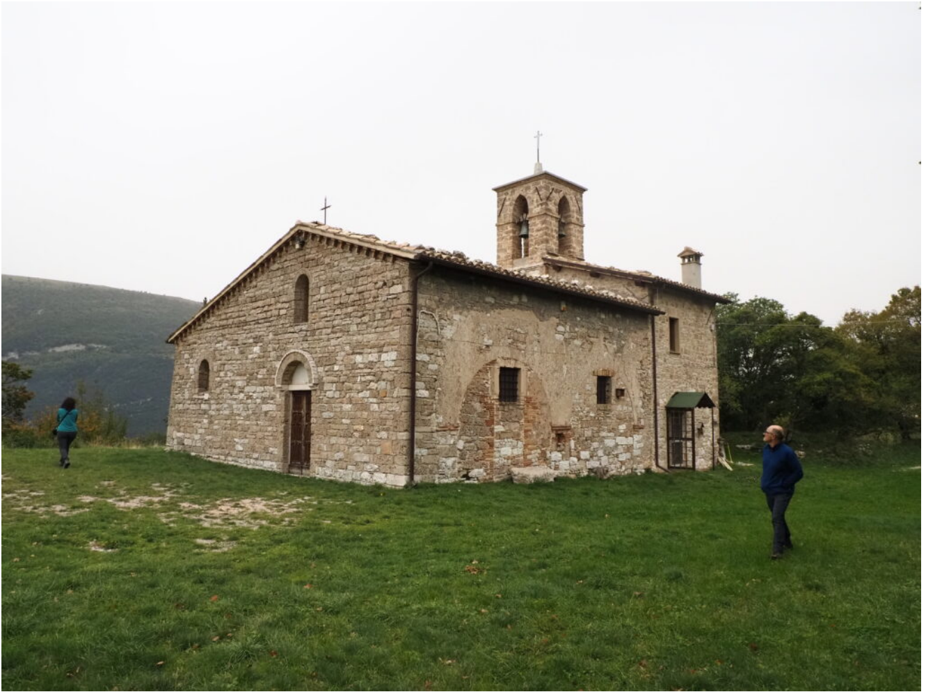
28- la Chiesa abbaziale di Santa Croce di Podalla, del XIII secolo, che abbiamo visitato nel pomeriggio.