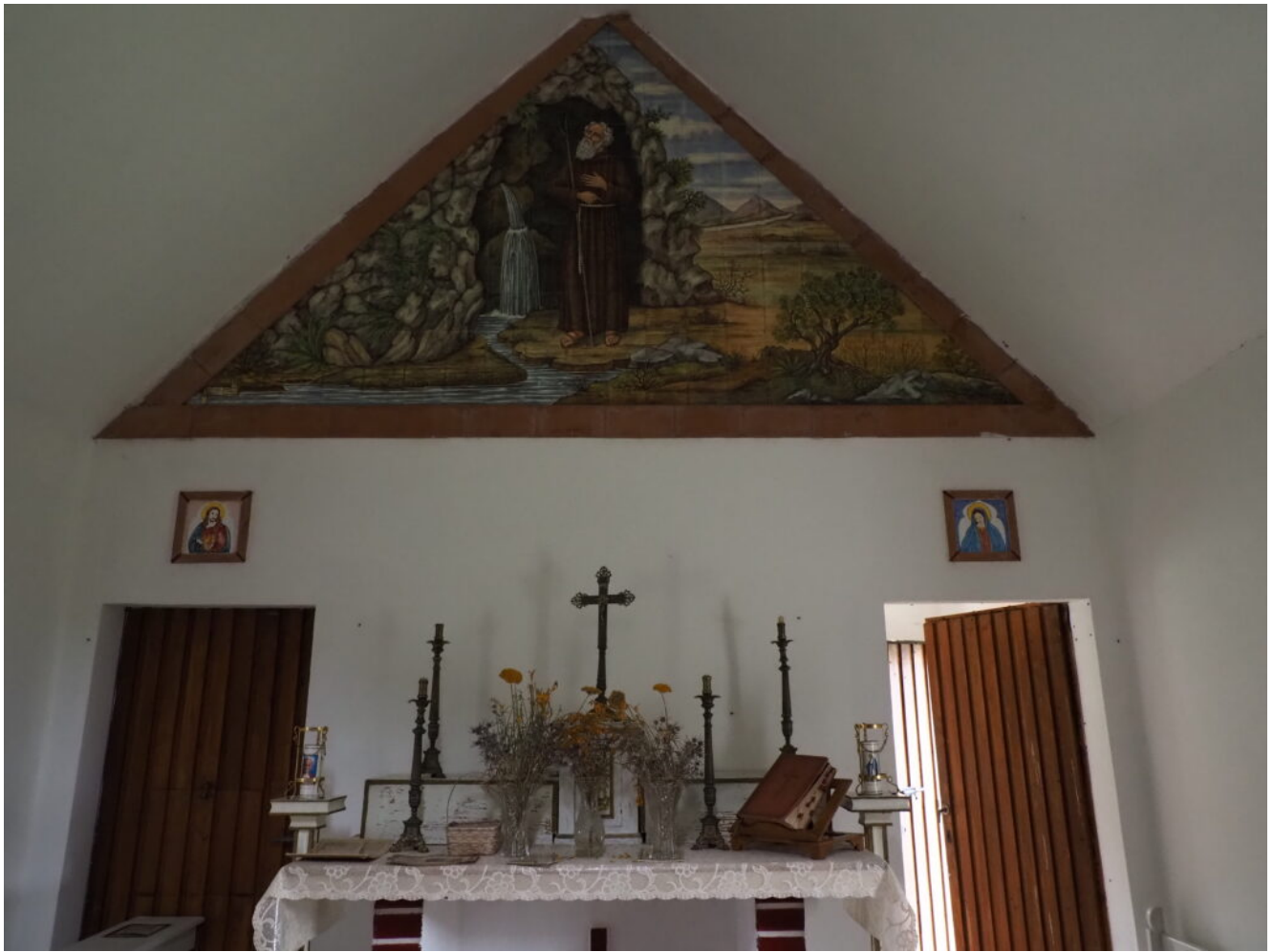
9- L'interno del Romitorio.