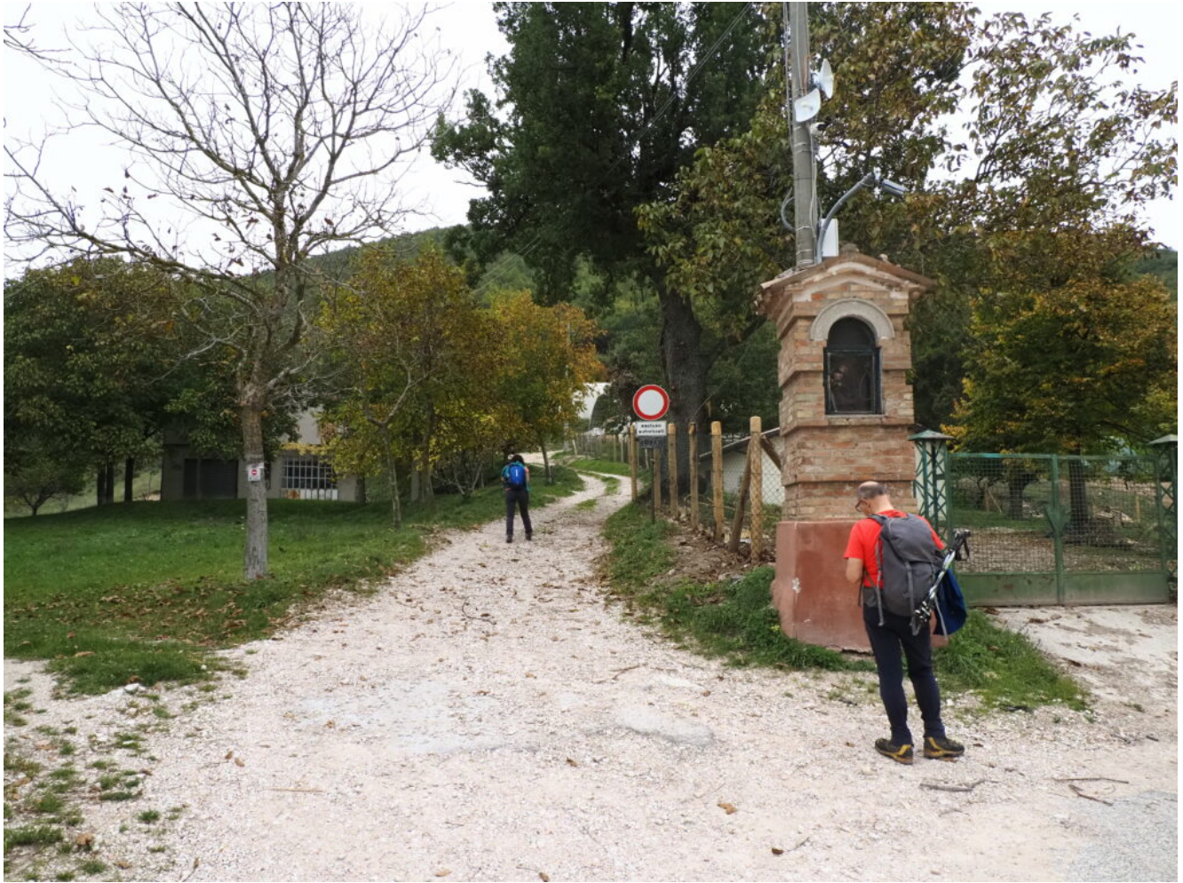
1- L'edicola nella strada all'ingresso di Fiegni, punto di partenza dell'itinerario proposto.