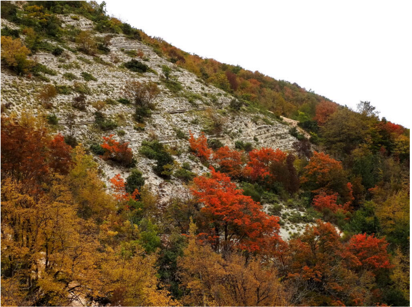
25- La parte superiore del canalone.