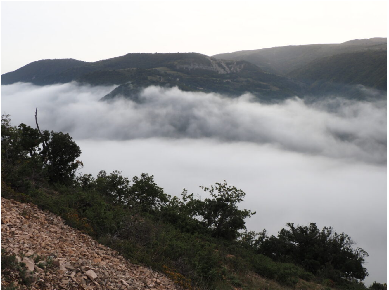
3- Veduta verso la frazione di Podalla di Fiastra, Monte Frascare e il Monte Montioli a destra.