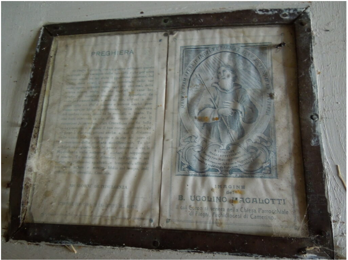
27 - 28 - L'interno della chiesa.