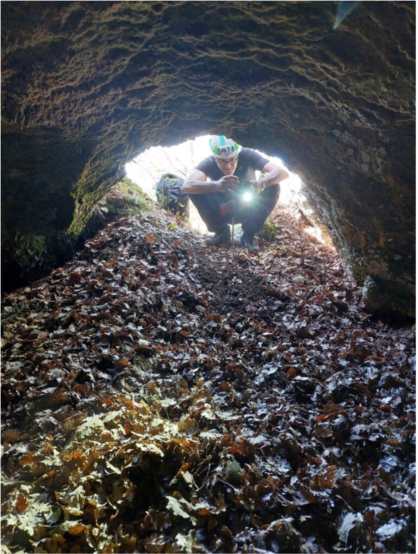
10 LA GROTTA "C"