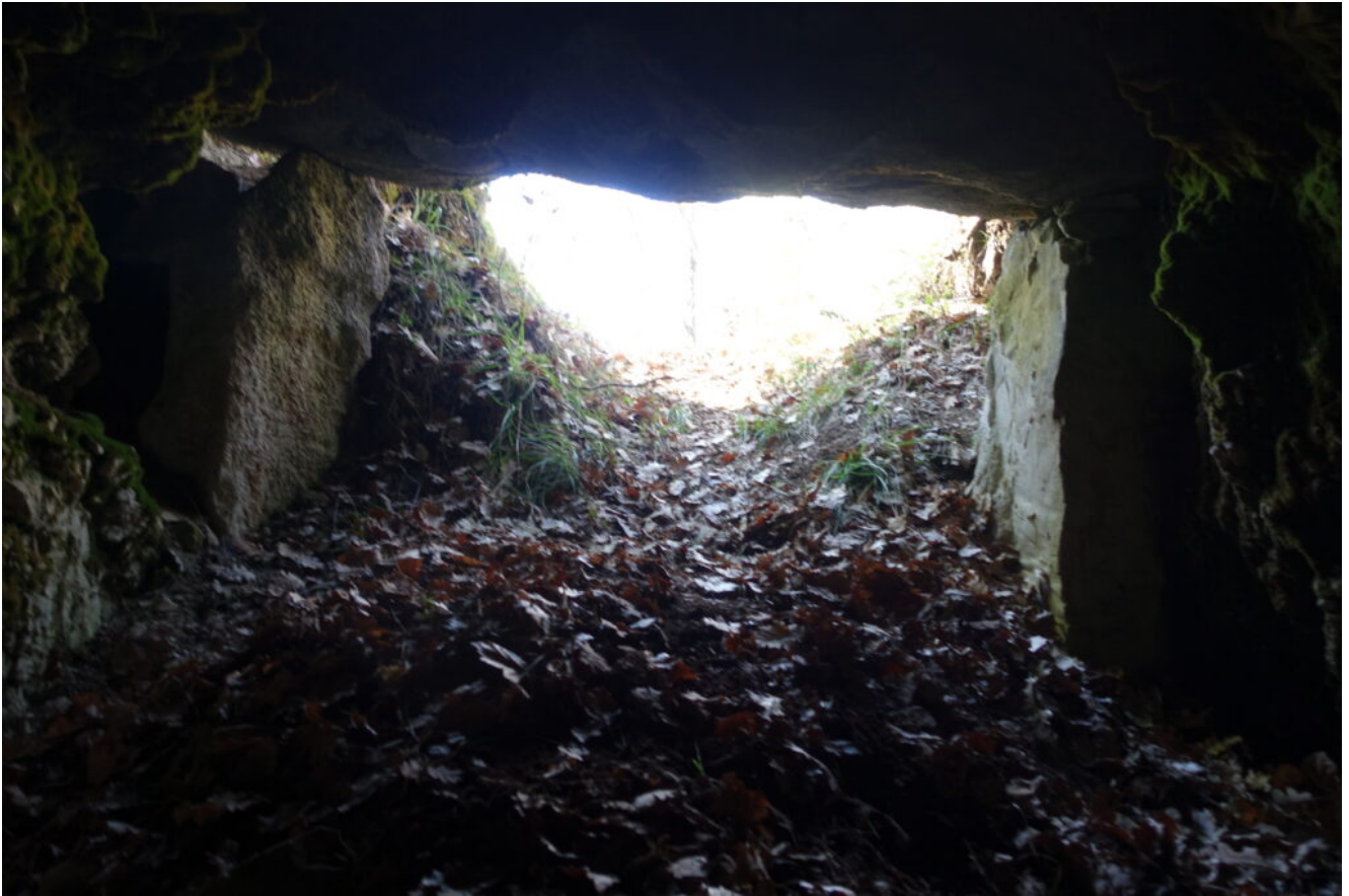
8 LA GROTTA "B"