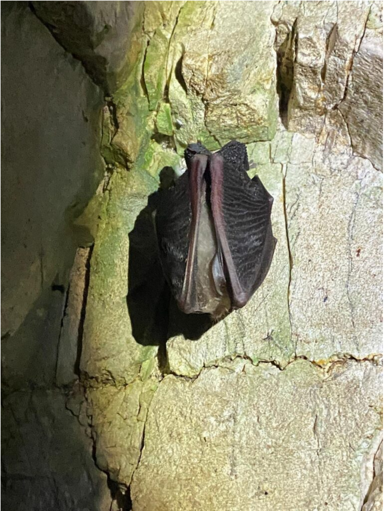
38- E chiaramente anche da Chirotteri.