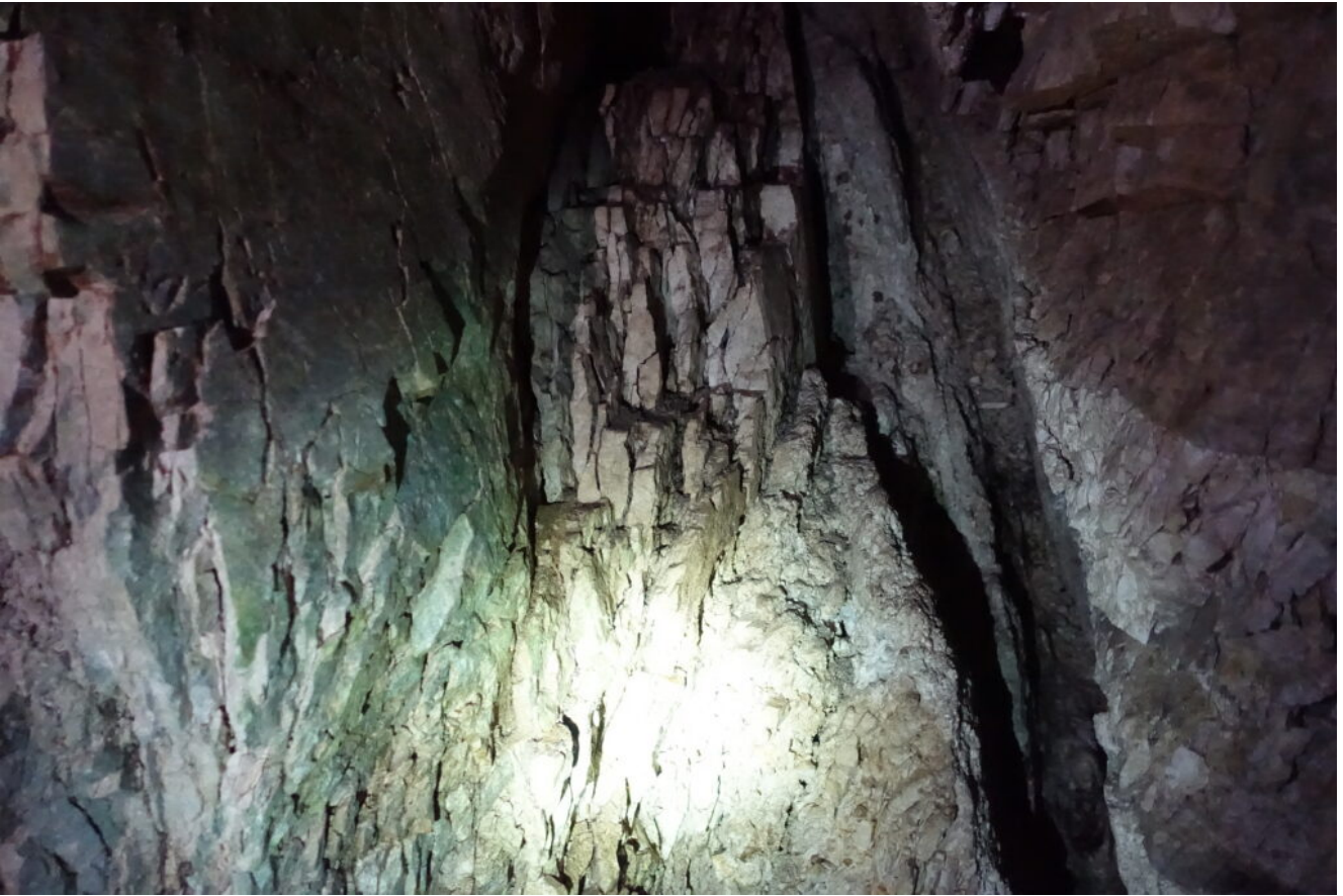
27- Una faglia interna che separa la giacitura orizzontale degli strati a destra da quella verticale degli strati a sinistra.