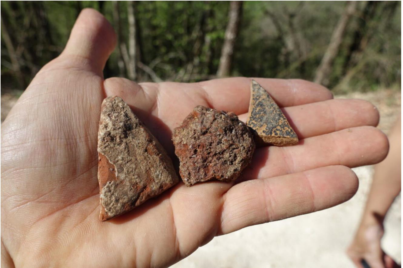
39- Alcuni frammenti di terracotta ritrovati al loro interno di cui quello a sinistra ricoperto di incrostazioni calcaree e quella a destra in particolare con tracce di vernice nera all'esterno stile bucchero,