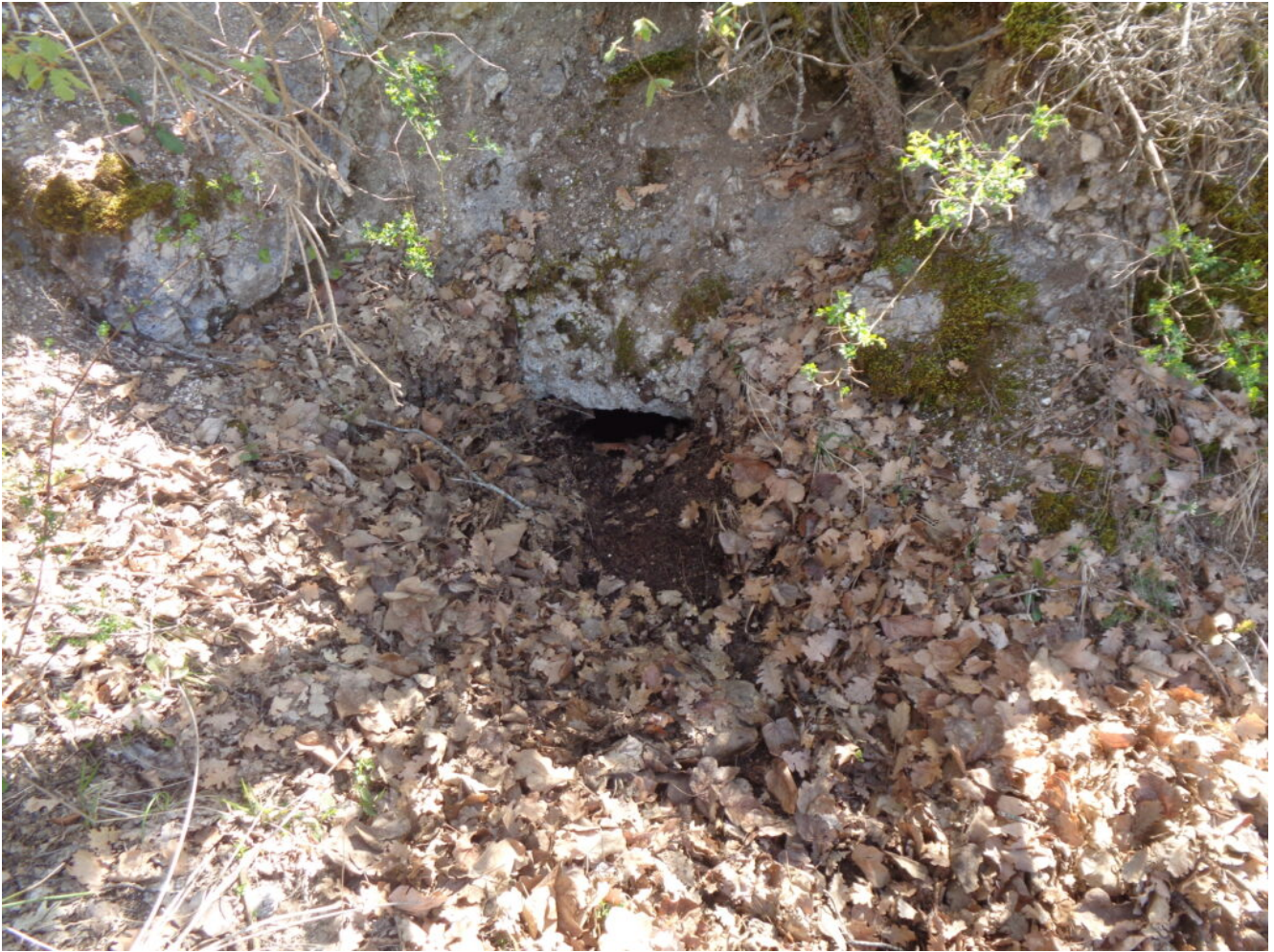
19- La finestra vista dall'esterno LA GROTTA "E"