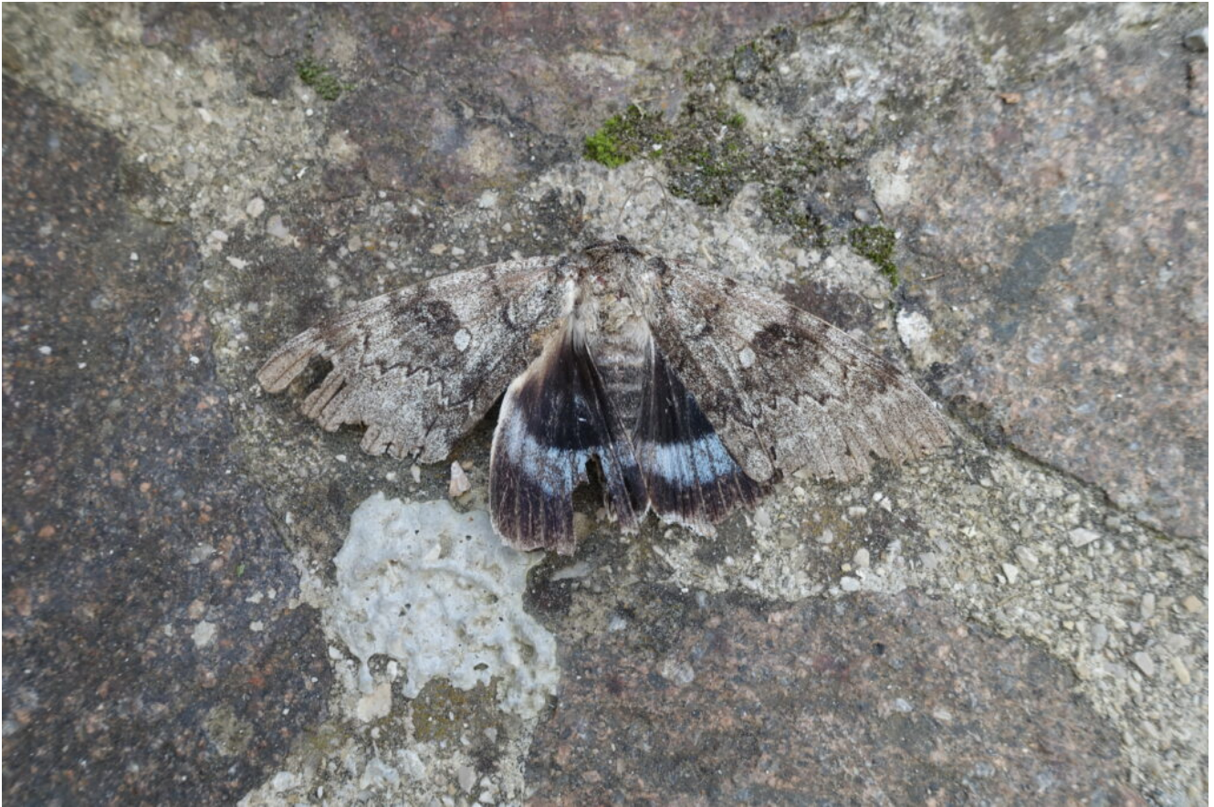
1- Catocala fraxini piuttosto rovinata a fine stagione.