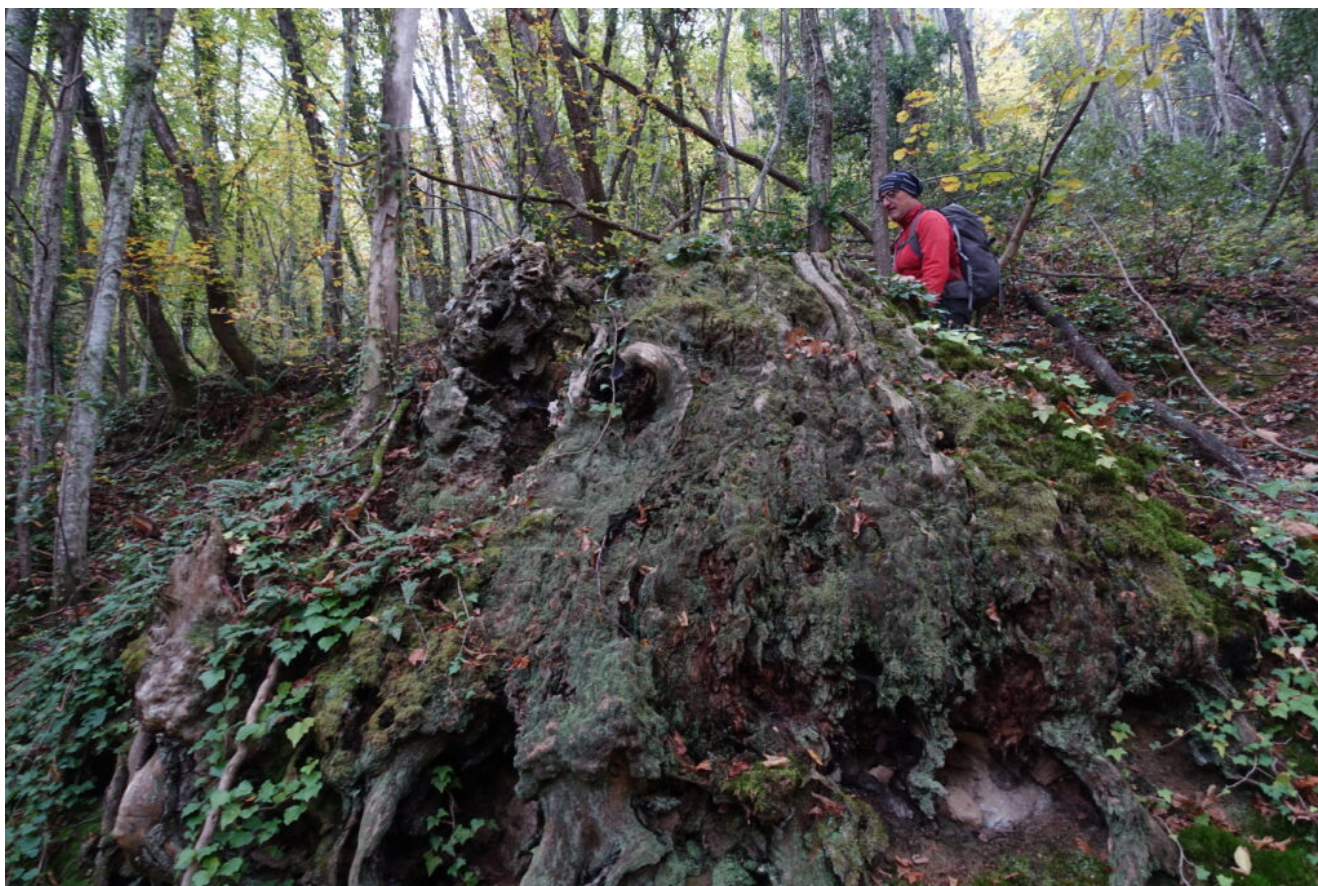
27- Vecchia ceppaia di castagno