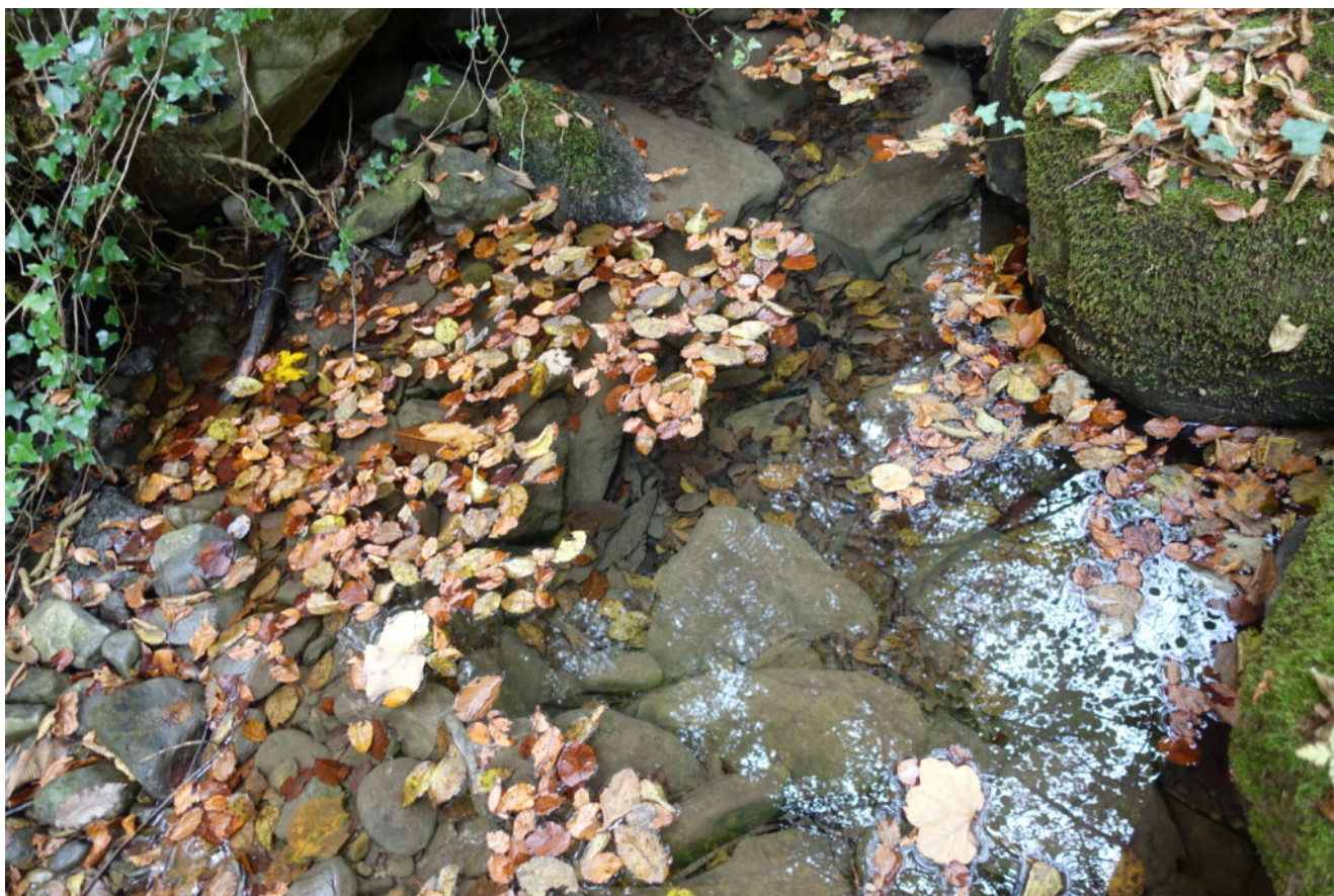
34- Acqua limpidissima nel fosso, visibile grazie alle foglie