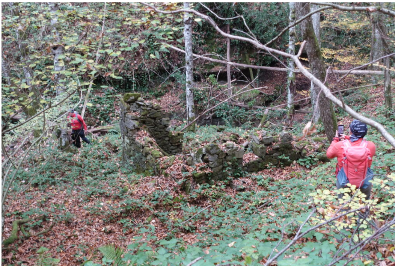
33- Poco prima di arrivare alla Grotta di Sasso Petruccio si incontrano anche i ruderi di un vecchio mulino.