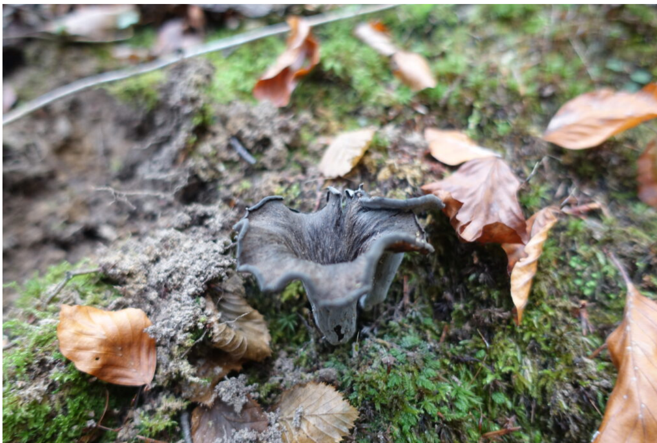
26- Fungo Craterellus cornucopioides detto Trombetta dei morti.