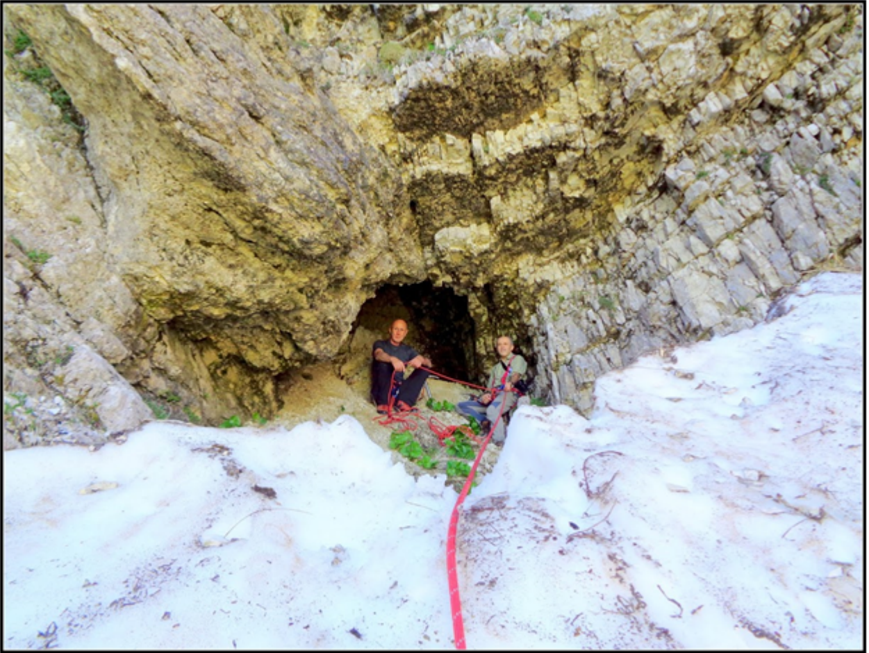
6 – La grotta inferiore, arriva Toni