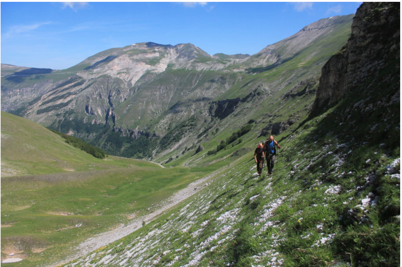
9 - La lunga traversata in quota nel versante Ovest di Monte