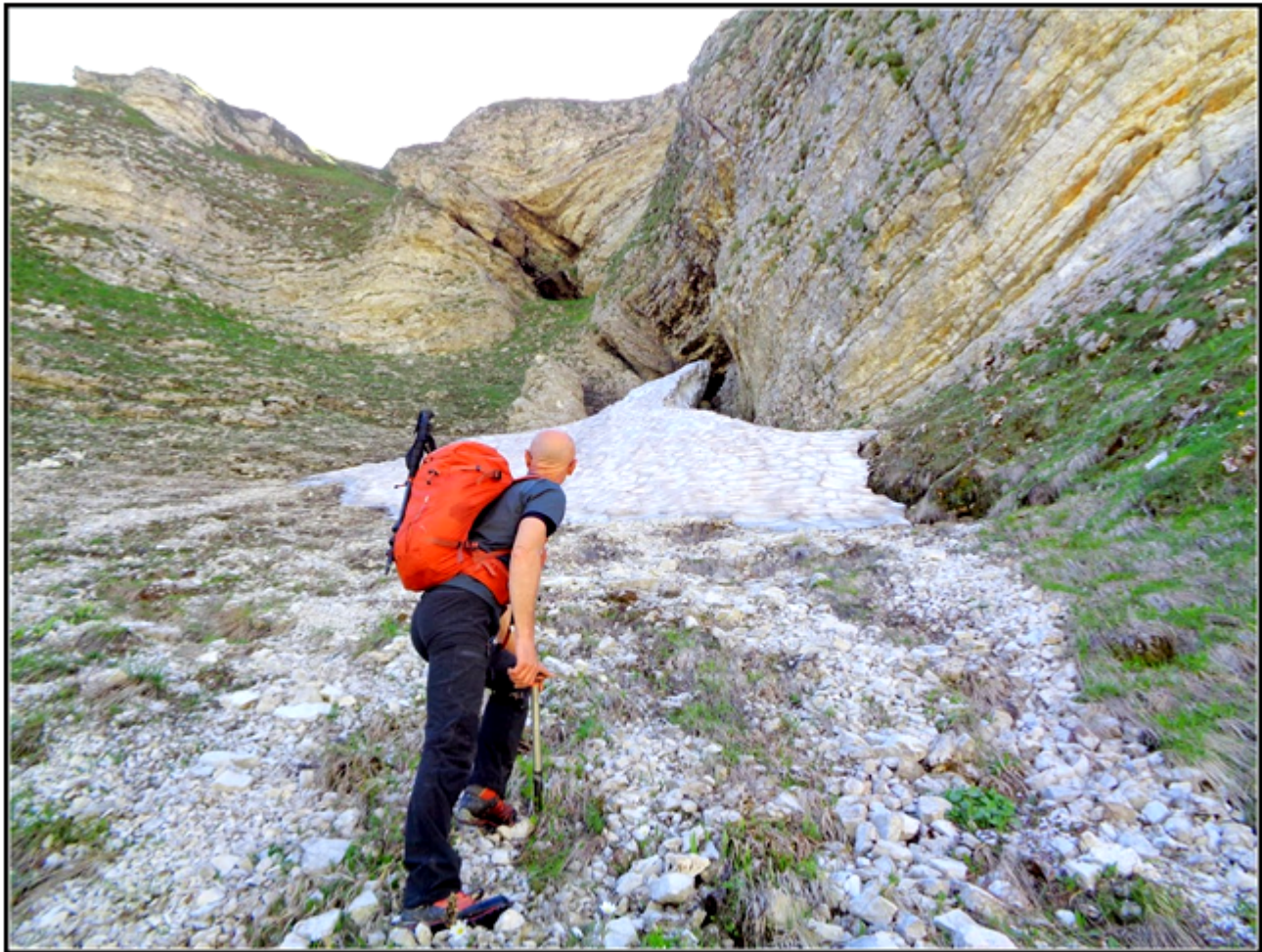
3- Le due grotte parallele esplorate. (ph. Toni Galdi).