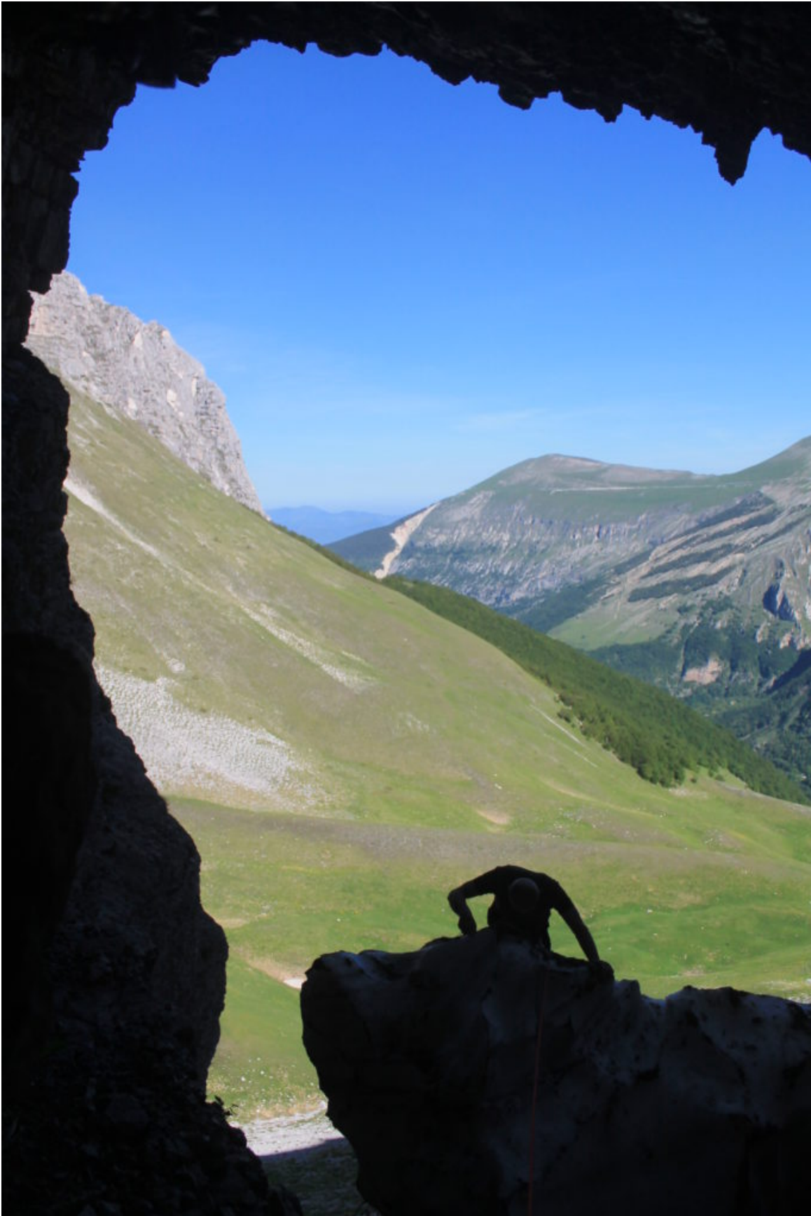
7- Inizia la discesa Fausto