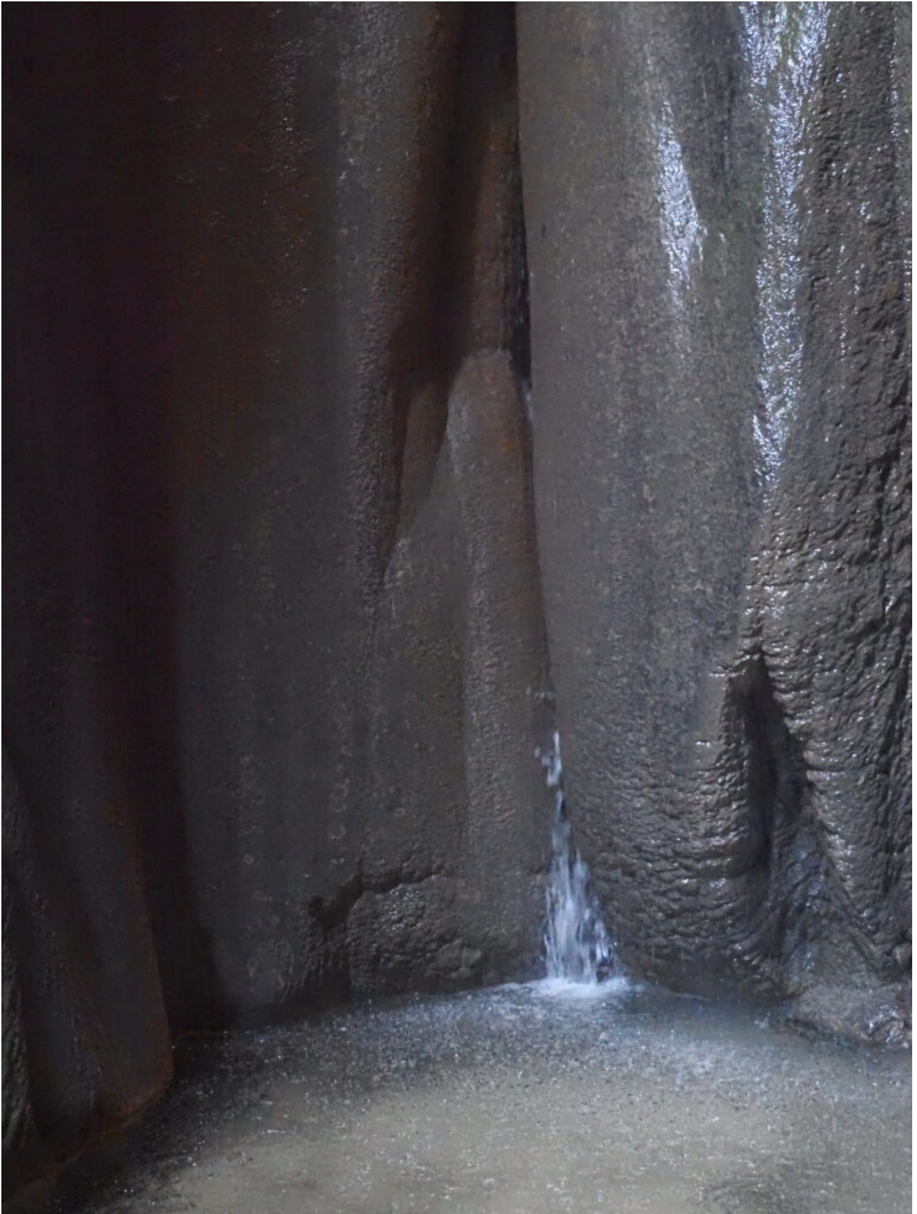
10- Il laghetto alla base della cascata con l'acqua che esce dalla roccia.