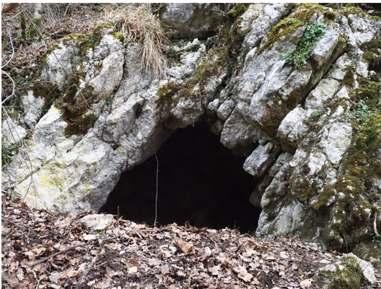
58 – 60- La Grotticella del km 5,3 per Cascia

ACCESSO: Si continua in auto la S.S. 209 della Valnerina da Triponzo in direzione Terni , dopo neppure un chilometro si gira a sinistra per Norcia fino a Serravalle. Si gira a destra in direzione Cascia e dopo 5 km si raggiunge l'incrocio per CERASOLA, si prosegue per Cascia, si supera una casa Cantoniera e, dopo una curva si prosegue 100 metri quindi si parcheggia al alto della strada (attenzione). Nel bosco sulla sinistra si apre la grotticella.