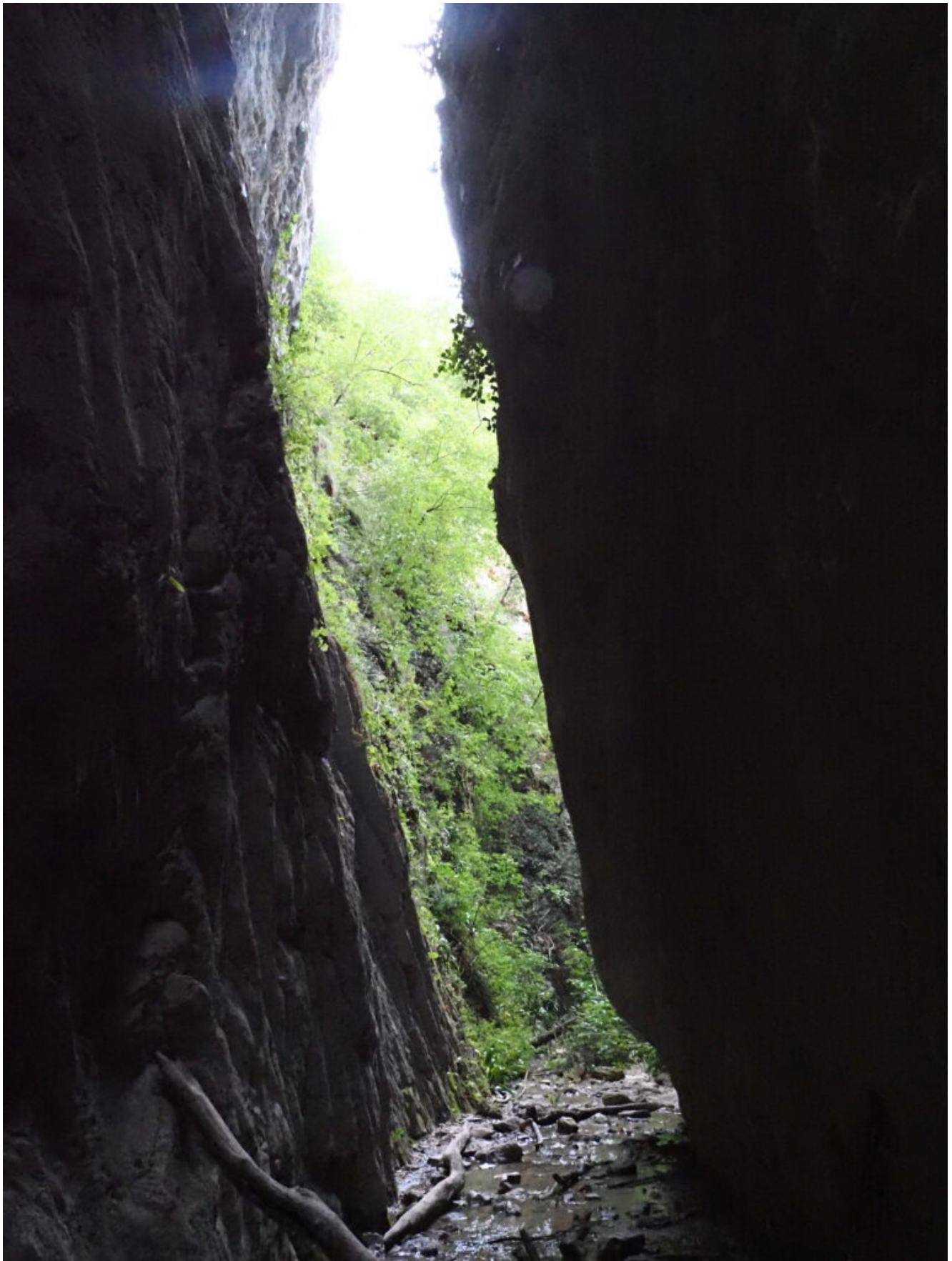
4- L'ingresso della forra visto dalla base della cascata.