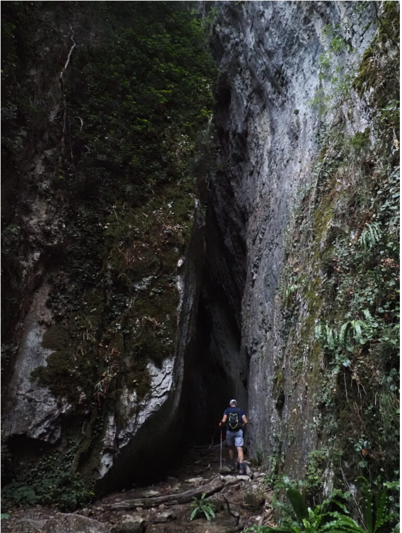
2- L'ingresso della breve forra dove scende la cascata.