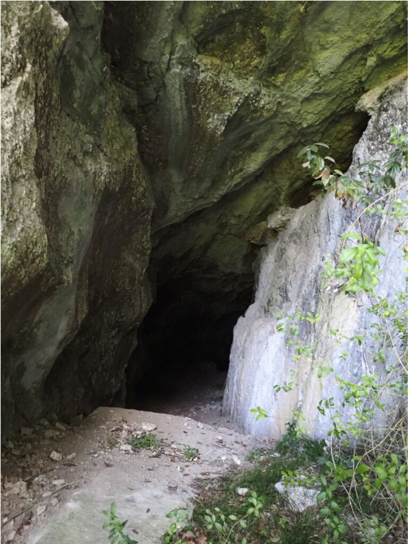
18 – 20 – La Grotta n.2 del Bagni di Triponzo.