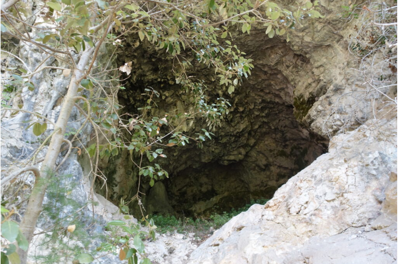
36- L'ingresso della Grotta del Grugnale.