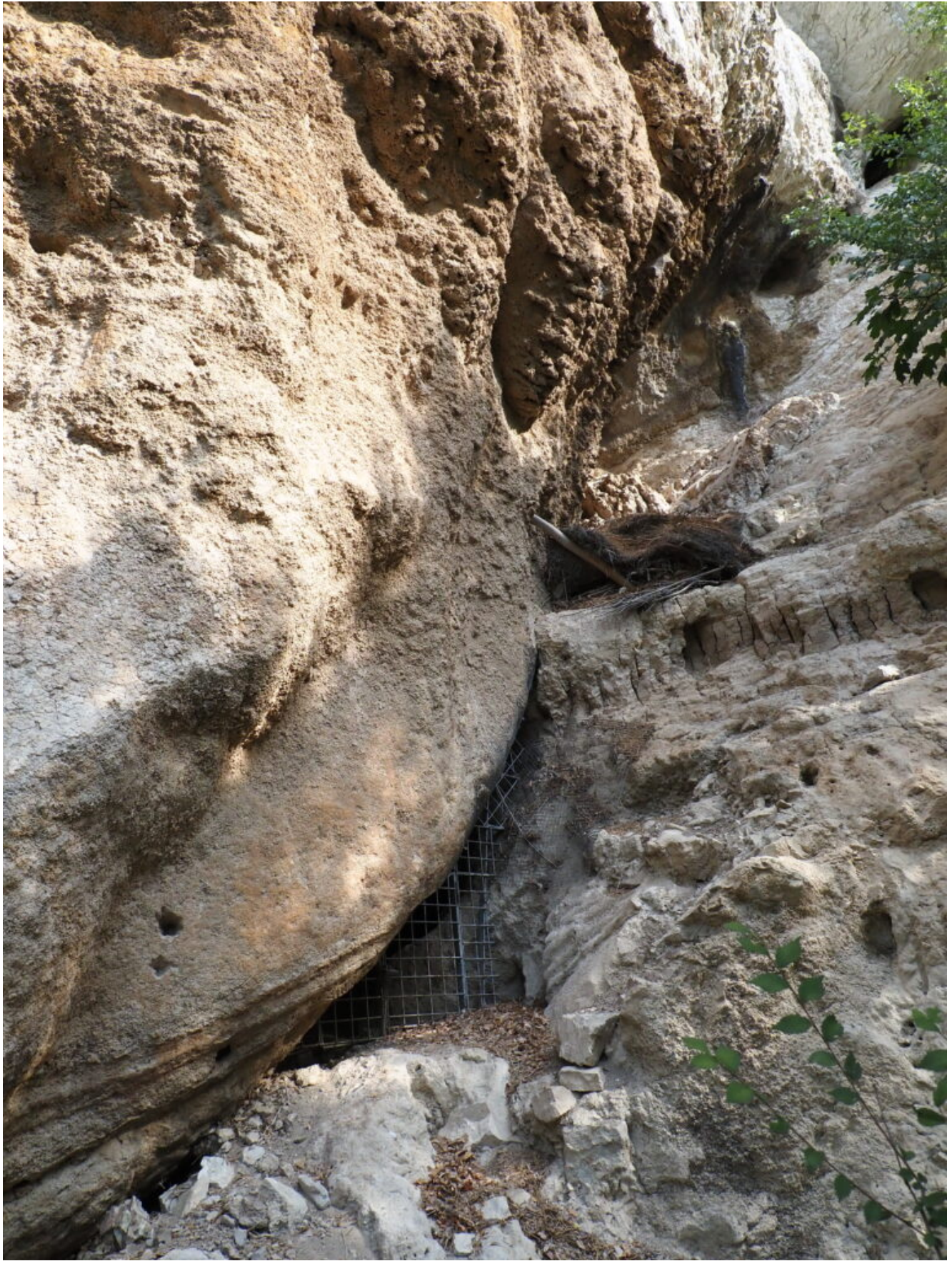
56- L'ingresso della Grotta del Lago.