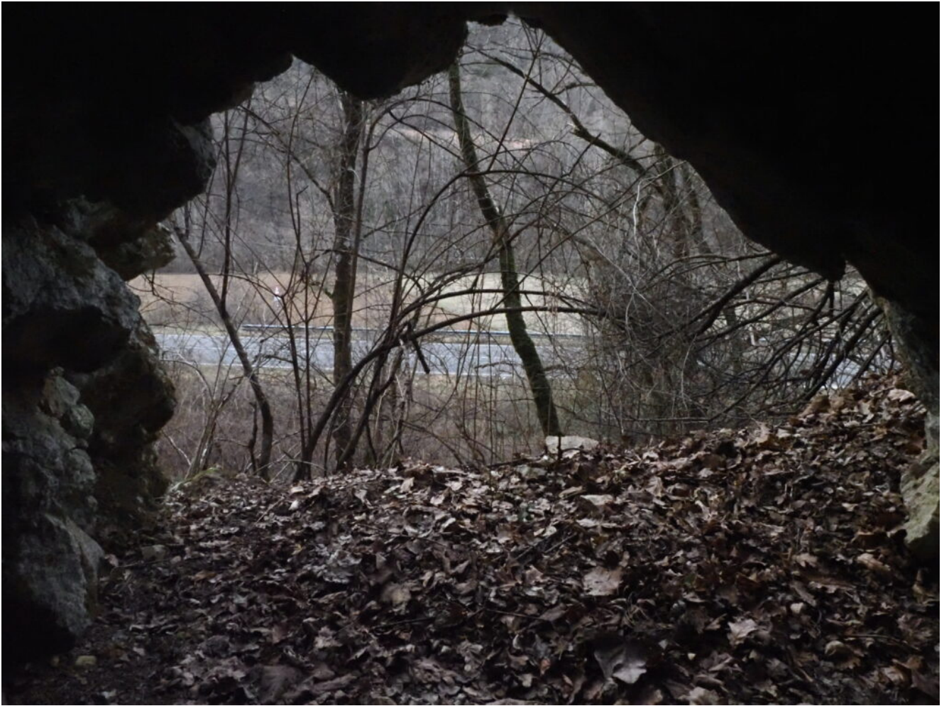
64- La strada per Cascia vista d'inverno dall'interno della grotticella.