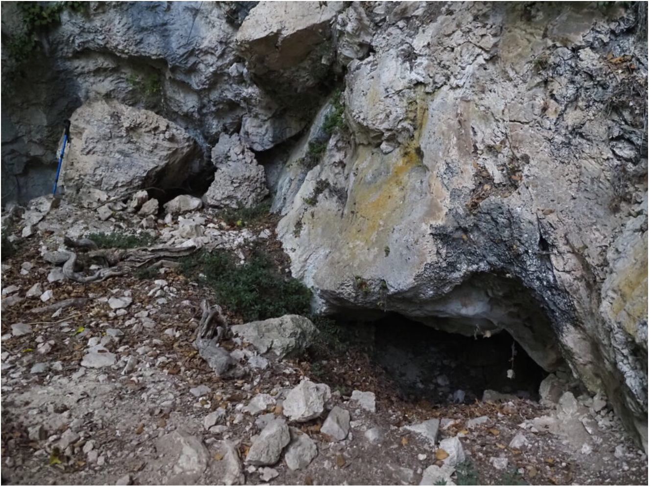
27 – 29- La Grotta n.5 del Bagni di Triponzo.