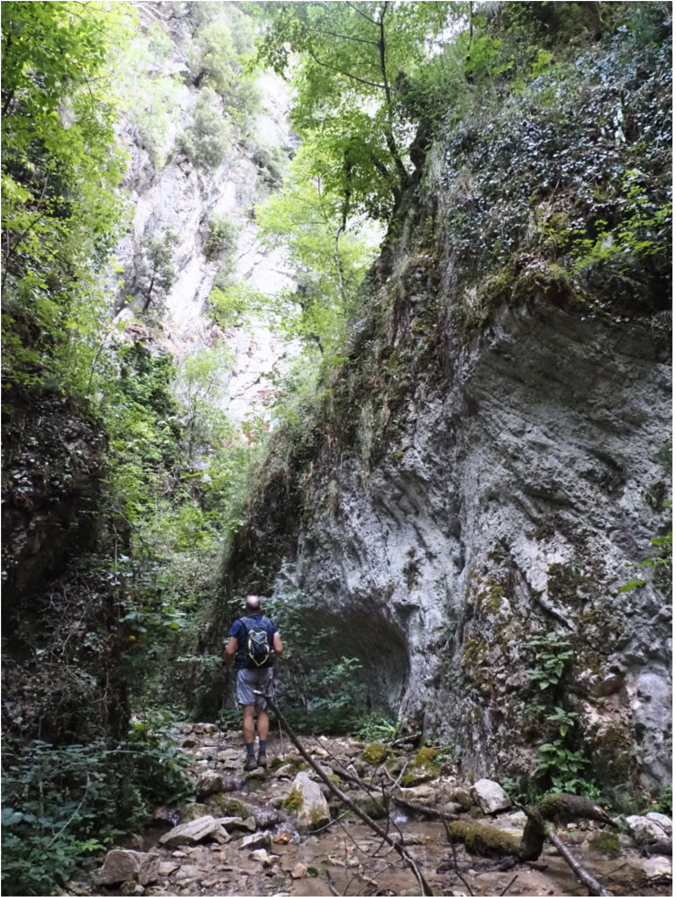
1- La stretta valle del Fosso di San Lazzaro.