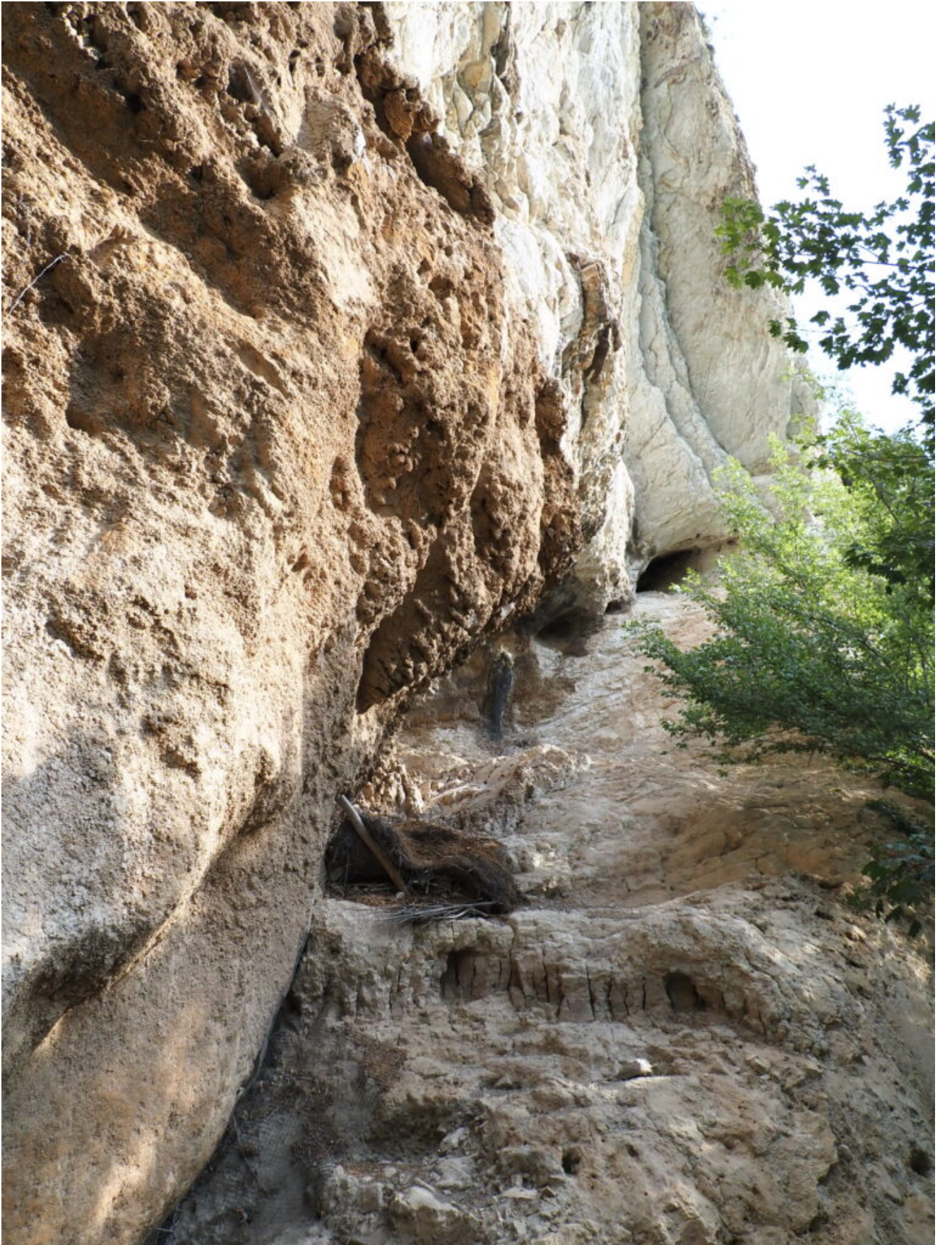
57- L'ingresso superiore e le concrezioni carbonatiche di colore scuro rispetto alle rocce calcaree superiori. GROTTA AL Km 5,3 PER CASCIA: piccola grotticella non riportata nel Catasto delle Grotte della Regione Umbria, trovata per