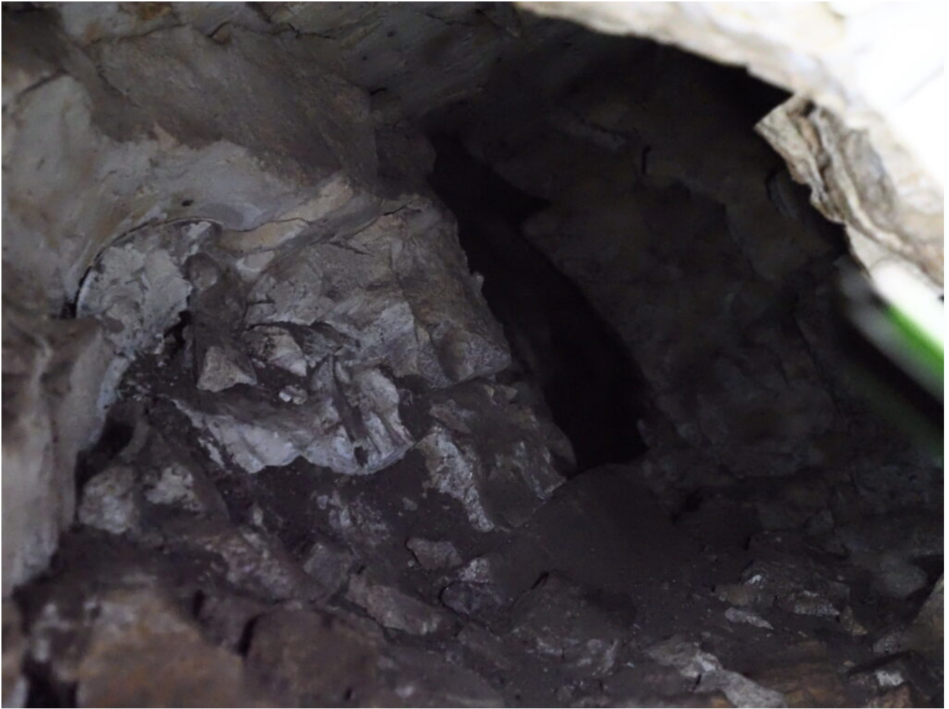
63- Il proseguimento inaccessibile della grotticella.