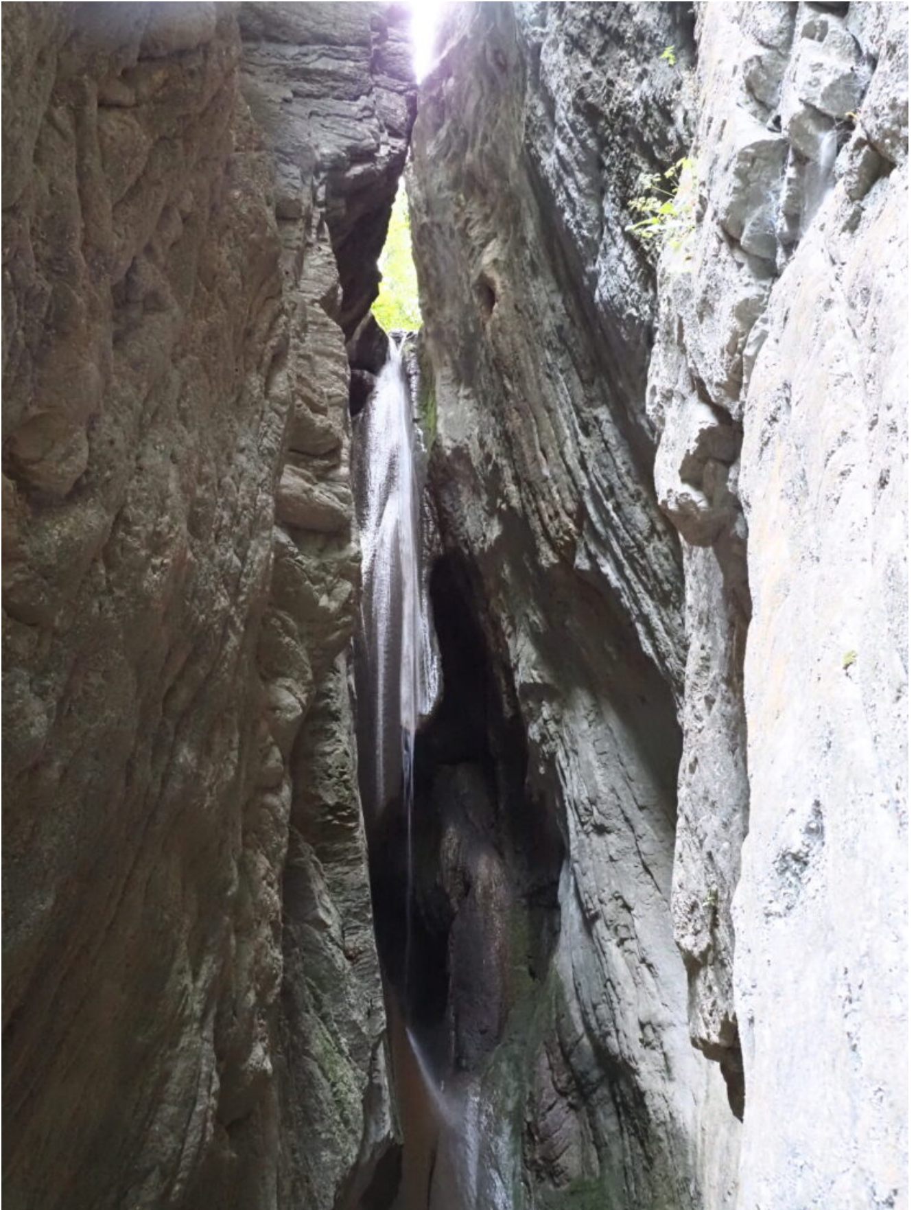
5 – 9 – La cascata de “Lu Cugnuntu”.