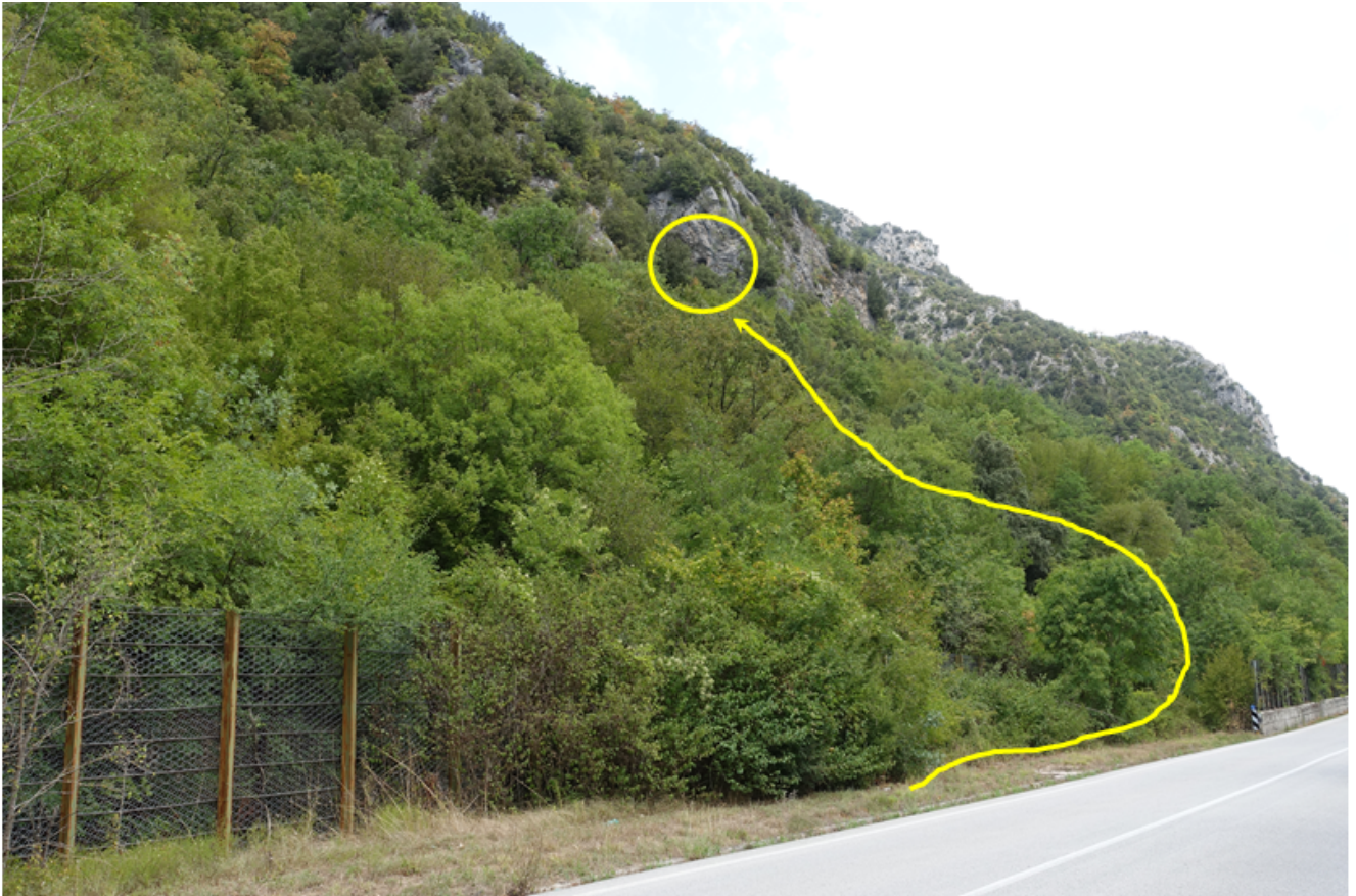
35- L'itinerario per raggiungere la Grotta del Grugnale, che si vede in alto.