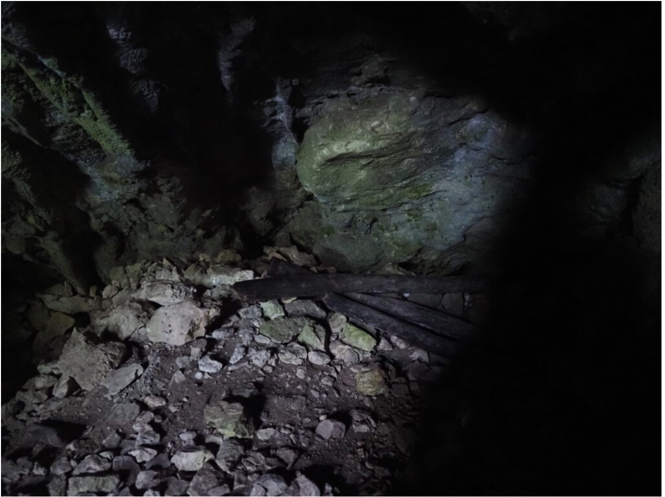
21 – 22- Resti di materiali da scavo all'interno della grotta