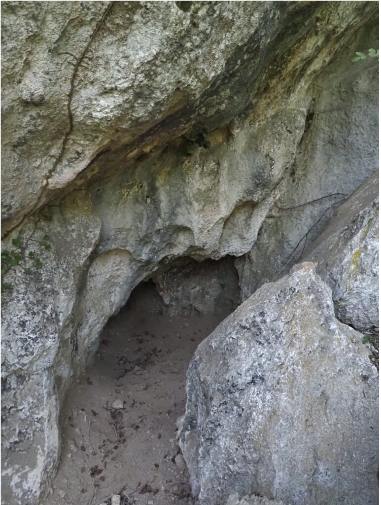
25 – 26 – La Grotta n.4 del Bagni di Triponzo.