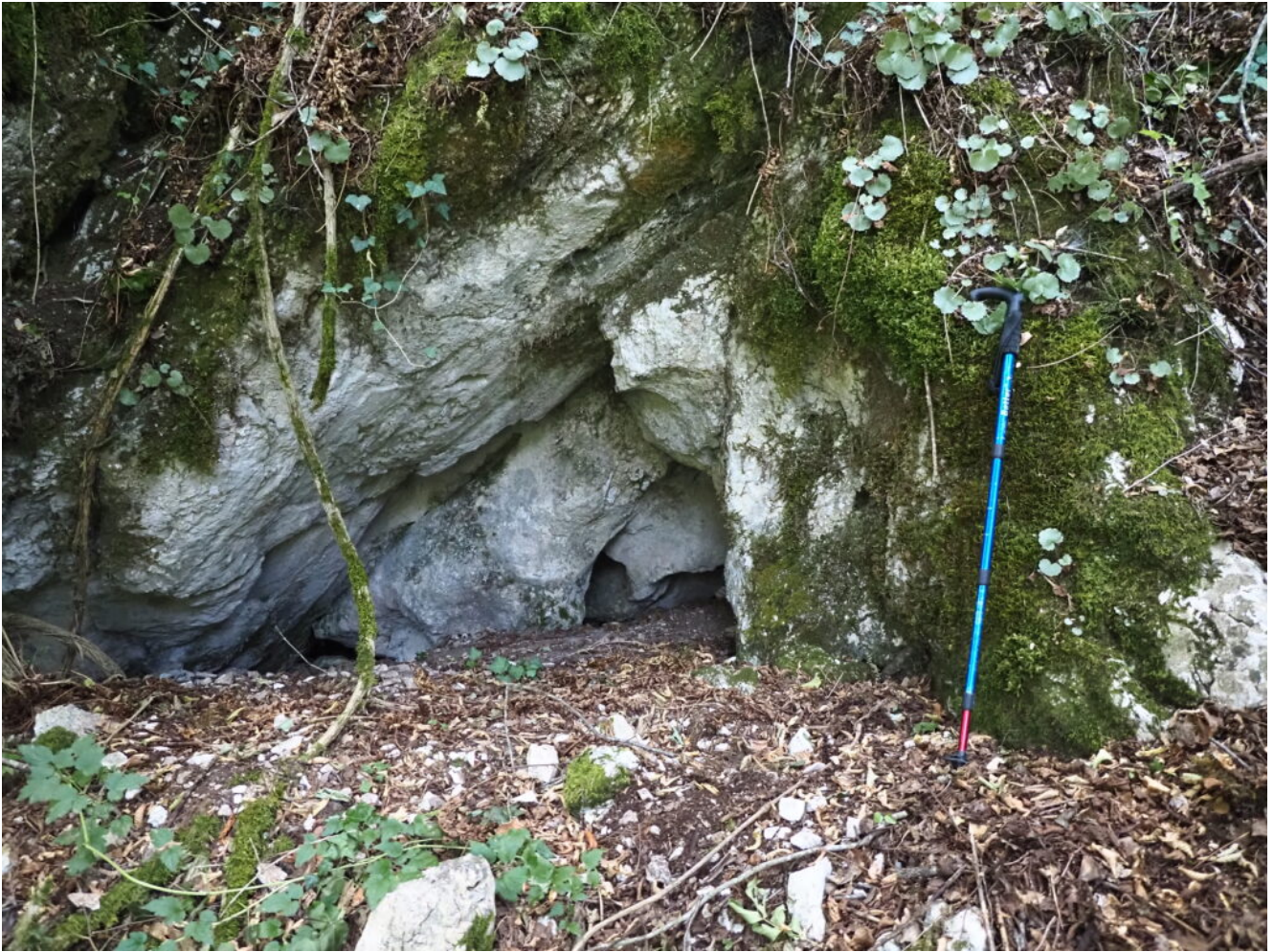
23 – 24 – La Grotta n.3 del Bagni di Triponzo.