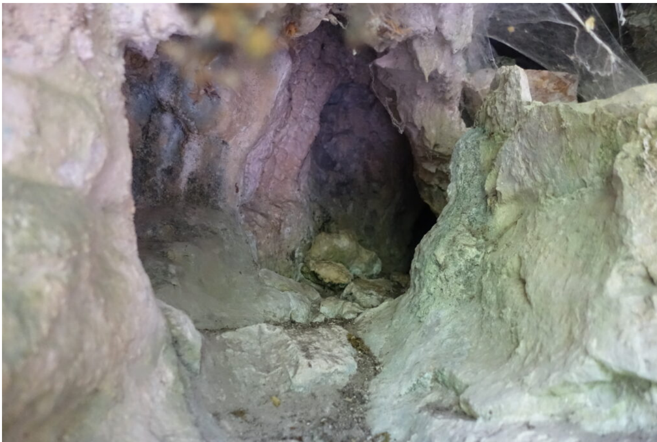
53 – 54 – La grotta n.6 continua con uno stretto budello.