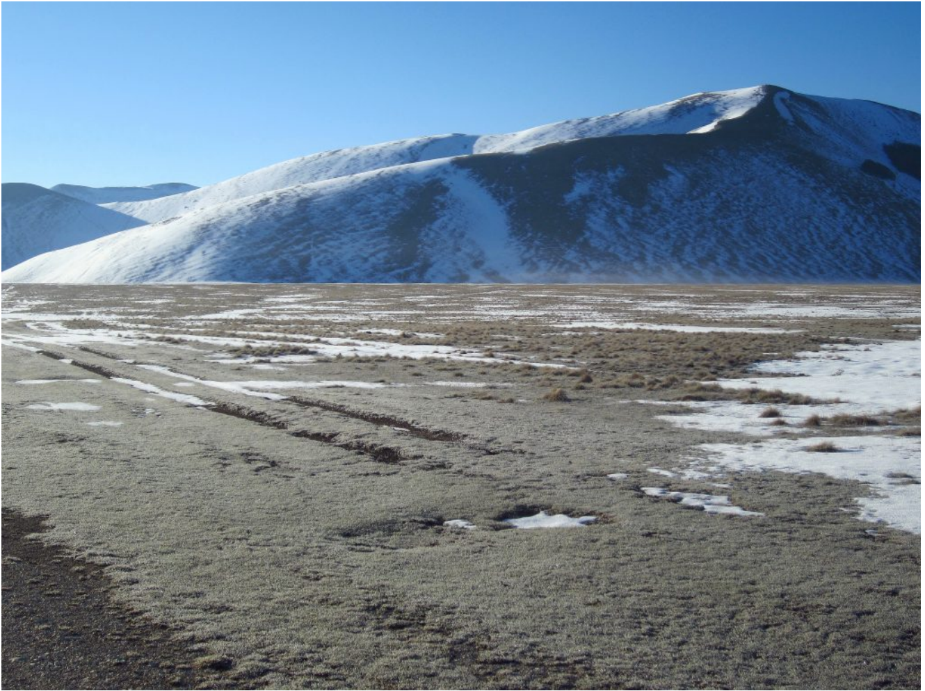
1- La cresta Nord di salita al Monte Guaidone, dietro l'altra cresta di salita proposta, vista dal Ranch di Piano Grande.