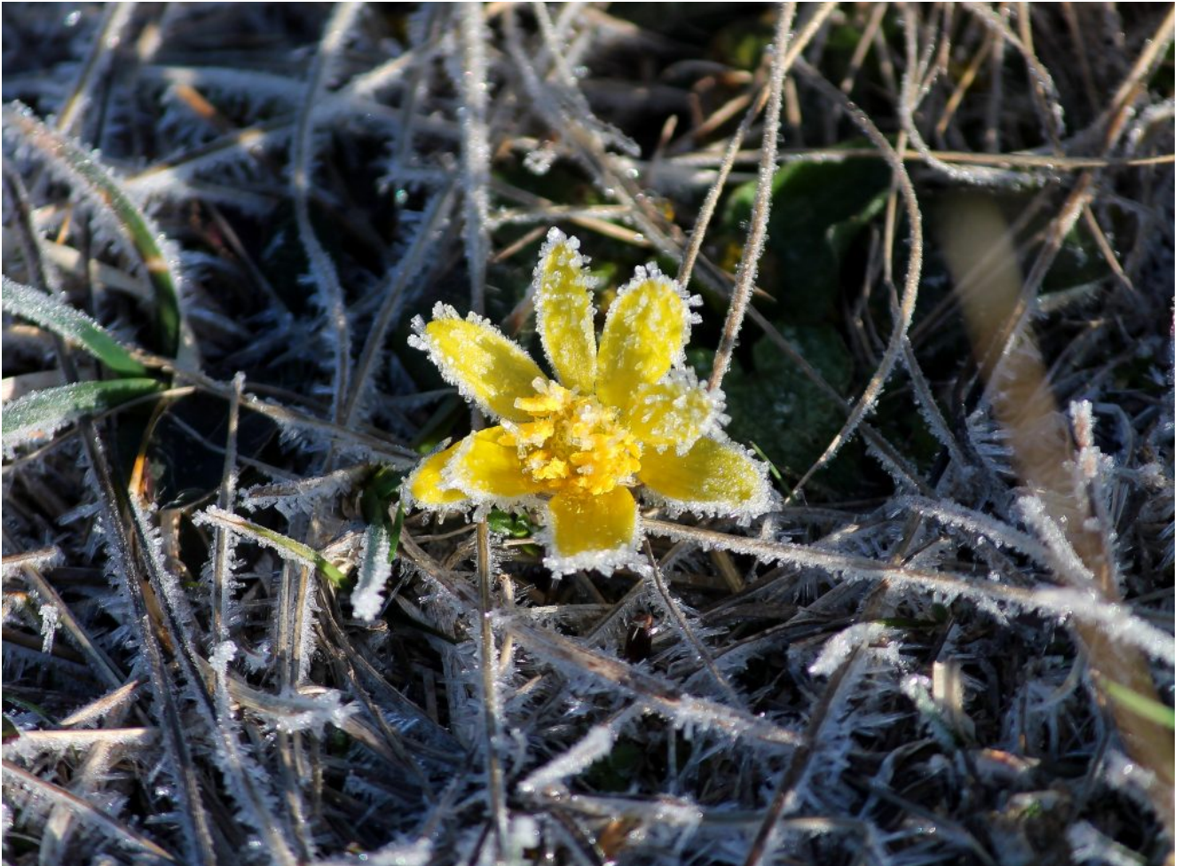
4- Ranunculus ficaria ricoperto di brina.