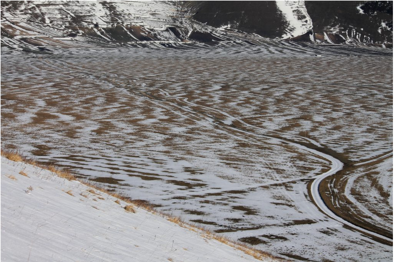
8- Man mano che si sale si osserva il tratturo percorso proveniente dal Ranch del Piano Grande.