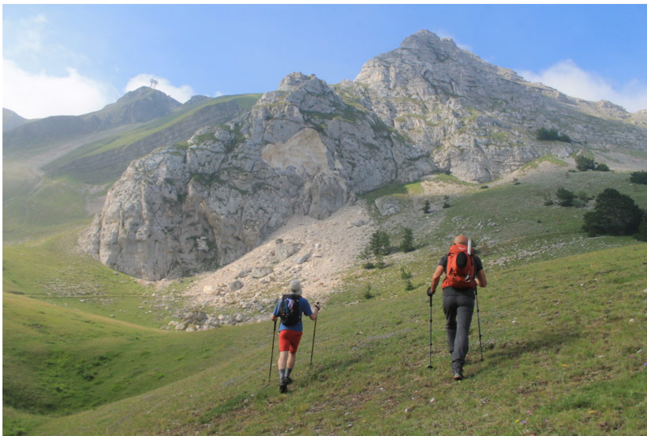
4- Parete nord del Monte Biccò con la grande frana dello spigolo est.