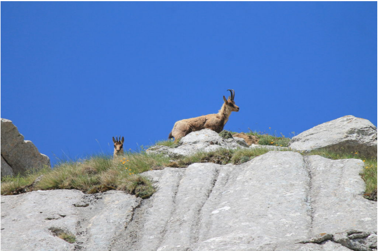
9- Camosci sulla cresta est del Monte Bicco.