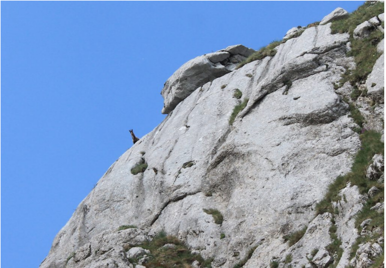
8- Camoscio curioso sulla cresta est del Monte Bicco.

rara farfalla di montagna in Val di Bove.