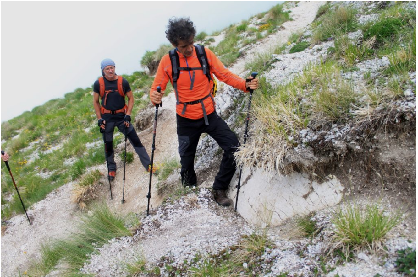
11- la scarpata cosismica alta circa 50-60 centimetri all'inizio del sentiero che dai campi da sci di Frontignano