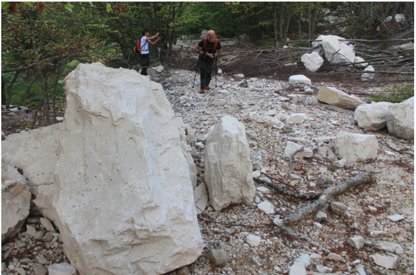
1-Primi massi ed alberi abbattuti nel fondo della Val di Bove, sulla verticale de "Le Quinte".

GIANLUCA CARRADORINI – FAUSTO SERRANI – STEFANO CIOCCHETTI – DAVIDE ANSOVINI 17 GIUGNO 2017