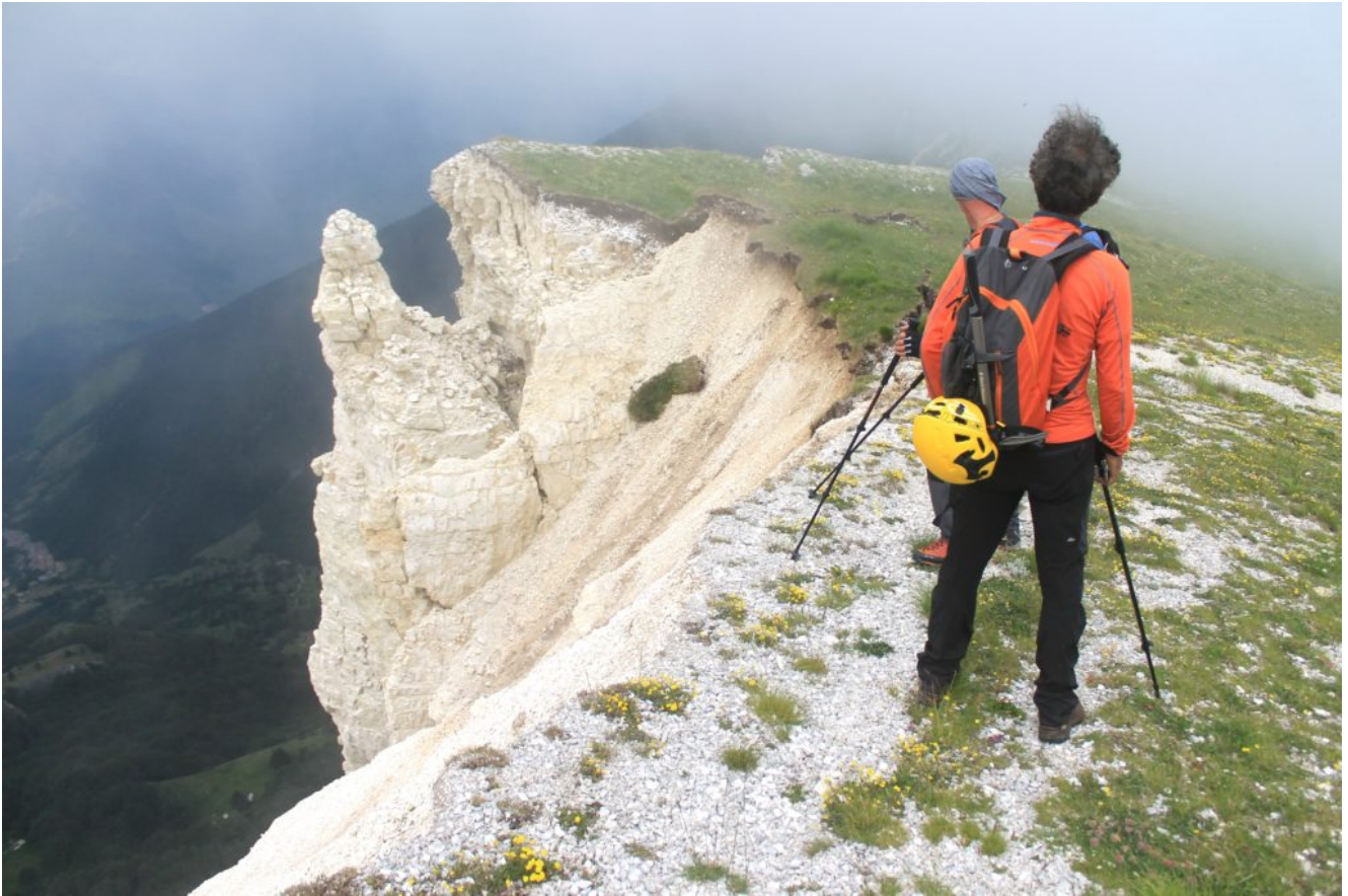
21- Sul bordo della seconda frana, di fronte i torrioni spaccati della foto n. 20.