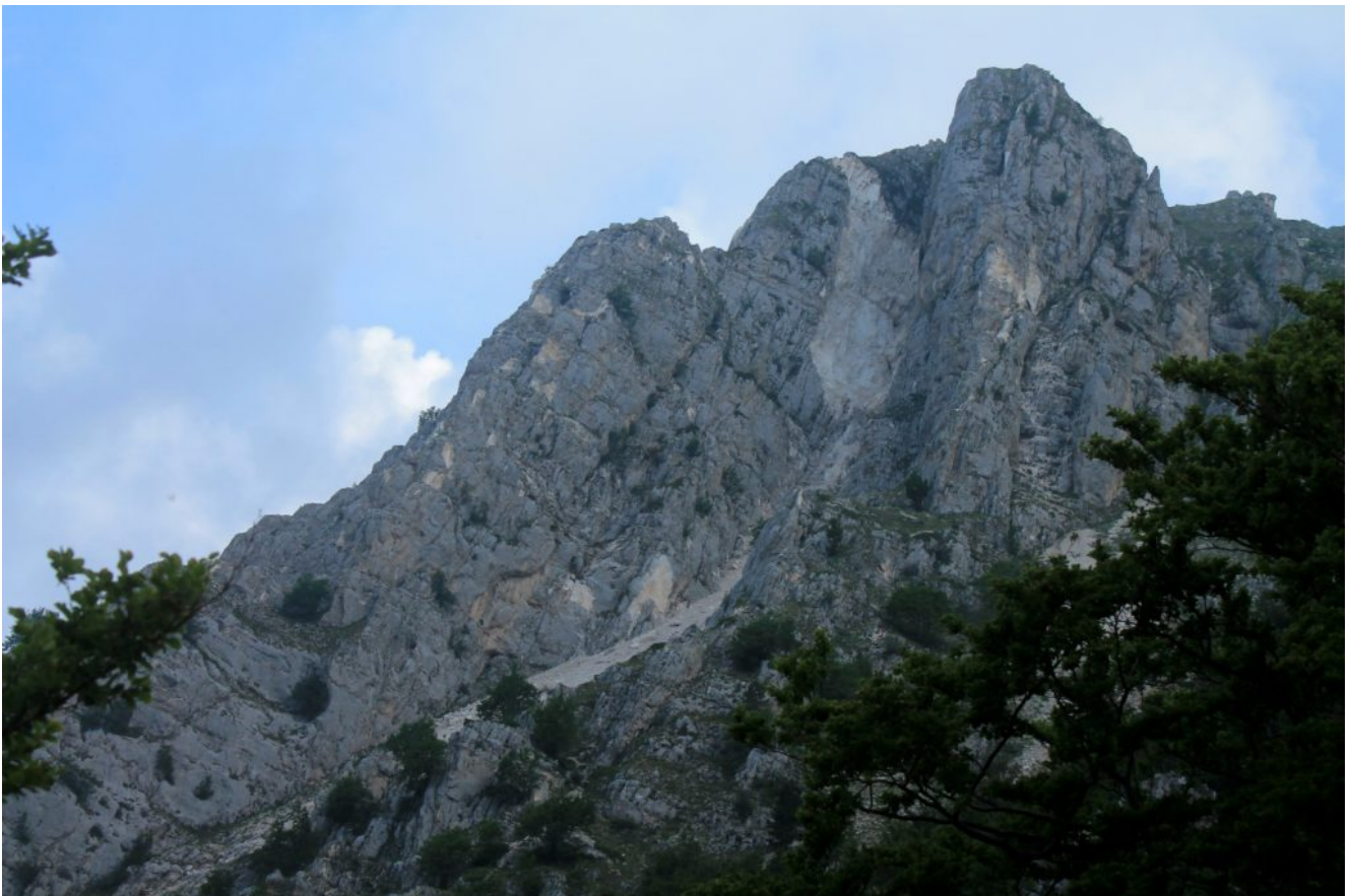
3-Val di Bove, versante sud de "le Quinte" con la grande frana