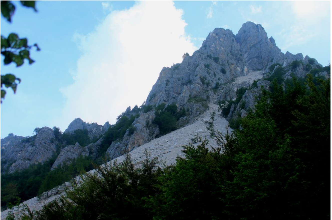
2-La base de "Le Quinte" con la grande conoido detritica prodotta dalle numerose frane, ma la grande frana ancora non era visibile.