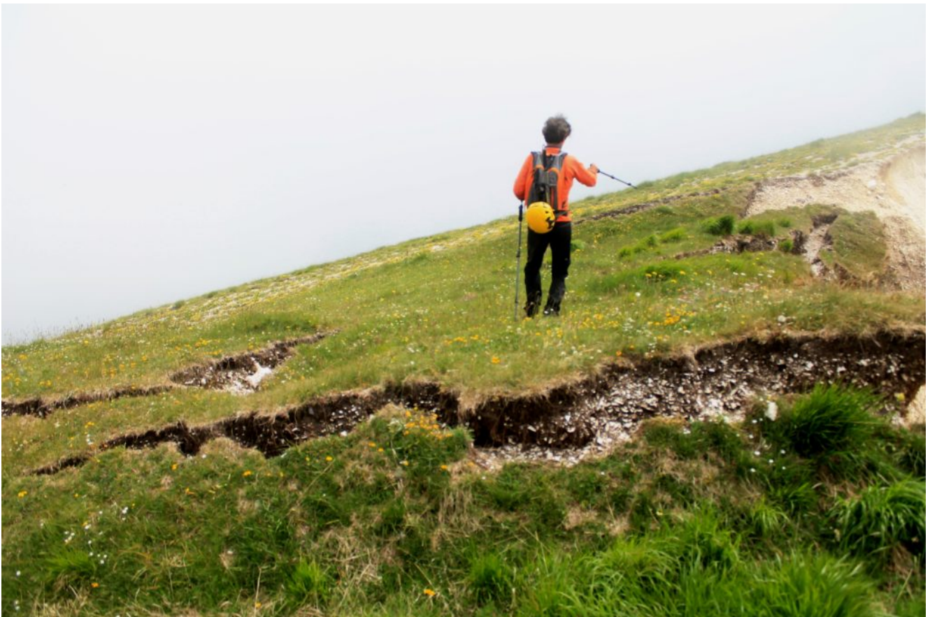
19- Salendo per il sentiero verso Cima di Vallinfante le