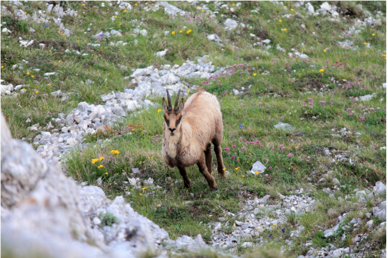
10-Parete nord del Monte Biccio, un camoscio al pascolo 10 metri sotto di noi tra decine di fiori alpini.