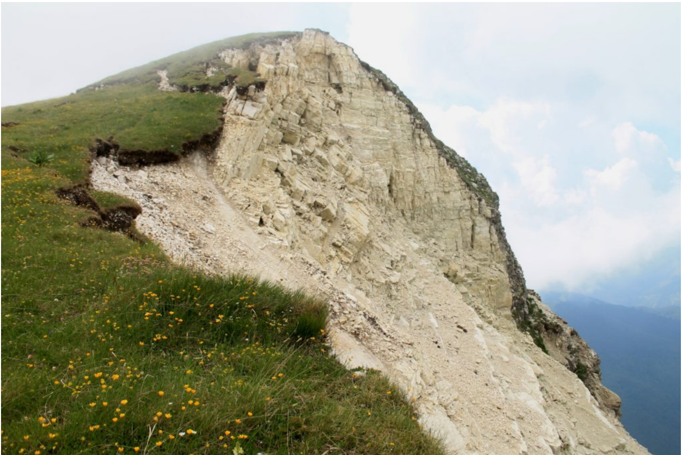
22-La cima sovrastante Passo Cattivo, che precede la Cima di Quota 2065 m., con il versante ovest completamente franato.