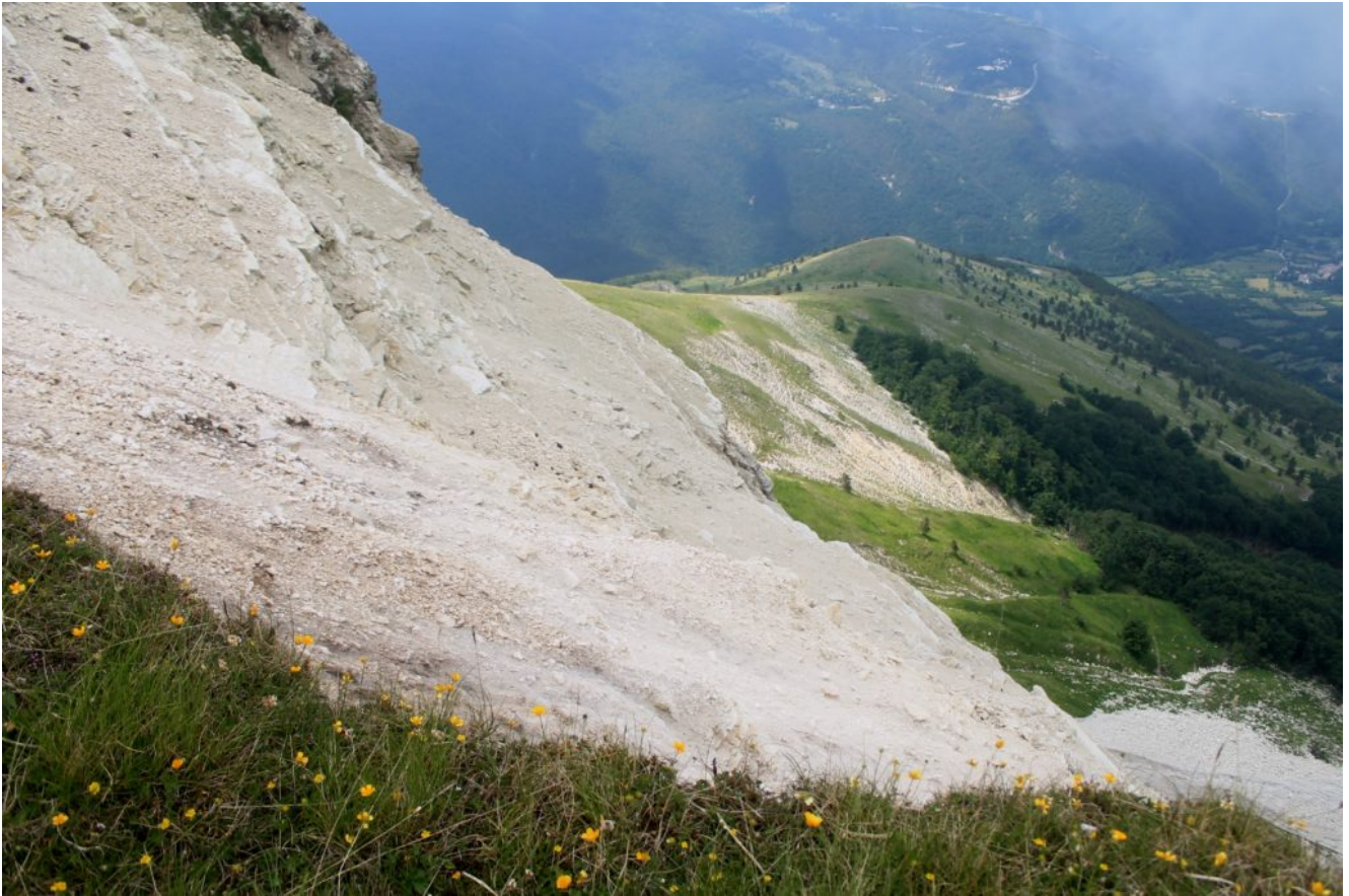
23- Il pendio sottostante la cima della foto n.22. Al centro il Colle la Croce ed il camping M. Prata, a destra l'abitato di Vallinfante.