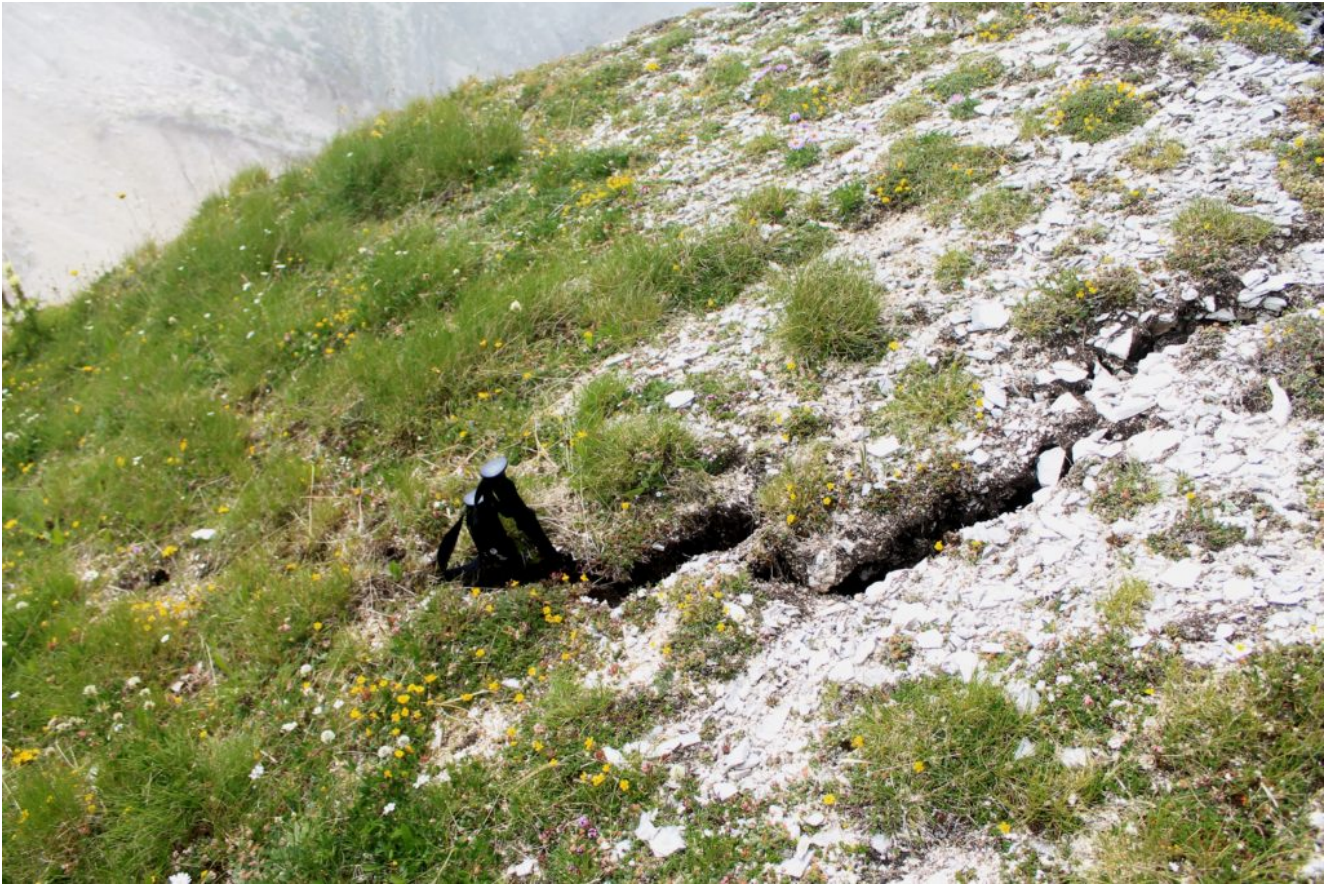
18- Un'altra fenditura in prossimità della cresta di Passo Cattivo, ci entrano i bastoncini per tutta la loro lunghezza !!!