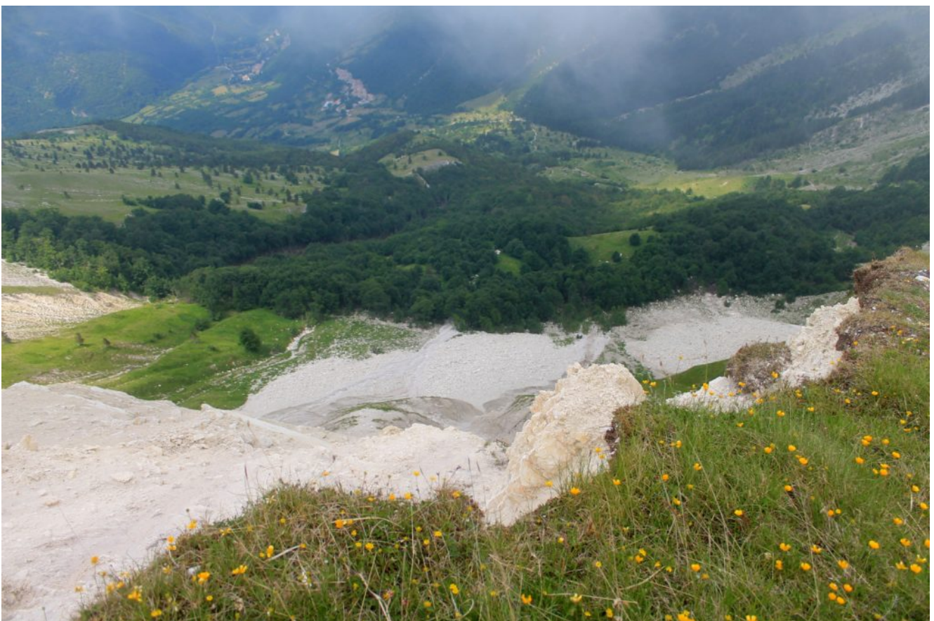
24- Veduta verticale sotto alle pareti di Passo Cattivo con le