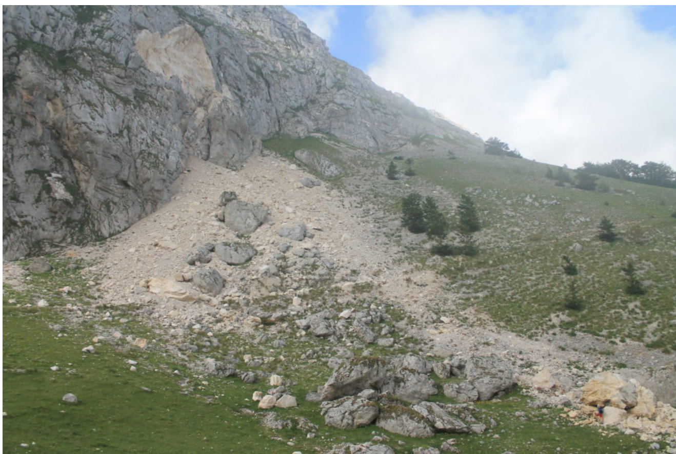
5- Le proporzioni della frana in confronto con Stefano, in