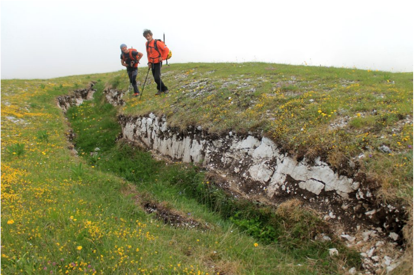
28- La parte finale con sorpresa della fenditura delle foto n.26-27.